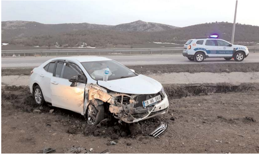
Kaza Çorum-Samsun kara yolu Kaymakçı mevkinde meydana geldi.