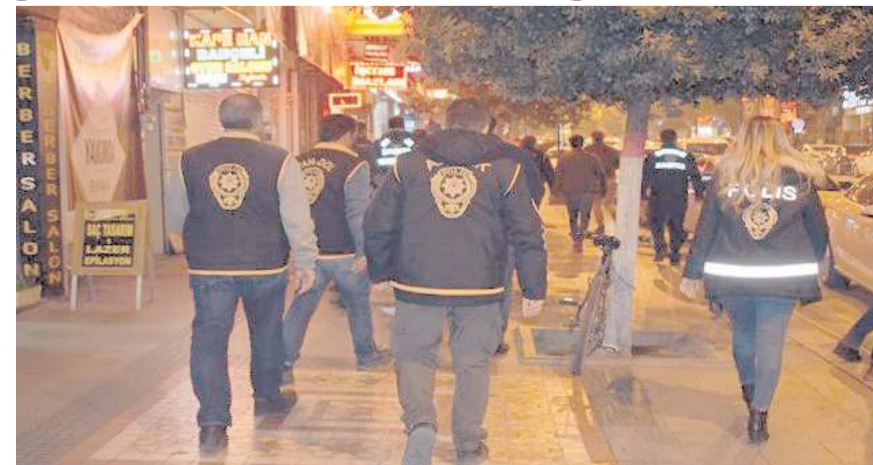
Polis ekipleri denetimlere devam ediyor.

Çorum'da asayiş ve güvenliğin sağlanması amacıyla, İl Emniyet Müdürlüğü Asayiş Şube Müdürlüğü'ne bağlı birimlerce 20 - 27 Şubat 2023 tarihleri arasında yapılan şok uygulamada 610 şahsın GBT kontrolü yapıldı, haklarında çeşitli mahkemelerce arama kararı bulunan 25 şahıs yakalandı, 3'ü tabanca, 1'i kesici ve delici alet olmak üzere toplam 4 adet silah ve 30 adet fişek ele geçirilirken, 50 araç kontrol edildi.