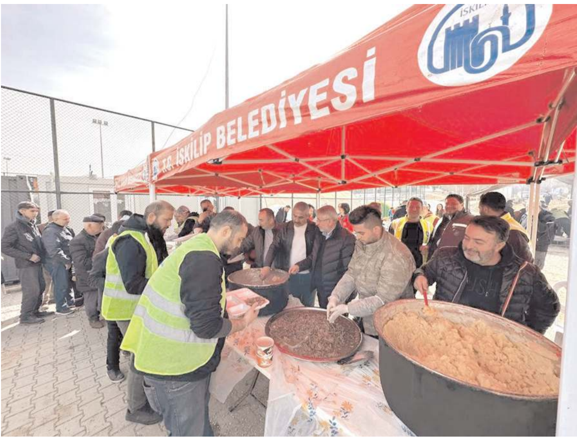
İskilip Belediyesi, Kahramanmaraş'ın Afşin ilçesinde depremzedelere İskilip dolması ikram etti.