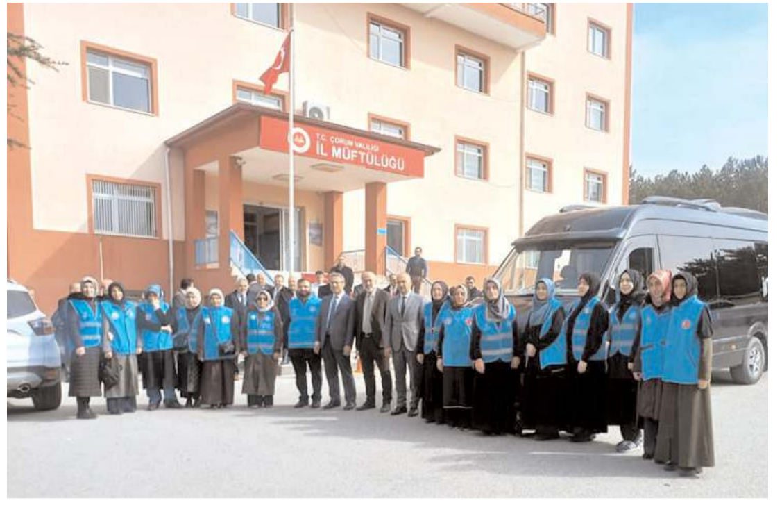
Gönüllü Kur'an kursu öğreticileri, Müftülük önünden Kahramanmaraş'a uğurlandı.