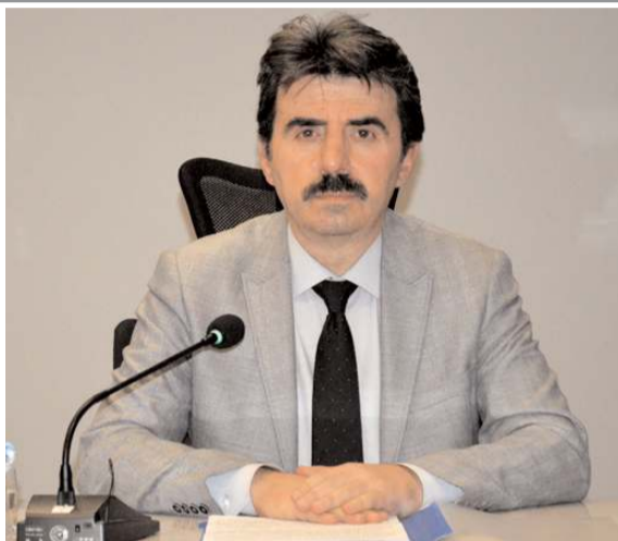
İDP Dönem Sözcüsü Necat Yazıcı