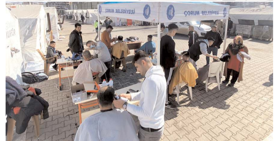
Ektepe 50 kuaför ve berber bulunuyor.