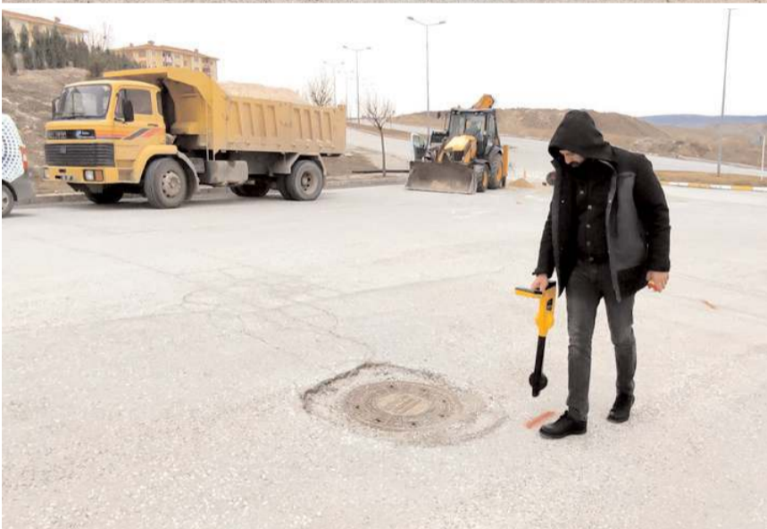
Su kaçakları için özel cihazlar kullanılıyor.