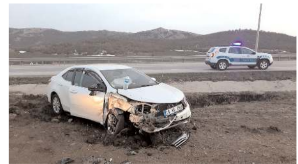
Kaza Çorum-Samsun kara yolu Kaymakçı mevkinde meydana geldi.