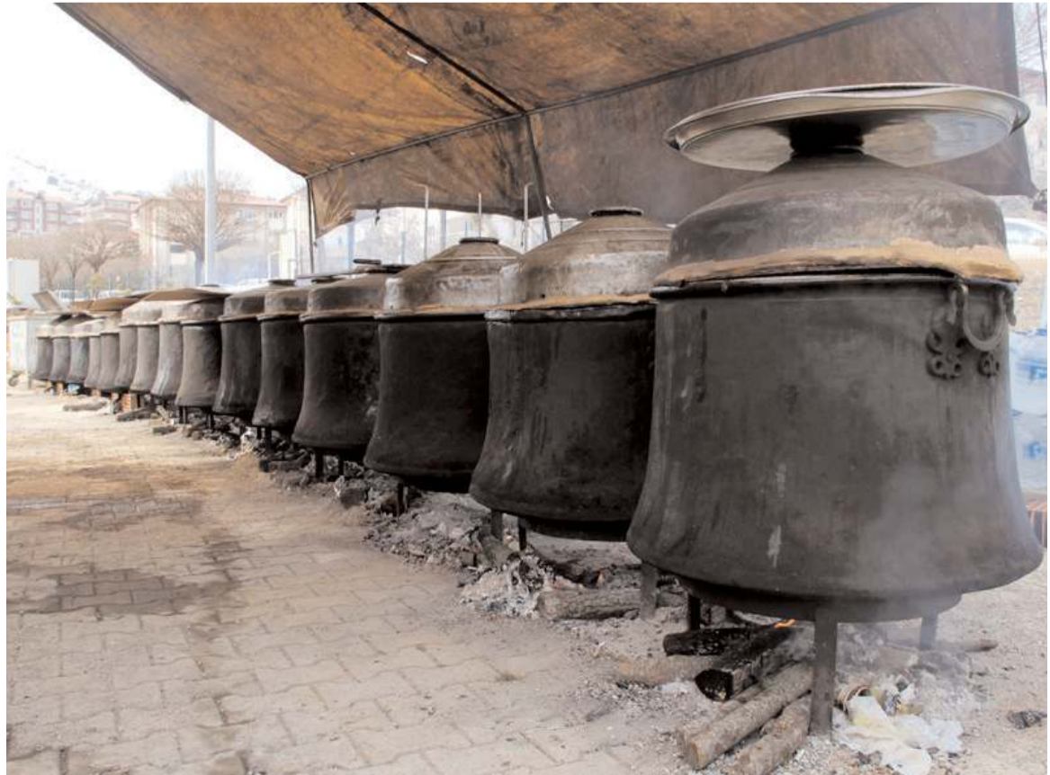
Kahramanmaraş'ın Afşin ilçesinde 22 kişilik ekip tarafından hazırlanan 15 kazan dolma 3 bin kişiye ikram edildi.