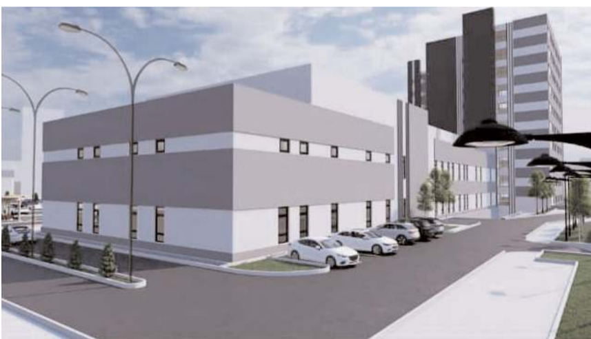
İhalenin ardından 2-3 ay içinde hastane inşaatına başlanması bekleniyor.