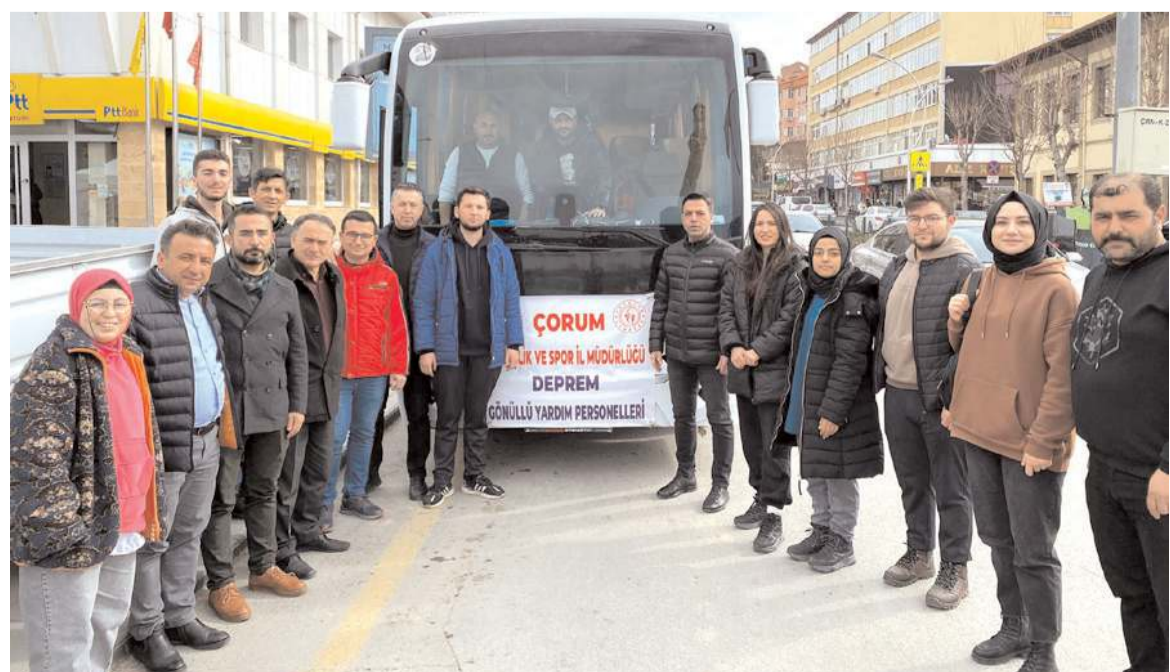
Gençlik Merkezleri'nde görevli personel ve gönüllüler Saat Kulesi yanından uğurlandılar.

Ekipte gençlik liderleri, spor uzmanları ve gönüllü gençler bulunuyor.