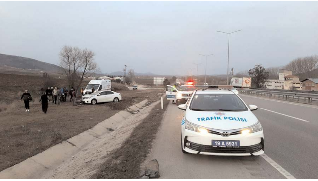
Polis kaza yerinde inceleme yaptı.

Çorum'da otomobil ile tırın çarpıştığı trafik kazasında 3 kişi yaralandı.