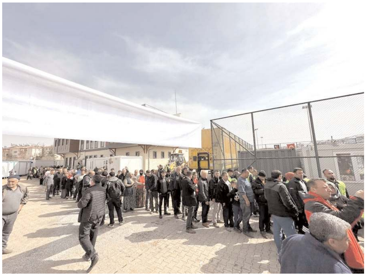
İskilip dolması ikramına ilgi yüksek oldu.