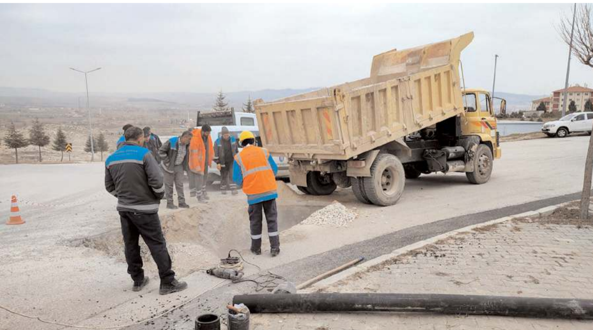
Kayıp-kaçak tespit çalışmaları sonucunda saniyede 20 litrelik su kaçağı tespit edildi.