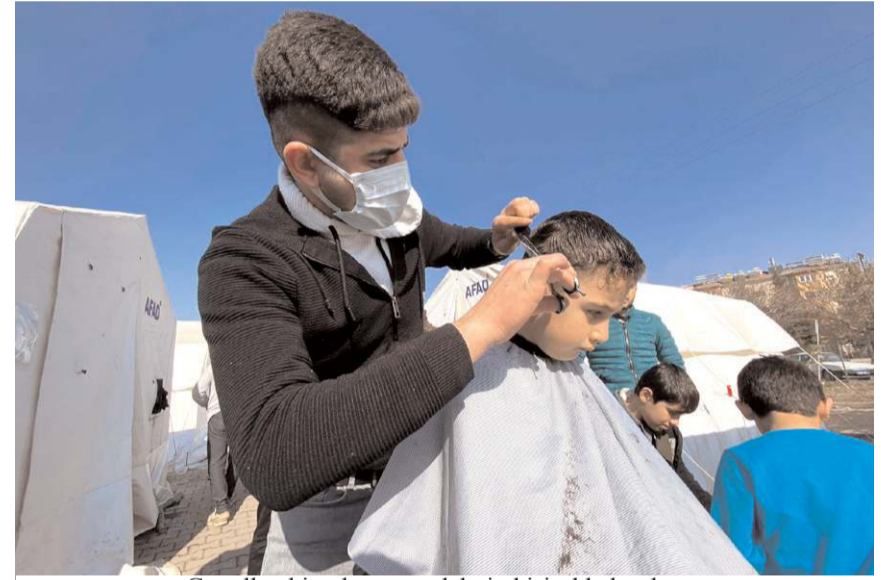
Gönüllü ekip, depremzedelerin kişisel bakımlarını büyük bir itina ile gerçekleştirdi.

Afşinli depremzedeler de, Çorum halkının yardımseverliğinden ve kendilerine olan ilgilerinden oldukça duygulandıklarını belirterek, "Çorum'dan gelen kardeşlerimizden Allah razı olsun. Çorum Belediyesi bizler için çok önemli işler yaptı. Çok güzel yardımlar geldi. Tüm Çorum halkından Allah razı olsun. Yardımlarınızın karşılığı ödenmez." diye konuştular. (Haber Merkezi)