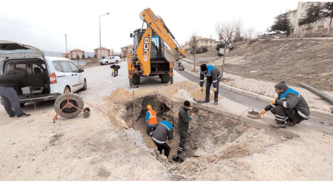
Çorum Belediyesi, Akkent Mahallesi 1. Cadde de su kaçağını tespit ederek arızayı giderdi.