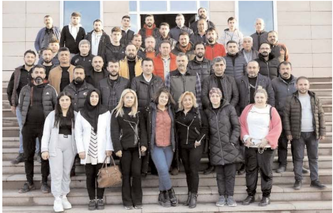
Kuaför ve berberler hatıra fotoğrafı çekindiler.