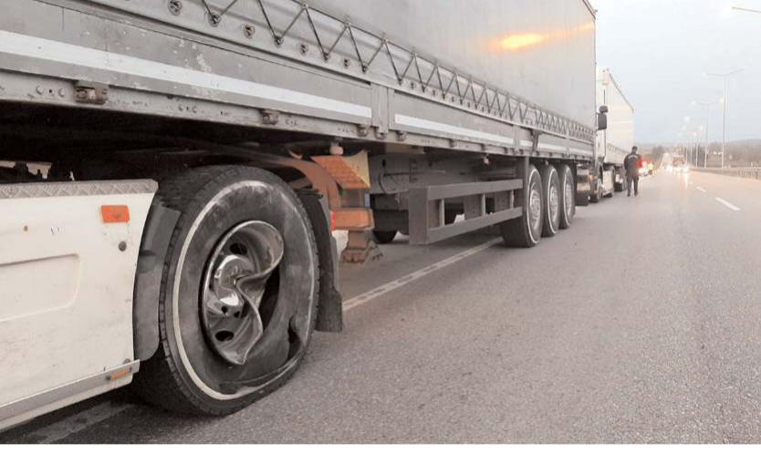
Otomobil tırın tekerine çarptı.