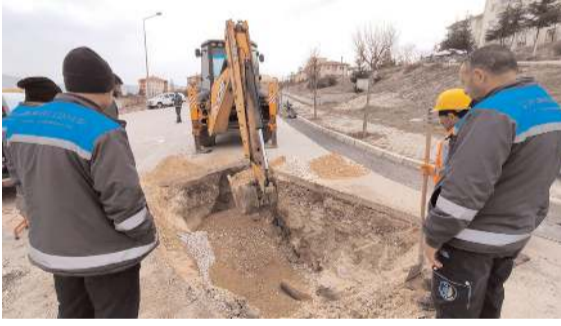
Çorum Belediyesi, Akkent Mahallesi 1. Cadde'de su kaçağını tespit ederek arzıyı giderdi.