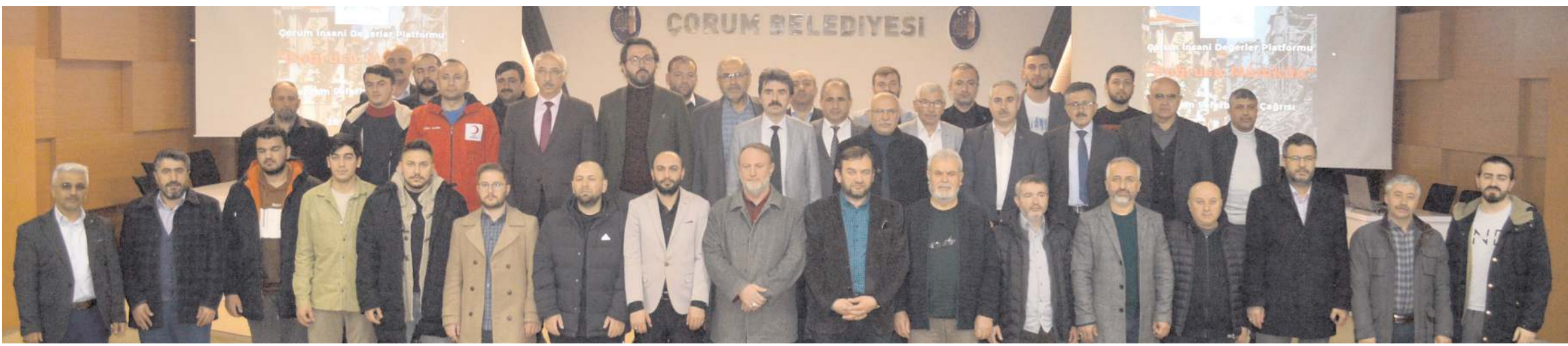
Çorum İnsani Değerler Platformu (İDP) yaptığı açıklamada depremlere karşı alınması gereken tedbir ve önerileri dile getirdi.