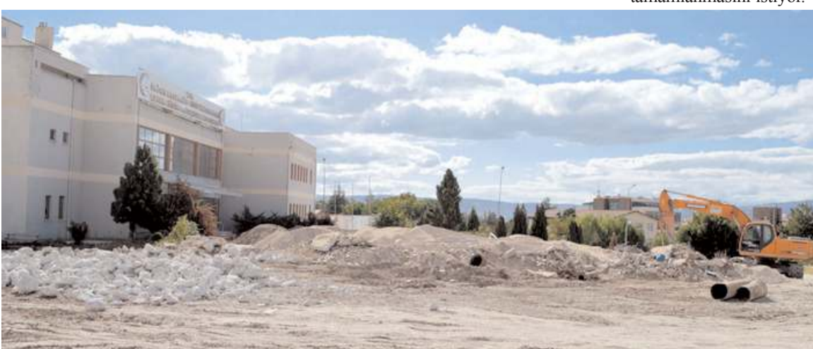
Devlet Hastanesi'nin eski blokları yıkılmıştı.