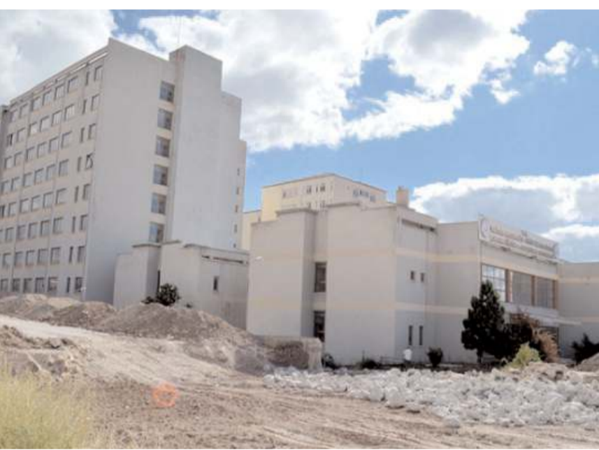
100 Yataklı Yeni Devlet Hastanesi ihalesi 17 Mart'ta ihale edilecek.