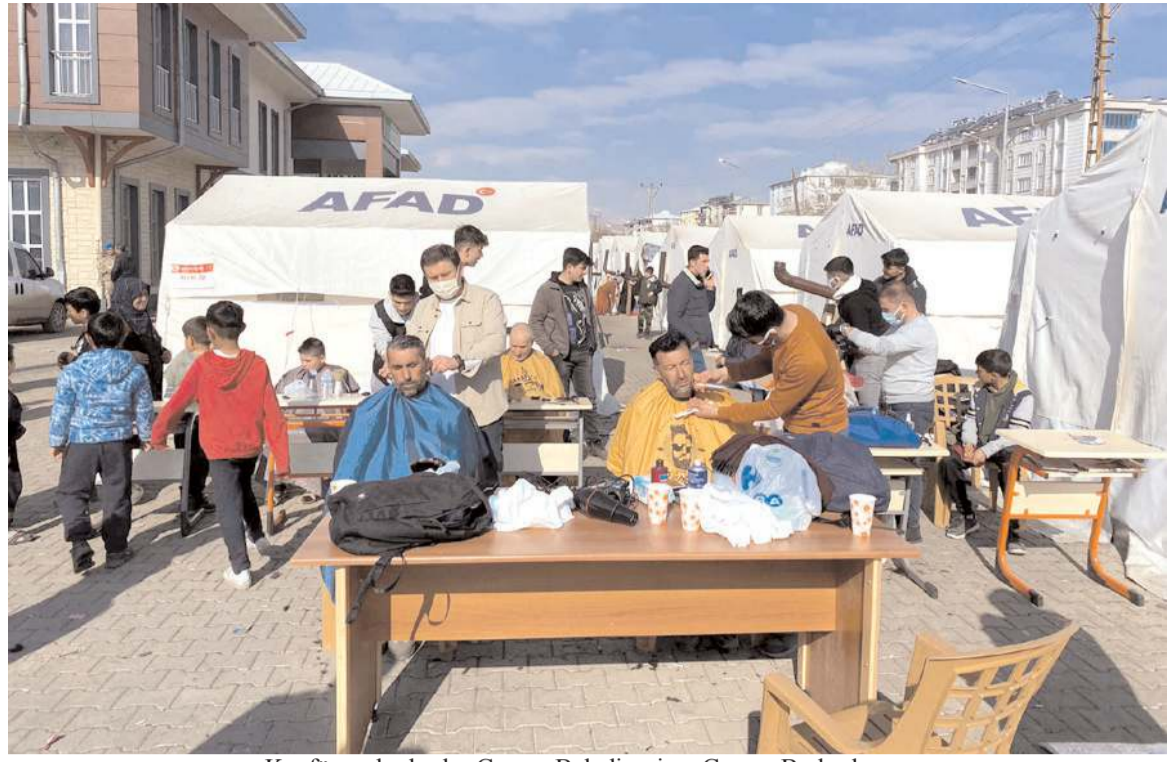
Kuaför ve berberler Çorum Belediyesi ve Çorum Berberler ve Kuaförler Odası işbirliği ile gönüllü olarak Afşin'e gitti.

Yaralılar sağlık ekiplerince olay yerinde yapılan ilk müdahalenin ardından ambulansla Hitit Üniversitesi Erol Olçok Eğitim ve Araştırma Hastanesi'ne kaldırıldı.(AA)