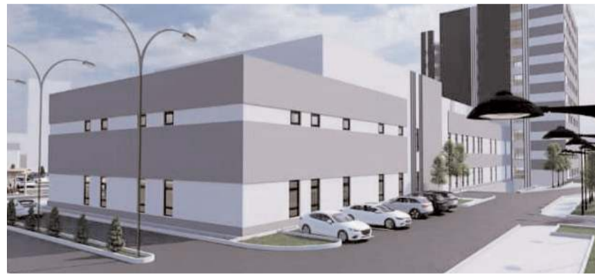
İhalenin ardından 2-3 ay içinde hastane inşaatına başlanması bekleniyor.