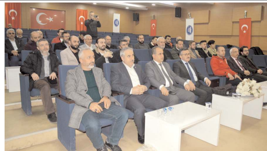
Basın açıklamasına İDP üyesi STK'ların temsilcileri katıldı.

Depremle daha bir açığa çıkan kira terörüne de