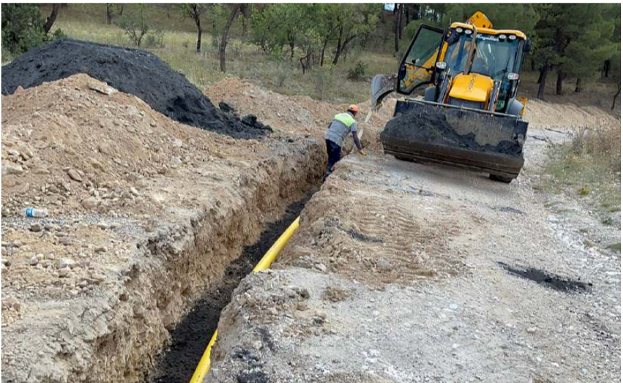
Doğalgazın ilçeye bu kış verilmesi planlanıyor.

muhabirine, çalışmaların mümkün olan en kısa sürede tamamlanacağını söyledi.