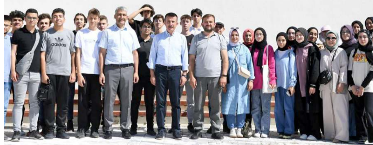
Programında sonunda toplu hatıra fotoğrafı çekildi.

kanlara vurgu yaptığı konuşmasında, bu milletin kalkınması ve dünyada lider konuma gelmesi için her zaman elimizden gelenin daha iyisini yapacağız, daha güzelini yapacağız.