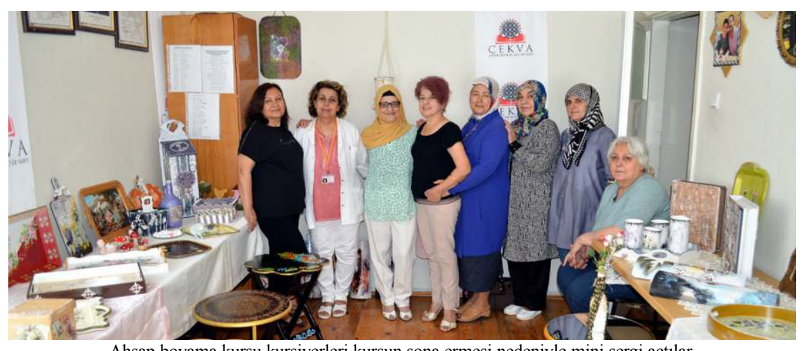
Ahşap boyama kursu kursiyerleri kursun sona ermesi nedeniyle mini sergi açtılar.