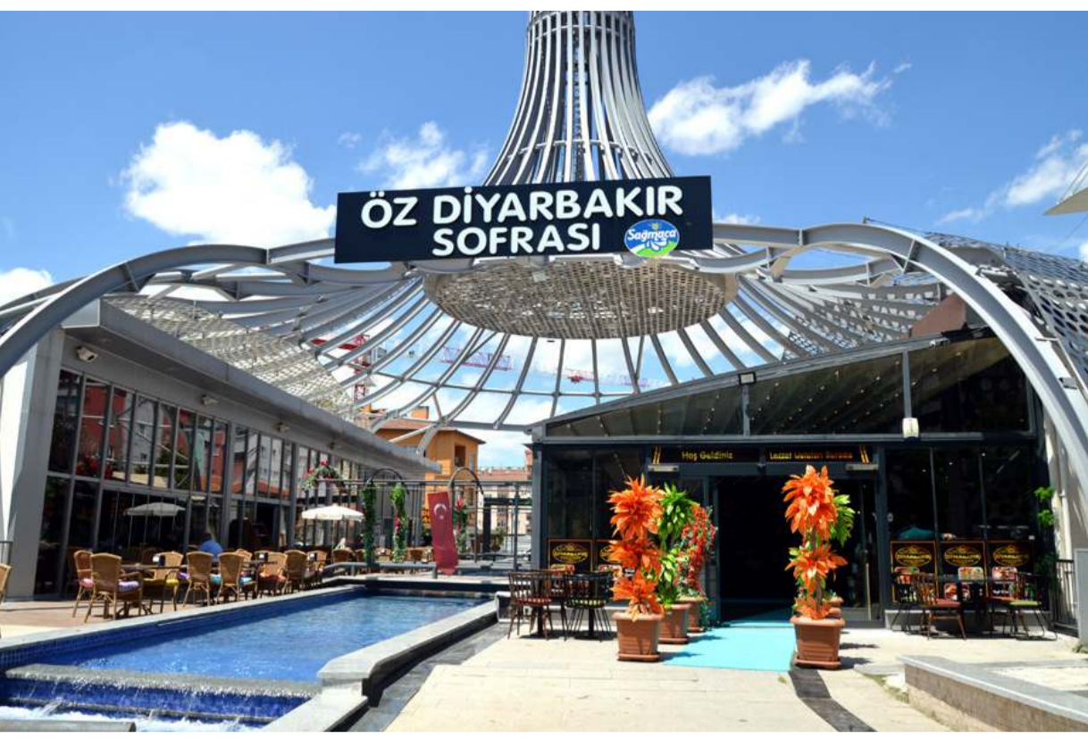
Öz Diyarbakır Sofrası, eski Kültür Sitesi yerinde hizmet veriyor.