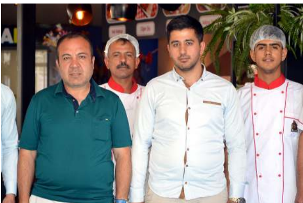
Öz Diyarbakır Sofrası 7. şubasını Çorum'a açtı.

■ Çorum'da balık tutmak için Kızılırmak'a giden yaşlı adam hayatını kaybetti. * HABERİ 5'DE