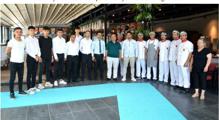
Öz Diyarbakır Sofrası tecrübeli personeli ile müşterilerine hizmet veriyor.