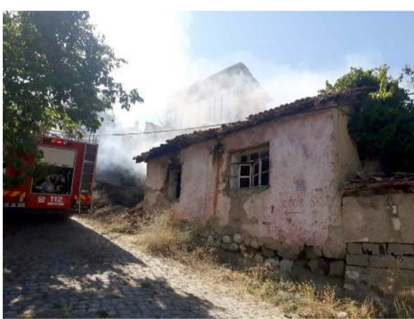
İsmetpaşa Mahallesi'nde bulunan boş evde henüz belirlenemeyen nedenle yangın çıktı.