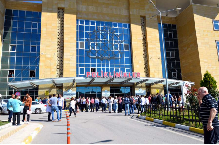
Bakanlık 27 bin sözleşmeli sağlık personeli alacak.

Söz konusu kişilerden 19 bin 694'ü uzman tabip, 7 bin 114'ü tabip, 147'si ebe, 38'si sağlık memuru, 3'ü hemşire olacak. Ayrıca birer diş tabibi, diyetisyen, psikolog ve sağlık teknikeri istihdam edilecek. (Haber Merkezi)