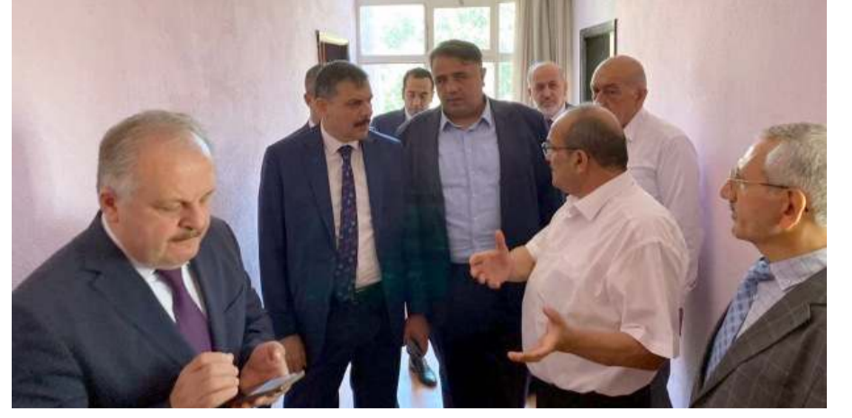
Vali Mustafa Çiftçi ve beraberindekiler binada incelemede bulundu.

Kargı'da kamuya ait olan ve atıl vaziyetteki Orta Mahalle Sakız Sokak'ta bulunan binada incelemelerde bulunan Vali Mustafa Çiftçi, kurumların istekleri üzerine bu binanın 3 kurum tarafından kullanılabilice-