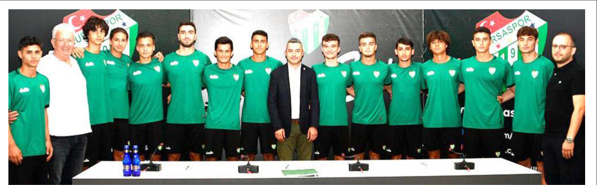
Bursaspor alt yapısında forma giyen 13 genç teknik heyetin raporu doğrultusunda profesyonel imza attılar