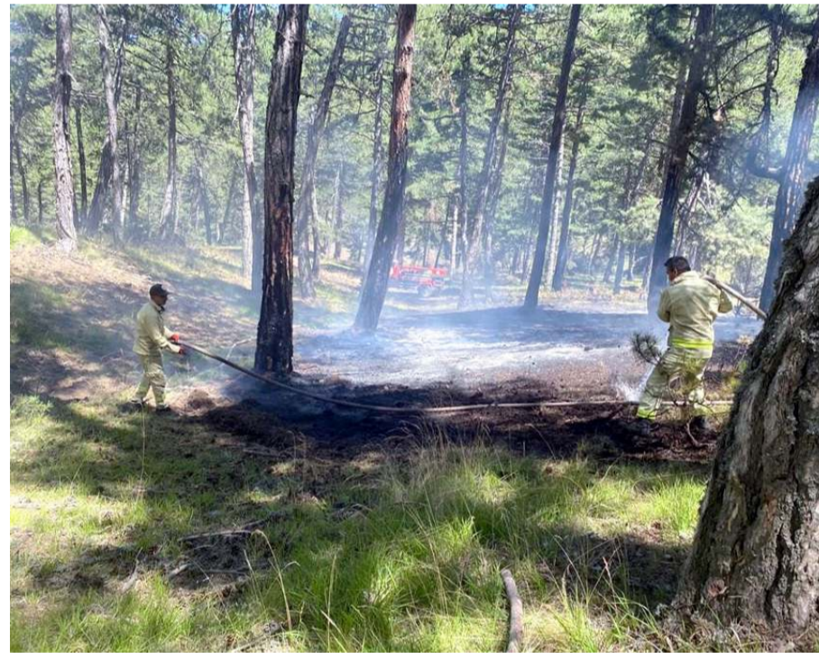
Yangın Osmancık'a bağlı Çampınar köyünde ormanlık alanda çıktı.

Osmancık'ta çıkan orman yangını büyümeden kontrol altına alındı.