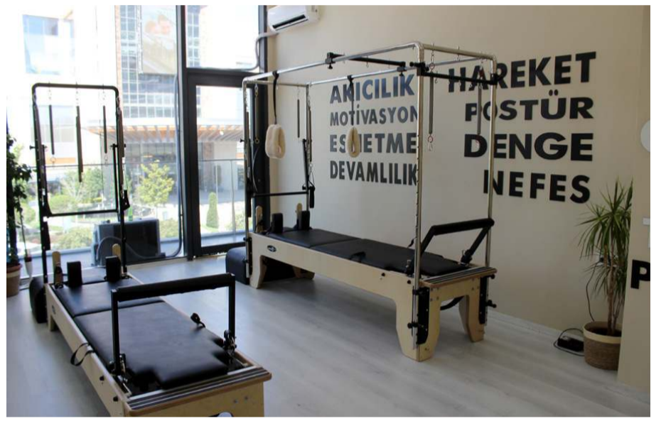
Merkezde GTOS Terapi, başta bel ve boyun fitiği olmak üzere tüm iskelet-kas sistemi rahatsızlıklarında başarıyla uygulanıyor.

Fizyoterapi ve Sağlıklı Yaşam Danışmanlık Merkezi'nde GTOS Terapi, başta bel ve boyun fitiği olmak üzere tüm iskelet-kas sistemi rahatsızlıklarında başarıyla uygulanıyor. Kas iskelet problemlerinin tedavisi için Fizyoterapi ve Sağlıklı Yaşam Danışmanlık Merkezi'ne başvurulabilir.