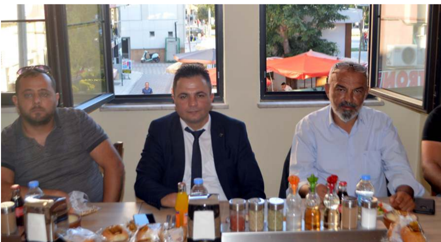
Basın toplantısında yeni fiyat tarifi kamuoyu ile paylaşıldı.

Aldıkları kararla kat sayısına göre fiyatlandırma yaptıklarında aktaran Buğa, "4. kata kadar olan binalarda asansör bakım ücreti 200-250 TL+KDV, 4-7 kat asansör bakım ücreti 250-300 TL+KDV, 8 kat ve sonrası olan binalarımızda ise asansör bakım ücretini 300-400 TL+KDV olarak daire sayılarını da göz önünde bulundurarak güncelleme yapmayı düşünüyoruz. Firmalarımız güncelleme yap değerli müşterilerimizin desteğini beklemektedir" ifadelerini kullandı.