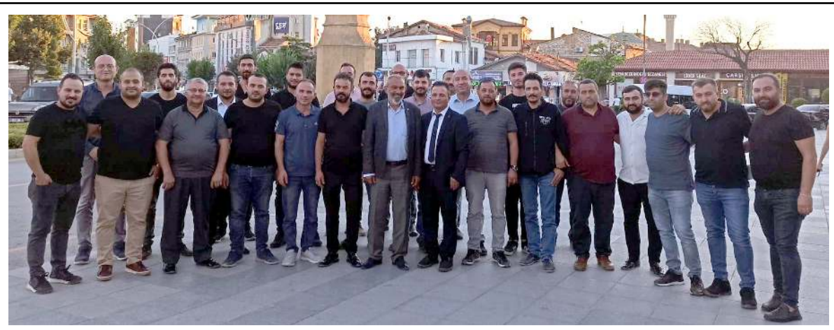
Çorum'da faaliyet gösteren asansör firmaları yaptıkları toplantıda sorun ve taleplerini istişare ettiler.