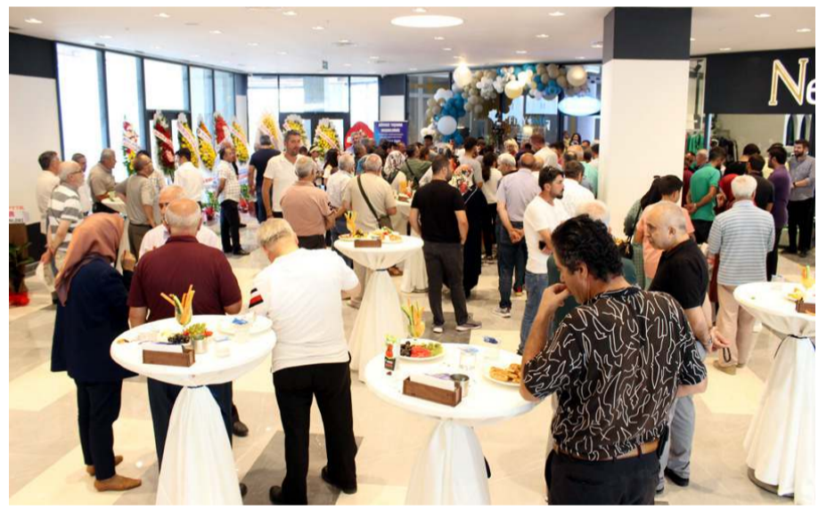
Açılışa çok sayıda davetli katıldı.