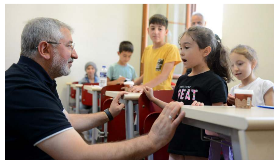
Başkan Aşgın, öğrencilere sorular sordu.