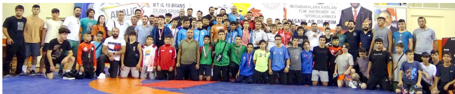
Analog Grekoromen Stil'de dereceye giren sporcular idareci ve antrenörleri ödül töreni sonrasında davetliler ile birlikte toplu halde görülüyor