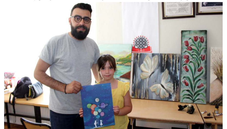
Akrilik boyama ve resim kursunun sona ermesi nedeniyle mini sergi açıldı.