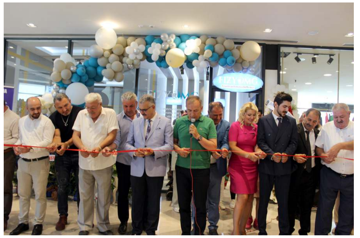
Fiziomg Fizyoterapi ve Sağlıklı Yaşam Danışmanlık Merkezi cumartesi günü açıldı.