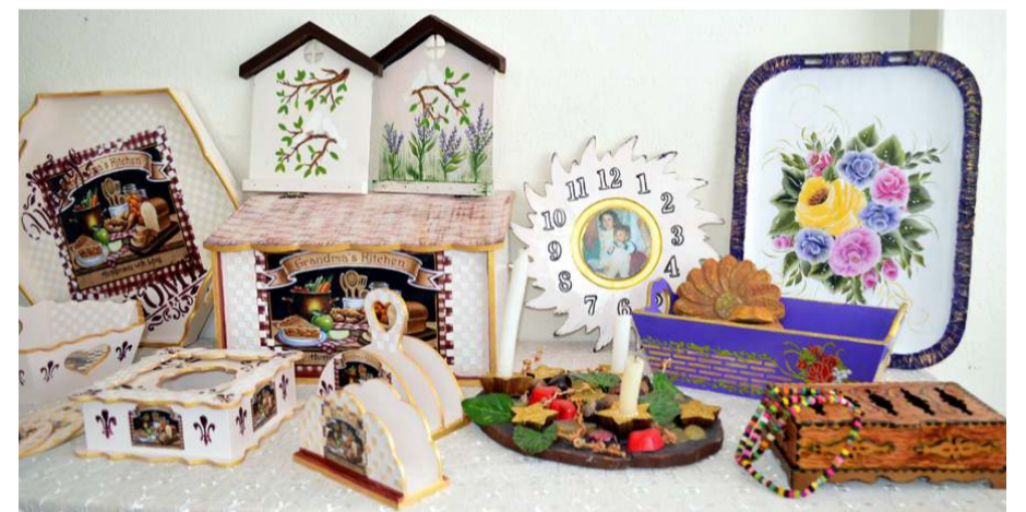
Ahşap boyama kursunda kursiyerler birbirinden güzel eserler yaptılar.