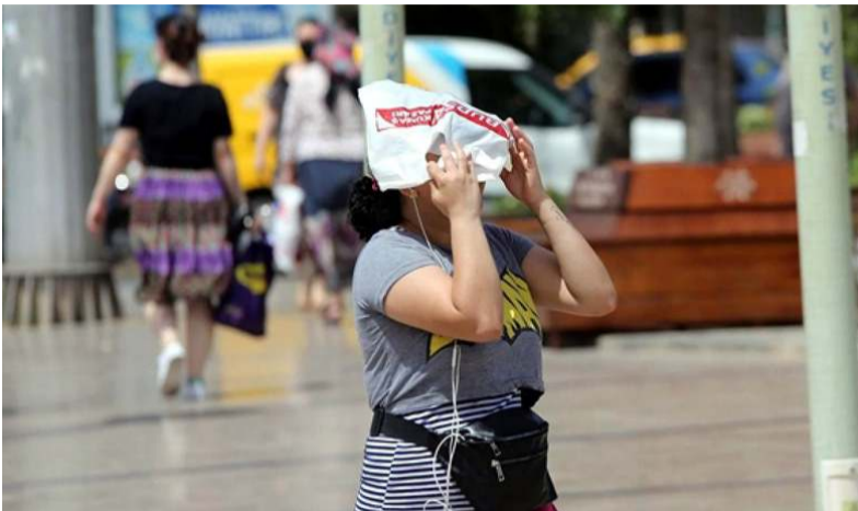
Çorum'da ise hava sıcaklıklarının 30 ile 34 arasında seyretmesi bekleniyor.

Yaz mevsiminin en sıcak ve boğucu günlerini ifade etmek için kullanılan "eyyam-ı bahur", her yıl temmuz ayının sonu ile ağustos ayının başına rastlıyor. Yerini "çöl sıcakları", "cehennem sıcakları" ve "Afrika sıcakları" gibi terimlere de bırakan "eyyam-ı bahur"un, özellikle yurdun güney kesimlerinde etkisini göstermesi bekleniyor. Çorum'da ise hava sıcaklıklarının 30 ile 34 arasında seyretmesi bekleniyor.