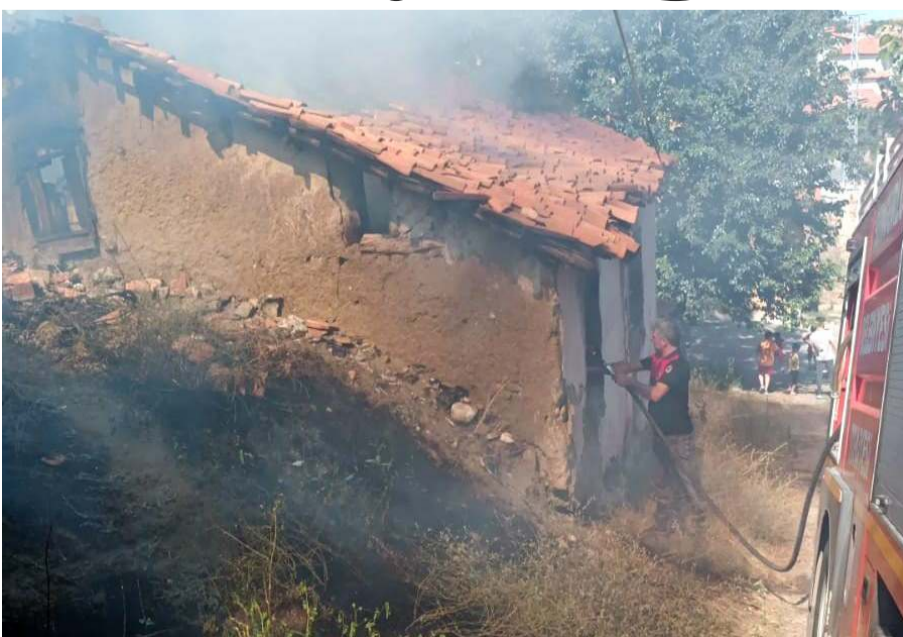
Yangın çevredeki evlere sıçramadan söndürüldü

Sungurlu'da boş bir evde çıkan yangın çevre sakinlerini korkuttu.