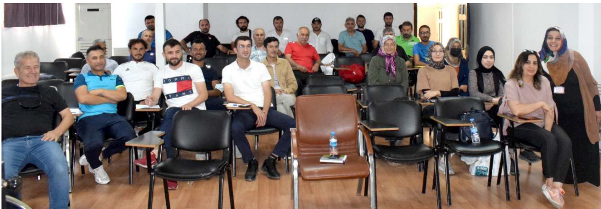
35 futbol antrenörü TÜFAD tarafından düzenlenen ilk yardım eğitimine katıldı ve belgelerini aldılar