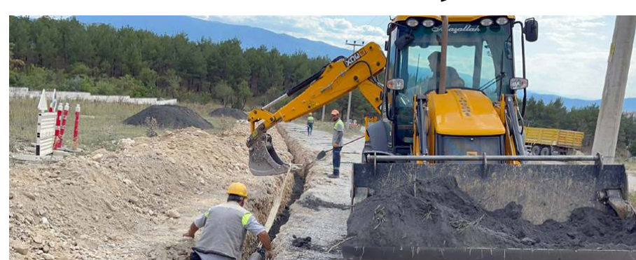
İlçede doğalgaz borularının döşenmesine başlandı.

■ Kargı'da doğalgaz borularının döşenmesine başlandı. İlçeye ilk gazın bu kış verilmesi planlanıyor. * HABERİ 7'DE