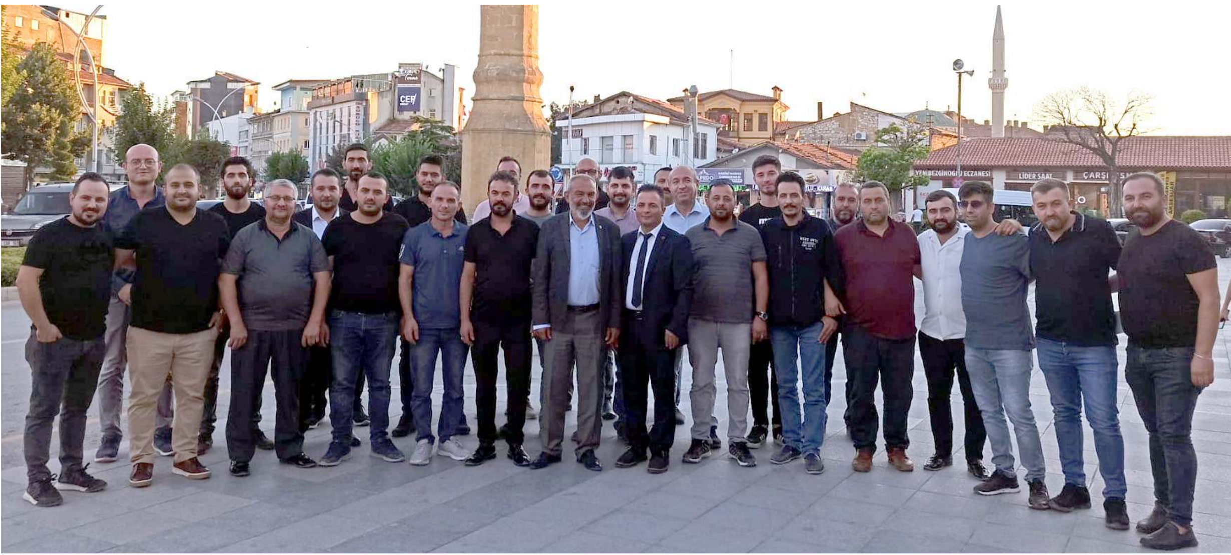
Çorum'da faaliyet gösteren asansör firmaları yaptıkları toplantıda sorun ve taleplerini istişare ettiler.