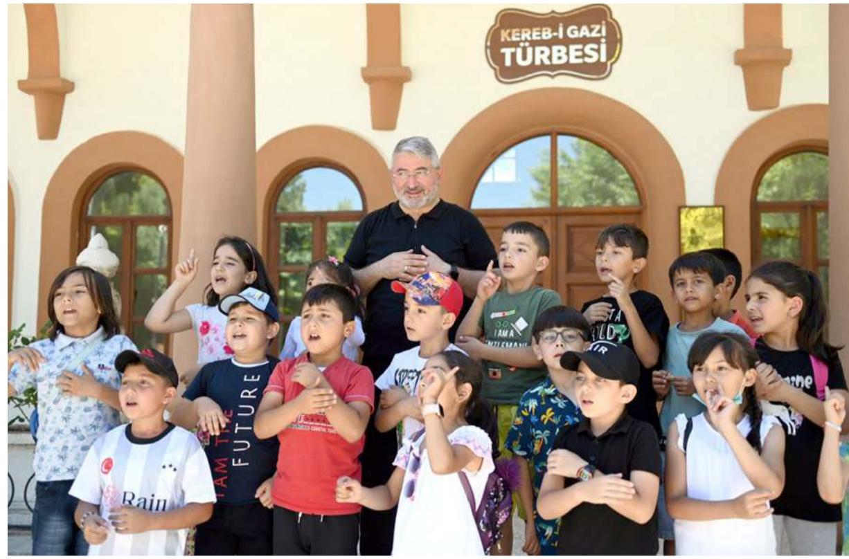
Çorum Belediyesi Mimar Sinan Gençlik Merkezi Yaz Kur'an Kursu öğrencileri sahabe türbelerini ziyaret için Hıdırlık'a gitti.

Resmi İlanlar: www.ilan.gov.tr 'de (Basın: 1668067)