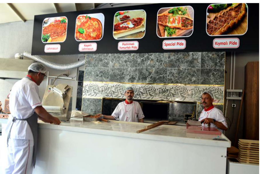
Öz Diyarbakır Sofrası Çorum'un yeni lezzet durağı oldu.