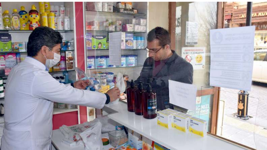
Eczane ve eczane depolarında bulunması gereken ilaç listesinin güncelleneceği belirtildi.

Toplantıda alınan kararları açıklayan Bakan Koca, paylaşımında şunları kaydetti: "Pandemi nedeniyle eczanelerimizin ITS (İlaç Takip Sistemi) kayıtlarında meydana gelmiş olan uyumsuzluklara ilişkin düzenleme çalışmaları yapılacak. Güncel ilaç stok yönetiminin daha etkin bir şekilde yapılması sağlanarak ilaç tedarikindeki sorunlar minimuma indirilecek. Eczane ve eczane depolarında bulunması gereken ilaç listesi güncellenecek." (Haber Merkezi)