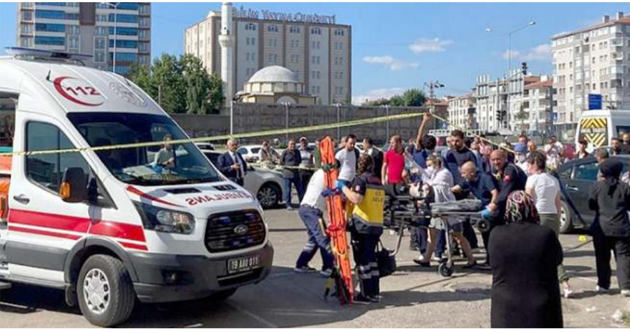
Olay geçtiğimiz günlerde Pazartesi Pazarında meydana gelmişti.

Ulukavak Mahallesi Pazartesi Pazarı'nda yürüten