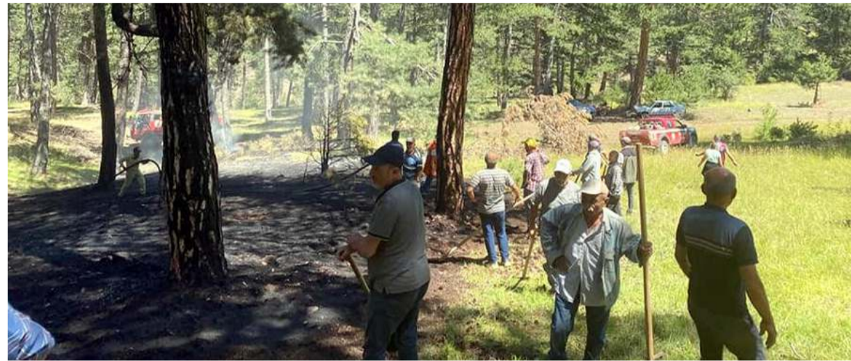
Orman İşletme Şefliğine bağlı itfaiye ekipleri yangını büyümeden söndürdü.