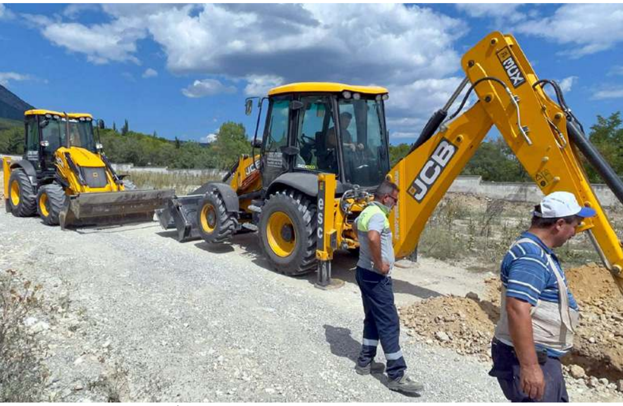
Iliçede doğal gaz borularının döşenmesine başlandı.