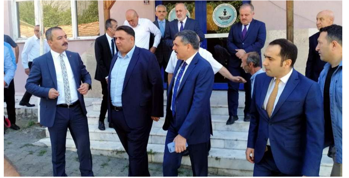
Binanın üç kurum tarafından kullanılmasına karar verildi.