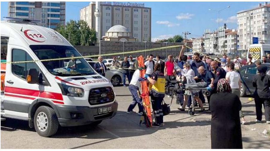
Olay geçtiğimiz günlerde Pazartesi Pazarında meydana gelmişti.

■ Çorum'da bir kişinin öldüğü, bir kişinin yaralandığı silahlı saldırıyı gerçekleştirdikleri iddiasıyla 5 kişi tutuklandı.