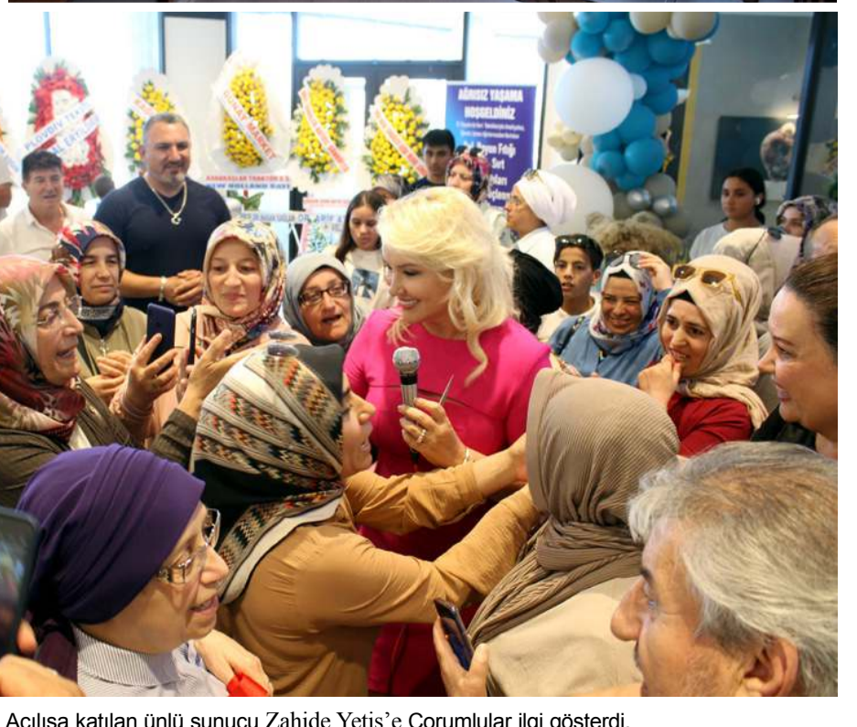
Açılışa katılan ünlü sunucu Zahide Yetiş'e Çorumlular ilgi gösterdi.