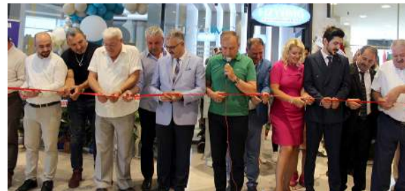
Fizyomg Fizyoterapi ve Sağlıklı Yaşam Danışmanlık Merkezi cumartesi günü açıldı.

■ Çorum Eğitim ve Kültür Vakfı (ÇEKVA) 27 yıldır açtığı kurslarla şehrin eğitim kültür ve sanatına katkıda bulunuyor. * HABERİ 6'DA