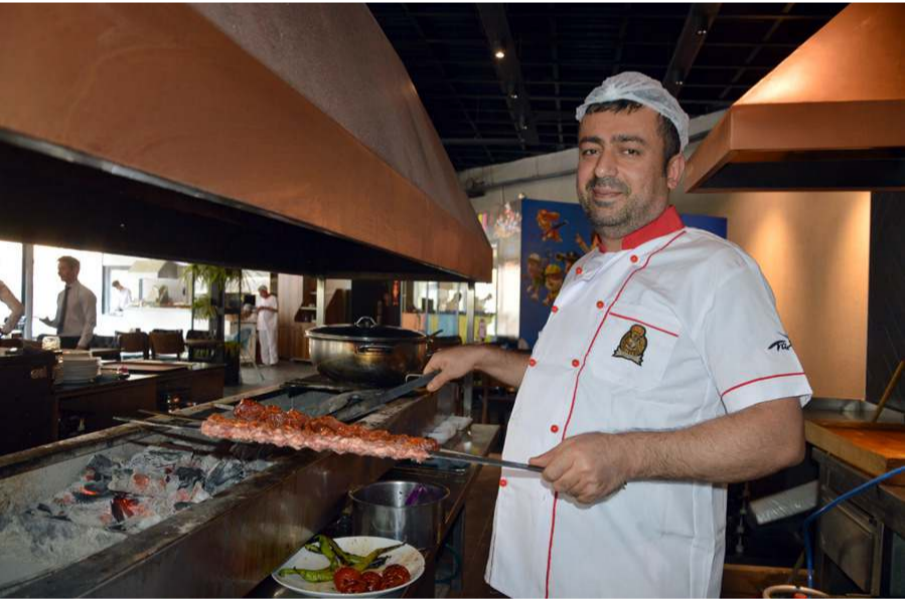
Öz Diyarbakır Sofrası 7. şubasını Çorum'a açmıştı.