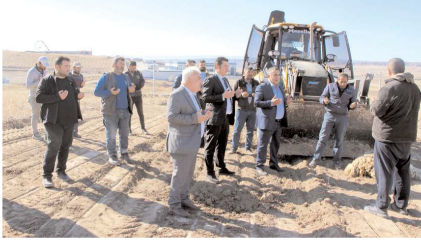
Temel kazısı yapılan dua ile başladı.