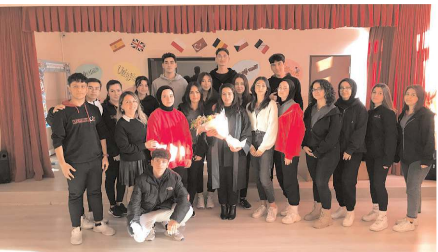
Etkinlikte 'Demokrasi ve Yurttaşların Temel Hak ve Özgürlükleri' hakkında bilgi verildi.