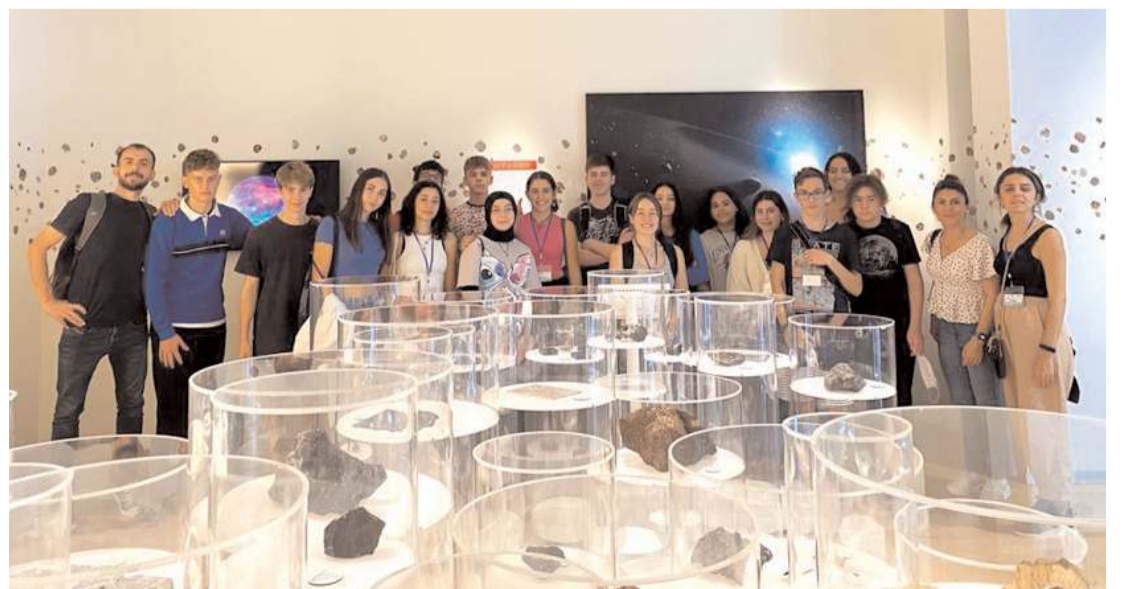
Etkinliklere Çorum, Kocaeli, Portekiz ve Macaristan'daki okullardan toplam 10 öğretmen ve 20 öğrenci katıldı.