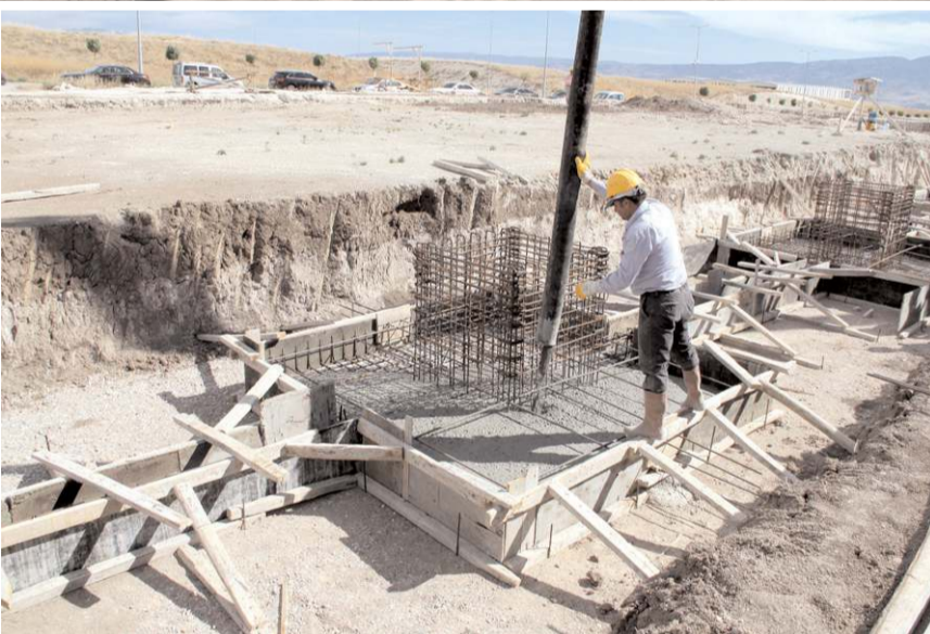
Fabrikada kolonya üretiminin yanında katma değeri yüksek tıbbi aromatik ürünlerde üretilecek.