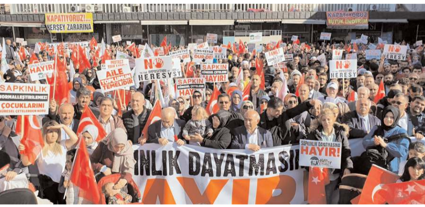
Yürüyüşe katılım yüksek oldu.