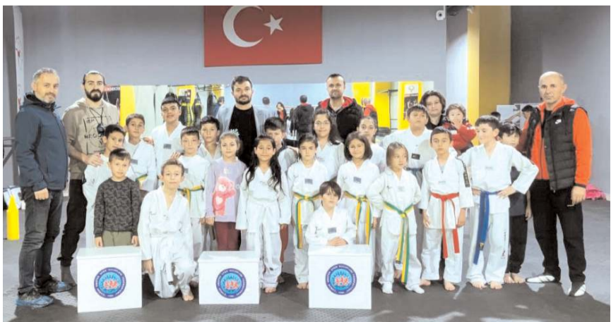
Ankaspor ve Zirve Fitness sporcularına da test ve analizler yapıldı

Statü gereği tek devreli maçlarda puan eşitliği halinde iki takım arasındaki maçta eşitlik olduğu için baraj maçı oynayacaklar. Hattuşa Gençlikspor ile Gençlerbirliği takımları 2 Kasım çarşamba günü saat 17'de 2 nolu sahada baraj maçı yapacaklar. Bu maç kazanan takım Mimar Sinan, He Kültürspor ve Çimentospor'un ardından final grubuna yükselen dördüncü takım olacak.