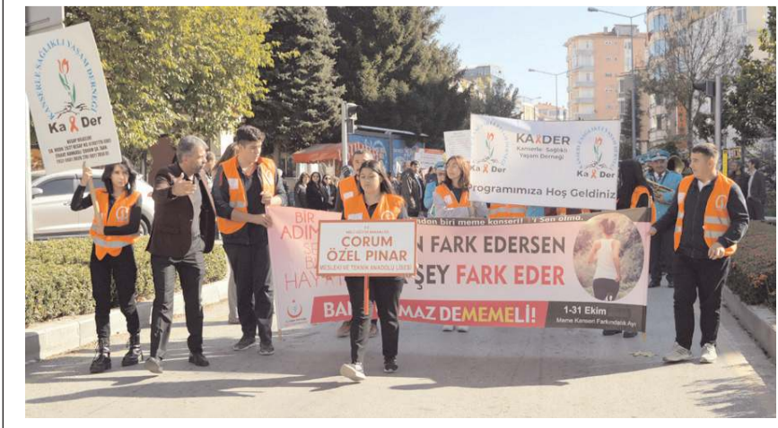
Yürüyüşte meme kanserine dikkat çekildi.