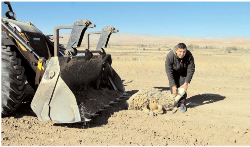
Çalışmalar başlamadan önce kurban kesildi.