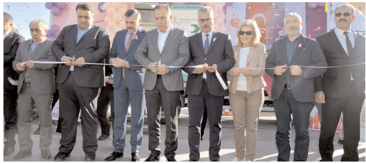
'Mobil Kanser Tarama' aracı yapılan törenle hizmete girdi.

Ceylan'dan randevulara gitmeyen vatandaşlara tepki!