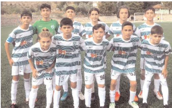
Çimentospor U 15 takımı gruptaki son maçında Çorumspor'u yenerek final grubuna yükselen üçüncü takım olmaya başardı

U 15 Liginde play-off'a yükselen son iki takımdan biri Çi-