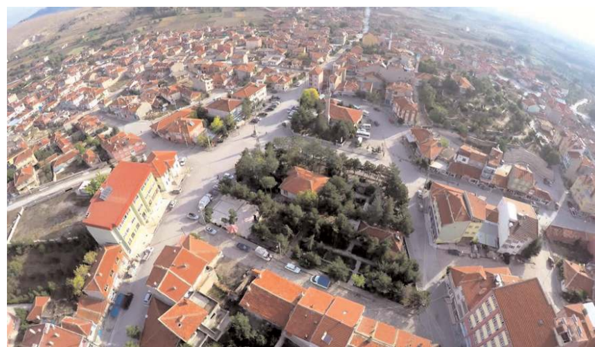
Çalışmalar kapsamında 10.360 metre dere ıslahı yapılacak.