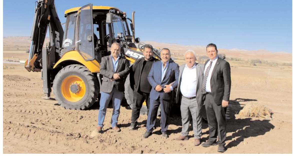
Kurulacak olan tesis için hafriyat çalışmalarına başlandı.