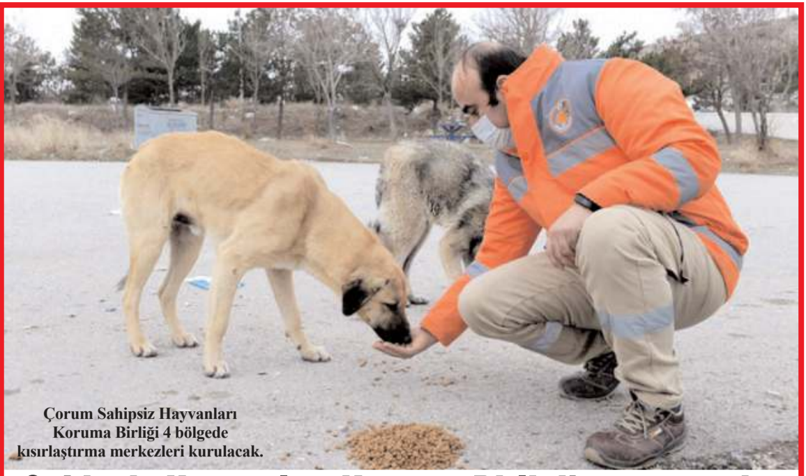
Çorum Sahipsiz Hayvanları Koruma Birliği 4 bölgede kısırlaştırma merkezleri kurulacak.

■ Kanser tarama faaliyetlerinin ulaşılabilirliğinin artırılması, vakaların zamanında tespit edilerek tedavi başarısının yükseltilmesi amacıyla Çorum'a "Mobil Kanser Tarama" aracı kazandırıldı. * HABERİ 2'DE