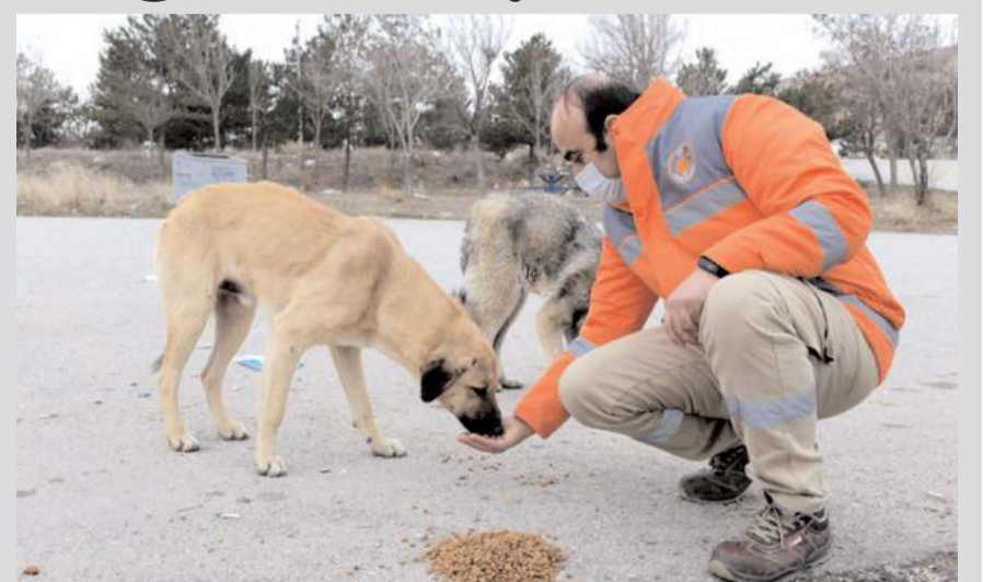
Çorum Sahipsiz Hayvanları Koruma Birliği 4 bölgede kısırlaştırma merkezleri kurulacak.

Çorum Sahipsiz Hayvanları Koruma Birliği marifetiyle tüm ilçe ve köyleri kapsayacak şekilde 4