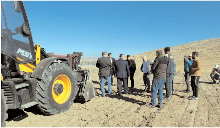
Tesis 20 dönüm araziye kurulacak.