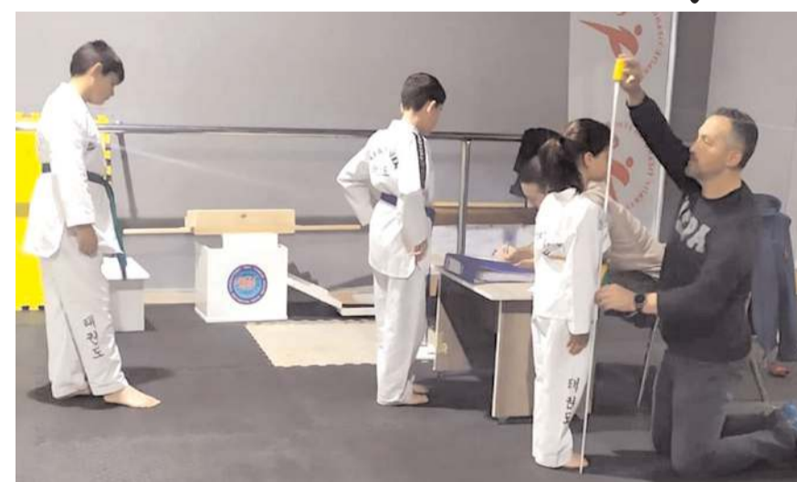
Testler sırasında sporcuların boy kilo ve diğer özellikleri kayıt altına alındı

üye kulüplere sunmuş olduğu sporcu taraması ve sakatlık risk analizi hizmeti gerek diğer şehir ASKF'leri için ve gerekse de ilimizdeki profesyonel takımlar, bilhassa futbol, voleybol, basketbol, atletizm, güreş ve yüzme gibi branşlar için bir model oluşturmaktadır. Çorum ASKF başkanı Ferhat Arıcı Çorum'u bir spor şehri yapmak ve şehrimizin gençlerinden milli düzeyde başarılı sporcular yetiştirmek için yoğun bir çabayla çalıştıklarını ifade etti.