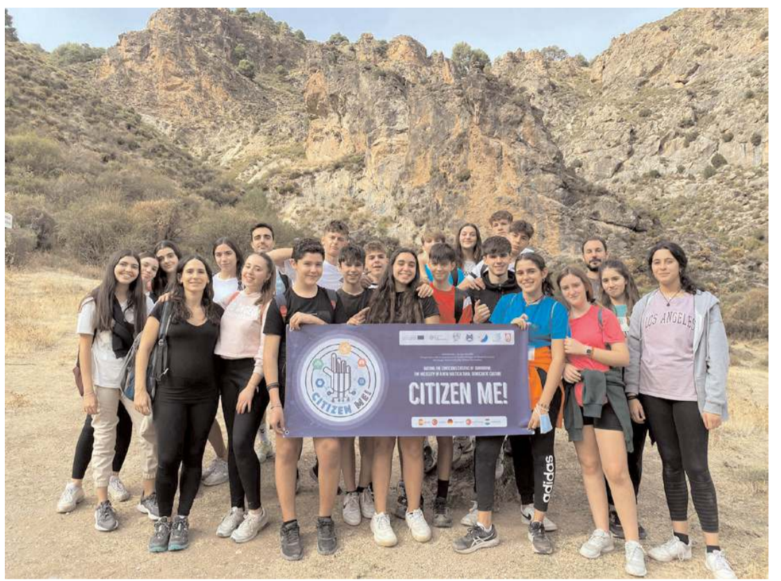
Mehmetçik Anadolu Lisesi öğrencileri Erasmus+ projesi kapsamında İspanya'yı ziyaret etti.

Ergün katılımcıların günlük hayatlarında karşılaşılabilecekleri hak ihlalleri durumunda neler yapabileceklerini ve çalışma hayatındaki insan hakları ihlallerinde nasıl bir yol izlediklerini öğrencilerle paylaştı. (Haber Merkezi)