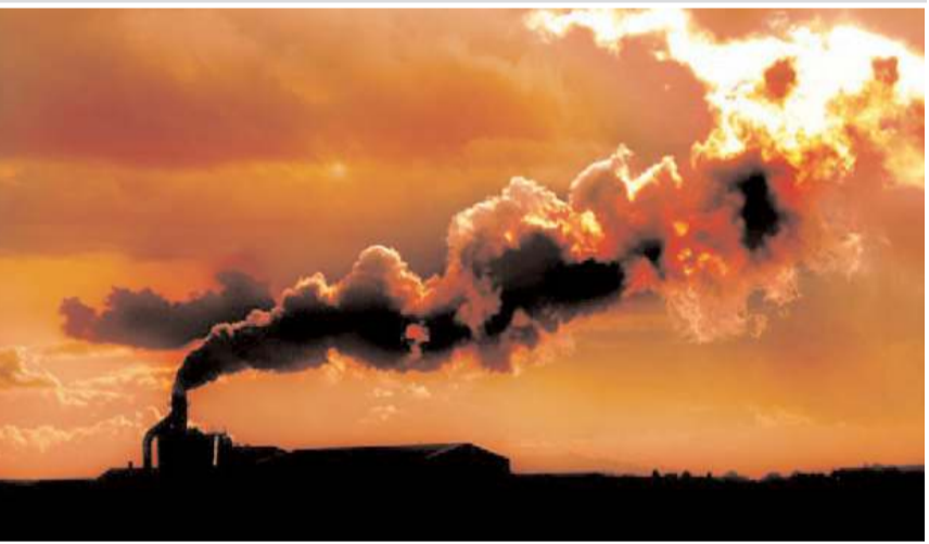
Mecliste alınan kararlarda karbonmonoksit gazı zehirlenmelerine dikkat çekildi.

"Karbonmonoksit zehirlenmelerinde artış olabileceği düşünülerek özellikle lodoslu günlerde gerekli tedbirler alınarak halka konuyla ilgili eğitim verilmeli. Belediyeler tarafından özellikle lodos rüzgârının estiği günlerde halkı ikaz edici anonslar yapılmalı. Tekniğe uygun imalatı, temizliği ve bakımı yapılmayan bacalar zehirlenmelere ve yangınlara neden olabileceğinden, bacalar bina sahiplerince/yöneticilerince her yıl düzenli olarak temizletilmeli bakım ve kontrolleri yaptırılmalı. Kullanılan yakıtın standartlara uygunluğu kontrol edilmeli. İzin belgesi olmayan satıcılardan kömür