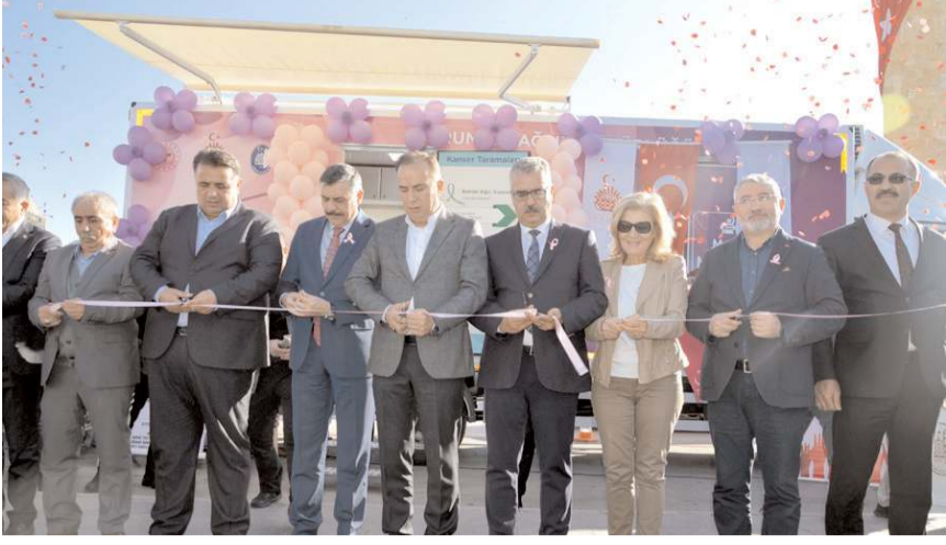
'Mobil Kanser Tarama' aracı yapılan törenle hizmete girdi.

■ Kanser tarama faaliyetlerinin ulaşılabilirliğinin artırılması, vakaların zamanında tespit edilerek tedavi başarısının yükseltilmesi amacıyla Çorum'a "Mobil Kanser Tarama" aracı kazandırıldı. * HABERİ 2'DE