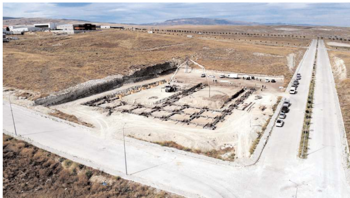
Fabrikanın 2023 yılında faaliyete geçmesi planlanıyor.