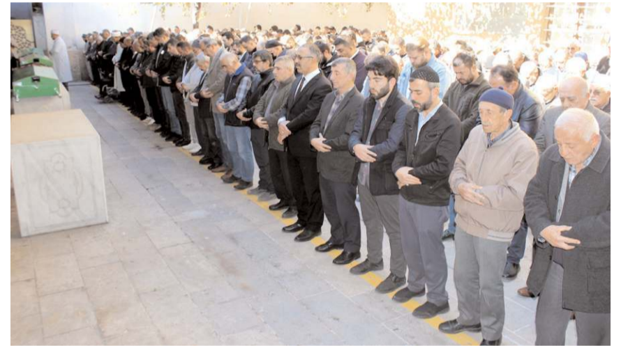
Merhumun cenazesi kılınan namazın ardından Ulu Mezarlık'ta toprağa verildi.