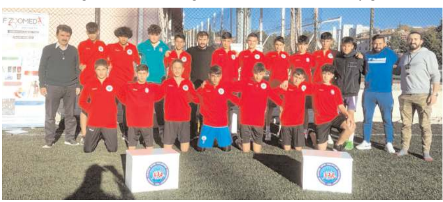
HE Kültürspor futbol takımı yapılan testler sonunda toplu halde görüldü