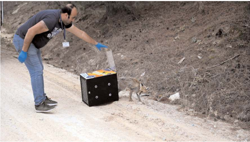
Veteriner İşleri Müdürlüğü'nde 2 gün boyunca bakımı yapılan tilki doğaya bırakıldı.