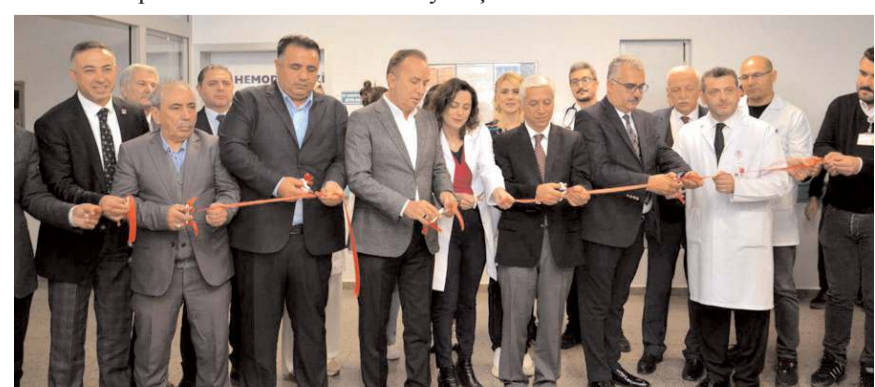
Açılış kurdelesini protokol üyeleri kesti.