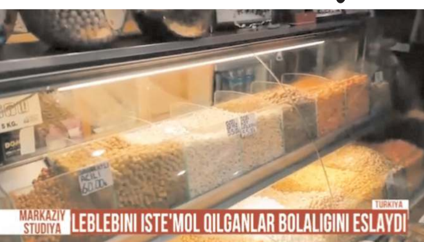
Markaziy Studiya kanalında Çorum leblebisi tanıtıldı.