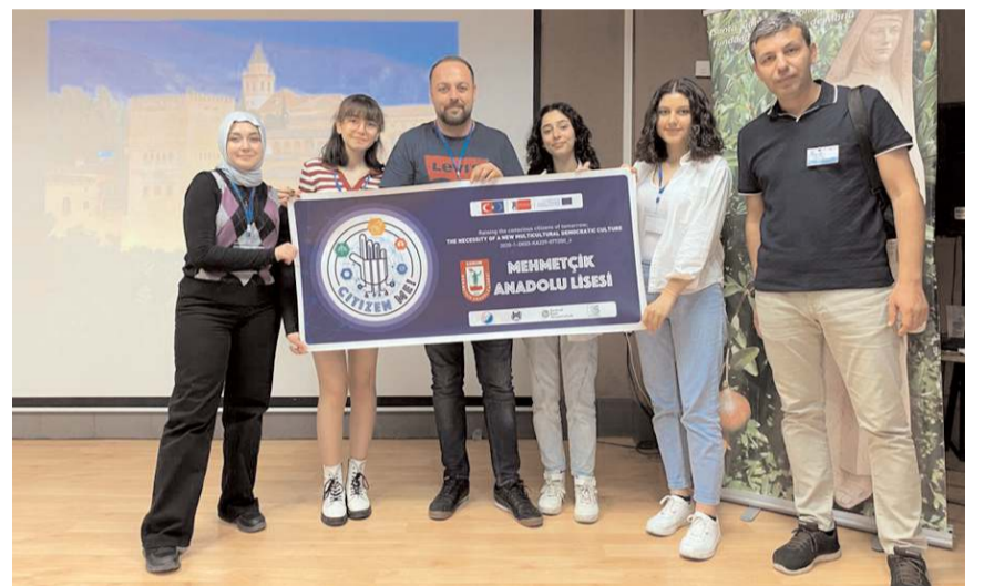
Compañia de Maria de Granada'ya giden öğrenciler burada çeşitli etkinliklere katıldı.

Programın sonunda ise katılımcılara beş günlük öğrenme, öğretim, eğitim faaliyetlerine katılıp başarı ile tamamladıklarını belirten sertifikaları verildi. (Haber Merkezi)