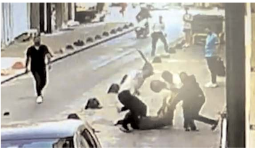
Dehşet anları kameralara yansımıştı.

Taksim'de boş bir binaya girmek istedikleri sırada binanın bekçisi tarafından engellenen şahıslar, bir süre sonra geri gelerek bekçiyi beyzbol sopası ve kaskla döverek komaya soktu. Beyoğlu Asayiş Büro Amirliği ekiplerince tespit edilen saldırgan, motosikletle yaralanmalı kazaya karışınca yakayı ele verdi. Dehşet anları kameralara yansırken, yaklaşık 4 ay komada kalan bina bekçisi ise hayatını kaybetti.