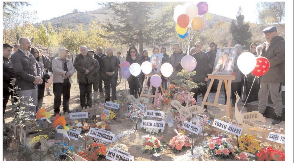
İzmir depremde hayatını kaybeden babaanne ve 4 torunu, Kuşsaray köyündeki mezarları başında anıldı.

İzleyene İki yılın Analitik Bütçenin Plan ve Bütçe Komisyona havalesi. Gülabibey Mahallesi de bulunan parka isim verilmesi. Buharaevler Mahallesi de bulunan parka isim verilmesi. Ulukavak Mahallesi de bulunan parka isim verilmesi. Laçın Belediyesine ait araç onarım talebi. Sarımbey Köyü 112 ada 19 parsel için İmar Planı ilavesi teklifi. Gülabibey Mahallesi 4733, 4734, 4735, 4736, 4737, 4738 nolu adalar ve 4729 ada 2, 7, 8, 9 nolu parseller ile 4730 ada 2, 6, 7 ve yakın çevresi için İmar Planı değişikliği teklifi. İlice Mahallesi 4226 ada 5 nolu parsel için İmar Planı değişikliği teklifi. Gülabibey Mahallesi 3843 ada 2 parsel için İmar Planı değişikliği teklifi. Karakeçili Mahallesi 4262 ada 1 parsel ve çevresinde 6 hektarlık alan için İmar Planı değişikliği teklifi. Çepni Mahallesi 3573 ada 14 parsel için İmar Planı değişikliği teklifi. 115 ada 4 nolu parselin tahsis (Güpür Hamamı). Basın Yayın ve Halkla İlişkiler Müdürlüğünün Yönetmeliğinde değişiklik yapılması."