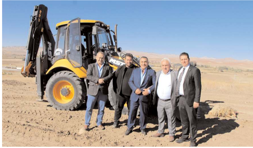
Kurulacak olan tesis için hafriyat çalışmalarına başlandı.

■ Sungurlu Organize Sanayi Bölgesine (OSB) Aten Atık ve Enerji firması tarafından kurulacak olan tesisin çalışmaları başladı. Atık lastiklerden piroliz yöntemi ile elektrik ve karbon siyahı üretecek tesis 100 milyon liraya yapılacak. * HABERİ 7'DE