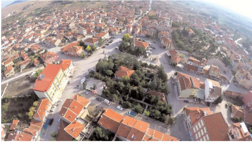
Çalışmalar kapsamında 10.360 metre dere ıslahı yapılacak.

Sözleşmesi imzalanan proje kapsamında, Bayat Deresi üzerinde 40 metre taban genişliğinde, 2,6 metre yüksekliğinde 9.300 metrelik makinalı kanal çalışması, 1000 metrelik gabion trapez kanal yapılması ve 60 metre mevcut kanal duvarının 70 cm yükseltilmesi olmak üzere, toplamda 10.360 metre dere ıslahı yapılacak. Yapılan çalışmalar sonucunda Bayat taşkınlarından korunmuş olacak. (Haber Merkezi)