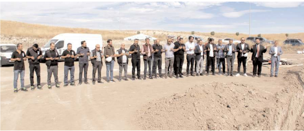
Organize Sanayi Bölgesi'nde 11 bin 500 metrekare araziye inşa edilecek olan fabrikanın temeli dualarla atıldı.