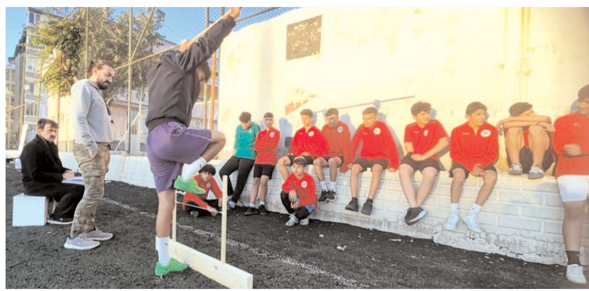
Sporcuların zıplama yükseklik tansiyon gibi bir çok özellikleri yapılan testler ile kayıt altına alındı

U 15'de Mimar Sinan ve Kültürspor'un ardından play-off'a çıkan üçüncü takım Çimentospor oldu. Son takım baraj maçında belli olacak.