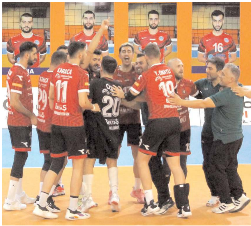
Akkuş deplasmanında galip dönen Çorum Belediyesi Gençlikspor'lu Efelerin sevinci

HALİL ÖZTÜRK Erkekler Voleybol 1. liginde beşinci maçlar sonunda Çorum Belediyesi Gençlikspor yoluna kayıpsız devam ederken liderliğini açık ara sürdürdü. Beşinci hafta maçında Çorum Belediyesi Gençlikspor bu ligin tec-