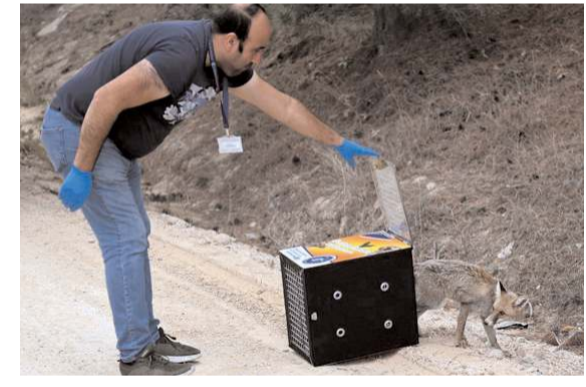
Veteriner İşleri Müdürlüğü'nde 2 gün boyunca bakımı yapılan tilki doğaya bırakıldı.