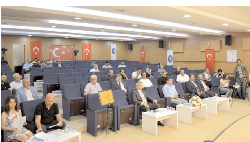
Toplantıda gündem maddeleri görüşülerek karara bağlanacak.

"2023 Yılı Performans Programı. 2023 Yılı ve