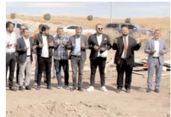
Organize Sanayi Bölgesi'nde inşaa edilecek olan fabrikanın temeli dualarla atıldı.