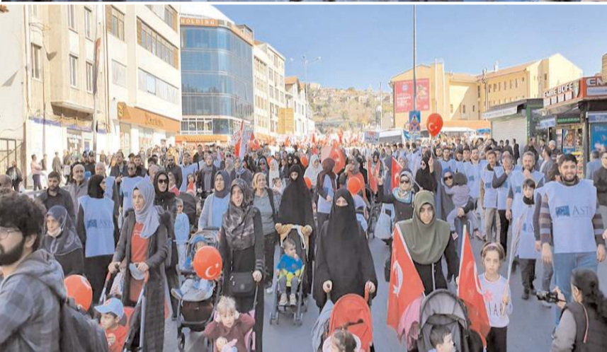
Yürüyüş Hacı Bayram Camii'nde başlayıp Ulus Meydanı'nda sona erdi.