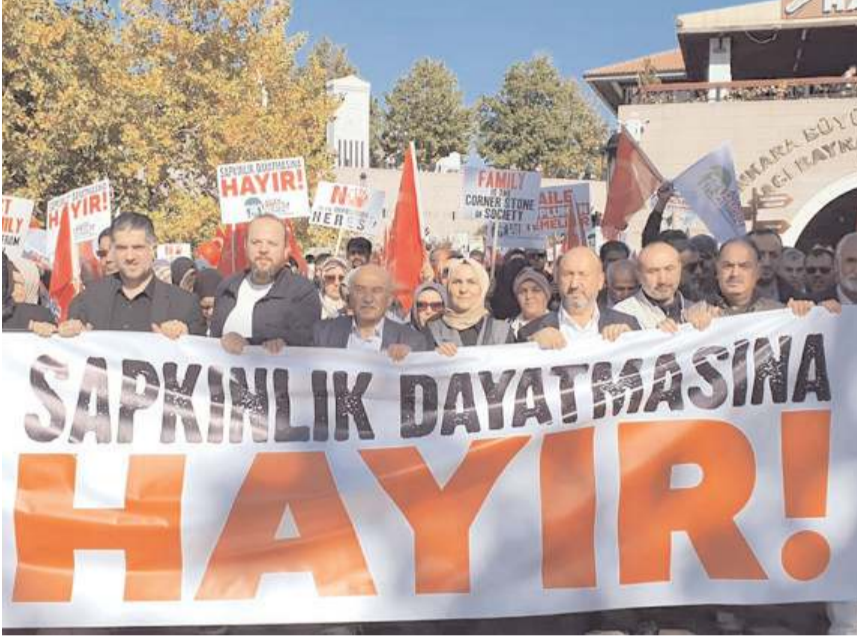
Yürüyüşe AK Parti Çorum Milletvekili Erol Kavuncu da katıldı.