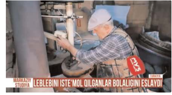
Programda leblebinin yapılış aşamaları gösterildi.