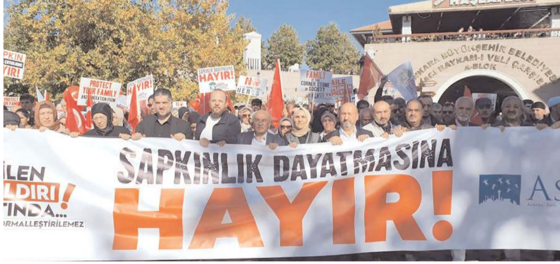
Yürüyüşe AK Parti Çorum Milletvekili Erol Kavuncu da katıldı.