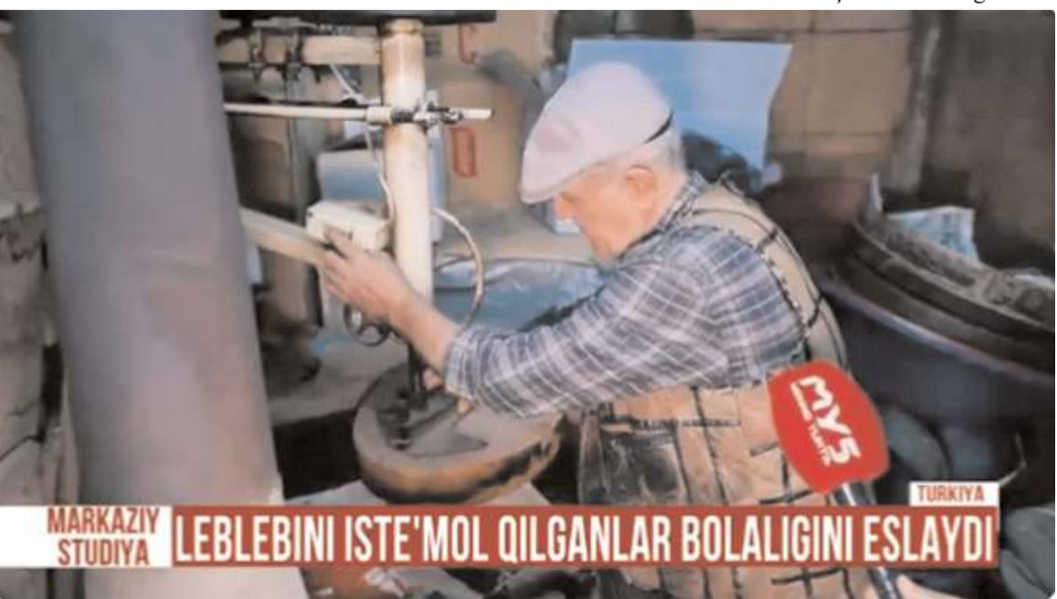
Programda leblebinin yapılış aşamaları gösterildi.

Özbekistan kanalı Markaziy Studiya, haberlerinde Çorumlu leblebi ustalarına yer vererek leblebinin yapılışı hakkında bilgi aldı.