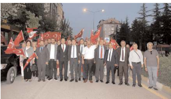
Yürüyüşe CHP, İYİ Parti, Deva Partisi ve Gelecek Partisi'nden katılım oldu.

■ Çorum'da Millet İttifakını oluşturan siyasi partilerin yönetici ve üyeleri, 30 Ağustos Zafer Bayramı nedeniyle vatandaşlarla birlikte 'Zafer Yürüyüşü' düzenlediler. * HABERİ 5'DE