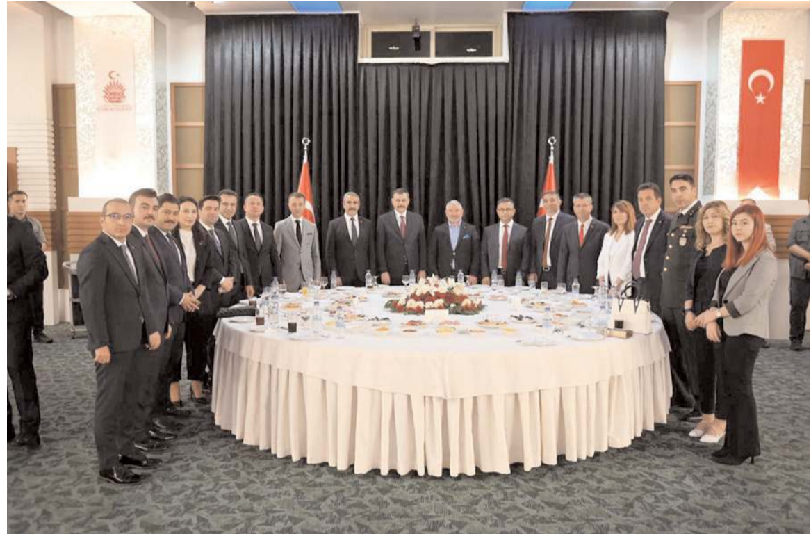
30 Ağustos Zafer Bayramı nedeniyle Anitta Otel'de resepsiyon düzenlendi.

Katılımcılar daha sonra Çorum Belediyesince organize edilen konseri izledi.(AA)