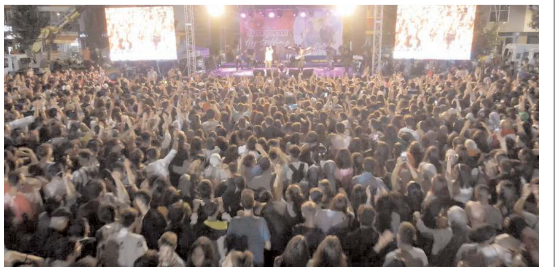
Kadeş Barış Meydanında yapılan konsere ilgi yüksek oldu.

Çorum Belediyesi, 30 Ağustos Zafer Bayramı kutlama etkinlikleri kapsamında sevilen müzik grubu İkilem'i Çorumlularla buluşturdu.