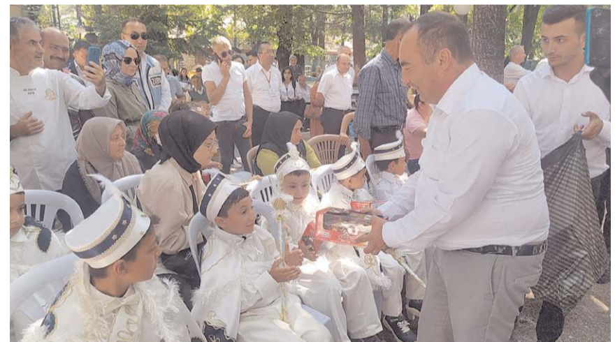
Şölende çocuklara oyuncak hediye edildi.

Programa İskilip Kaymakamı Yunuz Emre Vural, daire amirleri, sivil toplum kuruluşlarının temsilcileri ve vatandaşlar katıldı. (İHA)