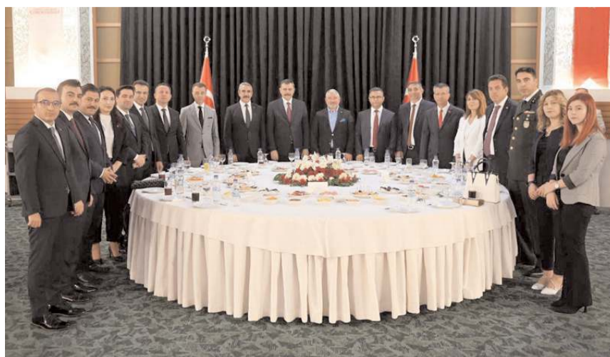
30 Ağustos Zafer Bayramı nedeniyle Anitta Otel'de resepsiyon düzenlendi

■ 30 Ağustos Zafer Bayramı'nın 100. yılı münasebetiyle Çorum Valiliği'nce düzenlenen resepsiyonda konuşan Vali Mustafa Çiftçi, birlik ve beraberlik mesajı vererek, "Bir ve beraber olursak geçmişte olduğu gibi sırtımız yere gelmeyecektir" dedi. * HABERİ 4'DE