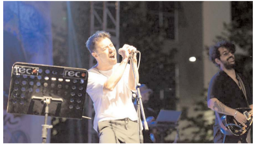
Çorum Belediyesi, sevilen müzik grubu İkilem'i Çorumlularla buluşturdu.