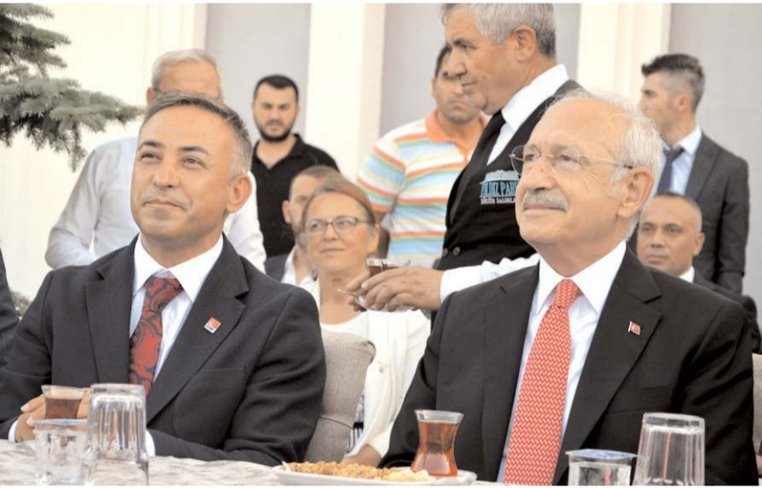
CHP Genel Başkanı Kemal Kılıçdaroğlu, partililer tarafından karşılandı.

Vatandaşlarla sohbet eden Kılıçdaroğlu, Millet İttifakını oluşturan siyasi partilerin il başkanları ile de istişarelerde bulundu.