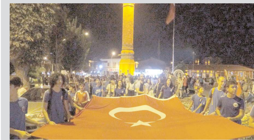
Atatürk Anıtı'nda başlayan Fener Alayı, Saat Kulesine devam edip Kadeş Barış Meydanı'nda sona erdi.