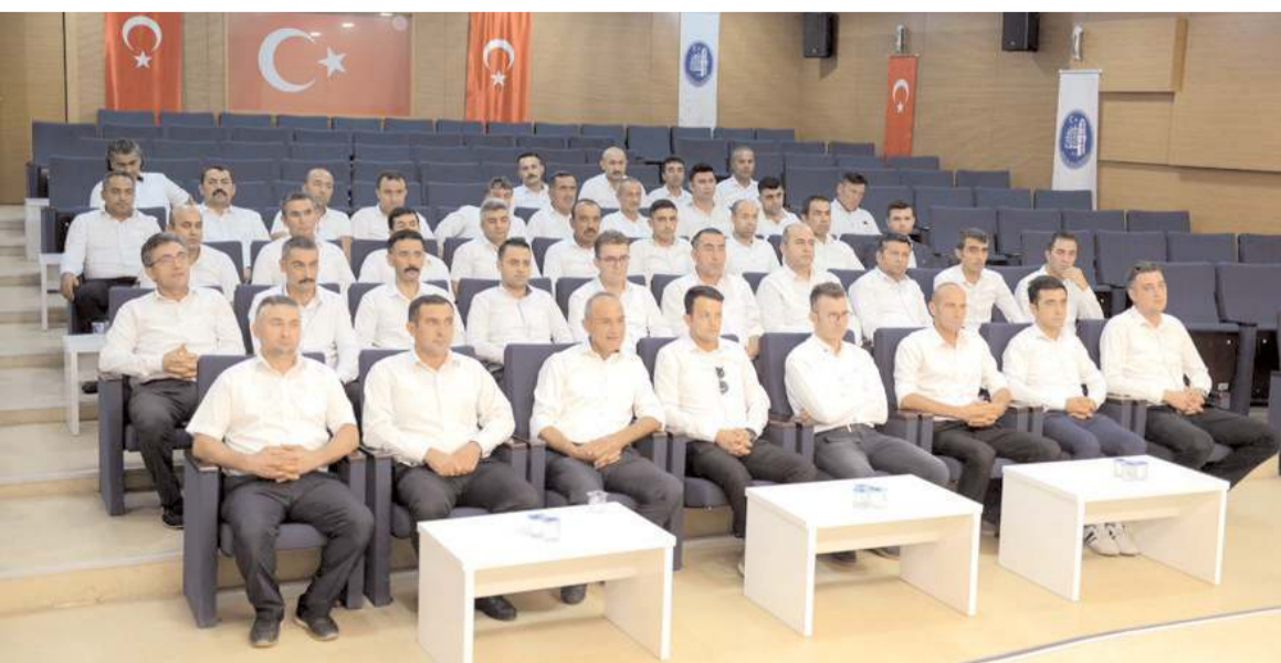
Toplantıda şoförlere toplu taşımada dikkat edilecek hususlar anlatıldı.

daşlarımızla bu toplantıları belirli periyotlar halinde yapacağız ve bu konuda eğitim seminerleri düzenleyeceğiz. İşlerimizde başarılı ve kolaylıklar diliyorum" diye konuştu. (Haber Merkezi)