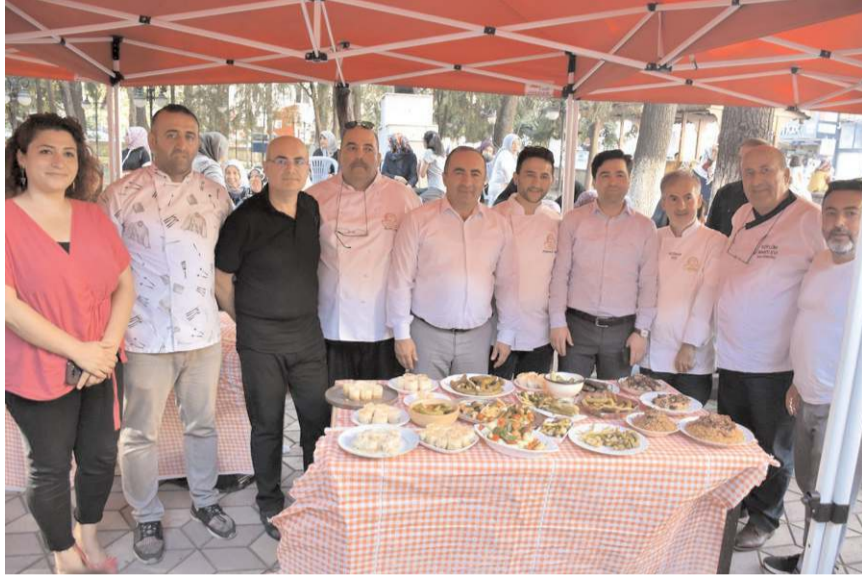
Yarışmacıların süslediği tabaklar, jüri üyeleri tarafından puanlandırıldı.

Görselliğe de önem verilen yarışmada, yarışma-