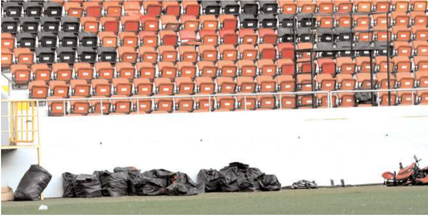
Şehir Stadyumunda kırılan koltuklar yenileri ile değiştirilerek pazar gününe hazırlanıyor