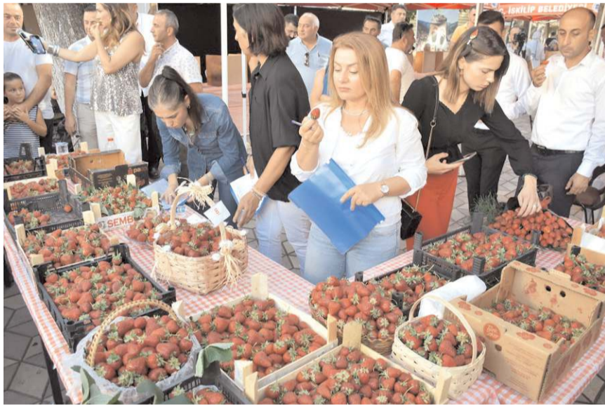
Festivalde çilek yarışması da yapıldı.

cıların süslediği tabaklar, jüri üyeleri tarafından puanlandırıldı.