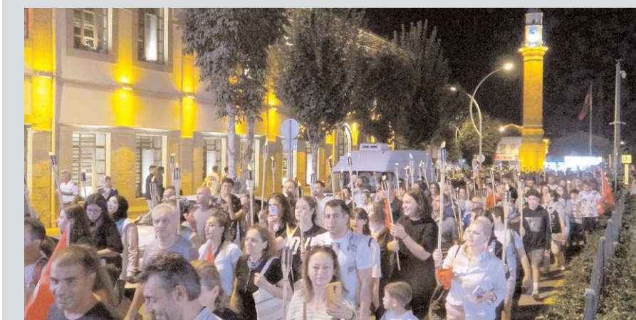
Fener Alayına vatandaşlar ellerinde meşalelerle katıldılar.