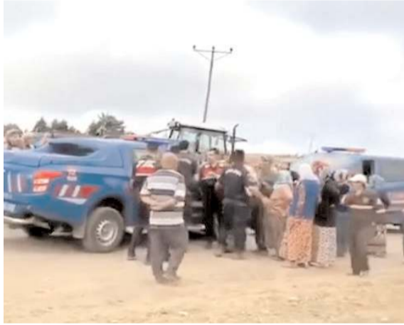
İki köyün karşı karşıya geldiği olayda prefabrik mescit yanarak zarar gördü.