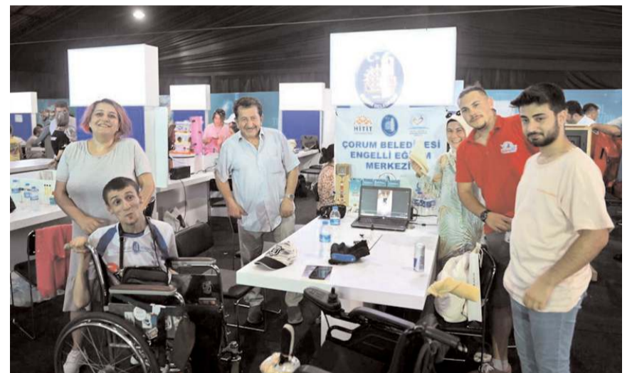
Teknofest'e Engelli Eğitim Merkezi ve Gençlik Merkezi öğrencileri de katılıyor.