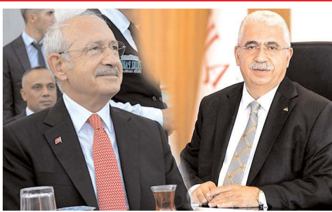
CHP Genel Başkanı Kemal Kılıçdaroğlu, Çorum'da açıklamalarda bulundu.