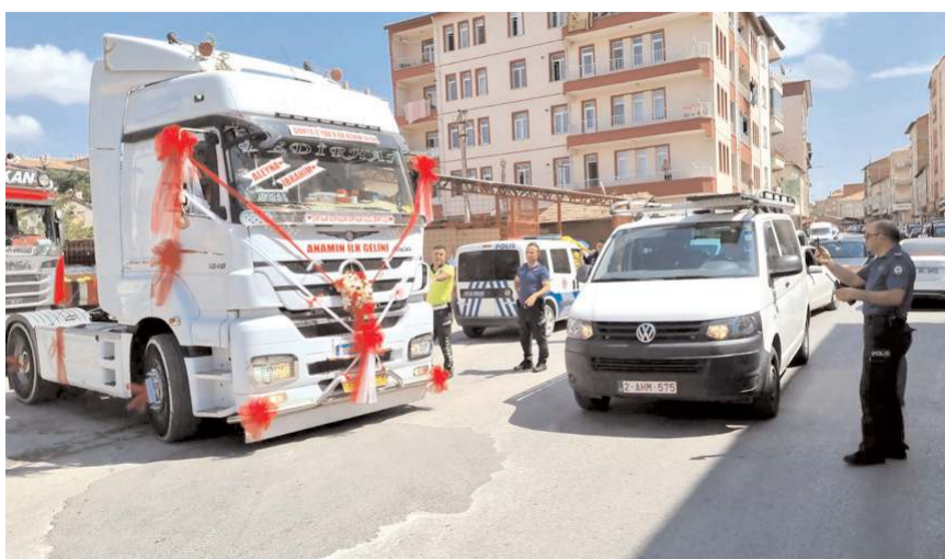
Tırlara 100 bin liranın üzerinde trafik cezası kesilmiş.

Düğün sahibinin araçlarına yaklaşık 15 bin TL cezanın yazıldığı konvoyda, gelin aracı olan tıra da 5 bin 200 lira ceza kesildi. 100 bin liranın üzerinde trafik cezasının yazıldığı düğün konvoyuna katılan tır sürücülerini cezasının yargıya taşıyacaklarını ifade ettiler. (İHA)