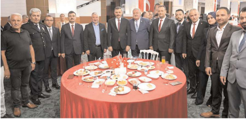
Resepsiyona protokol üyeleri ile çok sayıda davetli katıldı.