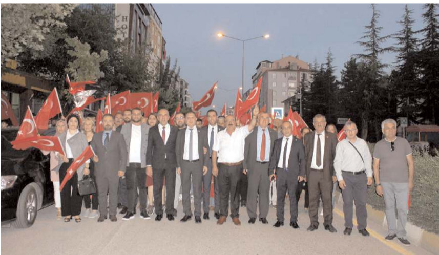
Yürüyüşe CHP, İYİ Parti, Deva Partisi ve Gelecek Partisi'nden katılım oldu.