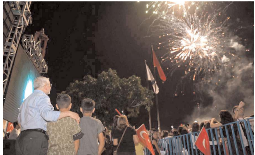
Konser sonunda havai fişek gösterisi yapıldı.