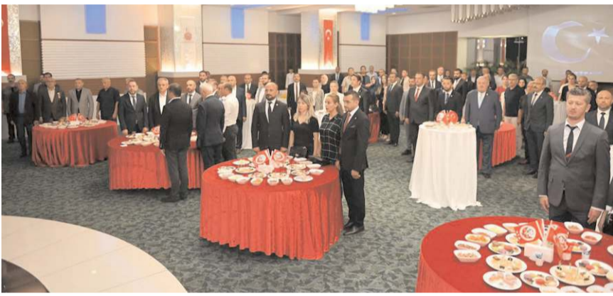
Program saygı duruşunda bulunulması ve İstiklâl Marşı'nın okunmasının ardından Kur'an-ı Kerim Tilaveti ile başladı.