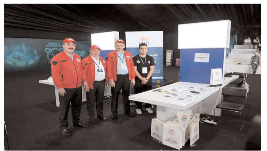
Protokol üyeleri Hitit Üniversitesi standını ziyaret ettiler.