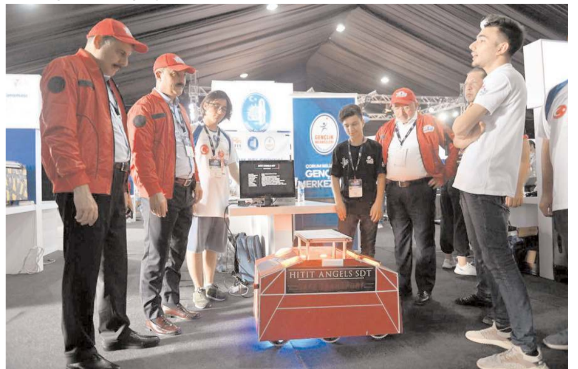
Protokol üyeleri Hitit Angels Takımının projesini inceledi.

Festival kapsamında 30 Ağustos-4 Eylül'de çeşitli gösteriler, teknoloji yarışmaları gerçekleştirilecek. Teknofest Karadeniz'de Türkiye'nin havacılık ve uzay sanayisi, savunma sanayisinde yerli ve milli üretimi yapılan insansız savaş araçları, helikopter ve jet sergileniyor. Festivalde kamu kurum ve kuruluşlarının yerli üretimini yaptıkları elektrikli araçlar da bulunuyor. Festivalde çeşitli sanatçılar da konserleriyle renk katıyor.