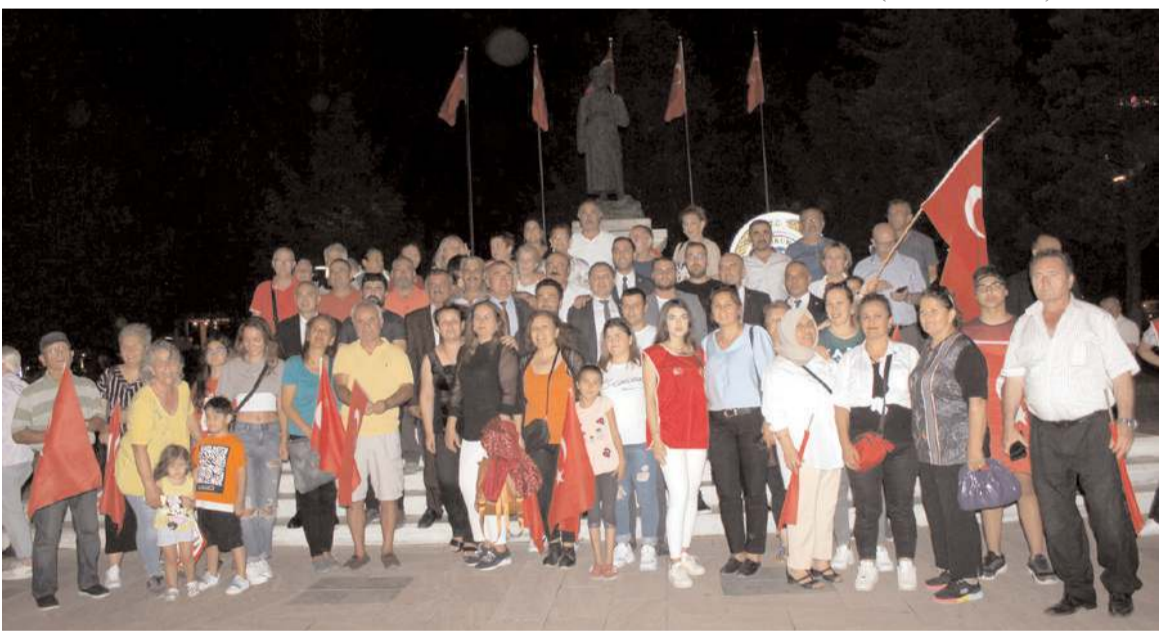
Hünkar Hacı Bektaş Veli Parkı'ndan başlayan yürüyüş Atatürk Anıtı'nda sona erdi.