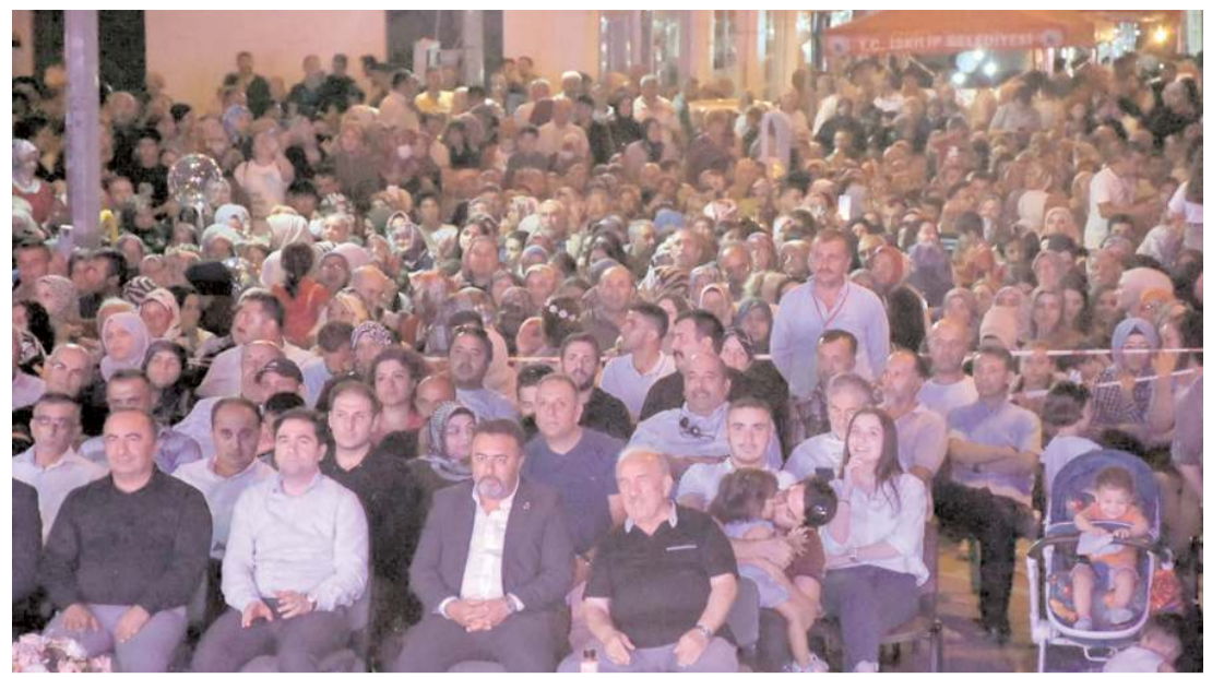
Konsere halkın ilgisi yoğun oldu.