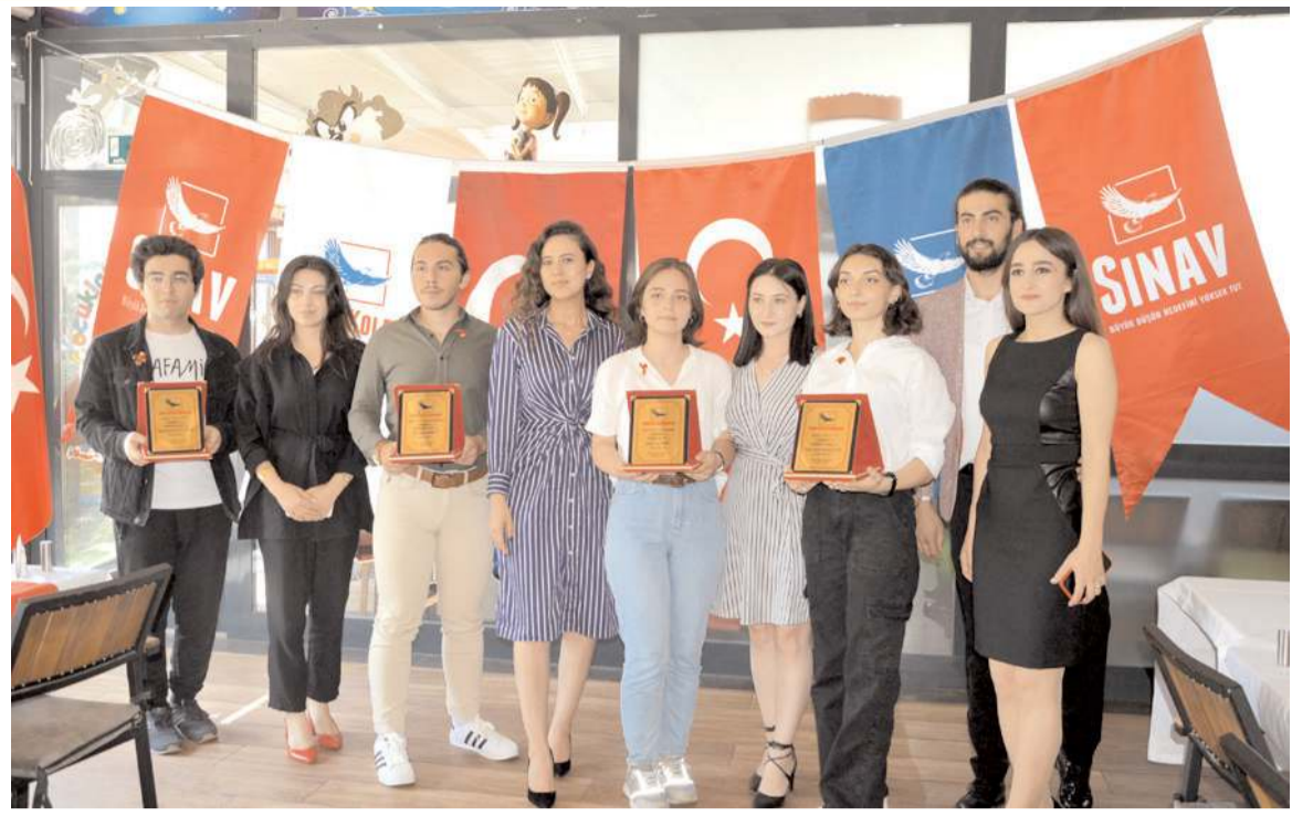
Çorum Sınav Eğitim Kurumları, Yükseköğretim Kurumları Sınavı'nda (YKS) başarılı olan öğrencilerine AHL Park AVM MADO'da gerçekleştirilen törenle plaket ve ödül verdi.