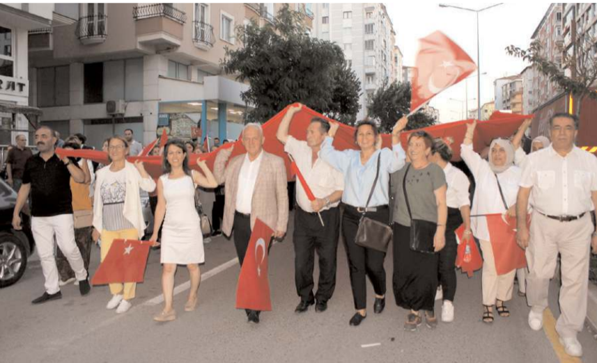
Katılımcılar ellerinde Türk bayrakları ile Atatürk Anıtı'na kadar yürüdüler.