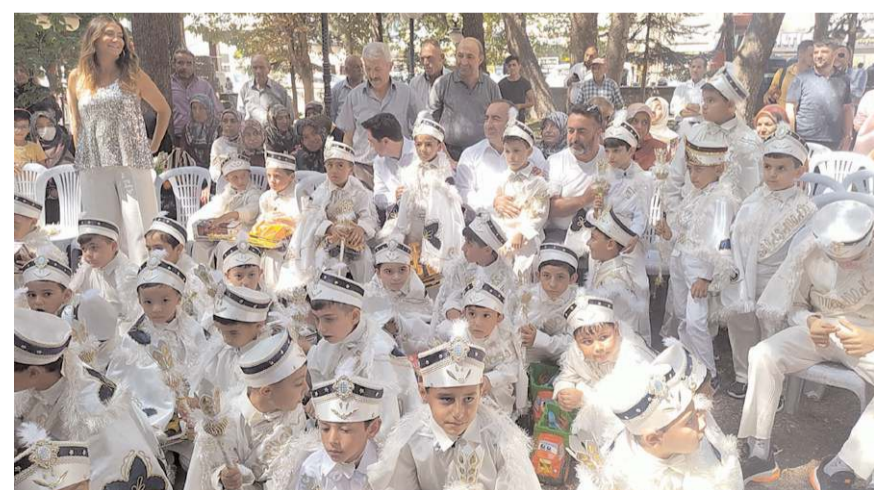
60 çocuk erkeklige ilk adımı attı.