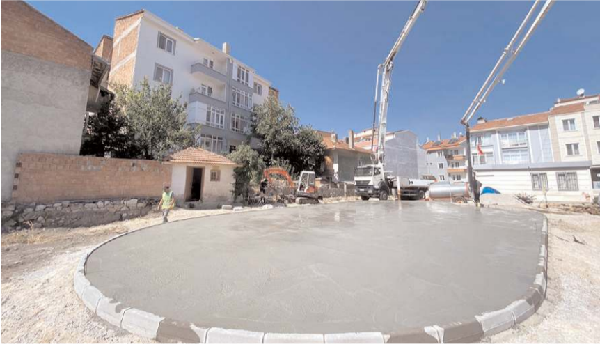
Park, bölgede büyük bir eksikliği giderecek.