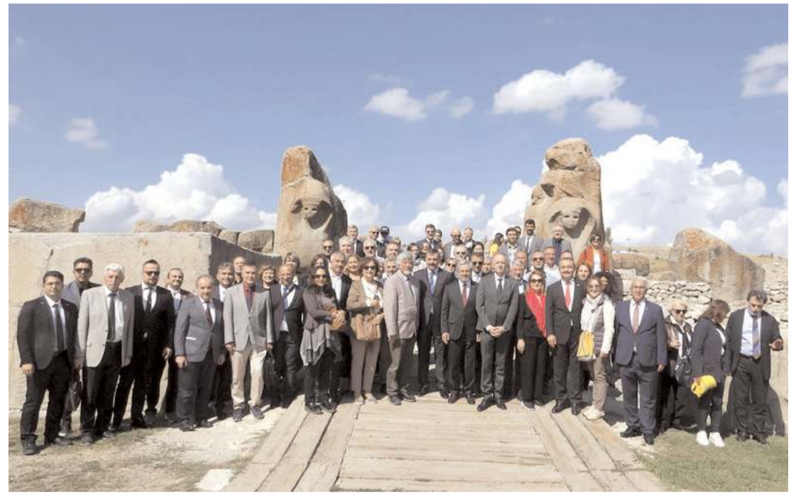
Ankara Üniversitesi Senatosu, yeni akademik yılın ilk toplantısını, Alacahöyük'te yaptı.

bir sahabe efendimizin geldiği burada medfun olduğuna dair tarihi bilgilere ulaştık. Osmancık Tapu kayıtlarında yer alan bilgilerden anlaşılıyor ki İbrikat Hazretlerine ait bir camii, bir hamam bir de türbe var. Türbenin mescidin içinde olduğuna dair bilgiler edindik. Bu kayıtlarda türbedar, türbedarın yakınlarının gömülü olduğu mezarlığın yeri tarihi kayıtlarda çıkıyor. Osmanlı Devleti resmi gazetesinde İbrikat Hazretlerinin türbesine her sene belli bir miktar bütçe ayrıldığından bahsediyor. Tamiri ve muhasebesi, birinin zaviyeye tayin edilmesi gibi birçok yerde ifade ediliyor. Günümüzde dükkanların olduğu bu yerlerin Vakıflar aracılığıyla tekrar sahip çıkılarak bir türbenin yapılmasını arzu ediyoruz" dedi. (İHA)