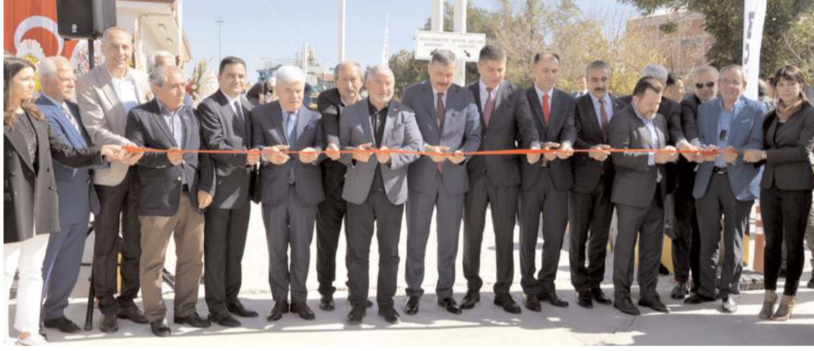
Konuşmaların ardından açılış kurdelesi kesildi.