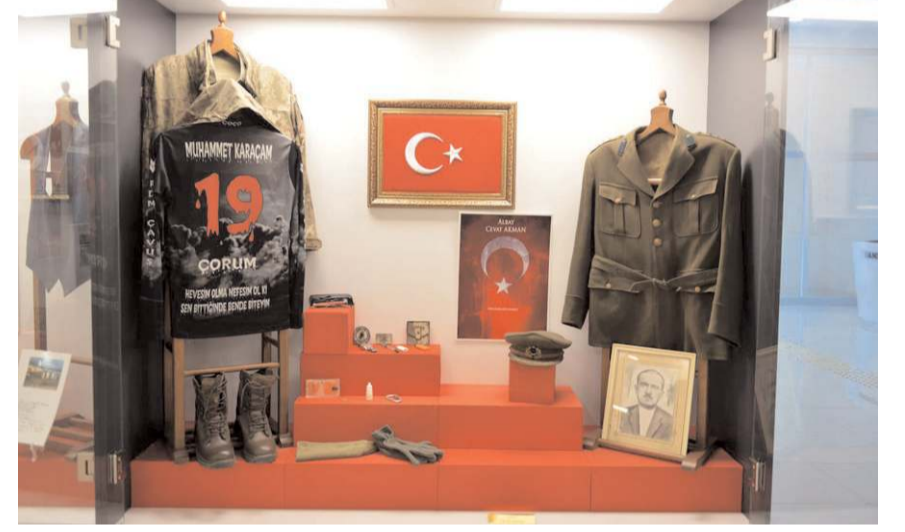
Şehidin eşyaları, 15 Temmuz Şehitler Müzesi'nde sergilenecek.