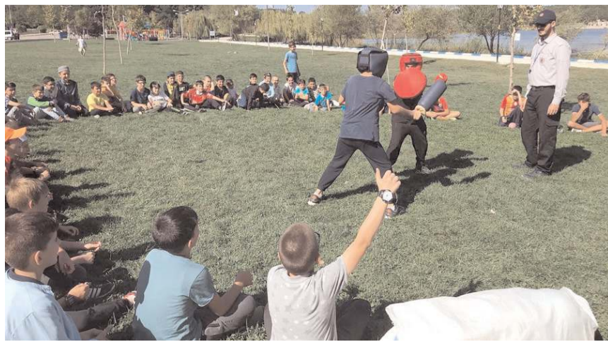
Öğrenciler piknikte çeşitli oyunlar oynadılar.