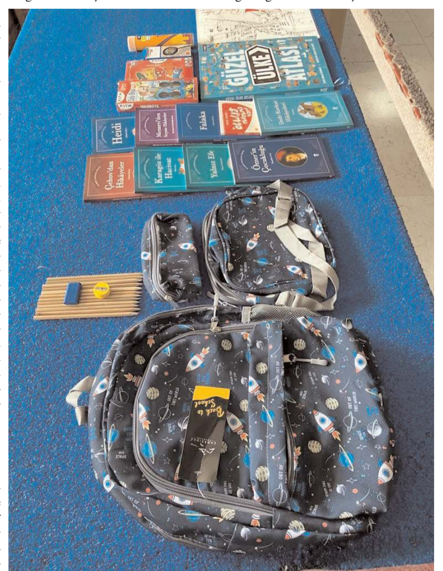
Hediye paketleri içinde kırtasiye malzemelerinin yanında kitaplarda bulunuyor.

Eğitim ve Gelişim Destek Paketleri'nin dağıtıldığı iller arasında Çorum'da var.