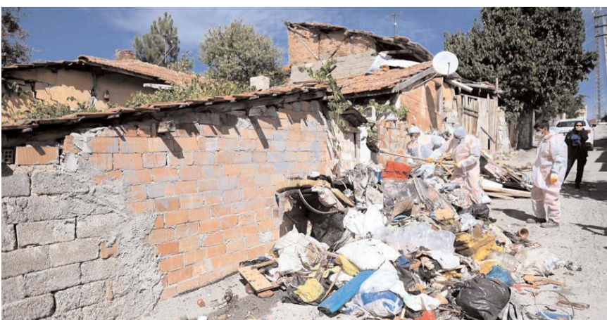
Temizlik İşleri Müdürlüğü ekipleri çöp evde temizlik yaptı.