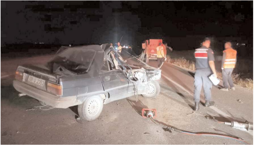
Kaza Alaca-Yozgat kara yolu Fakılar köyü yakınlarında meydana geldi.