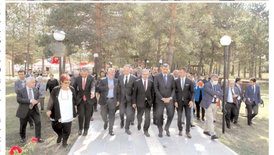
Ankara Üniversitesi Senatosu ilk kez Ankara dışında toplandı.

yeni projeler çıkartabileceklerini düşündüğünü söyledi.