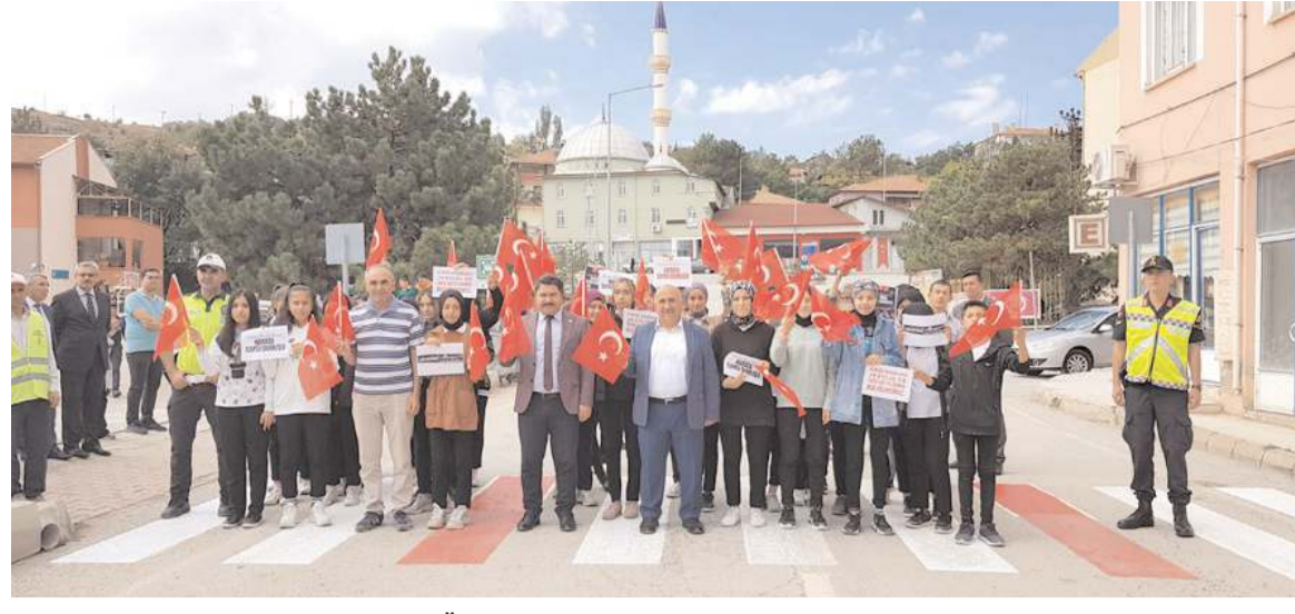
Bayat'ta 'Yayalara Öncelik Duruşu, Hayata Saygı Duruşu' etkinliği yapıldı.