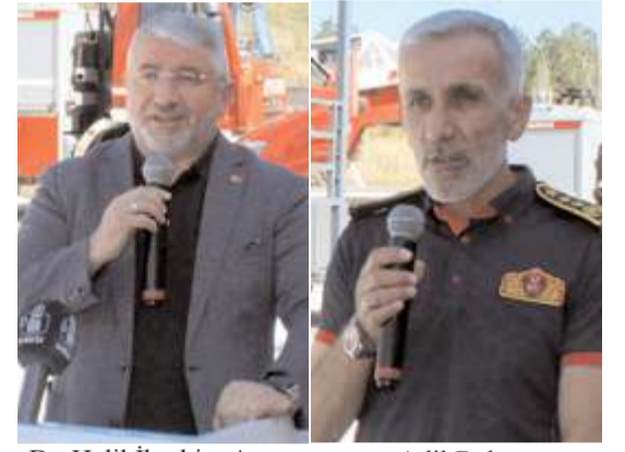
Dr. Halil İbrahim Aşgın

İtfaiye Birimi'nin özel bir yerinin olduğunu ifade eden Başkan Aşgın, 83 personeli ile gurur duyduğunu dile getirerek şunları söyledi: "Müdahaleleri yerinde, canları ve hayatları pahasına yangına koşuyorlar. Trafik kazasında ilk müdahaleyi yapmak için koşuyorlar. Kendi canlarını hiçe sayarak milletimizin can ve mal güvenliğini sağlamaya çalışıyorlar. Türkiye'nin neresinde bir problem varsa ilk aranan itfaiyelerden birisiyiz. Ülkenin herhangi bir yerinde yangın, sel vb. sorun varsa Çorum İtfaiyemiz aklı geliyor. Biz de o gece bize haber gelir, gelmez hazırlanıp, afet bölgesine doğru yola çıkıyoruz. Şehrimizin yayılan yapısı itfaiyemizin etkin ve verimli zamanında müdahalesi noktasında mutlaka yeni bir şeyler yapmamızı gerektiriyordu. Bizde TOKİ'ye, sanayiye yakın bir noktada terminal yanında müfremimizi kurduk. Şu anda müdahale rakamlarına baktığımız zaman sürekli zamanında müdahale rakamlarımızı geriye çekiyoruz."