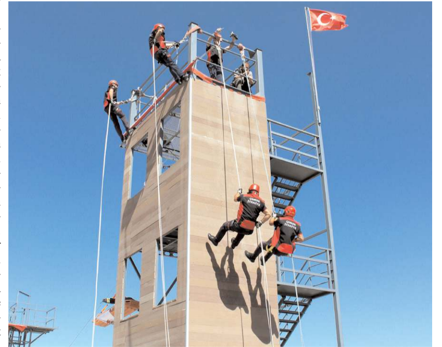
İtfaiyeciler yeni eğitim sahasında gösteri yaptılar.