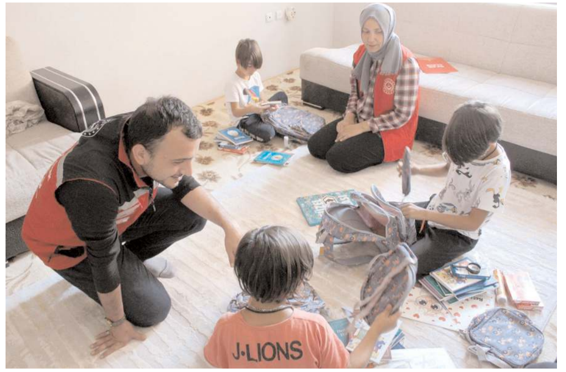
İhtiyaç sahibi ailelerin ilkököl ve ortaokula devam eden çocukları için "Eğitim ve Gelişim Destek Paketleri" dağıtılıyor.

2022 yılının ilk 8 ayında ise İstanbul'da 17, Kocaeli'de 15, Bursa'da 7, İzmir'de 4, Adana, Konya, Manisa, Bilecik, Kahramanmaraş ve Antalya'da üçer, Karaman, Sakarya, Hatay ve Gaziantep'te ikişer, Mersin, Samsun, Aydın, Düzce, Hatay, Uşak, Niğde, Osmaniye, Kırkkale, Adıyaman ve Tekirdağ'da birer olmak üzere toplam 79 yangın çıktı.(AA)