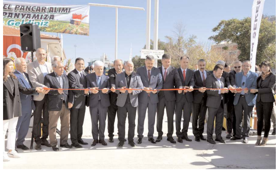
Konuşmaların ardından açılış kurdelesini kesildi.

Dünya'da gıda ve enerji krizi yaşanırken, Türkiye'de böyle bir sorun olmadığını belirten Aşgın; "Dünya şu anda bir kriz yaşarken, ülkemizde hamd