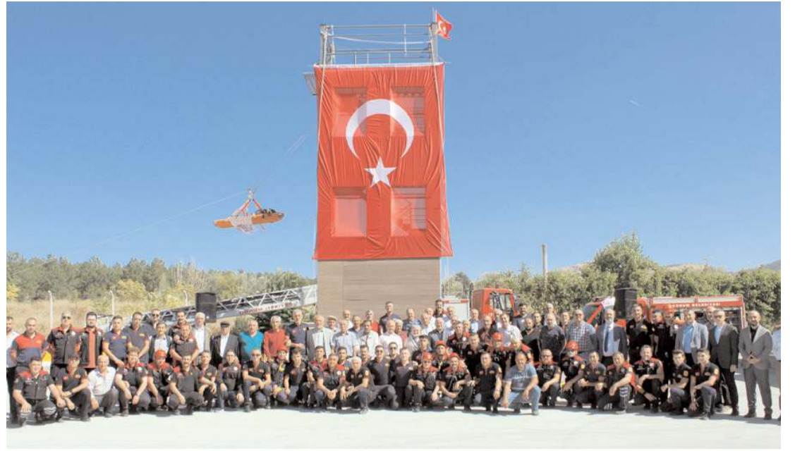
Çorum Belediyesi İtfaiye Müdürlüğü eğitim sahası açıldı.

Program şiiir ve okul korusu dinletileri ile devam etti.