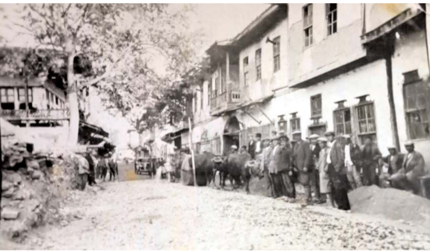
İbrikat Hazretlerinin mezarının bulunarak türbe yapılması isteniyor.