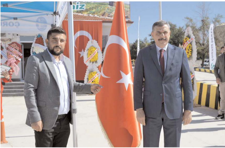
Şeker pancarını ilk getiren çiftçilere hediye verildi.