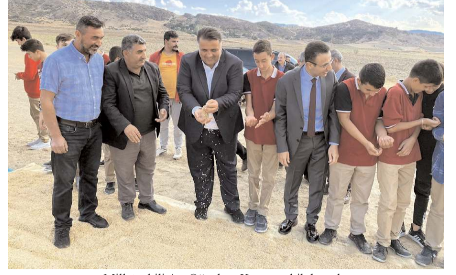
Milletvekili Av. Oğuzhan Kaya, çeltik hasadı, harmanı ve kurutma işlemlerini inceledi.

dik. İlçemizde Tarım Lisesini kazandırarak tarımsal alanda eğitim ve araştırma faaliyetleri ile bölgemizin ve ülkemizin kalkınmasına model olacak, özgüveni yüksek bireyler yetiştirip tarımı daha modern, toprağımızı daha verimli kullanan bilinçli çiftçilik modelini vatandaşlarımıza kazandırmayı hedefliyoruz" dedi. (İHA)