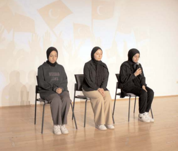
Kuşmaların ardından şehitlerimiz için toplanan hatimlerin duası yapıldı.