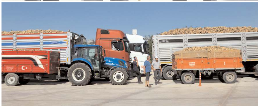
Şeker Fabrikası dün itibarıyla itibarıyla çiftçilerin hesaplarına 400 milyon TL yatırdı.