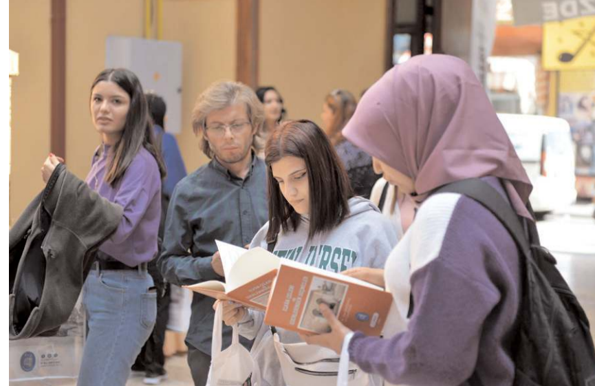
Gezinin sonunda kültür yayınlarının yer aldığı çantalar hediye edildi.