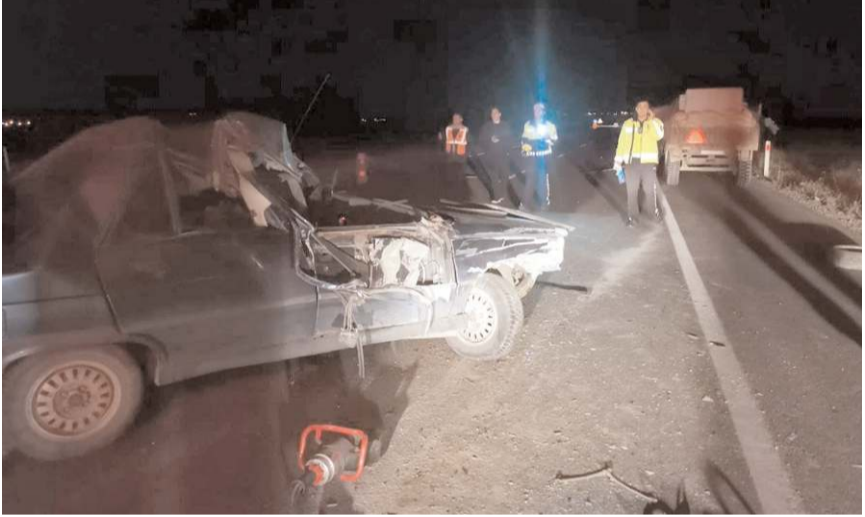
Polis ekipleri kaza yerinde inceleme yaptı.

Alaca'da traktöre çarpan otomobildeki 1 kişi öldü, 4 kişi yaralandı.