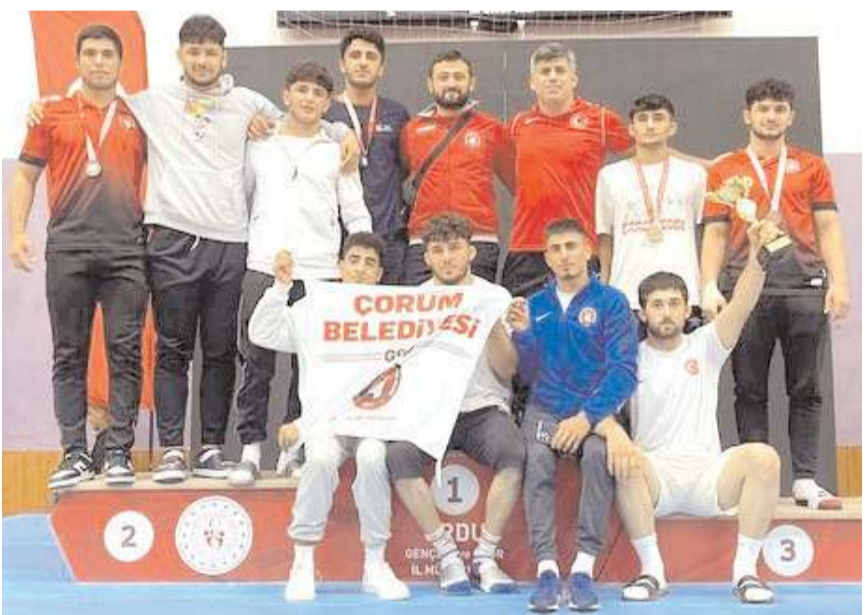
Ordu'da yapılan turnuvada dokuz madalya ve bir kupa kazanan Çorum Belediyesi Gençlikspor takımı toplu halde