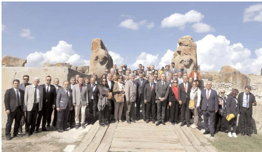
Toplantının sonunda toplu hatıra fotoğrafı çekildi.