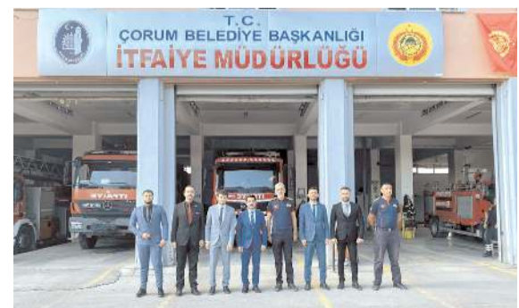
Ziyaretin anısına hatıra fotoğrafı çekildi.