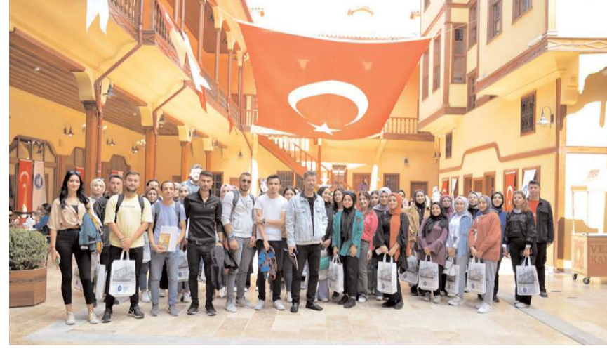
Edebiyat Bölümü öğrencileri Velipaşa Hanı'nı yakından görme fırsatı buldular.

İlanlım Dergisi, Genç Kadeş Dergisi ve Şehir Defteri Dergisi hakkında da bilgi alan Hitit Üniversitesi Fen – Edebiyat Fakültesi öğrencilerine, gezi sonrası kültür yayınlarından oluşan çanta hediye edildi. (Haber Merkezi)