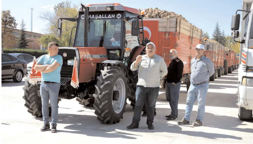
Bu sezon 750 bin ton pancar alınması hedefleniyor.