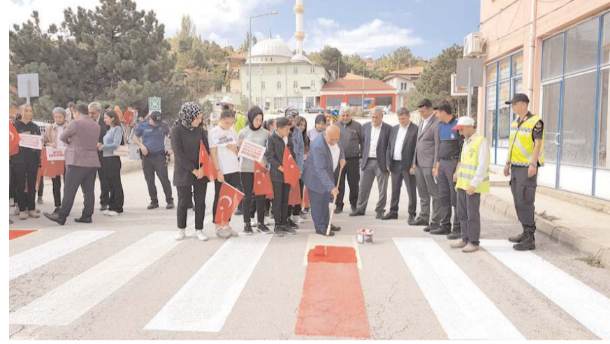
Temsili olarak bir yaya geçidi kırmızıya boyandı.

Sonrasında ise protokol üyeleri ve öğrenciler