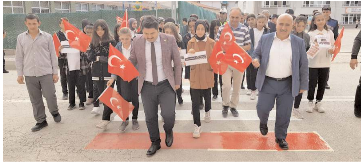
İlçe protokolü ile öğrenciler yaya geçidinden ellerinde Türk bayrakları ile geçtiler.