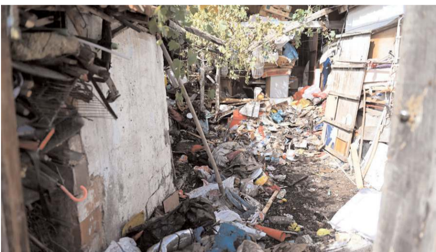
Bahçelievler Mahallesi'nde bir gece kondudan tonlarca çöp çıkartıldı.

ları vardır. Şehirleri yenilerken oluşturulan bu özelliklere dikkat edilmesi gerektiğine inanmaktayım. Bir yeri yıkmak, adın değiştirmek, konumu değiştirmek aslına bakarsanız çok ciddi planlamanın yapılması gereken çalışmalardır. Bu çalışmalar sadece inşaat, mimari gibi maddi unsurlarla değil kültürel, sosyal bilimlerinde katılması gereken bir süreçten geçmelidir. Siz bir tarihi yok edip yerine kiraathane yapacağımızı söylüyorsanız dönüştürmeye çalıştığımız topluma aslında hakaret ediyorsunuz. Çorumlu'nun gözünde canlanan anılar. Kek yiyip yuvarlanırken yaşayacağı hazzdan daha değerli olduğunu düşünmekteyim. Velhasıl her şey aklımıza gelirdi de Çorumlu'nun anılarının da çalınacağı hiç aklımıza gelmezdi. Gerçekten yaparsa bunlar yapmış bunu da başarmak bir başarı bugün için. Üzgünüm kıymetli hemşerilerim deşenek oynadığımız günlere özlemle" şeklinde belirtti. (Haber Merkezi)