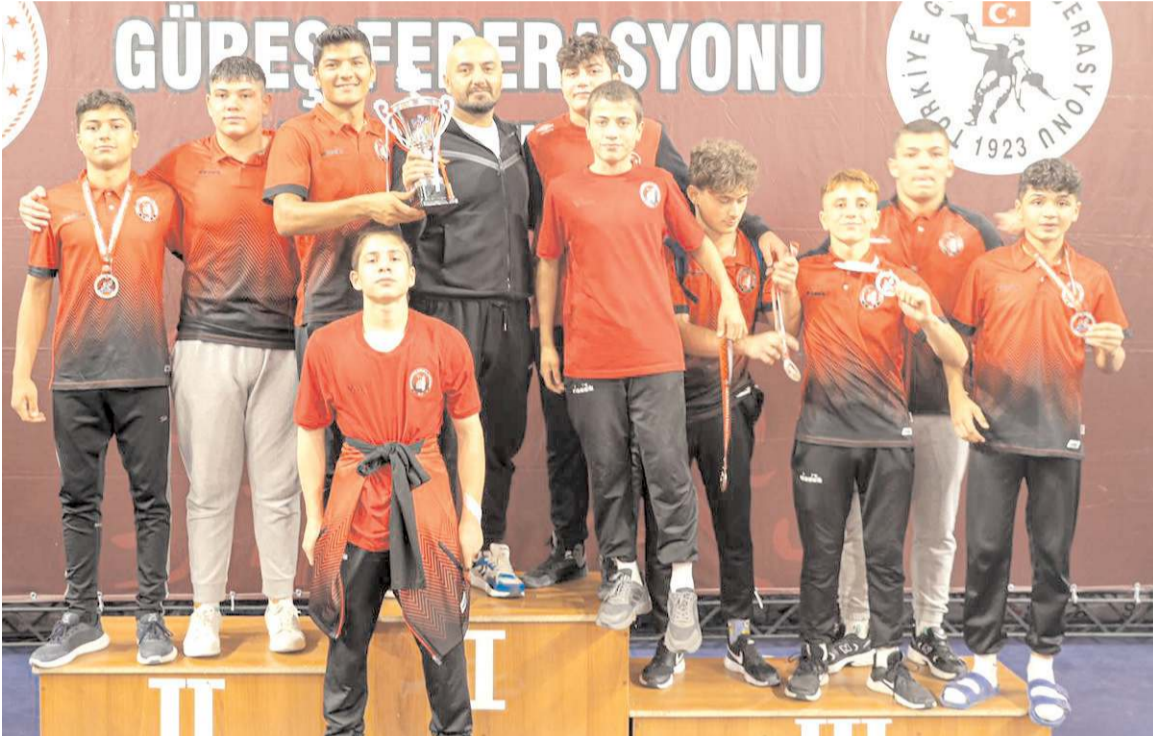
Çorum Belediyesi Gençlikspor yıldız grekoromen takımı takım birinciliği ödülü ile birlikte kürsüde toplu halde