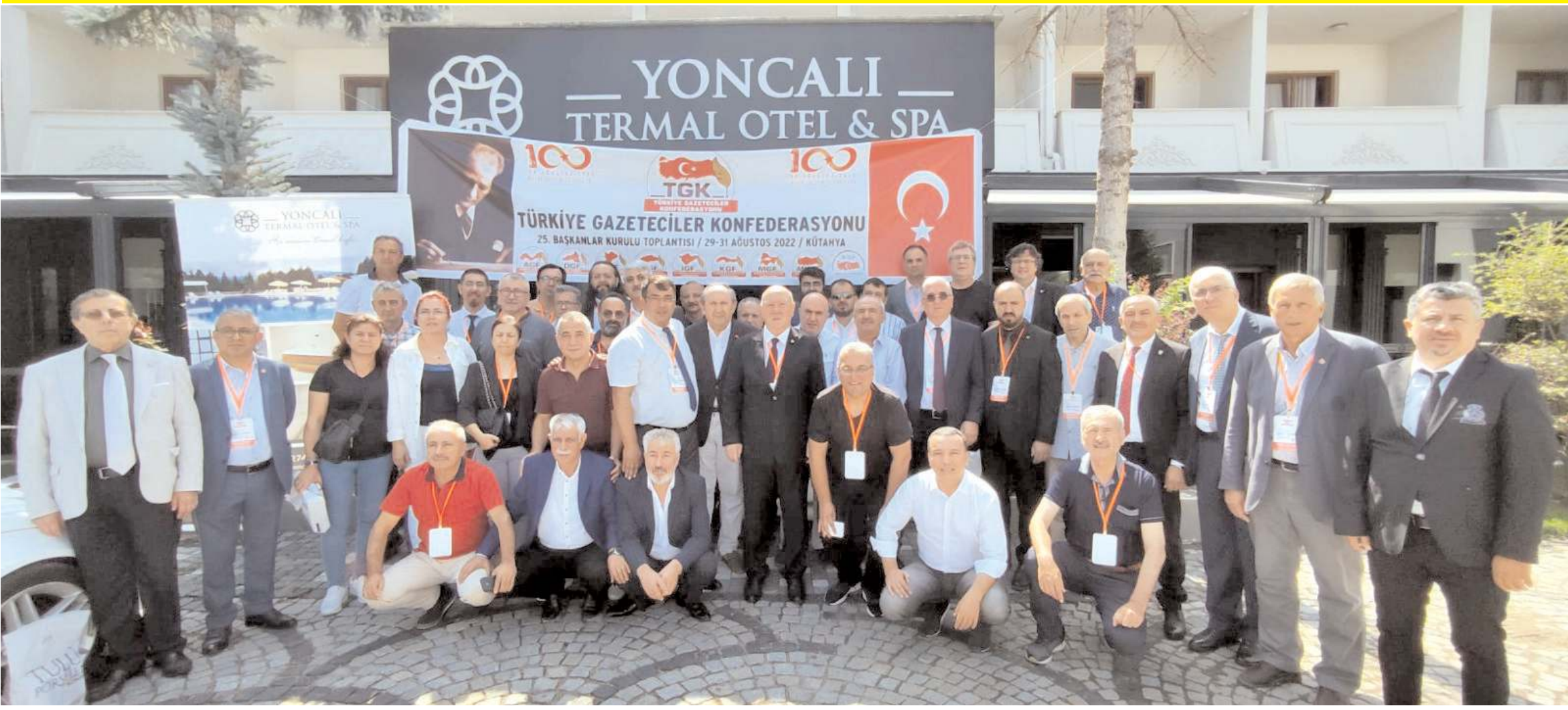
Türkiye Gazeteciler Konfederasyonu'nun 25. Başkanlar Kurulu Toplantısı, 30 Ağustos Zaferinin 100. yıldönümünü nedeniyle, Başkomutanlık Meydan Muharebesi'nin gerçekleştiği Kütahya'da yapıldı.