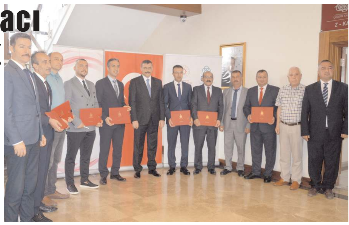
Orta Karadeniz Kalkınma Ajansı 2022 yılında Çorum'da 6 projeye destek verecek.