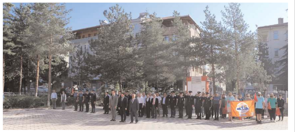
Törene protokol üyeleri ile vatandaşlar katıldı.

ceye giren öğrencilerimizi kutluyor, bu başarıda emeği geçen öğrenci ailelerimize ve öğretmenlerimize teşekkürlerimi sunuyorum" dedi. (Haber Merkezi)