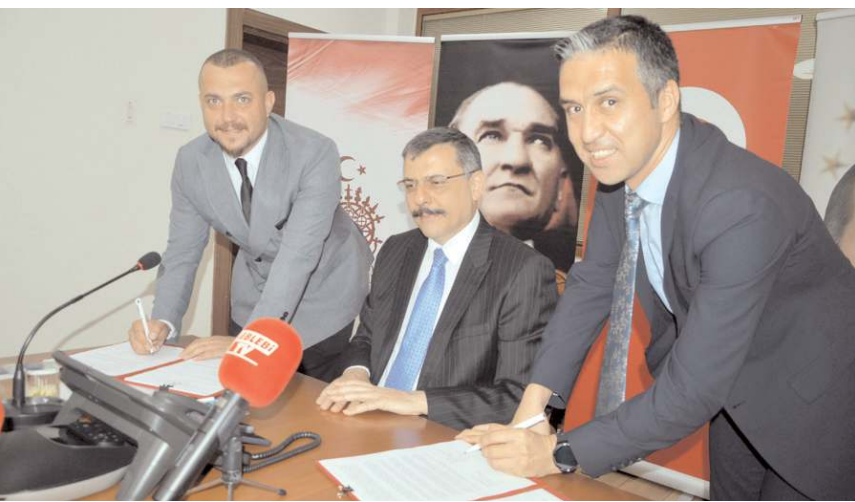
Projelerin imzaları dün atıldı.