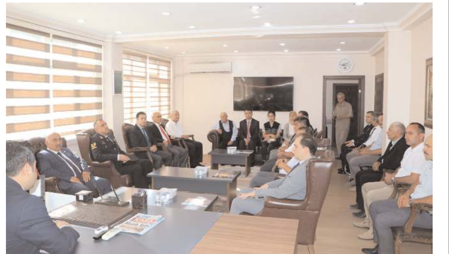
İlçe protokolü tebrikleri kabul etti.