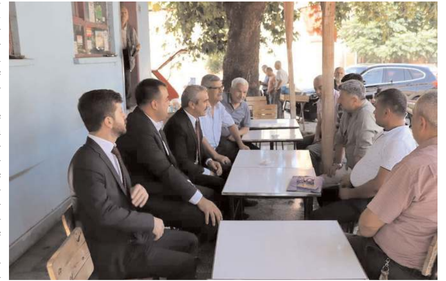
Köylüler sorunları dile getirdi.