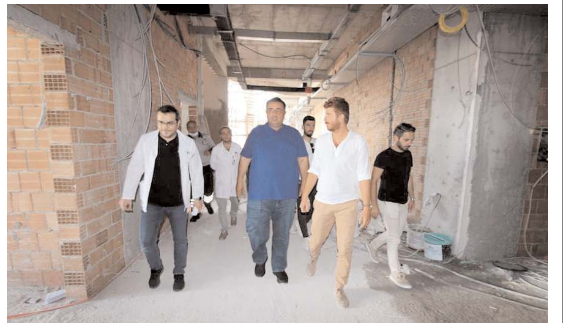
Milletvekili Av. Oğuzhan Kaya, çalışmaların son durumu hakkında bilgi aldı.