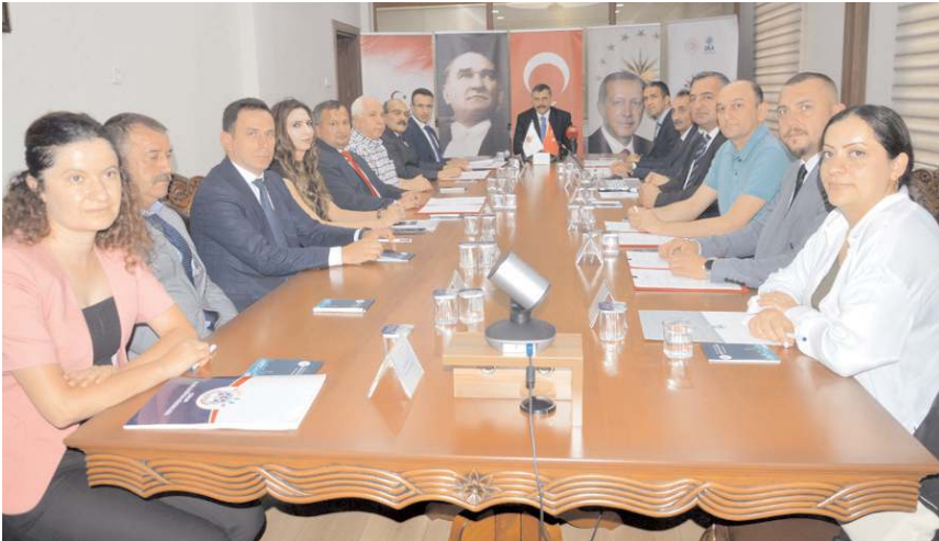
Vallilik toplantı salonunda imza töreni yapıldı.