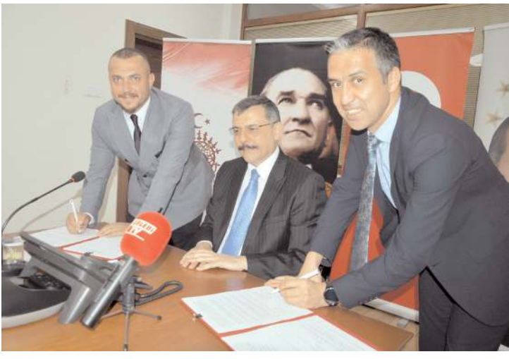
Projelerin imzaları dün atıldı.

Orta Karadeniz Kalkınma Ajansının 2022 yılında yürüttüğü destek programları kapsamında Çorum'dan toplam 6 proje destek almaya hak kazandı. Desteklenen projeler için Çorum Valiliği'nde imza töreni düzenlendi. Toplam bedeli 8,9 milyon TL olan projelere OKA 5,7 milyon TL destek sağlayacak.