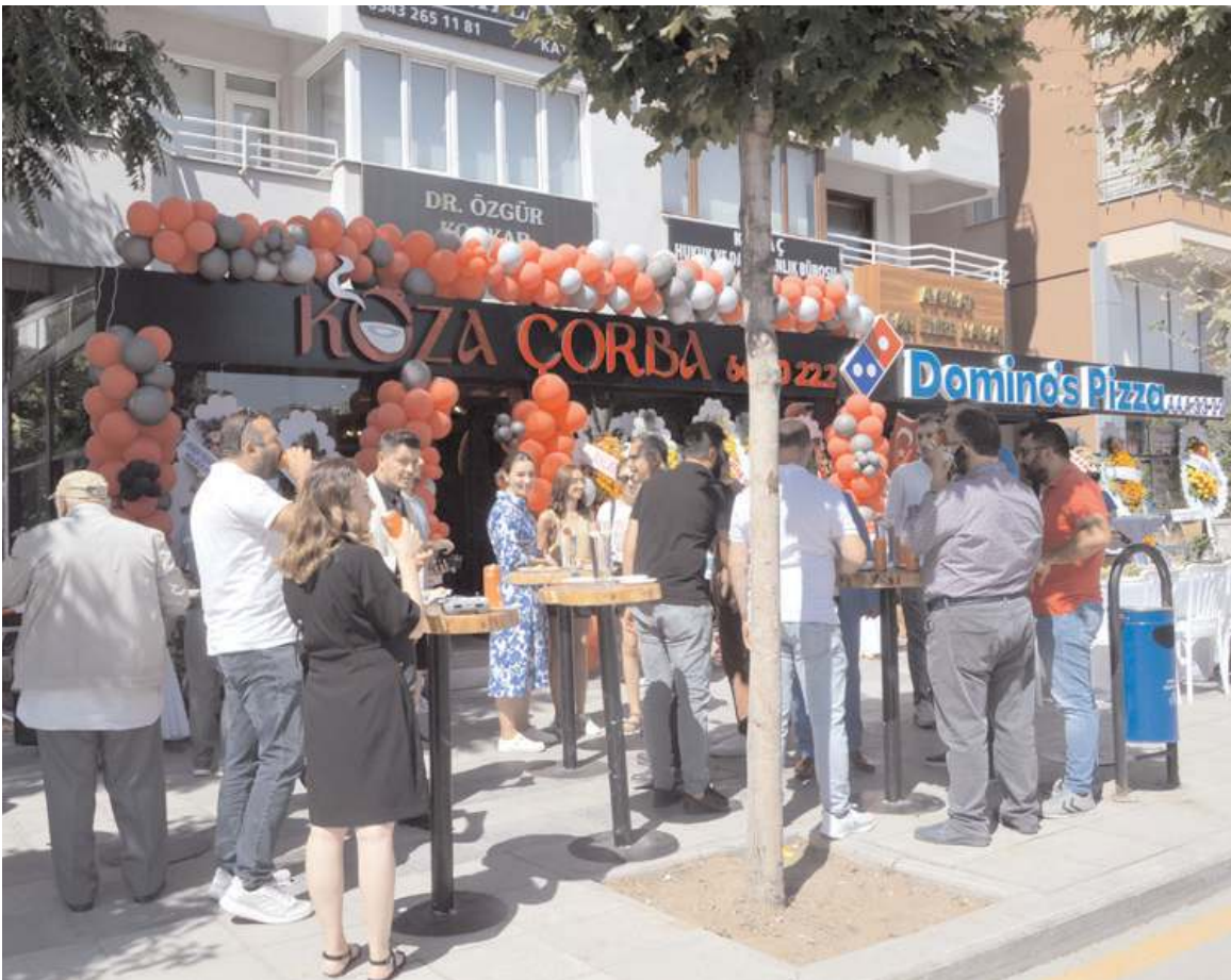
İşletme Gazi Caddesi numara 67'de (Dominos Pizza yanı) açıldı.