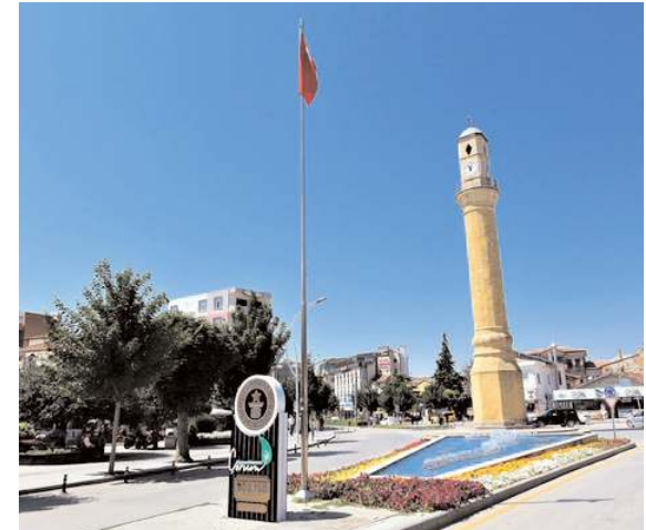
TÜİK 'Herkes kendi memleketinde yaşasa Türkiye'nin en kalabalık şehri hangisi olurdu?' araştırmasının sonuçlarını yayınladı.

Çorum Belediyesi Park ve Bahçeler Müdürlüğüne bağlı ekipler şehir genelindeki parklarda yıpranan oyun grupları, kauçuk zemin ve koşu yollarını yeniliyor. * HABERİ 7'DE