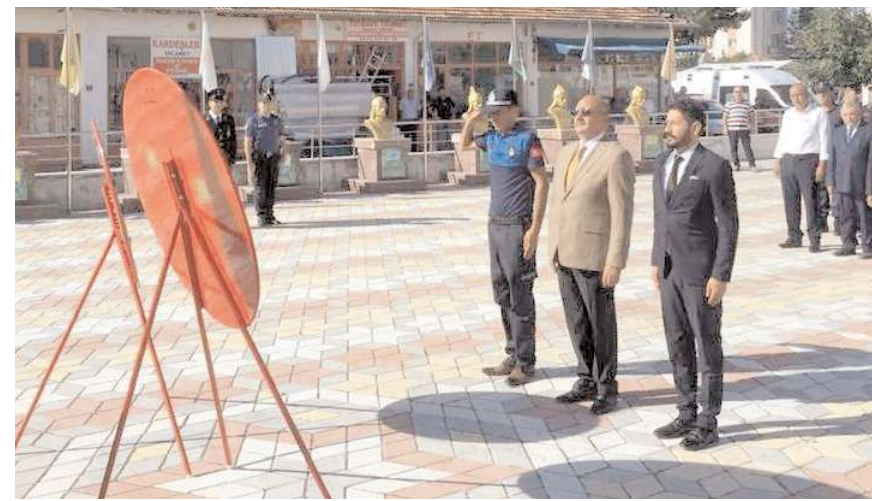
Kutlama programı Ortaköy 15 Temmuz Şehitleri alanında yapıldı.