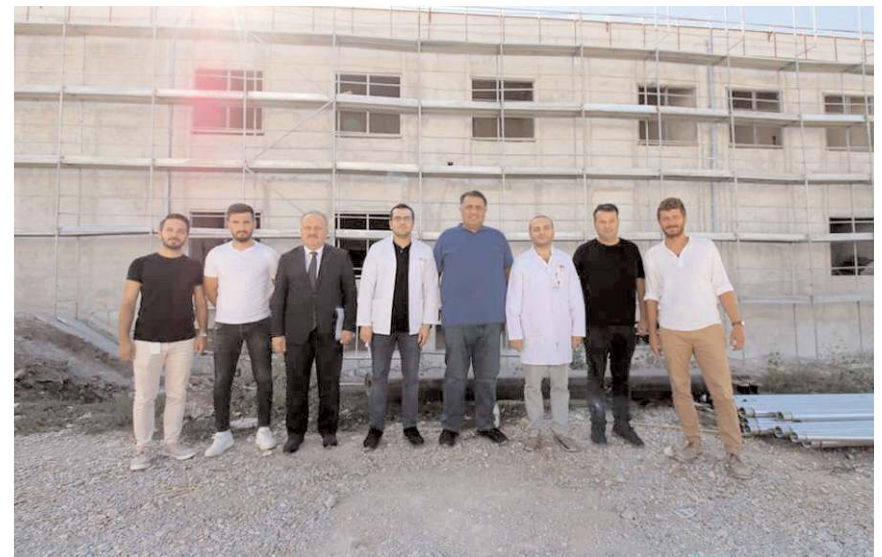
Onkoloji Tanı ve Tedavi Merkezi'nin yıl sonuna kadar bitirilmesi hedefleniyor.