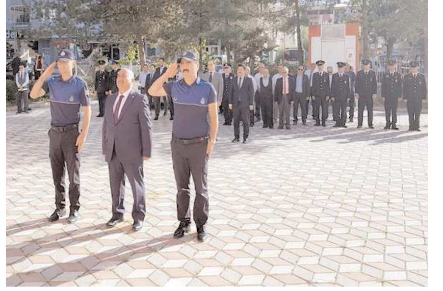
Protokol üyeleri Atatürk Anıtı'na çelenk sundular.

Günün anlam ve önemini belirten konuşmaların yapılması ve şiirlerin okunmasının ardından tören sona erdi. (Haber Merkezi)