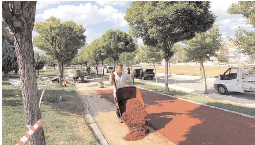
Parklarda bulunan koşu yolları da yeniliyor.

Çorum Belediyesi Park ve Bahçeler Müdürlüğüne bağlı ekipler şehir genelindeki parklarda yıpranan oyun grupları, kauçuk zemin ve koşu yollarını yeniliyor. * HABERİ 7'DE