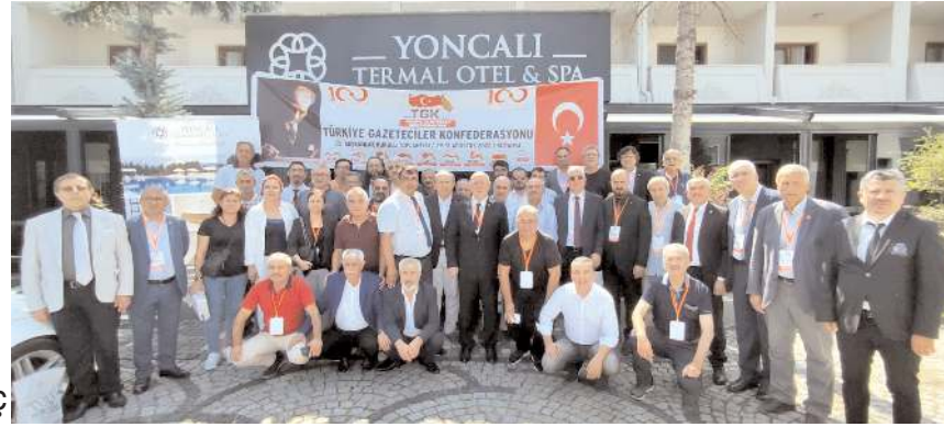
Türkiye Gazeteciler Konfederasyonu'nun 25. Başkanlar Kurulu Toplantısı, 30 Ağustos Zaferinin 100. yıldönümünü nedeniyle, Başkomutanlık Meydan Muharebesi'nin gerçekleştiği Kütahya'da yapıldı.

Kütahya Gazeteciler Cemiyeti'nin ev sahipliğinde gerçekleşen Türkiye Gazeteciler Konfederasyonu (TGK) 25. Başkanlar Kurulu'nun sonuç bildirgesinde, ekonomik, sosyal, siyasi ve teknolojik gelişmelerden yakından etkilenen medya sektörünün çok zor bir dönemden geçtiği ve yaşam savaşı verdiği vurgulandı. * HABERİ 4'DE