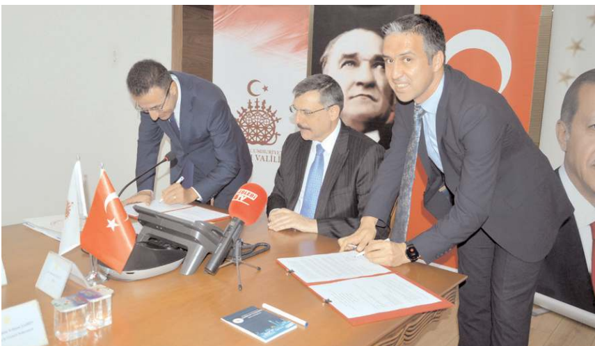
Toplam bedeli 8,9 milyon TL olan projelere OKA 5,7 milyon TL destek sağlayacak.

yon TL kaynak aktarıldığını belirttik; "Amasya, Çorum, Samsun ve Tokat illerinden (TR83 Bölgesi) sorumlu olan Orta Karadeniz Kalkınma Ajansı Bölge illerinin sosyo-ekonomik alanda gelişmesi için faaliyete başladığı 2009 yılından beri çeşitli faaliyetler yürütmektedir. Ajansın hazırladığı Bölge Planları TR83 Bölgesinin mevcut durumunu ortaya koymakta, potansiyel gelişim alanlarını ve gelişme odaklarını işaret etmektedir. Ajans yürüttüğü faaliyetleri ve destek programlarını söz konusu Bölge planına dayandırmakta ve stratejisini bu çerçevede geliştirmektedir. Ajans kurulduğu günden beri her yıl uyguladığı Mali Destek Programları aracılığıyla Bölge illerinde 1.000'den fazla projeye destek vermiştir. Bu projelere 260 milyon TL destek sağlanmış ve toplamda 666 milyon TL yatırım yapılmıştır. Çorum ilinin ise 229 projesine 50 milyon TL kaynak aktarılmış ve toplamda 100 milyon TL yatırım yapılmıştır. Turizm ve sanayi alanlarının altyapılarının desteklenmesi başta olmak üzere çeşitli alanlarda Mali Destek Programları uygulayan Ajans, Fizibilite Desteği ve Teknik Destek kalemleri ile de eğitim ve danışmanlık faaliyetlerini desteklemektedir. Orta Karadeniz Kalkınma Ajansının 2022 yılında yürütüldüğü destek programları kapsamında Çorum'dan toplam 6 proje destek almaya hak kazanmıştır. Sözleşme imza töreni için topladığımız bu projelere Ajans tarafından sağlanacak destek tutarı 5,7 milyon TL ve projelerin toplam bütçesi 8,9 milyon TL'dir." dedi