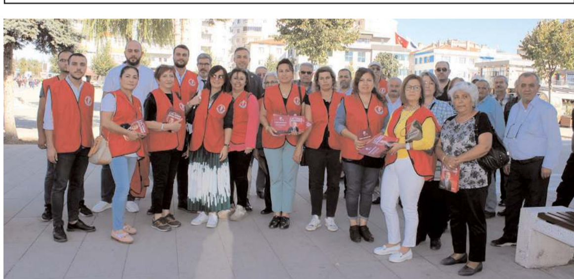
CHP'liler günün anısına hatıra fotoğrafı çekindiler.