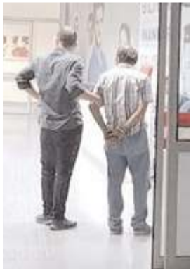
Şüphelilerden S.B yakalandı.

İskilip'te yardım kömürlerini çalmaya çalışan 3 kişiden 1'i polis tarafından yakalandı.