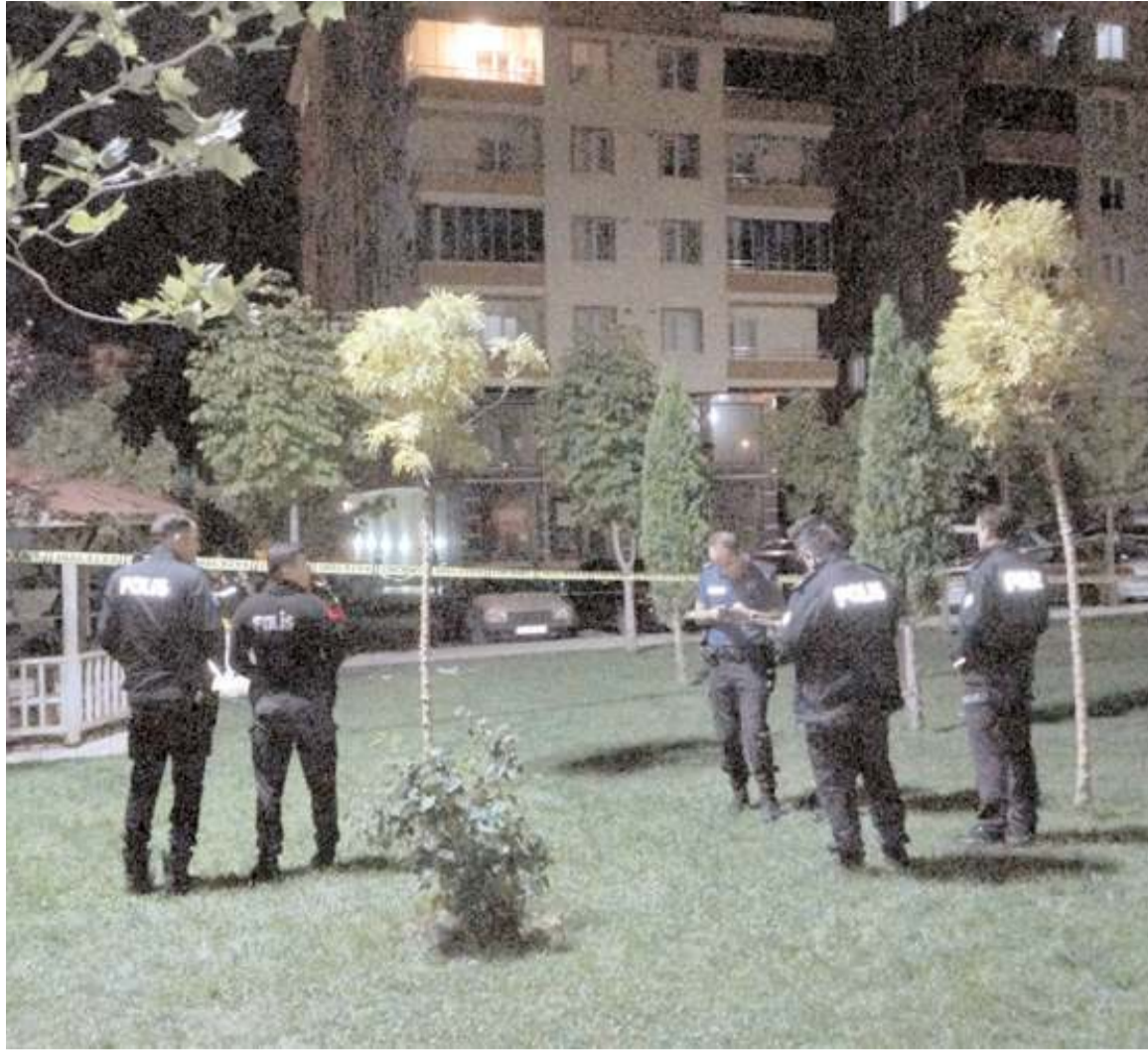
Olay, Ulukavak Mahallesi Osmancık Caddesi'nde bir parkta meydana geldi.