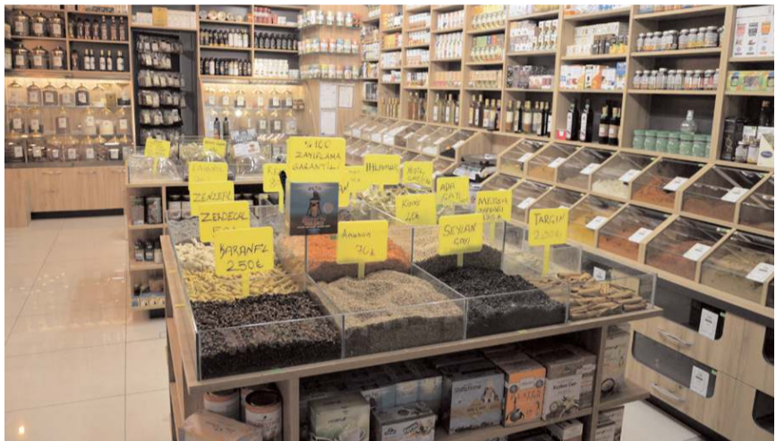
İşletmede doğal ürünler, şifalı bitkiler, yağlar, bitkisel şifalı çaylar bulunuyor.