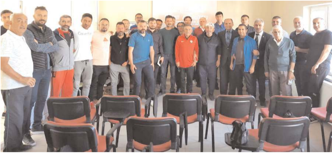
TÜFAD UEFA Süreli Gelişim Seminerine katılan teknik adamlar toplu halde görülüyor

İkinci sette ise ilk sayılar yine karşılıklı ol-