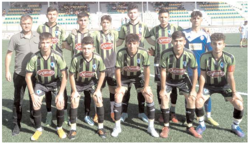
Mimar Sinan Gençlikspor İskilipspor deplasmanında ikinci yarıda galip geldi