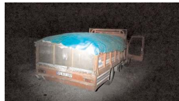
Zanlıların kamyonete 5 ton kömür yükledikleri tespit edildi.