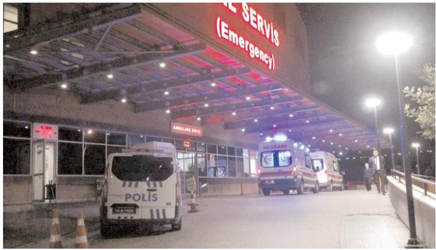
Yaralılar hastanede tedavi altına alındı.