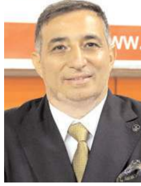
Av. Turan Kalıpcı