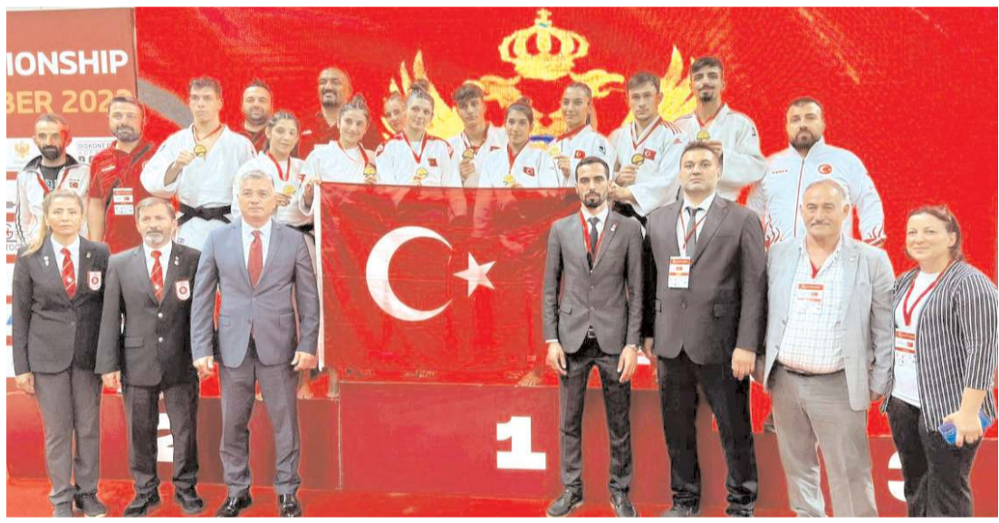
Balkan Şampiyonasında ferdi müsabakalar sonunda milli takım sporcuları idarecileri ve görevli hakemler toplu halde Türk bayrağı ile böyle poz verdiler