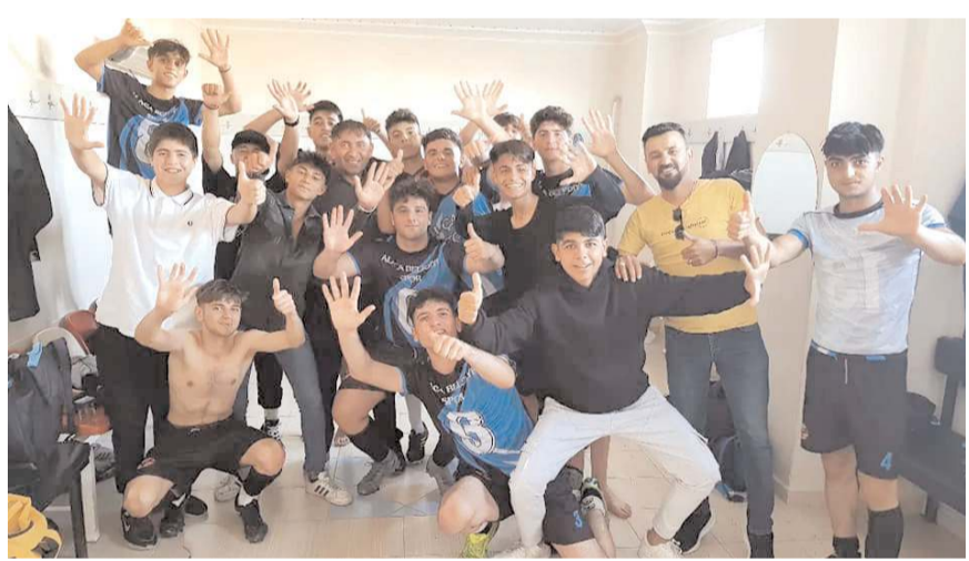
Alaca Belediyespor Bayat Belediyespor'u farklı yendiği maçın ardından galibiyet pozu

M.Akif (2), Emin, Doğan, A.Yiğit, Erenca.