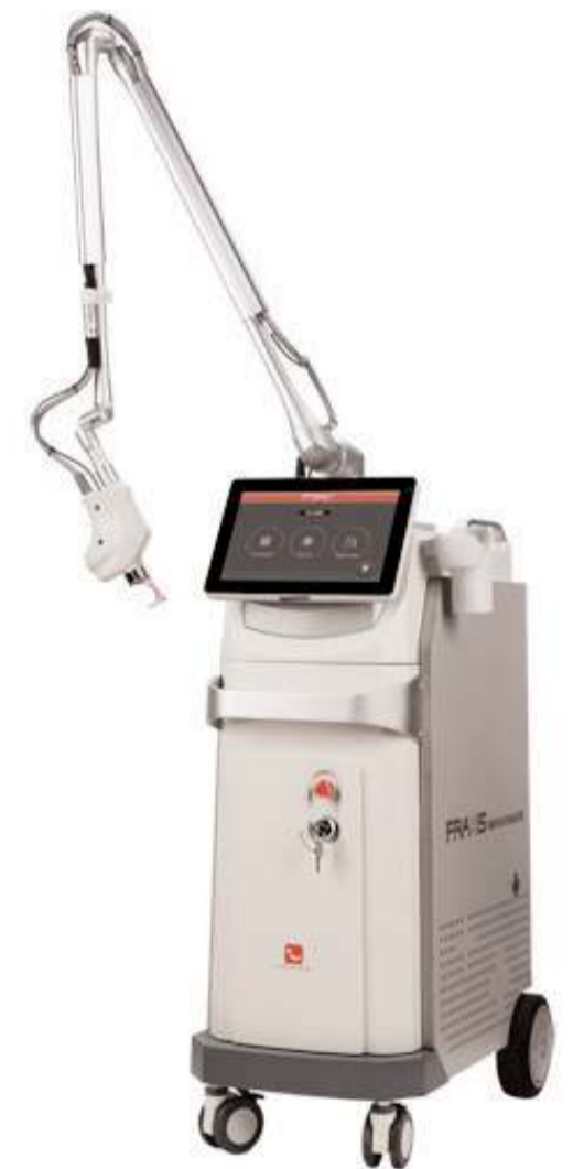
Fraksiyonel Karbondioksit Lazer Cihazı