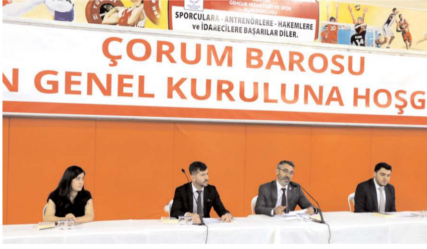
Genel Kurulda ilk olarak divan heyeti seçildi.