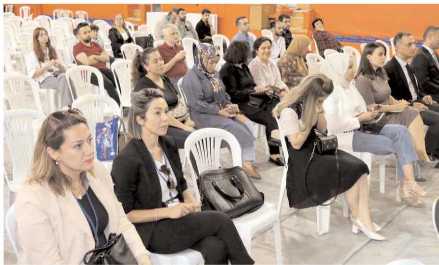
Genel Kurul Atatürk Spor Salonu'nda yapıldı.