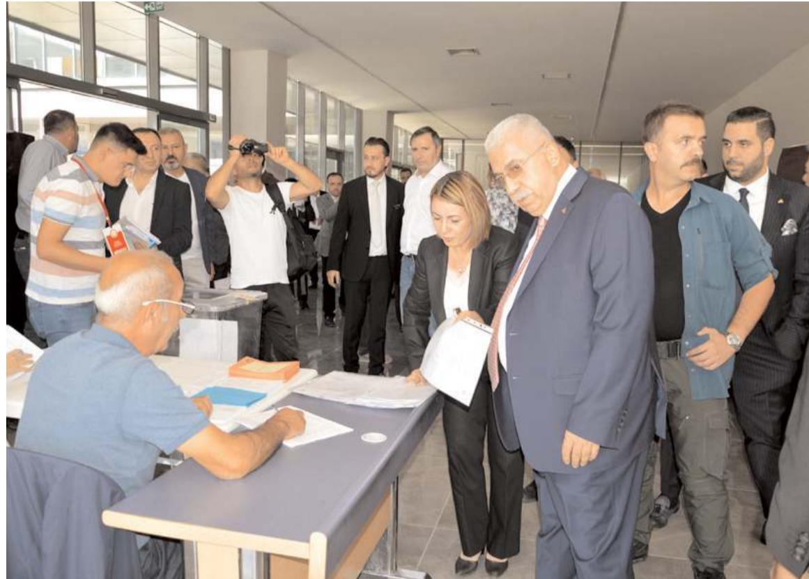
Seçimlerde 21 meslek gurubunda 57 asil, 57 yedek üye ve meslek komitelerinin seçimleri yapıldı.