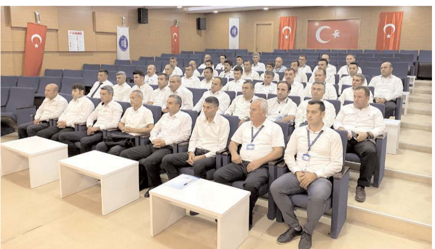
Belediye'nin, toplu ulaşım şoförlerine yönelik eğitimleri devam ediyor.