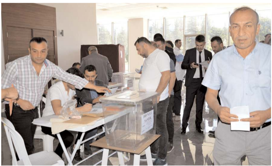
Seçimler TSO kompleksinde yapıldı.