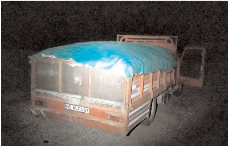
Zanlıların kamyonete 5 ton kömür yükledikleri tespit edildi.

Olay, Sanayi Sitesi yakınlarında bulunan kaymakamlığa ait depoda meydana geldi. Edinilen bilgilere göre, kömürlerin bulunduğu alandan gelen seslerden şüphelenen bir vatandaş polise haber verdi. İhbar üzerine belirtilen bölgeye giden polisler depo olarak kullanılan alan içerisinde bir kamyonet şahısların olduğunu gördü. Polisler dur ihartına uymayan 3 kişi kaçmaya başla-