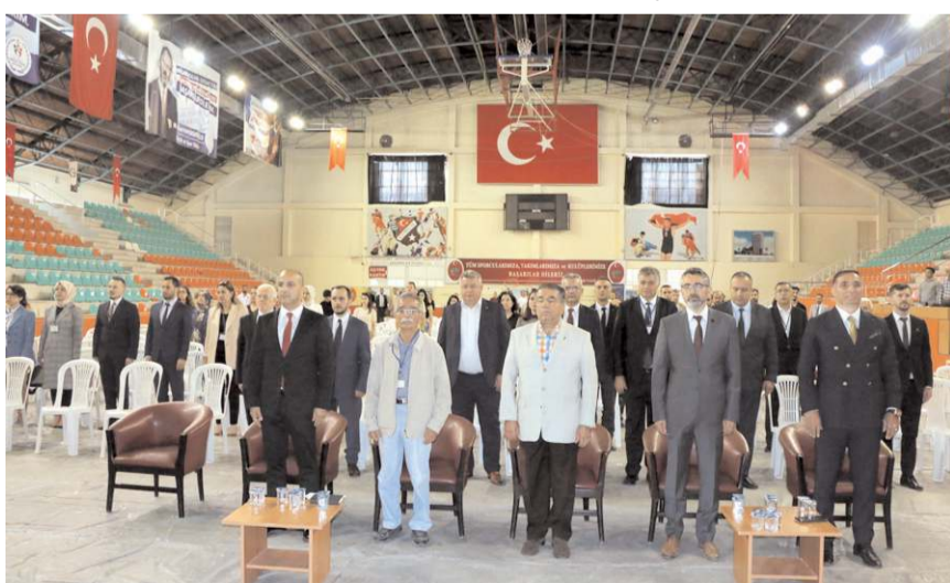
Saygı duruşunda bulunulması ve İstiklal Marşı'nın okunmasının ardından gündem maddelerinin görüşülmesine geçildi.