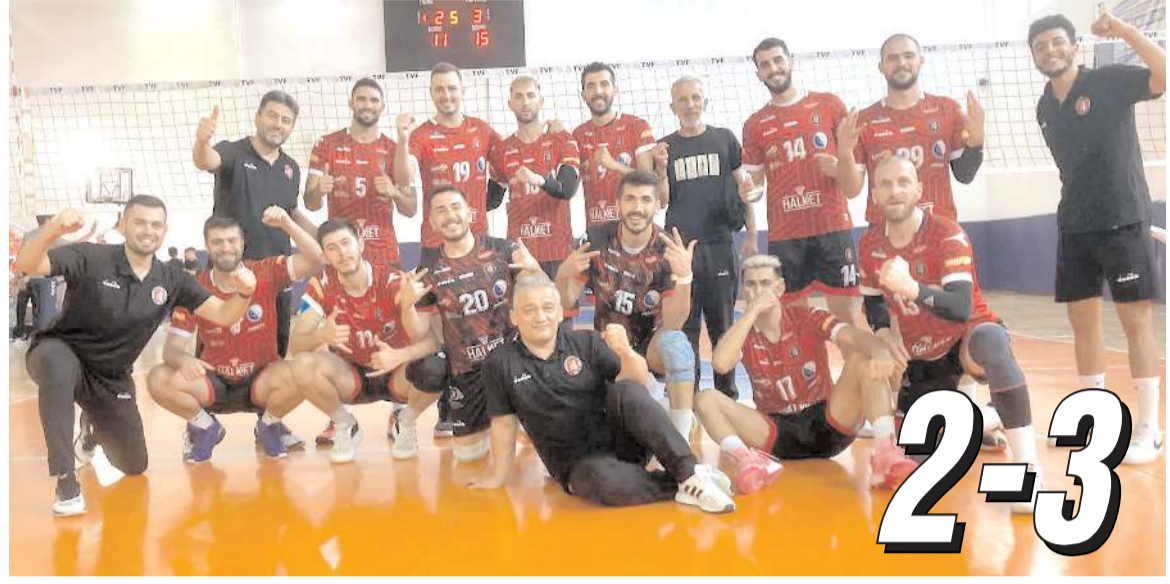
Çorum Belediyesi Gençlikspor sezonun ilk maçında Niksar'da geriden gelerek 3-2 kazanmayı başardı

13-7 maçı aldık derken Niksar takımı hücumda etkili oldu temsilcimiz savunmada yaptığı hatalar ise skor 13-10 oldu. Son bölümde rakibinin maça ortak olmasına izin vermeyen Çorum Efeleri seti 15-11 maçta 3-2 kazanarak sezona galibiyet ile başladı,