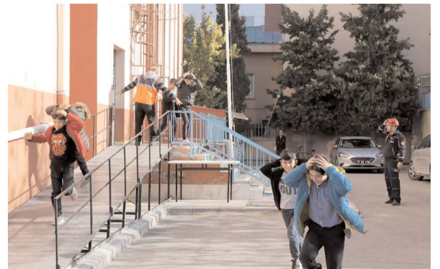
Tatbikata öğrenciler de katıldı.