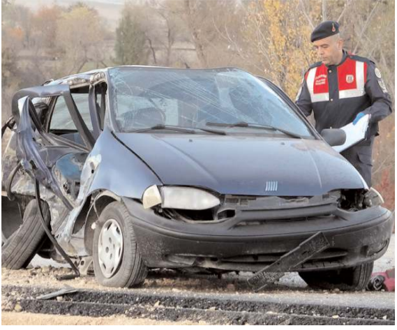
Kaza Çorum-Mecitözü kara yolu Elvan Çelebi mevkiinde meydana geldi.