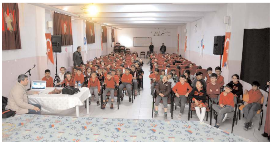
Öğrenciler anlatılanları dikkatle dinlediler.