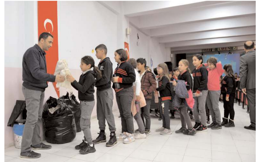
Eğitimler sonunda öğrencilere poşet kullanımını azaltmak için bez çanta ve daha yeşil bir çevre için tohum kalem hediye edildi.