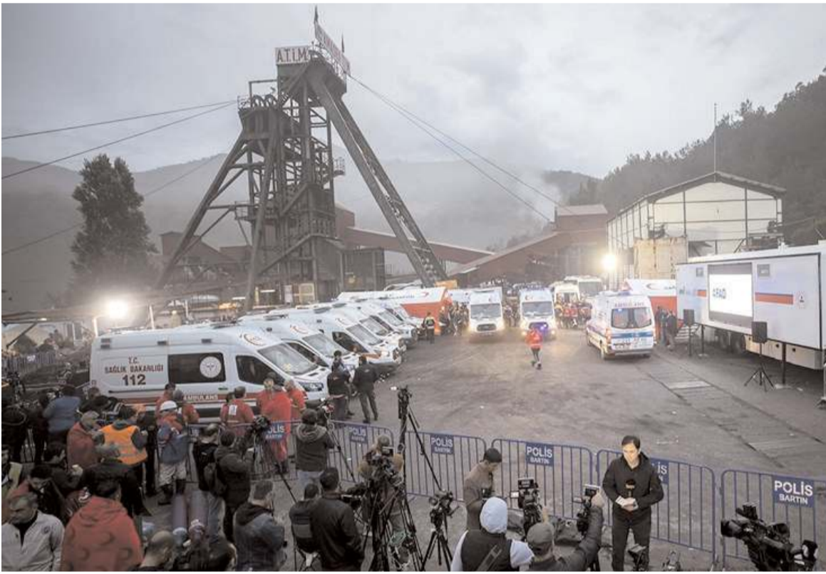
Bartın'ın Amasra ilçesinde meydana gelen maden kazasında 41 madenci hayatını kaybetmişti.

Ayrıca iş güvenliği eğitimleri ve tatbikatlar konusunda görülen eksikliklerin, kaza sırası ve sonrasında meydana gelen hataların kaynağını oluşturduğu da raporda vurgulanmış.