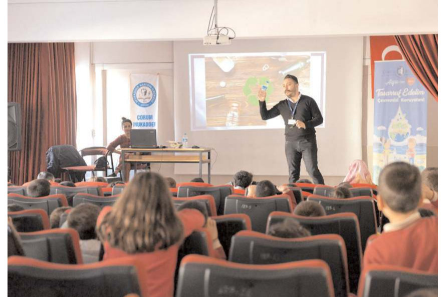
Seminerde öğrencilere çevre bilinci, enerji tasarrufu ve atıkların geri dönüşümü hakkında bilgiler verildi.

Eğitimler sonunda öğrencilere poşet kullanımını azaltmak için bez çanta ve daha yeşil bir çevre için tohum kalem hediye edildi. (Haber Merkezi)