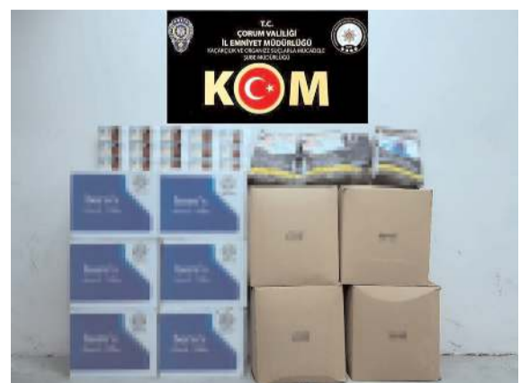
Yapılan aramada 60 bin sahte bandrollü makaron ile 42 kilogram kıyılmış kaçak tütün ele geçirildi.