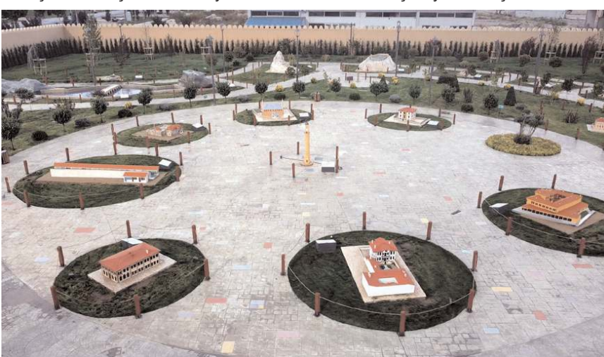
Çorumina'da Çorum'da bulunan tarihi eserlerin maketleri bulunuyor.