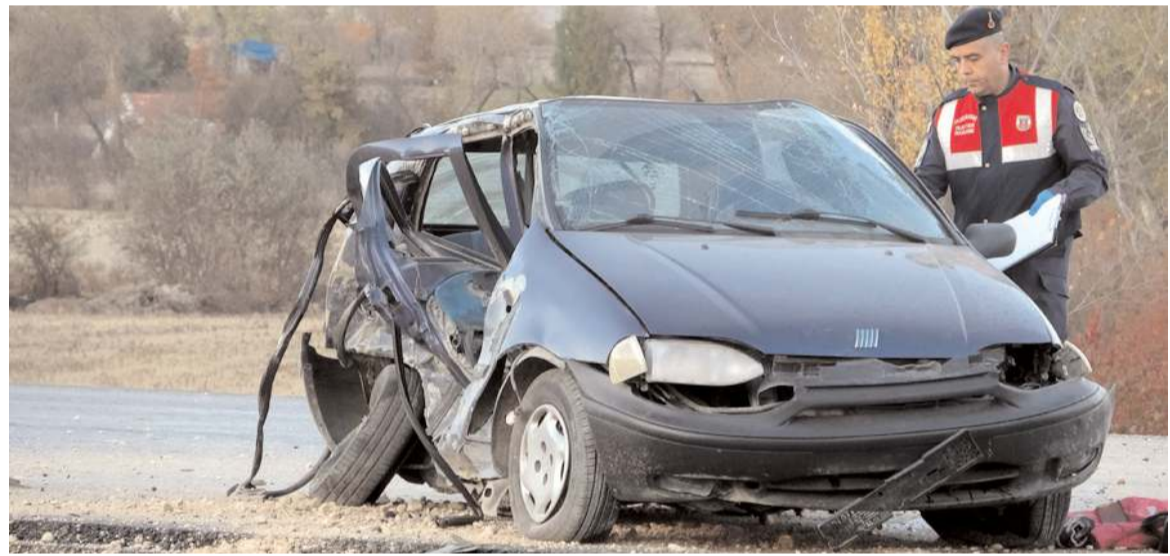
Kaza Çorum-Mecitözü kara yolu Elvan Çelebi mevkiinde meydana geldi.

Yaralılarından 3 aylık hamile Serap Çimen ve 6 yaşındaki kızı Ömür Su Çimen ile akrabası Niyazi Bilgen, hastanede müdahalelere rağmen kurtarılamadı.(AA)