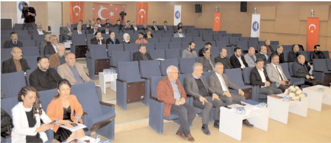
Çorum Belediyesi'nin 2023 yılı analitik bütçesi Meclis'in ikinci toplantısında oylanarak kabul edildi.