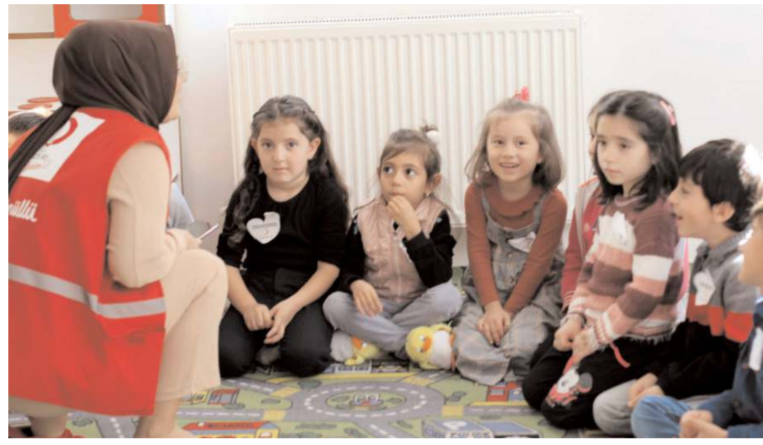
Kızılay Kadın Teşkilatı, ana sınıfı öğrencilerine Kızılay'ı tanıttı.