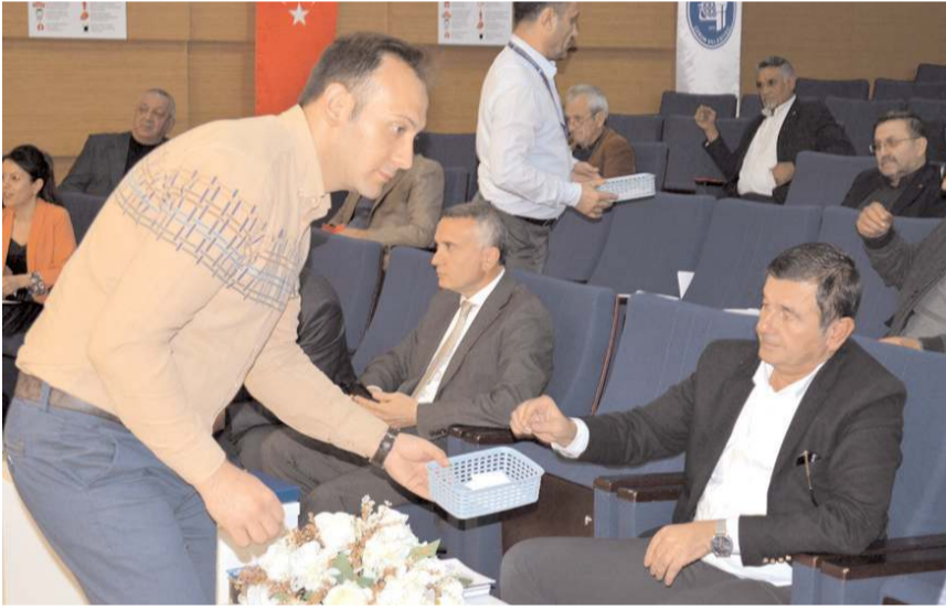
Bütçe kalemleri tek tek pusula ile oylandı.