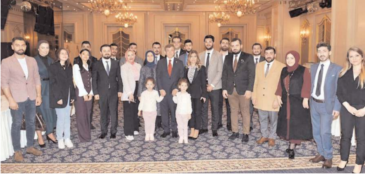
Gelecek Partisi, "Gelecekte Gençlik Modeli"ni tanıttı.

"İstihdam ve kariyer planlaması ve onurlu bir hayat standardı. Barınma, beslenme ve ulaşım giderleri kapsamında her üniversite öğrencisine asgari ücretin yarısı tutarında karışık burs verilecek. Mülakat kaldırılacak. Gençlerin aile kurmasını kolaylaştırmak adına evlilik destekleri programı başlatılacak. Gençlik Bakanlığı kurulucağı." (Haber Merkezi)