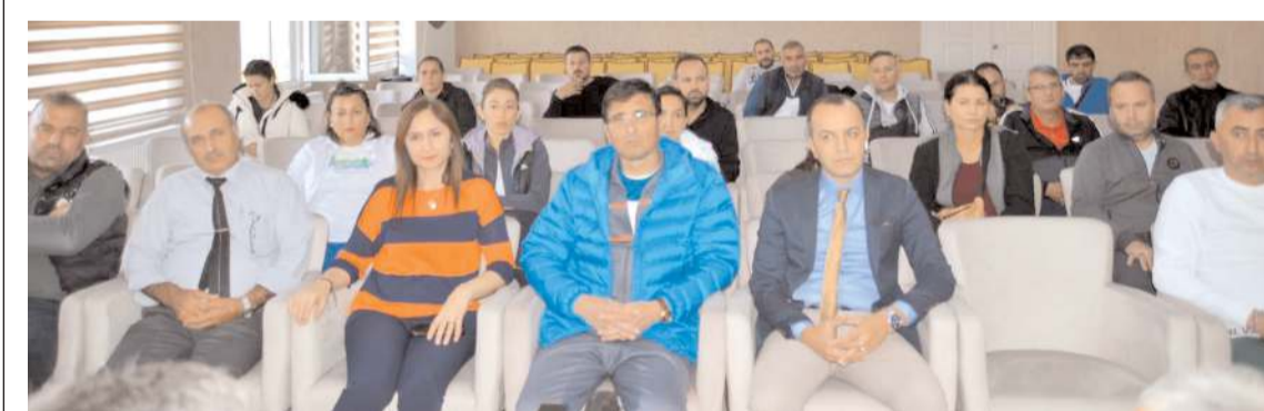
Toplantıya Tertip Kurulu üyeleri ve il temsilcileri ve antrenörler katıldılar