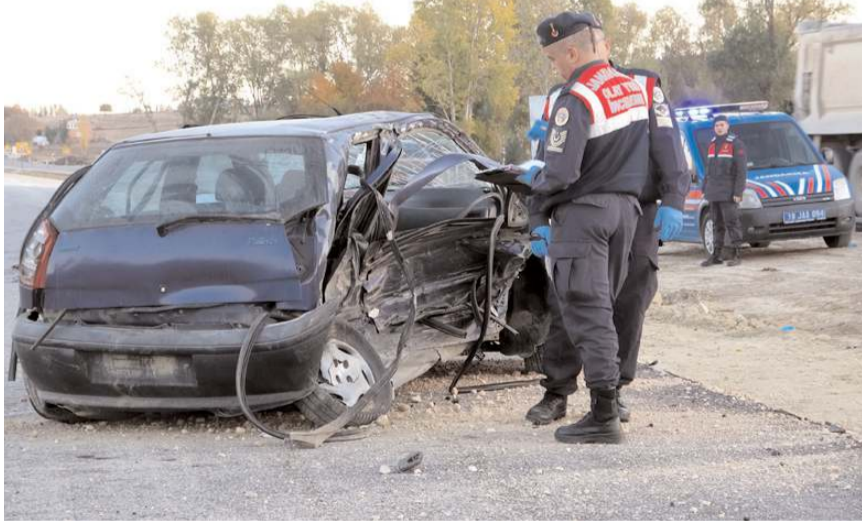
Jandarma olay yerinde inceleme yaptı.