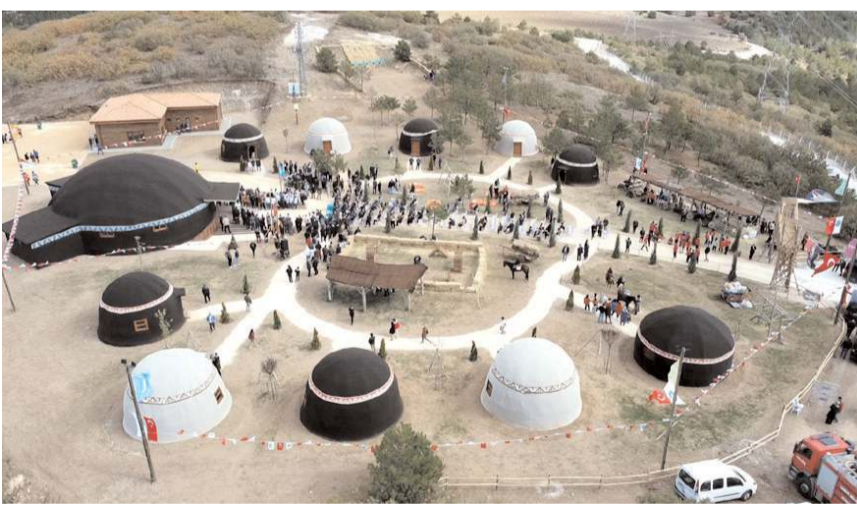
Çorumlu Obası'nın bir yılda 28 bin öğrenci konduğu oldu.