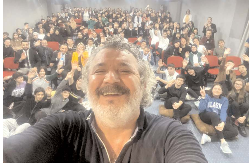
Senarist ve Oyuncu Müfitcan Saçıntı, öğrencilerle özçekim yaptı.