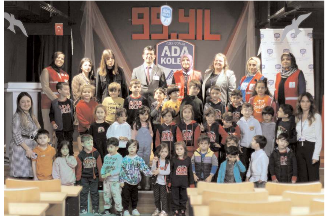
Programın sonunda toplu hatıra fotoğrafı çekildi.