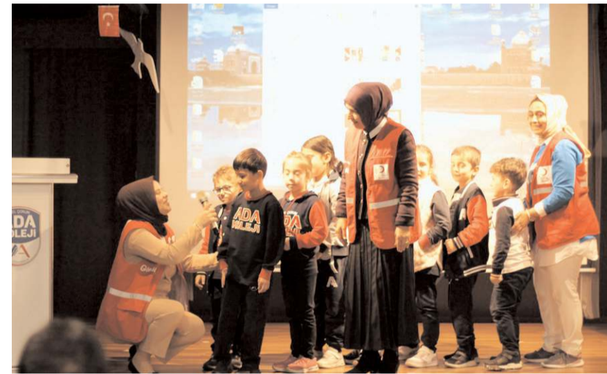
Öğrencilere Kızılay hakkında bilgiler verildi.

Oyun oynar gibi etkinliğe adapte olan minikler, ömür boyu hafızalarına yer edecek önemli bilgilerle donatılırken, okul idarecileri ve veliler Kızılay gönüllüsü hanımlara teşekkür etti.