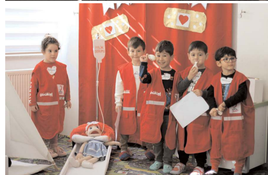
Miniklere Kızılay'ın faaliyetleri tiyatral bir ortamda anlatıldı.