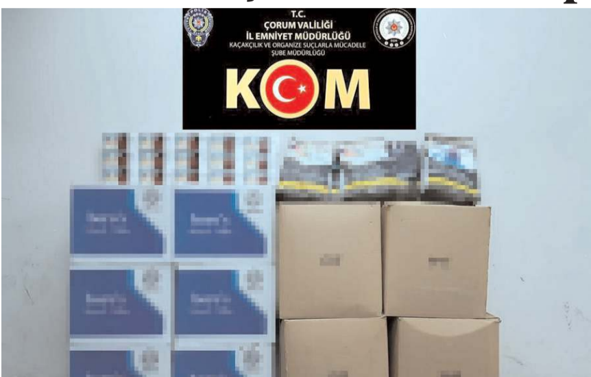
Yapılan aramada 60 bin sahte bandrollü makaron ile 42 kilogram kıyılmış kaçak tütün ele geçirildi.

Çorum'da bir araçta 60 bin sahte bandrollü makaron (filtreli sigara kağıdı) ele geçirildi, 2 şüpheli gözaltına alındı.