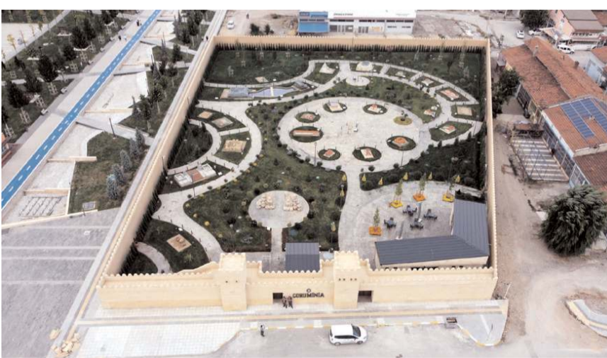
Çorumina Çorum Belediyesi tarafından Millet Bahçesi yanına inşaa edildi.