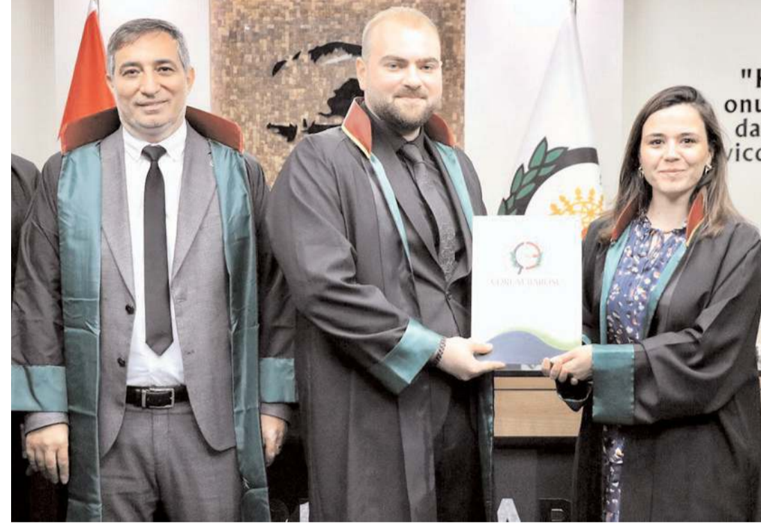
7 avukat adayı, Çorum Barosu'nda düzenlenen törenlerle cübbe giydi.

Resmi İlanlar: www.ilan.gov.tr 'de (Basın: 1722045)