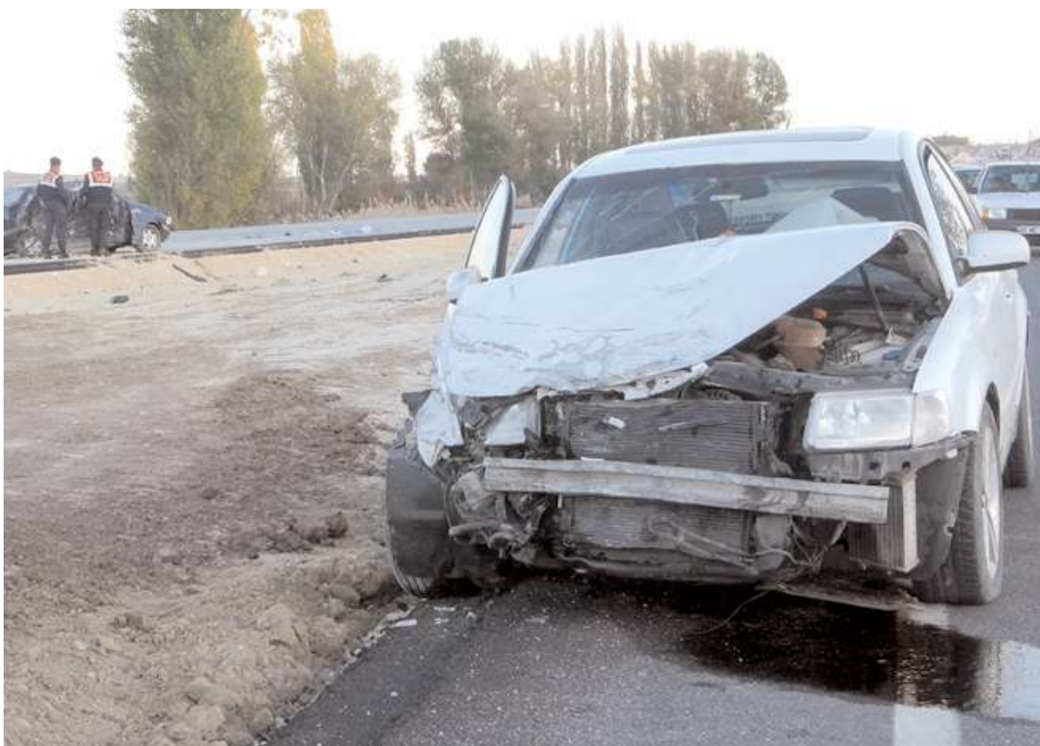
Kaza da her iki otomobilde hurdaya döndü.