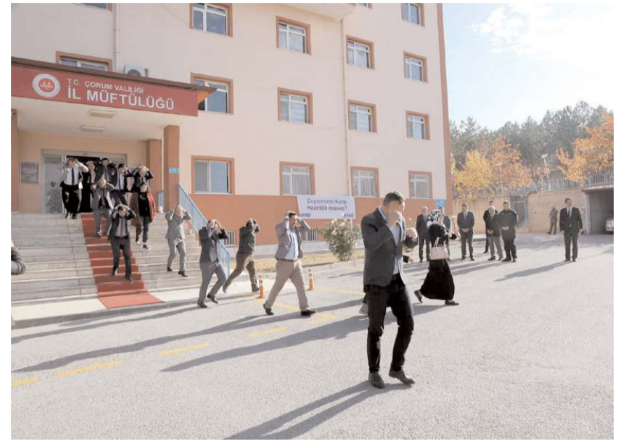
Tatbikat Türkiye genelinde 24 binden fazla merkezde eş zamanlı yapıldı.

İçişleri Bakanı Süleyman Soylu, seçilen 10 ilde ise belirlenen lokasyonlarda yaka kamerası ile tatbikat anını izledi. Bakan Soylu'nun Ankara'dan telekonferansla yönettiği tatbikatta, 6 ildeki noktadan yapılan bilgilendirmenin ardından sirenlerin çalınmasıyla yurt genelindeki eş zamanlı tatbikat başlatıldı.