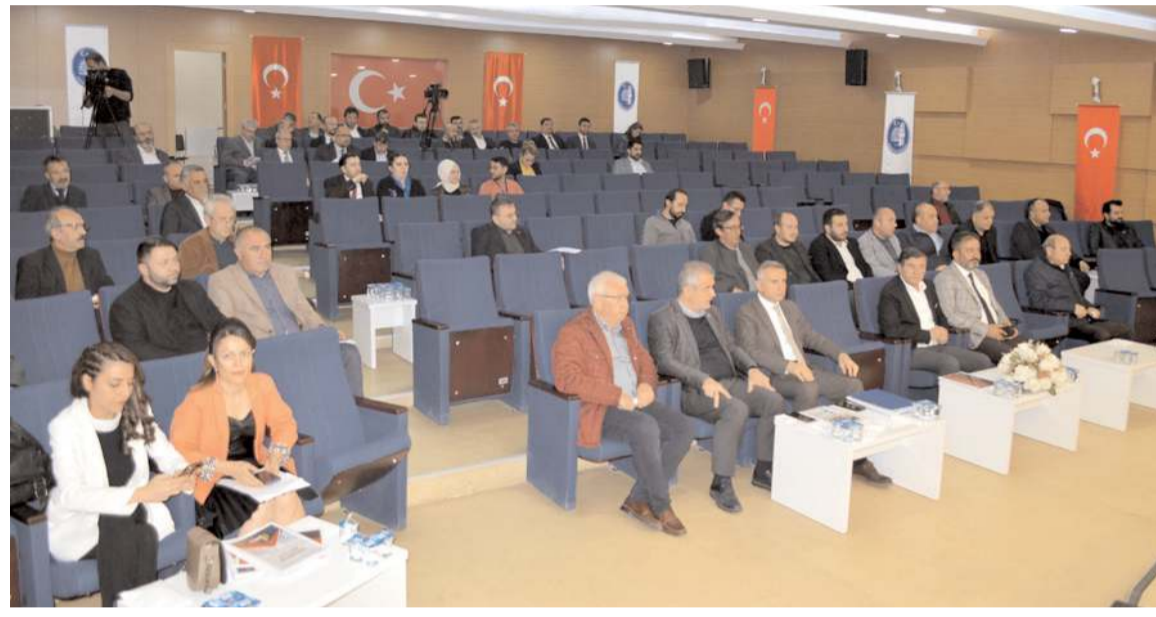
Çorum Belediyesi'nin 2023 yılı analitik bütçesi Meclis'in ikinci toplantısında oylanarak kabul edildi.

Konuşmasında Nazım İmar Planına da değinen Bulut, "Geçtiğimiz son 20 yıla bakıldığında Çorum'u hep iktidar belediyesi yönetmiştir. 20 yıl bir şehri planlamak için oldukça ciddi ve uzun bir süreçtir. Şehrimizi yönetenler Çorum'un geleceğini planlamadan öyle bir uzak noktada olmalılar ki hala bu şehre ait bir Nazım İmar Planı yok. Yerel yönetimlerin kentin en az 50 yıllık, 100 yıllık gelişim planlarını yaparak, halkımızın, müteahhitlerin ileride karşılaşılabilecekleri sorunları çözecek yol ve yöntemler üretmelidirler. Çorum'un bir şehir kimliği, bir imar planı henüz oluşturulmamıştır. Göreve geldiğimizden bu güne kadar yamalı bohaç gibi gerekli gereksiz imar konularını meclisce çözmeye çalışıyoruz. Bu ilde şehir plançıları, kentsel tasarımcılar, peyzaj mimarları, arkeologlar, restorasyon uzmanları, sanat tarihçileri, bir arada işi yapacak ve uyum içinde neden çalışıyorlar. Neden ortak bir eser ortaya koyamıyorlar. Sayın Başkanın 5 yıllık stratejik plana koymuş olduğu Nazım İmar Planı 2021 yılının Aralık ayında İller Bankası üzerinden ihale edilmiş olup bir Ankara firmasında kalmış ve daha sonra yapılan bu ihale aşırı düşük olması sebebiyle 2022 Ocak ayında meclis tarafından iptal edilmiştir" şeklinde belirtti.