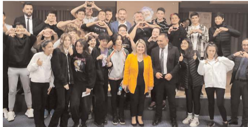
Programın sonunda toplu hatıra fotoğrafı çekildi.