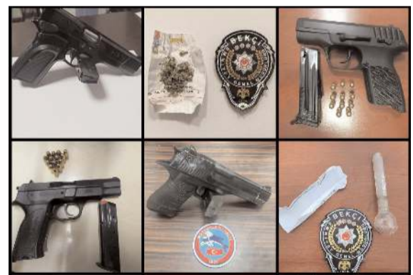
Operasyonlarda ele geçirilen suç aletleri.