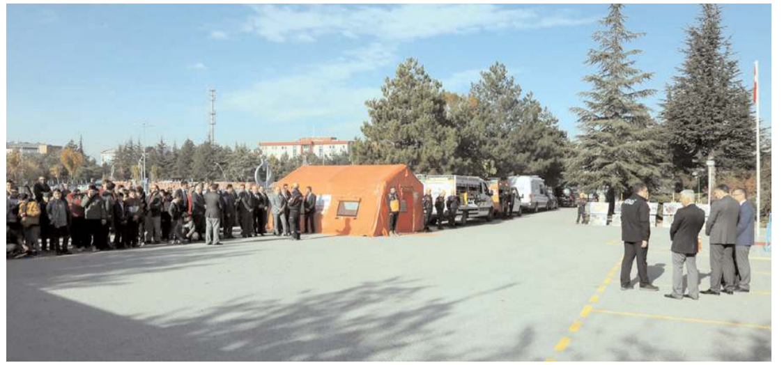
Tatbikat Çorum İl Müftülüğü'nde gerçekleştirildi.

Araçtaki 2 şüpheli ekiplerce gözaltına alındı.(AA)