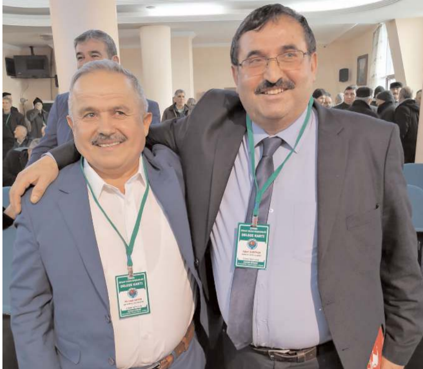
Her iki başkan adayı da birlik ve beraberlik mesajları verdiler.