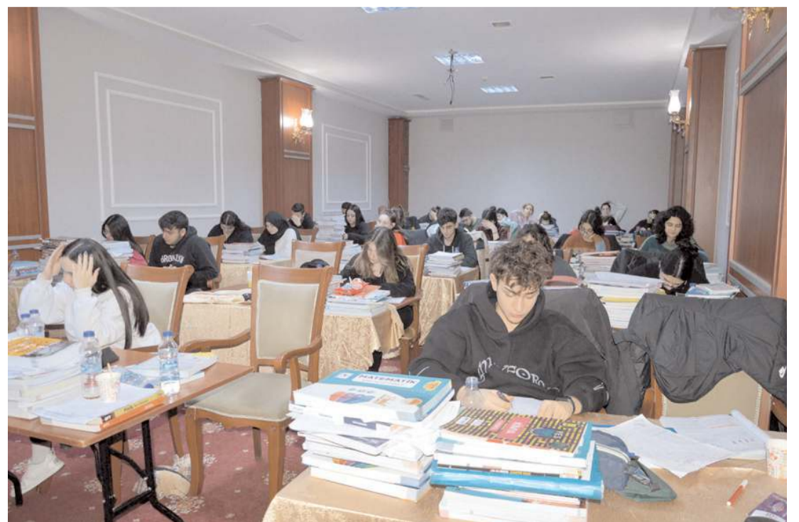
Etüt programı 5 gün sürecek.

yoruz. Çocuklarımızın dikkatini toplayarak güzel bir rekabetle ve ortam değişikliği ile ders çalışma kamplarından senelerdir yüksek verim alıyoruz." şeklinde konuştu