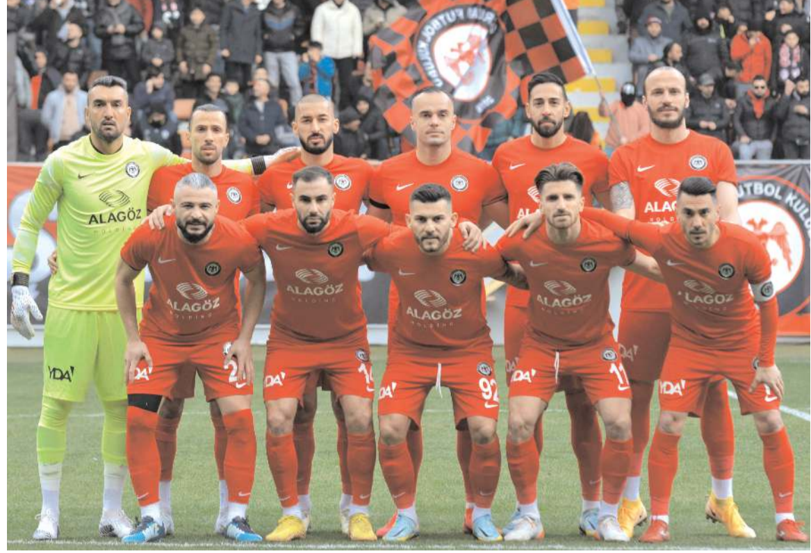
Çorum FK geçen hafta kazandığı Nazilli maçına yakın kadro ile bugün Bursaspor karşısına çıkması bekleniyor

Son çalışmayı Bursa'da yaptılar Çorum FK bugün oynayacağı Bursaspor