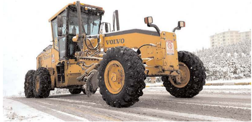
İl Özel İdaresi ekipleri çok sayıda ekiple karla mücadele ediyor.

Ekiplerin, köylerden gelen talepler doğrultusunda bazı yollarda temizlik çalışması yürütüldüğü belirtildi. (A.A)