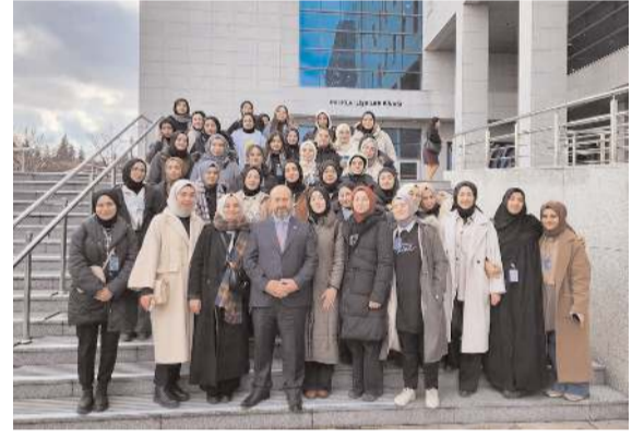
Ziyaretin sonunda toplu hatıra fotoğrafı çekildi.

AK Parti Çorum Milletvekili Erol Kavuncu