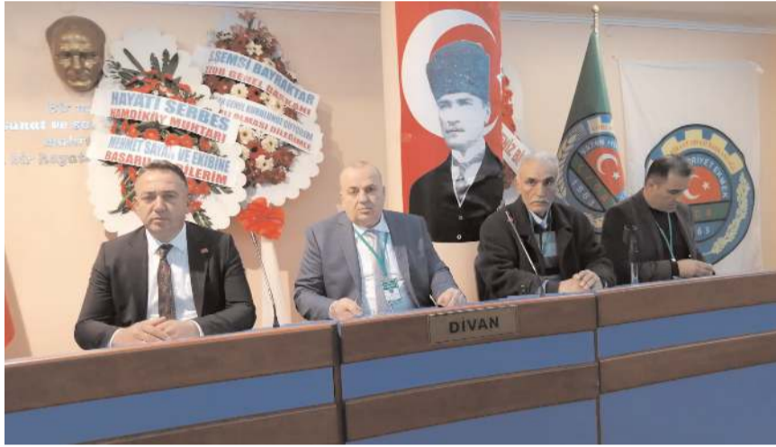
Genel kurulda ilk olarak divan heyeti belirlendi.