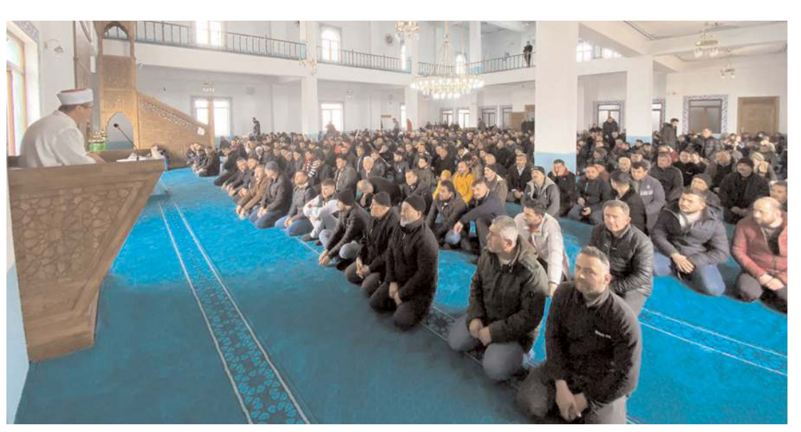
Cami 1200 kişi kapasiteye sahip.