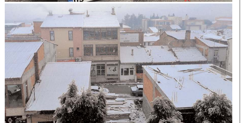
Kar yağışının devam etmesi bekleniyor.