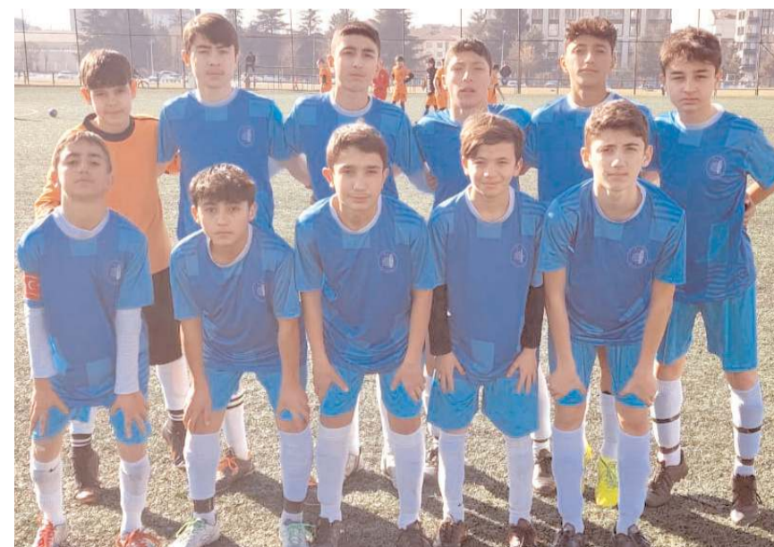
Mimar Sinan Gençlikspor ikinci maçını kazanarak iddiasını sürdürmek istiyor