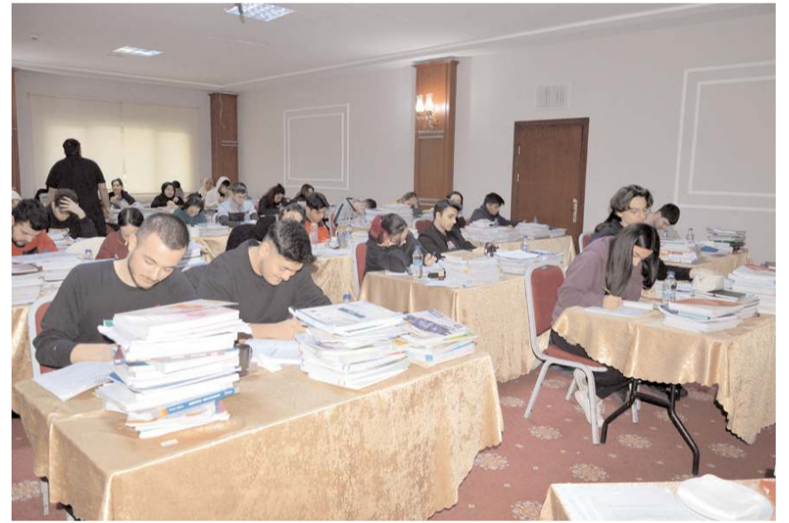
Etüt programına 90 öğrenci katılıyor.