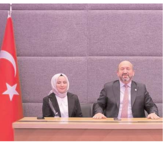
Öğrenciler milletvekili Erol Kavuncu'yu ziyaret etti.

TBMM'de gerçekleşen ziyarette öğrenciler Gazi