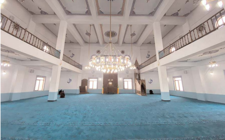
Cami, hayırsever esnaf ve vatandaşların katkılarıyla 2 yıl gibi bir sürede tamamlandı.