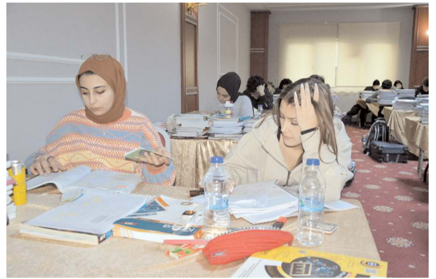
Duran Eğitim Merkezi, sömestr tatilinde öğrencilerini Armina Otel'de ağırladı.

Geleneksel hale getirdikleri yarıyıl kampını bu yıl da devam ettirdiklerini belirten Duran; "90 öğrenci ile özellikle sömestr tatilinde çocuklarımızın ilk dönem öğrendiklerini tekrar etme fırsatı sağlıyoruz. Teknolojik aletlerden, sosyal ortamdan ve hatta aileden 5 gün uzakta kalarak otel ortamında günde yaklaşık 12 saat etüt yapı-