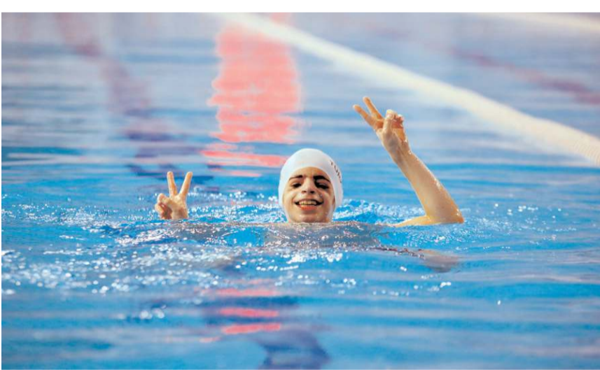
Proje başladıktan sonra 5 özel sporcu, katıldıkları turnuvalarda derece kazandı.

Ancak özellikle engelli bireylerin öncelikleri olduğuna dikkati çeken Ceylan, "Sosyalleşmeleri için yüzme araç olarak kullanmak istiyoruz. 2022'de 26 bin kişiye yüzme eğitimi verdik. Bunun 200'ü engelli bireyler. Bu sayıları her geçen yıl artırmak istiyoruz. 30 civarında yüzme antrenörümüz var. Bir hocaya düşen öğrenci sayısını düşürerek derslerin daha verimli geçmesini sağladık. Neredeyse bir öğrenciye bir hoca düşüyor. Bu da öğrenmenin önünü açıyor." ifadelerini kullandı.