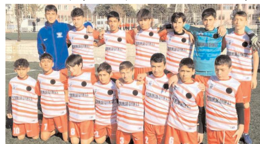
Hattuşa Gençlikspor Çimentospor önünde üç puan mücadelesi verecek