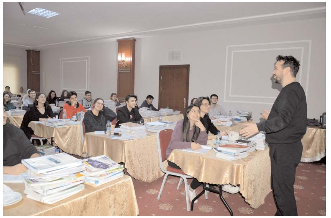
Ahmet Duran Eğitim Merkezi, geleneksel hale getirdiği 'Yarıyıl Tatil Kampı'nı bu yıl da devam ettirdi.