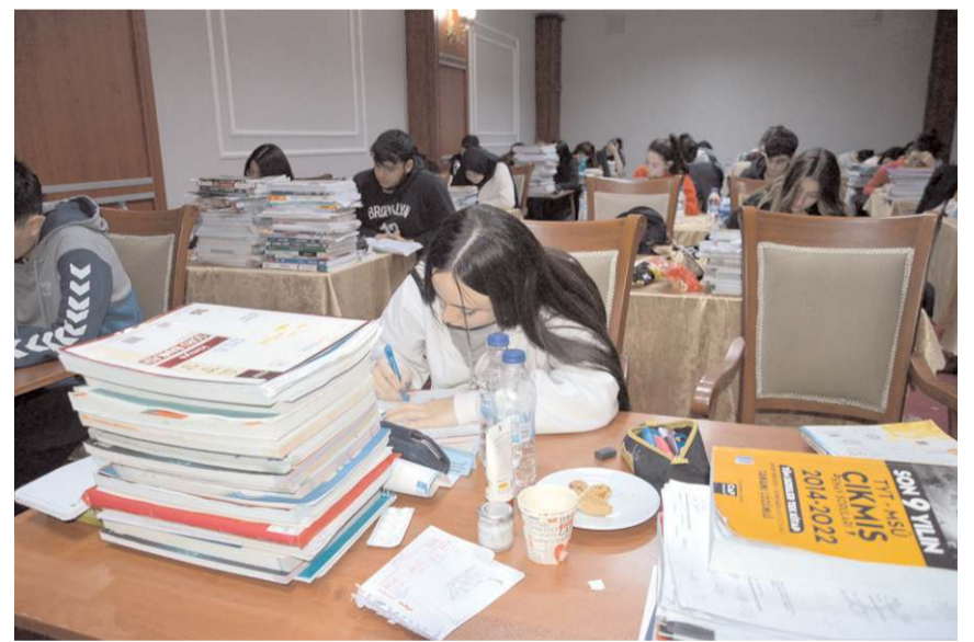
Öğrenciler etüt programında günde 12 saat ders çalışıyorlar.

yoruz. Çocuklarımızın dikkatini toplayarak güzel bir rekabetle ve ortam değişikliği ile ders çalışma kamplarından senelerdir yüksek verim alıyoruz." şeklinde konuştu