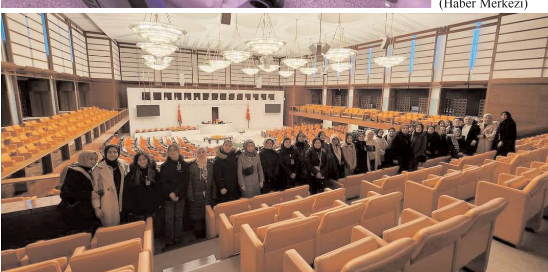
Öğrenciler meclis genel kurul salonunu gezdi.