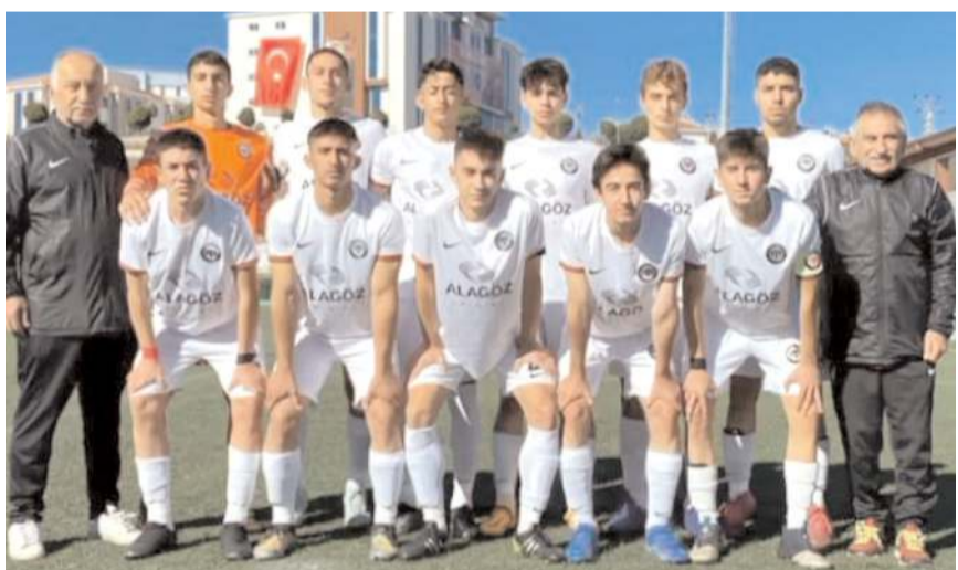
Çorum FK U 17 takımı bugün Orduspor önünde üç puan mücadelesi verecek