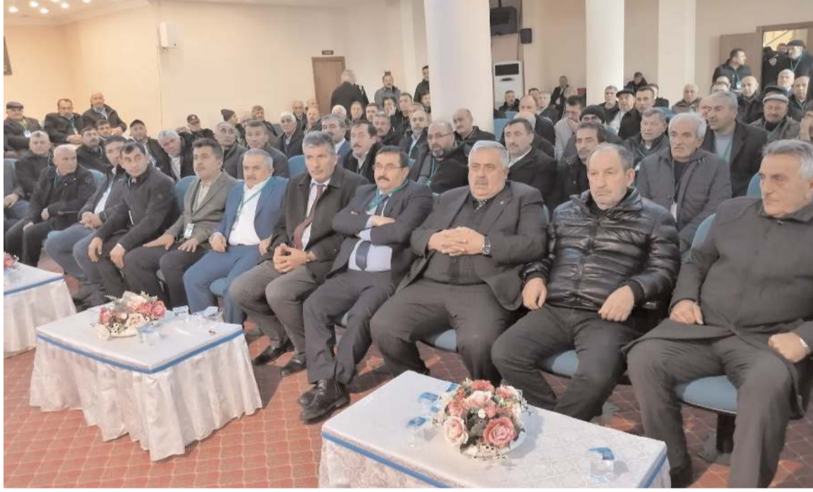
Genel kurula katılım yüksek oldu.