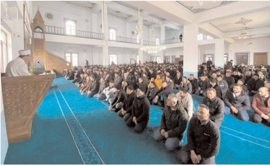
Cami 1200 kişi kapasiteye sahip.