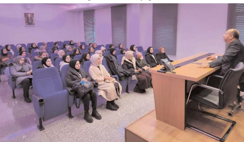
Milletvekili Erol Kavuncu, öğrencilere tavsiyelerde bulundu.