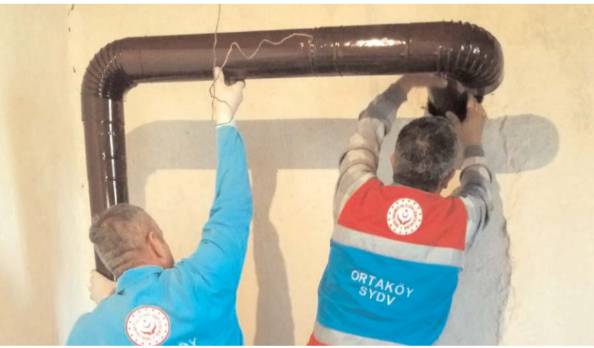
Vefa ekipleri ihtiyaç sahiplerine yardım ediyor.