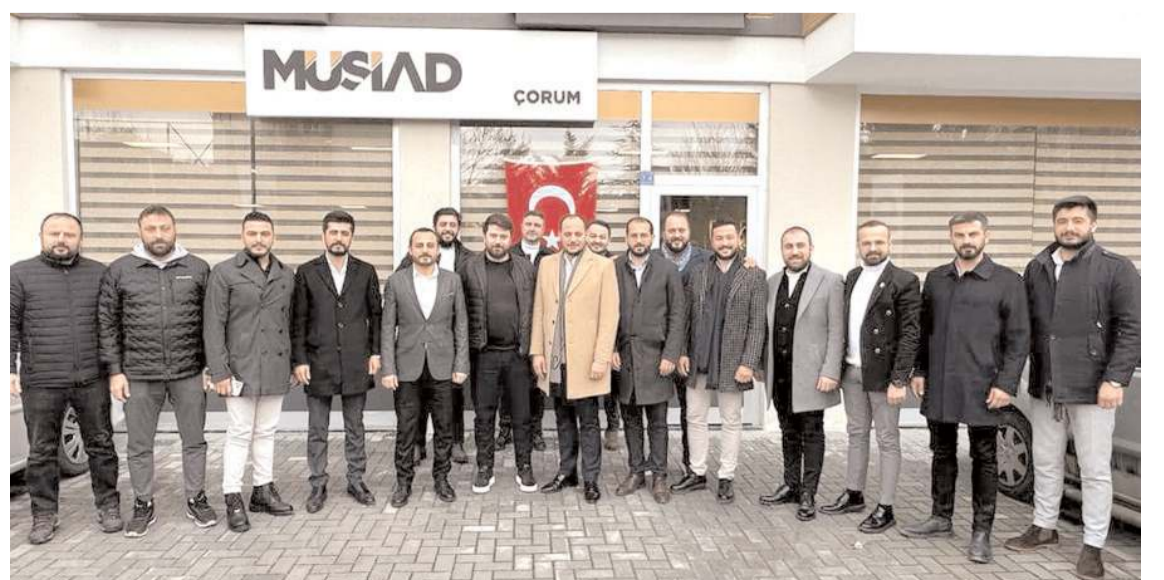
Ziyaretin sonunda toplu hatıra fotoğrafı çekildi.