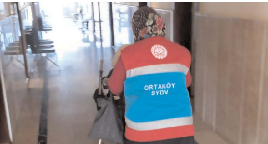
Ortaköy'de 40 kişiye ayda iki kez temizlik ve kişisel bakım hizmeti veriliyor.

Ortaköy Kaymakamlığı Sosyal Yardımlaşma ve Dayanışma Vakfınca (SYDV) Vefa Projesi kapsamında oluşturulan ekip, ihtiyaç sahibi 40 kişinin ayda iki kez evini temizliyor.