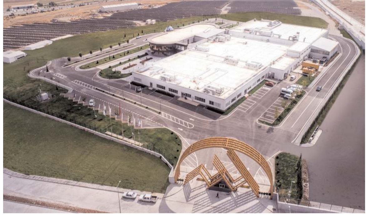
AHL Pay markası ile 2021 yılında Elektronik Para Kuruluşu lisansı alınmış.

AltınPOS kullanan kuyumcularımız, POS kullanımındaki en önemli sorunları olan "Altın-TL kuru" riskinden kurtulmuş oluyorlar. Android işletim sistemine sahip AltınPOS ile cumartesi günleri de dahil anlık canlı kur bilgileri sunan platformumuz sayesinde Kuyumculuk sektöründeki üye işyerlerimiz satış işlemi gerçekleştikten sonra TL'den Altın'a dönebiliyor. Oluşan altın bakiyeleri dahilinde, talep ettikleri tüm kuyumculuk ürünlerini alabiliyorlar. AltınPOS; kuyumculuk sektörü için tek çekim ve taksitli kart ödemelerinde avantajlı oranların, Altın-TL kur riskine karşı çözüm uygulamasının, fiziken kuyumculuk ürünlerinin tekrar alınabilmesinin bir bütün halinde