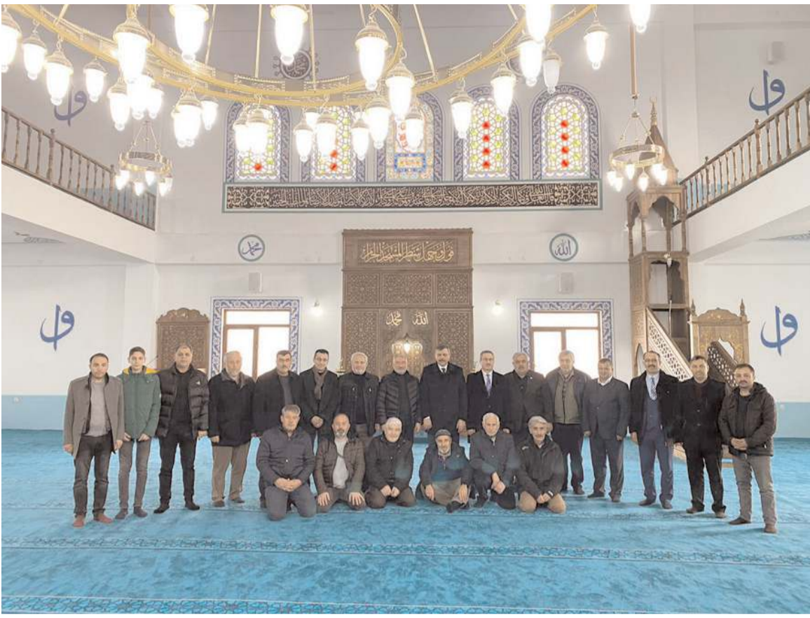
Sanayi Camii, dün kılınan Cuma namazı ile birlikte ibadete açıldı.