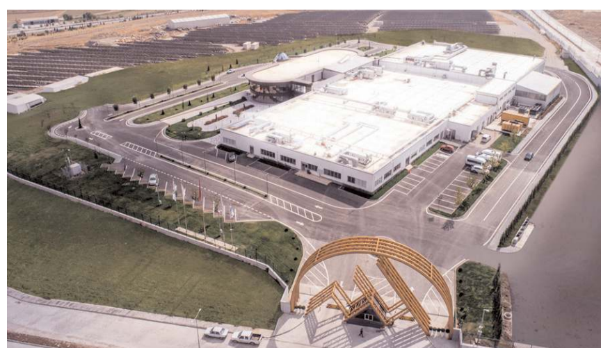
AHL Pay markası ile 2021 yılında Elektronik Para Kuruluşu lisansı alınmış.

Kuyumculuk sektörüne özel olarak geliştirdiği AltınPos ile kuyumcuları 'altın kuru' riskinden kurtaran AHL Pay, bireysel kullanıcılar için dijital cüzdanı da kullanıma sundu. * HABERİ 4'DE