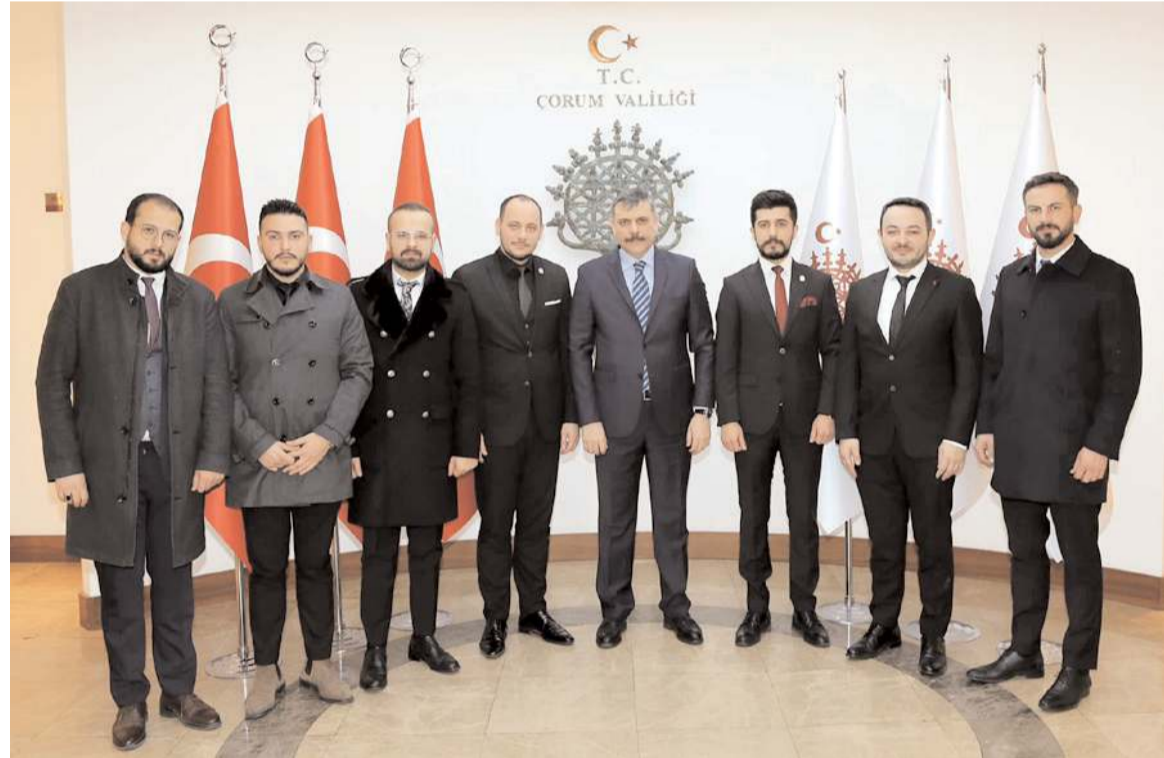
GİAD yönetimi Vali Mustafa Çiftçi'ye nezaket ziyaretinde bulundu.

Yaşlı bir sürücünün tespitini de son söz olarak paylaşalım; "Direksiyon başında yayaya, yaya iken de direksiyon başındaki insana saygı duyduğumuz süreçte, memleketin trafik sorununu büyük ölçüde çözmüş oluruz."