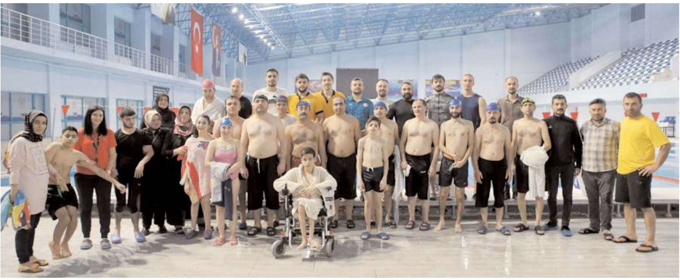
"Yüzme Bilmeyen Kalmasın Projesi" kapsamında Çorum'da düzenlenen yüzme kurslarında paralimpik sporcular yetiştiriliyor.