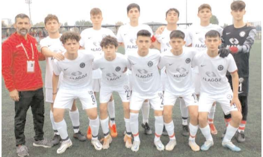
Çorum FK U 16 takımı yarın evinde Keçiöregücü önünde puan arayacak