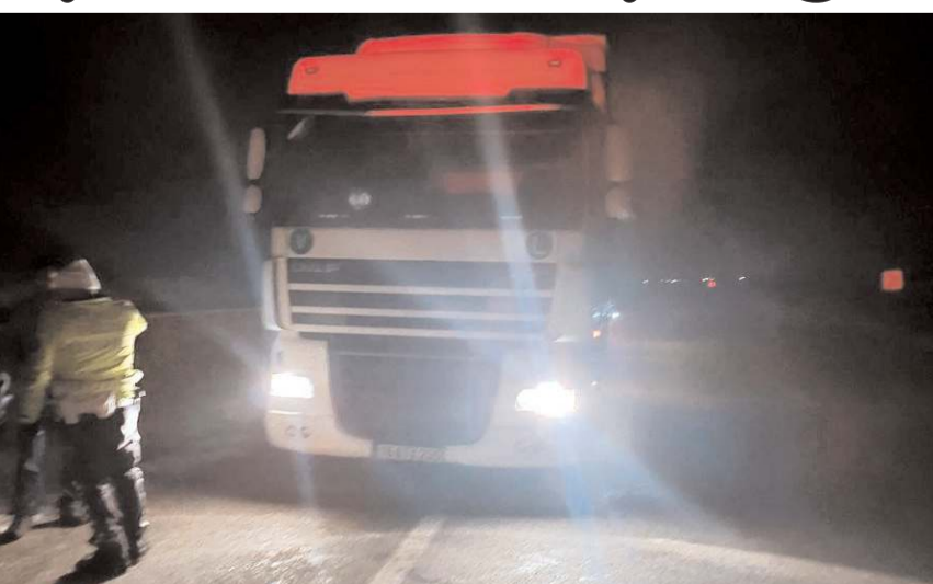
Olay Çorum-Yozgat kara yolunda meydana geldi.

112 Acil Çağrı Merkezi'nden gelen komut üzerine Çorum-Yozgat kara yolu Kuyluş köyü