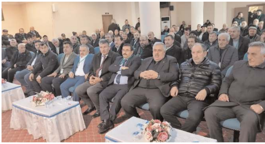
Genel kurula katılım yüksek oldu.