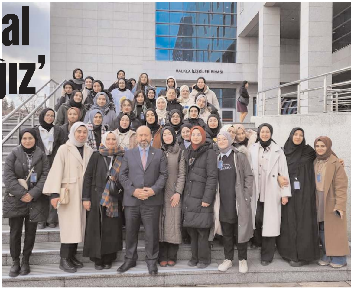
Ziyaretin sonunda toplu hatıra fotoğrafı çekildi.