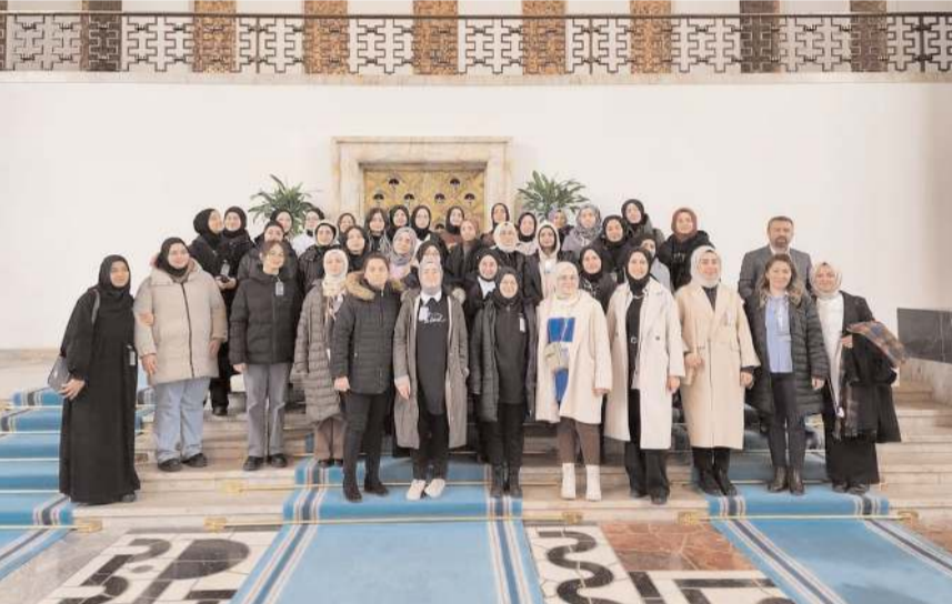
Kız öğrenciler TBMM'yi gezdiler.

Değerli öğrencilerimiz, öğrenci liderlerine, öğretmenlerine, ÖNDER yetkililerine ziyaretleri için teşekkür ediyor, eğitim hayatlarında ve çalışmalarında muaffakiyetler diliyorum." (Haber Merkezi)