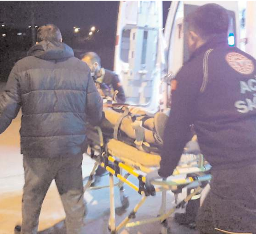
Yaralı olay yerinde yapılan ilk müdahalenin ardından hastaneye kaldırıldı.

Çorum'da bıçaklı saldırı sonucu yaralanan genç, tedavi altına alındı.