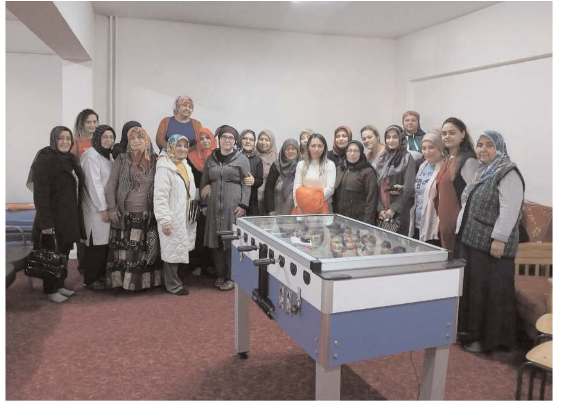
Çorum Belediyesi Kent Konseyi Kadın Meclisi, deprem bölgesinden Çorum'a gelen kadınlarla buluştu.