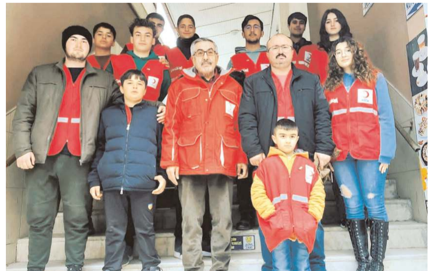
Toplanan malzemeler Sungurlu Kaymakamlığına teslim edilerek deprem bölgesine gönderildi.