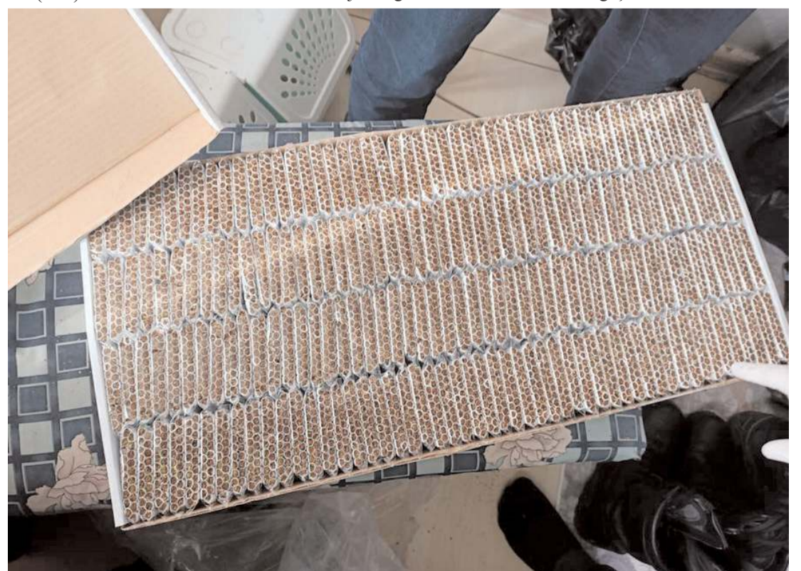
10 bin 570 makaron koyma poşeti ele geçirildi.