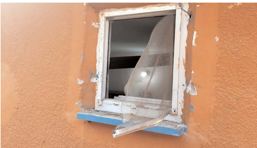
Hırsızlık olayları Bahçelievler Mahallesi Dumlupınar Caddesi ve Dumlupınar 16. Sokak'ta bulunan evlerde meydana geldi.