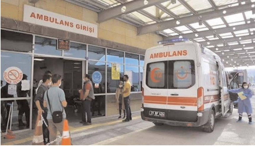
Öğrenciler hastanede tedavi altına alındı.

■ Çorum'da lise öğrencileri yedikleri yemeğin ardından rahatsızlandı. 8 öğrenci gıda zehirlenmesi şüphesiyle hastaneye kaldırıldı.