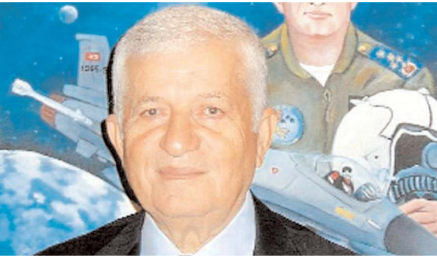
Eski Orgeneral hemşehrimiz Ahmet Çörekçi

Resmi Gazete'de yayımlanan Cumhurbaşkanlığı Kararı ile 28 Şubat davasında müebbet hapis cezasına çarptırılan eski Korgeneral Hakkı Kılınç (83), eski Orgeneral Ahmet Çörekçi (91) ve eski Tuğgeneral Idris Koralp'in (75) cezaları kaldırıldı. Karara gerekçe olarak hükümlülük hakkında Adli Tıp Kurumu'nun 'kocama hali' raporu gösterildi.