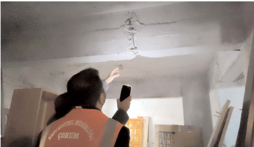
Binalardaki çatlak ve kırıklar teknik ekiplerce değerlendiriliyor.