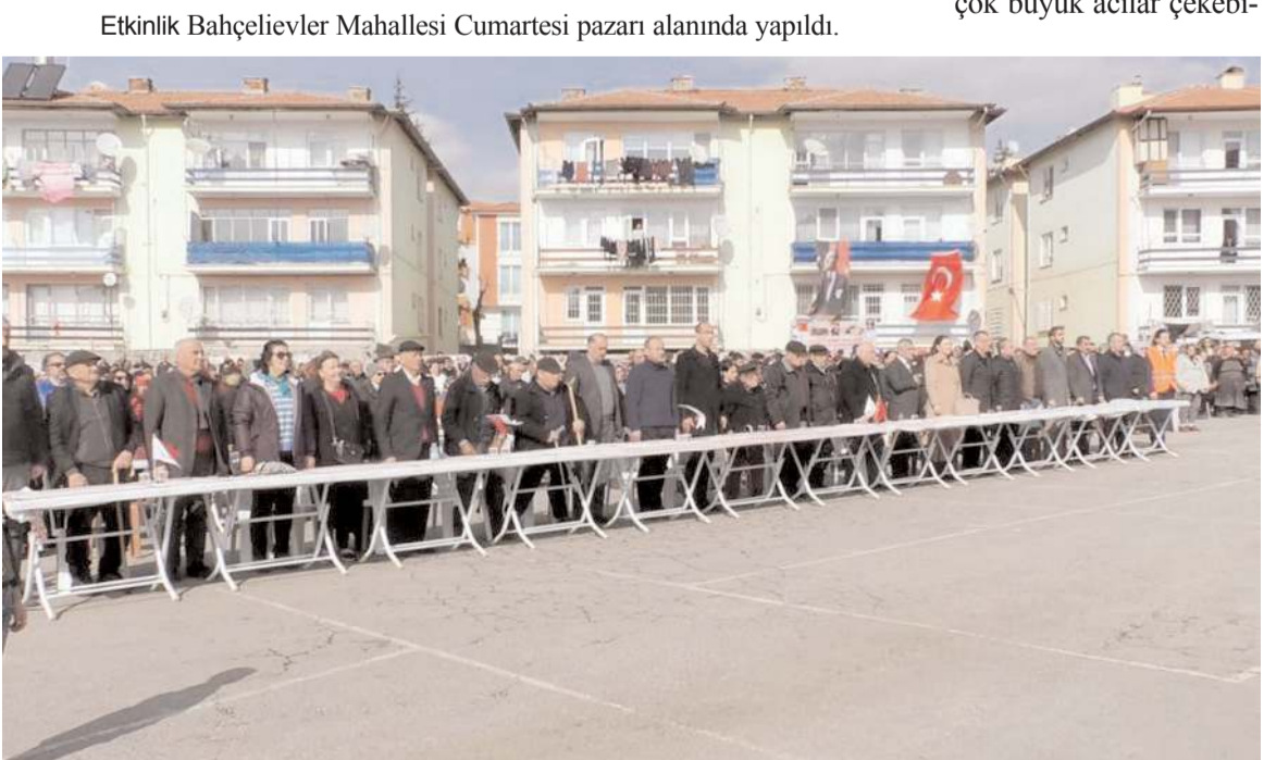
Etkinlik depremde yaşamını yitirenler anısına saygı duruşunda bulunulması ve İstiklal Marşı'nın okunması ile başladı.