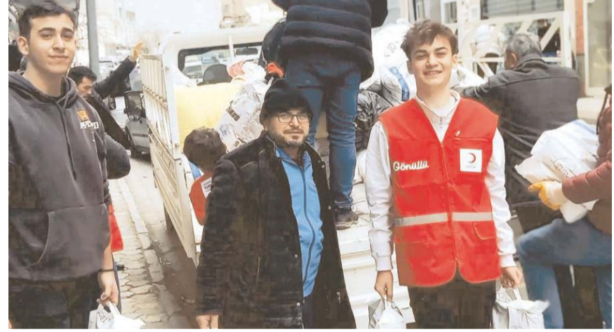
Sungurlu Kızılay Şubesi tarafından oluşturulan toplanma merkezlerindeki yardımlar yola çıktı.

Deprem bölgesine Kızılay aracı ile 60 koli giyim eşyası gönderildiği belirtilen açıklamada, "10 koli giyimde yardımı da Sungurlu Belediyesiyle teslim edildi. Kızılay olarak ayrıca 185 bin TL nakit, 7 bin 500 euro da aktarıldı. Bugün itibari ile Kızılay'a ilçedeki bin 375 kişi çeşitli yardımla bulundu. Deprem bölgesinden gelen kardeşlerimizin de giyim, gıda, ısınma, ev, mutfak ve çeşitli eşyalar verilmiştir. Halende yardım yapmaya devam etmekteyiz. Şuana kadar 93 aileden bin 753 kişiye giyim yardımı yapılmıştır. Bu süreçte depremezeder için yardım yapan kardeşlerimize, sivil toplum örgütlerine, resmi kurum ve kuruluşlarımıza çok teşekkür ederiz. Allah razı olsun herkesten. Allah birliğimizi beraberliğimizi bozmasın ve böyle felaketlerden korusun" ifadeleri kullanıldı. (İHA)