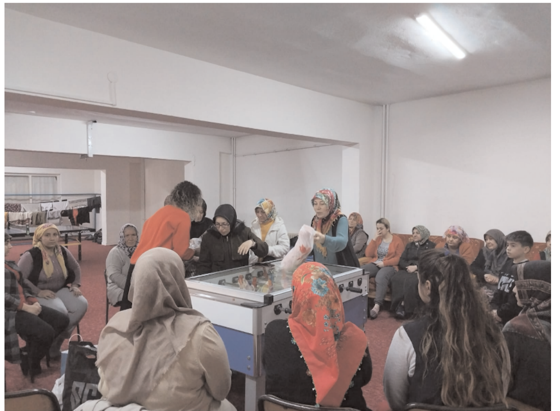
Depremzede kadınlar Erol Olçok İmam Hatip Lisesi Öğrenci Yurdu'nda misafir ediliyor.

Çorum Belediyesi Kent Konseyi Kadın Meclisi, deprem bölgesinden Çorum'a gelen kadınlara el işi malzemesi hediye etti.