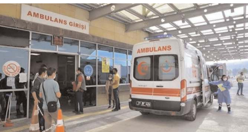
Öğrenciler hastanede tedavi altına alındı.

ardından rahatsızlandı. 8 öğrenci gıda zehirlenmesi şüphesiyle hastaneye kaldırıldı.