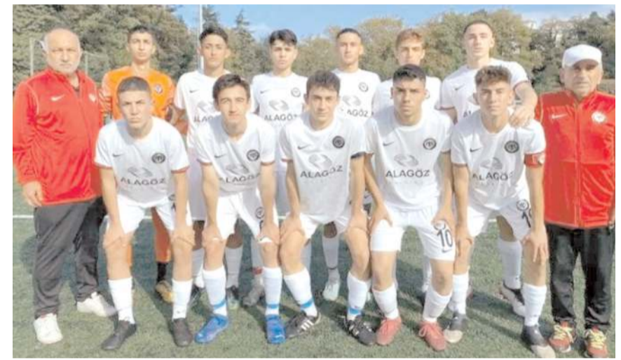
Çorum FK U 17 takımı final grubu için bugün Zonguldakspor önünde kazanmak zorunda

U 16 Gelişim Liginde ise Çorum FK üçüncü devrenin ilk maçında Boluspor deplasmanında mücadele edecek. Grupta 7 puanla son sırada bulunan Çorum FK 17 puanla beşinci sırada bulunan Boluspor ile Karacayır 1 nolu sahada karşılaşacak. Maçı Emrullah Çimen yönetecek yardımcılıklarını ise Bilal Arslan ve İbrahim Sezer hakem üçlüsü yönetecek.