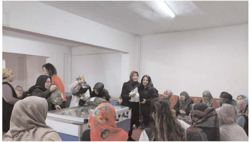
Kent Konseyi Kadın Meclisi, deprem bölgesinden Çorum'a gelen kadınlara el işi malzemesi hediye etti.