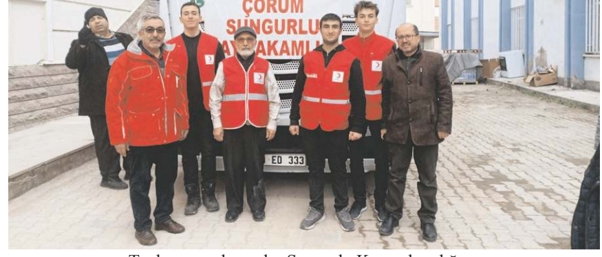
Toplanan malzemeler Sungurlu Kaymakamlığına teslim edilerek deprem bölgesine gönderildi.