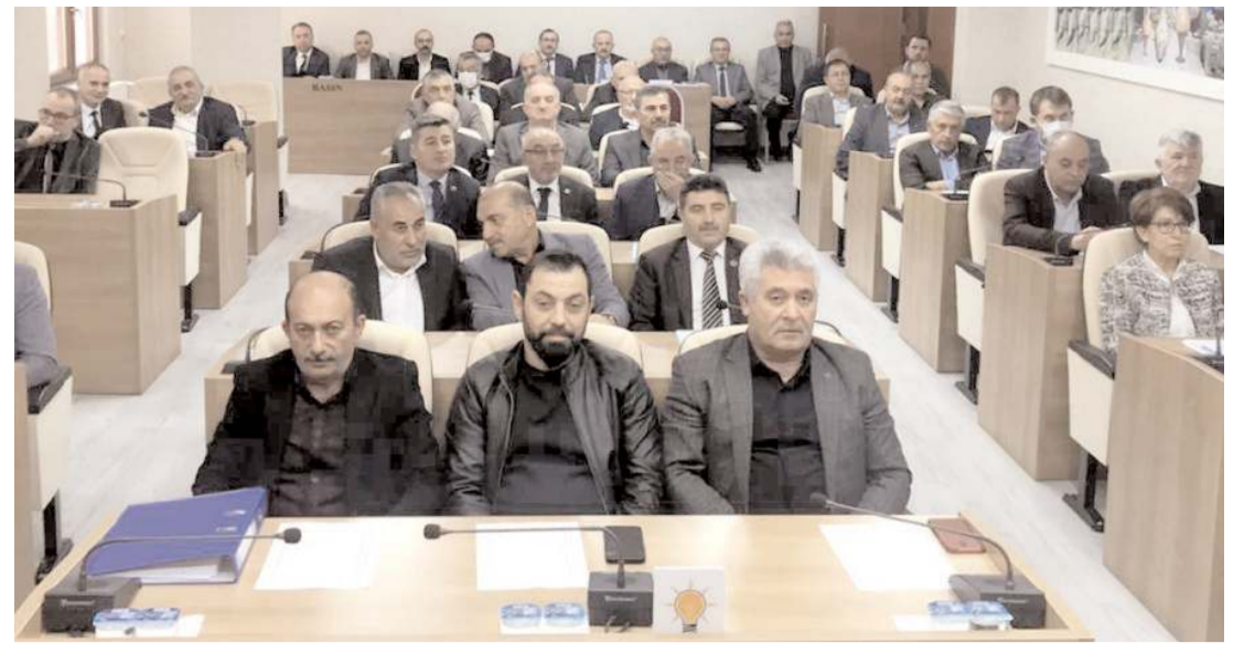
Meclis toplantısında gündem maddeleri görüşülerek karara bağlandı.