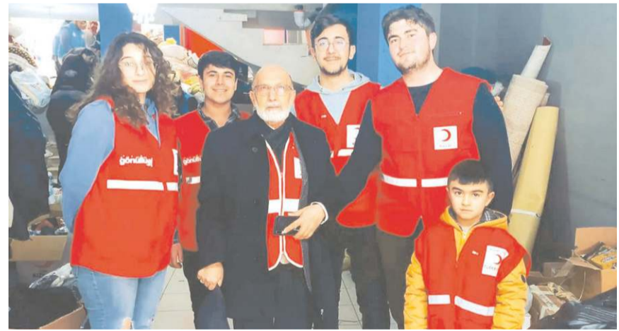
Kızılay, gıda, ev tekstili, temizlik maddeleri ve giyim eşyaları topladı.