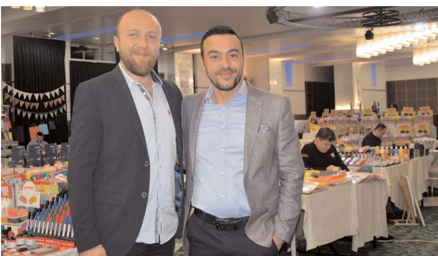
Erka Kâğıt ve Kırtasiye "Geleneksel Kırtasiye Fuarı"nın 22'ncisini açtı.