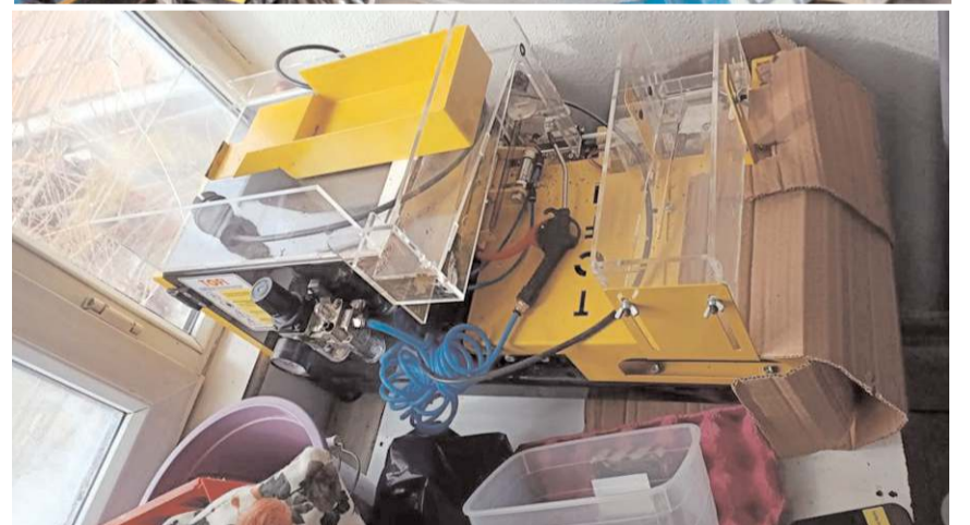
Operasyonda 16 kollu manuel sigara sarma makinesi ile 2 dijital sigara sarma makinesi de ele geçirildi.