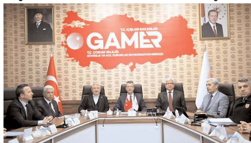
Toplantı Vali Vekili Tamer Orhan başkanlığında yapıldı.

Bugün itibarıyla Çorum il genelinde misafir edilen 7 bin 996 depremzede için devletin tüm imkânlarının seferber edildiğini söyleyen Vali Vekili Orhan, evini kaybeden vatandaşlara kendi evlerine kavuşana kadar sıcak yuvalar kurmak amacıyla AFAD tarafından başlatılan 'Evim Yuvan Olsun'