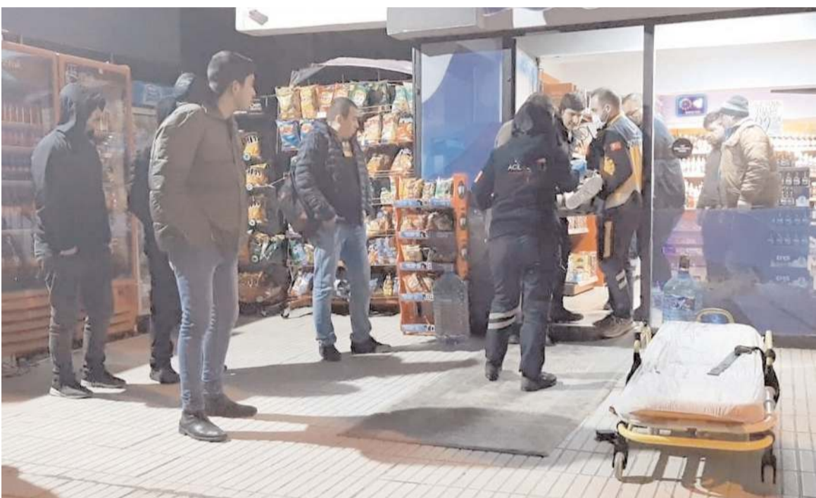
Olay Bahçelievler Mahallesi Bahar 1. Caddesi'nde meydana geldi.

Saldırganların yakalanması için çalışma başlatıldı. (AA)