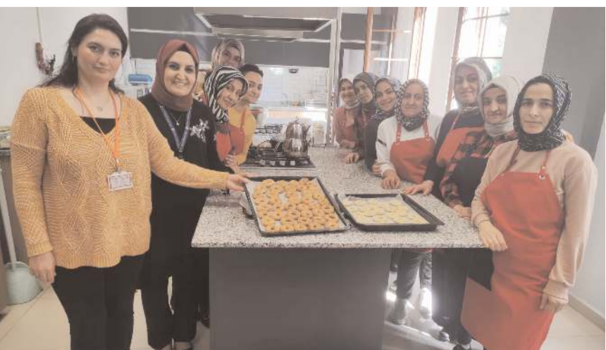
Simitler Berat Kandili'nde Afşin'deki depremzedelere ikram edilecek.