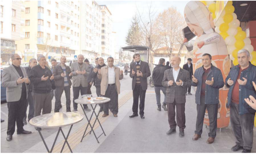
Açılış öncesinde dua edildi.