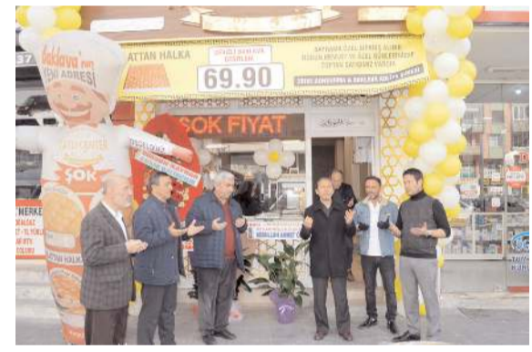
Firma, Tatlı Center'ın Çorum bayiliğini aldı.

■ Çorum'da aynı semte üst üste hırsızlık olaylarının meydana geldiği iddiası üzerine polis ekiplerince inceleme başlatıldı. * HABERİ 7'DE