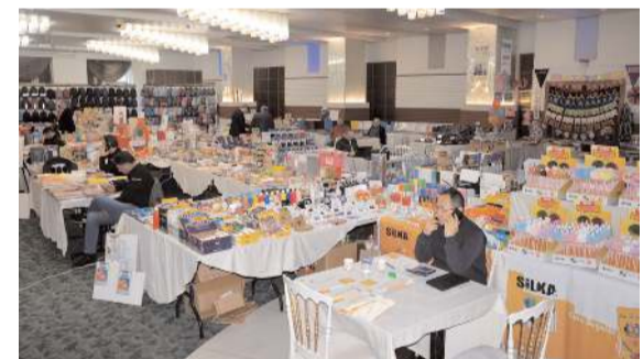
Fuarda Türkiye genelinden 35 imalat ve ithalatçı firma stant açtı.

■ Ata Caddesi'nde geçen yıl faaliyete başlayan Zirve Dondurma ve Baklava ikinci şubesini Fatih Caddesi'nde açtı. * HABERİ 4'DE