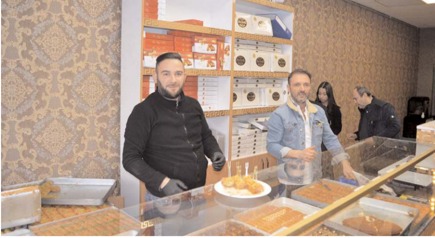
Zirve Dondurma ve Baklava'nın ikinci şubesi Fatih Caddesi'nde Adliye karşısında bulunuyor.