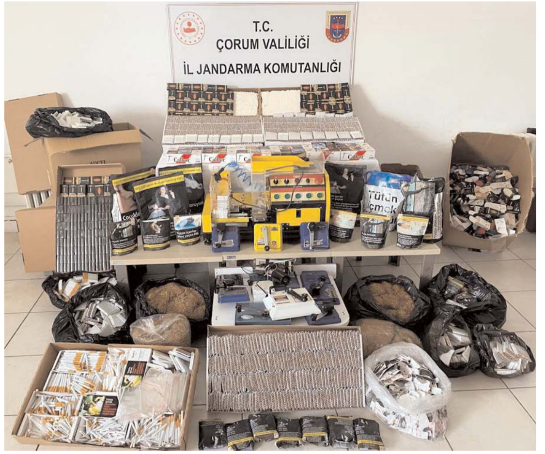
İl Jandarma Komutanlığı ekipleri Sungurlu'da kaçak makaron ve tütün operasyonu düzenledi.

Diğer ev sahibi Hasan Bayar ise bölgede çok sayıda hırsızlık olayı yaşandığını belirterek, "Benim 30 bin liralık motorumu kilitli olduğu halde kapımı kırıp götürdüler. Geçen sene de 9 tane tavuğumu götürdüler. 5 defa girdiler benim evime." ifadelerini kullandı. (AA)