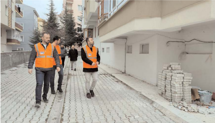
Çorum Belediyesi, tüm başvuruları kısa sürede değerlendiriyor.