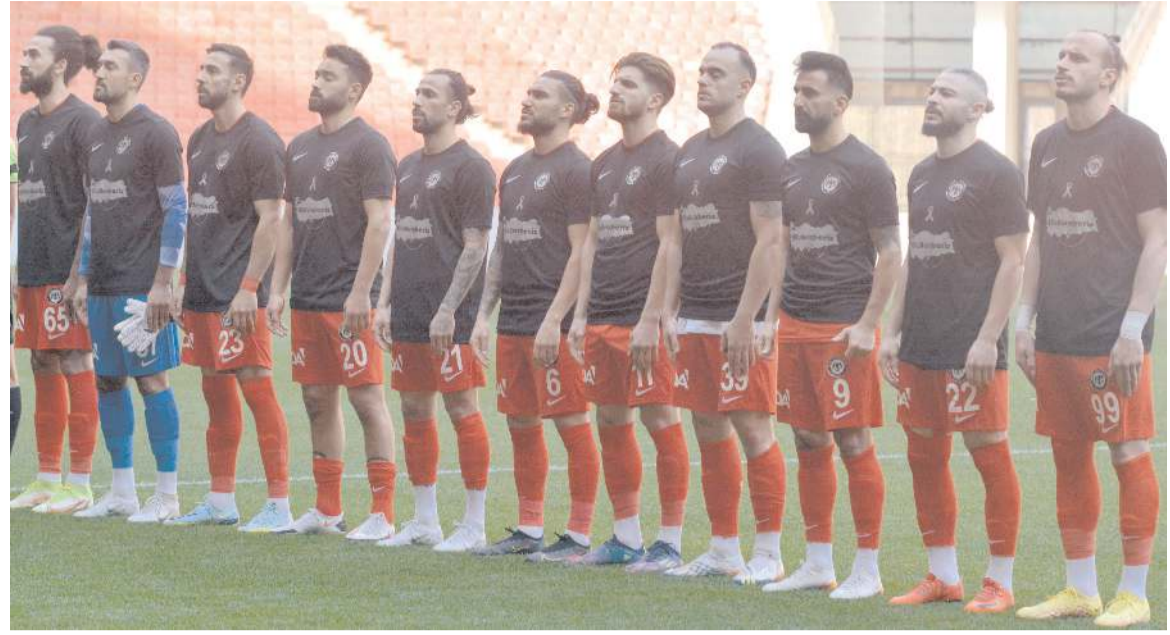
Çorum FK üç haftalık aranın ardından yarın Batman Petrolspor deplasmanında galibiyet arayacak

Çorum FK kafilesi yarın saat 14'de başlayacak maçın ardından ise önümüzdeki hafta sonunu bay geçeceği için karayolu ile Çorum'a dönecek.