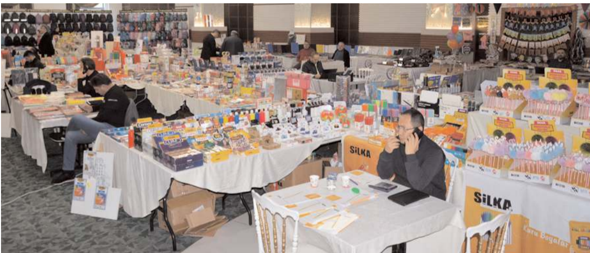
Fuarda Türkiye genelinden 35 imalat ve ithalatçı firma stant açtı.