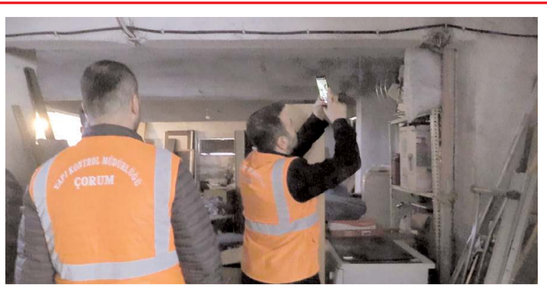
Binalardaki çatlak ve kırıklar teknik ekiplerce değerlendiriliyor.