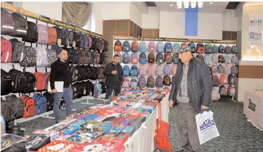
Fuar Anitta Otel'de açıldı.