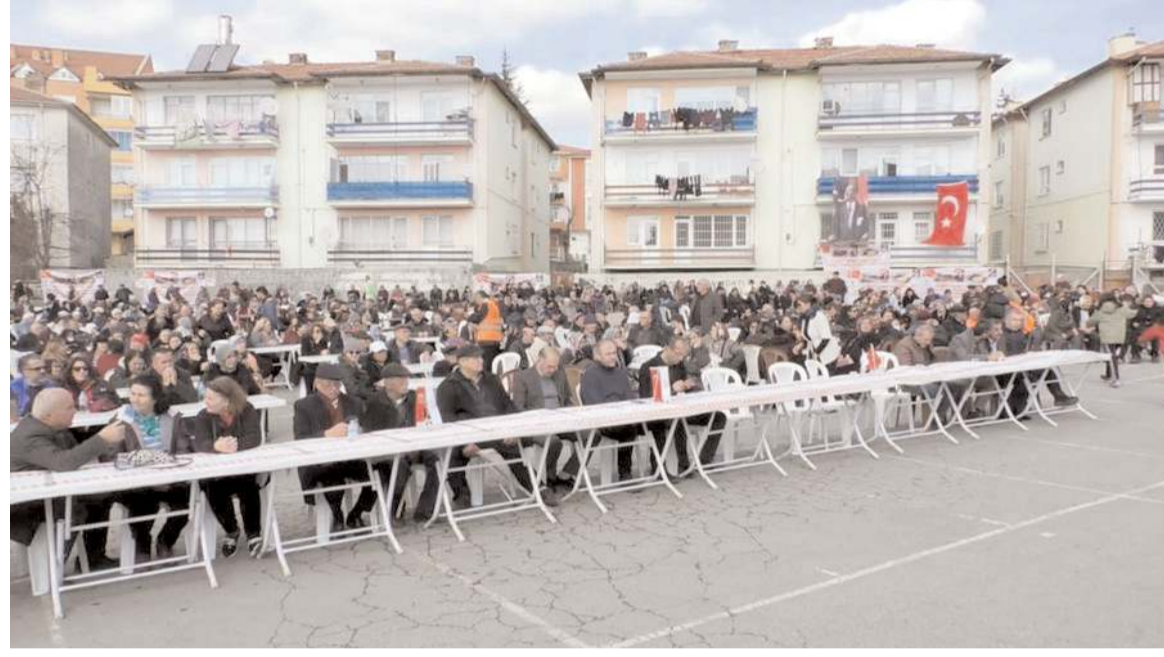
Ehlibeyt Kudret Dağı Vakfı Cemevleri tarafından düzenlenen 'Hızır Ayı'nda Abdal Musa Kurtuluş Lokması' etkinliği Çorum'da yoğun bir katılımıyla gerçekleşti.

Doğan, "Fark ettim ki doğurmadığım birçok çocuğum, hiç elini öpmediğim annem, babam, dedem varmış. Birlikte kıyafetimi, yemeğimi paylaşmadığım birçok kardeşlerim varmış. Ve ben onları bilmeden, hiç tanımadan onların yerine çok büyük acılar çekebi-