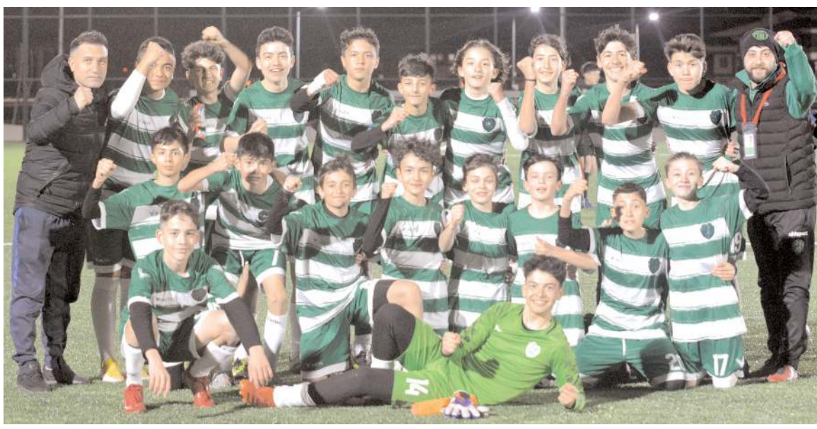
Çimentospor U 14 takımı üçüncü maçında kazanarak şampiyonluk yolunda bir adım öne geçti