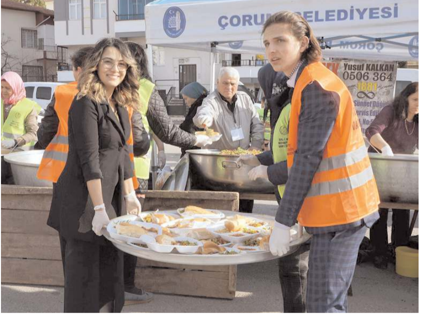
Katılımcılara lokma dağıtımı yapıldı.