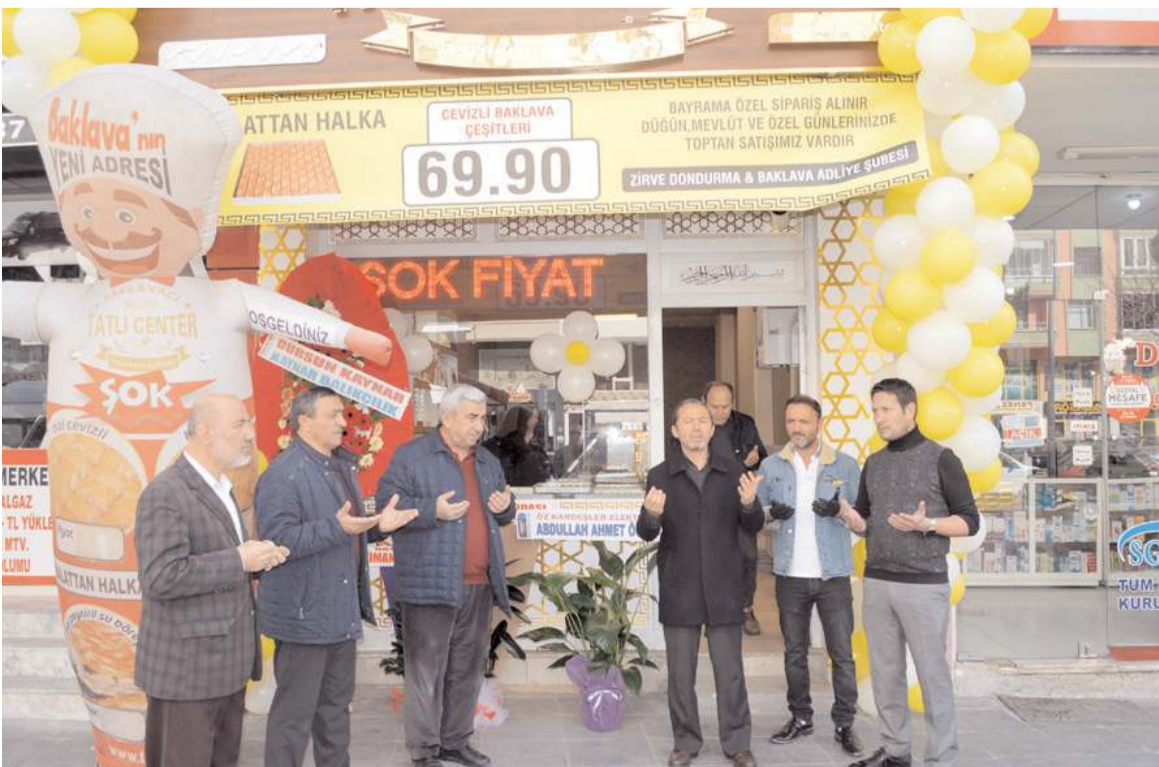
Firma, Tatlı Center'ın Çorum bayiliğini de aldı.