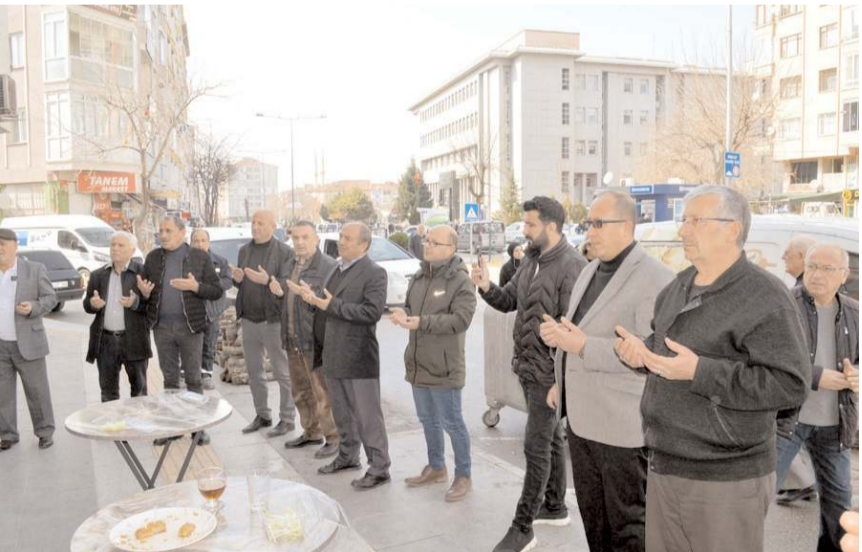
Açılışa davetliler katıldı.