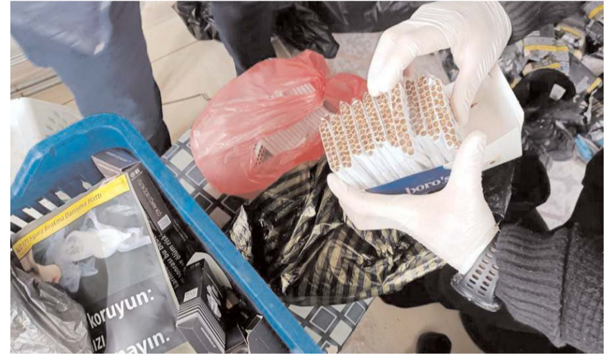
Operasyonda 52 bin 201 makaron ele geçirildi.

Operasyonda gözaltına alınan 3 şüpheli, işlemlerinin ardından sevk edildikleri hakimlikçe adli kontrol şartıyla serbest bırakıldı. (AA)