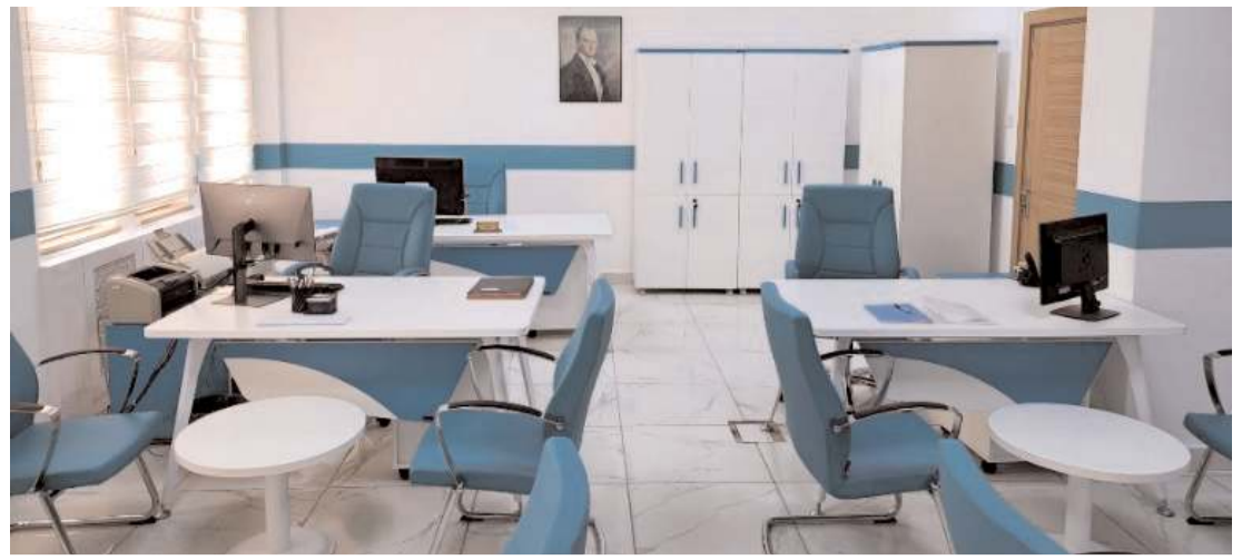
İl Sivil Toplumla İlişkiler Müdürlükleri yeni konseptle hizmet vermeye başladı.