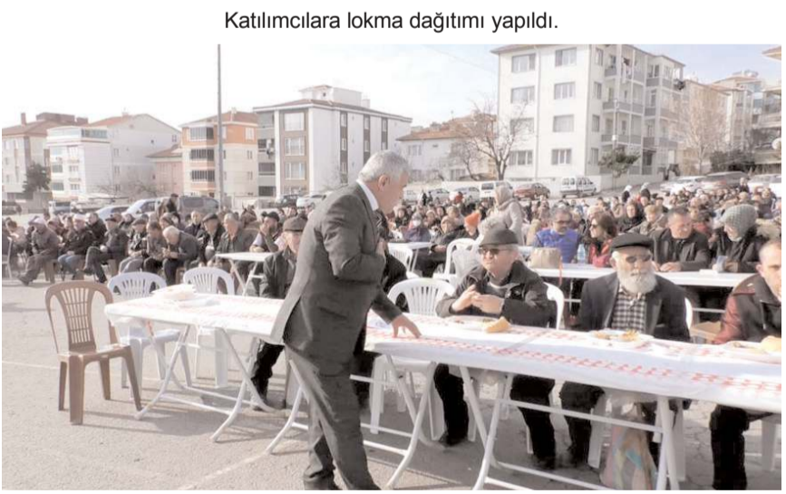
Etkinlik Bahçelievler Mahallesi Cumartesi pazarı alanında yapıldı.