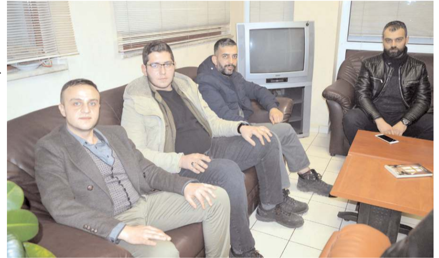
Ziyarete Alperen Ocakları İl Yönetim Kurulu üyeleri de katıldı.

nü'nü erkenden kutluyor, tüm çalışmalarında başarılı diliyorum." dedi.