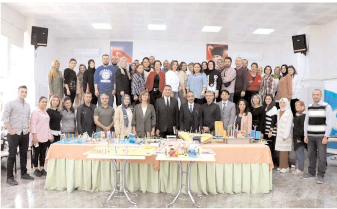
Programın sonunda toplu hatıra fotoğrafı çekildi.