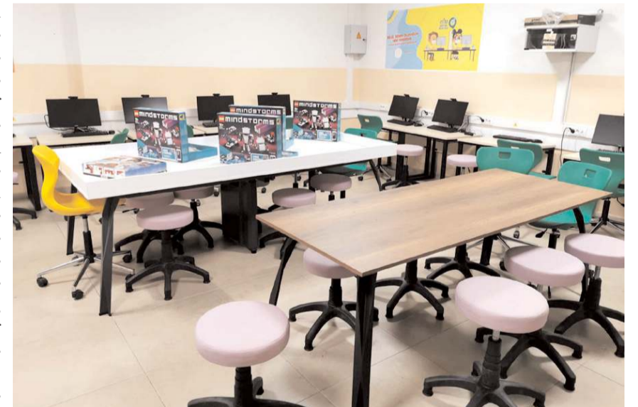
Tasarım-Beceri Atölyeleri, bilim, sanat, spor ve kültür odaklı yapılandırılacak.

1.600.000 TL bütçesi olan DOKAP projesi ile Çorum'da kurulacak atölyelerin tamamından tüm okulların faydalanabileceği belirtildi. (Haber Merkezi)