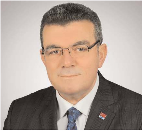
CHP İl Başkanı Ümit Er

TÜİK tarafından belirlenen enflasyon rakamlarının gerçeği yansıtmadığını iddia eden Ümit Er, TÜİK'in açıkladığı enflasyon oranı ve Cumhurbaşkanı Erdoğan'ın duyurduğu yüzde 25'lik memur ve emekli zammına tepki göstererek, insanca yaşayacak, refah düzeyini artıracak bir düzenleme yapılmasını istedi.