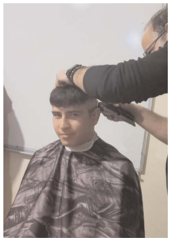
Öğrenciler berberlere teşekkür ettiler.