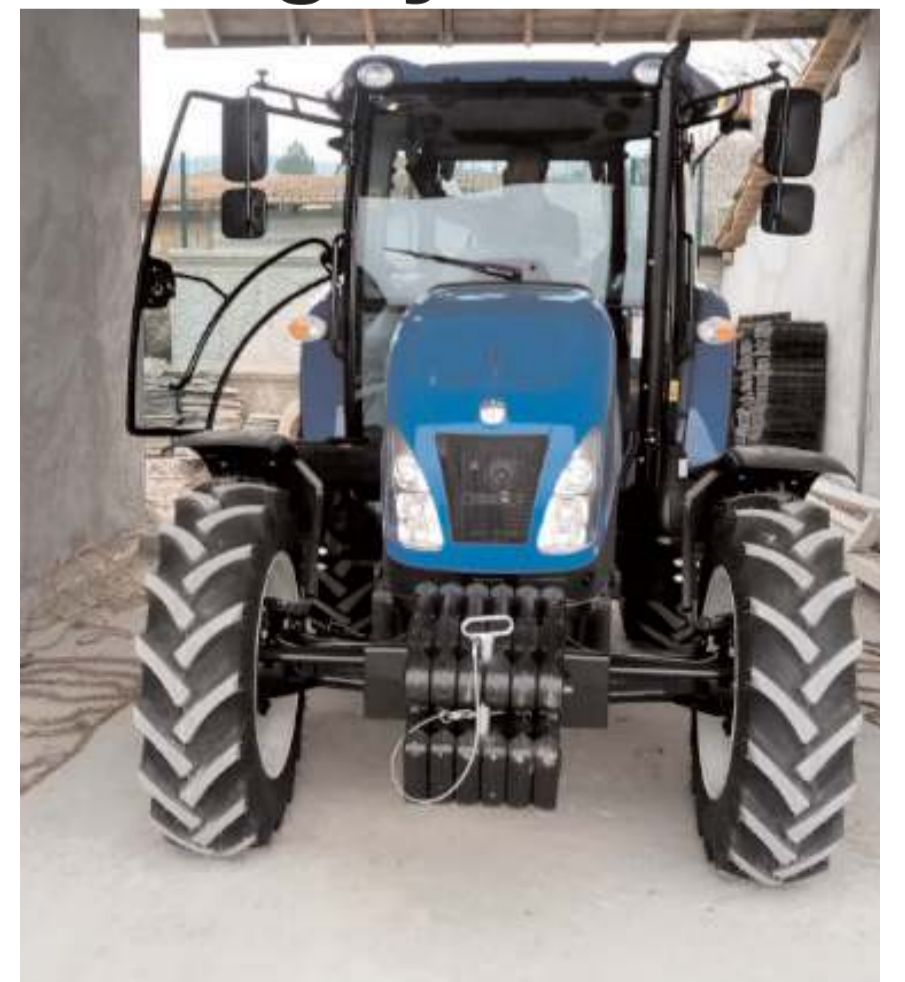
Ortaköy Belediyesi araç filosuna traktör kattı.

Göreve geldiği 2014 yılından bugüne kadar araç filosuna 14 adet sıfır araç kazandırdıklarını belirten Belediye Başkanı Taner İsbir, "Bugün de ilçemiz hizmet ve projelerinde kullanılmak üzere araç filomuzaya bir traktör dahil ettik. İlçemize kazandırılan hizmet, proje ve araçlardan dolayı başta Çevre, Şehircilik ve İklim Değişikliği Bakanımız Murat Kurum olmak üzere, AK Parti Milletvekillerimiz ve İl Başkanımıza ilçe halkım adına teşekkür ediyorum. İlçemize hayırlı ve uğurlu olsun." dedi. (Haber Merkezi)