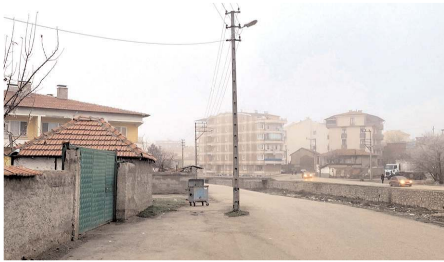
Yol ortasında bulunan direk trafik güvenliğini tehlikeye atıyor.

Elektrik direğinin kaldırılmasını isteyen sürücüler ve bölge halkı, "Yolun ortasında kalan elektrik direği trafiği sıkıştırıyor ve kazalara neden oluyor. Akşam saatlerinde direk neredeyse hiç görünmüyor. Bugün, içerisinde çocukların da bulunduğu bir araç az