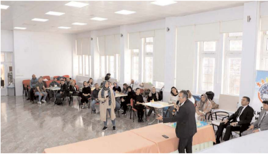
'Matematik Seferberliği Çorum Günleri'nde çeşitli eğitimler gerçekleştirildi.