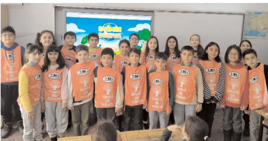
Türkiye'nin biyolojik çeşitliliği hakkında bilgilendirmek amacıyla 365 öğrenciyi eğitim verildi.