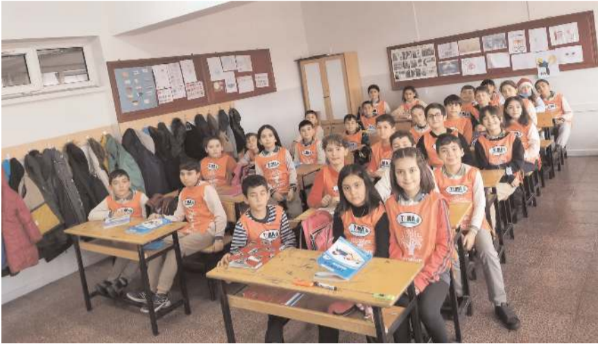
Eğitimler TEMA-Biyolojik Çeşitlilik Projesi kapsamında yapıldı.