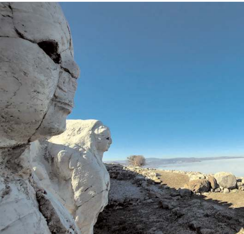
Boğazkale'de sis ve soğuk hava etkili oldu.

Anadolu'nun ilk medeniyetlerinden Hatti ve Hititler'in kültürel mirasına ev sahipliği yapan Çorum'un Boğazkale ilçesinde sis ve soğuk hava etkili oldu.