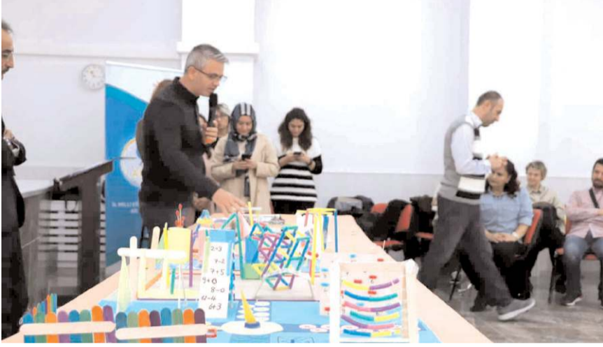
Çalıştay, Bahçelievler Mesleki ve Teknik Anadolu Lisesi'nde yapıldı.