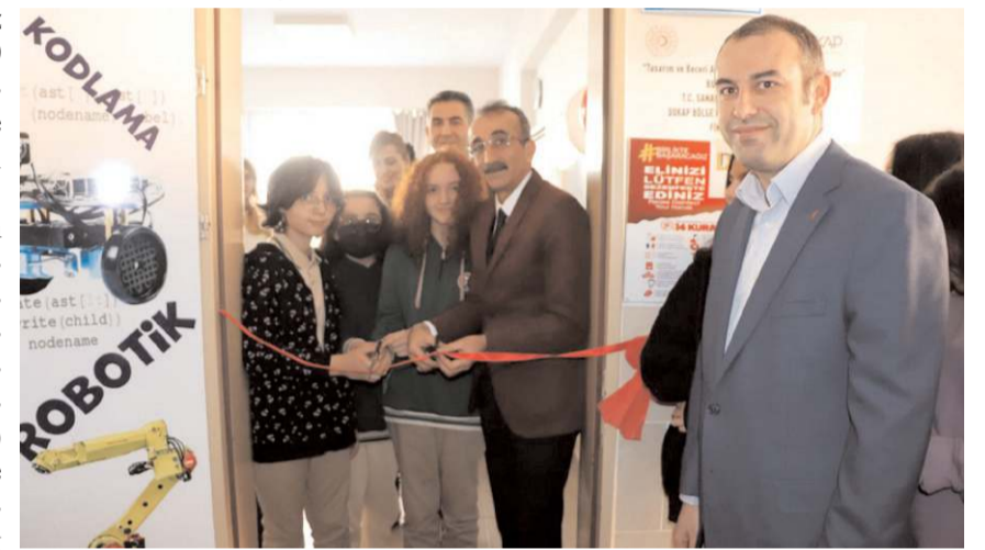
Tevfik İleri Ortaokulu'nda yer alan Robotik Kodlama Atölyesi düzenlenen törenle açıldı.