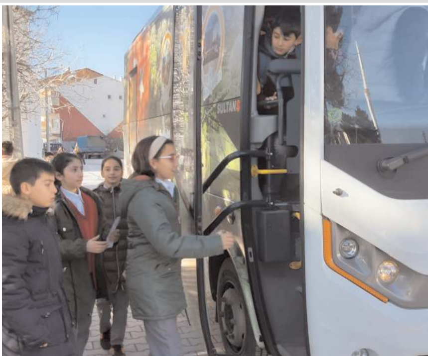
Öğrenciler okullarına belediyenin otobüsü ile ücretsiz gidiyorlar.

İsbir, "Bizler daima kendilerinin yanında olmaya devam edeceğiz, velilerimize ve çocuklarımıza hayırlı ve uğurlu olsun." dedi. (Haber Merkezi)