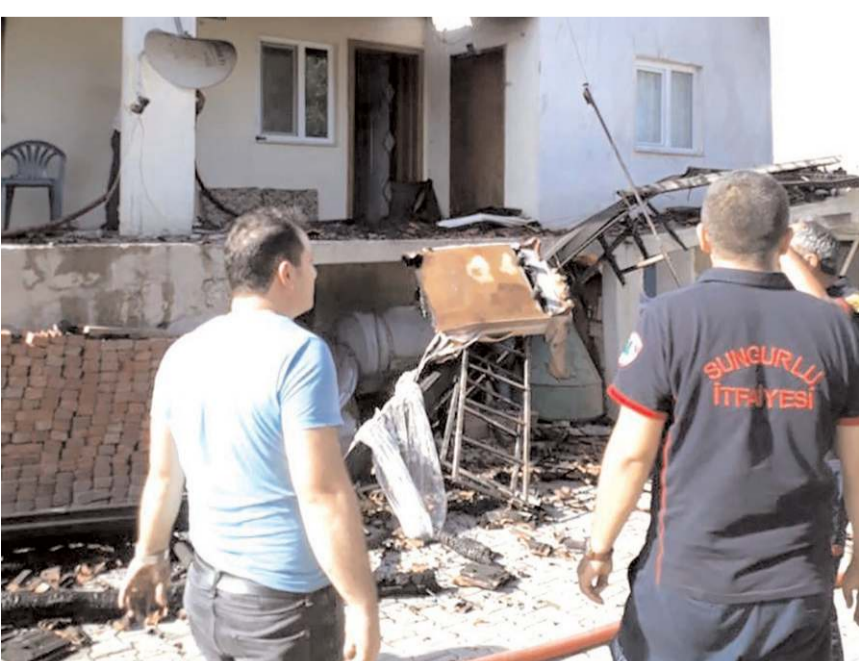
Sungurlu Belediyesi İtfaiye Müdürlüğü ekipleri geçen yıl 31 ev yangınına müdahale etti.