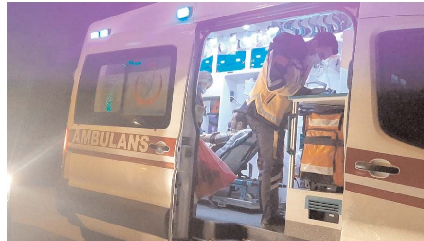
Yaralıları ilk müdahaleyi 112 acil sağlık ekipleri yaptı.