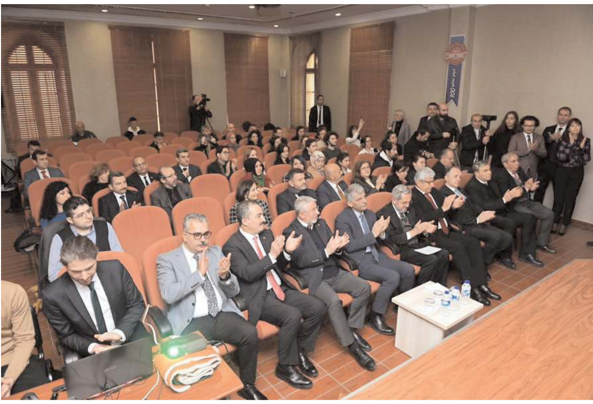
Projenin tanıtım toplantısı Çorum Müzesi konferans salonunda yapıldı.