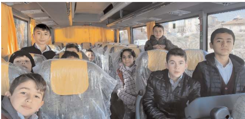
Öğrenciler servis hizmetinden dolayı teşekkür ettiler.