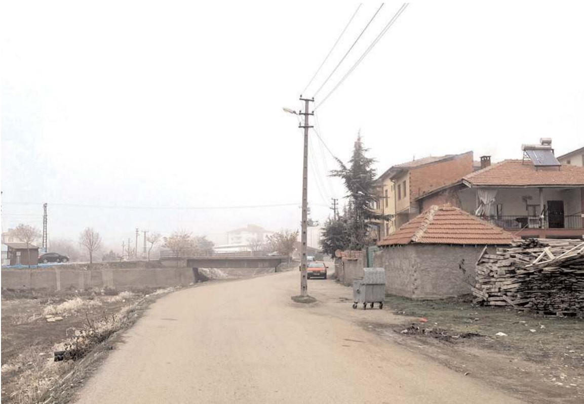
Vatandaşlar yolun ortasında kalan direğin kaldırılmasını istiyor.

liler gereğini yapmadı. Bir facia yaşanmadan konuya çözüm bulunmasını talep ediyoruz" diyerek tepkilerini dile getirdi. (İHA)