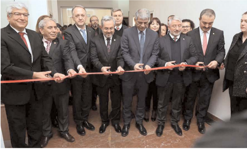
Projenin açılış kurdelesini protokol üyeleri tarafından kesildi.