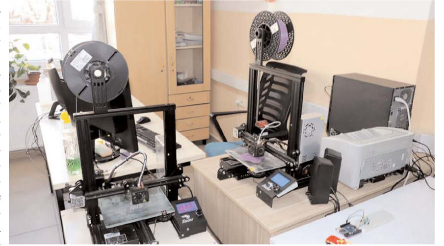
Tasarım-Beceri Atölyeleri'nde 3D yazıcılar bulunuyor.