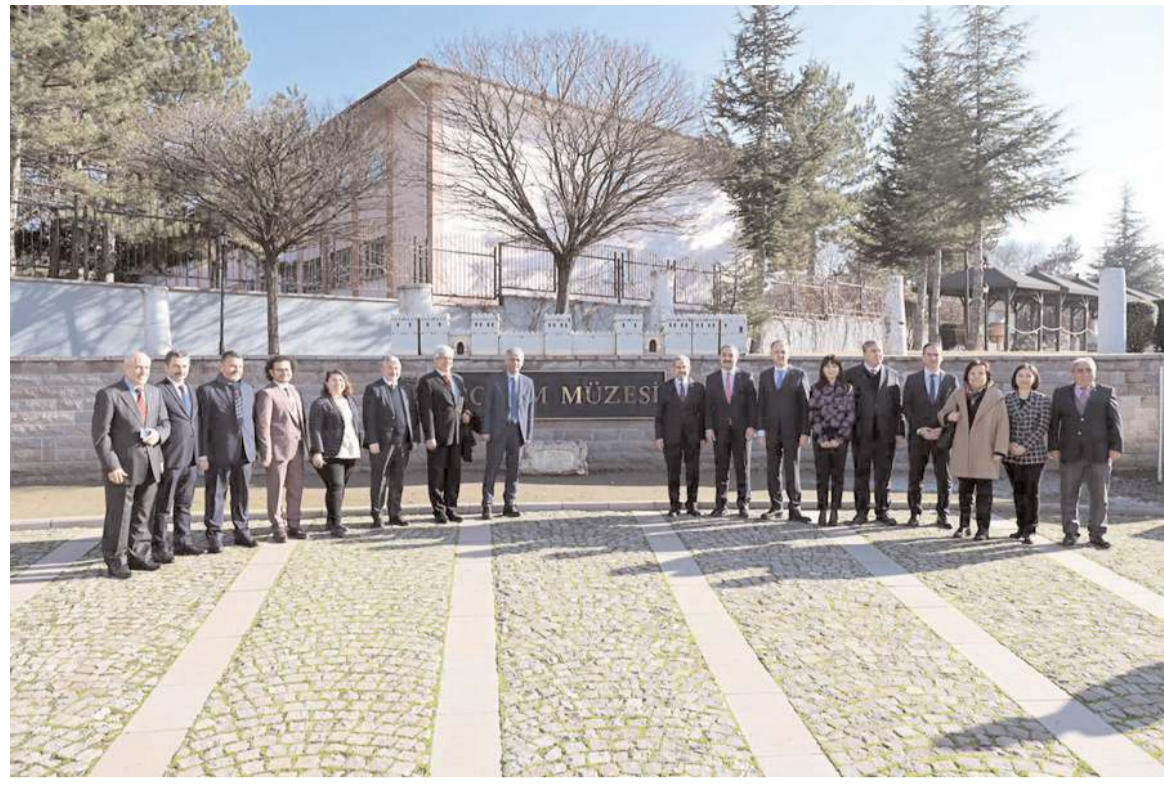
Günün anısına müze bahçesinde fotoğraf çekildi.