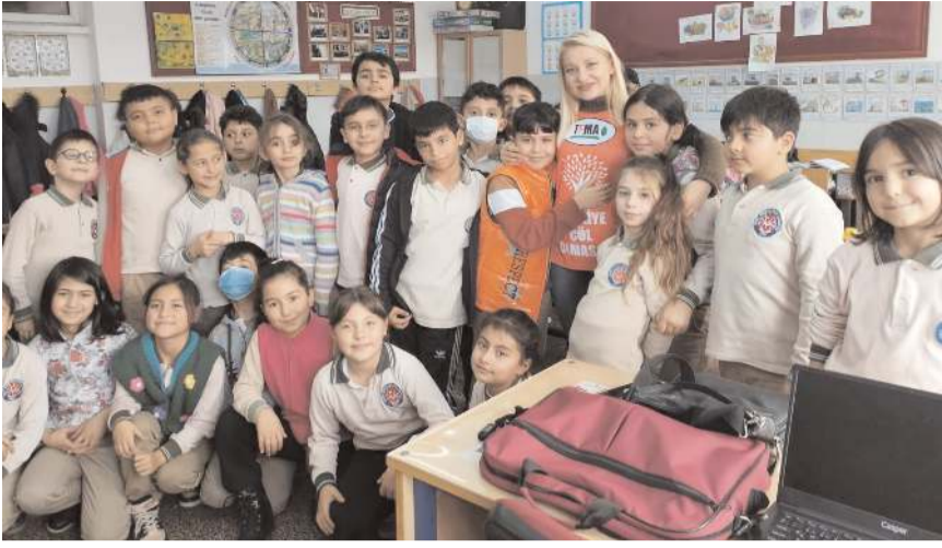
TEMA Vakfı 2022 yılı, Yavru Tema eğitim faaliyetlerini tamamladı.