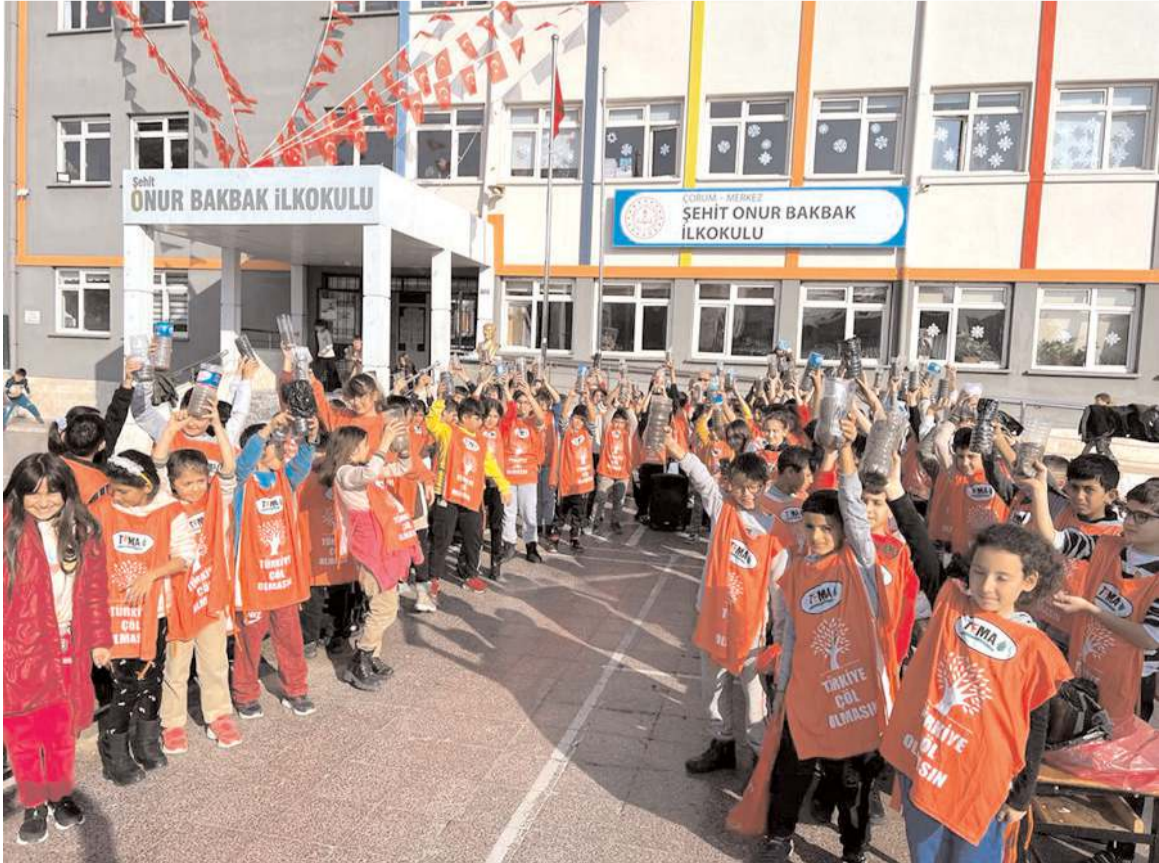
TEMA gönüllüleri rehberliğinde Meşe Palamudu Tüpleme Etkinliği gerçekleştirildi.

Şehit Onur Bakbak İlkokulu, Milli Eğitim Bakanlığı tarafından desteklenen TEMA Vakfı 2022 yılı, Yavru Tema eğitim faaliyetlerini tamamladı.