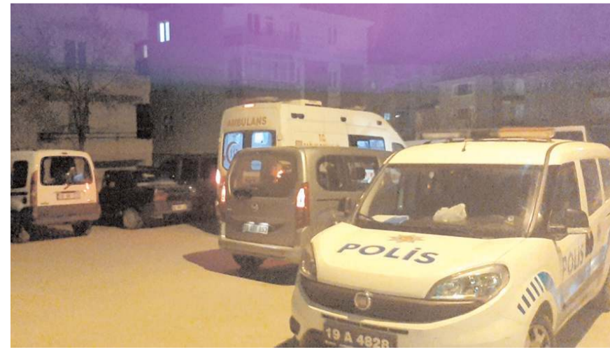
Olay Bahçelievler Mahallesi Bahar 15. Sokak'ta meydana geldi.

Koltuk altından aldığı bıçak darbesiyle yaralanan Arda Ç, buradaki müdahalenin ardından ambulansla Hitit Üniversitesi Erol Olçok Eğitim ve Araştırma Hastanesi'ne sevk edildi.(AA)