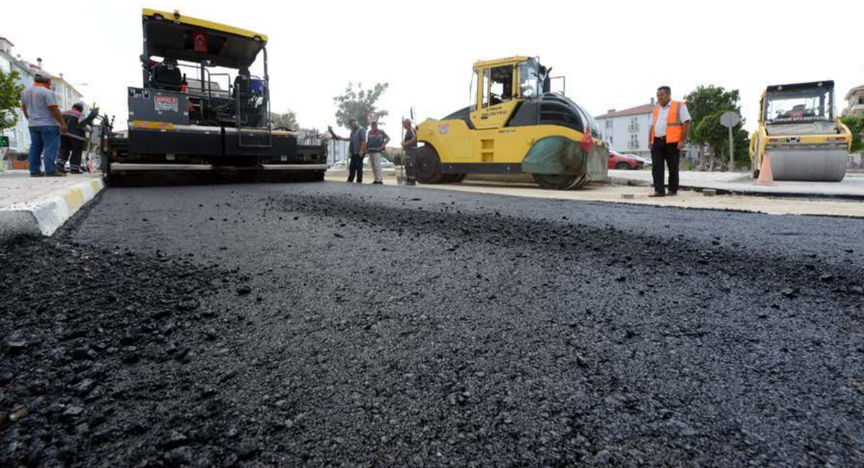
Altyapı çalışmalarının ardından 650 ton asfalt serimi yapıldı.

Çorum Belediyesi ekipleri şehrin farklı bölgelerinde altyapı ve asfalt çalışmalarına hız kesmeden devam ediyor. Fen İşleri Müdürlüğü ekiplerince Kapaklı 1. Cadde'de başlatılan altyapı çalışmaları sonrasında asfalt serimi gerçekleştirildi.