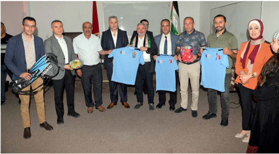
Kültür Merkezinde eğitim gören öğrencilere eğitim setleri ve spor malzemeleri hediye edildi.