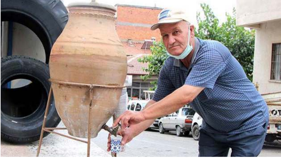
Perşembe Pazarı girişinde içinde içme suyu bulunan küpten ilçe halkı 42 yıldır su içiyor.

Neredeyse yarım asırdır devam eden iyilik hareketini yorumlayan ilçe halkı, yıllardır görünümü ile gözlere barındırdığı hassasiyet ile de gönüllere hitap eden, bu güzel küpün sahibini ve dahası bu güzel geleneğin temsilcisini, bu vesile ile bir kez daha saygı ve rahmetle andıklarını ifade ettiler. (Haber Merkezi)