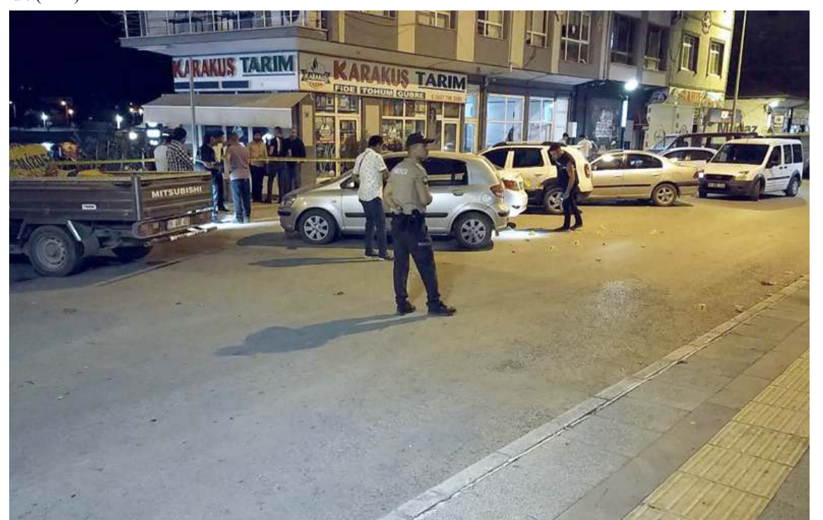
Olayın ardından cadde bir süre trafiğe kapatıldı.