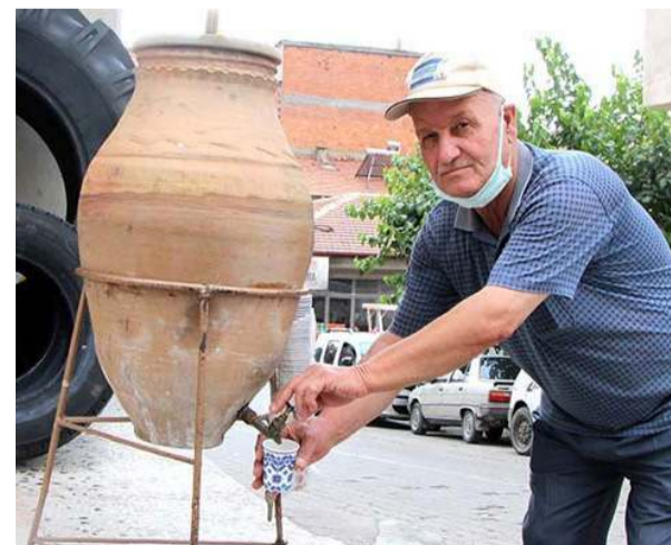
Perşembe Pazarı girişinde içinde içme suyu bulunan küpten ilçe halkı 42 yıldır su içiyor.

Osmancık'ta meydana gelen olayda amca çocukları arasında çıkan tartışmada kan aktı. * HABERİ 7'DE