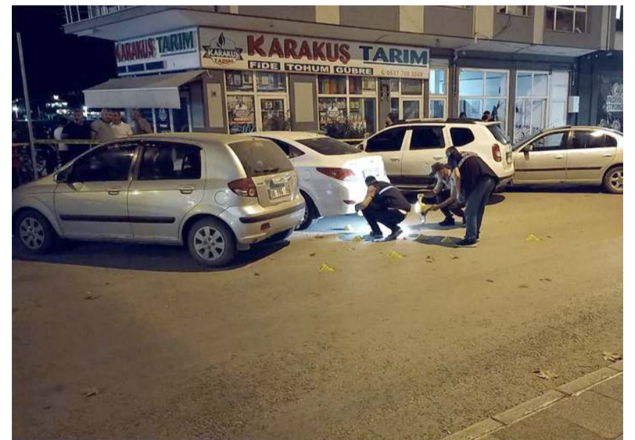
Seken kurşunlardan bazıları ise caddedeki araçlara isabet etti.