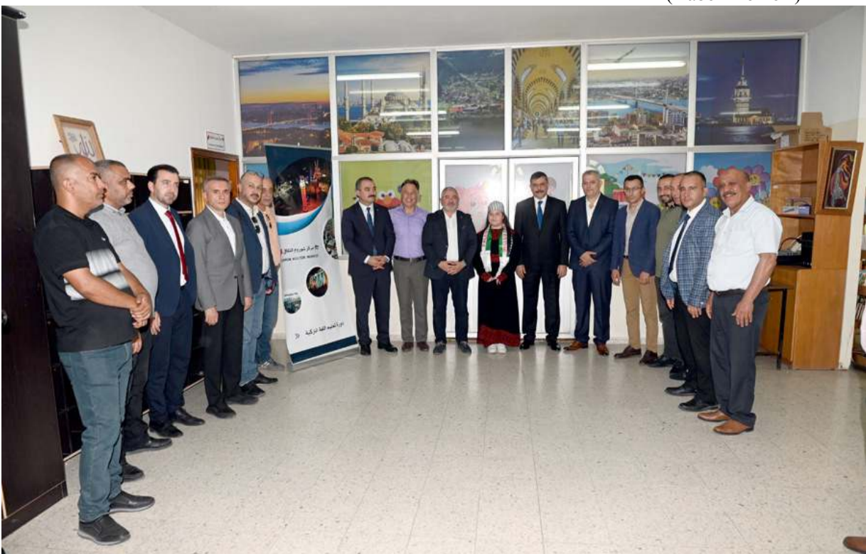
Açılışın ardından hatıra fotoğrafı çekildi.