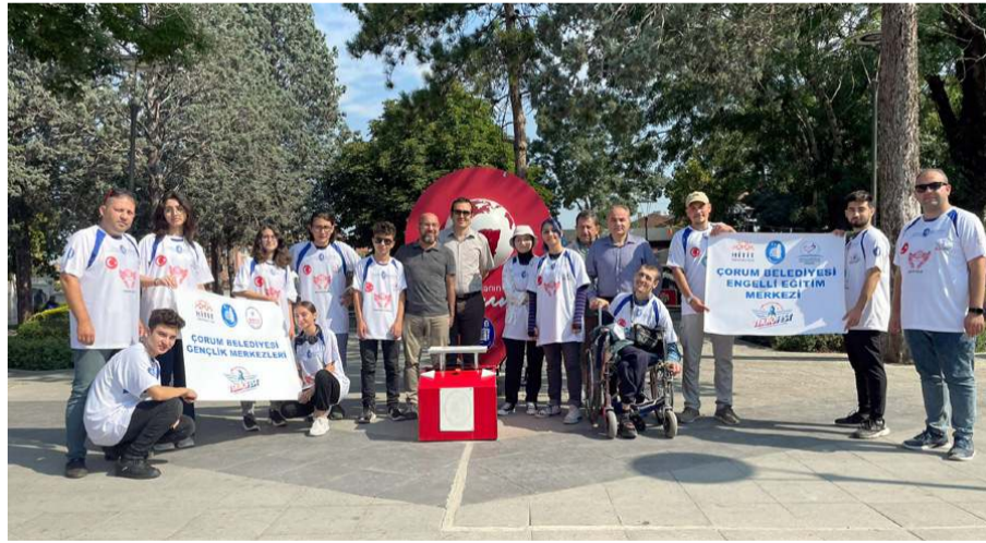
Trabzon'a hareket öncesinde hatıra fotoğrafı çekildi.

Çorumlu genç mucitler Trabzon'da gerçekleşecek olan TEKNOFEST yarışmalarında ilimizi temsil edecek. Çorum Belediyesi Buhara Gençlik Merkezi ve Engelli Eğitim Merkezi adına TEKNOFEST final yarışmalarına katılacak olan genç mucitler yola çıktı. * HABERİ 7'DE