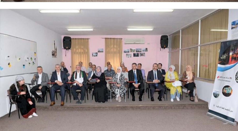
Çorum Kültür Merkezi'nde gençlere Türkçe öğretilcek.