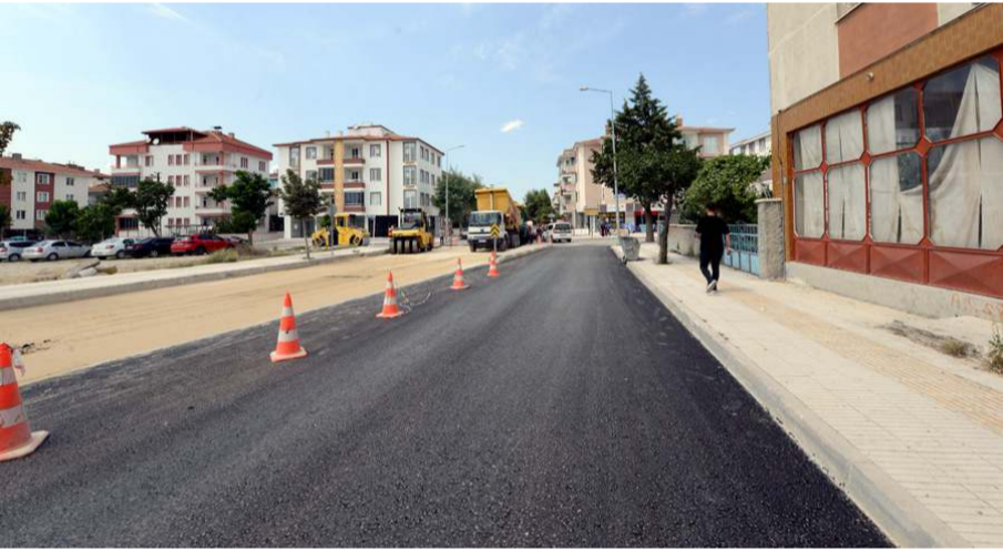
Yolda 2 bin 150 m3 kazı çalışması gerçekleştirildi.