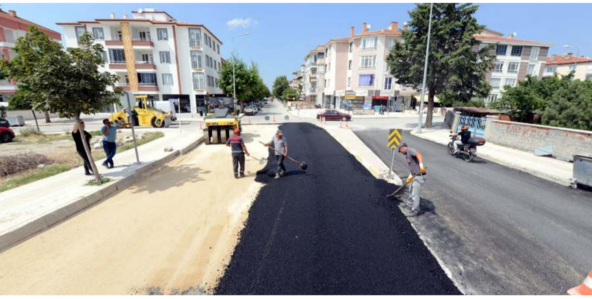
Kapaklı 1. Cadde'de ilk olarak kanalizasyon, içme suyu ve yağmur suyu hatları yenilendi.