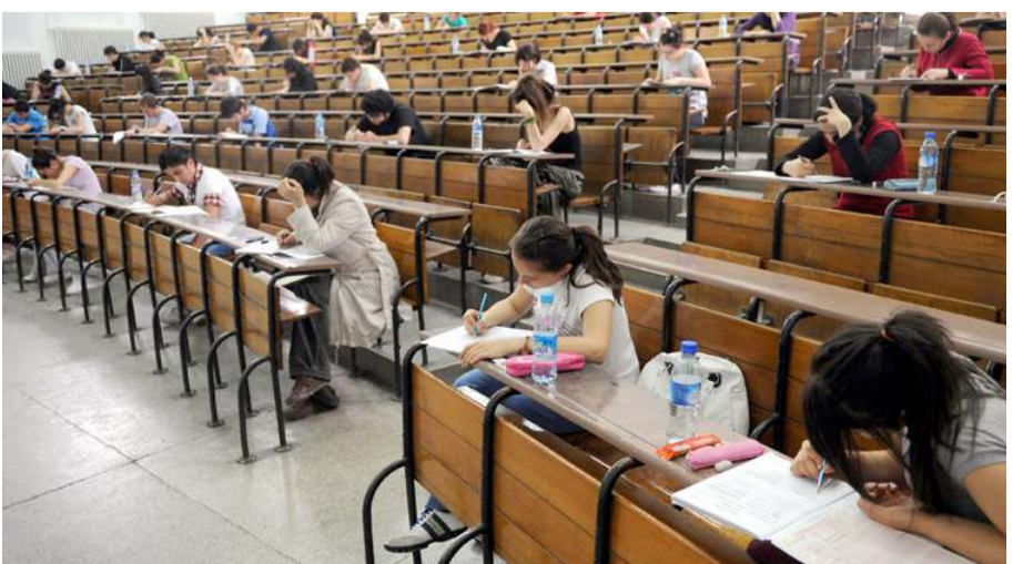
Yeni KPSS takvimi 17 Eylül'de başlayacak.

Devlet Denetleme Kurulu (DDK) Başkanı Yunus Arıncı da yaptığı yeni açıklamada, "Kamu vicdanını rahatlatmak ve hiçbir vatandaşımızın kafasında soru işareti kalmaması adına 31 Temmuz'da gerçekleşen KPSS'nin iptaline lüzum görülmemiştir. Süreçle ilgili Devlet Denetleme Kurulu olarak şeffaf bir şekilde vatandaşlarımızı bilgilendirmeye devam edeceğiz" ifadelerini kullandı.