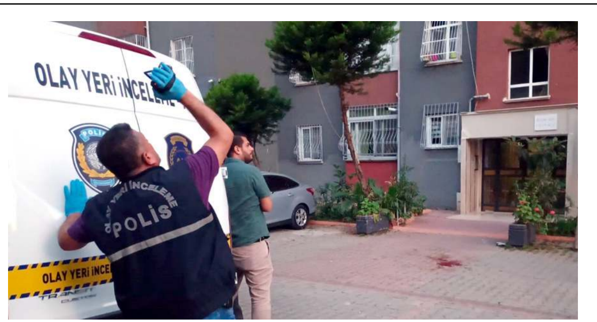
Olay Kale Mahallesi'nde meydana geldi.