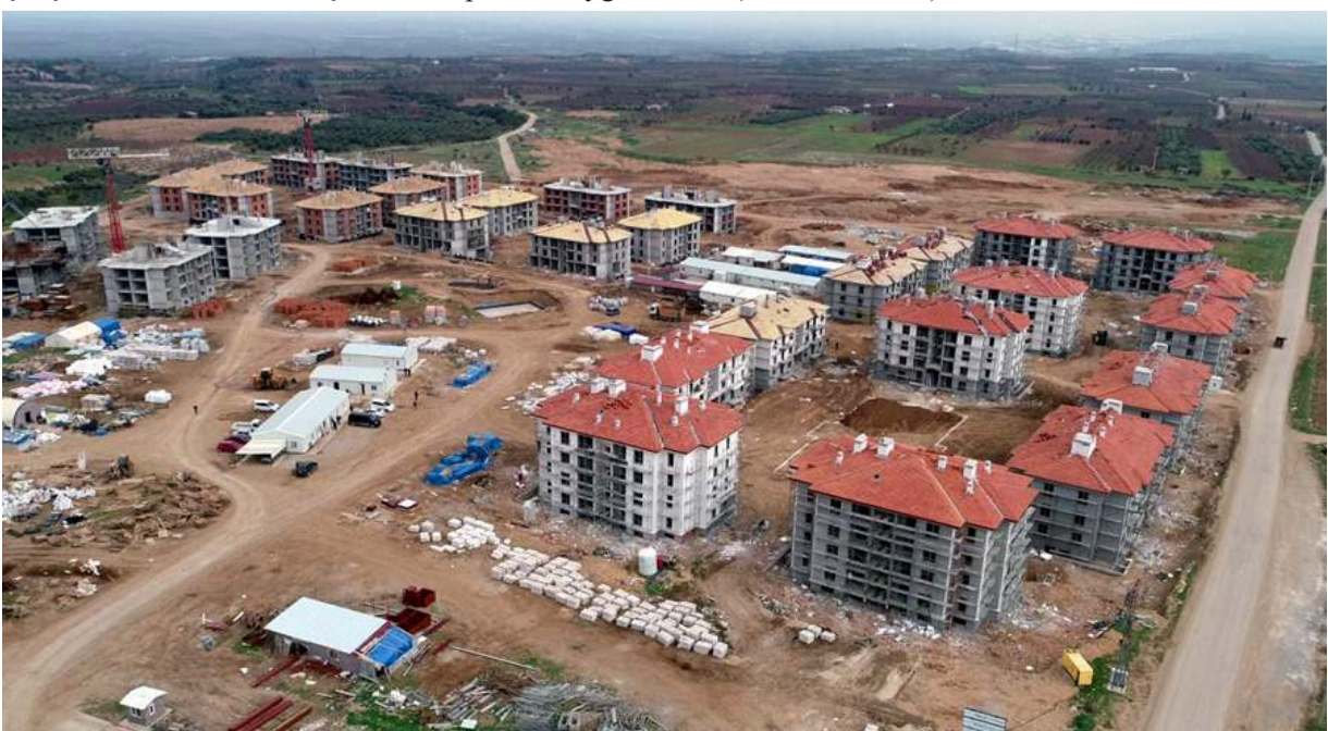
TOKİ, 775 şantiyede toplam 144 bin konut ile diğer donatıların inşaatına devam ediyor.

TOKİ, 220 farklı alanda yeni konut projelerinin ihalesini, 66 bin konutun da satış sözleşmesinin gerçekleştirilmesini de bu yıl yapacak, 200 sektörün üretimine, ekonomiyi ve istihdama katkı sağlayacak. (Haber Merkezi)