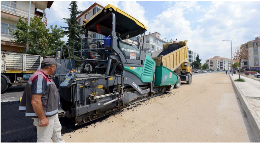
Alt yapı çalışmalarının tamamlanmasının ardından asfalt serme işlemi başladı.