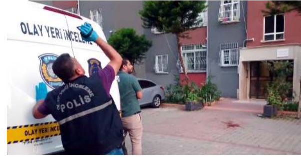
Olay Kale Mahallesi'nde meydana geldi.