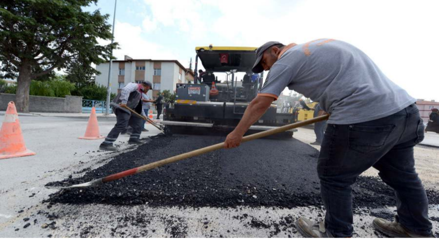
Yolda 1.900 ton stabilize 9 bin 800 ton mekanik serimi ile kazı ve dolgu çalışması yapıldı.