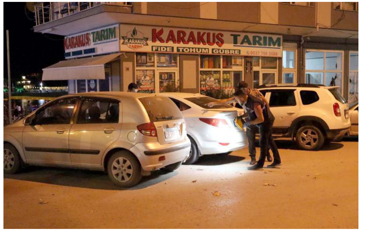
Olay, Kızılırmak Mahallesi'nde meydana geldi.