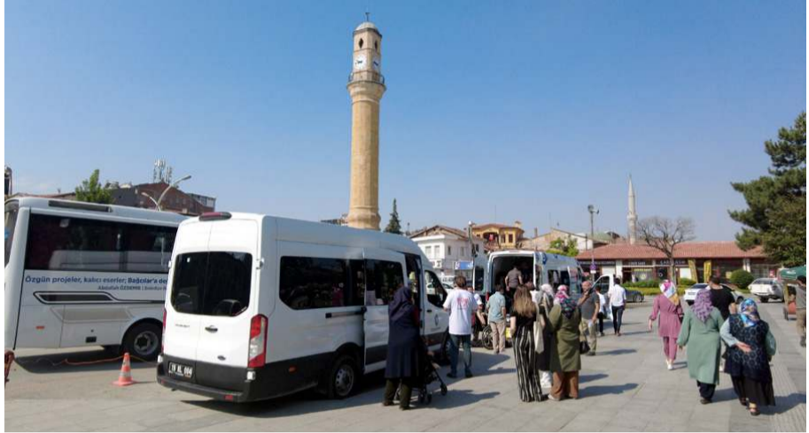
Genç mucitler Saat Kulesi yanından minibüslerle Trabzon'a gittiler.