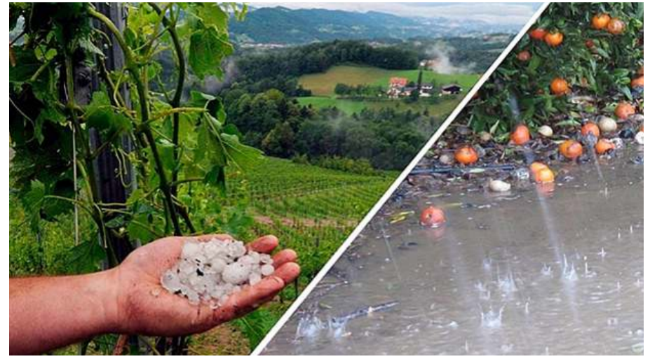
Proje Konya'nın Cihanbeyli, Karatay ve Kadınhanı ilçelerinde pilot olarak uygulandı.

mandalina, portakal, altıntop ve bazı limon çeşitleri ile üzümde zarara yol açması, TARSİM'in kapsamının genişletilmesini gündeme getirdi. Yapılan çalışmalar sonucunda, "sıcak hava zararı teminatı" 2021 yılında TARSİM kapsamına alındı" dedi.