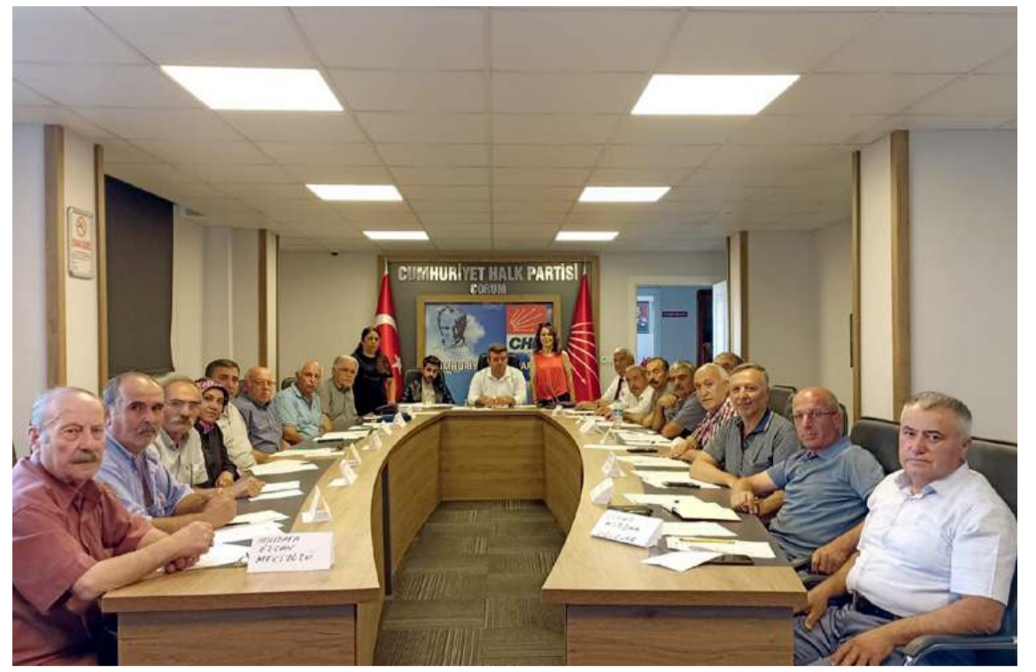
Eğitime merkez ilçe yetkilileri ile ilçe başkanları katıldı.