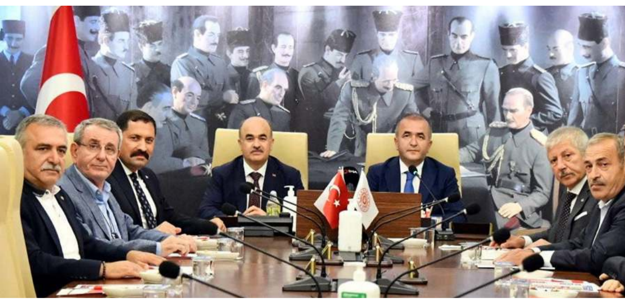
OKA Yönetim Kurulu Toplantısı Samsun'da yapıldı.