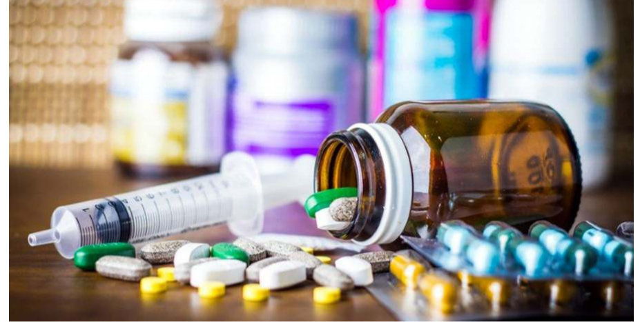
Temmuz'da ilaçlarda yüzde 18,66 fiyat artışı yaşandı.

TÜİK'in tüketici fiyatları endeksine göre, temmuzda aylık bazda fiyatları en fazla artan ürünlerle