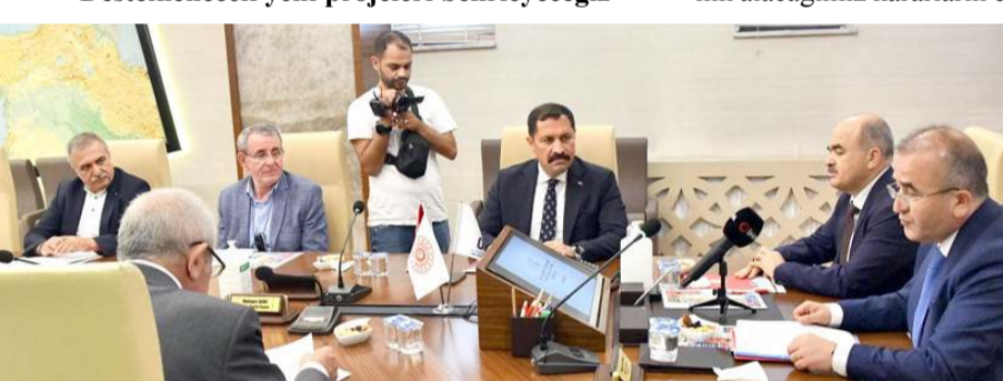
Toplantıda gündem maddeleri görüşüldü.

"Desteklenecek yeni projeleri belirleyeceğiz"