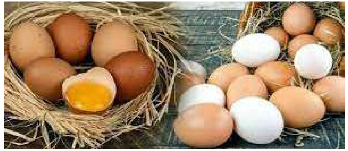
Temmuz'da yumurta ve yumurtayla ilgili ürünlerin fiyatı yüzde 16,54 arttı.

"Ortaya çıkan rezalet ne ilktir ne de ÖSYM içindeki bir grup çıkar çevresinin kötü niyetiyle açıklanabilir. Sorun eğitim ve sınav sistemindedir. Her yıl hatta bir kısmı yılda birkaç kez de yapılabilen YGS, LYS, ALES, KPSS, TUS gibi lise, üniversite ve kamu kurumlarına yerleştirme sınavları ile akademik kariyer ve görevde yükselmelere dair sınavlarda her dönem yolsuzluk, usulsüzlük iddiaları olmuştur. Sorumlular, üzerinin kapatılmasının mümkün olmadığı durumlarda, kamuoyu baskısıyla, zoraki açılan soruşturmalarda adeta durumu idare etmeye çalışmışlar ve her türlü yolsuzluğun zeminini korumuşlardır. 2016 yılında liselileri ayaklandıran şifreleme rezaleti hala hafızalardadır. Sınav yolsuzlukları başlıyla arama motora girildiğinde ÖSYM tarafından yapılan her sınav için yer alan şaibeli durumlar ve ciddi usulsüzlük dökümleri alınabilir. KPSS sınavında yaşanan fiyaskonun sorumluları başta ÖSYM başkanı olmak üzere hesap vermelidir. Ancak sorunun kaynağı sadece eğitim bürokrasisinden birkaç kişi değildir. Eğitim sistemi her bakımdan sorumludur; çeşitli uzmanlıklara yerleştirme, akademik görevler için başta eleme ve seçme olmak üzere uygulanan yöntemler sorunludur. Üniversitelere, liselere yerleştirme yöntemleri sorunludur ve yanlıştır. ÖSYM başına başına sorunludur ve sınav sisteminde tekel olmasının da getirdiği avantajlarla sınavlar halkı soymanın aracı haline gelmiştir." (Haber Merkezi)