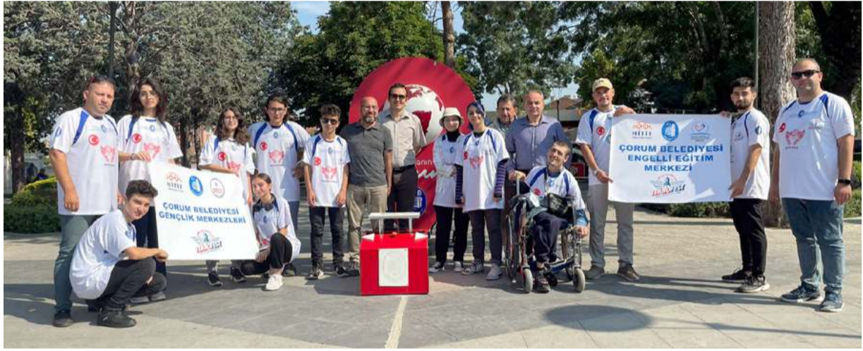
Trabzon'a hareket öncesinde hatıra fotoğrafı çekildi.