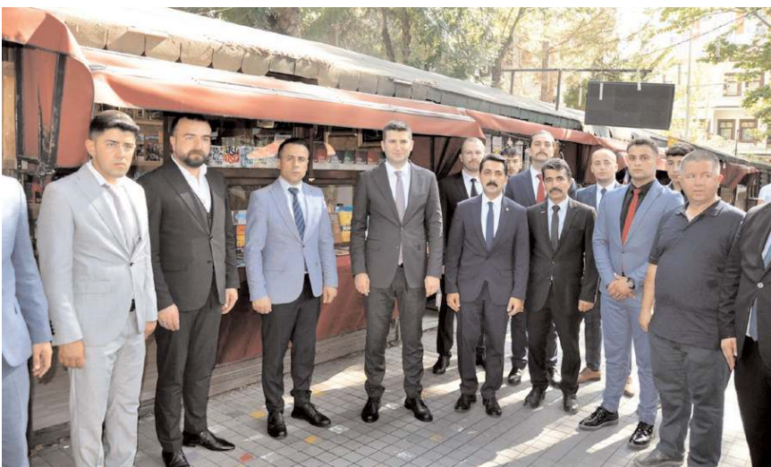
Açılışın ardından hatıra fotoğrafı çekildi.