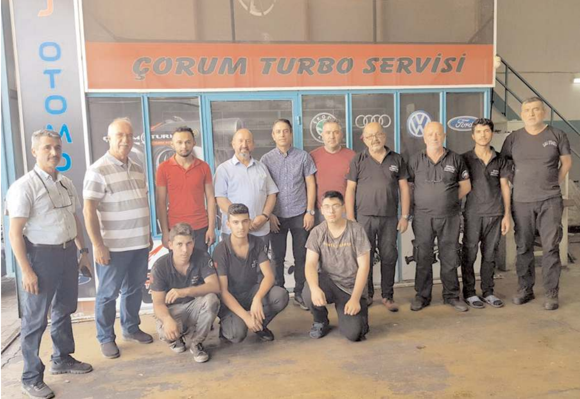
Ziyaretlerin anısına fotoğraf çekinildi.