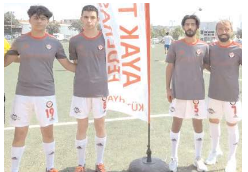
Ayak Tenisi Türkiye Şampiyonasında mücadele eden Çorum takımı