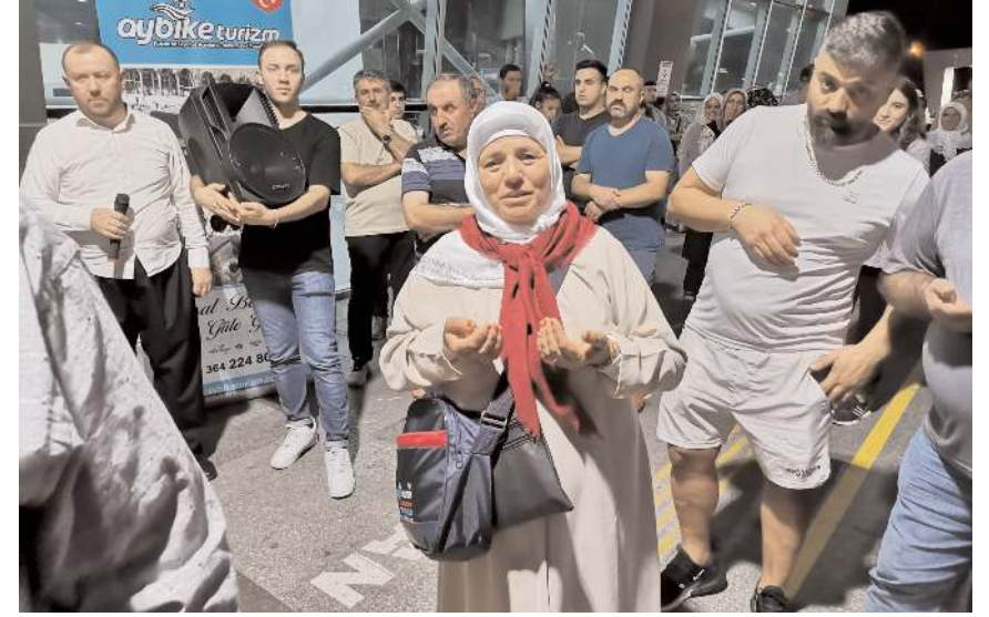
Umreciler dualarla kutsal topraklara uğurlandı.

İlahilerle başlayan uğurlama programında Kur'an-ı Kerim okundu. Umre kafilesi yapılan duanın ardından kutsal topraklara yolcu edildi. Duygulu anların yaşandığı uğurlama programına umrecilerle birlikte yakınları da katıldı.