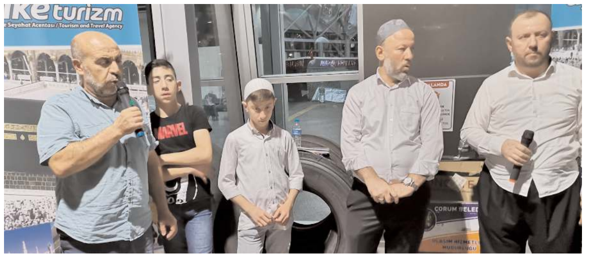
Aybike Turizm'in umre kafilesi için uğurlama programı yapıldı.