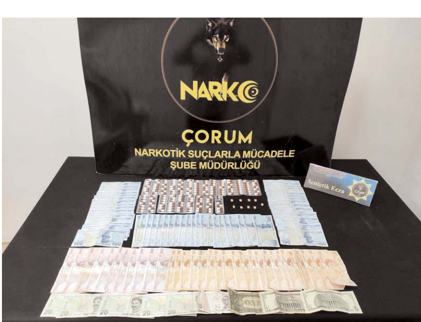
Operasyonda çok miktarda uyuşturucu madde ele geçirildi.

satıcılarına yönelik düzenlenen operasyonda bir kişi suçüstü yakalandı.