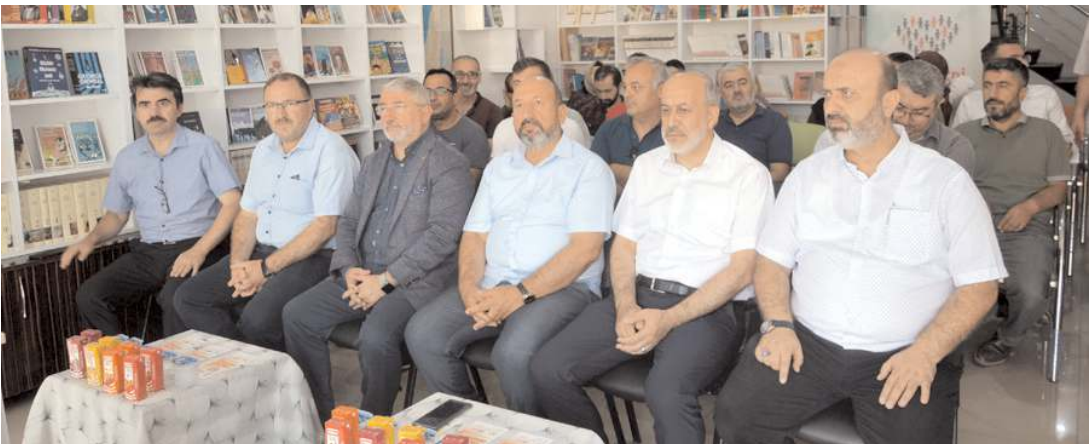
GÜL-DER'in "Gönülleri Onarıyoruz" projesinin açılış programı Cumartesi günü gerçekleştirildi.