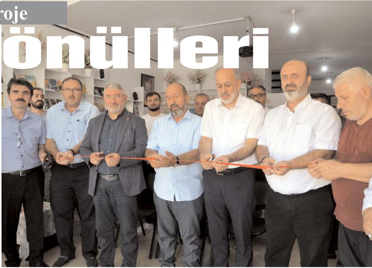
Projenin açılış kurdelesini protokol üyeleri kesti.