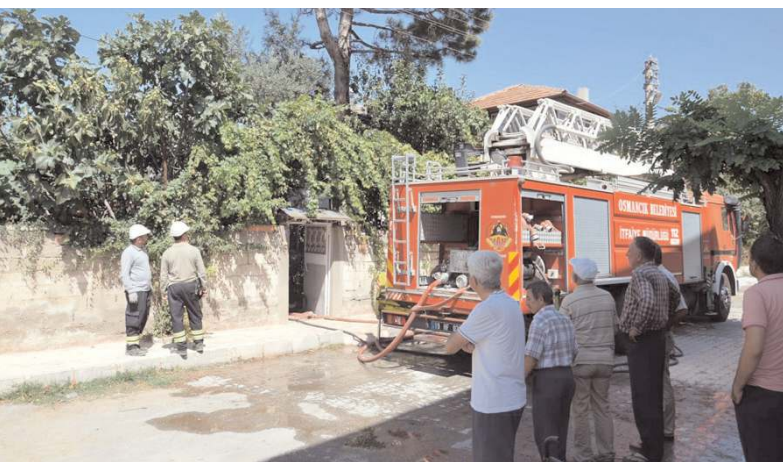
Olay Yeşilçatma Mahallesi Bülbül Sokakta bulunan bir evde meydana geldi.

Siyasi kariyerinde seviyesiz üslubu ve lakayt tavırları ile gündemi işgal eden bu haddini bilmez müptezele çağrımız, İslam tarihi ile fazla haşır neşir olmaması, peşine taktığı 40 Maocu ile Çin ve Rusya şakşakçılığına devam etmesidir. Aksi takdirde contalar yakması içten bile değildir."