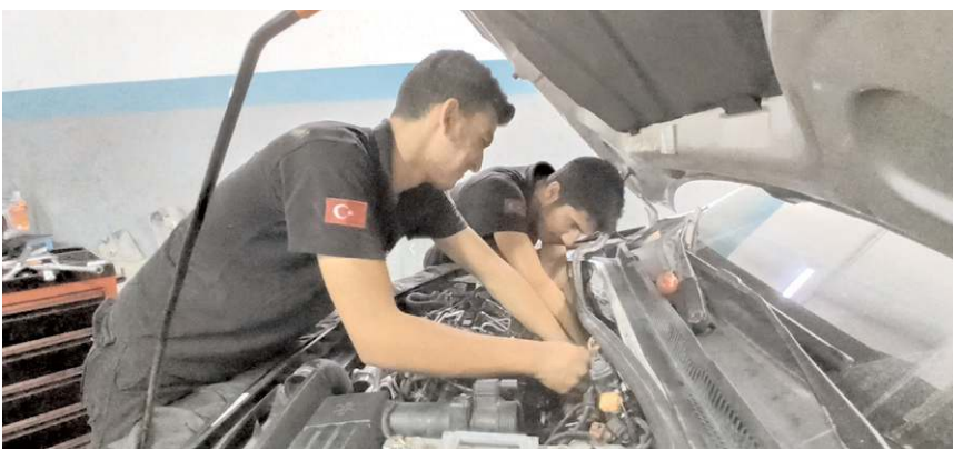
Mesleki eğitimde yapılan düzenleme 9,10 ve 11. sınıf öğrencilerinin asgari ücretin en az yüzde 30'unu, 12. sınıf öğrencilerinin asgari ücretin yarısı kadar maaş almasını sağlıyor.