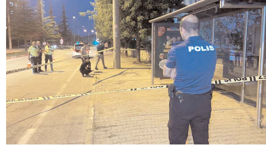
Olay Bursa'nın İnegöl ilçesinde meydana geldi.