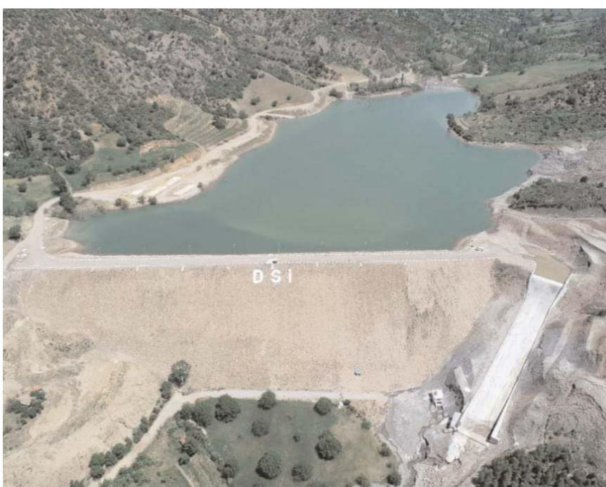
Projelerin hayata geçmesi ile birlikte köylerin içme suyu, taşkın ve tarımsal sulama sorunları çözüme kavuşacak.