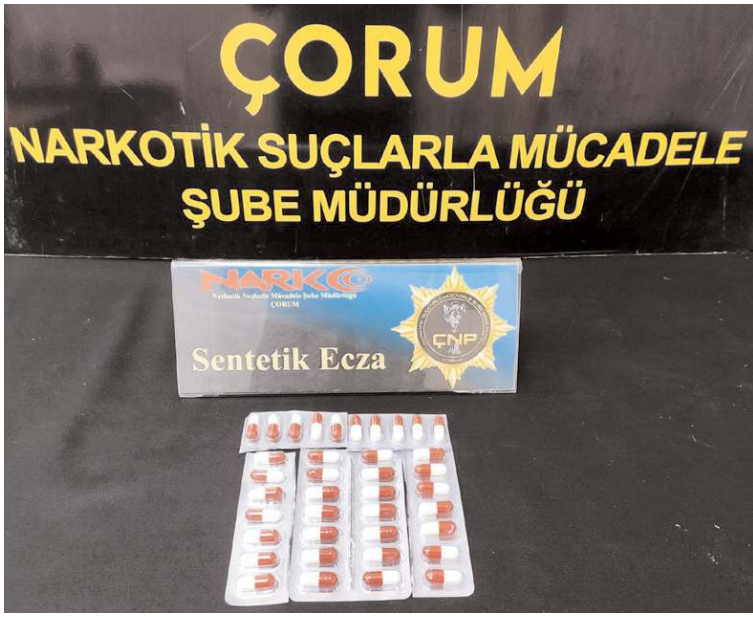
Operasyonda 38 adet sentetik ecza maddesi hap ele geçirildi.

Çorum Emniyet Müdürlüğü, Narkotik Suçlarla Mücadele Şube Müdürlüğü ekipleri tarafından sokak satıcılarına düzenlenen operasyonda 2 kişi suçüstü yakalandı.