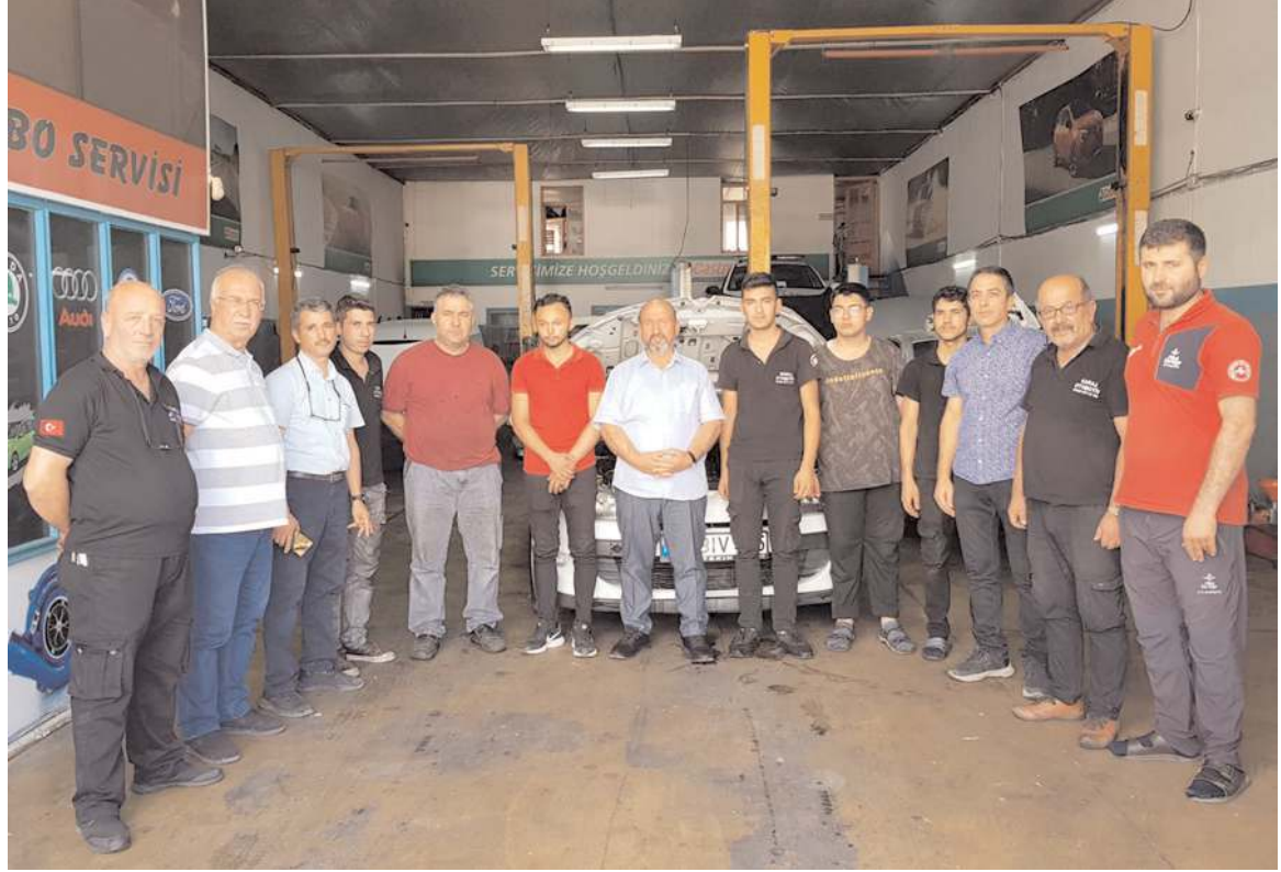
AK Parti Çorum Milletvekili Erol Kavuncu, sanayiye iş başı eğitimine katılan sanat okulu öğrencilerini çalıştıkları işyerlerinde ziyaret etti.

"Öğrencilerimiz şimdi hem ustalarından meslek öğreniyor hem de lise diploması