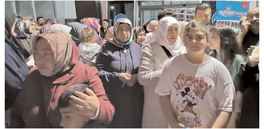
Törende duygulu anlar yaşandı.