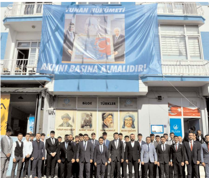
Ziyaretin ardından toplu hatıra fotoğrafı çekildi.

DEFTER ÇEŞİTLERİ ÇANTA ÇEŞİTLERİ KIRTASIYE ÇEŞİTLERİ A'DAN Z'YE SORU BANKALARI TÜM KİTAP ÇEŞİTLERİ NE ALIRSAŖ AL YARISINI ÖDE