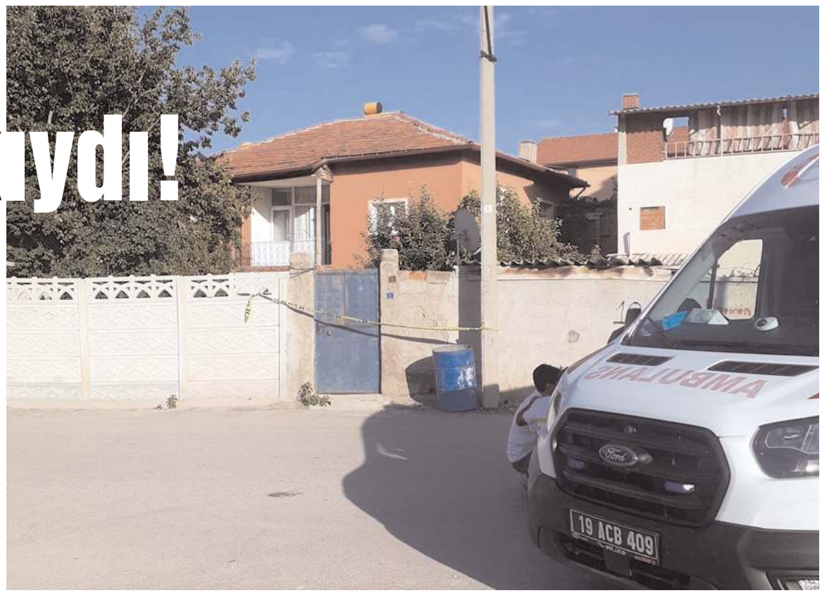
Olay Alaca'da yaşandı.