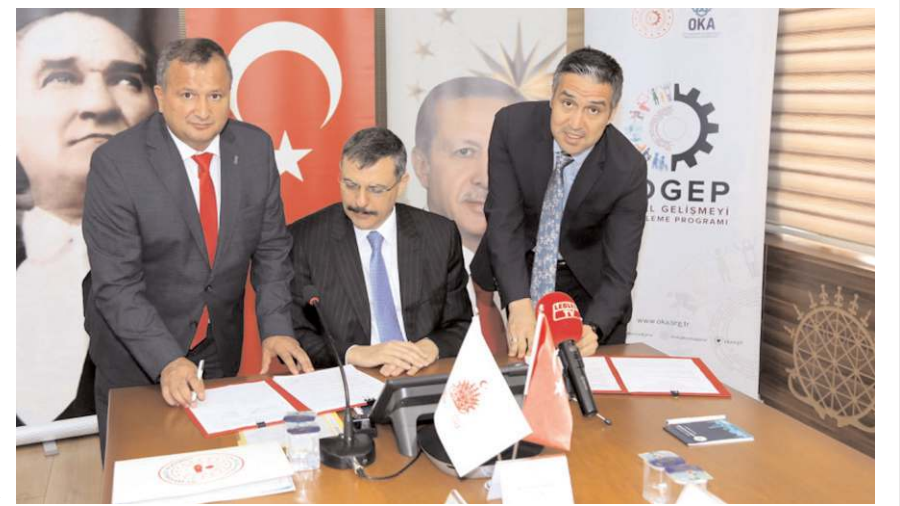
Projenin imzaları atıldı.

Çorum Belediyesi, Hitit Üniversitesi, ÇESOB ve İl Özel İdaresi'nin proje paydaşları olduğunu ve fizibilite raporunun hazırlanması ile birlikte Çorum'a dev bir tesis kazandırmayı hedeflediklerini kaydeden Başkan Uzun, odaları tarafından hazırlanan