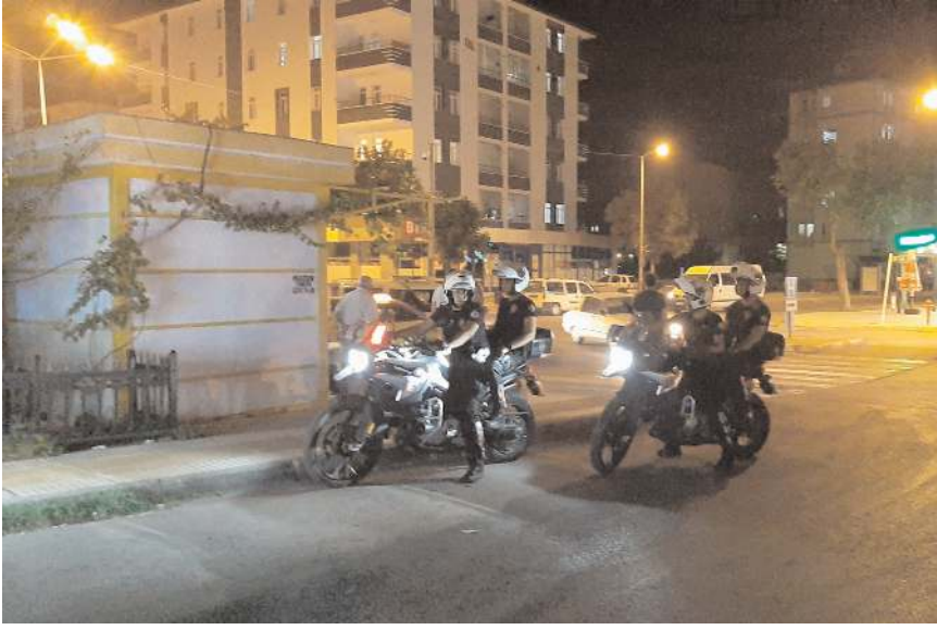
Olay Rüstem Eren Parkı'nda meydana geldi.

Çorum'da bıçakla yaralanan iki kişi hastaneye kaldırıldı.