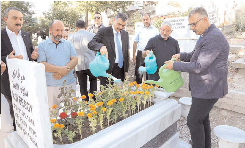
Anma törenine protokol üyeleri de katıldı.