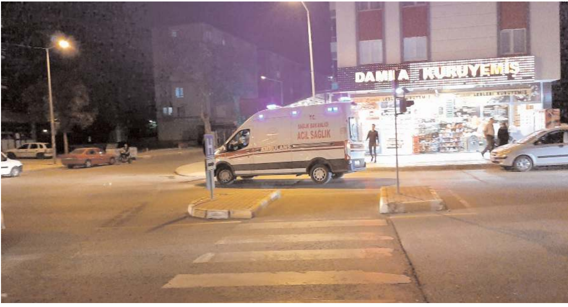
Yaralılar Ö.Ö. ve H.K.'ya ilk müdahaleyi 112 acil ekipleri yaptı.

Polis, olay yerinde düşürdüğü cüzdanından kimliği belirlenen saldırgan E.B'nin yakalanması için çalışma başlattı.(AA)