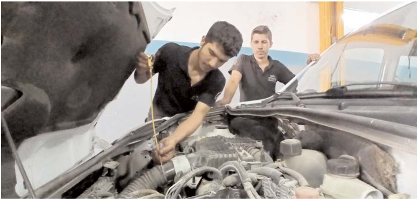
Türkiye'nin önemli bir problemi haline gelen ara eleman açığının yeni düzenlemelerle çözülmesi hedefleniyor.