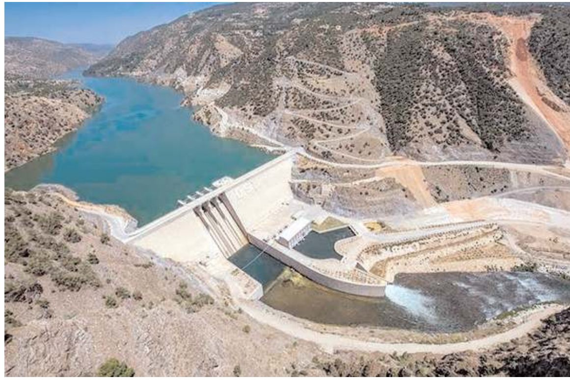
Yeni gölet projeleri hayata geçirilecek.

rum Barajı Mansabı, Koçhisar Barajı 2. Kademeye İçmesuyu Arıtma Tesisi, Merkez Dağkarapınar Göleti, Obruk Dutludere Sulaması İkmal, Şeyhmustafa Göleti İkmal, Serban Göleti, Aşdağul Göleti, Seydim Köyü Taşkın Koruma, Büyük Düvenci Köyü Taşkın Koruma, 5. Bölge Küçük Depolama Tesisi, Alaca Küçükçukurka Göleti, Bayat Çayı İsla-