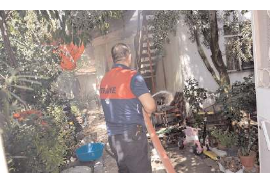
İtfaiye ekipleri yangını büyümeden söndürdü.

İtfaiye ve polis ekipleri tarafından yangının çıkış sebebi araştırılırken, soruşturmanın sürdürüldüğü öğrenildi. (İHA)