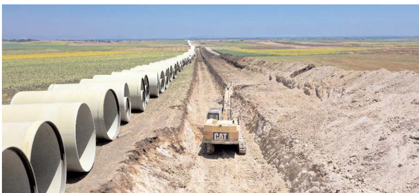
Obruk Dutludere Sulaması İkmal projesinde programa alındı.