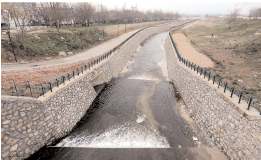
Programda yeni taşkın koruma projeleri de bulunuyor.