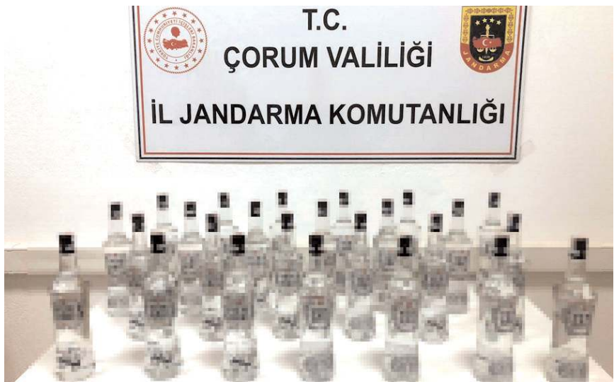
Şüpheli şahsa ait kolide yapılan aramada 25 şişe kaçak içki ele geçirildi.

merkezinde bulunan otobüs terminalindeki kargo bölümüne verilen kaçak/sahte bandrollü içkileri il dışına otobüs ile göndermek isteyen şüpheli bir şahsa ait kolide yapılan aramada 25 şişe 100 cl yeni rakı ibareli kaçak/sahte bandrol-