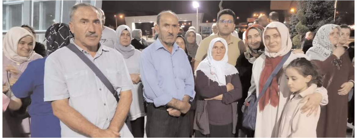
Umrecileri aileleri de yalnız bırakmadı.