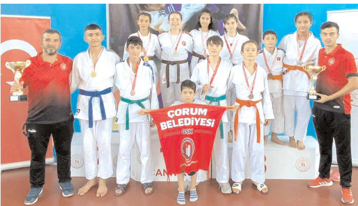
Yıldızlarda bayanlar ve erkeklerde birinciliği kazanan Çorum Belediyesi Gençlikspor sporcuları toplu halde