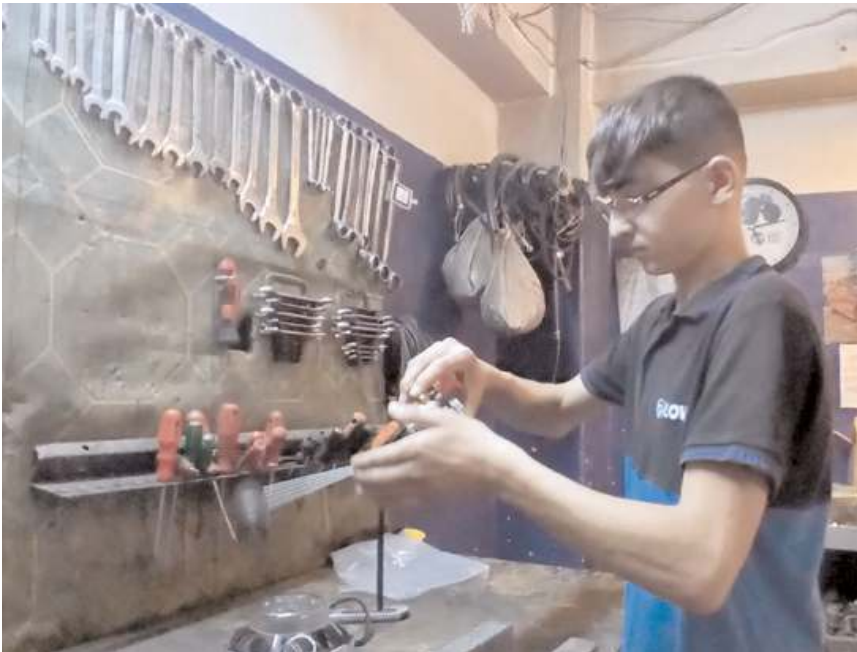
Yeni uygulamayla 90 bin olan çıracak sayısı 700 bine çıktı.