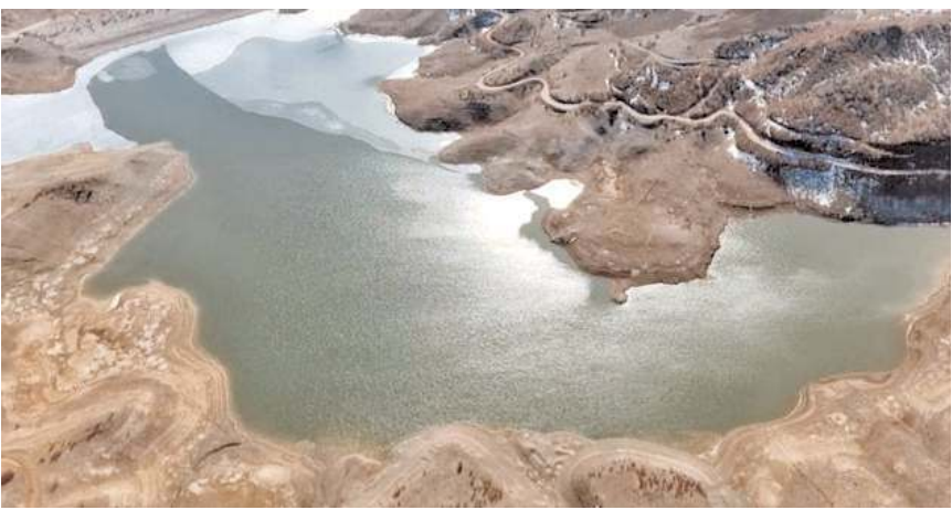
Yeni içme suyu projeleri de programda yer alıyor.