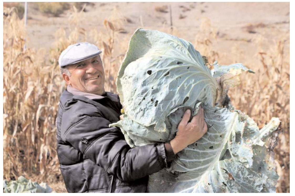
40 kiloluk beyaz lahanalar Demirşeyh köyünde yetiştiriliyor.