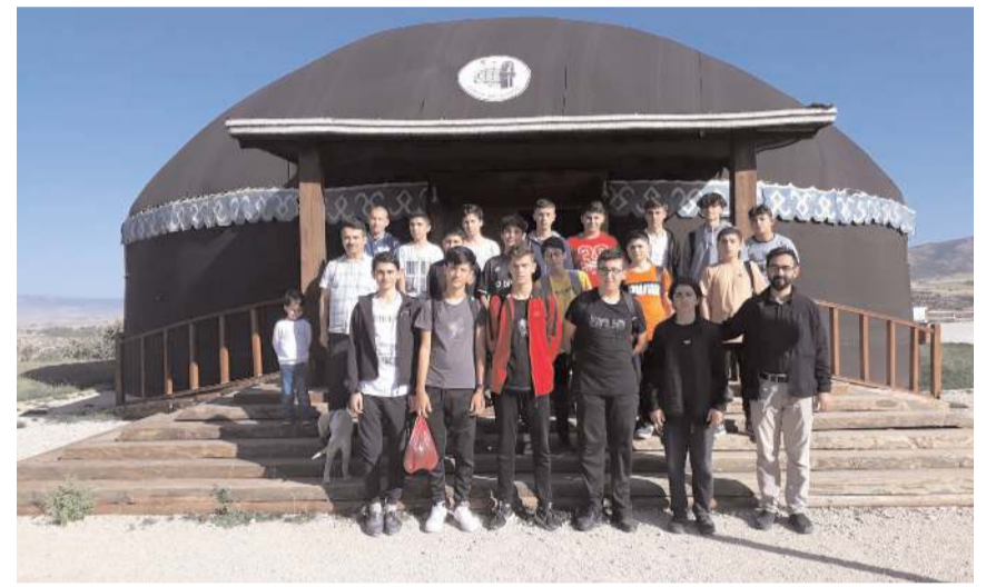
Öğrenciler hatıra fotoğrafı çekindiler.