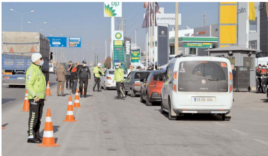
En düşük trafik cezası 953 liraya yükselecek.