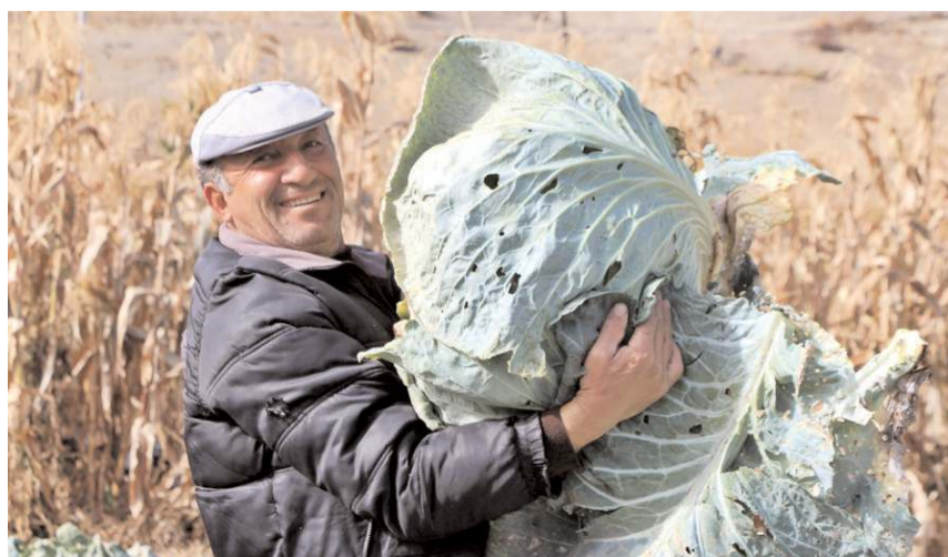
40 kiloluk beyaz lahanalar Demirşeyh köyünde yetiştiriliyor.