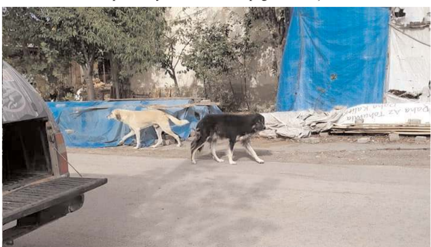
Kısırlaştırılan köpekler doğaya bırakıldı.

İskilip Belediye Başkanı Ali Sülük, ilçedeki yaklaşık 200 sahihsiz hayvanın özel bir klinik aracılığıyla kısırlaştırılıp serbest bırakıldığını bildirdi.