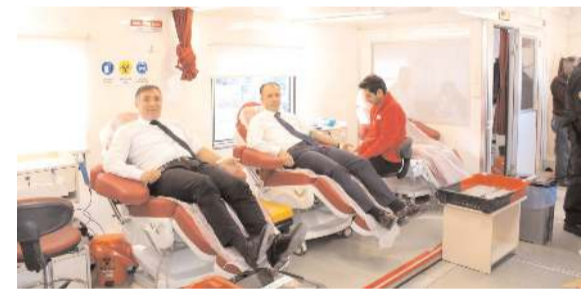
Cumhuriyet Başsavcısı Ahmet Bektaş ve Baro Başkanı Turan Kalıpcı, kan bağışında bulundular.

■ Çorum'da bir sürücü, elektrik direğine çarptığı minibüsünü kaza yerinde bırakıp kaçtı. Kaza nedeniyle bölgede elektrik kesintisi yaşandı. * HABERİ 3'DE