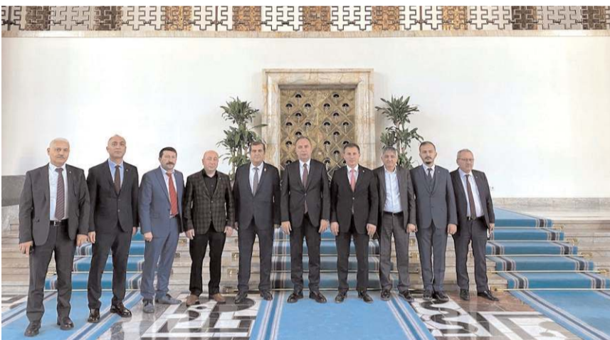
Çorum Ticaret Borsası Yönetim Kurulu, Milletvekili Ahmet Sami Ceylan'ı ziyaret etti.