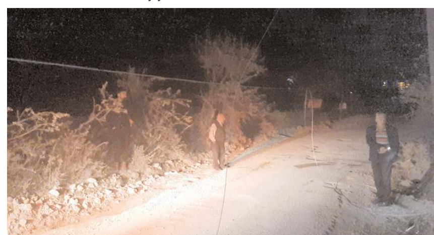
Olay Çoraklık Bağları mevkiinde meydana geldi.