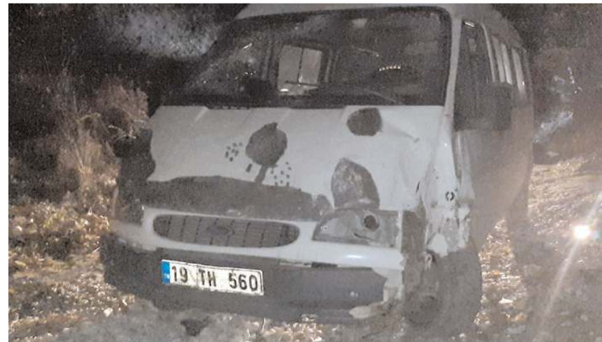
Minibüs olay yerinden 200 metre uzaklıkta bulundu.

Minibüs çekici ile otoparka çekilirken kopan elektrik telleri YE-DAŞ görevlilerince tamir edildi.(AA)