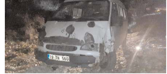
Minibüs olay yerinden 200 metre uzaklıkta bulundu.