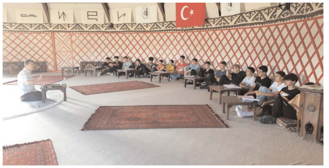
AGD Lise Karavan Gruplarında bulunan 18 genç Çorum Obası'nda 'Lise Kampı' gerçekleştirdi.