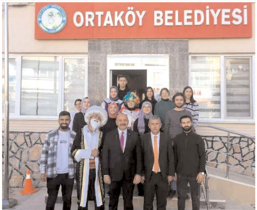
Hitit Üniversitesi öğrencileri köy okullarında eğitim gören öğrencilere gösteriler yaptılar.

Başkan İsbir, "Hitit Üniversitemizde eğitim gören öğrencilerimiz bir topluluk oluşturarak köylerimizde eğitim gören öğrencilerimize gösteriler sundular. Öğrencilerimize moral ve motivasyon kazandırarak eğlenceli vakit geçirmelerini sağladılar. Kıymetli gençlerimizin sunmuş olduğu gösterilerden dolayı teşekkürlerimi sunuyorum, eğitim ve öğretim hayatlarında başarılar diliyorum" dedi. (Haber Merkezi)