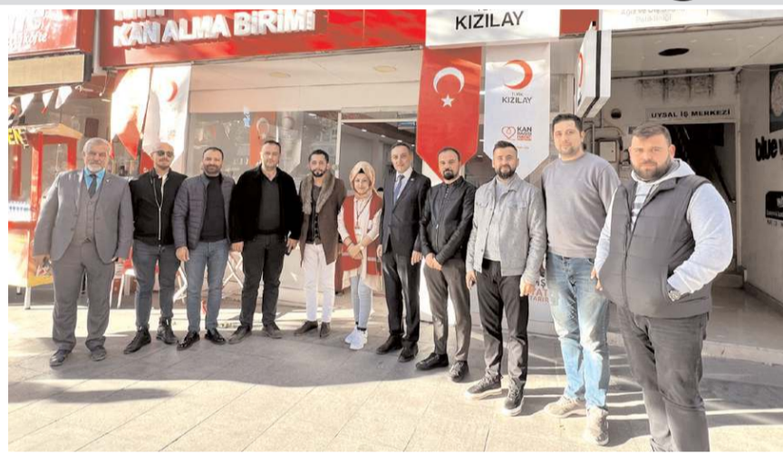
Deva Partisi İl Teşkilatı günün anısına toplu fotoğraf çekindi.

Sağlıklı her bireyin vatandaşlık vazifesi olan bu görev için siz değerli vatandaşlarımızı kan bağışına