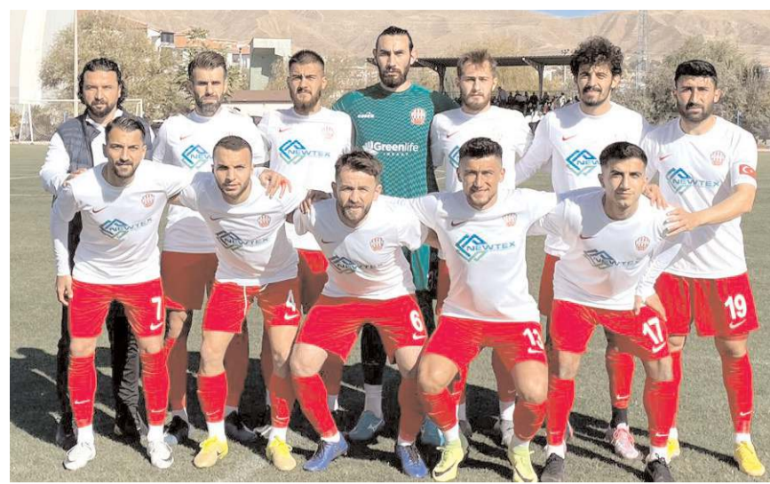
Osmancık Belediyespor yarın Yozgat deplasmanında çıkışını sürdürmek istiyor