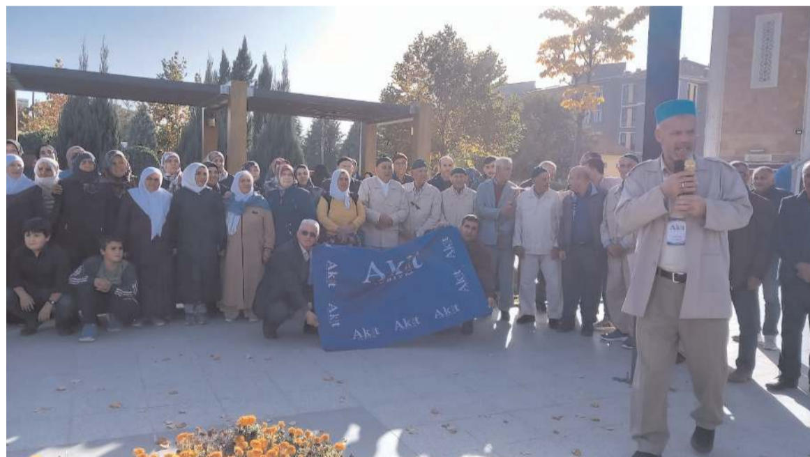
Akşemseddin Cami bahçesinde uğurlama töreni düzenlendi.