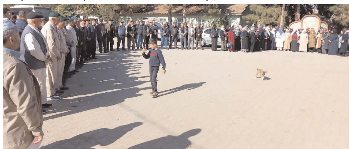
Umreciler 23 Kasım'da Çorum'a dönecek.