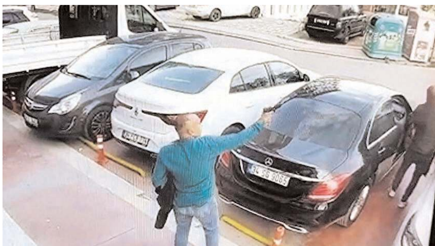
Cinayet âni güvenlik kameralarına yansımıştı.