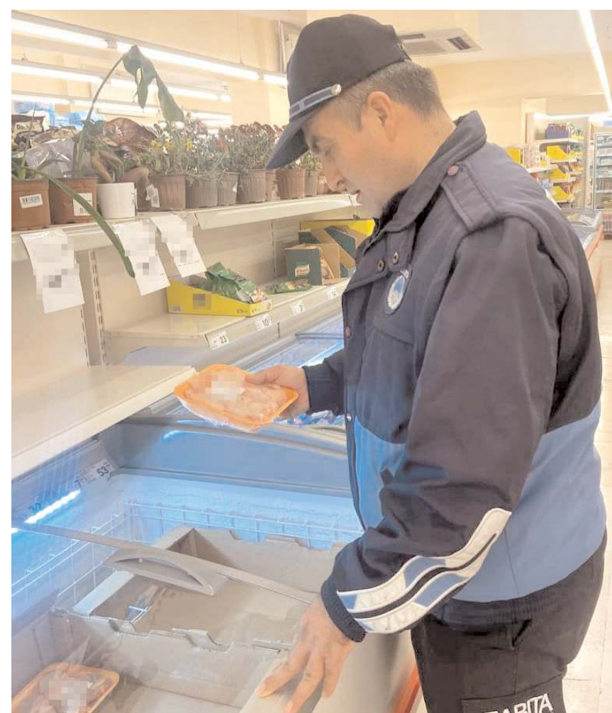
Zabıta ekipleri ruhsat, hijyen, gıda ürünlerinin son tüketim tarihleri ve muhafaza şartlarını kontrol etti.