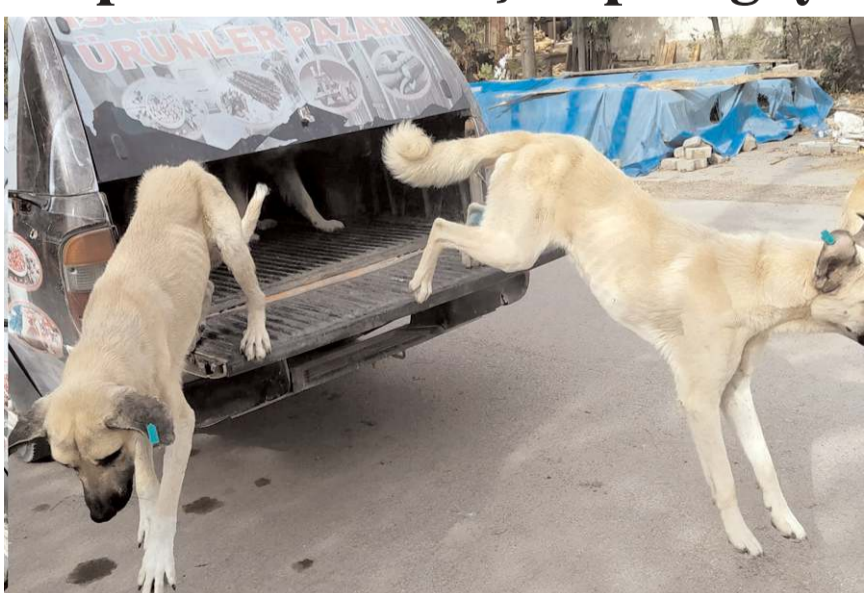
İskilip Belediyesi 200 sokak köpeğini kısırlaştırdı.