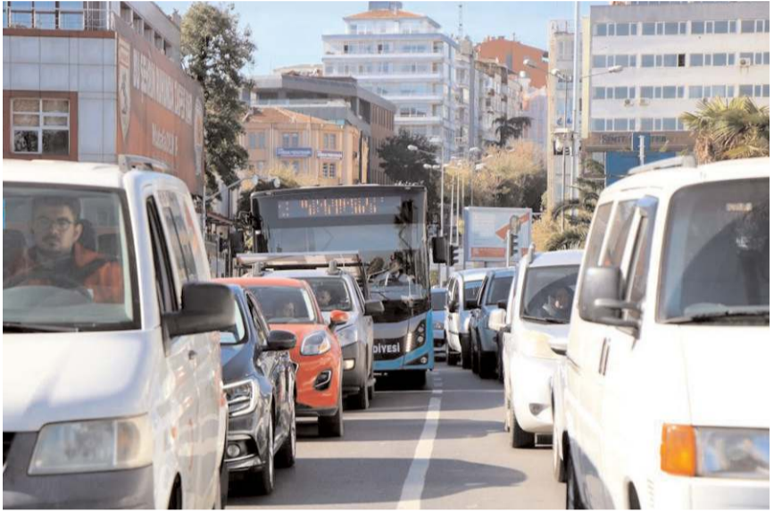
Çorum'da ocak-eylül döneminde trafiğe kayıtlı motorlu kara taşıtı sayısının 184 bin olduğu belirtildi.