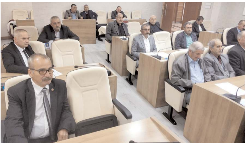
Gündem maddelerinin görüşülmesinin ardından toplantı sona erdi.