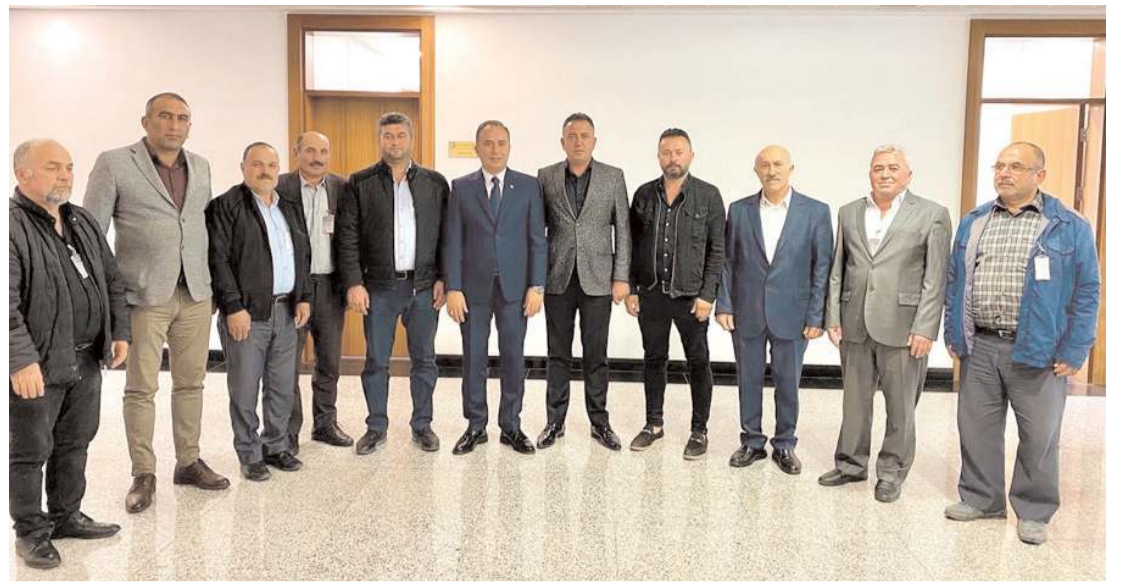
AK Parti Çorum Milletvekili Ahmet Sami Ceylan, köy muhtarlarını ağırladı.

"5199 sayılı Hayvan Koruma Kanunu gereğince sahihsiz hayvanların yaşam alanı, kamuya ait olan sokaklar ve kaldırımlardır. Sahipsiz hayvanların bulunduğu ortamdaki kısırlaştırılarak küpe ve mikroçip takılması ve aşılardan sonra alındığı ortama geri bırakılması kanuni zorunluluktur. Bu kapsamda 200 sokak köpeği uygun yöntemlerle toplanarak sistematik olarak kısırlaştırıldı ve küpe mikroçip takılıp alındıkları ortama geri salındı." (AA)