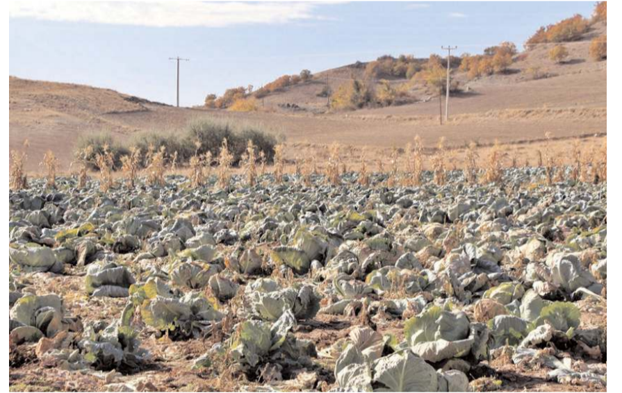
Mayıs ayında dikilen lahanalar Eylül'de hasat ediliyor.

mamen doğal şartlarda lahanaya üretimi gerçekleştirdiklerini ifade etti. (İHA)