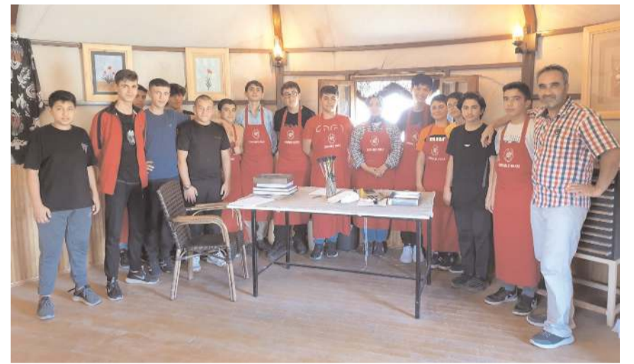
Öğrenciler kampta ebru sanatını yapma ikani buldular.