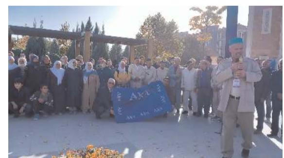
Akşemseddin Cami bahçesinde uğurlama töreni düzenlendi.