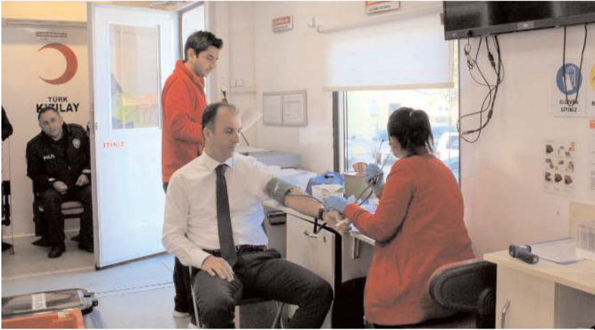
Cumhuriyet Başsavcısı Ahmet Bektaş, vatandaşları kan bağışında bulunmaya davet etti.