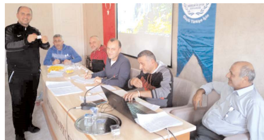
Okul Sporlarında ilk kuralar Beden Eğitimi Öğretmenleri tarafından çekildi

10 takım, Sungurlu'da 5, Alaca'da 6 ve İskilip'te 3 okulun mücadele edeceğini ve grup birincilerinin merkezde finallerde şampiyonluk için karşılaşacaklarını söyledi. Erkeklerde ise merkezde dokuz takım mücadele edecek. Müsabakaların ara tatilinden sonra başlayacağı açıklandı.