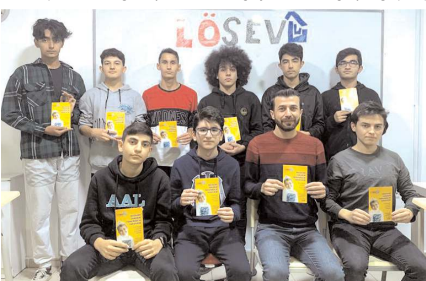
Lösemili Çocuklar Haftası'nda bağış ve oyuncak kampanyası gerçekleştirildi.

kapsamında MA Eğitim Kurumları'na bağlı olarak faaliyetlerini sürdüren Meşe Özel Öğretim Kursu ve Ada Özel Öğretim Kursu öğretmen ve öğrencilerinin katılımıyla Lösemili Çocuklar Haftası'nda bağış ve oyuncak kampanyası gerçekleştirildi.