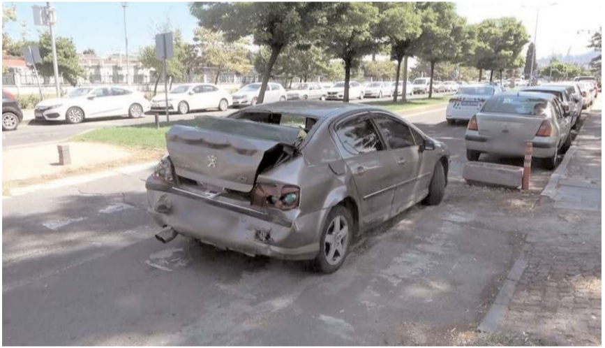
Çorum'da geçen yıl 1679 trafik kazasında 67 kişi hayatını kaybetmişti.