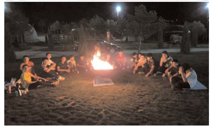
Gençler gece kamp ateşi yakıp ezgiler, marşlar ve türküler söylediler.