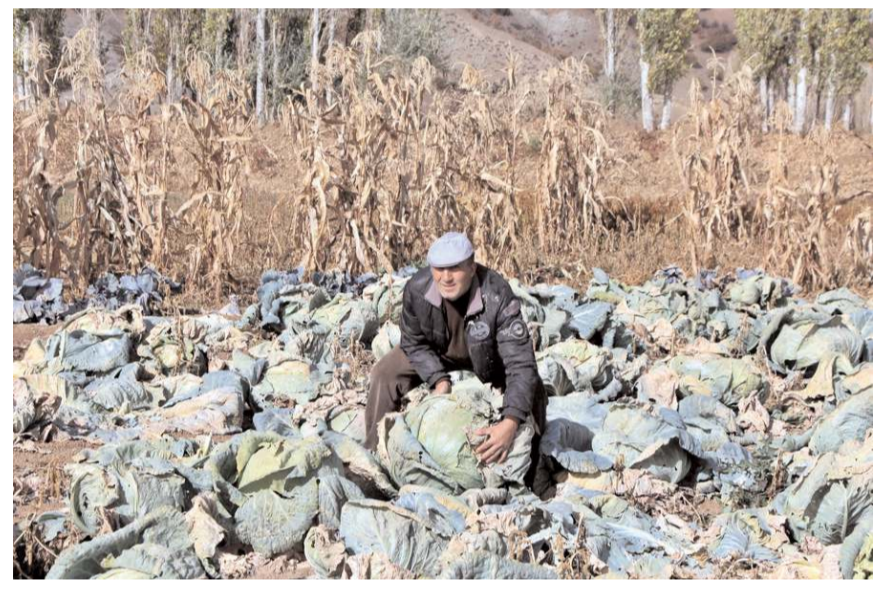
40 kiloluk beyaz lahanalar görenleri şaşırtıyor.

Karaaytu, son derece kaliteli, sağlıklı ve ta-