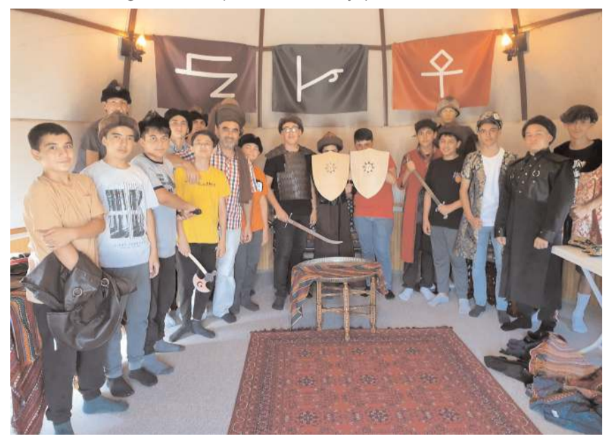
Gençler gece kamp ateşi yakıp ezgiler, marşlar ve türküler söylediler.