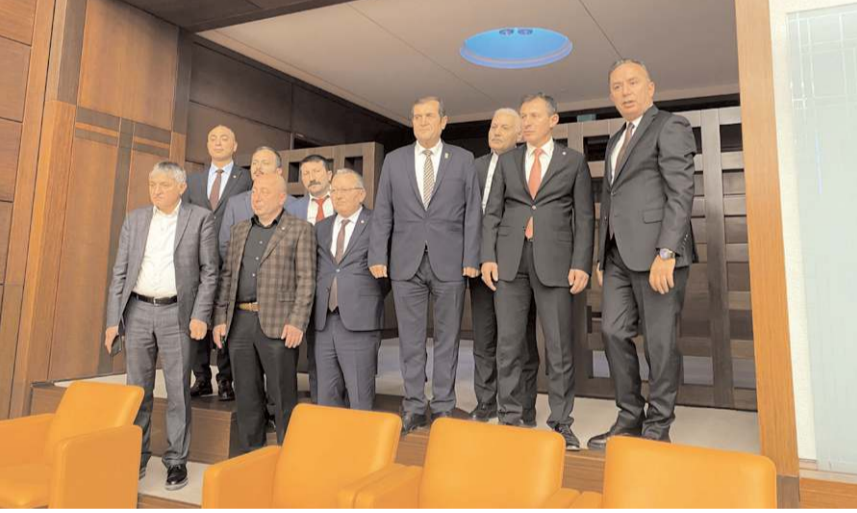
Ticaret Borsası heyeti TBMM genel kurul salonunu gezdi.