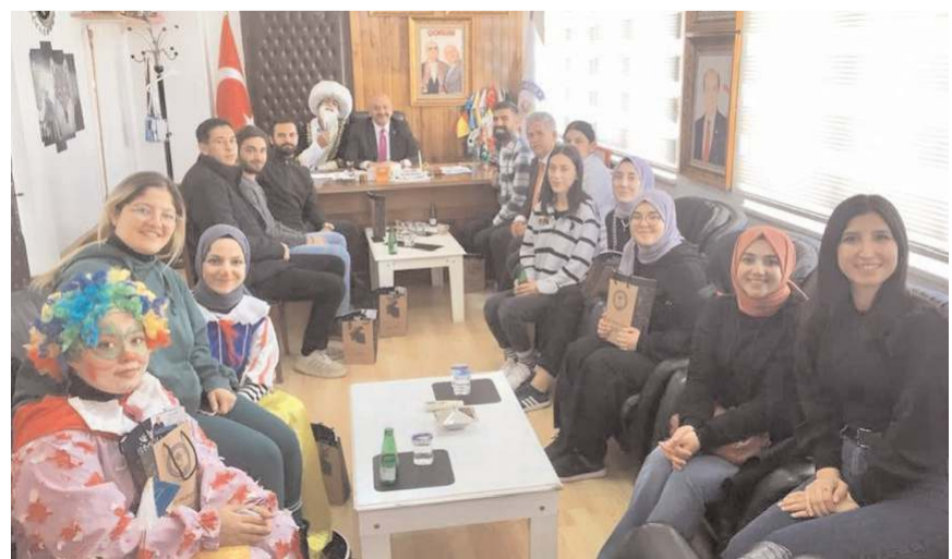
Hitit Üniversitesi öğrencileri Ortaköy Belediye Başkanı Taner İsbir'i ziyaret etti.