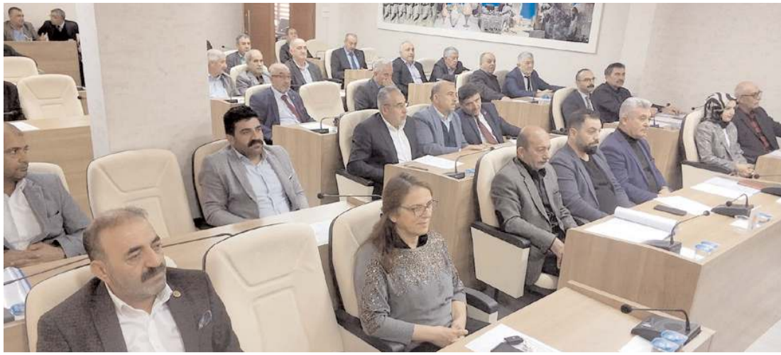
İl Genel Meclisi bütçe görüşmelerine devam ediyor.