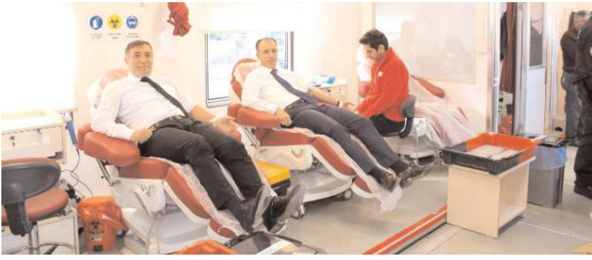
Cumhuriyet Başsavcısı Ahmet Bektaş ve Baro Başkanı Turan Kalıpçı, kan bağışında bulundular.