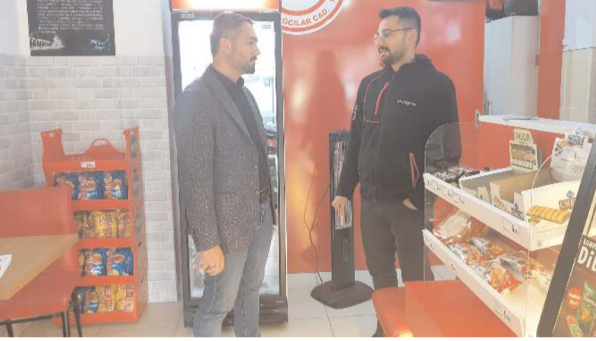
Esnafın sorunlarını dile getirdi.