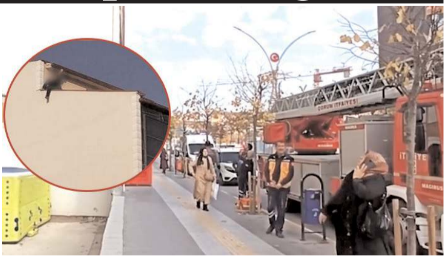
Olay, Recep Tayyip Erdoğan Caddesi'ndeki bir binanın çatısında gerçekleşti.

Olay yerine gelen polis ve itfaiye ekipleri hava yastığı açarak önlem almaya çalıştı. Çatıdaki vatandaşın yanına çıkan ekipler, uzun