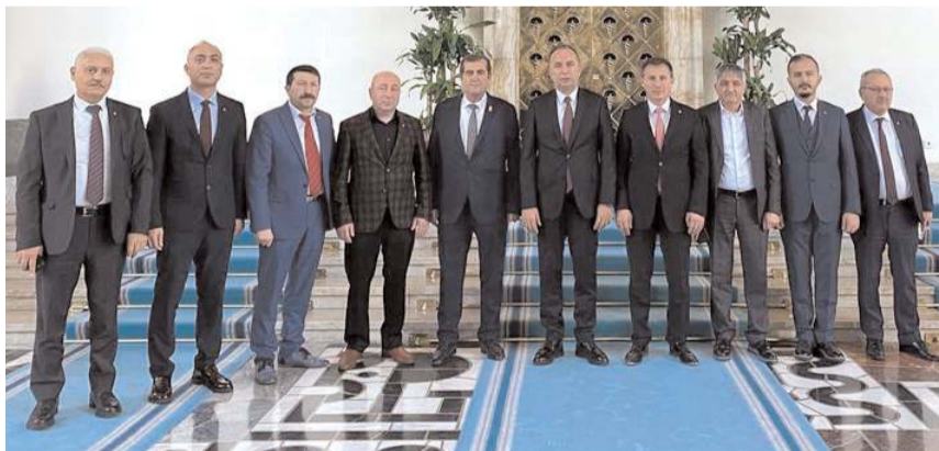
Çorum Ticaret Borsası Yönetim Kurulu, Milletvekili Ahmet Sami Ceylan'ı ziyaret etti.

■ AK Parti MKYK Üyesi ve Milletvekili Ahmet Sami Ceylan, Çorum'un 5 yılda tarım ve hayvancılıkta örnek gösterilen bir il haline geldiğini belirtti. * HABERİ 2'DE