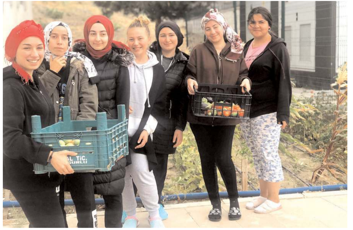
Sungurlu KYK öğrenci yurdu öğrencileri Hobi Bahçesi'nde sebze yetiştiriyorlar.

Projenin tamamlanmasıyla bölgedeki tarımsal üretim çeşitliliğinin gelişeceğini belirten Şahin, "İlçemizde Ambarcı, Eskiçelttek, Kırköy ve Yarımcı köylerinden geçen projenin tamamlanmasıyla çiftçilerimiz başta çeltik üretimi olmak üzere yeni zirai mahsullerin ekimini gerçekleştirerek daha farklı ürünler elde edebileceklerdir. Projenin bugünlere gelmesinde başta Sayın Cumhurbaşkanımız olmak üzere, Sayın Valimize, sayın milletvekillerimize, DSİ Genel Müdürlüğüne ve emeği geçen ekibine ilçe halkı ve çiftçilerimiz adına şükranlarımızı sunuyorum." dedi.(AA)