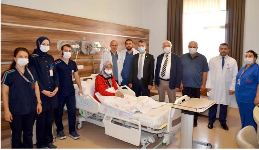
'Laparoskopik Dalak Koruyucu Distal Pankreatektomi' ameliyatı Çorum'da ilk defa yapıldı.