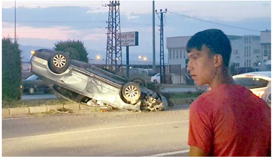
Kazada otomobilde bulunan üç kişi yaralandı.

Çorum'da kontrolden çıkan otomobil refüje bulunan elektrik direğine çarptıktan sonra takla attı. Kazada araçta bulunan 3 kişi yaralandı.