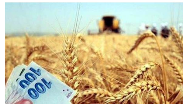
Cumhurbaşkanı Kararında belirtilen tarihler dışında TMO'ya satanlar için destekleme ödemesi yapılmayacak.