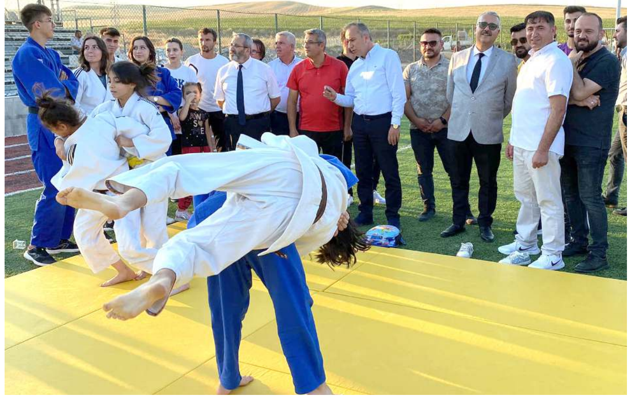
Judo branşında çalışma yapan sporcular davetlilere gösterileri ile bu branş çalışmalarındaki hünelerini gösterdiler