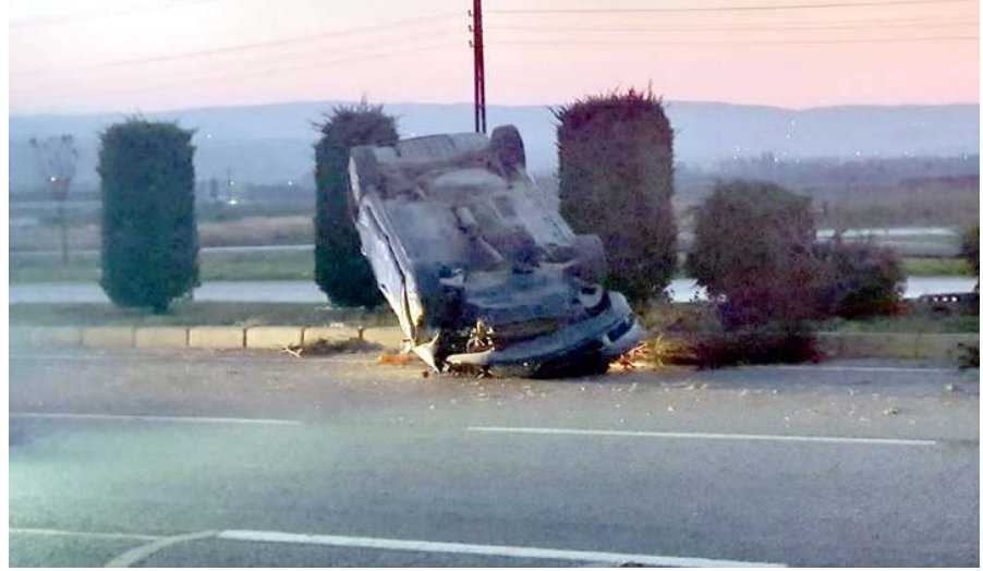
Kaza nedeniyle trafik bir süre kontrollü olarak verildi.