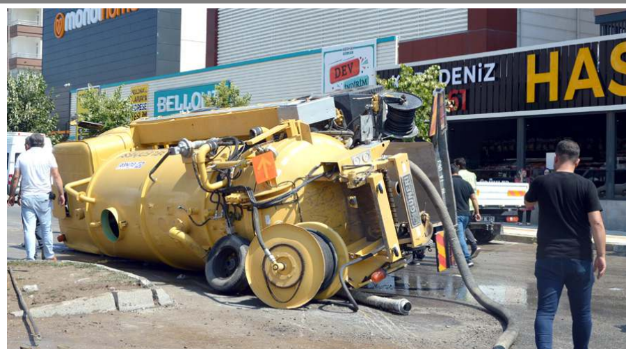
Kazada belediyeye ait vidanjör devrildi.