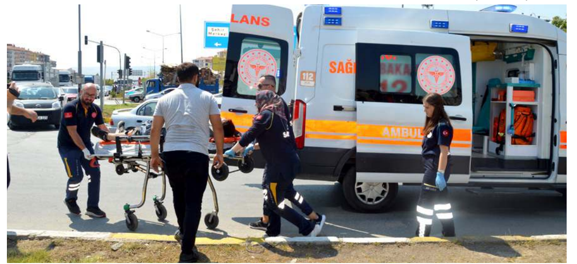
Yaralılar, Hitit Üniversitesi Erol Olçok Eğitim ve Araştırma Hastanesi ve kentteki özel bir hastaneye kaldırıldı.