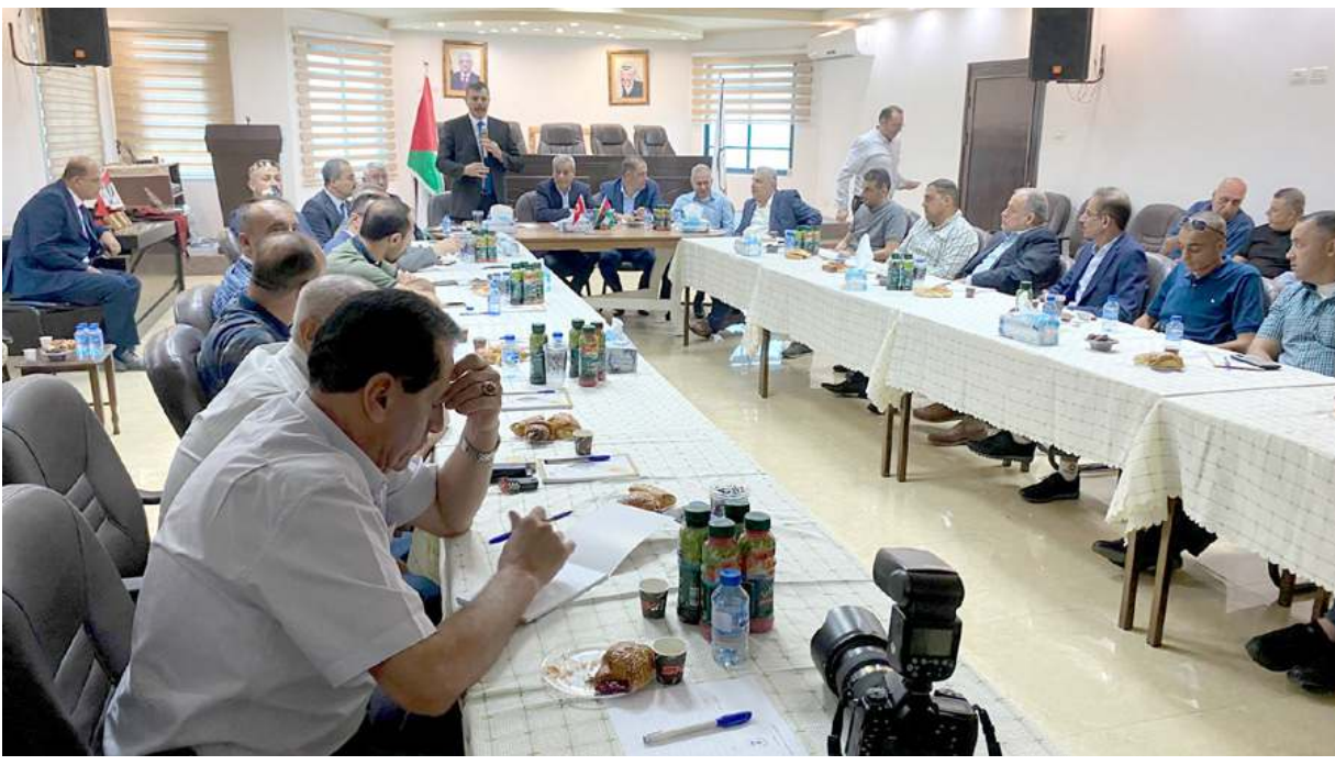
Çorum heyeti Kalkilya Ticaret ve Sanayi Odası'nı ziyaret ederek iki şehrin işbirliği fırsatları üzerine istişarelerde bulunuldu.