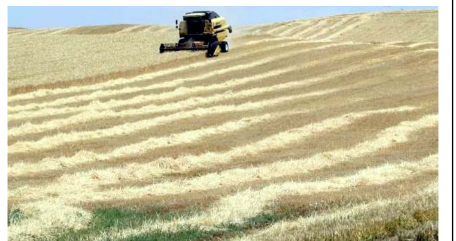
Cumhurbaşkanı Kararında belirtilen tarihler dışında TMO'ya satanlar için destekleme ödemesi yapılmayacak.