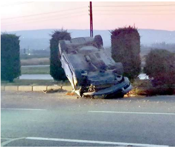
Kaza nedeniyle trafik bir süre kontrollü olarak verildi.