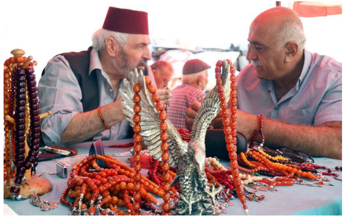
Eski Ekin Pazarı Sokak'ta yer alan bir kahvehane tespih tutkunlarının buluşma noktası oldu.