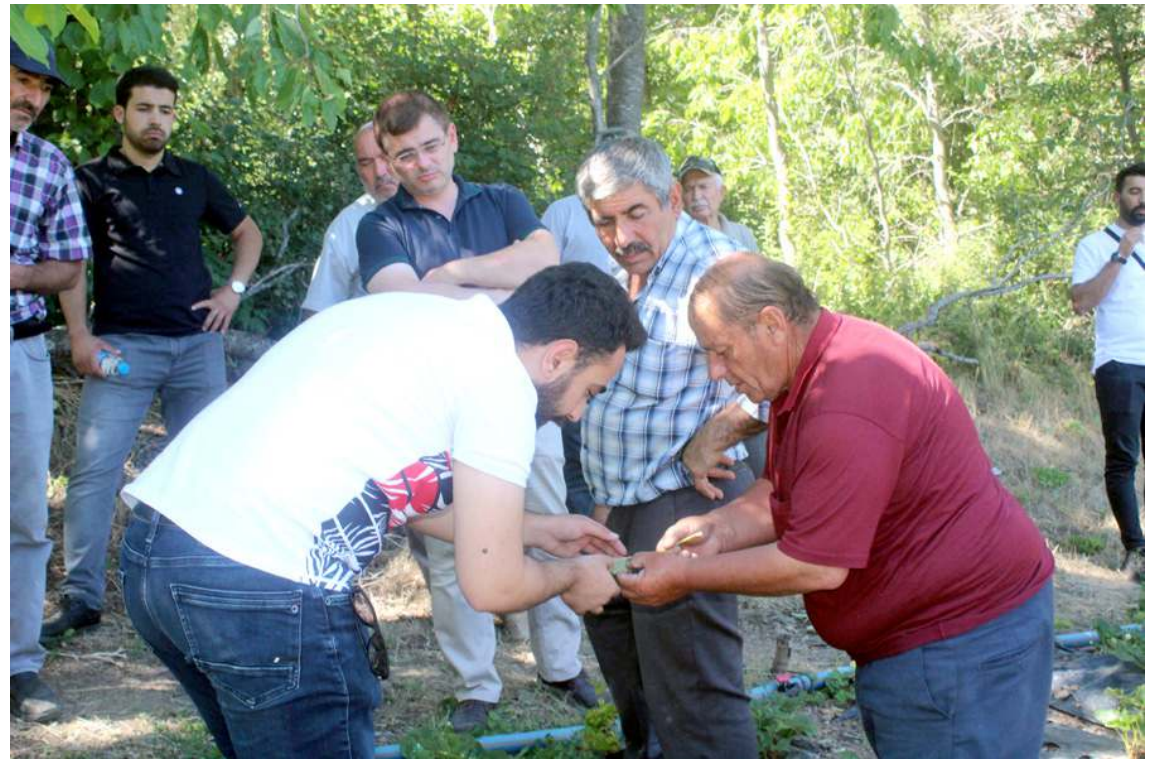
Eğitimler kapsamında tarlada uygulama yapıldı.