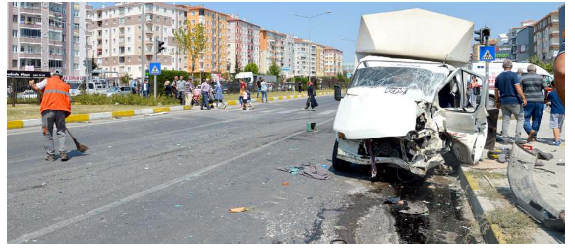
Kaza İlim Yayma Kavşağında meydana geldi.