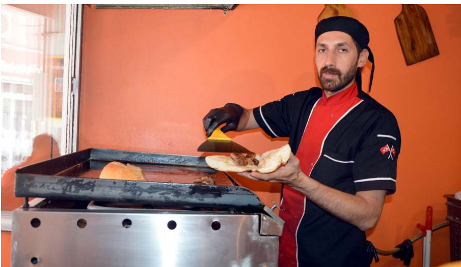
Köftede Öncü faaliyete başladı.