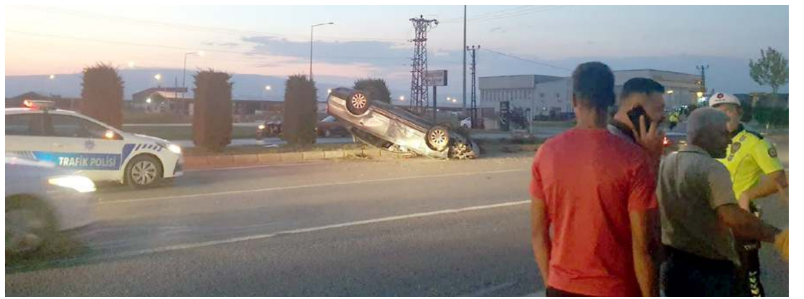
Kaza Çevre Yolunda meydana geldi.