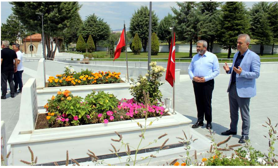
'Çorum Şehitlerini Anıyor, Gazilerini Yâd Ediyor' projesi başlatıldı.