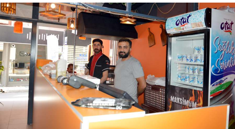
İşletme gece 04.00'e kadar paket siparişi alıyor.