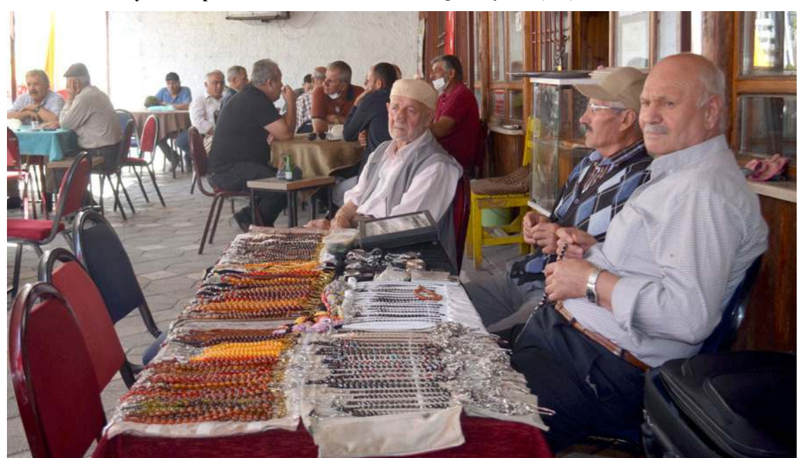
Yaklaşık 15 kişinin kahvehanede tezgah açıyor.

"Pazarda 50 liraya da 100 bin liraya da tespih var"