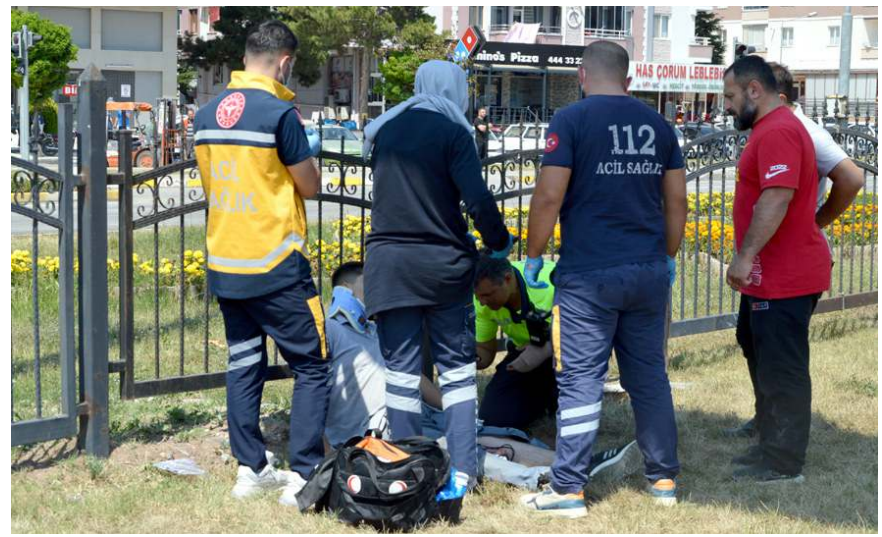
Yaralılara ilk müdahaleyi 112 acil sağlık ekipleri yaptı.