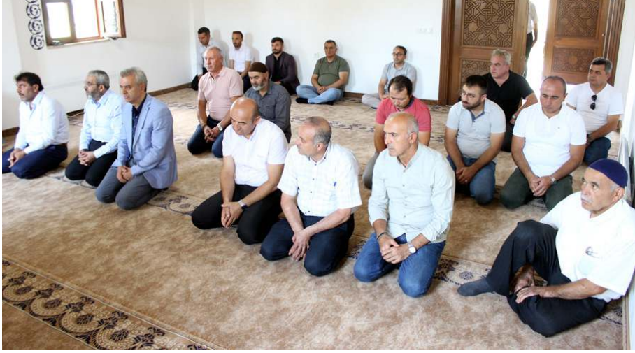
Türkiye Harp Malulü Gaziler Şehit Dul ve Yetimleri Derneği üyeleri her Cuma şehitliği ziyaret edecek.