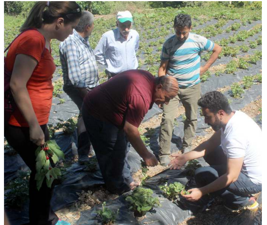
Katılımcılar teorik bilgilerinin tarlada uygulama fırsatı buldular.

hevesli girişimcilere ön ayak olmak, karşılaşılabilecek muhtemel ve gerçek sorunlarla nasıl başa çıkılacağı konusunda uzman hocaların tecrübelerinden yararlanılmak temel amaçtı" denildi.