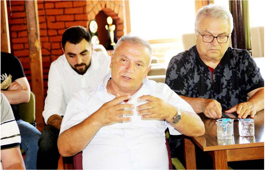
Toplantıda İskilip'te ahşap oyuncak fabrikası kurulması amacıyla hazırlanacak proje hakkında istişare edildi.