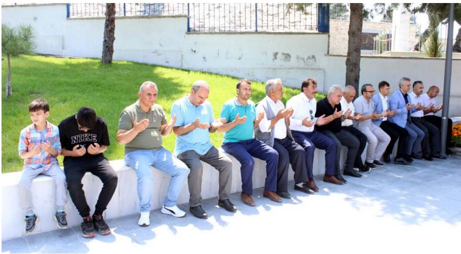
Cuma namazının ardından şehitler için dua edildi.