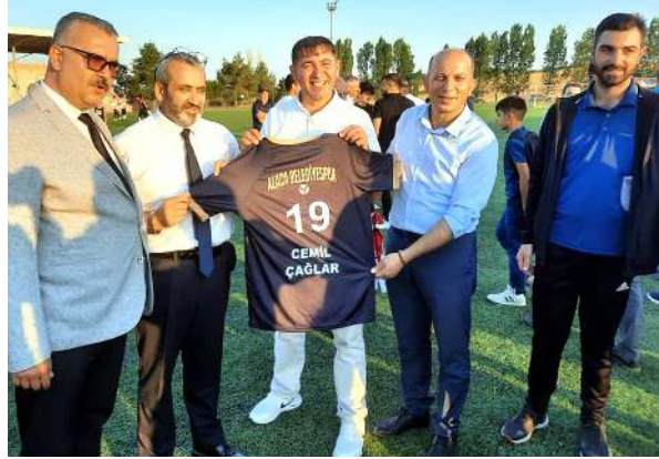
Alaca Belediyespor yönetimi tarafından protokol üyelerine isimleri yazılı kulüp forması hediye edildi