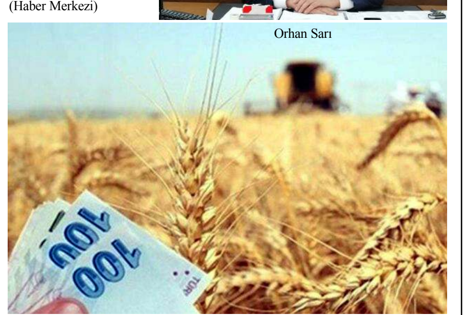
Desteklemelere başvuru için son başvuru tarihi 16 Eylül 2022 olarak belirtildi.