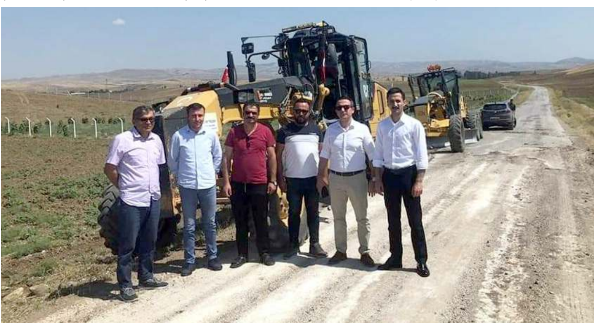
İlk etapta Ankara-Sungurlu yol ayrımından Alembeyli köyüne kadar yaklaşık 16 kilometre yolun yapılması hedefleniyor.

rı ve il genel meclisinin kararı ile il özel idaresi bütçesinden 3,5 Milyon TL ödenek ayrılmıştır. Yine aynı zamanda, Bakan Yardımcımızın girişimleri ile bu yola İller Bankasından ve diğer yatırımcı kuruluşlardan gerekli destek temin edilmiştir. Tüm bu kaynaklarla ilk etapta Ankara-Sungurlu yol ayrımından Alembeyli köyüne kadar yaklaşık 16 kilometre yolun yapılması hedeflenmektedir. Devamında temin edilecek ödeneklerle bu yolun tamamlanması hedeflenmektedir" denildi. (İHA)