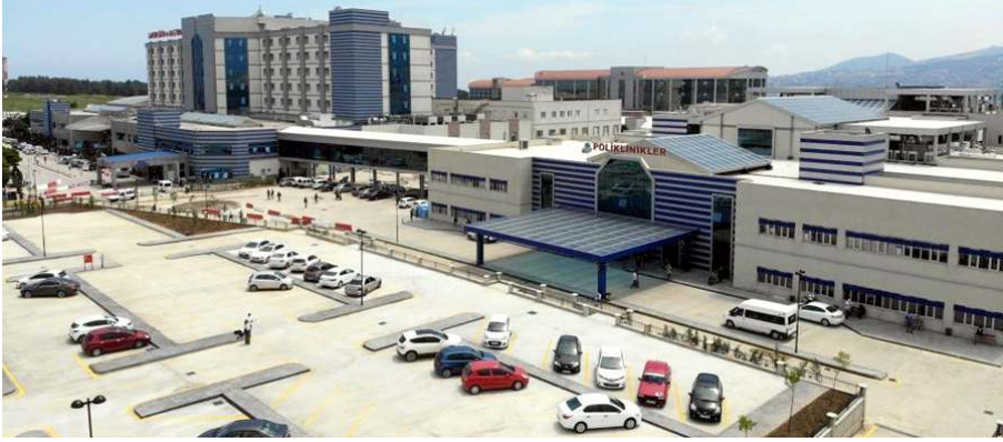
Samsun'da bulunan sağlık tesisleri 2022 yılının ilk 6 ayında 9 milyona yakın hastaya muayene hizmeti verdi.

Samsun'da 2021 yılında devlet ve özel hastanelerin polikliniklerine 8 milyon 577 bin 407 kişi başvurmuştu. Aile hekimlerinin polikliniklerine ise 5 milyon 189 bin 752 kişi tedavi olmak için gitti. Toplamda 2021 yılında 13 milyon 767 bin 159 hastanın hastaneye başvurduğu Samsun'da bu yıl bu rakamın 17 milyon olması bekleniyor. (İHA)