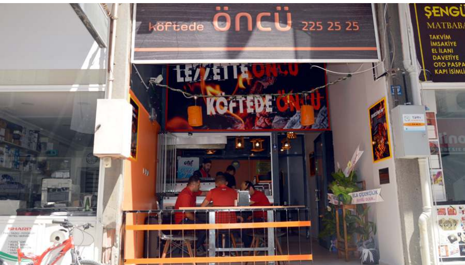
Köftede Öncü, Mevlana Otopark yanında bulunuyor.