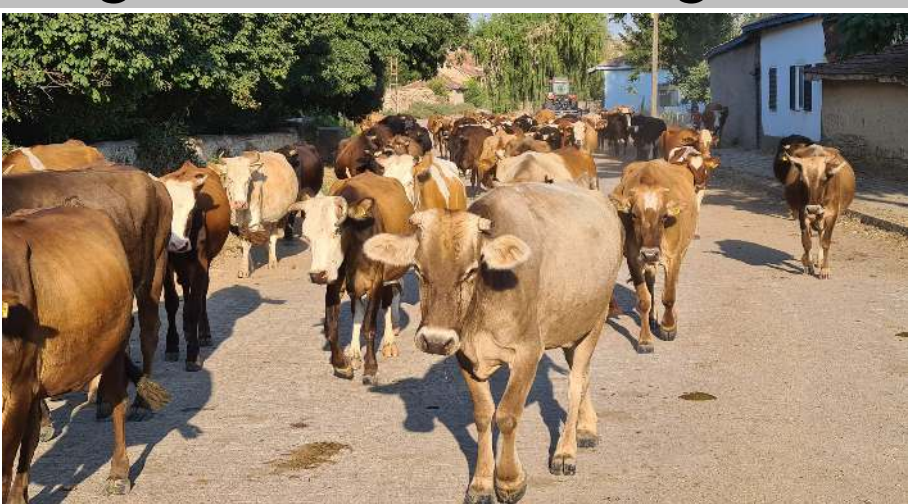
Buzağı desteklemeleri içinde bulunan üreme parametresi kriterlerinde değişikliğe gidildi.