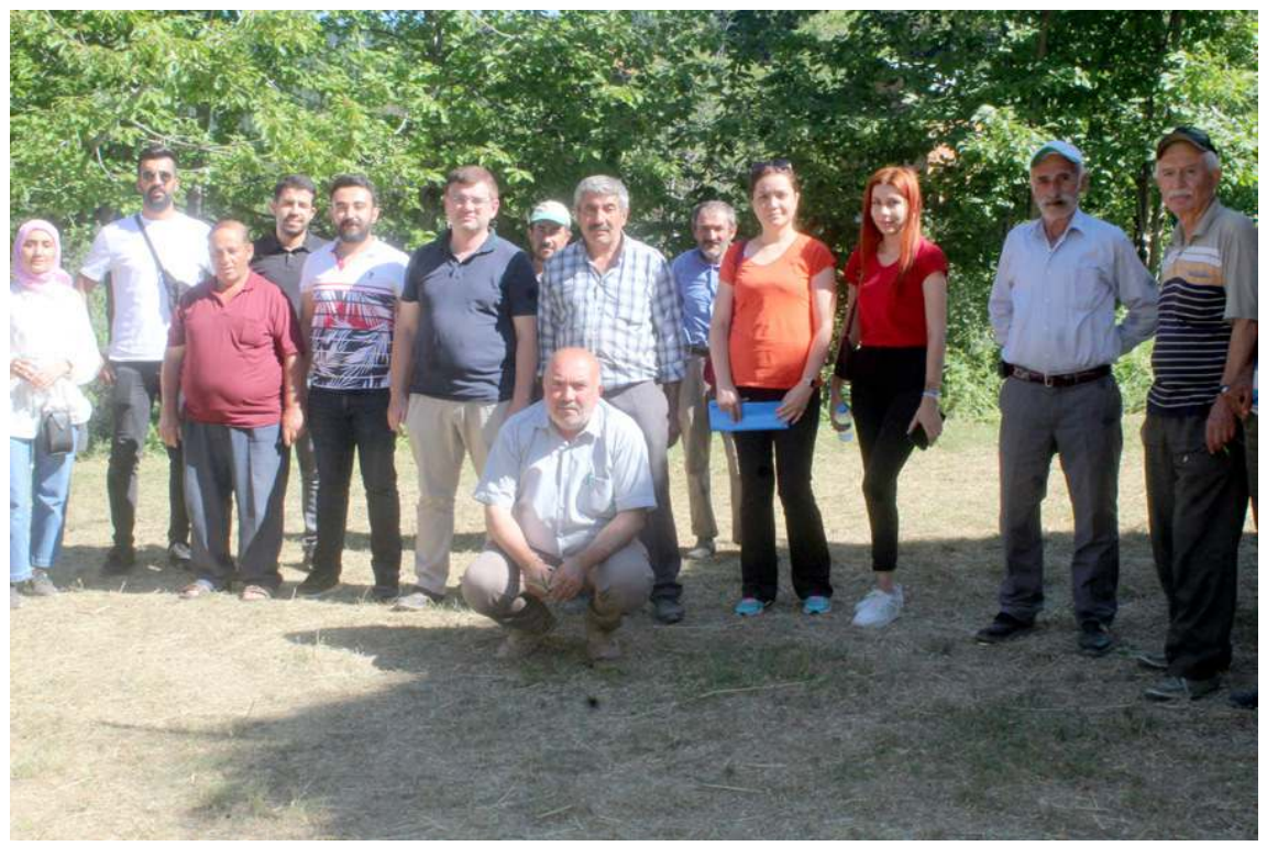
Eğitimin sonunda toplu hatıra fotoğrafı çekildi.

Eğitimde sorunlarla nasıl mücadele edileceği ve kalitenin korunması için neler yapılması gerektiği üreticilere anlatıldı. Uygulamalı eğitim İskilip'te üretimde adından söz ettiren İskilip Şeyh Köyü ve Koçcağz Köyleri'nde yapıldı.