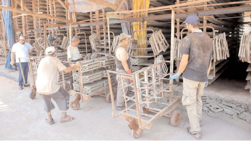
Tuğla ve kiremitler, Türkiye'nin dört bir yanındaki binalarda yapı malzemesi olarak kullanılıyor.