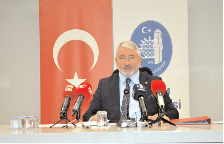
Belediye Başkanı Dr. Halil İbrahim Aşgın

Arada ki fark 1 milyon 312 bin 755 metrekaredir. Biz sattığımızın altı katını belediyemize mülkiyet olarak kazandırdık. Bunlara da değer kazandırıp yine satışlarını yapacağız. Ve hemşehrilerimize hizmet olarak döndüreceğiz. Bunun gayreti içerisindeyiz. İnşallah yakında eski stadyum yerini Millet Bahçesi yapmak karşılığında Hazine'den yüklü bir şekilde milletimize tapular kesilecek ve bu 1 milyon 569 bin 800 metrekare rakamları çok çok daha yukarılara çıkacak. Bununla müjdesini buradan ifade etmiş oluyum" dedi.