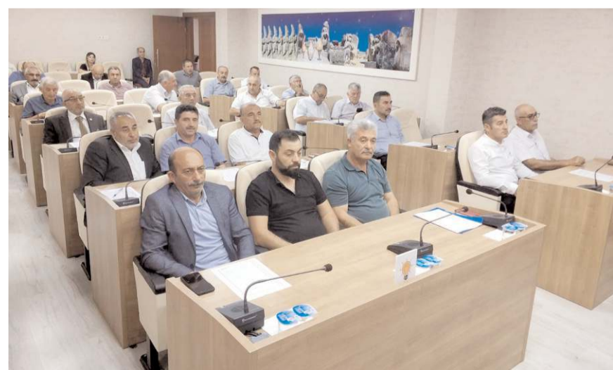
Toplantıda gündem maddeleri görüşüldü.