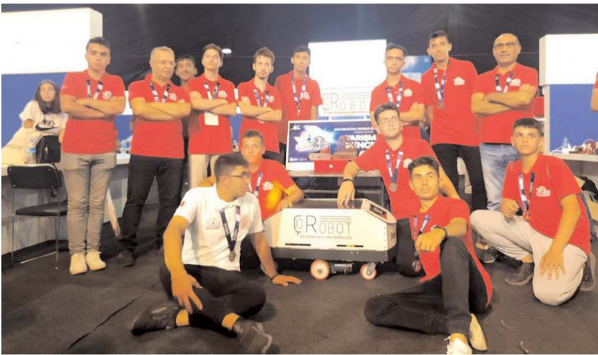
TOBB-OSB Mesleki ve Teknik Anadolu Lisesi Çorobot takımı.