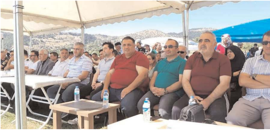
Festivale protokol üyeleri ile çok sayıda vatandaş da katıldı.