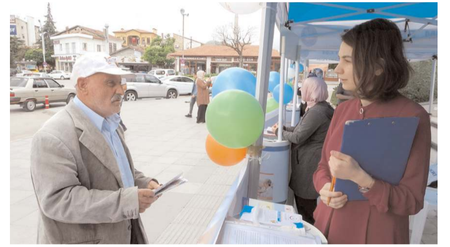
Sağlık ekipleri, vatandaşlara sigaranın zararlarını anlattı.