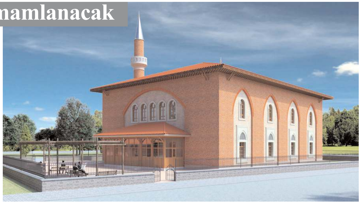
Sanayi Mescidinde çalışmalar devam ediyor.