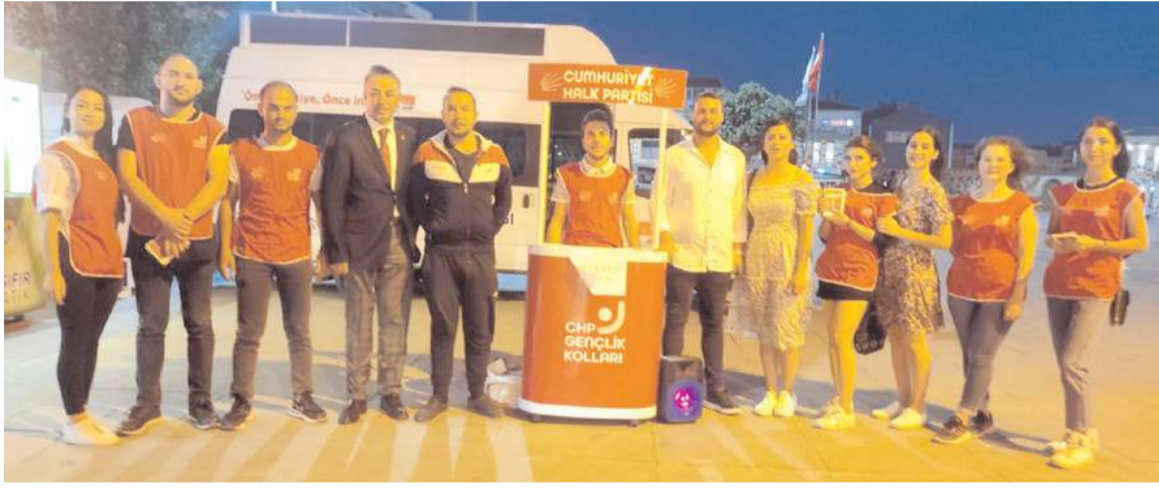
CHP Çorum Gençlik Kolları stant açarak, vatandaşları partiye üye olmaya davet etti.