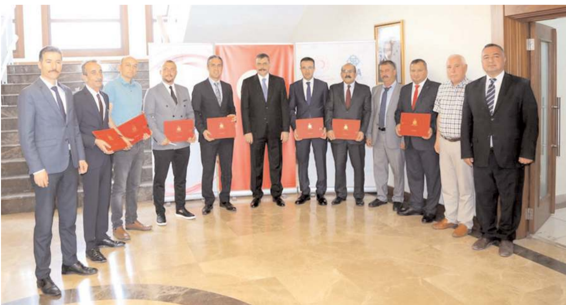
Desteklenecek projeler arasında Anovel Yazılım tarafından geliştirilen 'Yapay Zekâ Destekli Optimizasyon Yazılımı' projesinde yer aldı.

devam edeceklerini ve gelecekte yazılım sektöründe öne çıkan şehirler arasında yer almasını arzu ettiklerinin altını çizen Hakan Yıldırım, yaptıkları çalışmalara katkı sağlayan Orta Karadeniz Kalkınma Ajansı'na (OKA), Hitit Üniversitesi'ne ve TEKNOKENT yönetimine teşekkür etti.