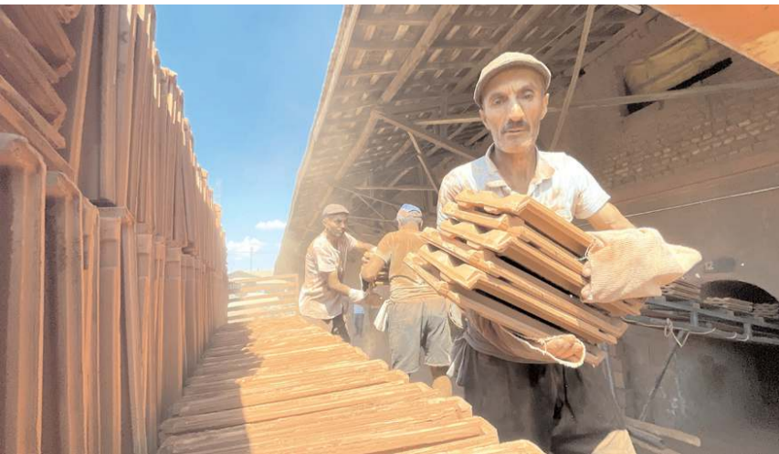
Sanayiciler, Çorum Toprak Sanayicileri Kooperatifi çatısı altında güç birliği yaparak üretimlerini sürdürüyor.