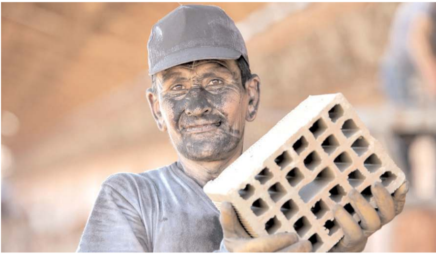
Çorum'daki sanayi kuruluşları, Covid-19 salgınının ardından üretimlerini tam kapasite sürdürüyor.