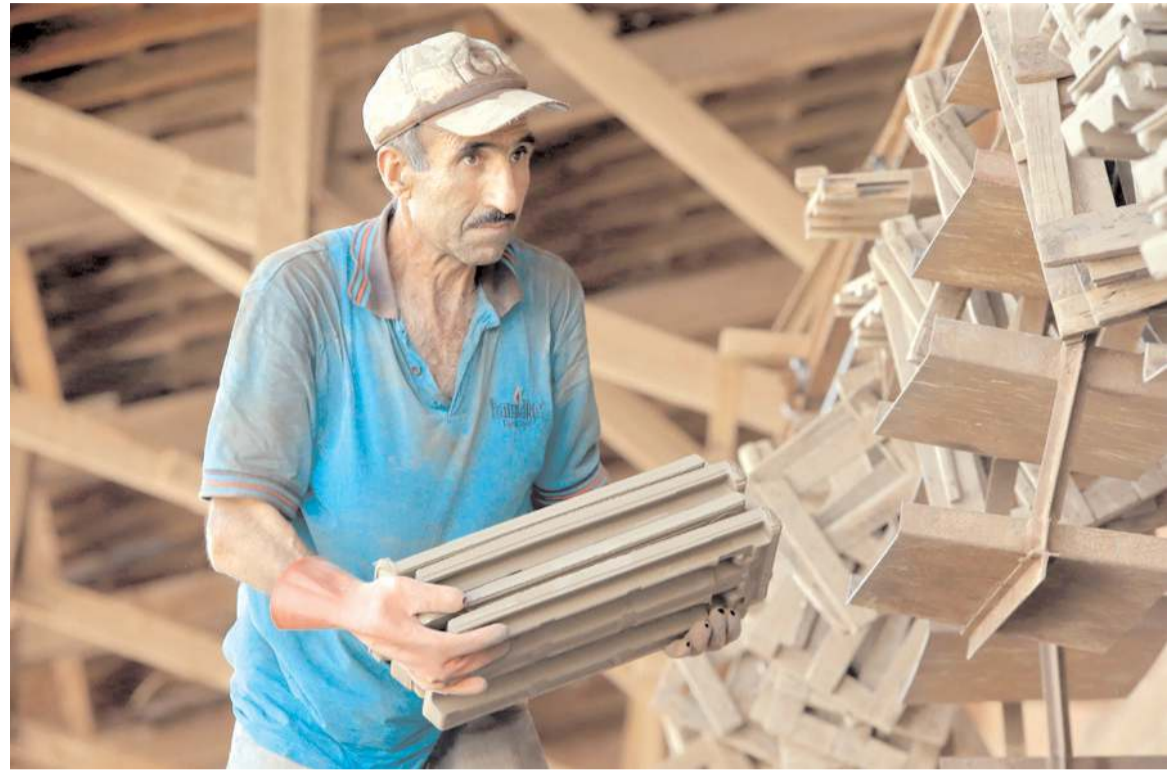
Çorum, toprak sanayi sektöründe söz sahibi kentlerden birisi.

Çorum'daki kiremit ve tuğla fabrikalarında