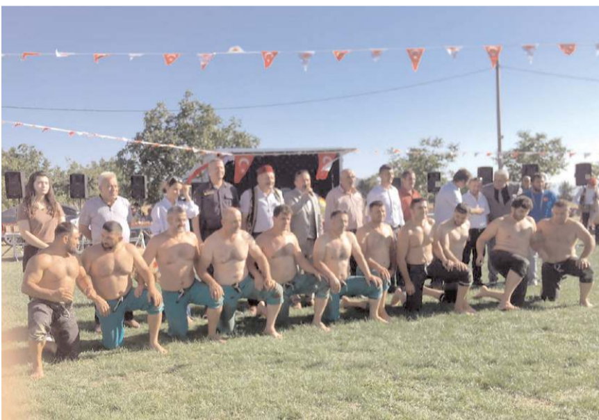
Festivalde güreş müsabakaları da yapıldı.

İskilip'e bağlı Şeyh köyünde geleneksel hale getirilen Armut ve Çilek festivalinin 15.'si gerçekleştirildi.