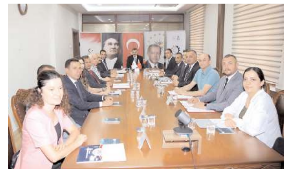
Desteklenmeye değer görülen ve toplam tutarı 4.4 milyon TL olan 6 projeye OKA 2.6 milyon TL destek sağlanacak.