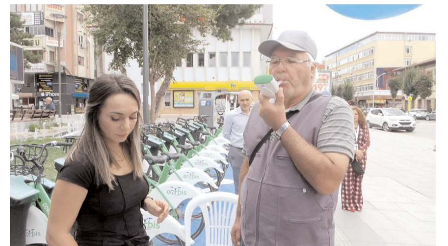
Stantta vatandaşlara tarama ve bilgilendirme çalışması da yapıldı.