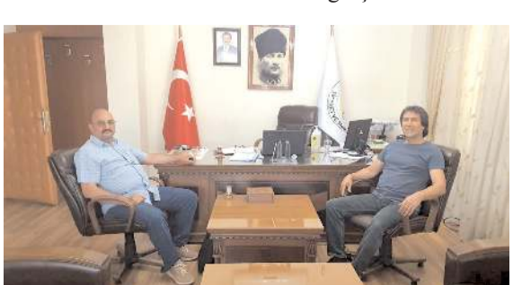
Tamaksan Çelik firması, Sungurlu'ya 25 milyon lira yatırımla çelik dövme fabrikası kuracak.