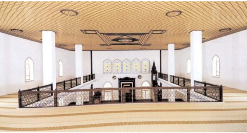
Mescit 1200 kişi kapasiteli olacak.