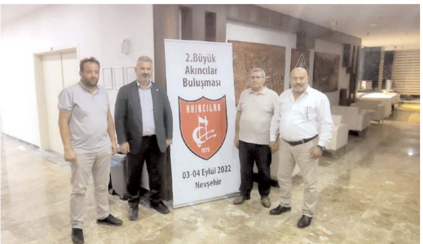
Toplantıya Çorum'dan katılanlar Milletvekili Hasan Turan ile birlikte...