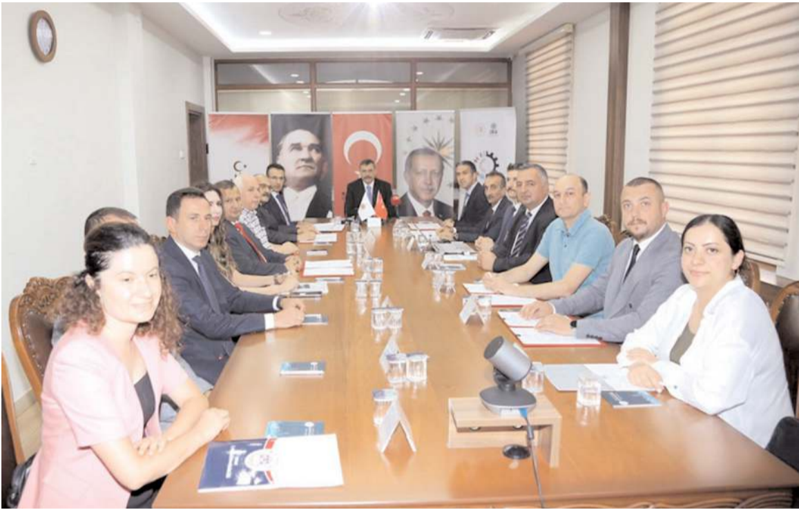
Desteklenmeye değer görülen ve toplam tutarı 4.4 milyon TL olan 6 projeye OKA 2.6 milyon TL destek sağlayacak.

cık Kandiber Kalesi etrafındaki binaların Çevre Şehircilik ve İklim Değişikliği Bakanlığı tarafından kamulaştırılması ve bu alanın yeşil alan olması kararının Cumhurbaşkanımız Recep Tayyip Erdoğan'ın imzası ile Resmî Gazete'de yayımlandığını açıkladı. 81 parseli kapsa-