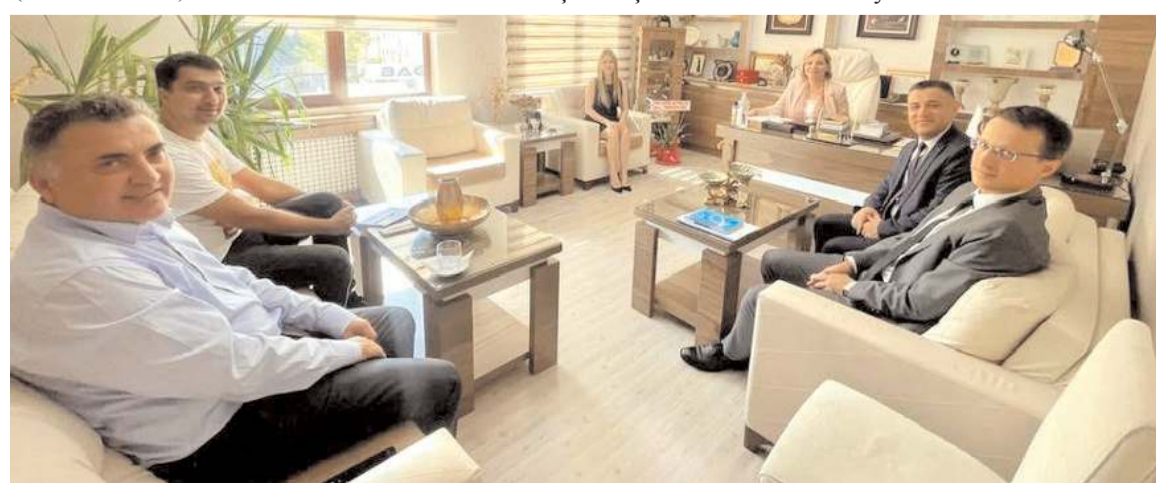
Ziyarete Halk Bankası'nın genç eczacılara sunduğu fırsatlar görüldü.