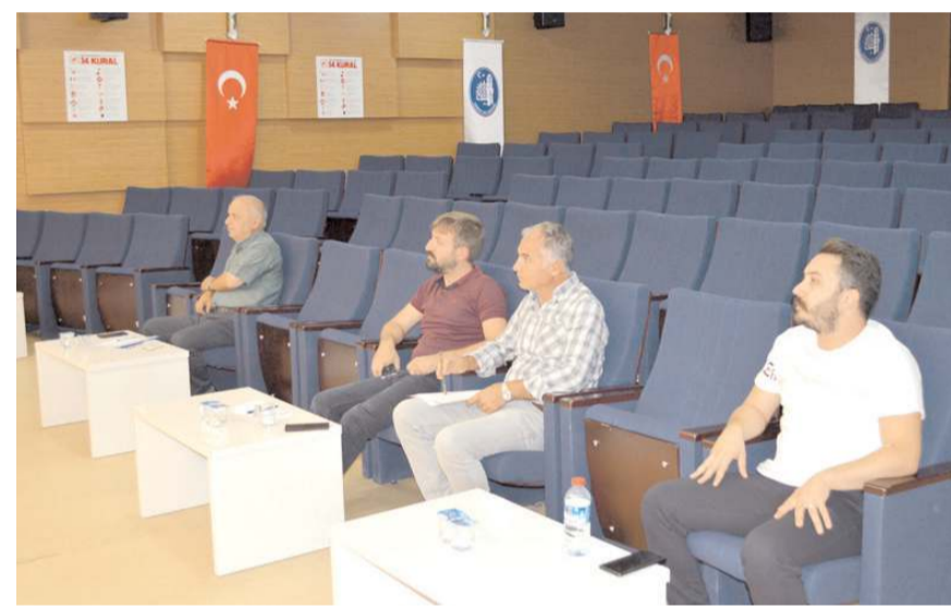
İhaleye 5 firma teklif verdi.