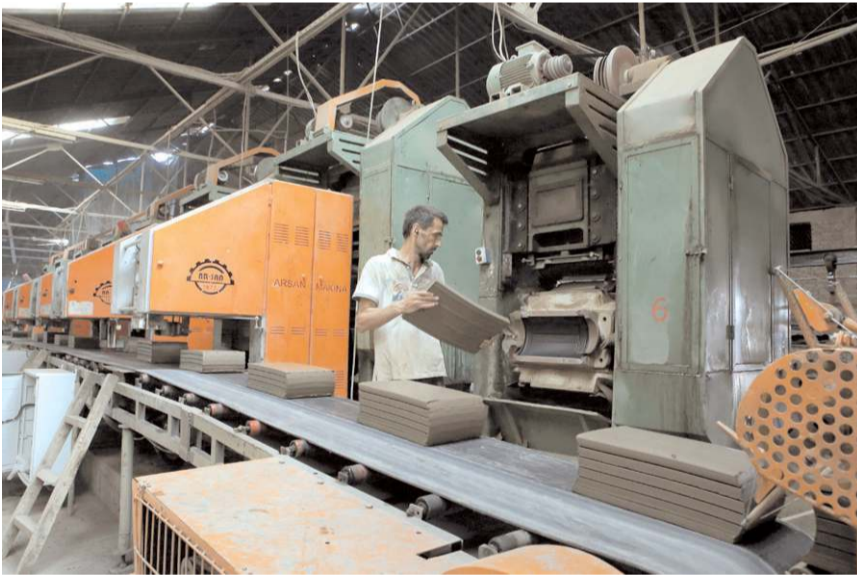
Kiremit ve tuğla fabrikalarında 3 bin kişiye istihdam sağlanıyor.