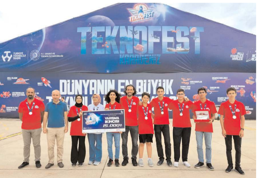
15 Temmuz Şehitleri Fen Lisesi ikinciliği elde etti.