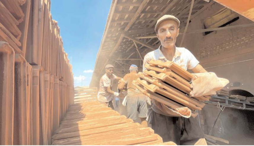
Sanayiciler, Çorum Toprak Sanayicileri Kooperatifi çatısı altında güç birliği yaparak üretimlerini sürdürüyor.