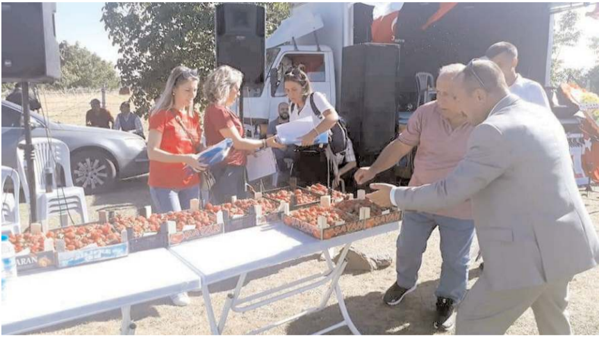
Festivalde çilek yarışması yapıldı.