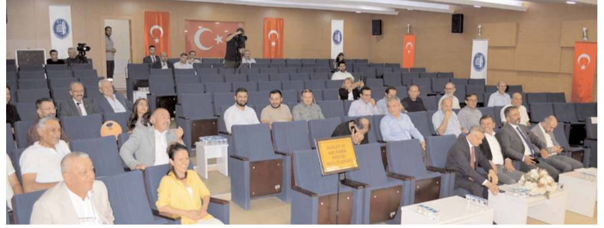
Eylül ayı Meclis toplantısı gündem maddelerinin görüşülmesinin ardından sona erdi.

da bulundu. Sistemin ayrıntıları hakkında bilgiler veren Başkan Aşgın, "Öğrenciler abonman bilet kullanabilecekler. 60 binim 175 TL, sınırsız binim ise 250 TL olacak. Bu haktan 25 yaşını doldurmamış ve örgün eğitimde olan (açık öğretim dahil değil) herkes yararlanabilecek" dedi.