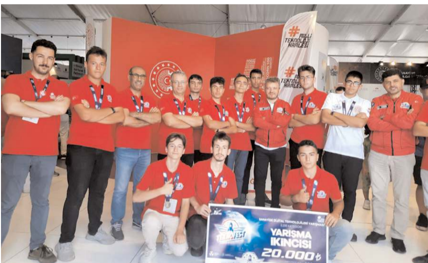
TOBB-OSB Mesleki ve Teknik Anadolu Lisesi takımı ikinci oldu.

TEKNOFEST Havacılık, Uzay ve Teknoloji Festivali'ne Çorum İl Milli Eğitim Müdürlüğü adına katılan projeler üç ödül kazandı.