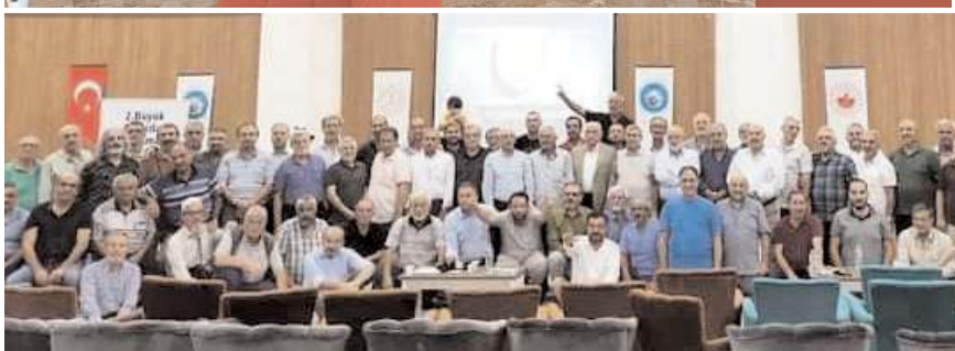
Toplantının sonunda toplu hatıra fotoğrafı çekildi.

03-04 Eylül Cumartesi ve Pazar günleri Nevşehir'de buluşan Akıncılar yeniden teşkilatlanarak hareket etme kararı aldı.