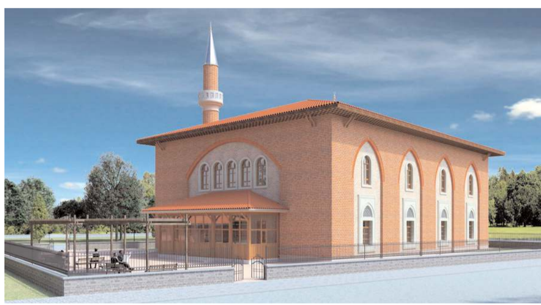
Sanayi Mescidinde çalışmalar devam ediyor.