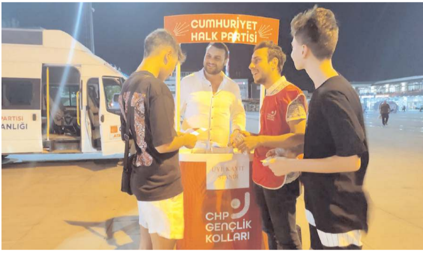
CHP'li gençler, dağıttıkları bildirilerle vatandaşlara 'bize katılın' çağrısında bulundu.