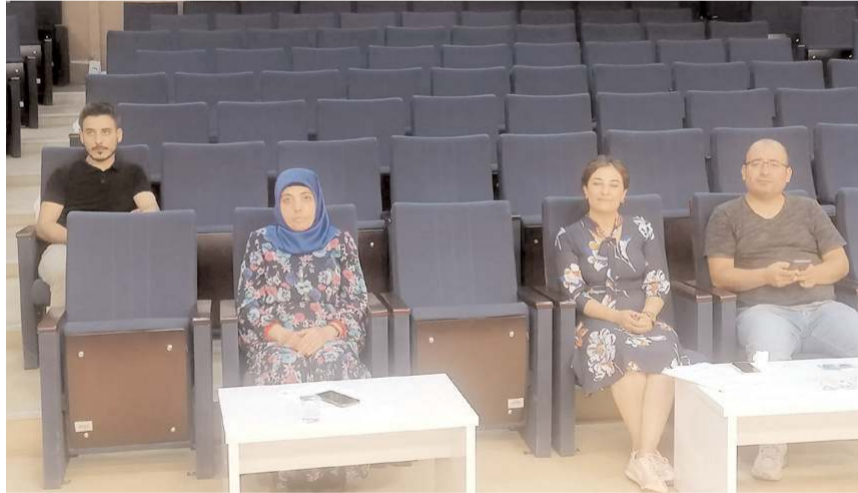
İhale e-ihale olarak gerçekleştirildi.