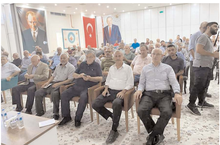
Program 03-04 Eylül Cumartesi ve Pazar günleri Nevşehir'de yapıldı.