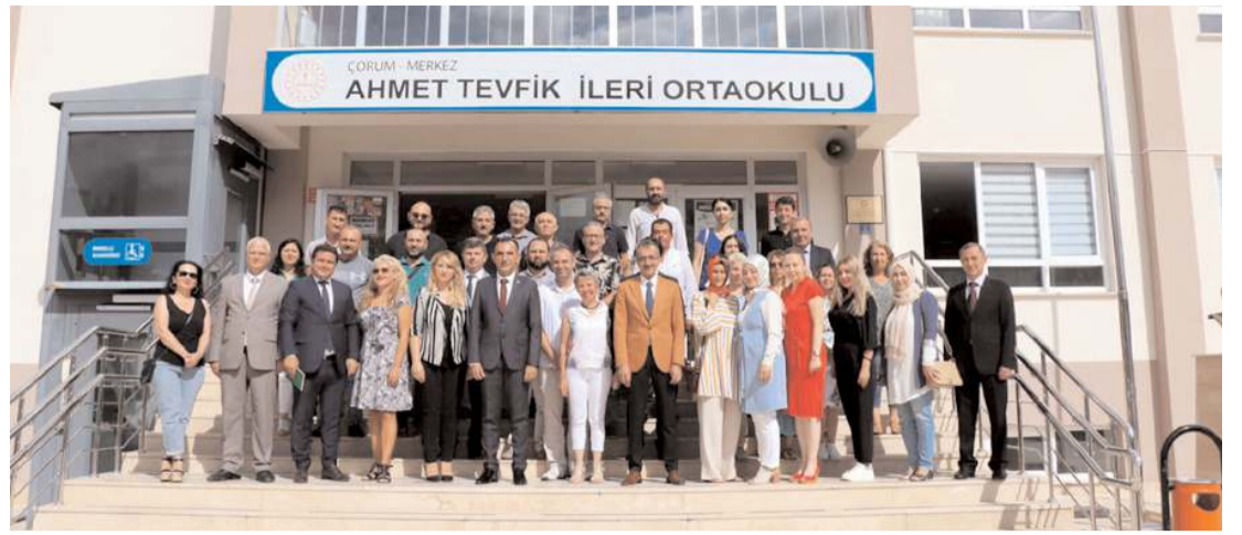
Milli Eğitim Bakanlığı Destek Hizmetleri Genel Müdürü Levent Özil, Çorum'da incelemelerde bulundu.

nı zedeleyen bir uygulamadır. Biz sınava karşıyız çünkü, verilen uzmanlığın branşlar ile hiçbir ilgisi yoktur. Sınavla uzman olan bir öğretmen kendi branşı ile ilgisi olmayan bir eğitime maruz kalacak sonra sınavına girecek. Biz sınava karşıyız çünkü, velilerin bile öğrencilerini uzman-başöğretmene yazdırma telaşının yaşandığı şu dönemde yapılacak olan sınavında; verilecek olan unvanın da iptalini istiyoruz. Öğretmenler odasında tek statüde öğretmen olmalıdır. En düşük devlet memuru maaşı alan, yoksulluk sınırının yarısından dahi az olan öğretmenlerin tümünün ücretleri artırılmalı; insan onuruna yaraşır bir ücret getirilmelidir. Ardından kademi dolan her öğretmen unvanı, sınavsız ve şartsız ilgili tazminatardan yararlanmalıdır. Öğretmenlerin yetiştirilmesinden, çalışma şartlarından emekliliğine kadar olan süreci içinde barındıracak gerçek bir Öğretmenlik Meslek Kanunu'na ihtiyaç vardır. Mevcut haliyle bu meslek kanunu bırakın sorunları çözmeyi, var olan sorunları daha da artırmaktadır. TBMM açıldığında yapılması gereken ilk iş tüm paydaşların görüşleri ile Öğretmenlik Meslek Kanunu'nun yeniden ele alınmasıdır. Öğretmenlik Meslek Kanunu ile ilgili yaşanan sorunlara duyarsız kalmayan tüm eğitim sendikalarını da bir arada olmaya bu konu başlığında tek ses olmaya davet ediyoruz" ifadelerini kullandı. (Haber Merkezi)