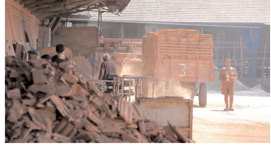
Türkiye'de çatılarda kullanılan her iki kiremitten bir tanesi Çorum'da üretiliyor.

Üretim sezonunun mevsim şartlarına göre yaklaşık 7 ay sürmesine karşın yılın 12 ayı kiremit ve tuğla tedarik edebildiklerini söyleyen