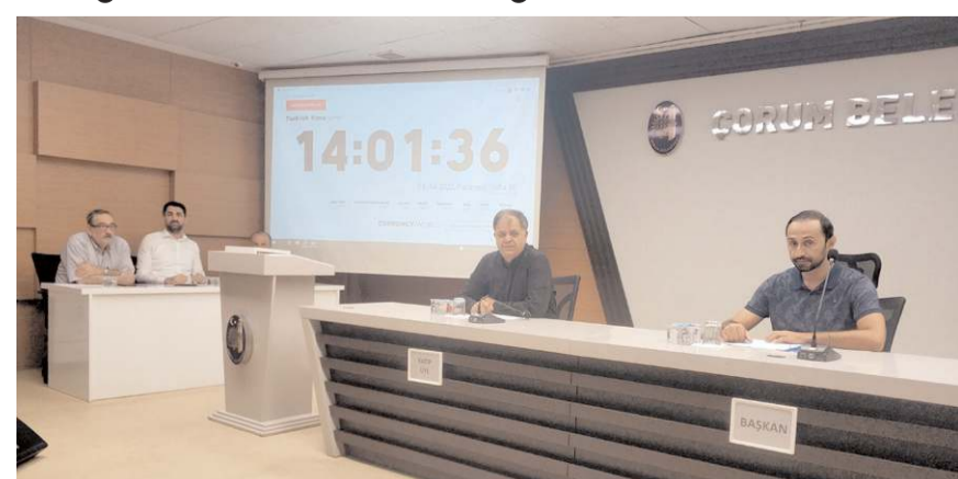
İhaleler Encümen huzurunda yapıldı.

Saat 15.00'de gerçekleşen ihalede ise Dikiciler Arastası'nda bulunan 15 adet işyeri kiraya verilerek ihale edildi.