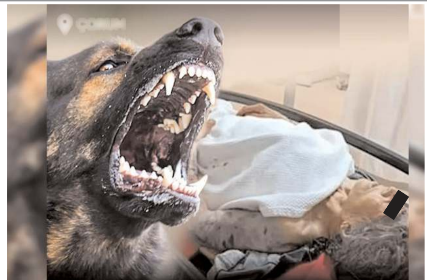
Olay İskilip'in İbik köyünde meydana geldi.

Hastanede tedavi altına alınan talihsiz kadının durumunun iyi olduğu öğrenildi.