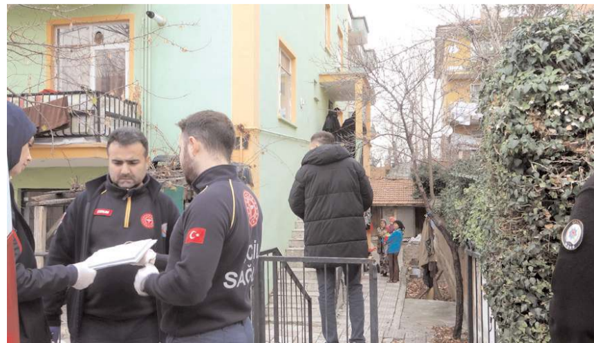
Sağlık ekiplerince yapılan kontrolde, kadının yaşamını yitirdiği belirlendi.