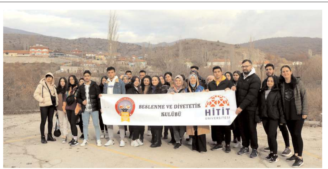
Yürüyüşe Hitit Üniversitesi Beslenme ve Diyetetik Kulübü de katıldı.