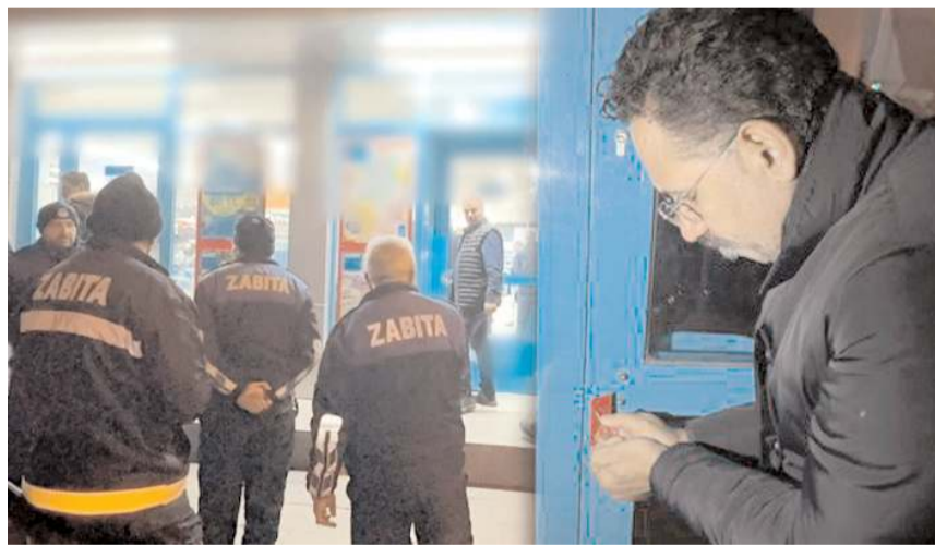
Ticaret İl Müdürlüğü ekipleri ve belediye zabıta ekipleri zincir marketlere yönelik denetimlerini artırdı.

Türkiye genelinde Ticaret İl Müdürlüğü ekipleri ve belediye zabıta ekipleri zincir marketlere yönelik denetimlerini artırdı.