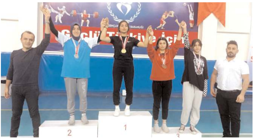
Kategorilerinde dereceye girenlere törenle madalyaları verildi

Müsabakalar sonunda sıktelerinde dereceye girenlere madalyaları verildi.