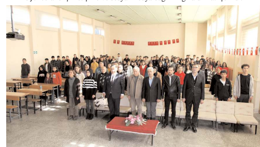
Oyun, Sungurlu Mesleki ve Teknik Anadolu Lisesi konferans salonunda sahnelendi.