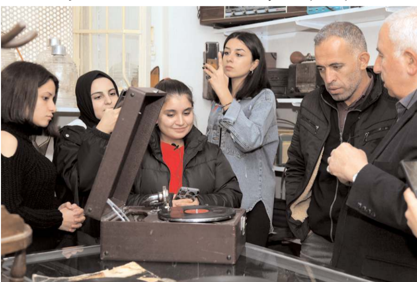
Öğrenciler geçmişte kullanılmış eşyaları yakından görme fırsatı buluyorlar.