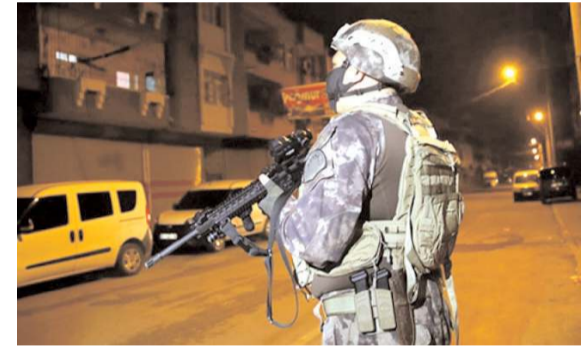
Operasyon yapılan iller arasında Çorum'da bulunuyor.