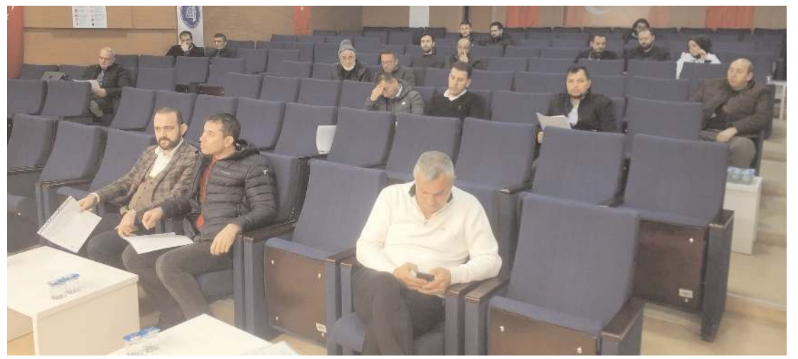
İhale Turgut Özal İş Merkezi Belediye Konferans Salonu'nda gerçekleştirildi.