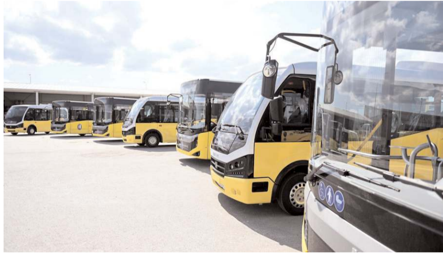
Toplu ulaşım ücretlerinin bazılarına zam yapılırken bazı kalemleri ise sabit kaldı.

ton arası 3,25 liradan 4,90 liraya, 11-20 ton arası 3,65 liradan 5,90 liraya, 21-30 ton arası 3,80 liradan 6,50 liraya, 31 bin ton ve üzeri ise 4 liradan 7,25 liraya yükseltildi.