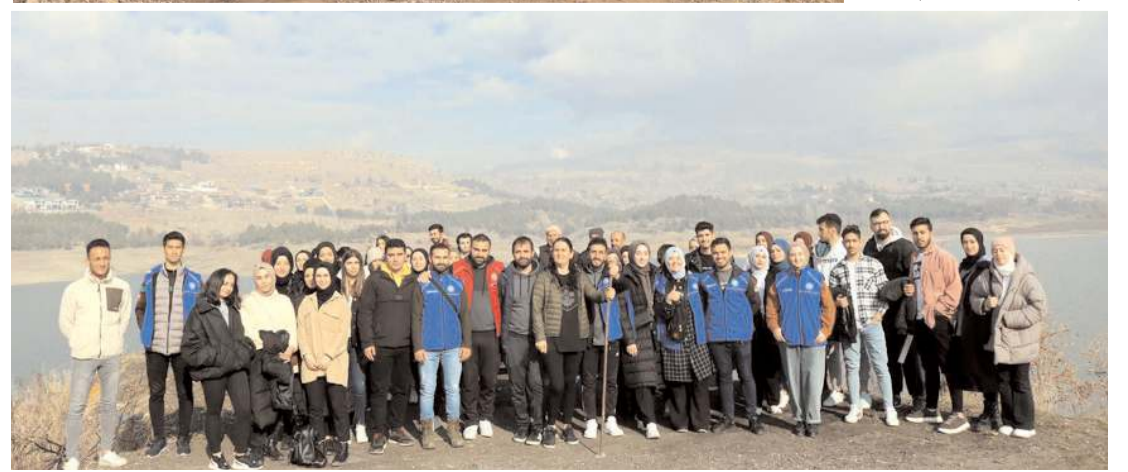
Öğrenciler yürüyüşün sonunda toplu anı fotoğrafı çekindiler.

Katılımcılar etkinliğin düzenlenmesinde emeği geçen herkese teşekkür ettiler. (Haber Merkezi)