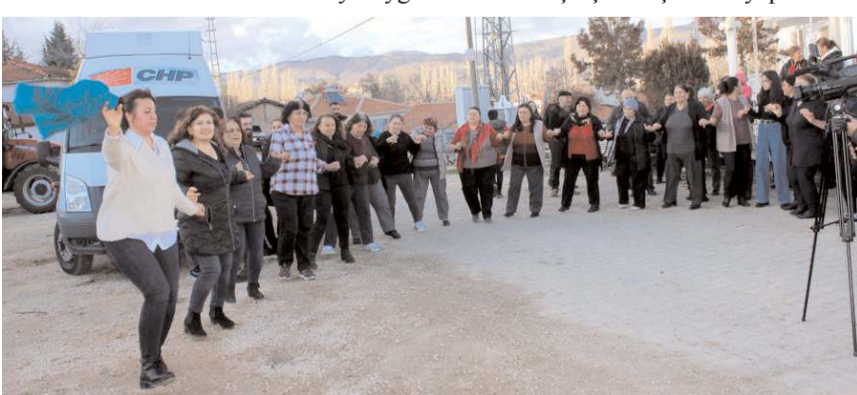
Kutlama programında katılımcılar halay çekti.