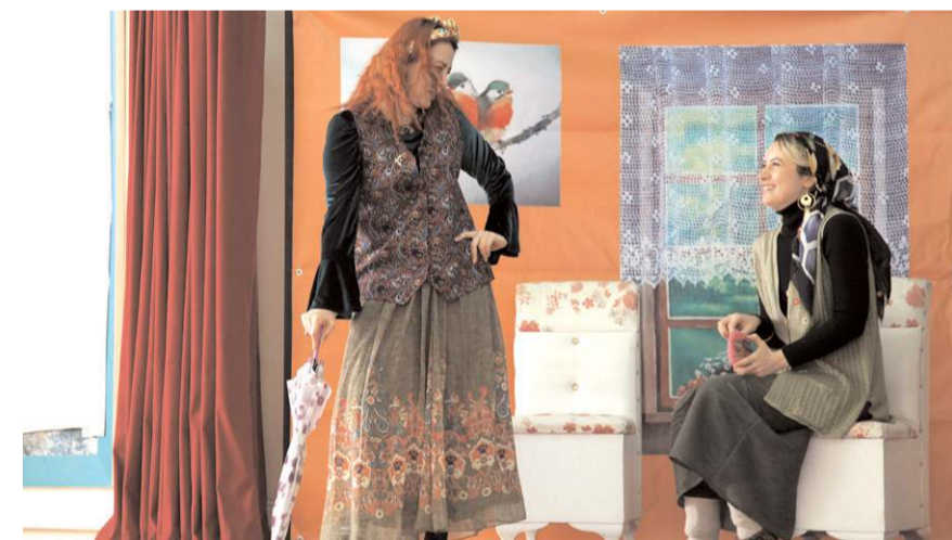
Oyunda aile içi iletişime ve sosyal medya bağımlılığına dikkati çekildi.

Oyun, Çorum ve ilçelerinde sahnelenmeye devam edecek. (AA)