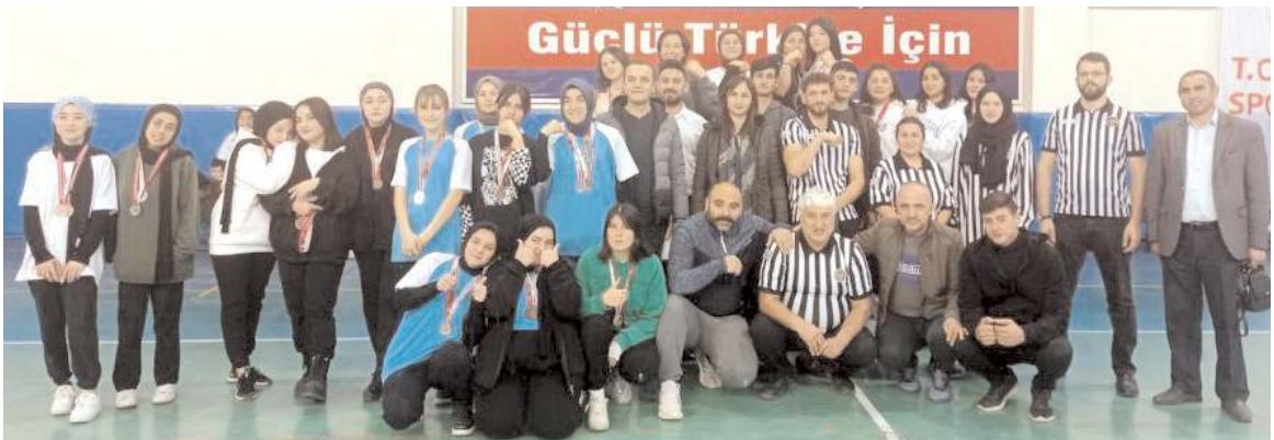
Genç Kızlar Bilek Güreşinde dereceye giren sporcular ödül töreni sonrasında toplu halde