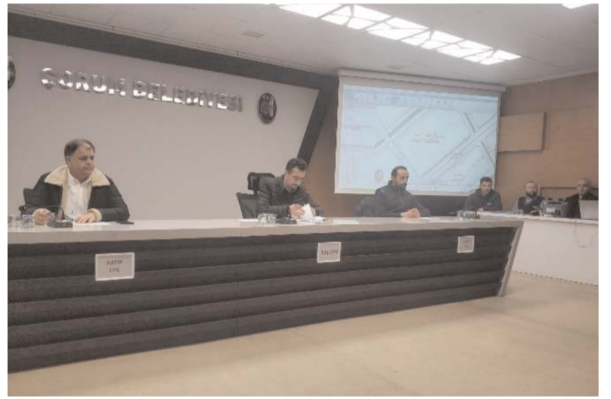
İhale Belediye Encümeni huzurunda yapıldı.

Turgut Özal İş Merkezi Belediye Konferans Salonu'nda Encümen huzurunda açık artırma usulü gerçekleştirilen ihalede muhammen bedelleri 820 bin lira ile 1 milyon 88 bin lira arasında değişen 9 arsa toplam 10 milyon 687 bin liraya satıldı.