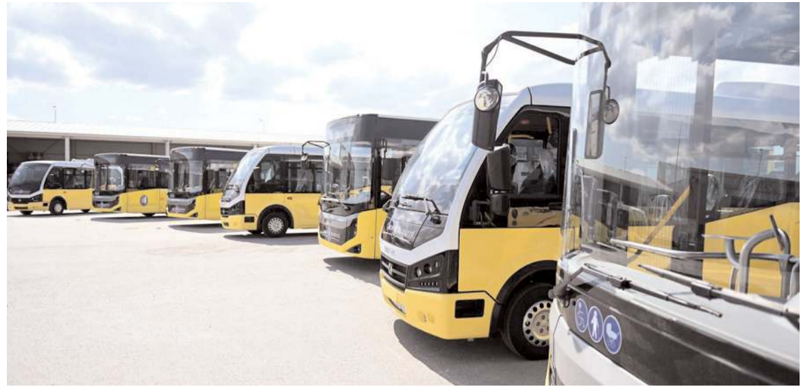
Toplu ulaşım ücretlerinin bazılarında zam yapılırken bazı kalemleri ise sabit kaldı.