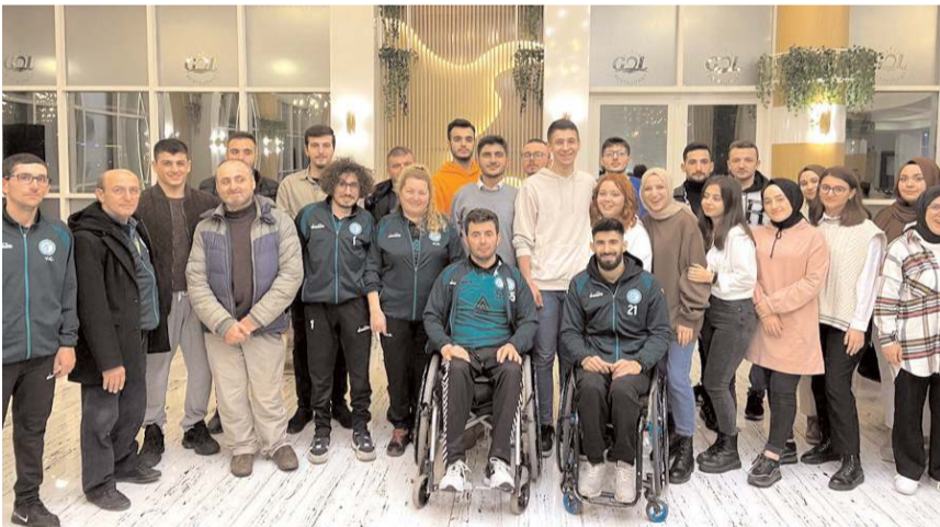
Gençler, maçtan sonra kulüp üyesi sporcularla birlikte yemek programı düzenledi.