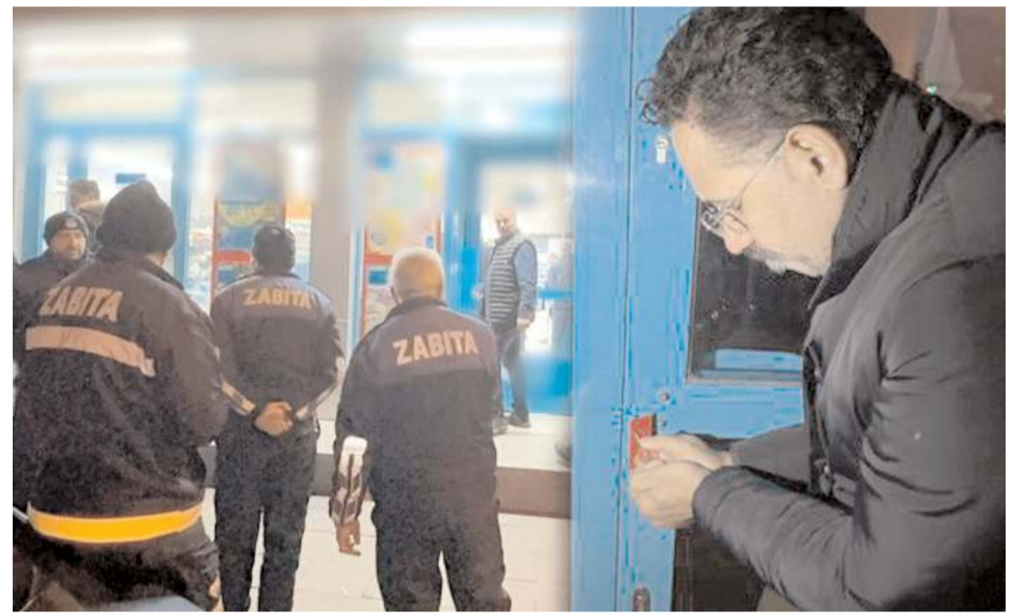
Ticaret İl Müdürlüğü ekipleri ve belediye zabıta ekipleri zincir marketlere yönelik denetimlerini artırdı.

mak üzere toplam 50 ilde gerçekleştirilen operasyonda belirlenen 502 şüpheliden 400'ü yakalanarak gözaltına alındı. Firari şahısların yakalanmasına yönelik çalışmaların ise devam ettiği aktarıldı. (İHA)