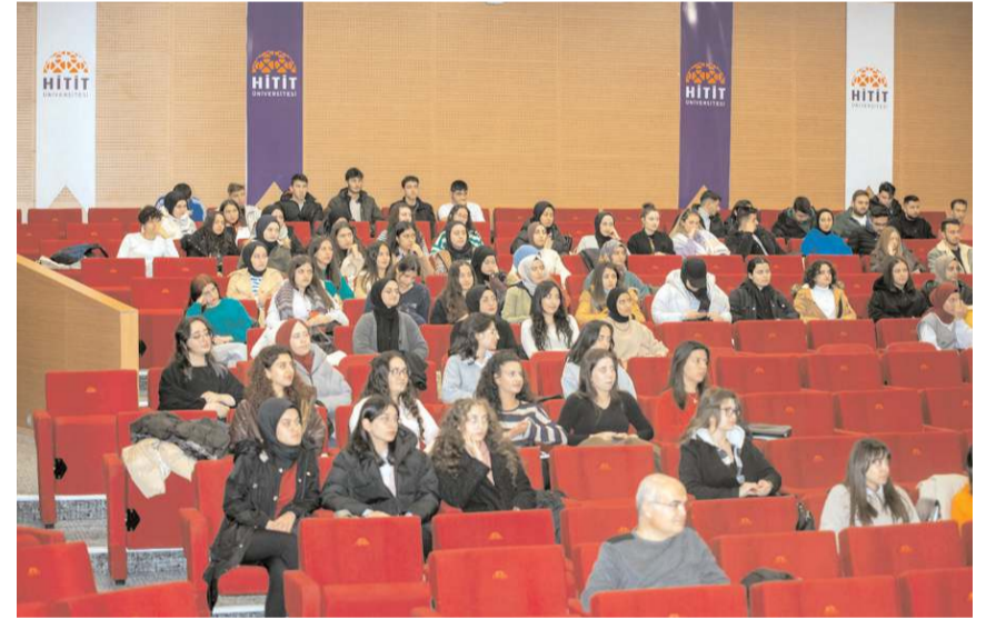
Program MYO Ethem Erkoç Toplantı Salonu'nda yapıldı.

listelerinde yer alabileceğini ifade eden Kayışoğlu, kahvenin yararları ve zararlarıyla da ilgili bilgiler verdi.