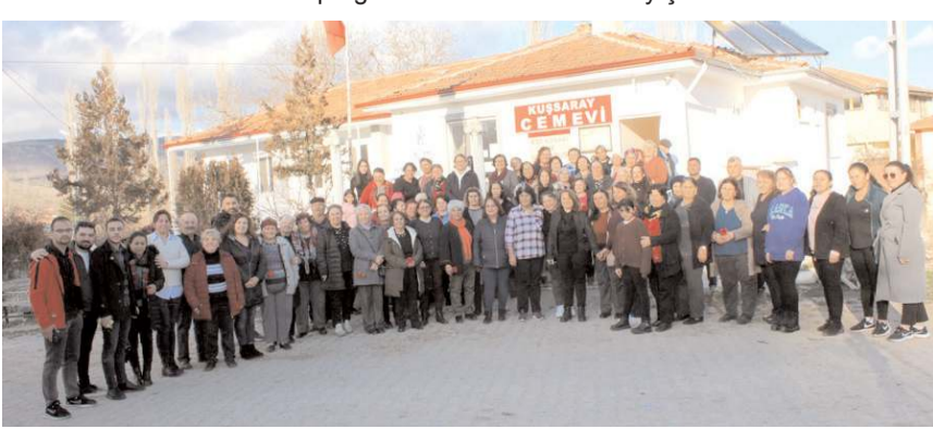
Program çeken toplu hatıra fotoğrafı ile sona erdi.