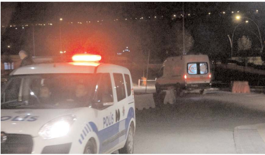
Kaza İnönü Caddesi Terminal Kavşağı'nda meydana geldi.

Çorum'da iki otomobilin çarpışması sonucu 2 kişi yaralandı.