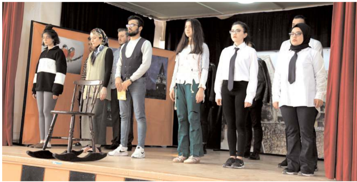
Tiyatro oyununda, polisler ve üniversite öğrencileri rol aldı.