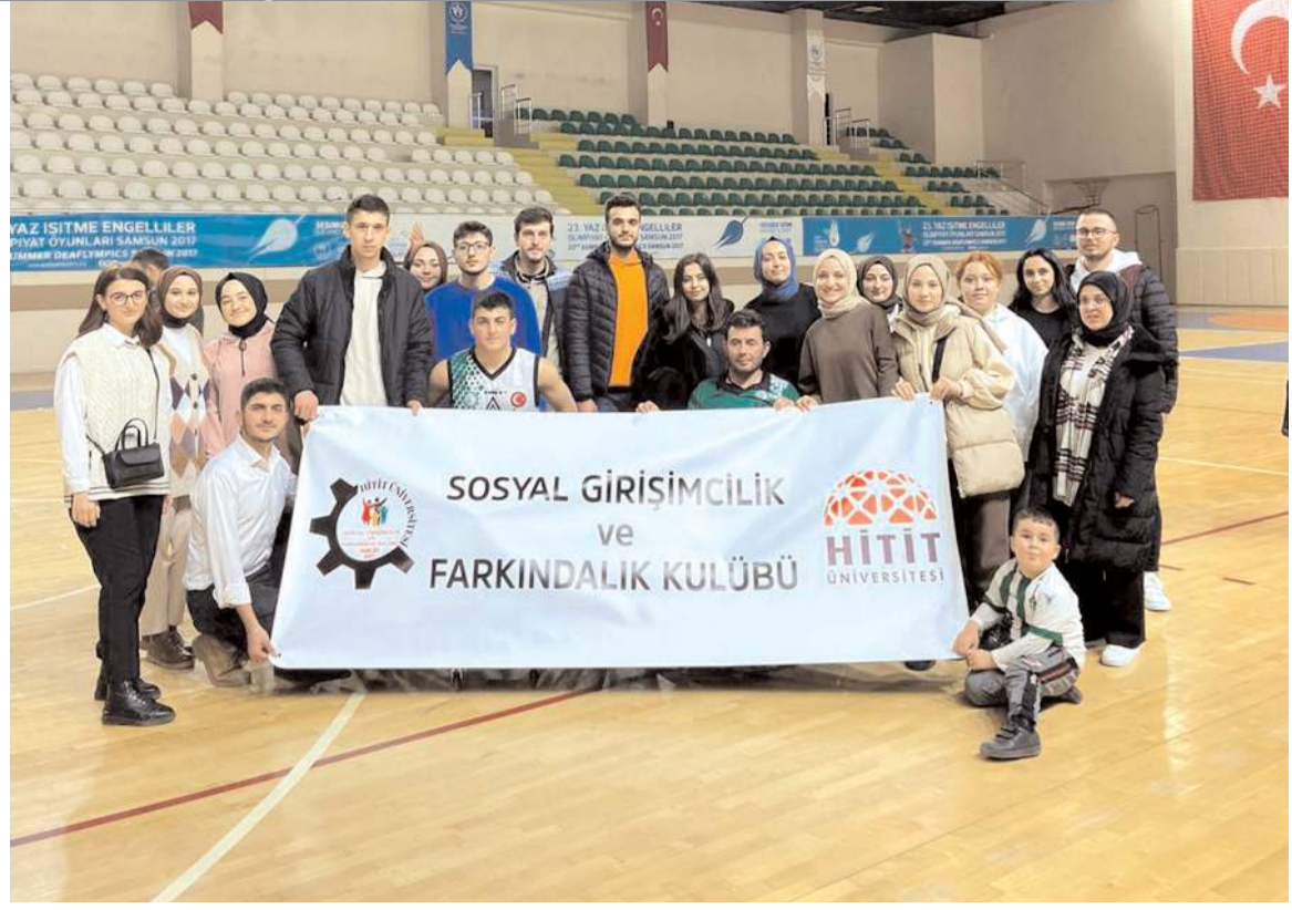
Hitit Üniversitesi Sosyal Girişimcilik ve Farkındalık Kulübü, engelli basketbolcuları yalnız bırakmadı.