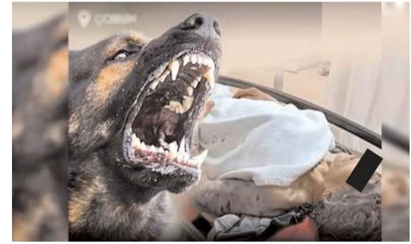
Olay İskilip'in İbik köyünde meydana geldi.