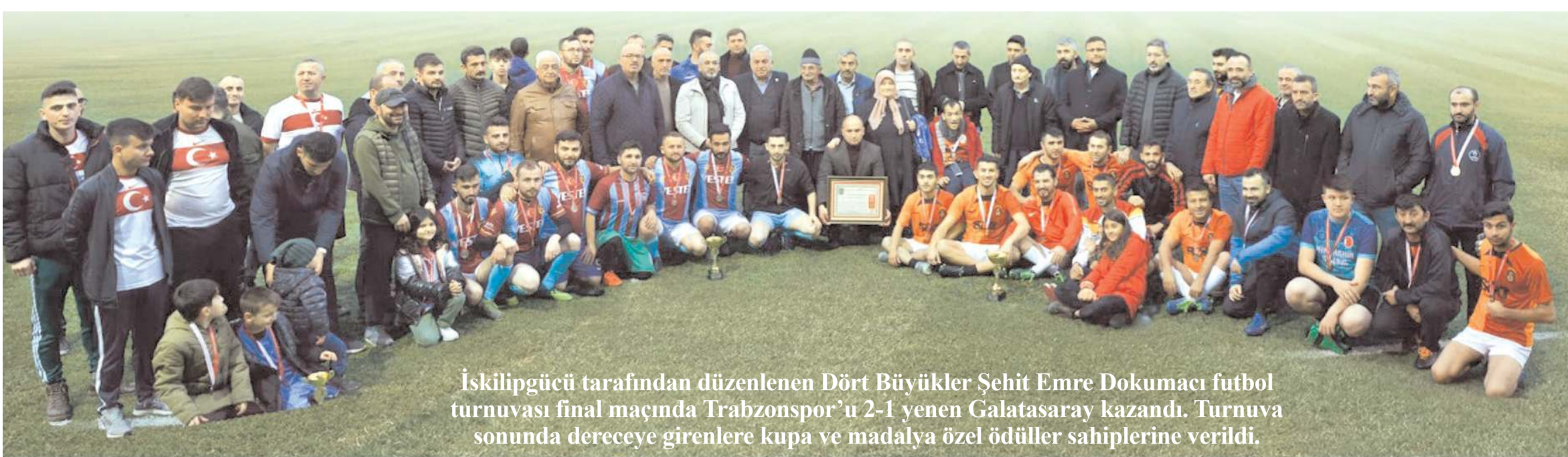
İskilipgücü tarafından düzenlenen Dört Büyükler Şehit Emre Dokumacı futbol turnuvası final maçında Trabzonspor'u 2-1 yenen Galatasaray kazandı. Turnuva sonunda dereceye girenlere kupa ve madalya özel ödülleri sahiplerine verildi.