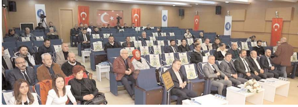
Belediye Meclisi 2022 yılının son toplantısında 10 gündem maddesini görüşerek karara bağladı.