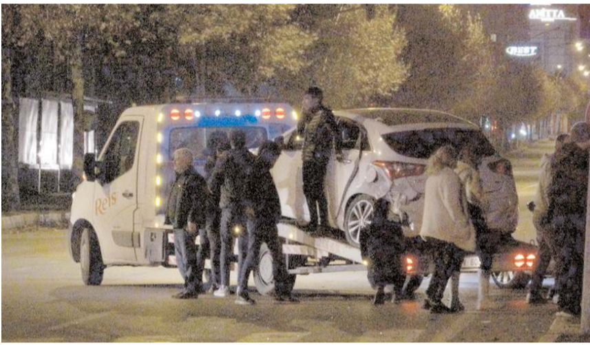
Araçlar çekicilerle kaza yerinden kaldırıldı