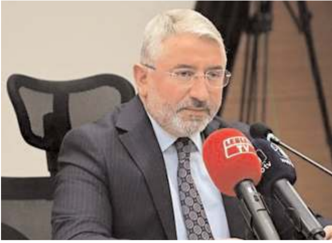
Belediye Başkanı Dr. Halil İbrahim Aşgın

Belediye Meclisi toplantısında konuşan Belediye Başkanı Dr. Halil İbrahim Aşgın, 2023 yılının Türkiye için önemli bir yıl olduğunu ifade ederek, "Cumhuriyetimizin ikinci yüzyılı Türkiye yüzyılı olacak, Çorum yüzyılı olacak. Bu anlamda aşkla çalışmaya şehrimizdeki sorunların çözümü noktasında büyük bir gayretin içerisinde olmaya inşallah 2023'te de devam edeceğiz" dedi.