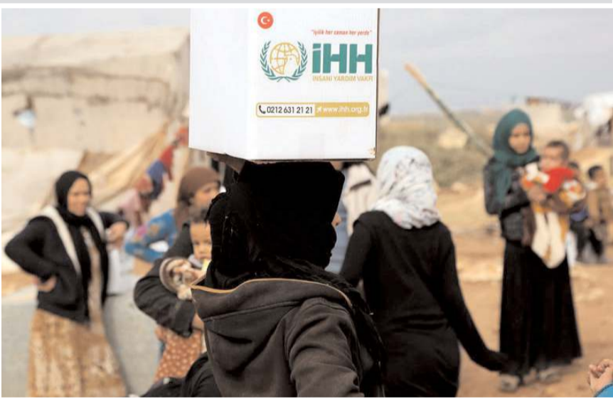
Program 17 Aralık Cumartesi günü yapılacak.

İHH Çorum'dan mazlum coğrafyalara, başta un olmak üzere, kuru gıda, kömür, sıfır kıyafet, battaniye gibi ihtiyaç maddelerini ulaştırmayı hedefliyor. Programa katılım davetiye ile yapılacaktır. Programın davetiyeleri Çorum İHH Murat Evler 6. Sok. No: 12'deki ofisten alınabilecektir. (Haber Merkezi)