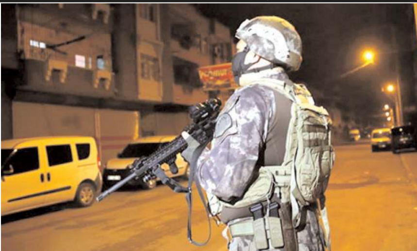
Operasyon 50 ilde 502 şüpheli şahsa yönelik yapıldı.

Ağlarına düşürdükleri kişiler üzerinde baskı, cebir, tehdit ve şiddet yöntemleri kullanarak haksız çıkar sağladığı belirlenen 18 mafya tipi organize suç örgütü ile bu örgütlere silah temini sağlayan 55 suç grubuna yönelik 'Silindir' kod adlı eş zamanlı operasyon gerçekleştirildi. EGM Kaçakçılık ve Organize Suçlarla Mücadele Başkanlığı tarafından organize suç örgütleri ile mücadele çerçevesinde; Adana, Adıyaman, Afyonkarahisar, Ağrı, Aksaray, Ankara,