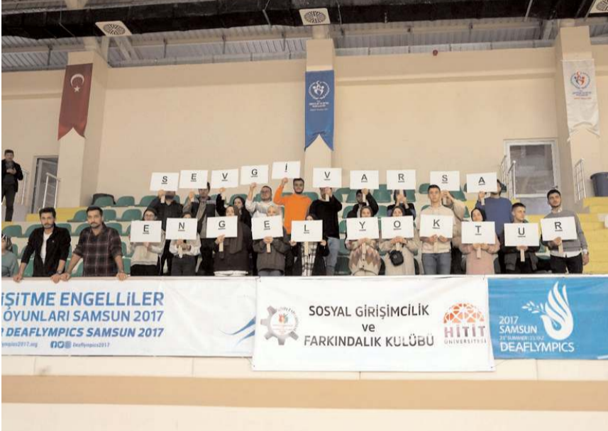
Hitit Üniversitesi Sosyal Girişimcilik ve Farkındalık Kulübü üyesi öğrenciler, engelli basketbolcuları tribünden destekledi.