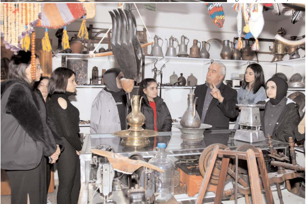
Öğrenciler geçmişte kullanılmış eşyaları yakından görme fırsatı buluyorlar.