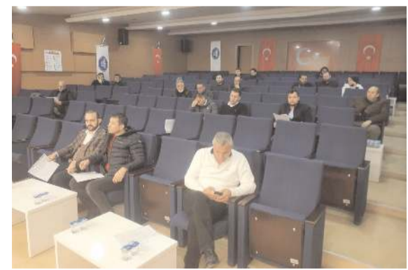
İhale Turgut Özal İş Merkezi Belediye Konferans Salonu'nda yapıldı.