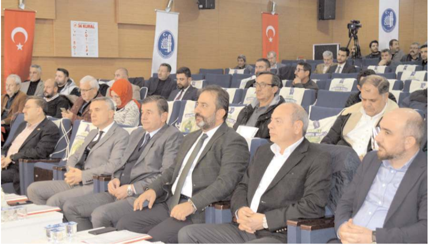
Belediye Meclisi yılın son toplantısını dün yaptı.