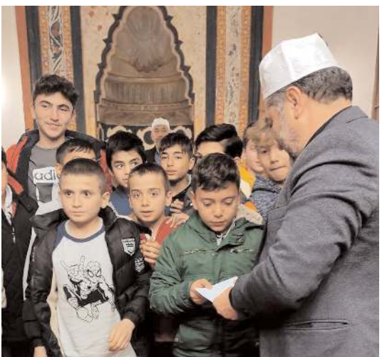
Öğrenciler, kendilerine verilen hediyeleri deprem bölgesindeki kardeşlerine gönderilmek üzere Kızılay'a başışladı.