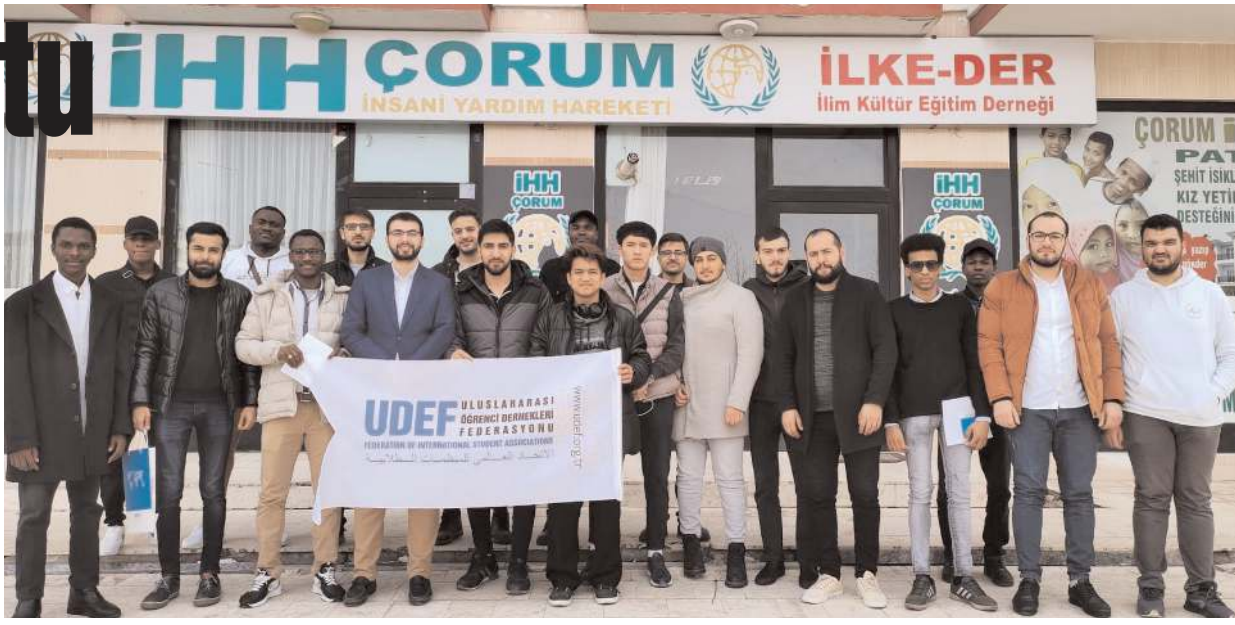
Ziyaretin anısına hatıra fotoğrafı çekinildi.

Yerel Yönetimler Başkanlığı olarak birçok belediyeyi depremde etkilenen şehirlere görevlendirdikleri aktaran Böke, şöyle konuştu: "Sadece Kahramanmaraş'a 54 belediyemizi görevlendirdik. Afşin'de de Çorum Belediyemiz ve İstanbul Çekmeköy Belediyemiz görevli. Bu iki belediyemiz ilçemizi normale çevirmek için canla başla çalışıyor. Normalleşme çalışmaları Çorum Valimiz Mustafa Çiftçi başkanlığında yürütülüyor ve Çorum'un tüm birimleri Afşin'de. Çekmeköy Belediyemiz konteyner kent kurma çalışmalarını devam ettiriyor. İlçemize katkıda bulunan tüm devletyelerimize emeklerinden dolayı teşekkür ediyorum." (AA)