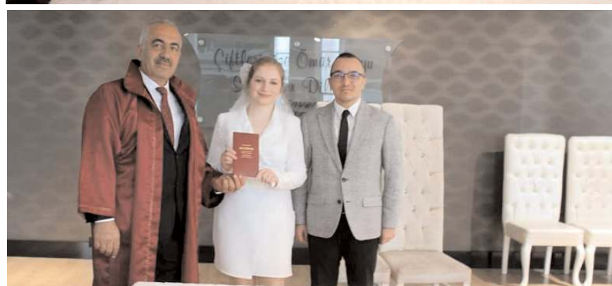
Nikahı Boğazkale Belediye Başkanı Mesut Ocaklı kıydı.