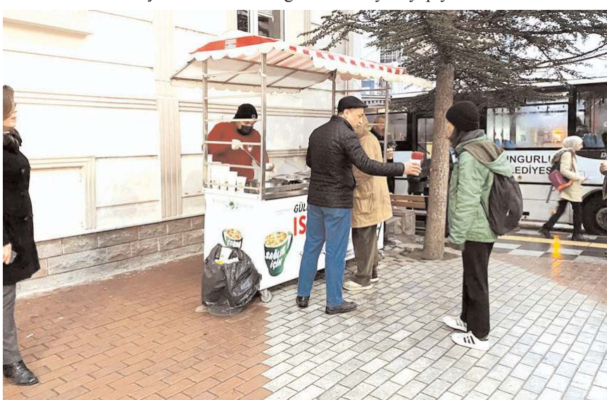
Vatandaşlar uygulamadan duydukları memnuniyeti dile getirdiler.