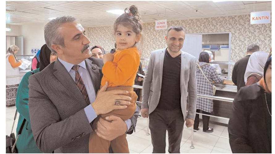
Karapıçak, küçük kızı böyle sevdi...