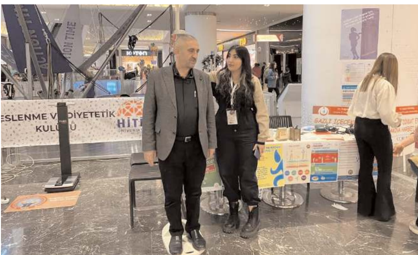
Vatandaşların vücut analizi yapıldı.