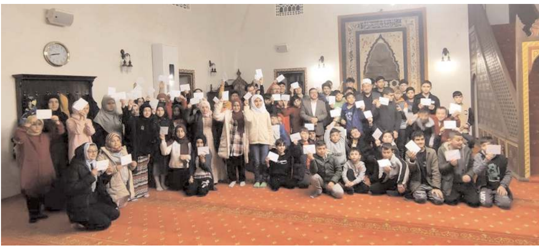
'Cuma Geceleri Ailece Camide Buluşuyoruz' ve 'Camideyim Huzurdayım' projelerinin finali Ulu Cami'nde yapıldı.