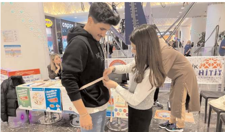
Etkinlikte vatandaşların bel çevresi ölçümü gerçekleştirildi.