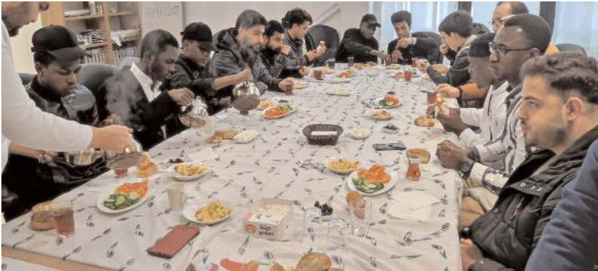
Toplantı kahvaltıyla başladı.

"Bu organizasyon sadece Türkiye'de değil Dünya'da gördüğüm en yardımsever kuruluş. Türkiye'nin farklı şehirlerini dolaştım, neredeyse her şehirde dernekleşmiş ve biz uluslararası öğrenciler için imkanlar sunmuşlar. UDEF dernekleri, bizi hem dini açıdan hem de kültürel açıdan geliştirmek ve bizim maddi manevi sıkıntılarımıza çözüm üretmek için kurulmuş harika bir organizasyon. Ben kendim ve ülkem adına çok teşekkür ediyorum." (Haber Merkezi)