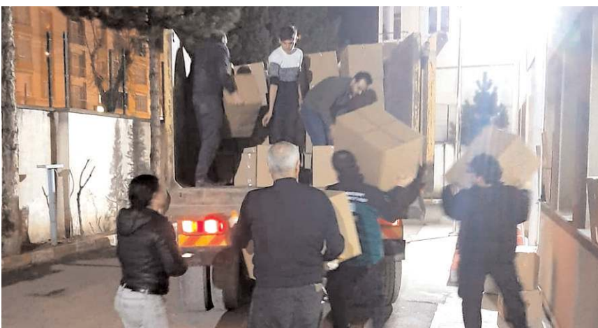
Toplanan yardımlar kamyonlara yüklenirken...

Çorum Memur-Sen Kadınlar Komisyonu, "Kadınlardan Kadınlara Dayanışma Vakti" diyerek depremzede kadınların ihtiyaçlarına yönelik yeni bir kampanya başlattı.