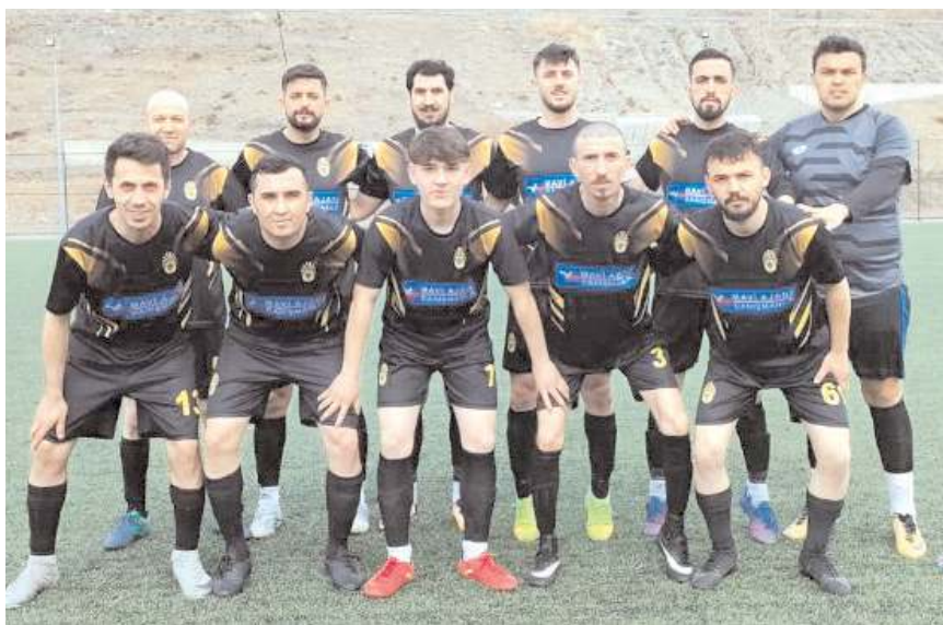
Kargiserispor ligde ilk maçında deplasmanda farklı kazanarak lider başladı