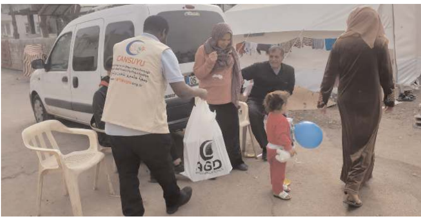
Ekipler, vatandaşların yardımına böyle koşuyor...