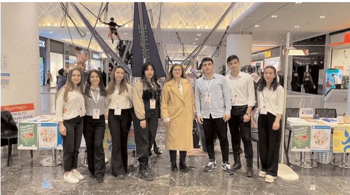
Etkinliğe Hitit Üniversitesi Beslenme ve Diyetetik Kulübü gönüllüleri de katıldı.

Depremde herhangi bir olumsuzluk yaşanmadığı öğrenildi.