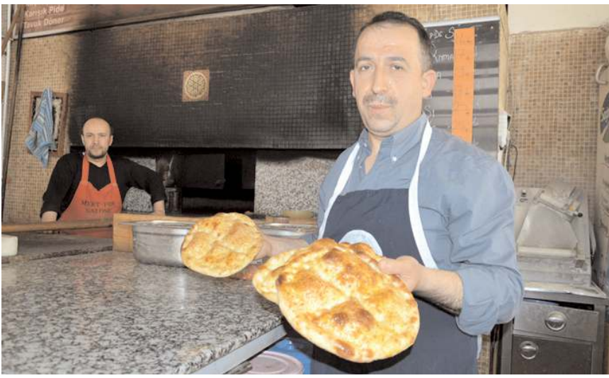
Boş pide 5,5 TL'den yumurtalı-susamlı pide ise 7,5 TL'den satılacak.