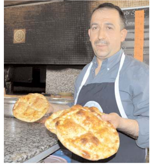
Boş pide 5,5 TL'den yumurtalı-susamlı pide ise 7,5 TL'den satılacak.