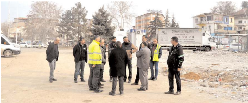
Meydan projesinin hayata geçirileceği alanda inceleme yapıldı.