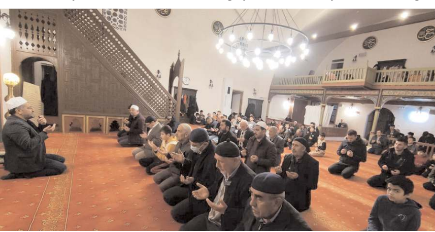
Programda Yasin-i Şerif okunarak, dua edildi.