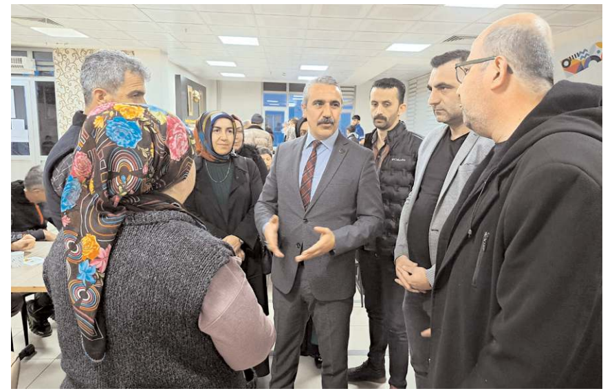
Karapıçak, ailelerin sorunlarını ve taleplerini dinledi.

Depremzedeler, ilgi ve destekleri için MHP heyetine teşekkür ettiler. (Haber Merkezi)