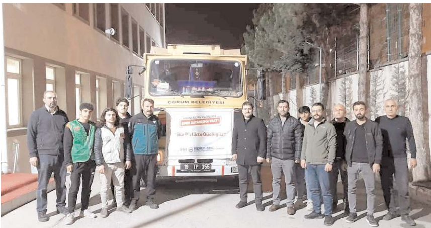
Toplanan kamyon dolusu yardımlar deprem bölgesine gönderildi.