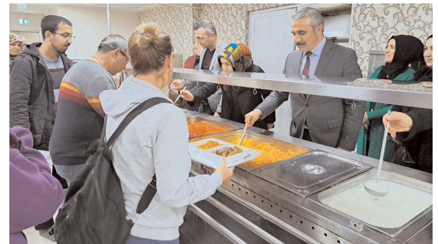
Karapıçak, depremzedelere yemek dağıtırken...