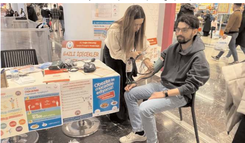
Vatandaşların tansiyon ölçümü yapıldı.