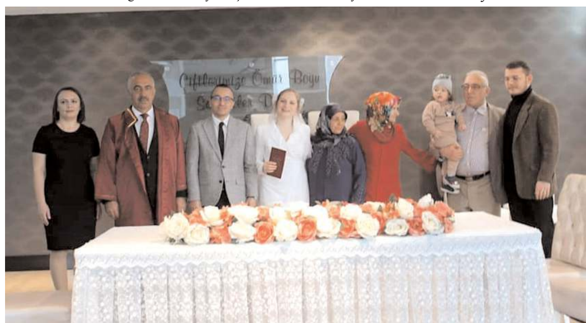
Nikah törenine genç çiftin yakınları da katıldı.