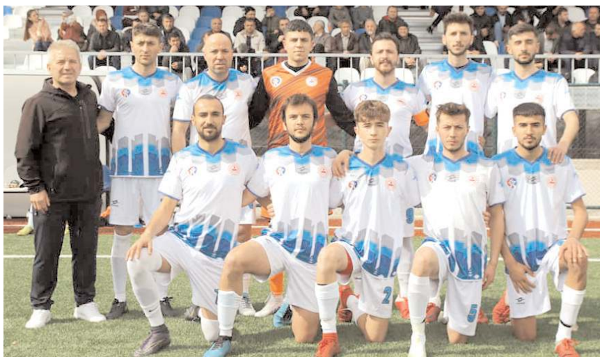
Dodurga Belediyespor ilk kez katıldığı 2. Küme'de ilk maçını kazanarak iyi başladı

lip gelerek ilk haftadan iddiasını ortaya koldu. Kargiserispor'da Necati attığı dört golle takımının farklı galibiyetinde en büyük pay sahibi oldu.