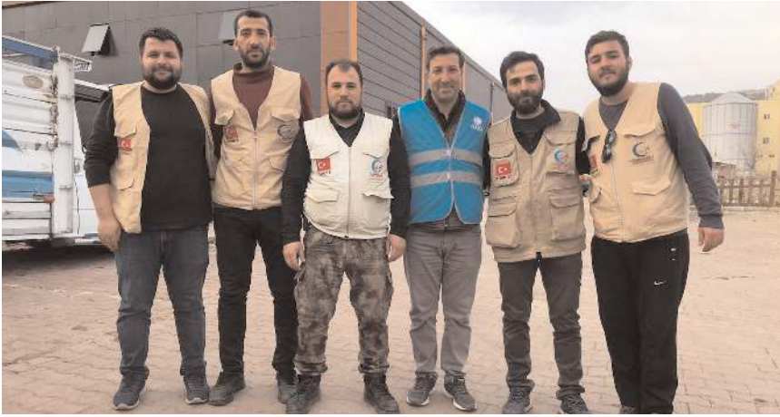
Çorum Cansuyu ekibi, deprem bölgesinde

Günlük su, giyim, gıda ve kömür dağıtımını yaptıklarını aktaran Öztekin, 20 bin kişiye ise aşevlerinde sıcak yemek hizmeti verdiklerini ifade etti.