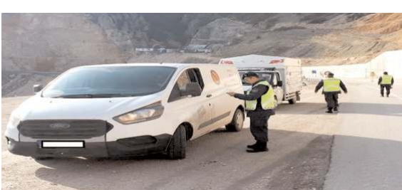
Jandarma ekipleri Kırkdilim'de trafik denetimi yaptı.

■ Uluslararası Öğrenci Dernekleri Federasyonu (UDEF) Çorum temsilciliğinin düzenlediği Gönüllü Ülke Temsilcileri toplantısı İHH Çorum Şubesinde düzenlendi. * HABERİ 8'DE