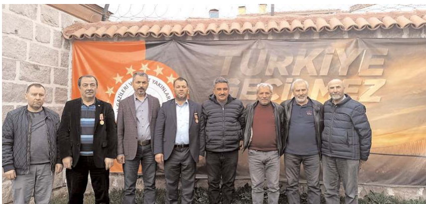
Ziyaretin anısına hatıra fotoğrafı çekildi.