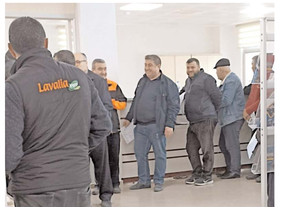
Toplanan yardım kolileri 17 Mart 2023 Cuma günü, Ramazan öncesinde deprem bölgesine gönderilecek.

Konuya ilişkin olarak kaymakamlıktan yapılan açıklamada, "Deprem bölgesine gönderilecek yardımlar 'yardım kolisi' şeklinde teslim alınacak, nakit yardım kabul edilemeyecektir. Nakit yardımı yapmak isteyen vatandaşlarımız, AFAD'ın yardım hesaplarına yardım yapabilir. Vatandaşlarımızın getirdikleri yardım malzemelerini koli olarak paketlenmiş ve üzerinde içeriği yazılmış şekilde teslim etmeleri, deprem bölgesinde yardımların bir an önce depremzede kardeşlerimize dağıtılmasına yardımcı olacaktır. Vatandaşlarımız istedikleri market veya bakkaldan yardım kolisini hazırlatabilecektir. Yardım kolisi içeriğinde bozulacak gıda konulmamasına dikkat edilecektir. Giyim yardımı kabul edilmeye-