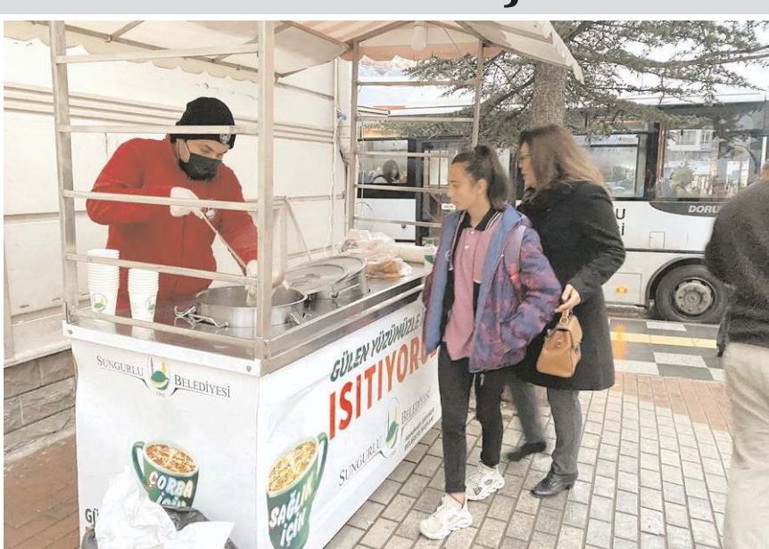
Çorba ikramını Sungurlu Belediyesi yapıyor.