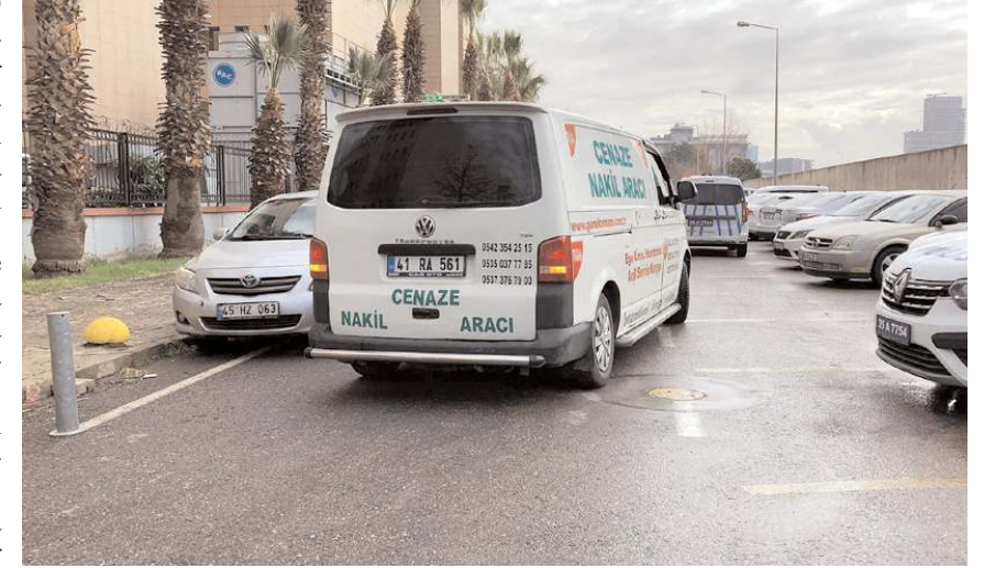
Olay İzmir'in Foça ilçesinde meydana geldi.