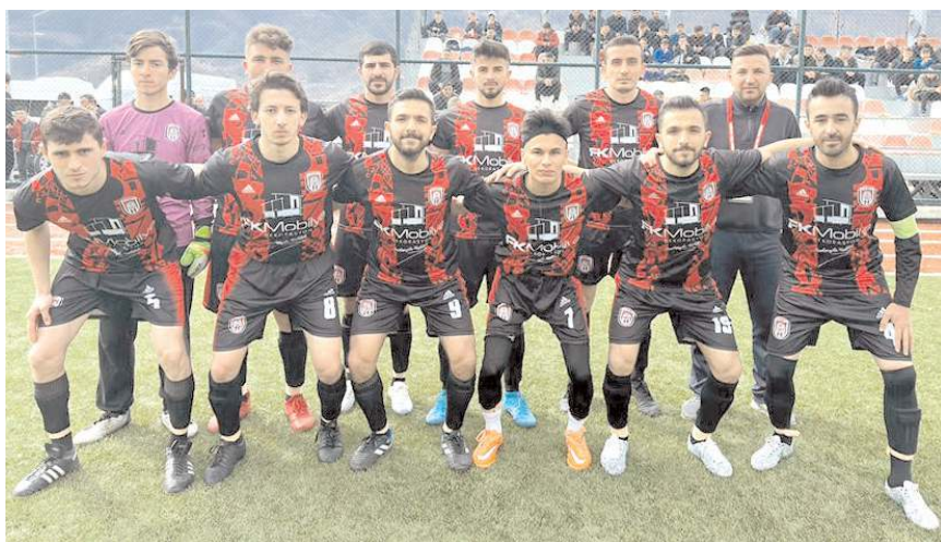
Oğuzlar Belediyespor ilk yarısını 3-1 öne geçtiği maçta 3-3 berabere kaldı