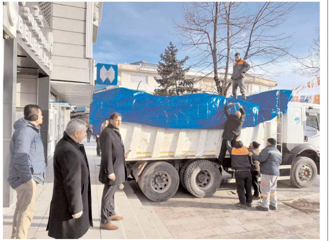
Yardım kampanyasında toplanan yardımlar deprem bölgesine gönderilmeye başlandı.