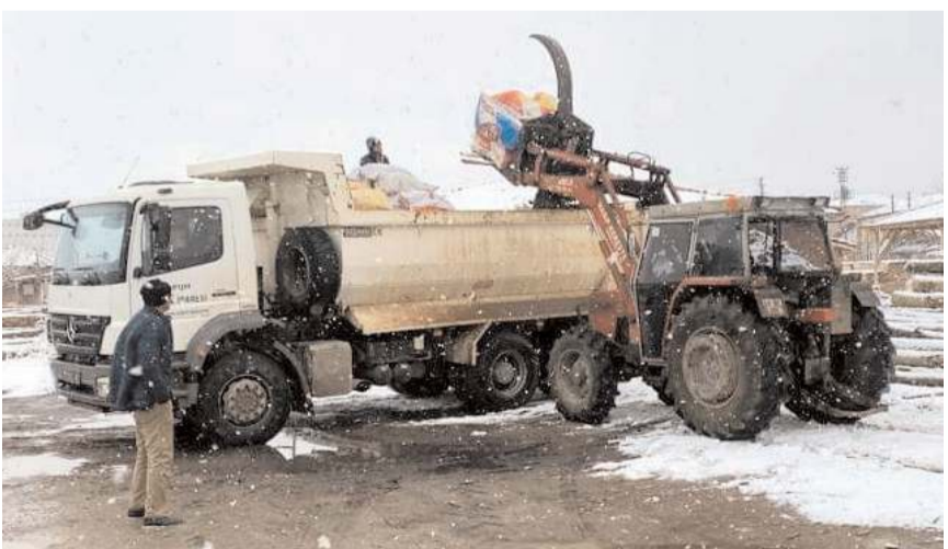
Deprem bölgesine yakacak kömür ve odun gönderildi.