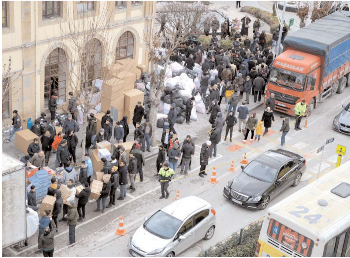
Yardım çağrılarının ardından vatandaşlar belediye binasına akın etti.