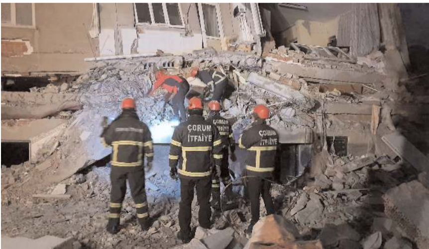
Belediyenin arama kurtarma ekipleri bina enkazlarında çalışmalara başladı.