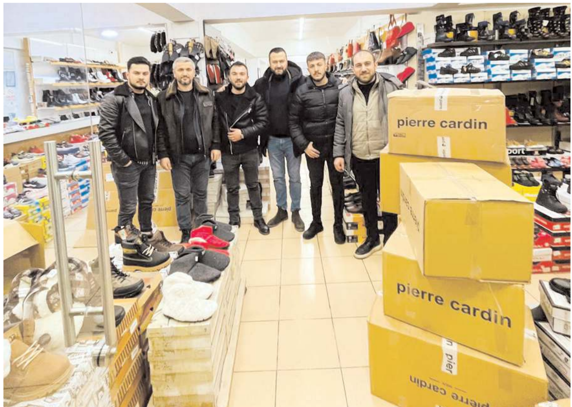
Dikiciler ve Kunduracılar Odası deprem bölgesine 2 bin adet ayakkabı gönderdi.

Ayrıca hayırsever tüm Çorumluları depremlere sahip çıkmaya çağırda bulunan Palabıyık, "Yüce Rabbimiz, ülkemize ve milletimize böyle acılar yaşatmasın. Depremde hayatını kaybeden vatandaşlarımıza Allah'tan rahmet, yaralı vatandaşlarımıza da acil şifalar dilerim" şeklinde konuştu. (Haber Merkezi)