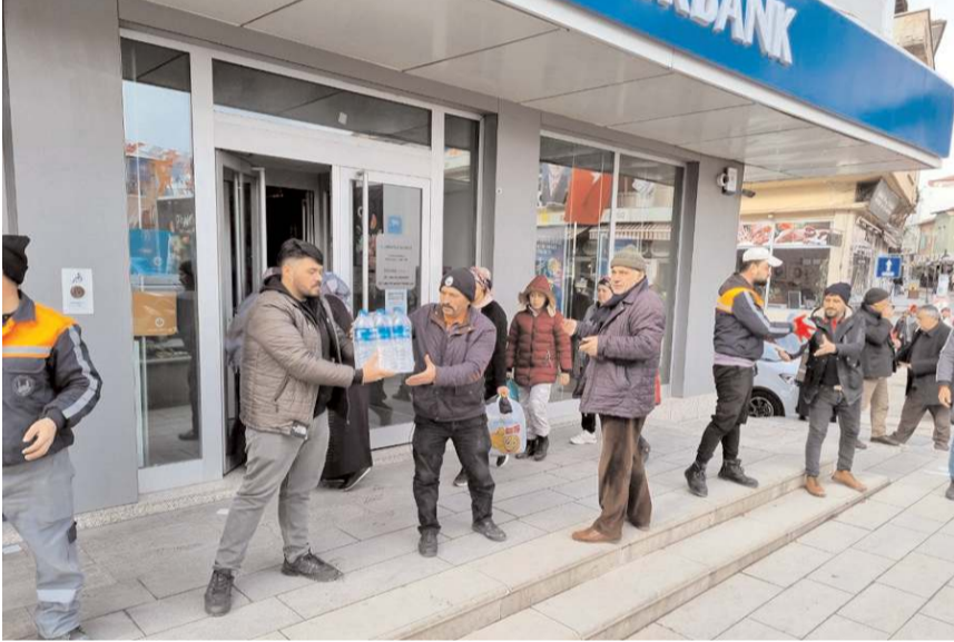
İlçe halkı tek yürek olarak toplanan yardımların bir an önce ulaşması için seferber oldu.