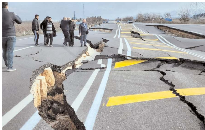
Hatay-Reyhanlı yolunda büyük hasar meydana geldi.

kurumlarımızla sahada bu büyük felaketi de el birliğiyle aşacağız! Rabbim Devletimize ve Milletimize yardım etsin." ifadelerini kullandı.