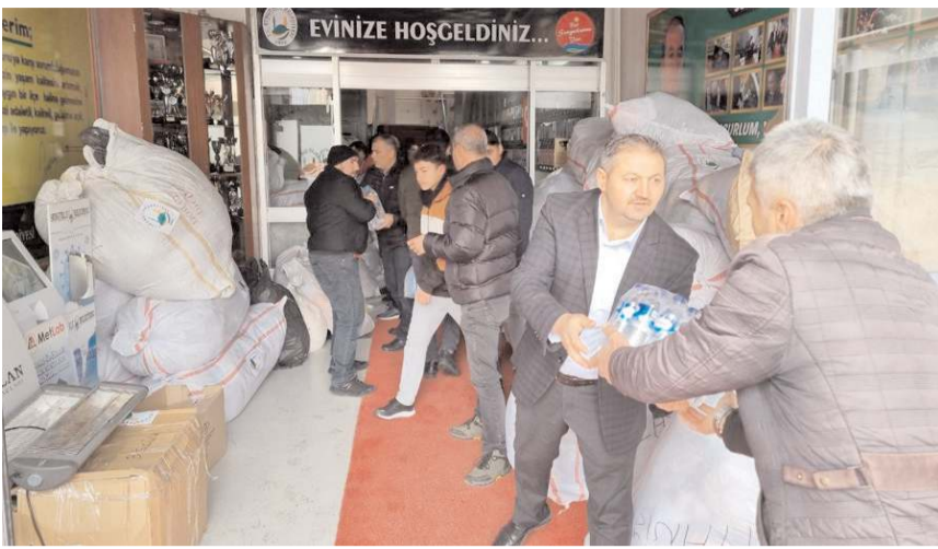
Vatandaşlar deprem bölgesine yardım için seferber oldu.