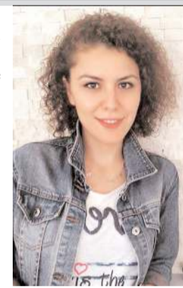
Haber/Yorum ENİSE AĞBAL ÜŞÜMÜS

Bölgede öğlen saatlerinde yaşanan ikinci depremin etkisini Çorum'da da hissettik. Şükürler olsun can kaybımız olmadı ama korkusu herkesi sokaklara döktü. Valilik, Belediye, insanlarımızın psikolojik sarsıntısına destek amacıyla hemen harekete geçti. Kalacak yer, yiyecek yemek, hepsi sağlandı. Deprem bölgesine çığ gibi yardım yağdı. Hava koşulları sert, ulaşım zorlu. Yardımlar ne zaman ulaşır bilinmez ama memlekette bu kadar