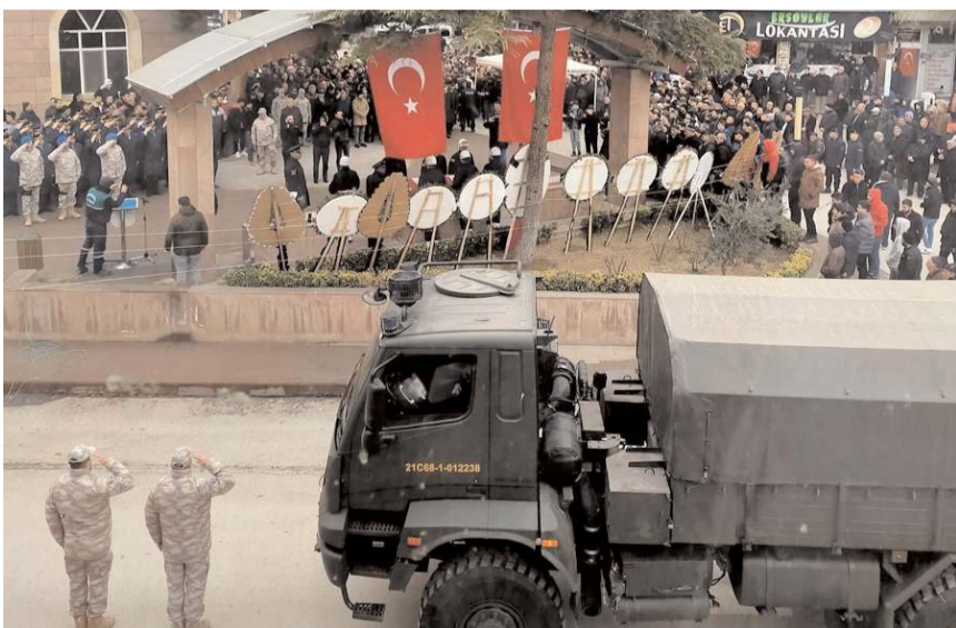
Osmancık Beylerçelesi Camii'nde ikinci namazına müteakip cenaze namazı kılındı.