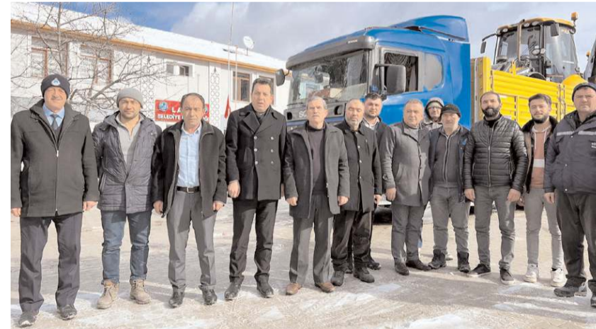
İş makineleri törenle afet bölgesine uğurlandı.

Belediyemizden iş makineleri Kahramanmaraş'tan Afşin'e doğru yola çıktı. Gün birlik olma günü." ifadelerini kullandı.