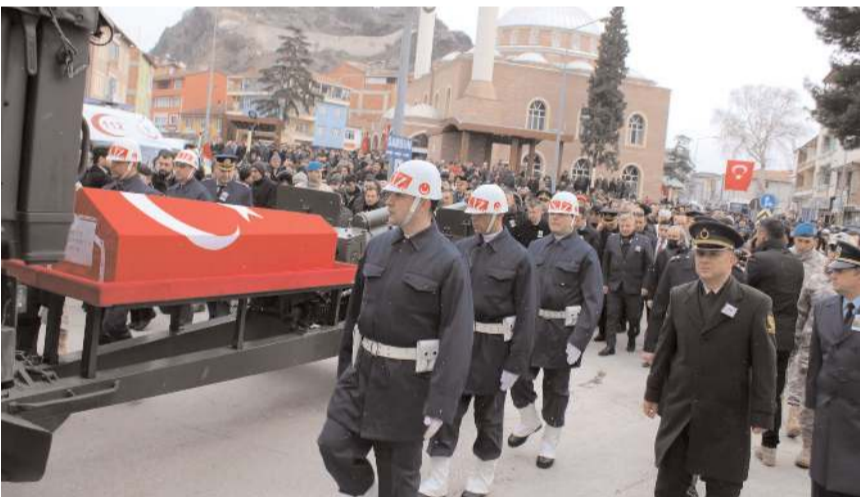
Şehidin cenazesine binlerce kişi katıldı.