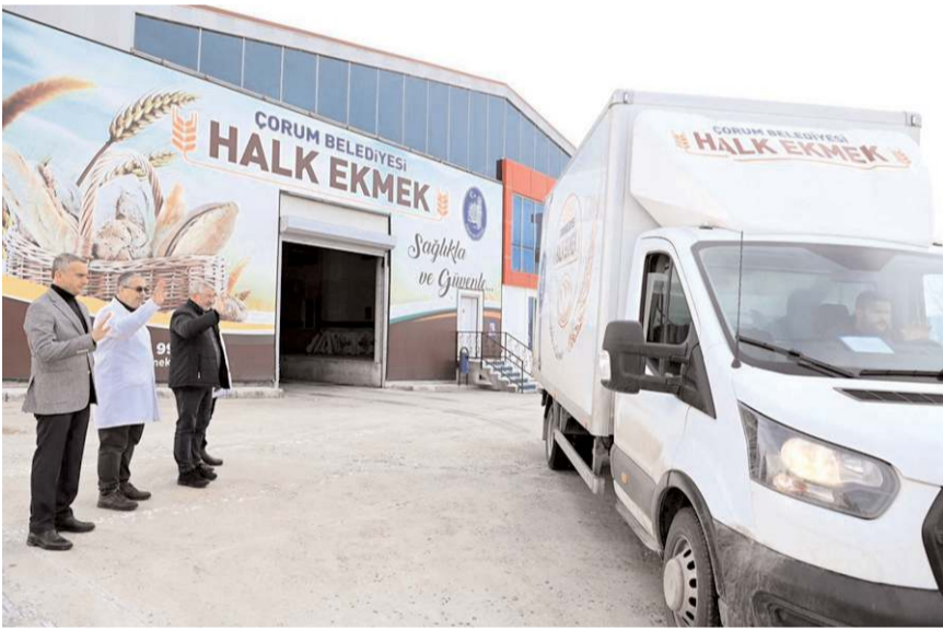
Çorum Belediyesi, afet bölgesine her gün 60 bin ekmeğ gönderecek.