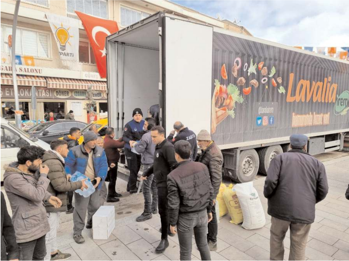
Belediye personeline vatandaşlar da yardım etti.

Çorum'un Sungurlu ilçesinde, vatandaşlar deprem bölgesine yardım için seferber oldu.