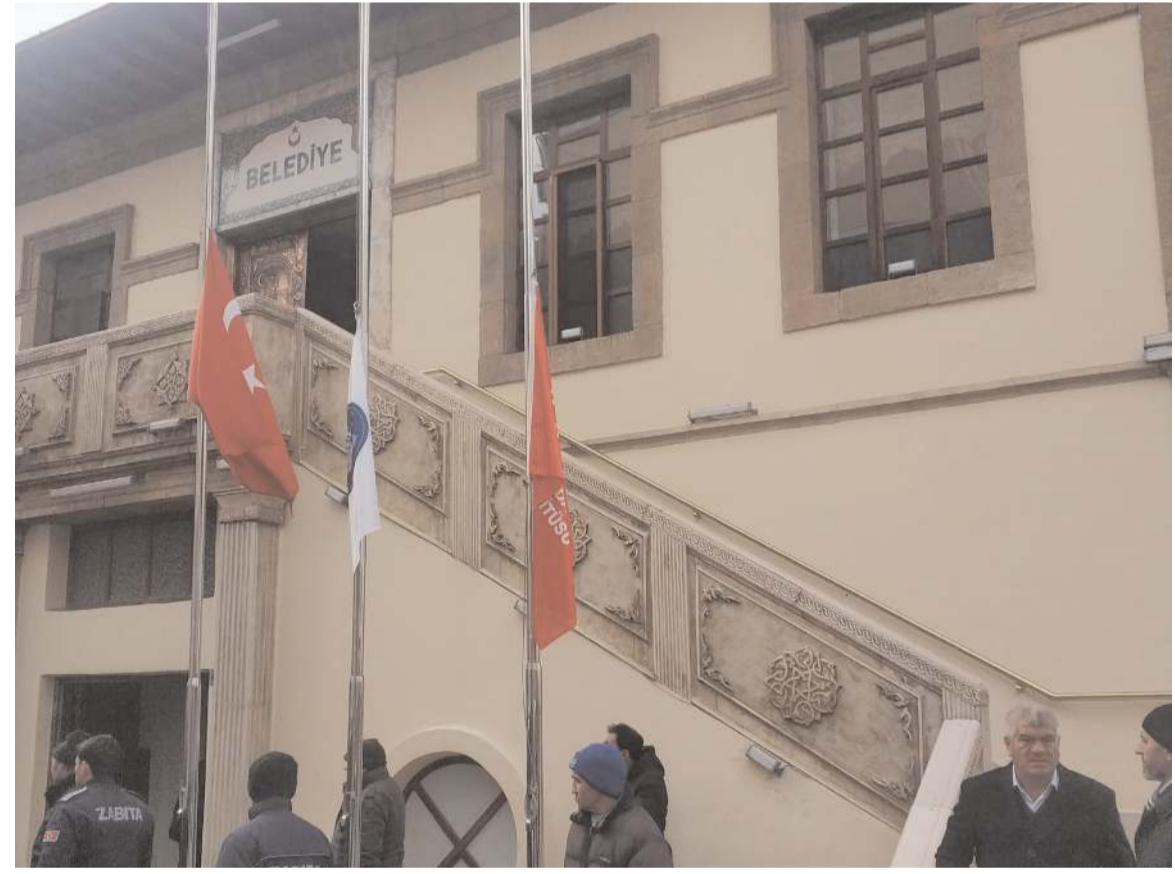
Milli yas ilan edilmesinin ardından Çorum'da da bayraklar yarıya indirildi.