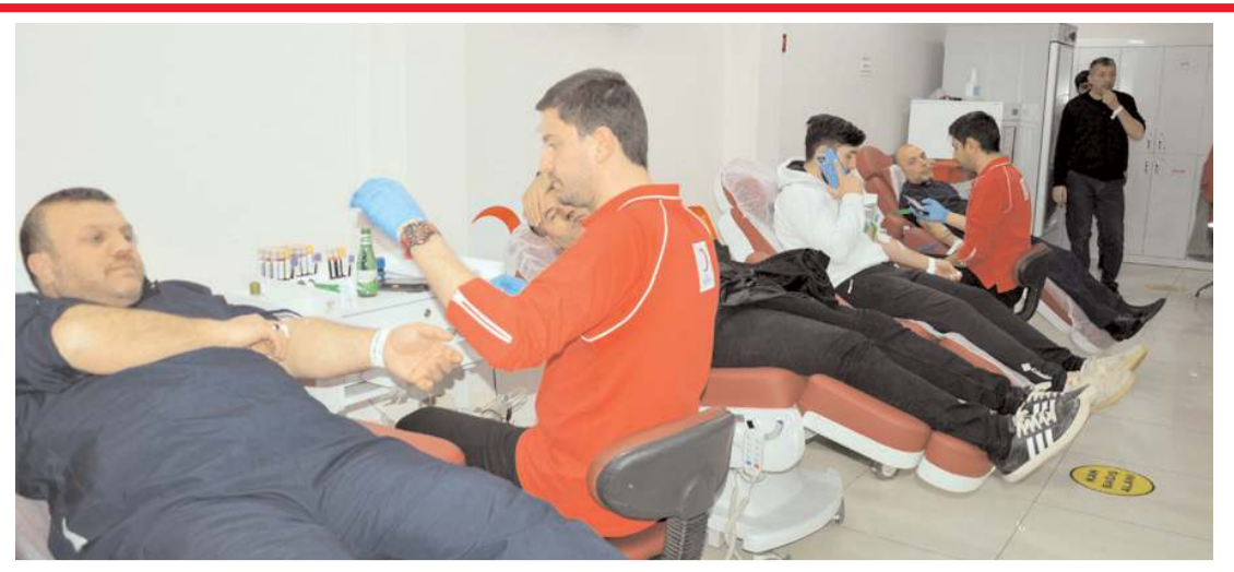
Çorum'da vatandaşlar kan merkezlerine akın etti.