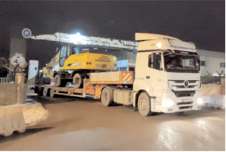
Belediye bölgeye iş makinesi gönderdi.