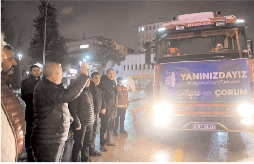
Çorum'da toplanan yardımlar deprem bölgesine gönderilmeye başlandı.