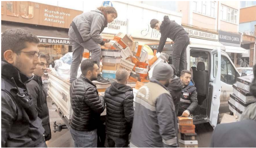
Yardımlar belediye ekiplerine teslim edildi.