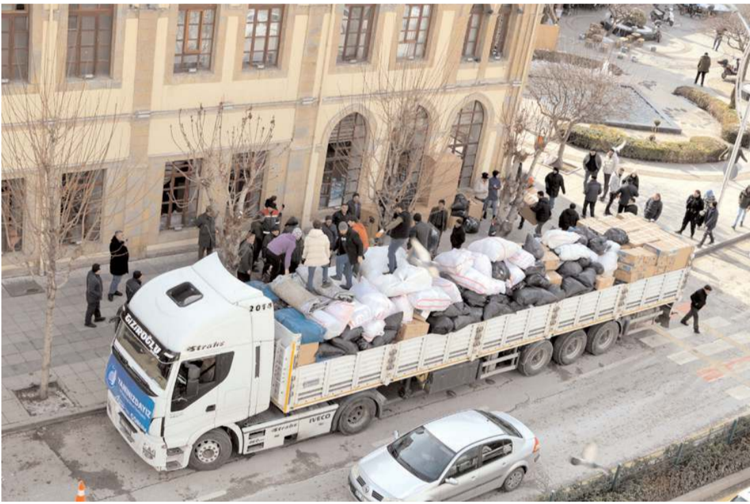
Tasnif edilen yardımlar tirlara yüklenerek deprem bölgesine gönderiliyor.