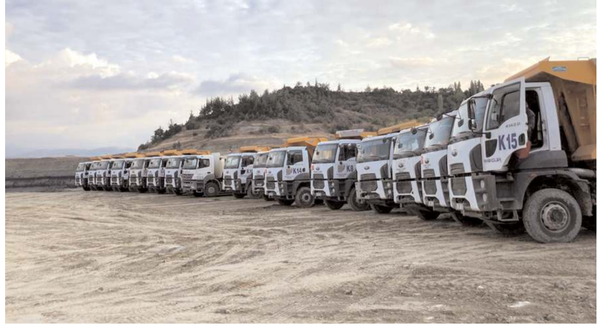
Irmakçılar Proje İnşaat kamyon ve iş makinesini deprem bölgesine gönderdi.