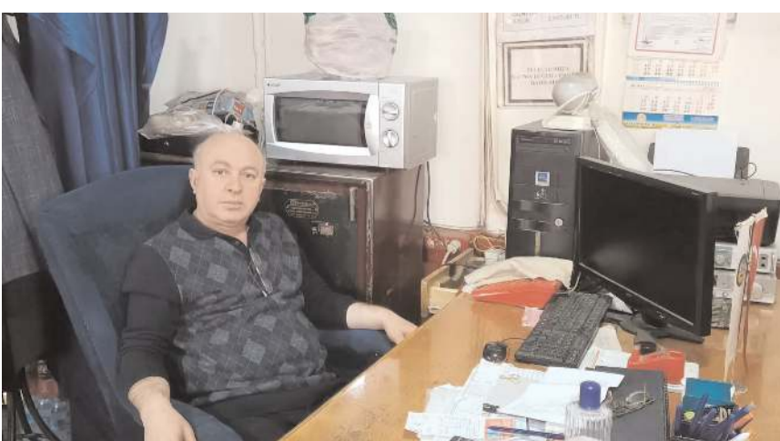
İşletme sahipleri bir günlük kazançlarını bağışladılar.

Şen Kardeşler, aldıkları kararı müşterilerinin de memnuniyetle karşıladığını ifade ettiler.