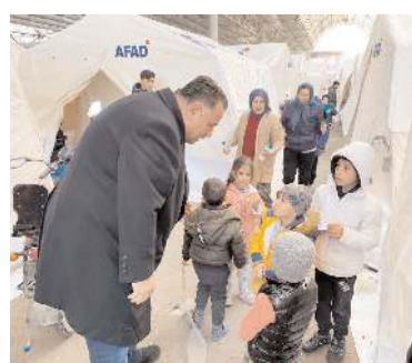
Milletvekili Oğuzkan Kaya, Osmaniye'de çalışmalara katılıyor.