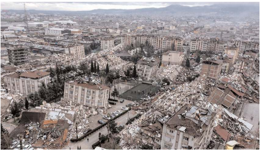
Deprem 10 kentte yıkıma neden oldu.