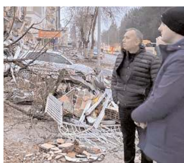
Milletvekili Ahmet Sami Ceylan, Adıyaman'da çalışmalara katılıyor.

■ AK Parti Çorum Milletvekilleri Ahmet Sami Ceylan, Oğuzkan Kaya ve Erol Kavuncu deprem bölgelerine görevlendirildi. * HABERİ 4'DE