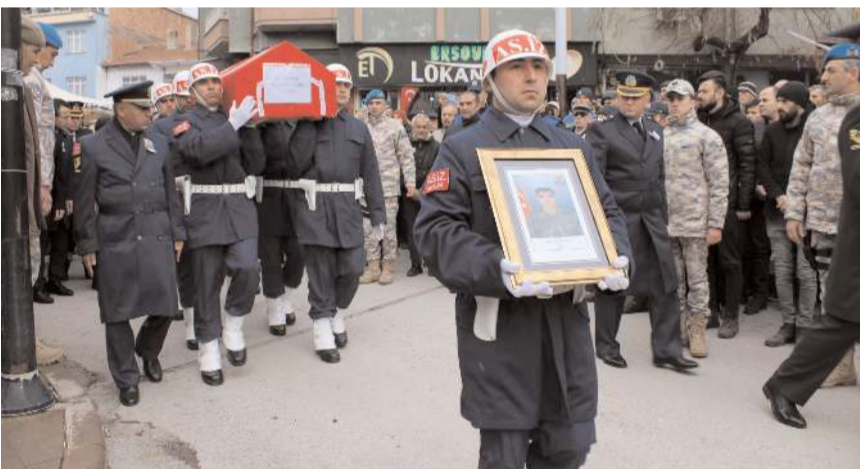
Şehidin cenazesi Türk bayrağına sarılı tabutla Osmancık'a getirildi