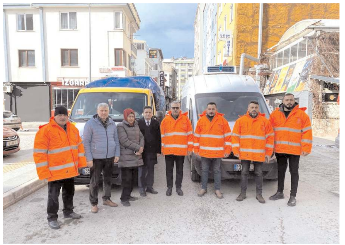
AK Parti İl ve İlçe Teşkilatlarının katkılarıyla hazırlanan acil yardım malzemeleri afet bölgesine uğurlandı.

Çorum Belediyesi afet bölgesine gönderdiği araç ve ekiplerin sayısını da artırıyor. Gece boyu deprem bölgesine araç ve ekipman sevkiyatı devam etti. Peş peşe yola çıkan ekip ve araçlar deprem bölgesine ulaşmaya devam ediyor. (Haber Merkezi)