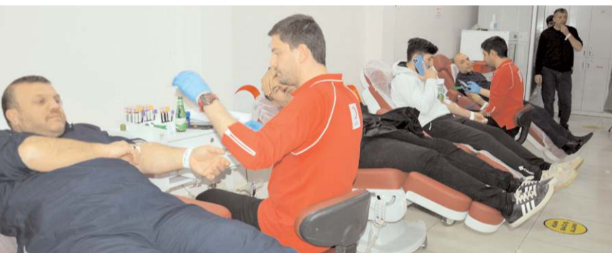
Kızılay kan alımına 10 Şubat'ta yeniden başlayacak.