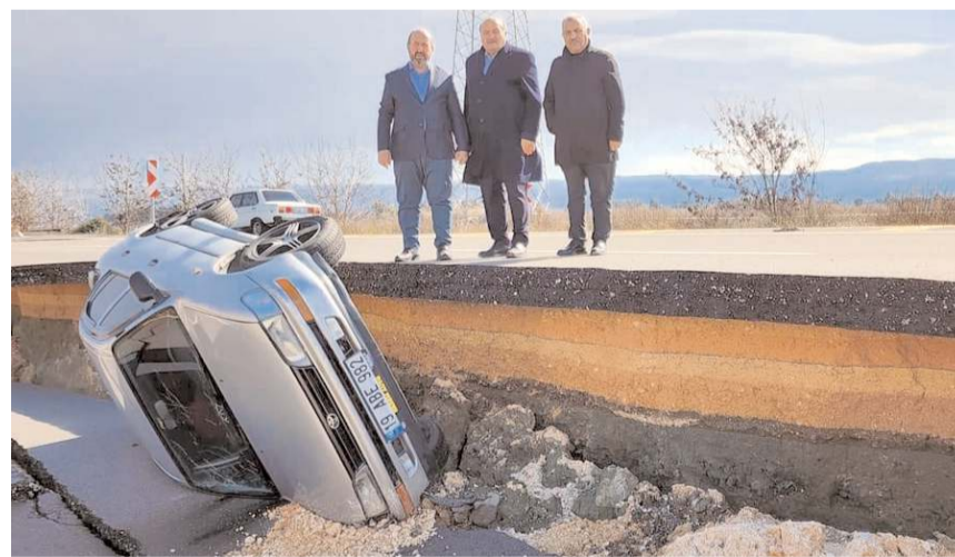
Çöken yolda devrilen araçlardan birisinde Çorum plakalı.

Kavuncu, Hatay'da paramparça olup adeta akordiyona dönen yollar, depremin ne kadar şiddetli olduğunu gözler önüne sermektedir. Son asrın en büyük felaketinin ardından Hatay ilimizde AFAD, asker, polis, sağlık çalışanlarımız ve tüm gönüllülerimizle çalışmalara aralıksız devam ediyor. Ancak depremin büyüklüğü, yeryüzüne yakın ve yerleşim bölgelerinde gerçekleşmesi tahribatı artıran müdahaleyi de zorlaştırmaktadır... Dünyanın hiç bir yerinde aynı anda 10 farklı bölgede binlerce enkazın olduğu bir felaket yaşanmamıştı. Aziz vatandaşlarımız müsterih olsun! Devletimiz tüm