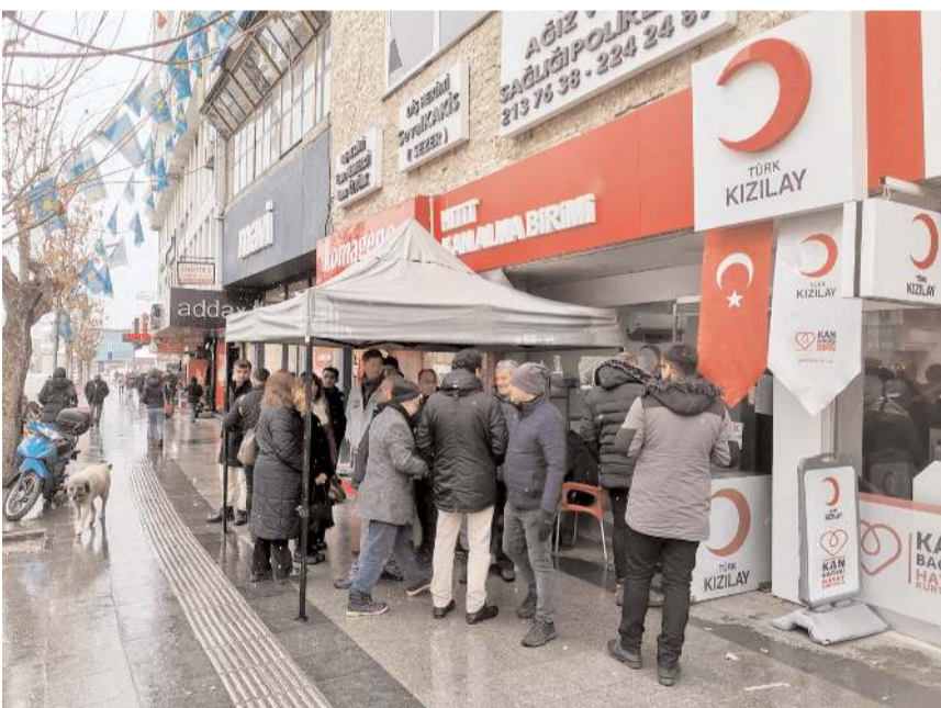
Çorum'da vatandaşlar kan merkezlerine akın etti.