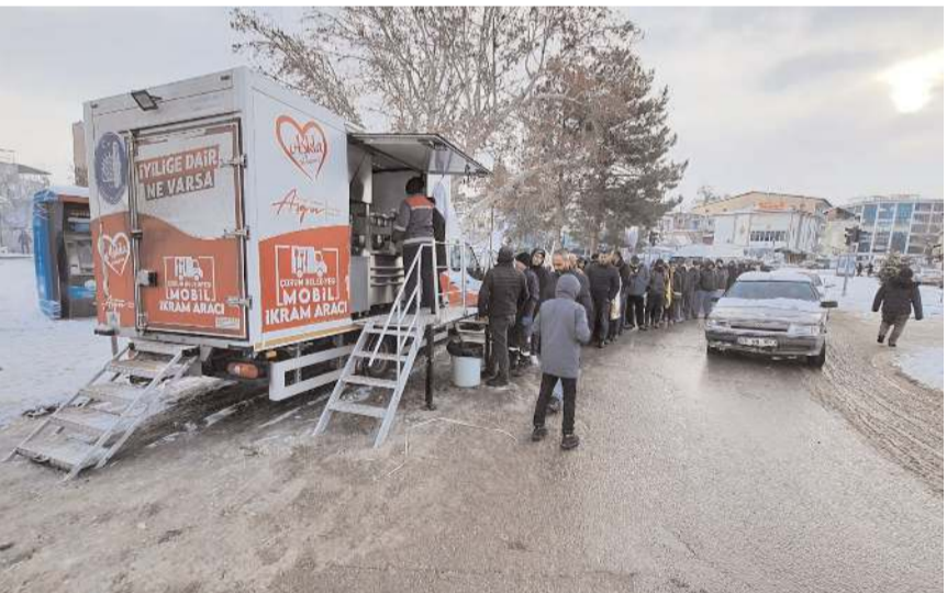
Çorum Belediyesi mobil ikram aracıyla, Afşin bölgesinde vatandaşlara sıcak çorba, ekmeğ ve çay ikramı yapılıyor.