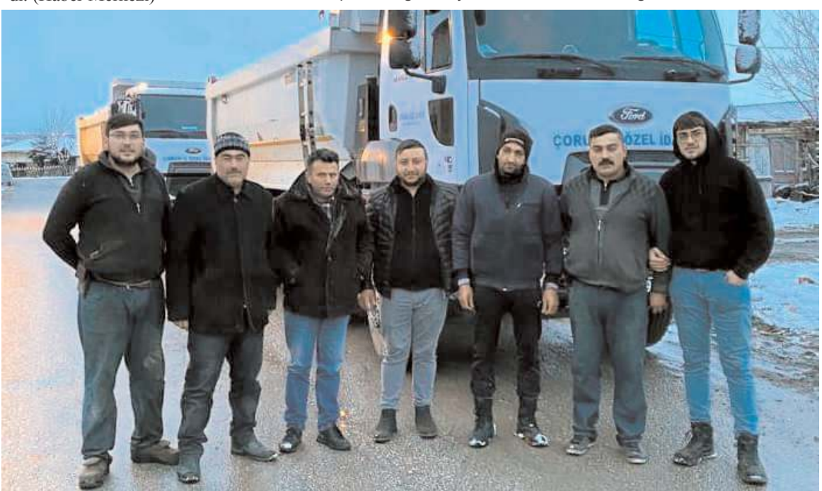
Yardımlar afet bölgesine gönderildi.