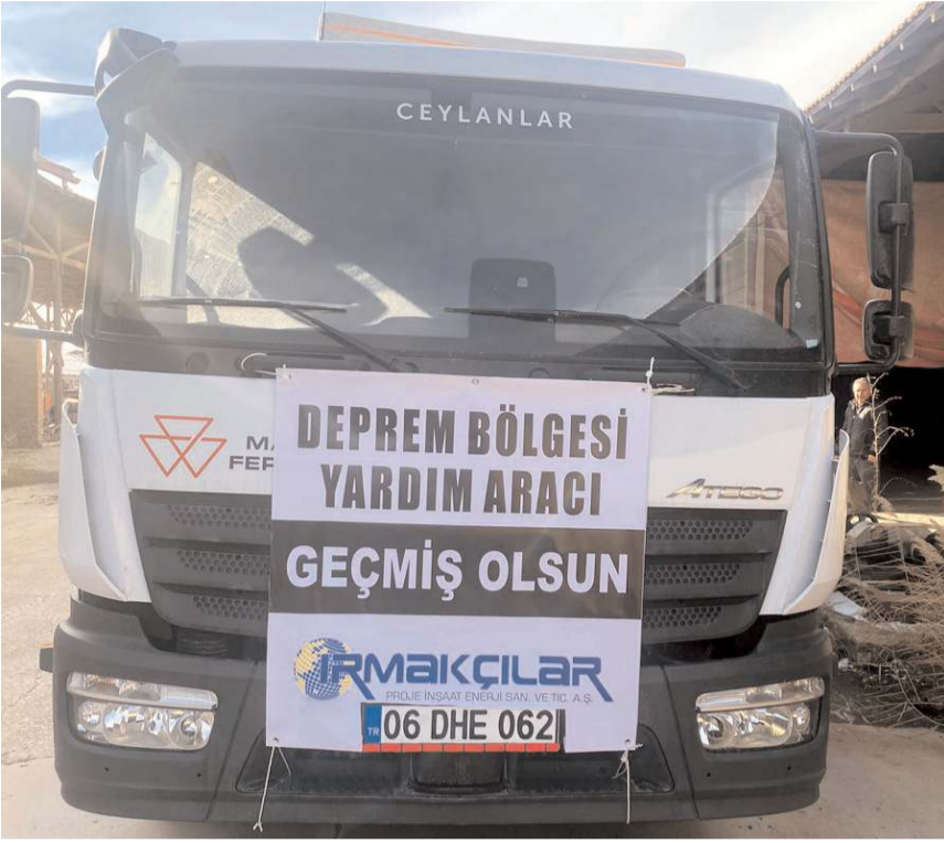
Firma bir tır dolusu insani yardımda gönderdi.