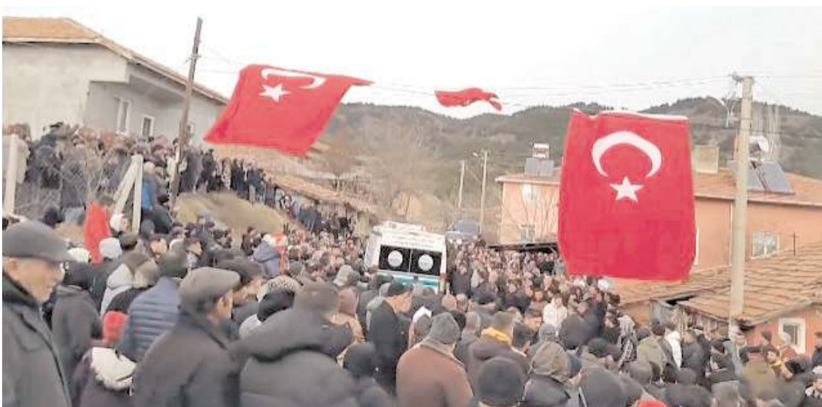
Şehit asker dualarla son yolculuğuna uğurlandı.