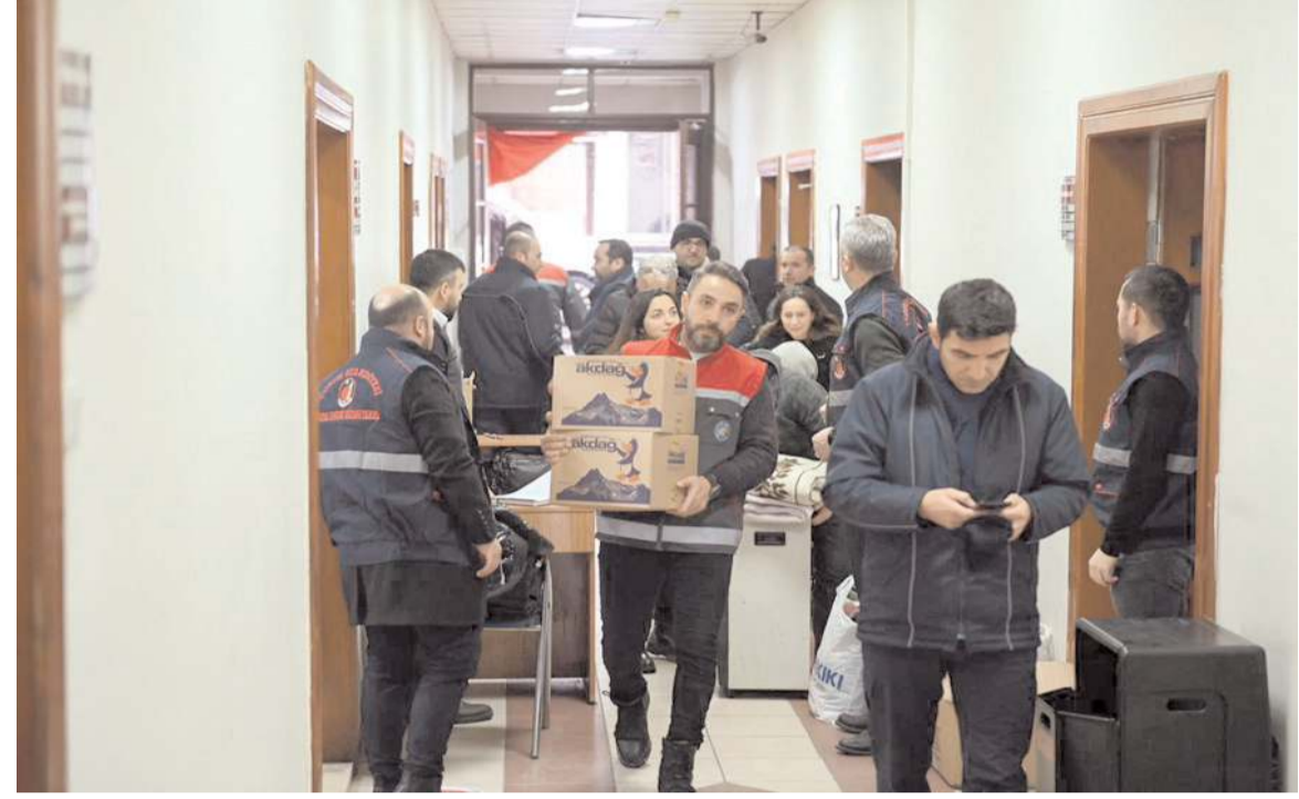
Vatandaşlar belediye binasına akın etti.

Çorum'da depremin olduğu günün akşam saatlerinden beri belediye ulaşan yardımlar Tır'lara doldurularak deprem bölgesine gönderiliyor. Dün de onlarca Tır dolusu yardım paketi daha deprem bölgesindeki vatandaşlara ulaştırılmak üzere yola çıktı.