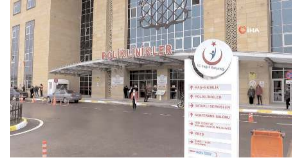
Başhekim Sinan Zehir, depremden dolayı randevu sisteminde sıkıntı yaşanabileceğini açıkladı