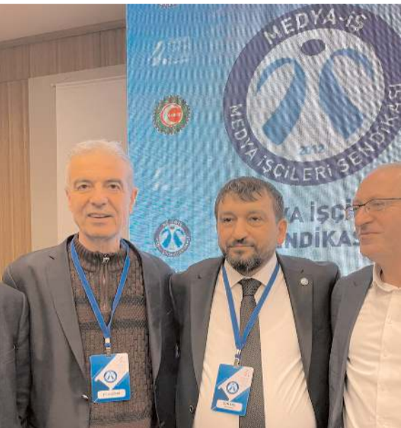
Medya-İş Genel Kurulu Ankara'da yapıldı.

görüülerek etkin ve ihtiyaca uygun biçimde gönderilebilmesi için eşgüdüm içinde hareket edilecektir. Gün; dayanışma, akıl ve bilimin doğruları ile hareket etme, yetkililerin uyarılarına ve kurallara uyma, duyarlı ve dikkatli olma günüdür. Özellikle sosyal medyadaki maksatlı ve yersiz paylaşımlar dikkate alınmamalı, yaygınlaştırılmamalıdır." (Haber Merkezi)