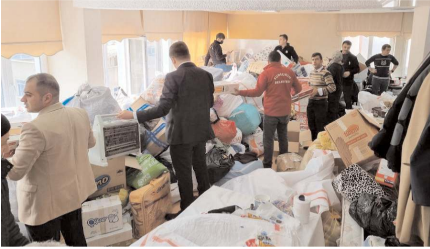
Gelen yardımlar Kadın Kültür Merkezi'nde toplandı.