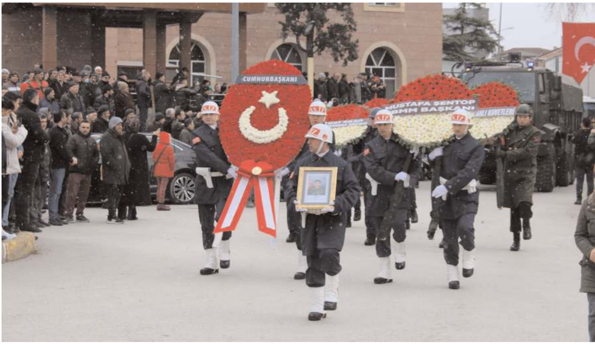
Depremde hayatını kaybeden asker için Osmancık'ta tören düzenlendi.