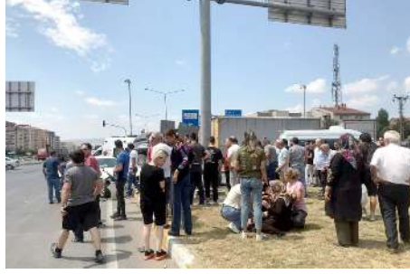
Kaza da yaralananların yardımına çevredeki vatandaşlar koştu.

Çarpmanın etkisiyle takla atan aracın içindekiler çevredekilerin yardımıyla araçtan çıkarıldı.