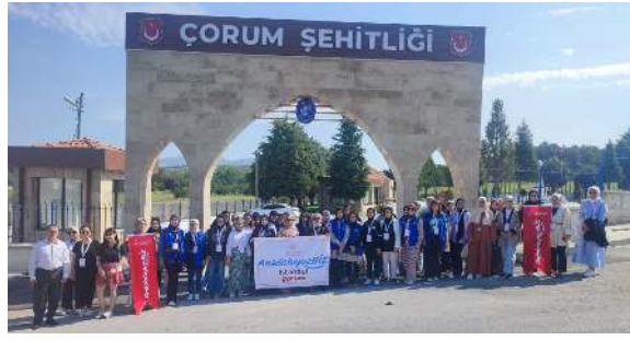
Gençler Çorum Şehitliğini ziyaret ederek şehitler için dua ediyorlar.