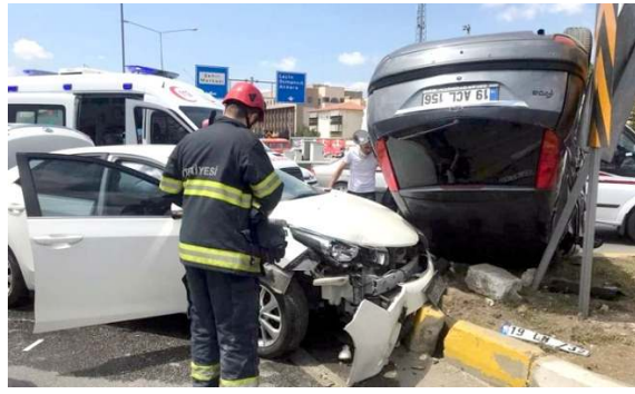
Kavşakta çarpışan araçlardan bir tanesi takla attı.