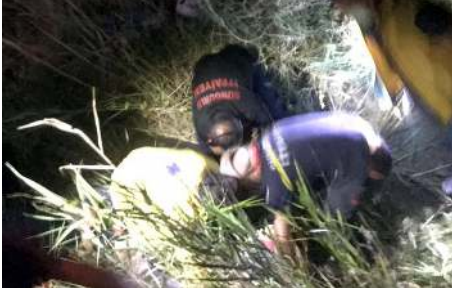
İtfaiye ekipleri, yaralıları uzun uğraşlar sonucu sıkıştığı yerden çıkarttı.

Sungurlu'da lüks otomobilin hafif ticari araca çarpması sonucu meydana gelen trafik kazasında 3'ü çocuk 5 kişi yaralandı.