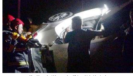
Yaralıları sıkıştıktan yaraları itfaiye ekipleri kurtardı.