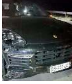
Lüks araçta maddi hasar meydana geldi.

Kazayla ilgili soruşturma başlatıldı. (İHA)