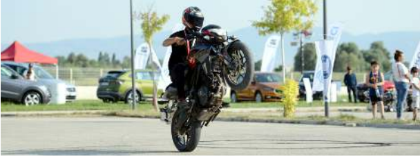
Atahan Atlı Spor Kulübü tesislerinde gerçekleşen Hitit Motosiklet Festivali nefes kesen gösterilere sahne oldu.