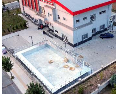
Çorum Belediyesi Kale Spor tesisi bahçesine kurulan havuzun montajı tamamlandı.