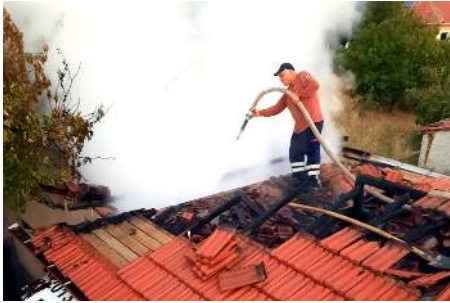
Yangın diğer evlere sıçramadan söndürüldü.

Sungurlu'da çıkan yangında, evin tandırılık bölümü tamamen yanarak kullanılmaz hale geldi.