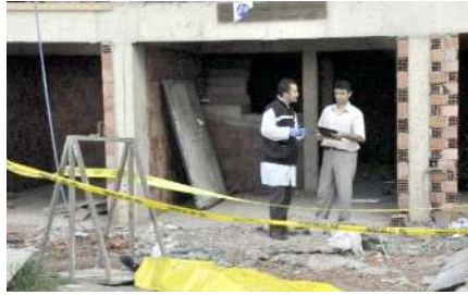
Olay Vezirköprü'de bir inşaatı meydana geldi.

Olayla ilgili soruşturma başlatılırken, Emre E.'nin cenazesi otopsi yapılmak üzere hastane morguna kaldırıldı.