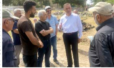
Tahtasız, olay hakkında bilgi aldı.

den korusun. Yapabileceğimiz, yardımı olabileceğimiz herhangi bir durum olursa gönül kapımız, hizmet kapımız sizlere sonuna kadar açık" dedi. (Haber Merkezi)