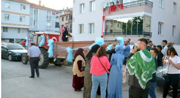
Genç çift düğünden sonra Fransa'da yaşamaya devam edecek.