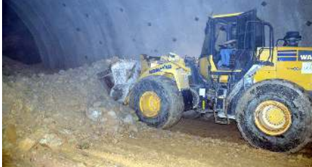
Kırkdilim Tüneli 2023 yılında hizmete açılacak.