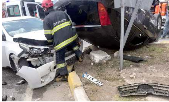
Ekipler olay yerinde inceleme yaptılar.

Kaza yerine polis, itfaiye ve sağlık ekipleri sevk edildi. Yaralılar ambulansla hastaneye kaldırıldı. Kazayla ilgili soruşturma başlatıldı. (Haber Merkezi)