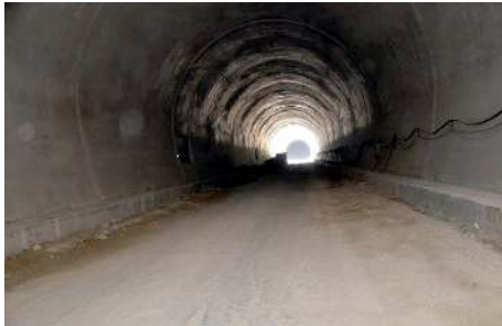
Projenin tamamlanmasıyla birlikte 10,2 kilometre uzunluğundaki mevcut güzergahın 8,6 kilometreye düşeceğini ifade ettiler.

AK Parti Çorum Milletvekili Oğuzhan Kaya, 2 milyar TL'ye mal olan ve sarp kayalıklar ve uçurum arasındaki seyahatler mazide bırakacak olan Kırkdilim geçiş projesinin 2023 yılında hizmete açılacağını açıkladı.