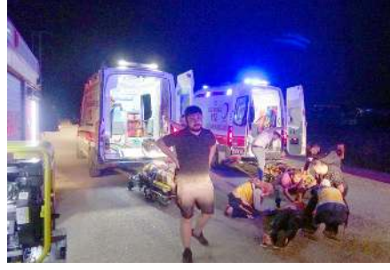
Yaralıları ilk müdahaleyi olay yerinde 112 acil sağlık ekipleri yaptı.

İtfaiye ekiplerince yaklaşık bir saatlik çalışmayla otomobilin tavanı kesilerek dışarı çıkarılan yaralılar sağlık ekiplerince olay yerinde yapılan ilk müdahalelerin ardından ambulansla Çorum Hitit Üniversitesi Erol Ölçök Eğitim ve Araştırma Hastanesi ile kentteki özel bir hastaneye kaldırıldı. (AA)