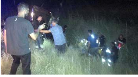
Çarpmanın etkisiyle araç takla atarak tarlaya uçtu.