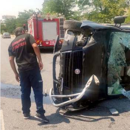
Kaza, Sungurlu-Çorum yolu sanayi sitesi civarında meydana geldi.

Kazayla ilgili başlatılan soruşturma sürüyor. (İHA)