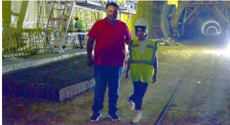
Milletvekili Av. Oğuzhan Kaya çalışmaları yerinde inceledi.