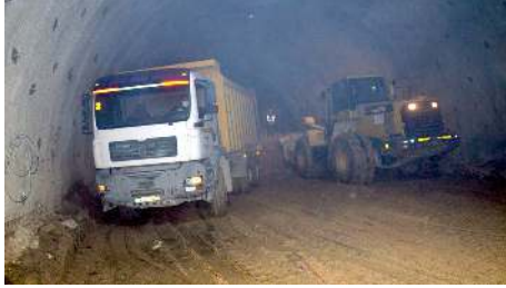
9 kilometrelik yolda uzunlukları bin 389 metre, bin 149 metre ve bin 553 metre üç ayrı tünel yapılıyor.