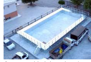
Cuma pazarı yanında kurulan havuzun da montajı tamamlandı.

Çorum'da yüzme bilmeyen çocuk kalınayacak. Olimpik Yüzme Havuzu ve ardından yapımı tamamlanma aşamasına kadar çocuklarımız hizmetine açılacağını söyledi.