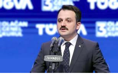
Türkiye Gençlik Vakfı Genel Başkanı Enes Eminoglu

Türkiye Gençlik Vakfı Genel Başkanı Enes Eminoglu, Türkiye Gençlik Vakfı Çorum İl Temsilciliğinin düzenlediği yaz okulunun kapanış programına katılmak üzere bugün Çorum'a gelecek.