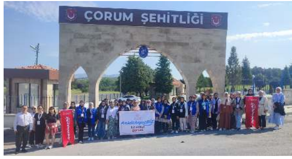
Gençler Çorum Şehitliğini ziyaret ederek şehitler için dua ediyorlar.

Çekime gelirken aç olmasına gerek yok. Yemek yenilebilir ve sıvı tüketilebilir. Eğer hasta ilaç kullanıyorsa mutlaka kullandığı ilaçlar ve mevcut rahatsızlıkları hakkında çekim öncesinde doktoru bilgilendirmelidir. Çünkü EMG çekimi öncesinde bazı ilaçların kullanılmaması gerekir. Çekim günü sabahında banyo yapılması önerilir. Çekim sonucunun net bir şekilde anlaşılabilmesi için banyo yapılması hatta kese yapılması önerilir. Çekime giderken sıkı olmayan rahat kıyafetlerin giyilmesi önerilir. Kadın hastalar çekime giderken kiltolu corap giymemelidir. Çeşitli kremler ya da losyonlar kullanılmamalı, cilde hiçbir şey sürülmemelidir. Ayrıca hasta eğer kalp piline sahipse bu durumda çekim öncesinde doktora bildirmelidir. Kan yolu ile bulaşabilen çeşitli hastalıklar mevcutsa mutlaka doktora EMG çekiminden önce bilgi verilmesi gerekir." (Haber Merkezi)