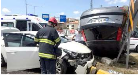
Kavşakta çarpışan araçlardan bir tanesi takla attı.

Ölüm kavşağı olarak bilinen İlim Yayma Kavşağı'nda dün yine trafik kazası meydana geldi. * HABERİ 3'DE