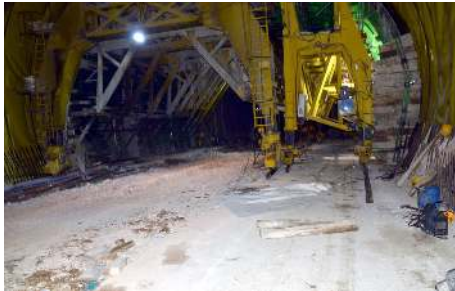
Proje 3 tünelin yanı sıra 3 adet hemzemin kavşak ve 2 adet alt geçit bulunuyor.