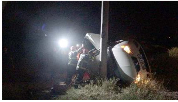
Kaza Bahçelievler Mahallesi Yukarı Kapaklı Bağları'nda meydana geldi.