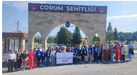
Gençler Çorum Şehitliğini ziyaret ederek şehitler için dua ettiler.

Gençlik ve Spor Bakanlığı'nın hayata geçirdiği 'Anadoluyuz Biz' projesi kapsamında İstanbul'dan Çorum'a gelen gençler ziyaretler yaparak tarihi ve turistik yerleri keştiler. * HABERİ 2'DE