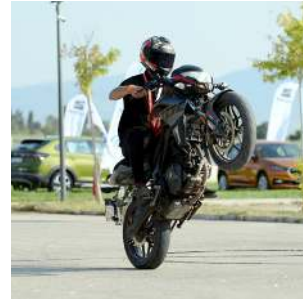
Atahan Atıl Spor Kulübü tesislerinde gerçekleşen Hitit Motosiklet Festivali nefes kesen gösterilere sahne oldu.