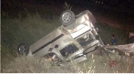
Kaza, Sungurlu-Kırıkkale karayolunda meydana geldi.