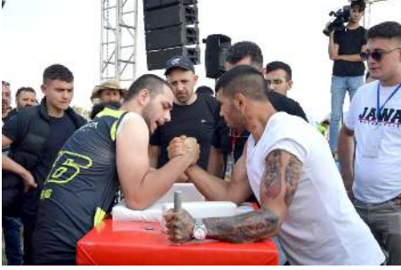
Festivale çeşitli yarışmalar yapıldı.

Festivale gelen kulüp başkanına katılım belgeleri verilirken, düzenlenen yarışmalarda dereceye girenlere ise madalya ve derece belgeleri takdim edildi.