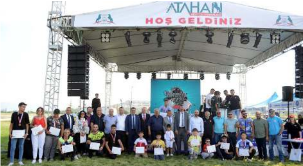
Yarışmalarda dereceye girenlere madalya ve belgeleri takdim edildi.