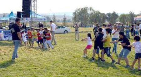
Çocuklar çeşitli oyunları oynadılar.