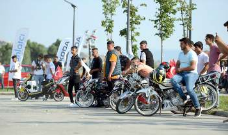
Festivale katılım yüksek oldu.