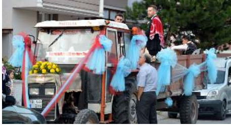
Vatandaşlar meraklı gözlerle konvoyu izledi.