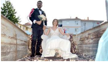
Genç çift düğün salonuna ise traktör ile gitti.