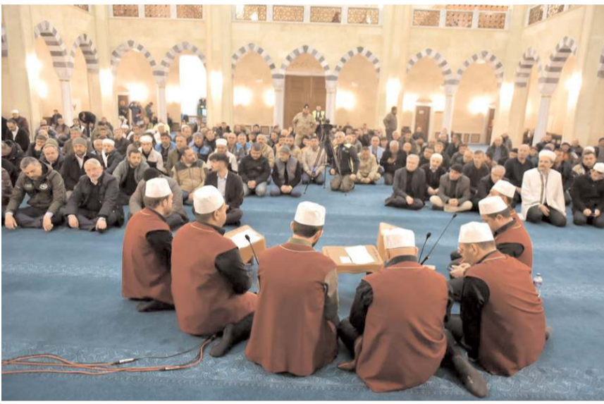
Çorumlu din görevlileri programda Kur'an-ı Kerim okudular.