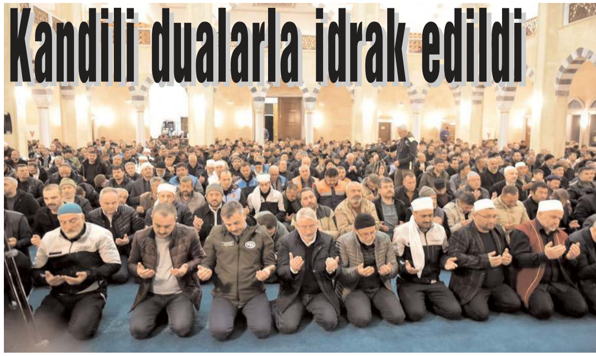
Berat Kandili'nde Afşin Ashabı Kehf Camii'nde program yapıldı.