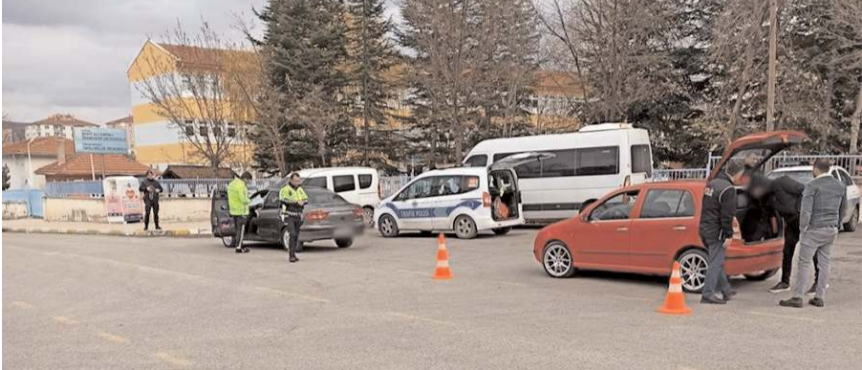
Şok uygulama 27 Şubat – 6 Mart 2023 tarihleri arasında gerçekleştirildi.