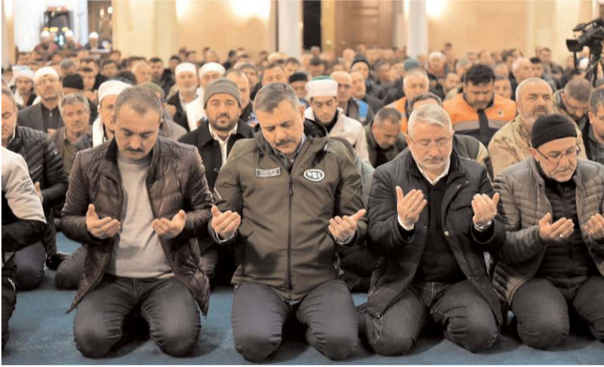
Kandil programına Çorum il protokolünden de katılım oldu.