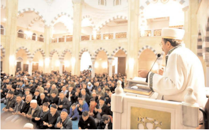
Programda depremlerde hayatını kaybedenler için dua edildi.

Çorum Valisi Mustafa Çiftçi de, "Gecemiz mübarek olsun. Bu güzel geceyi sizlerle idrak ediyoruz. Hamdolsun biraz daha normalleşiyoruz. Camimiz, cemaatimiz kalabalıklaşıyor. İlk günden itibaren buradayız. Bize ihtiyaç duyulan her zaman burada olmaya devam edeceğiz. Cenab-ı Hak bir daha böyle günler göstermesin. Devlet-millet kaynaşmasının en üst düzeyde yaşandığını gördük. Allah devletimize zeval vermesin" diye konuştu. (İHA)