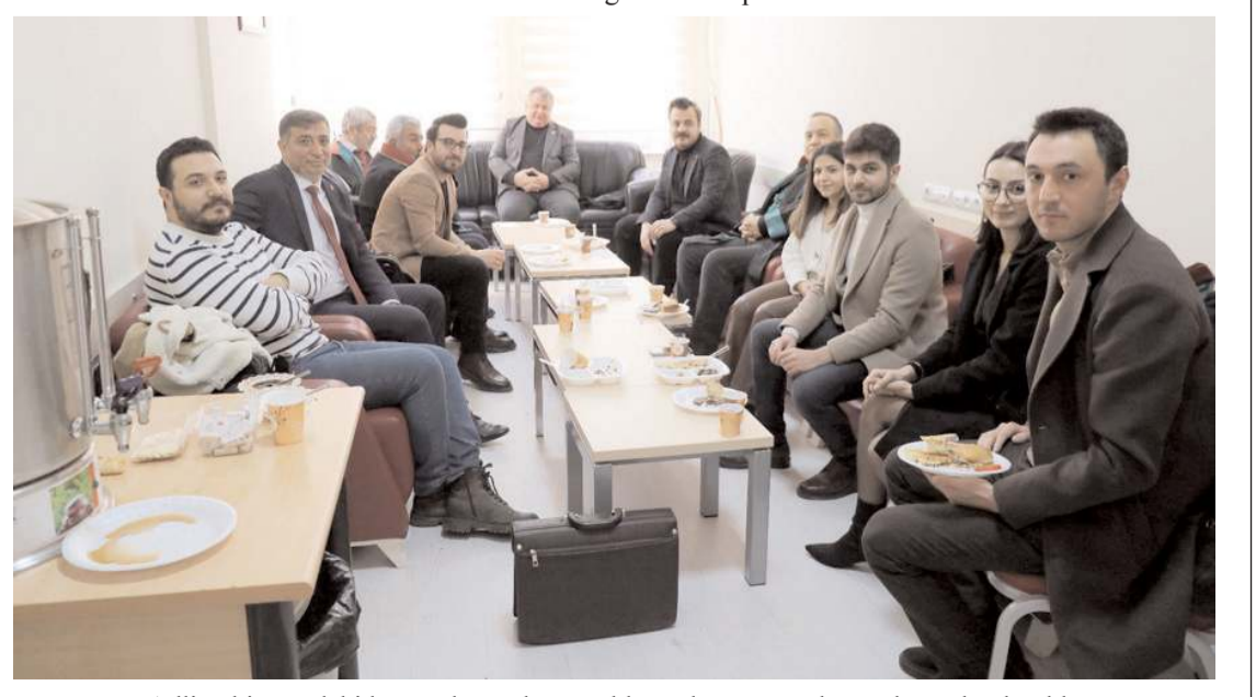
Adliye binasındaki baro salonunda gerçekleşen kermese çok sayıda avukat katıldı.