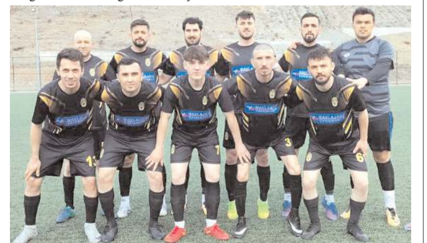
Kargiserispor ilk maçında farklı galip ayrılarak liderlik koltuğuna oturdu

Belediyespor karşılaşacak. Pazar günü ise ilk haftanın iki kazanan takımı Kargiserispor ile Dodurga Gençlikspor maçı oynanacak. Merkezde ise HE Kültürspor ile Oğuzlar Belediyespor maçı oynanacak.