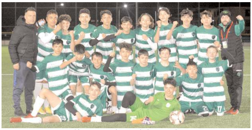
Çimentospor bugün de kazanarak şampiyonluğunu namağlup elde etmek istiyor