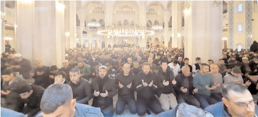
İl Müftülüğü Akşemseddin Camii'nde kandil programı düzenledi.

■ On bir ayın sultanı Ramazan ayının müjdecisi Berat Kandili'nde vatandaşlar camilere akın etti.