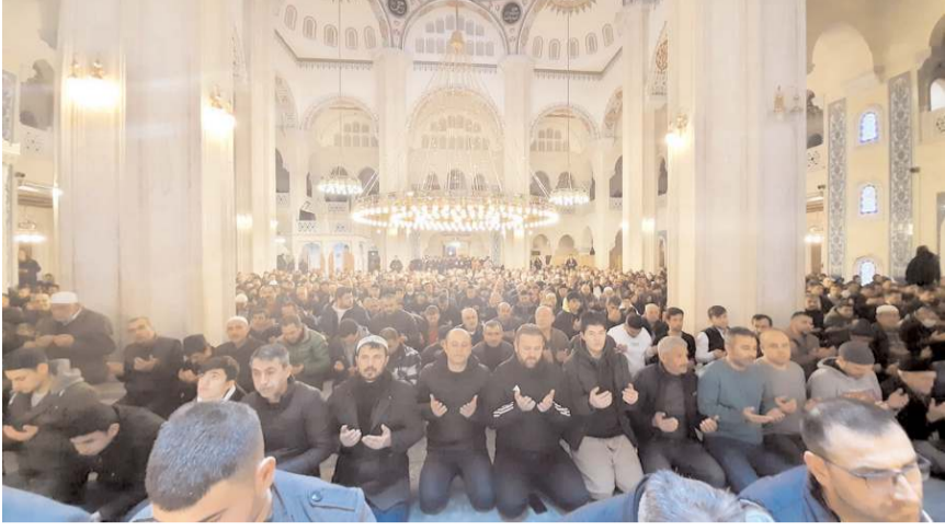
İl Müftülüğü Akşemsettin Camii'nde kandil programı düzenledi.