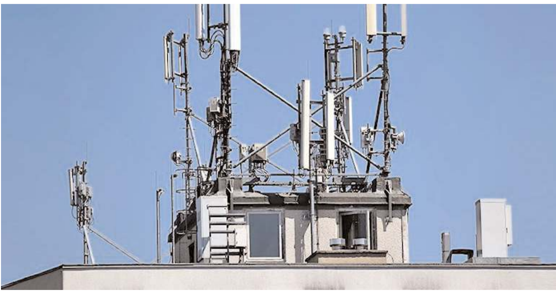
Binalarda bulunan baz istasyonları depremde yıkılma tehlikesi ile karşı karşıya.

Durgun, depremlerde hayatını kaybedenlere Allah'tan rahmet yaralılara ise acil şifalar dileyerek sözlerini tamamladı.