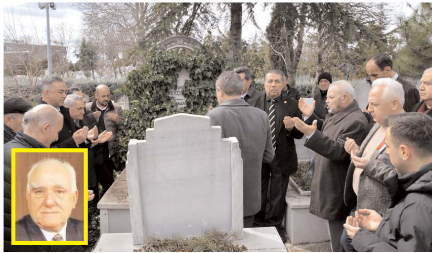
Kılıçcioğlu mezarı başında dualarla anıldı