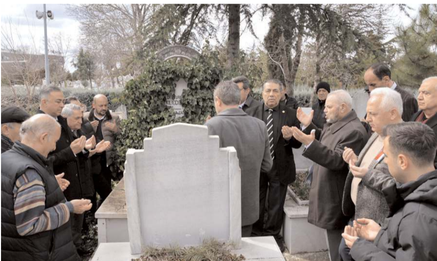
Kılıçcıoğlu mezarı başında dualarla anıldı