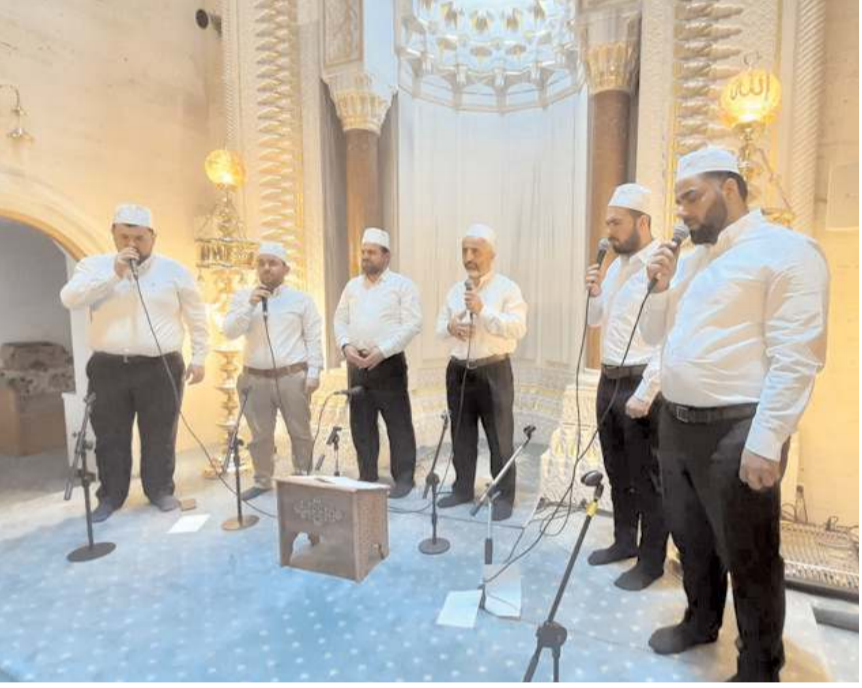
Programda din görevlileri Kur'an-ı Kerim tilaveti, Mevlid-i Şerif ve ilahiler seslendirdiler.