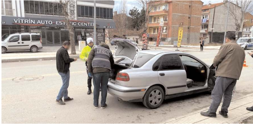
İl Emniyet Müdürlüğü ekipleri şok uygulamada 1.346 GBT kontrolü yaptı.