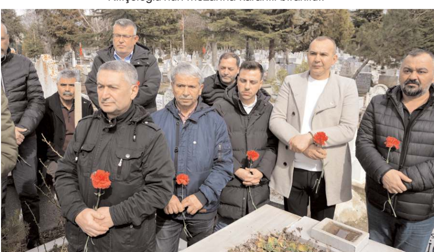
Törene. CHP İl ve Merkez İlçe Yönetim Kurulu Üyeleri, bazı vatandaşlar katıldı.