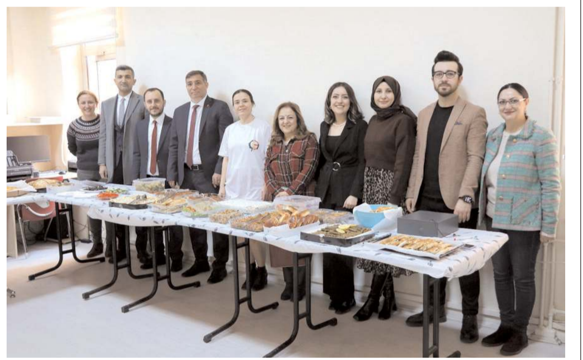
Çorum Barosu, depremzede avukatlar yararına kermes düzenledi.