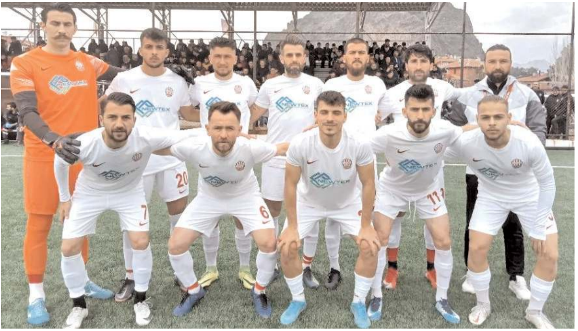
Osmancık Belediyespor bugün Kırıkkale Yahşihanspor ile oynayacağı maçta üç puan için mücadele edecek

BAL temsilcimiz Osmancık Belediyespor bugün saat 14'de Kırıkkale Yahşihanspor deplasmanında üç puan arayacak. İkinci yarıda ilk iki maçını kaybeden temsilcimiz hafta sonu grup lideri Sincan önünde 0-0 bereber kalarak bir puan aldı. Bugün grupta alt sıralardan kurtulma mücadelesi veren Kırıkkale Yahşihanspor deplasmanında galibiyet arıyor.