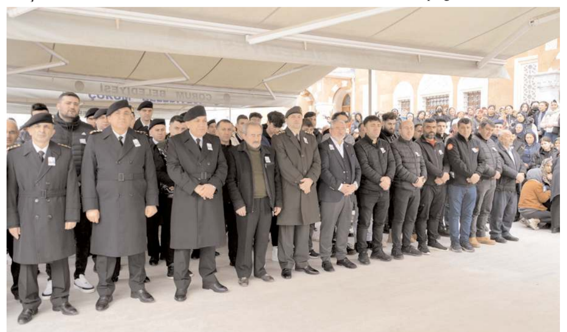
Cenaze törenine il protokolü askeri erkan ve vatandaşlar katıldı.