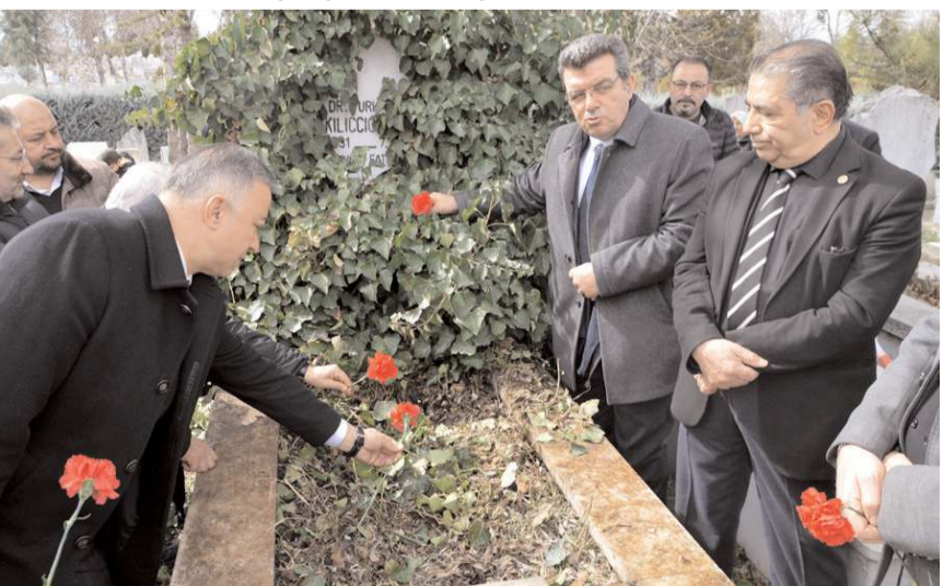
Kılıçcıoğlu'nun mezarına karanfil bırakıldı.