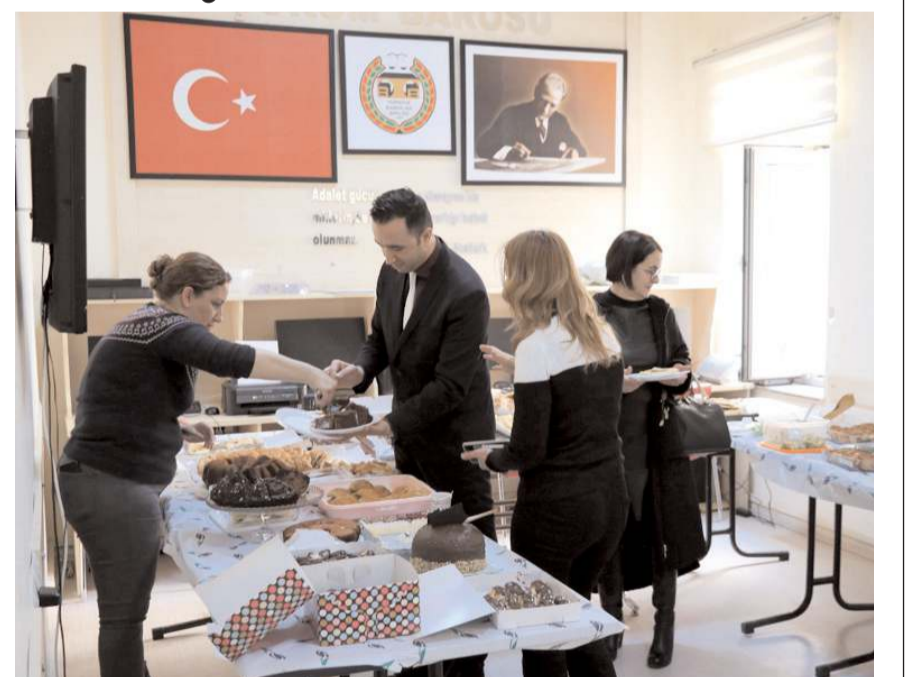
Kermesten elde edilen gelirlerin depremzede avukatlara verilecek.

Kermesten elde edilen gelirlerin depremzede avukatlara verileceği ifade edildi.