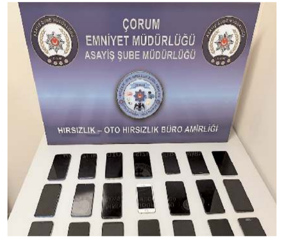
Çalınan ürünler sahiplerine teslim edildi.