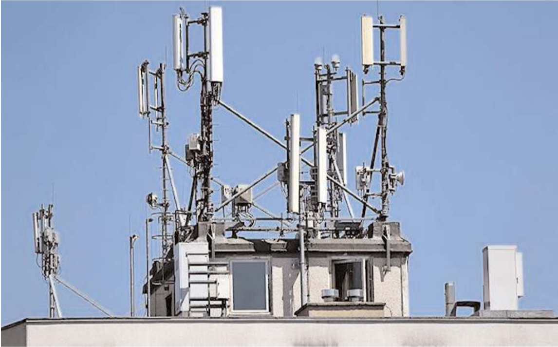
Binalarda bulunan baz istasyonları depremden yıkılma tehlikesi ile karşı karşıya.