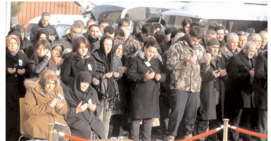
Törende Kur'an-ı Kerim tilavetinin ardından helallik alındı.