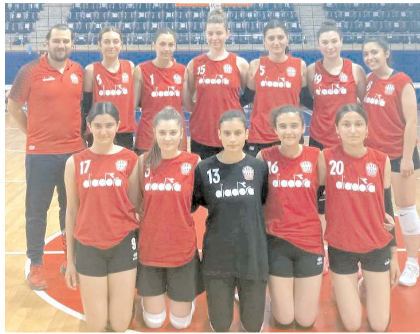
Osmancık Belediyespor yeni sezon hazırlıklarını dün yaptığı antrenmanla tamamladı