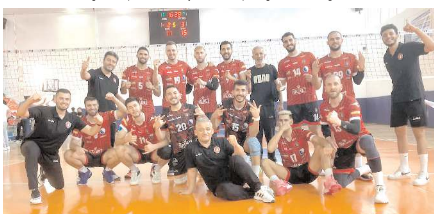
Çorum Belediyesi Gençlikspor sezonun ilk maçında aldığı galibiyeti yarın evinde devam ettirmek istiyor

Erkekler 1. liginde yarın oynanacak Çorum Belediyesi Gençlikspor-Gaziantep Gençlikspor maçı için ilimiz A Klasman hakemi Hüseyin Kamber yönetecek. Yardımcılığını ise ilimizden Hasan Olun yapıpken gözlemci ise Mahmut Uysal.