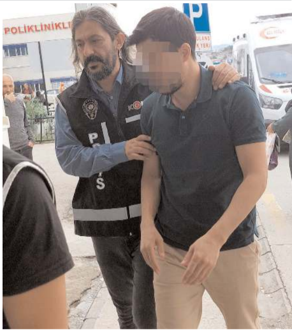
Operasyon çerçevesinde 6 FETÖ şüphelisi yakalanarak gözaltına alındı