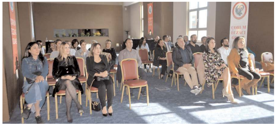
Çorum'da ki eczacılar Ankara'da yapılacak olan 'Büyük Eczacı Mitingi' öncesinde istişarede bulundular.

Eczacılar sorunlarına kalıcı çözüm istiyor