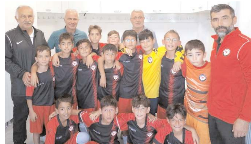
Çorum FK mini minik takımı bugün şampiyonluk için Vefaspor ile karşılaşacak

Bu maçın ardından saat 16'da ise Vefa Gençlikspor ile Çorum FK takımları şampiyonluk maçına çıkacaklar. Bu karşılaşmayı ise Abdullah Enes Gökgüne yönetecek. Final maçının ardından düzenlenecek törenle dereceye giren takımlara kupa ve madalyaları verilecek.