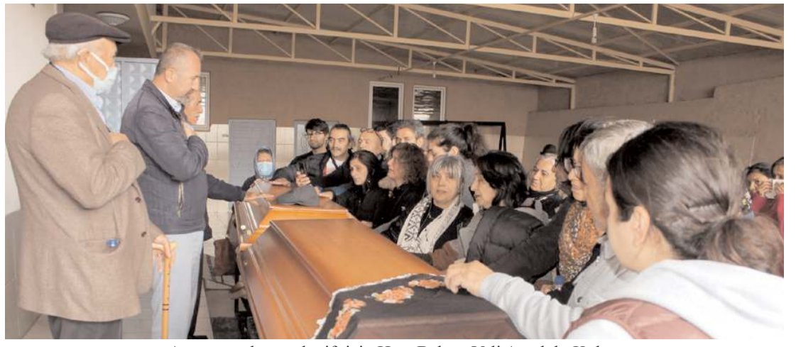
Aynı gün ölen yaşlı çift için Hacı Bektaş Veli Anadolu Kültür Vakfı Çorum Şubesi'nde helallik alma töreni düzenlendi.

Hakimiyet, merhuma Allah'tan rahmet, ailesine ve yakınlarına başsağlığı diler.