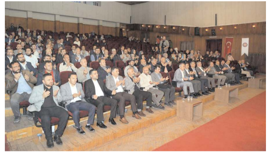
Program Devlet Tiyatro Salonu'nda yapıldı.