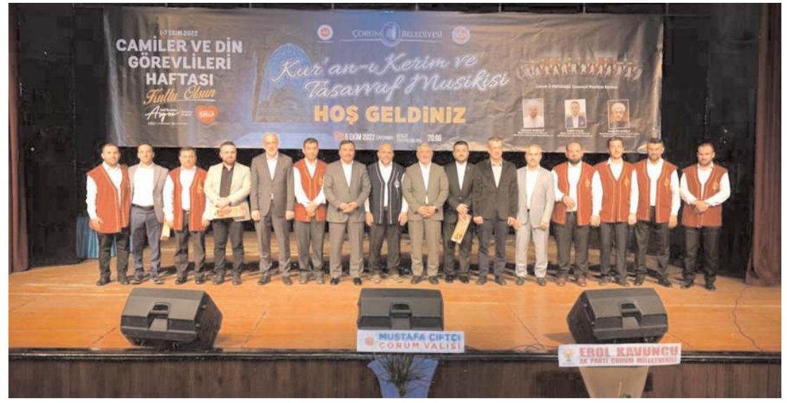
İl Müftülüğü Tasavvuf Musikisi Korusu da programda konser verdi.

Peygamber Efendimizin (S.A.V.) 63 sene boyunca sürdürdüğü örnek hayatı tüm insanların dikkatlice incelemeleri gerektiğini ifade eden Ceylan, "Uyguladığı dâhiyane yöntemlerle dağınık kabileleri İslam bayrağı altında bir araya getiren usta bir devlet adamı, en zorlu anlaşmazlıkları çözmek için her daim kapısı çalınan 'Emin' yani güvenilir kişiliği, kuşu öldü diye bir çocuğa taziye ziyaretine giden uçsuz bucaksız bir merhamet abidesi olması, sevgili Peygamberimizi (S.A.V.) anlatacak sadece birkaç cümle olabilir. O'nun ortaya koyduğu adil ve insan odaklı dünya nizamı düşüncesi, günümüzde birçok bölgede karşılaştığımız sorunların çözümüne en üst düzeyde yardımcı olacaktır. Resulullah'ı (S.A.V.) anlamak, O'nun verdiği evrensel ve manevi mesajı kuşaktan kuşağa aktarmak, hepimizin görevidir. Bu duygu ve düşüncelerle Aziz Milletimizin ve tüm İslam Alemi'nin Mevlid Kandili'ni tebrik ediyor, Rabbimden birlik ve beraberliğimizi muhafaza etmesini niyaz ediyorum" şeklinde kaydetti. (Haber Merkezi)