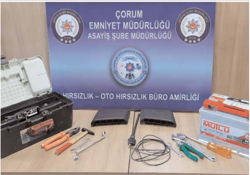
Çalınan malzemelerde ele geçirildi.

Emniyet Müdürlüğü ekipleri Küçük Sanayi Sitesi'nde meydana gelen otomobilden hırsızlık olayını aydınlattı.