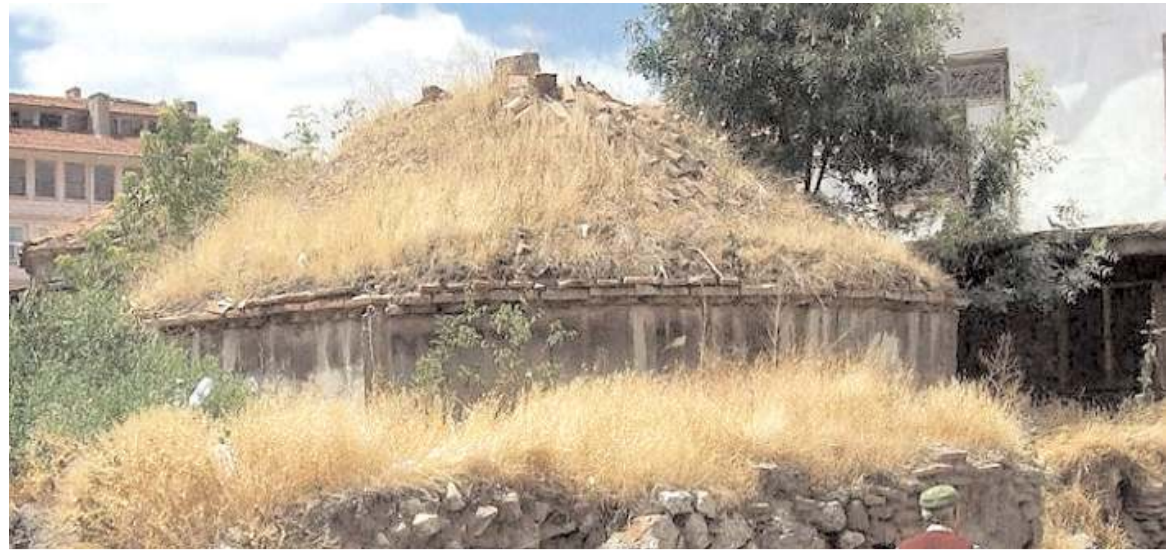
Güpür Hamamı uzun yıllardır harabe vaziyette duruyor.