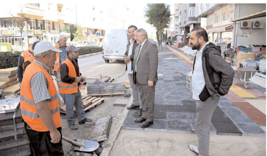
Başkan Aşgın, çalışmalarını yerinde inceledi.

retle şehrimizi imar etmeye devam edeceğiz" dedi.