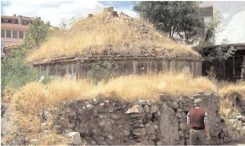
Güpür Hamamı uzun yıllardır harabe vaziyette duruyor.

Hamamın satın alınması ile ilgili pazarlık aşamasının tamamlandığı ve resmi işlemlerin başlatılacağı öğrenildi.