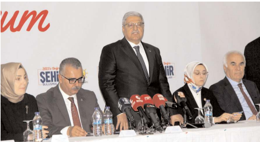
Programda AK Parti Genel Başkan Yardımcısı Vedat Demiröz açıklamalarda bulundu.