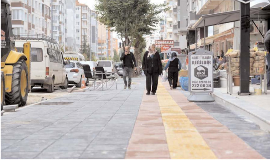
Belediye yeni tretuvar ve bordür taşlarını ilk kez Bahabey Caddesi'nde uyguladı.

Çorum'un bütün mahallelerinde çalışmalarını devam ettiriyor. Çorum'un ahlak ilmek dokuyuyoruz. Şehrimizin imarına, ihtiyasına, güzelleşmesine katkı veren tüm mesai arkadaşlarımıza teşekkür ediyorum. Tevazu, samimiyet ve gay-