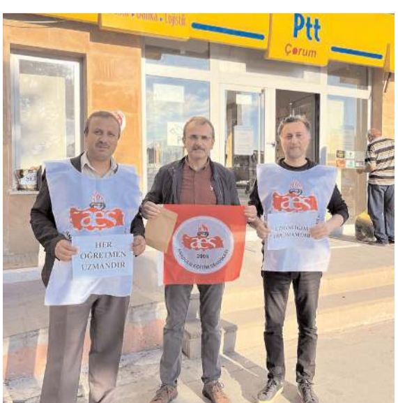
AES'ciler TBMM'ye mektup gönderdi