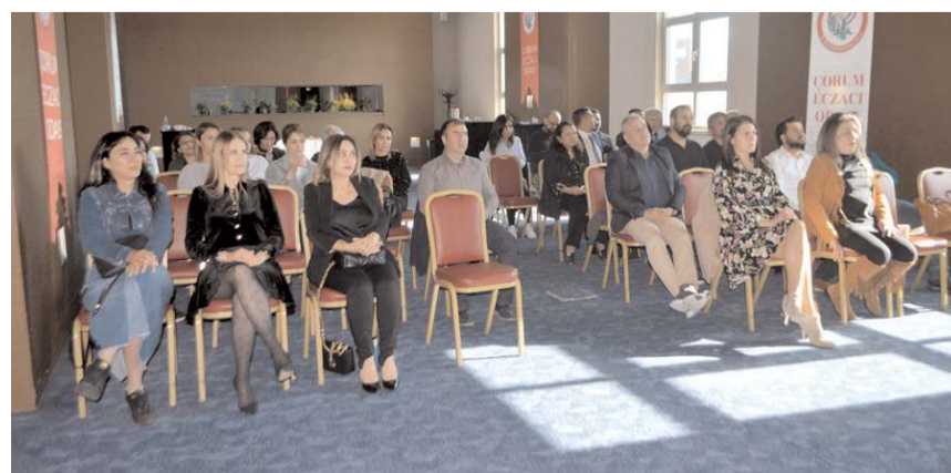
Çorum'da ki eczacılar Ankara'da yapılacak olan 'Büyük Eczacı Mitingi' öncesinde istişarede bulundular.