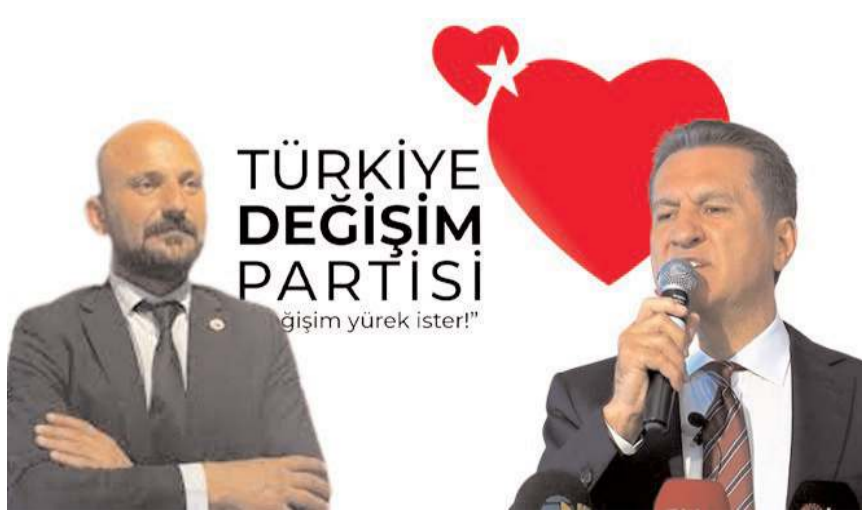
TDP Genel Başkanı Mustafa Sarıgül, Çorum'da bir dizi ziyarette bulunacak.

Mustafa Sarıgül Çorum ziyareti kapsamında Gaziler Derneği'nin ve halk pazarını ziyaret edecek. (Haber Merkezi)