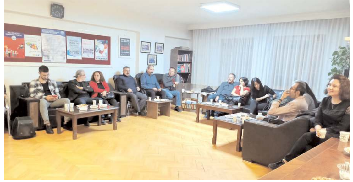
Dünya Öğretmenler Günü nedeniyle Eğitim Sen Çorum Şubesi'nde kutlama yapıldı.

Görgü şahidi bir başka tır sürücüsü ise "Kaza yapan araç 200 metre ileride beni sollamaya çalıştı. Herhalde heyecanlandı mı ne olduysa köprü ayağına vurdu makasladı tır. Şoför 50 metre ileriyeye düşmüştü arabadan fırlayarak." ifadelerini kullandı.(AA)