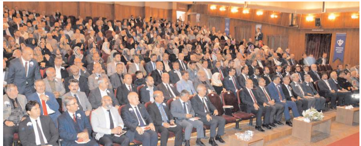
Devlet Tiyatro Salonu’ndaki programa çok sayıda din görevlisi katıldı.