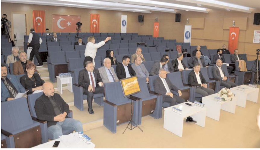
Gündem maddelerinin görüşülmesinin ardından toplantı sona erdi.