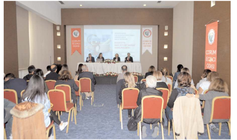
Toplantıda sektörün sorunları ele alındı.

çen gün katlanarak artıyor. Biz eczacılar hiçbir sorumluluğumuz olmamasına rağmen sahada hasta ve eczacıyı karşı karşıya getiren, ilaç fiyat farklarından kaynaklı sıkıntıları defalarca dile getirdik. Stratejik personel olarak kamuda görev yapan meslektaşlarımızın uğradığı hak kayıplarının kabul edilemez olduğunu ifade ettik. Ama görmezden gelindik, yok sayıldık. Şimdi halka en yakın sağlık hizmeti sunan eczacılar olarak açık bir şekilde ifade ettiğimiz taleplerimize karşılık bulamadığımız için sesimizi 16 Ekim Pazar günü Ankara'da gerçekleştireceğimiz Büyük Eczacı Mitinginde, gerek kamuda gerek eczanelerinde gerekse ilaç sanayinde görev yapan meslektaşlarımızla Birlik'te yükselteceğiz! 45.Bölge Eczacı Odası olarak meslektaşlarımız ve en büyük destekçimiz eczane çalışanlarımızla birlikte katılacağımız mitingde Türkiye'nin dört bir yanından gelecek diğer meslektaşlarımızla birlikte omuz omuza mesleğimiz için ayakta olacağız. Uğradığımız haksızlıklara hep birlikte "Dur" diyeceğiz! Çıktığımız bu yolda bize destek olan, güç veren bütün meslektaşlarımızı ve halkımıza yürekten teşekkür ediyoruz." ifadelerini kullandı.