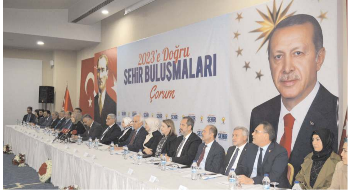
Toplantı Anıt Otel’de gerçekleştirildi.