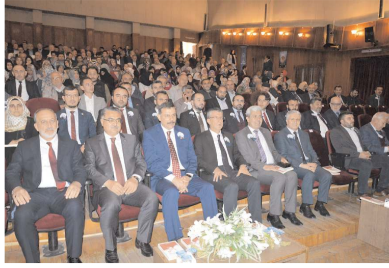
İl Müftülüğü, Camiler ve Din Görevlileri Haftası nedeniyle konferans düzenlendi.