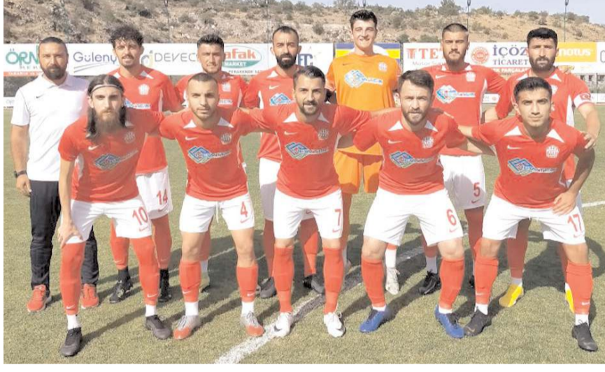
Osmancık Belediyespor evindeki ilk maçında yarın Niğde Belediyespor'u konuk edecek

Hakem Samsun'dan Osmancık Belediyespor ile Niğde Belediyespor takımları arasındaki maçı Samsun bölgesi hakemi Yavuz Yasul yönetecek. Yardımcılıklarını ise Fatih Yüzbaşı ve Nurdan Köseoğlu yapacak. Maçın dördüncü hakemi ise Sinop'tan Cem Alpay. Maçta gözlemci olarak ise Tuncay Uçar görev yapacak.