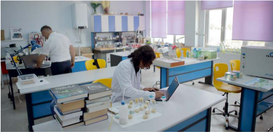
Proje kapsamında, kentteki yaklaşık 300 öğrenciye, iklim değişikliği konusundaki farkındalıklarını ölçmek amacıyla ön test yapıldı.