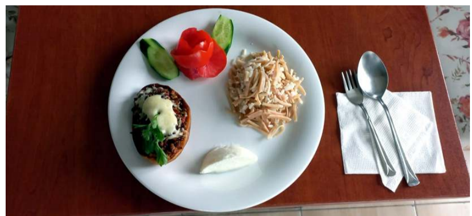
Kursiyerler Oğuzlar cevizi ve patates kullanarak farklı bir yemek ortaya çıkardılar.

Kursiyerler ile kurs usta öğreticisinin ortaya çıkardıkları Oğuzlar'a özgü cevizli kartol yemeği,