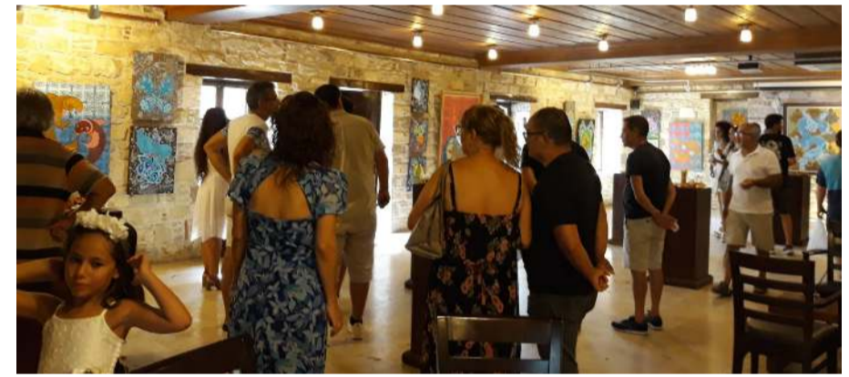
Serginin açılışına çok sayıda davetli katıldı.