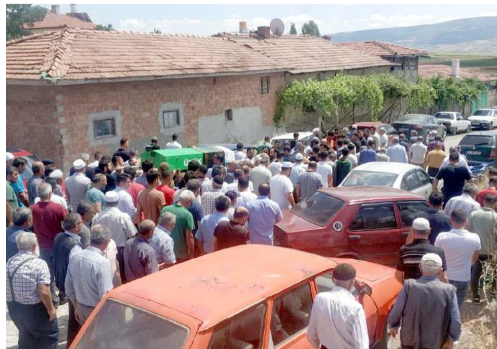
Üyük Köyü'ndeki cenazeye çok sayıda vatandaş katıldı.