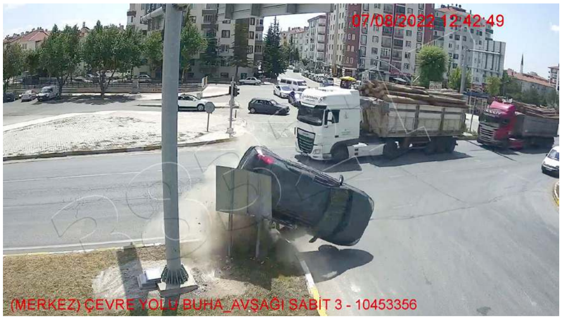
(MERKEZ) ÇEVRE YOLU BUHA_AVŞAĞI SABIT 3 - 10453356