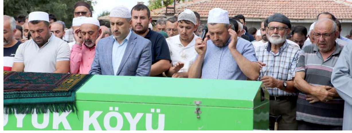
Anne ile bebeği aynı tabutta son yolculuğuna uğurlandı.