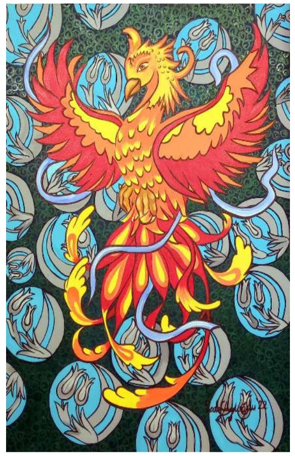
Sergide yer alan eserler ilgi çaktı.