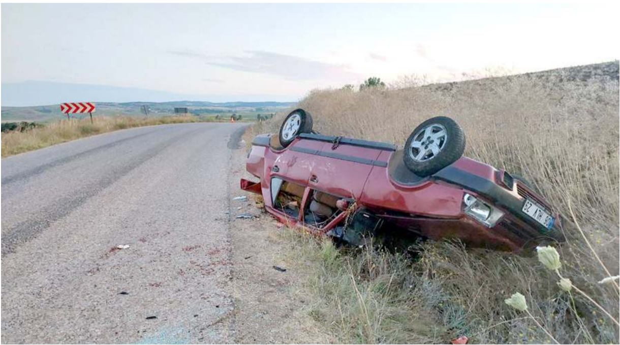
Kaza Alaca'ya bağlı Eskiyaşar köyü yol ayrımında meydana geldi.

Katılımcılara teşekkür eden Uzman Dağlı, birinci olan yarışmacıya Türkiye Finalinde başarılar dileyip ödülünü takdim etti. (Haber Merkezi)