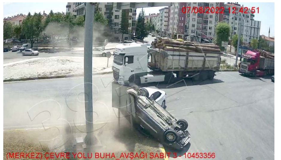
(MERKEZ) ÇEVRE YOLU BUHA_AVŞAĞI SABIT 3 - 10453356

Kavşakta diğer araçlar beklerken karşıya geçmeye çalışan otomobil, önce kamyonla çarpıştıktan sonra kurtuluyor.