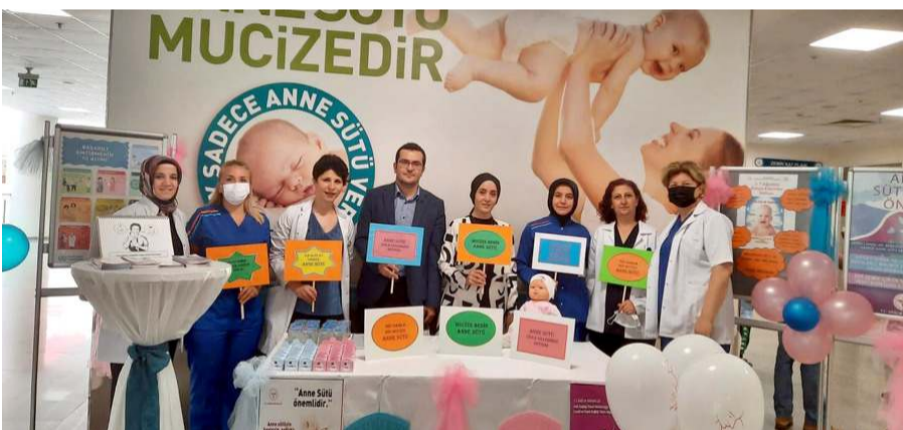
Hastane 'Anne ve Bebek Dostu' hastaneler arasında yer alıyor.