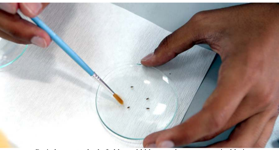
Projede cam tüplerde farklı sıcaklıklar uygulanan meyve sinekleri "İklim Kutusu" adı verilen kutulara alınarak tepkileri gözlemlendi.

TÜBİTAK yarışmasında birinci olan proje TEKNOFEST'te sergilenecek