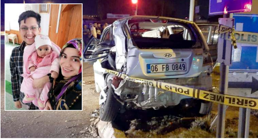
Kazanın ardından kamyon sürücüsü gözaltına alındı.

Çorum'da kamyon ile otomobilin çarpışmasıyla meydana gelen trafik kazasında anne ve bir yaşındaki bebeği hayatını kaybetti.