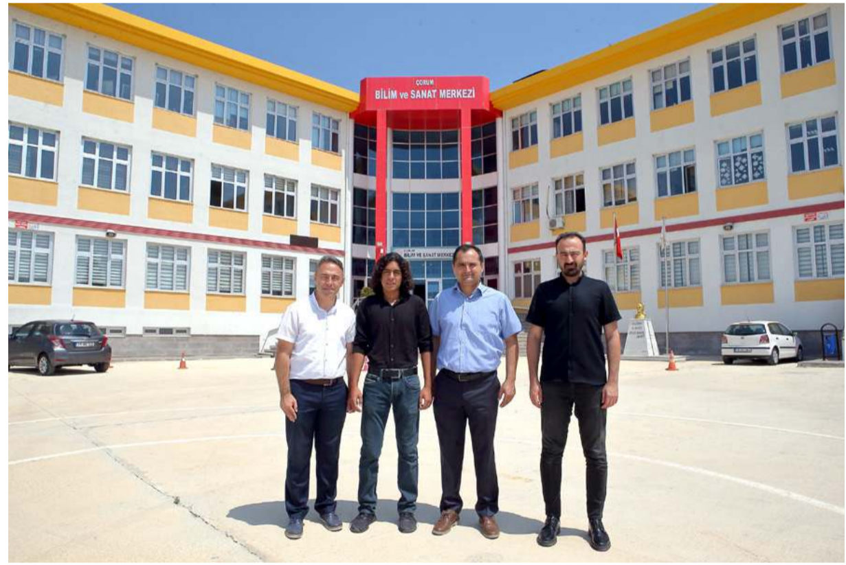
Proje TÜBİTAK'ın 1700 projenin yarıştığı Lise Öğrencileri İklim Değişikliği Araştırma Projeleri Yarışması'nda birincilik elde etti.

Kayıtlarda, meyve sineklerinin yüksek ısılarda hayatta kalma oranlarının düştüğü görülürken, laboratuvar çalışmalarında elde edilen veri ve görsellerle, aynı öğrencilere gruplar halinde verilen farkındalık