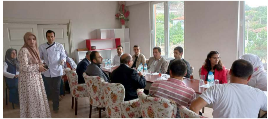
Oğuzlar'a özgü cevizli kartol yemeği ilçe protokolünün beğenisine sunuldu.