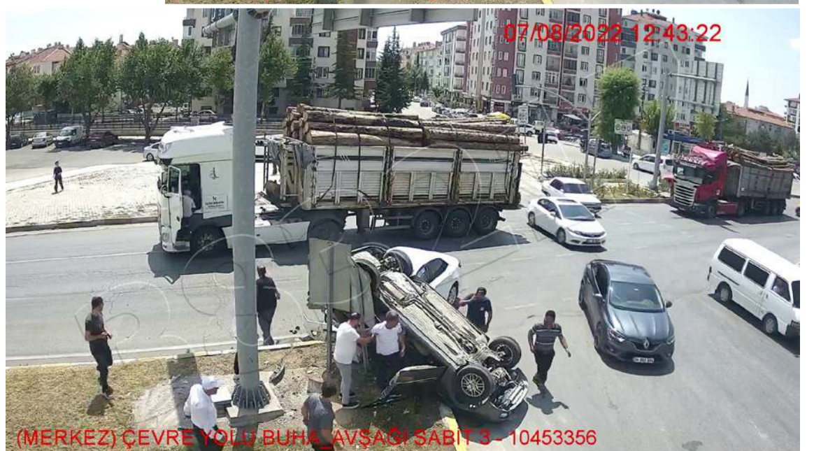
(MERKEZ) ÇEVRE YOLU BUHA_AVŞAĞI SABIT 3 - 10453356

Yaralılara ilk müdahaleyi çevredeki vatandaşlar yaptı.