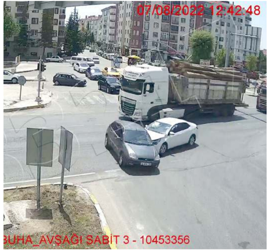
BUHA_AVŞAĞI SABIT 3 - 10453356

Kaza, bölgede bulunan KGYS görüntülerine yansdı. Görüntülerde kavşakta diğer araçlar beklerken karşıya geçmeye çalışan otomobil, önce kamyonla çarpıştıktan sonra kurtuluyor. Önüne aniden çıkan araç nedeniyle kamyon şoförü fren yapıp beklerken, otomobil karşı şeride geçmek için yoluna devam ediyor. Bu sırada Samsun istikametine seyir halinde olan otomobil diğer araçla çarpıyor. Çarpışmanın etkisiyle savrulan otomobil takla atarak orta refüjde bulunan tabelalara çarparak duruyor.