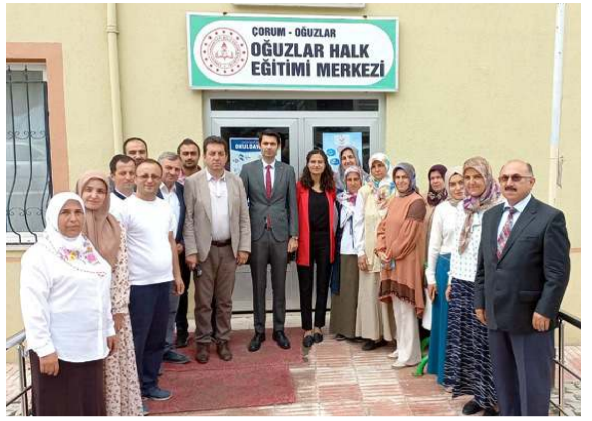
Aşçı yardımcılığı kursuna ilgi yüksek oldu.