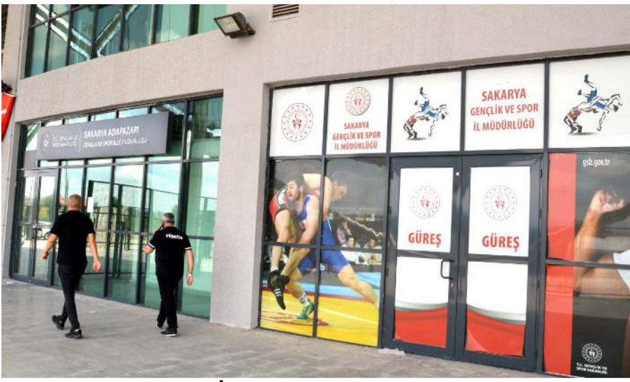
Gençlik ve Spor İl Müdürü Cemil Çağlar Çorum Şehir Stadyumu'nun 'Yaşayan Stadı' olması için hazırlanan proje doğrultusunda Sakarya Atatürk Stadı'nda incelemelerde bulundu.