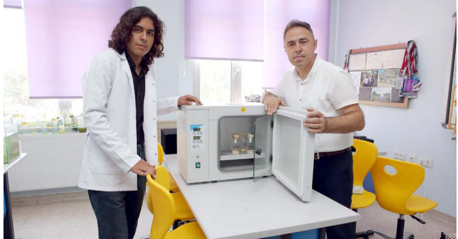
Ödüllü proje kapsamında, gelecek yıllarda kentteki ilk ve ortaokul öğrencilerine yönelik farkındalık eğitimleri verilmesi planlanıyor.

TÜBİTAK yarışmasında birinci olan proje TEKNOFEST'te sergilenecek