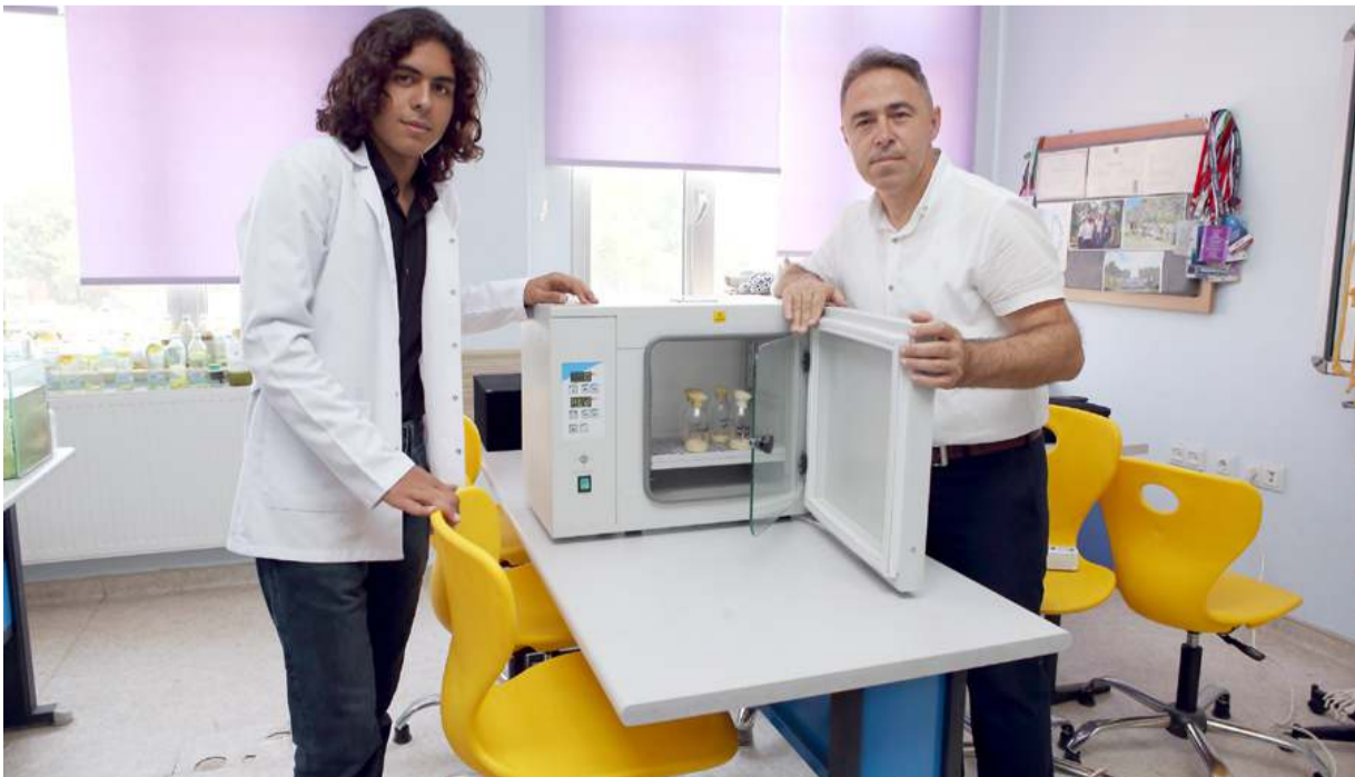
Ödüllü proje kapsamında, gelecek yıllarda kentteki ilk ve ortaokul öğrencilerine yönelik farkındalık eğitimleri verilmesi planlanıyor.

Çorum Bilim ve Sanat Merkezi'nde geliştirilen "İklim Kutusunun Öğrencilerin Farkındalıkları Üzerine Etkisi Projesi" ile öğrenciler, iklim değişikliğinin canlılara etkisini kısa sürede görebiliyor.