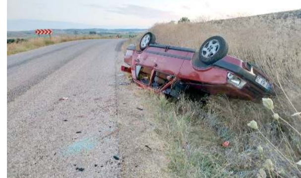
Kaza Alaca'ya bağlı Eskiyağar köyü yol ayrımında meydana geldi.