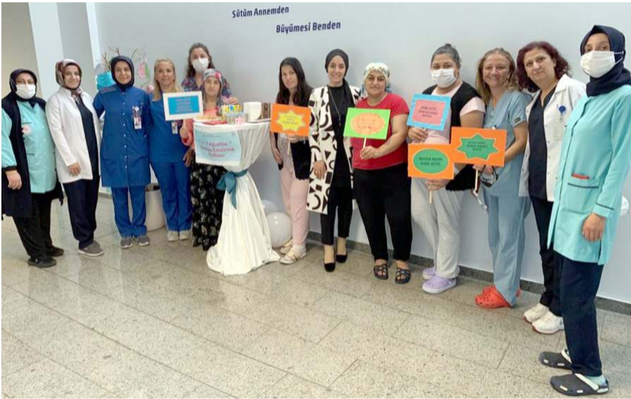
Etkinliklerde pankartlarla, anne sütünün önemine dikkat çekildi.