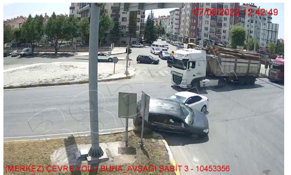
(MERKEZ) ÇEVRE YOLU BUHA_AVŞAĞI SABIT 3 - 10453356

Kaza, önceki gün Buharaevler kavşağında meydana gelmişti.