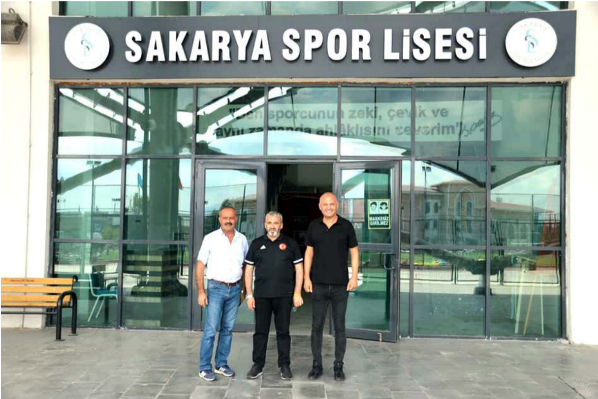
Sakarya Atatürk stadyumu içinde faaliyetleri gösteren Spor Lisesi tüm işlevlerini bu bina içinde yapıyor