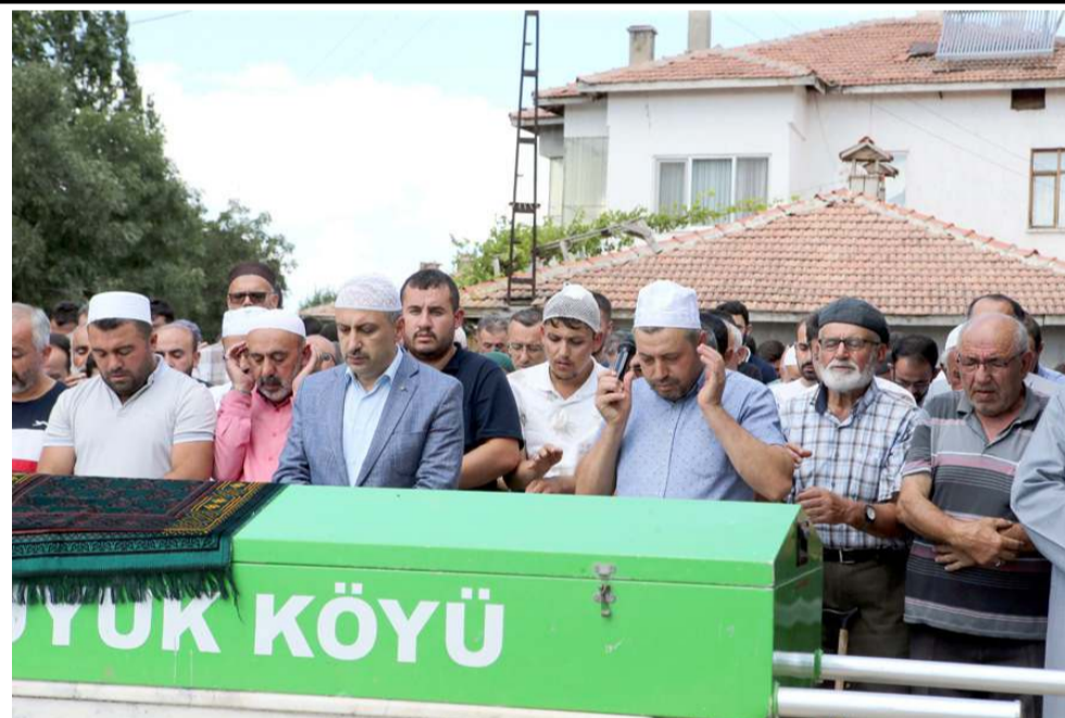
Anne ile bebeği aynı tabutta son yolculuğuna uğurlandı.