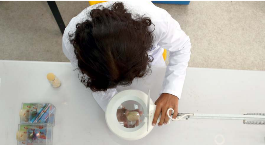
Proje kapsamında meyve sineklerinin farklı ısılardan sonraki hareketleri 3 hafta boyunca özel bir yazılımla kameralarla kayıt altına alındı.