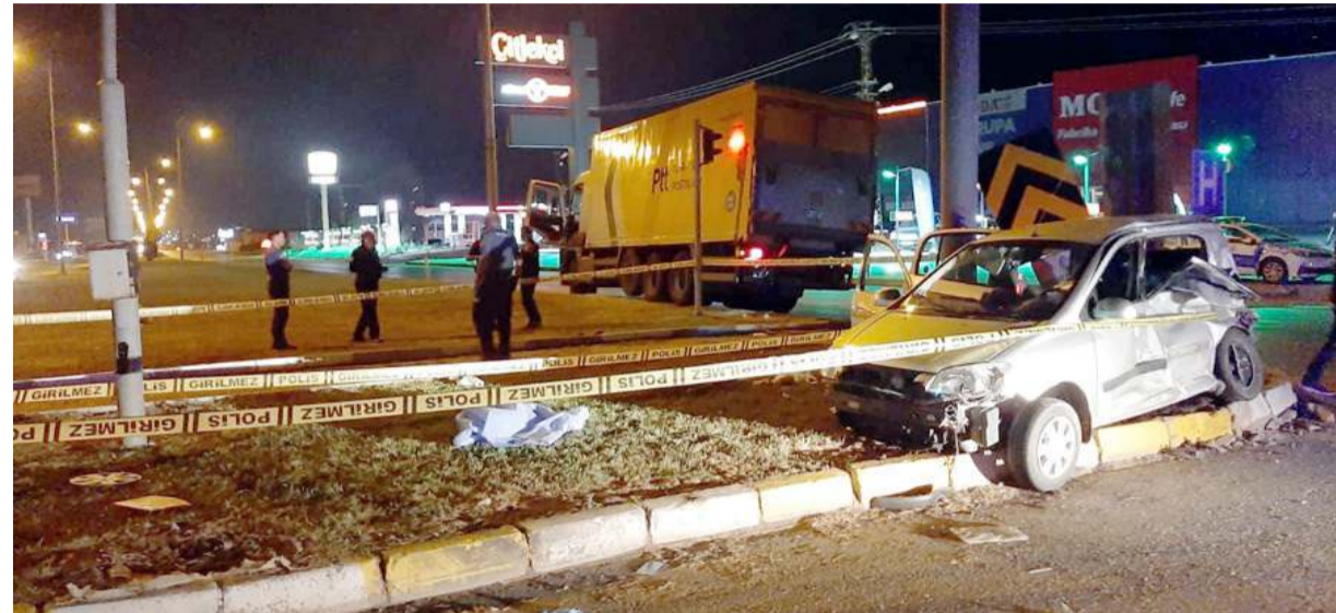
Kaza önceki gece İskilip Kavşağı'nda meydana geldi.

Kazanın ardından kamyon sürücüsü gözaltına alındı.