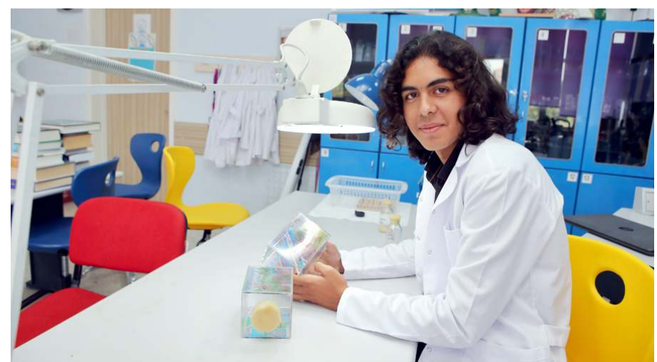
Proje kapsamında okullarda yapılan çalışmalar öğrenciler üzerinde olumlu etkiler bıraktı.

"Ayrıca öğrencilerin yüzde 10'u ile yaptığımız mülakatlarda, 'iklim değişikliği' denildiğinde, küresel ısınma ve sünyanın ortalaması dışında bahsettikleri, bu duruma neden olan gazlar arasında karbondioksit, karbonmonoksit ve metan gazlarını saydıkları, buna karşı alınabilecek tedbirler konusunda toplu taşıma kullanımı, yenilenebilir enerji kullanımına dikkat ettiklerini gözlemledik. Dolayısıyla çalışmamızın öğrenciler üzerinde oldukça olumlu etki bıraktığını, farkındalıklarını artırdığını düşünüyoruz. İklim değişikliği farkındalığının artmasının öğrencilerin erken yaşta verilecek eğitimlerle artabileceği kanaatindeyiz."(AA)