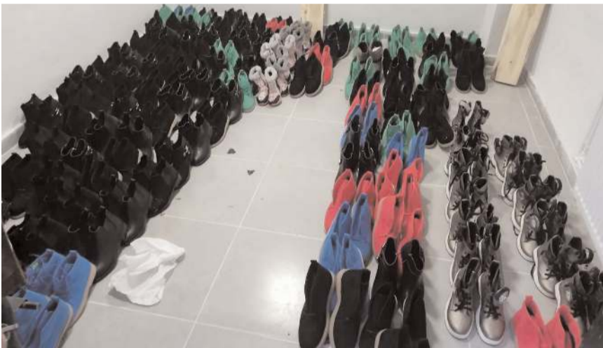
Hayırseverler tarafından sağlanan botlar ihtiyaç sahiplerine dağıtıldı.