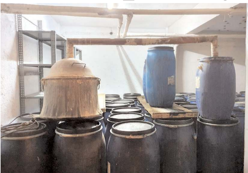
Operasyonda 12 bin 500 litre sahte içki ele geçirildi.