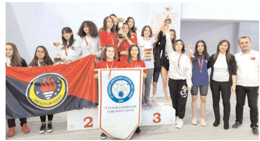
Genç bayanlarda dört sırayı alan okullar kupa töreninde kürsüde

Müsabakalar sonunda düzenlenen törenle branşlarında dereceye girenlere madalya takım halinde dereceye giren okullara ise kupaları verildi.