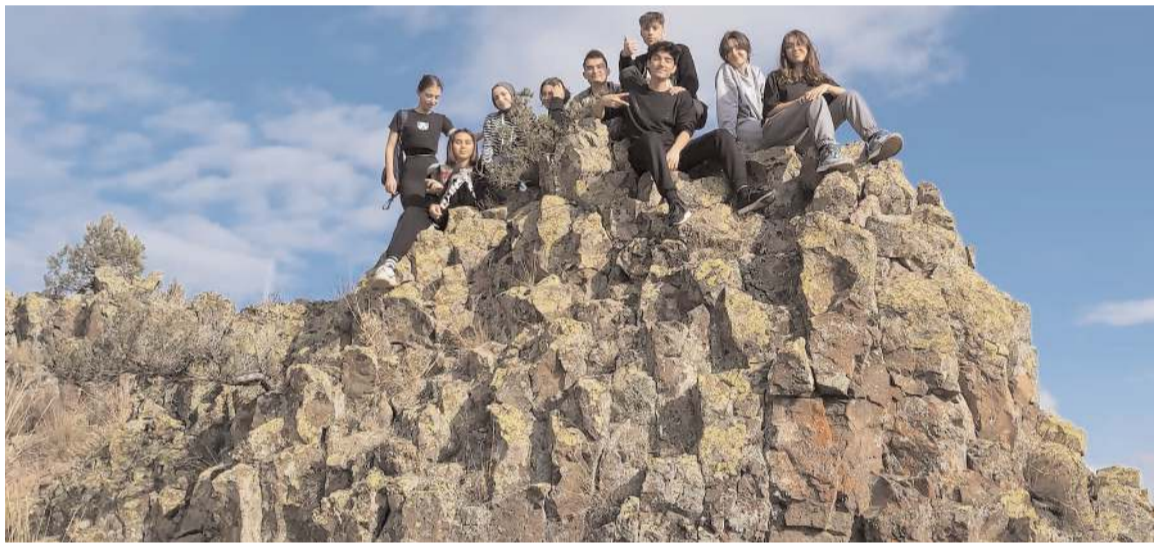
Öğrenciler hafta sonu ise doğa yürüyüşü yaptılar.

Öğrenciler ayrıca hafta sonu da öğretmenleriyle birlikte dağ yürüyüşü yaptılar. (Haber Merkezi)