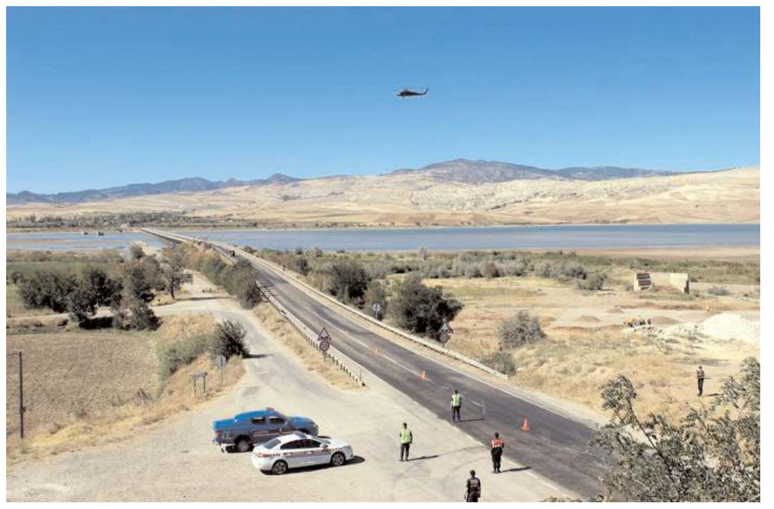
Jandarma Kasım ayı içerisinde, 5.502 önleyici devriye, şok yol kontrol ve huzur güven uygulaması yaptı.

Bir şüphelinin gözaltına alındığı operasyon, polis kamerasınca kaydedildi.