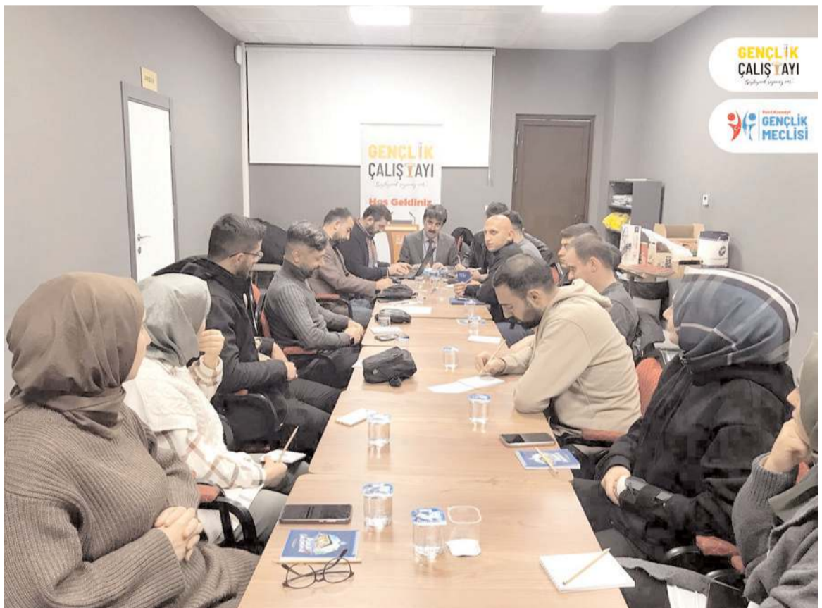
STK temsilcilerinin moderatörlüğünde çalışma atölyeleri oluşturuldu.

Bu kapsamda öncelikle Kent Konseyi Gençlik Meclisi üyeleri ve Platform üyesi dernek başkanlarının moderasyonunda "Liseliler, Üniversiteli ve Çalışan Gençlik" kategorilerinde, gençlerimizin içinde buldukları ortamlarda karşılaştıkları sorunları ve varsa