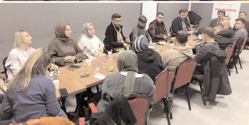
Çalışma atölyelerinde gençler kendilerini özgürce ifade ederek kendi sorunlarına çözümleri de kendileri sundu.