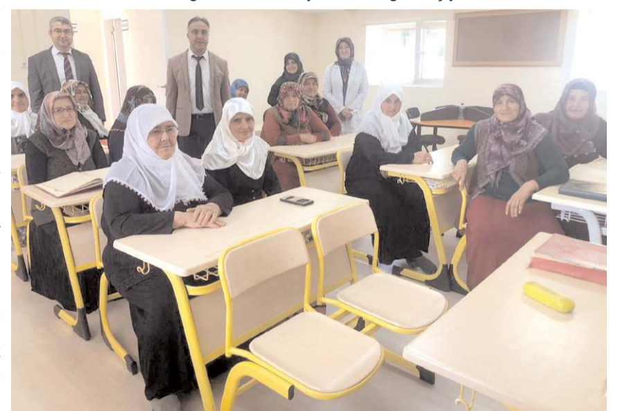
Kurslardan 73 bin 036 vatandaş yararlandı.