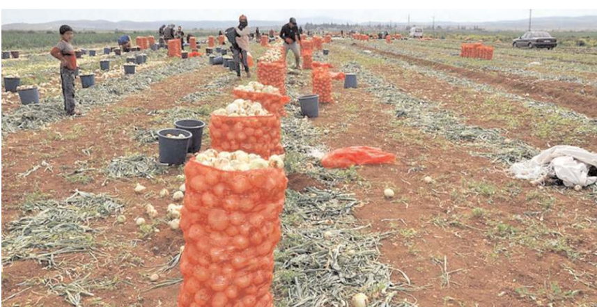
İhraç edilen soğan 6-7 liradan satılıyor.