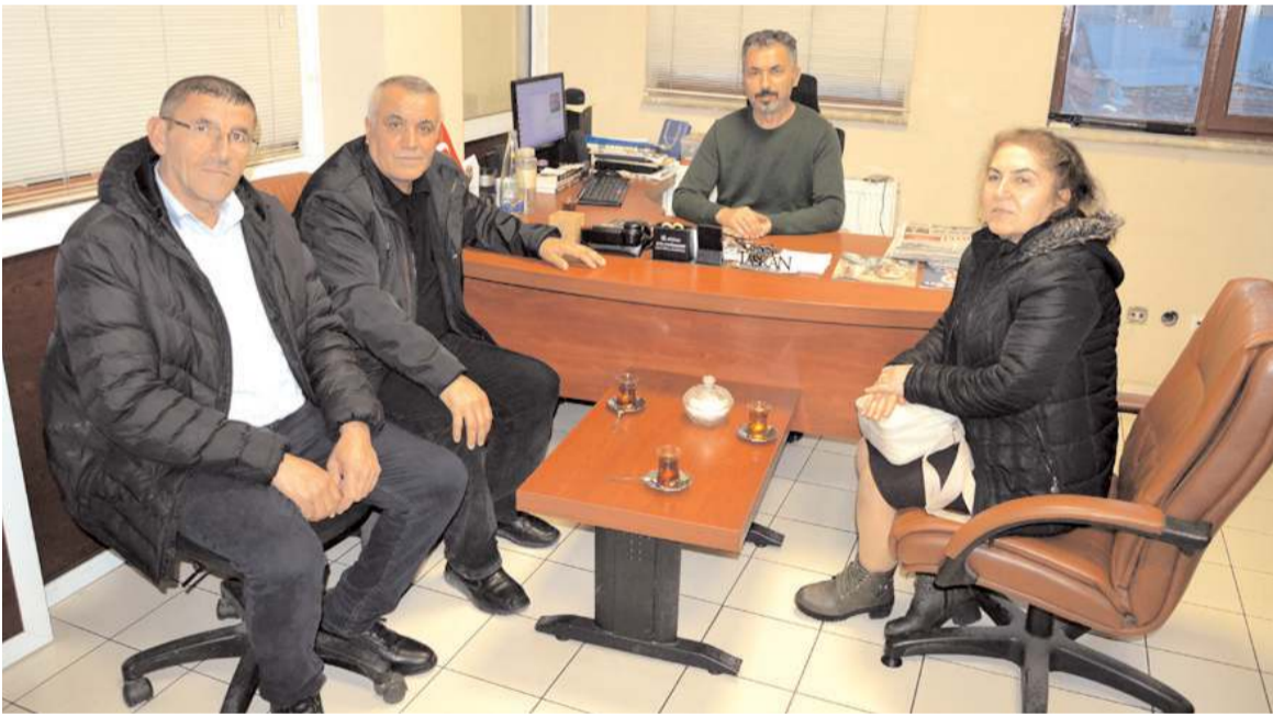
Mecitözü Dernekleri Federasyonu yönetimi gazetemizi ziyaret etti.