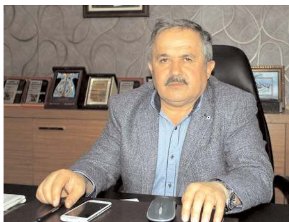
Ziraat Odası Başkanı Mehmet Sayan