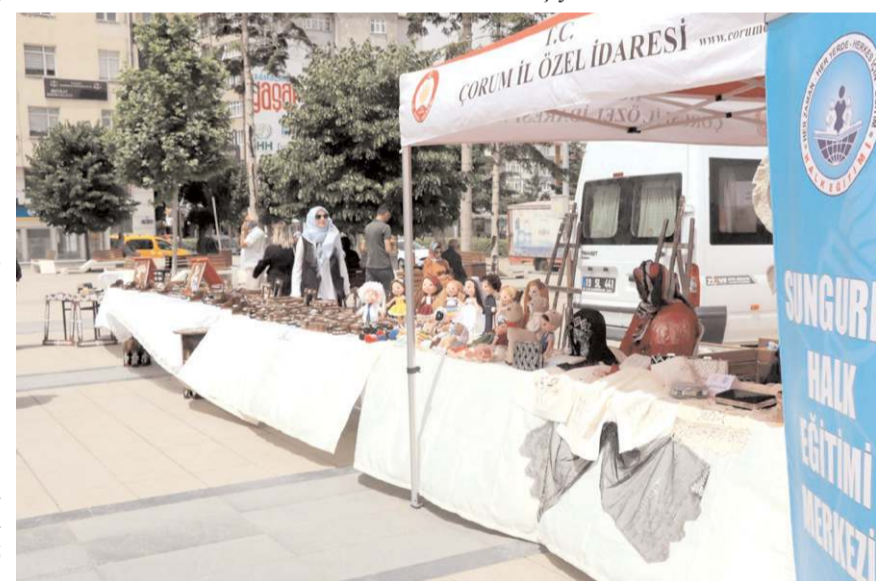
Kurslara 27 bin 525 erkek, 45 bin 511 kadın kursiyer katılıyor.