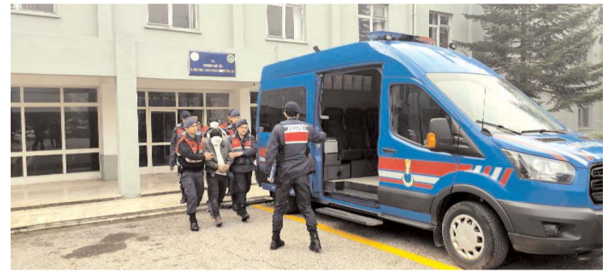
Çeşitli suçlardan aranan 58 şahıs yakalandı.