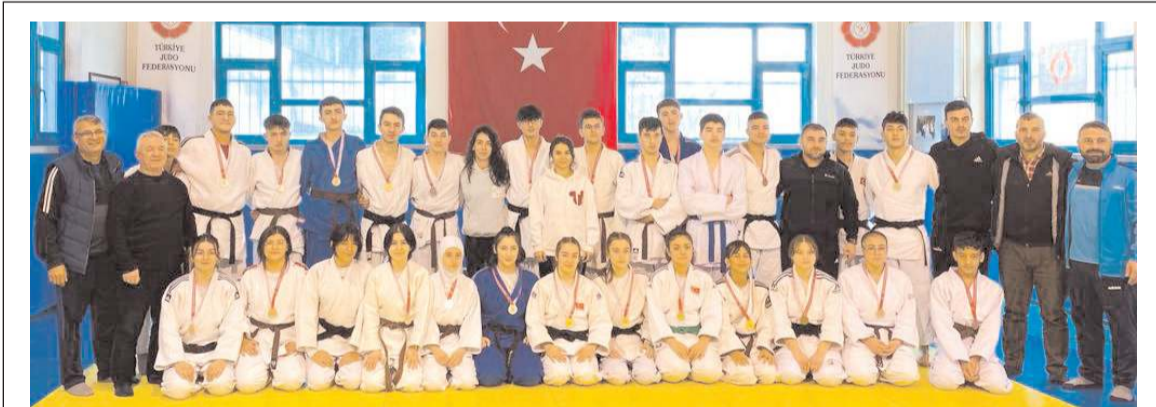
İl birinciliğinde mücadele eden sporcular öğretmenler ve antrenörleri ödül töreni sonrasında toplu halde