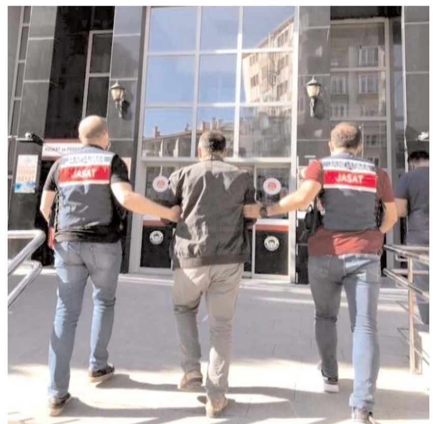
Çeşitli suçlardan 176 şüpheli hakkında adli soruşturma başlatıldı.