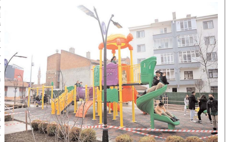
Parkin yapılmasına en çok çocuklar sevindi.