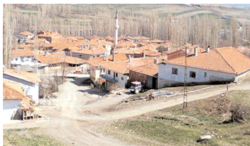
Arazilerin satış ihalesi 20-21-22 ve 23 Aralık tarihlerinde yapılacak.