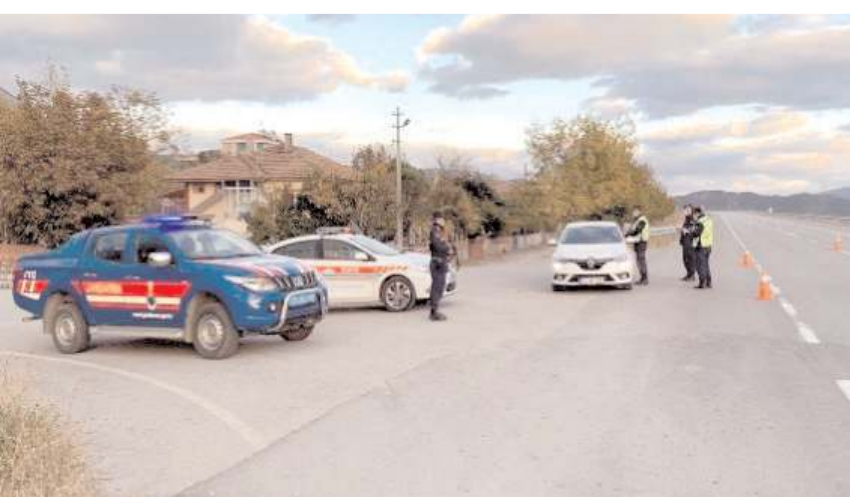
Jandarma Kasım ayı içerisinde, 5.502 önleyici devriye, şok yol kontrol ve huzur güven uygulaması yaptı.

■ İl Jandarma Komutanlığı sorumluluk alanında emniyet ve asayiş ile kamu düzeninin sağlanması, aranan şahıslar ile yasaklı maddelerin yakalanması çalışmalarına 24 saat kesintisiz devam ediyor. Jandarma ekipleri tarafından yapılan operasyonlarda çeşitli suçlardan aranan 58 şahıs yakalandı.