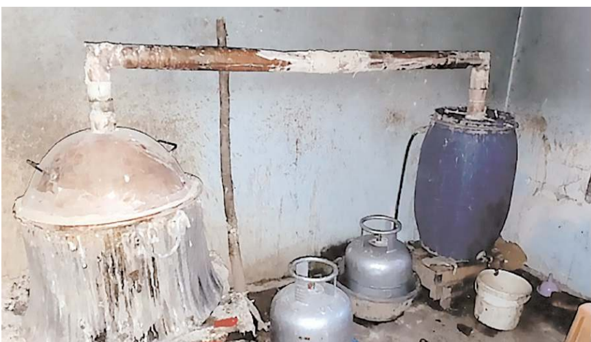
Operasyonda sahte içki üretmekte kullanılan düzenekle bulundu.

Çorum'da 12 bin 500 litre sahte içki ele geçirildi, bir şüpheli gözaltına alındı.