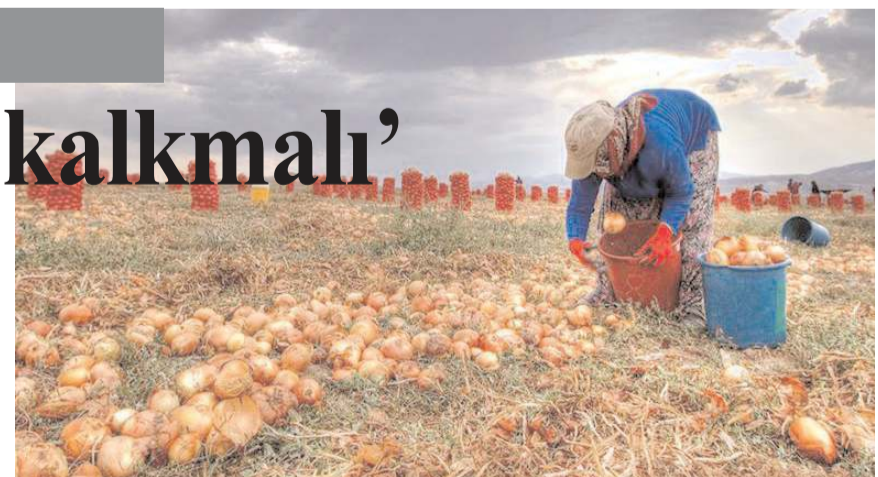
Soğan fiyatları depolarda 4,5 ile 5 lira arasında değişiyor.

Sayan, "İhracatta sıkıntı olunca, seneye ekilmeyen soğanı daha pahalı tüketeceğiz. Kademeli olarak bunun önünü açılırsa soğanda bir sıkıntı olmaz. İhraç edilen soğan yasaktan sonra satışları durdu. En azından iç pazarda tüketilmeyen ihracat ürünü mor soğanın önünü açılmasını talep ediyoruz. Çorum'da depolarda en az 150 bin ton ihracat ürünü mor soğan var. Kente en az 300 bin ton soğan bulunuyor" diye konuştu.