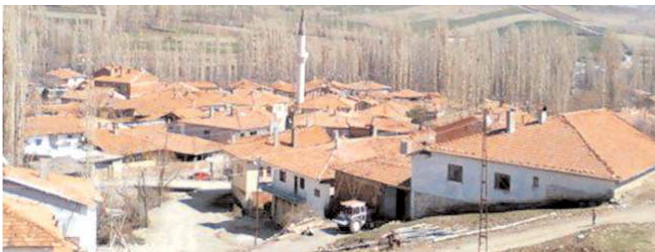
Arazilerin satış ihalesi 20-21-22 ve 23 Aralık tarihlerinde yapılacak.

Ayrıca Ahmetoğlu, Akçakaya, Çalyayla, Erdek, Gökçepinar, Karacıkili, Kızılpınar, Kumçelteği, Yakuparpa köylerinde hazineye ait 10 arsada 23 Aralık tarihinde açık artırma usulü ile satılacak.