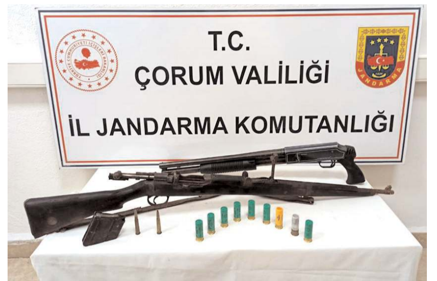
Operasyonlarda 8 ruhsatsız silah ele geçirildi.