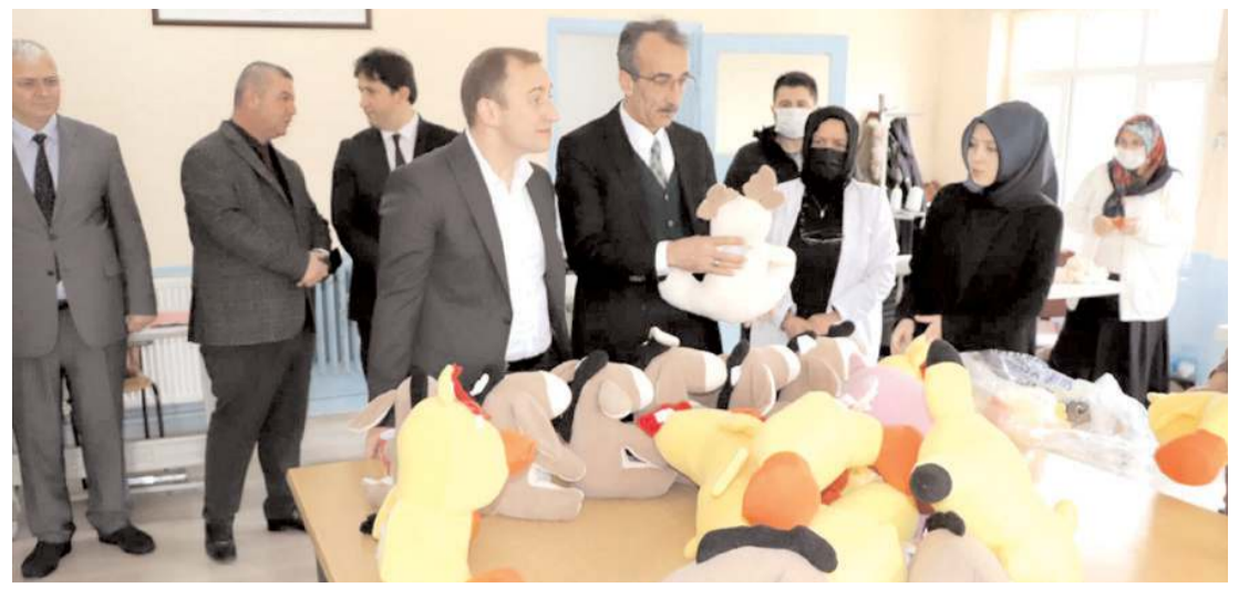
Halk eğitim merkezleri 2022 yılında 3 bin 841 kurs açtı.

tüm konut kuralının tamamlanması planlanıyor Proje çerçevesinde 81 ilde 250 bin sosyal konutun kura çekilişlerinin Mart 2023'e kadar etaplar halinde tamamlanması ve hak sahiplerinin belirlenmesi planlanıyor. (İHA)