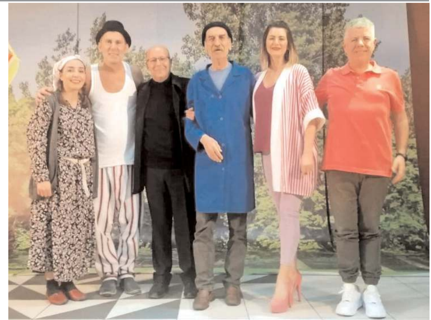
Tiyatro oyununda rol alan sanatçılar izleyicilerden büyük alkış aldı

Oyunu izlemek için salonu dolduran misafirlere hediye çekilişleri yapıldı. Çekilişte hediye çıkan davetliler kazandıklarını kulübe bağışlayarak destek verdiler. Kargiserispor Başkanı