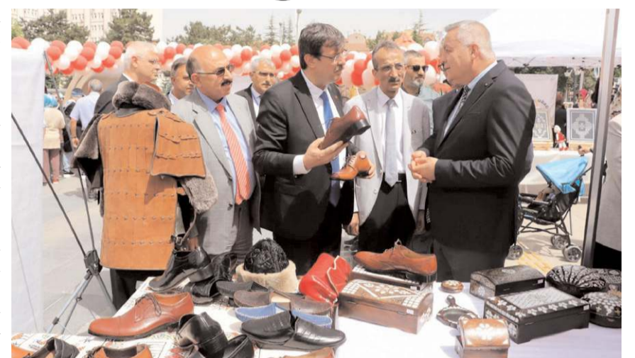
Halk eğitim merkezleri yıl sonu sergileri açıyor.