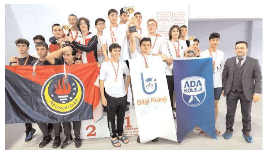
Erkekler takım sıralamasında dereceye giren okullar kürsüde toplu halde