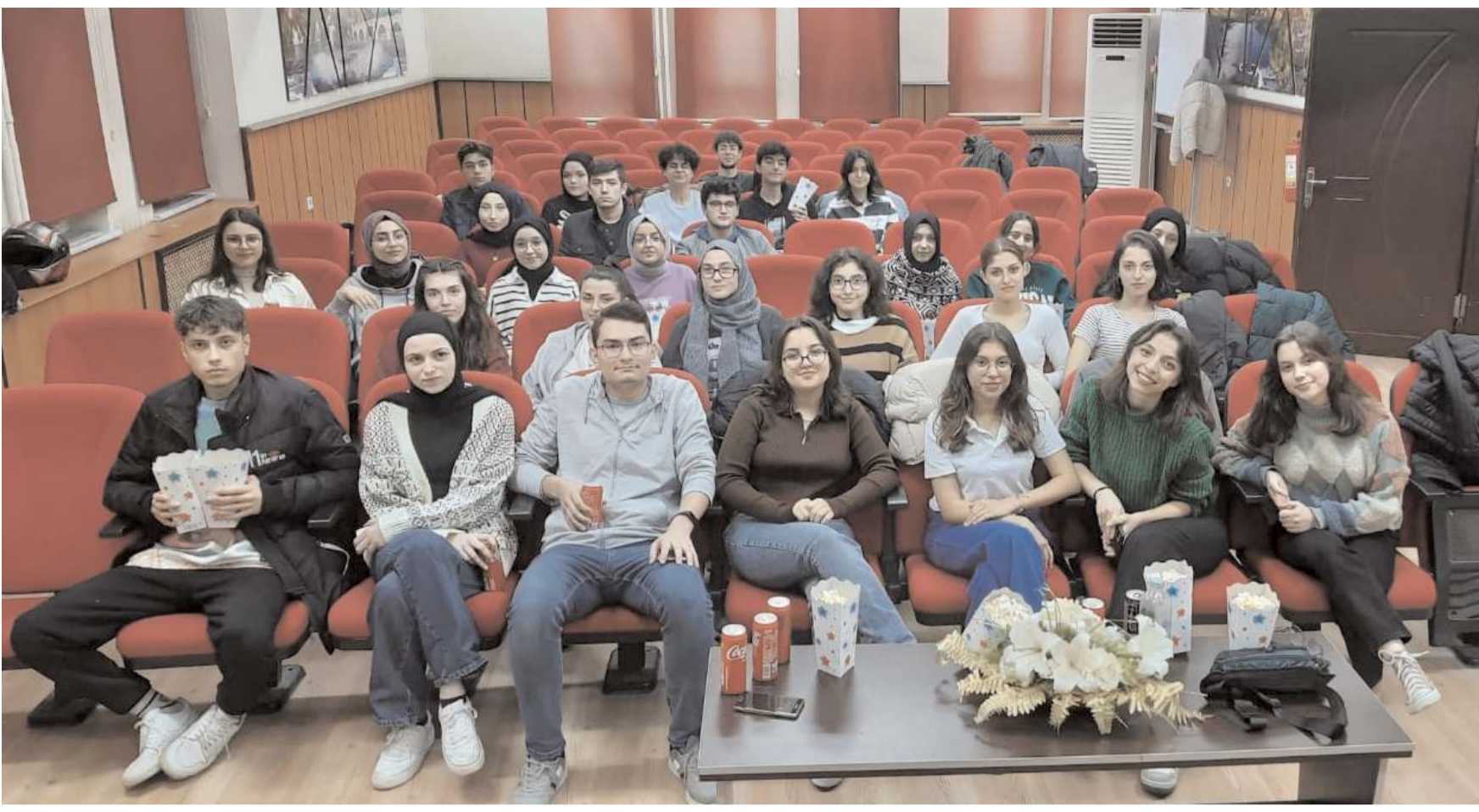
Osmancık Ömer Derindere Fen Lisesi 12. sınıf öğrencileri için sinema etkinliği gerçekleştirildi.