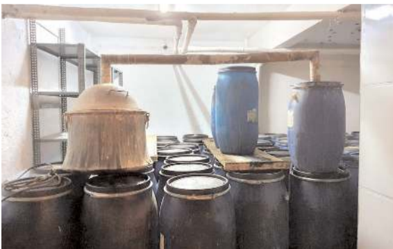
Operasyonda 12 bin 500 litre sahte içki ele geçirildi.