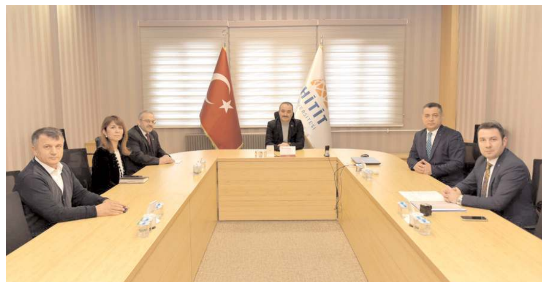
2022-2026 yıllarını kapsayan maaş promosyonu ihalesi güncelleme görüşmeleri tamamlandı.

20.000 TL + 1.000 TL paraf puan ödemesi yapılacak şekilde anlaşmaya varıldı. Türkiye Halk Bankası, söz konusu ödemesi Şubat 2023 ay sonuna kadar yapacağını belirtti. (Haber Merkezi)