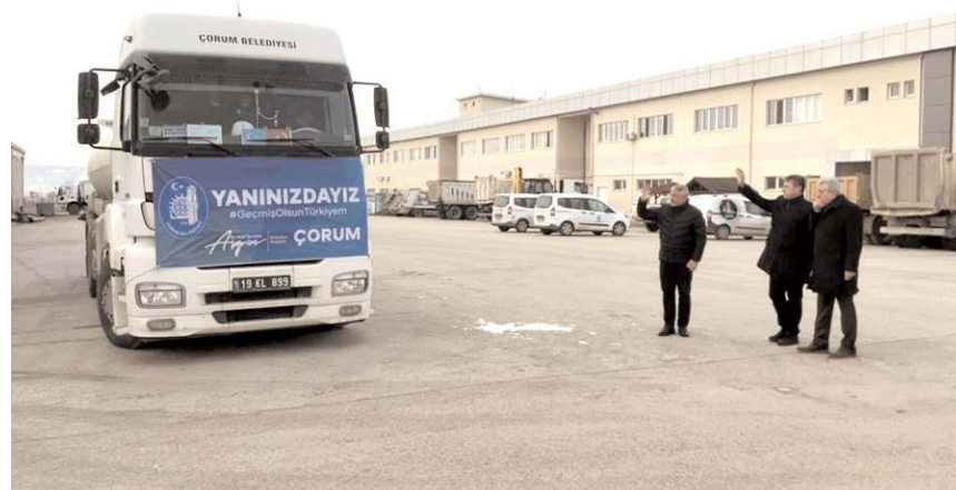
Başkan Aşgın, Akaryakıt desteğinde bulunan hayırseverlere tek tek teşekkür etti.

■ Çorumlu hayırsever iş adamlarının destekleriyle temin edilen 33 bin 500 litre mazot deprem bölgesine gönderildi. * HABERİ 8'DE