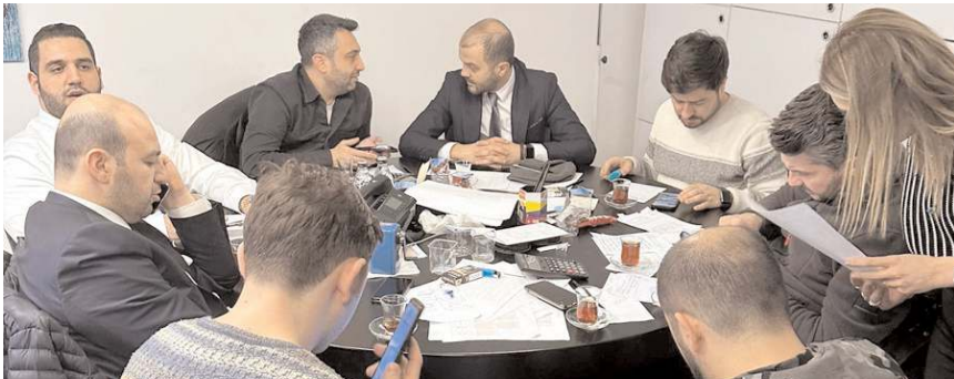
Yardım çalışmalarını Ahlatıcı Acil Durum ve Afet Yardım Koordinasyon Merkezi koordine ediyor.