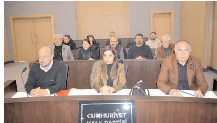
Toplantıda gündem maddeleri görüşülerek karara bağlandı.