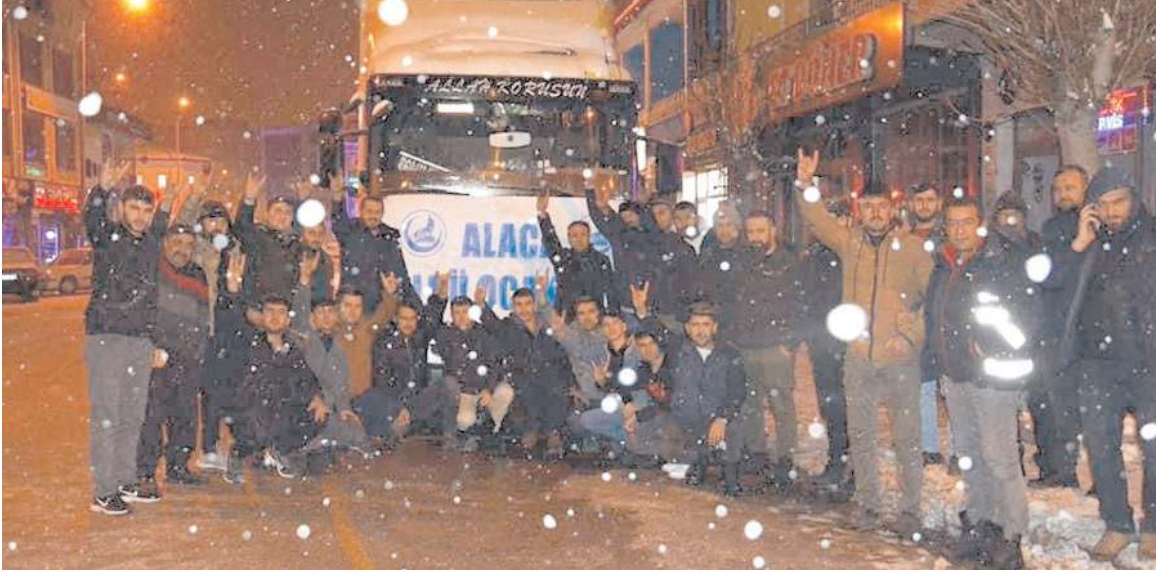
Kampanya kapsamında toplanan yardımların bir kısmı deprem bölgesine gönderildi.