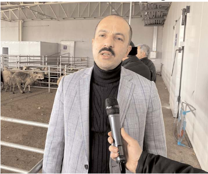
Deprem bölgesine başlatılan yardım kampanyasına Çorumlular'dan destek yağıyor.