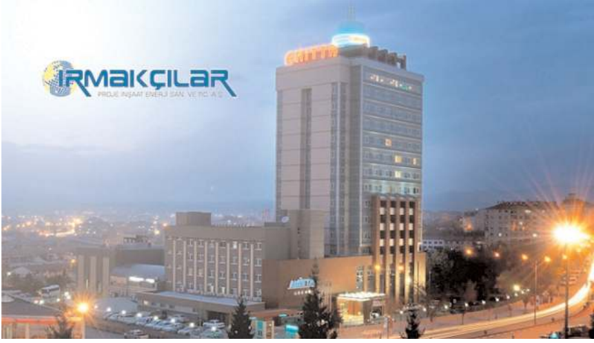
Anitta Otel'de 100 kişilik bir ekibi ağırlamaya hazır olduklarını açıkladı.

■ Türkiye'yi yasa boğan Kahramanmaraş-Gaziantep depreminin ardından yaralar sarılmaya çalışılıyor. Türkiye Otelciler Federasyonu ve Akdeniz Turistik Otelciler ve İşletmeciler Birliği'nce (AKTOB), Kültür ve Turizm Bakanlığı iş birliğiyle oteller kapılarını depremzedelere açıyor. Bu kapsamda Çorum'da Anitta Otel ve Grand Park Otel, depremin etkilediği 10 ilden misafirlerini ağırlamaya hazır olduklarını açıkladı. * HABERİ 3'DE