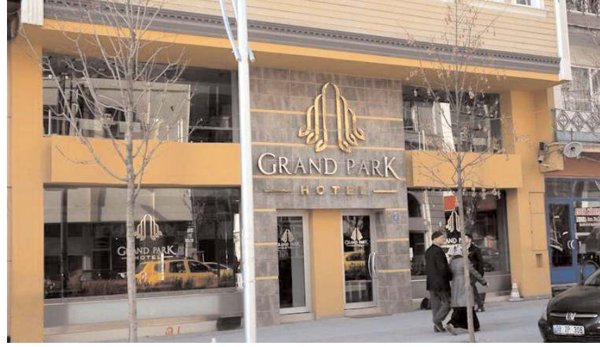
Grand Park Otel, depremin etkilediği 10 ilden misafirlerini ağırlamaya hazır olduklarını açıkladı.