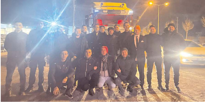
Yardımlar önceki akşam gönderildi.

500 adet çocuk külot, 1000 adet uniseks içlik-üst, 1000 adet uniseks içlik-alt, 1000 adet çocuk külotlu çorap, 350 adet bere, 5050 adet erkek kazak, 2550 adet kadın kazak.