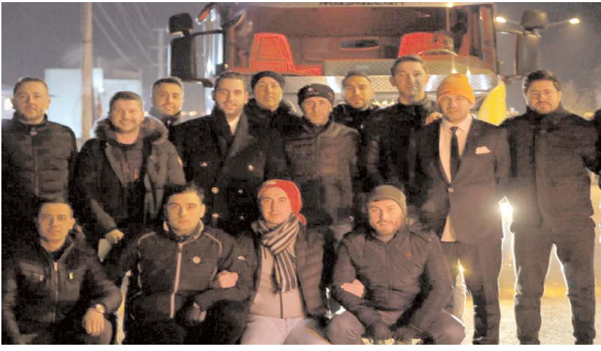
Yardımlar önceki akşam gönderildi.

■ Kahramanmaraş merkezli meydana gelen ve 10 ilde yıkıma neden olan depremin ardından harekete geçen Ahlatıcı Eğitim Sağlık ve Yardım Vakfı, bölgeye 25 milyon liralık yardım gönderdi. * HABERİ 2'DE