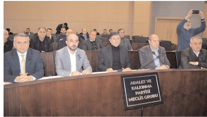
Şubat ayı Belediye Meclisi toplantısı dün yapıldı.