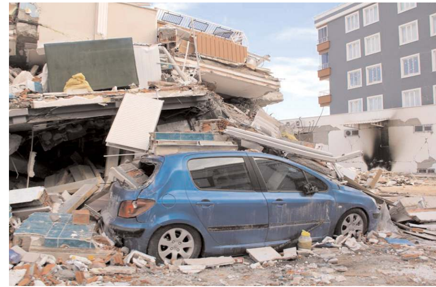
Çok katlı binaların yerle bir olduğu şehirde büyük dram yaşanıyor.