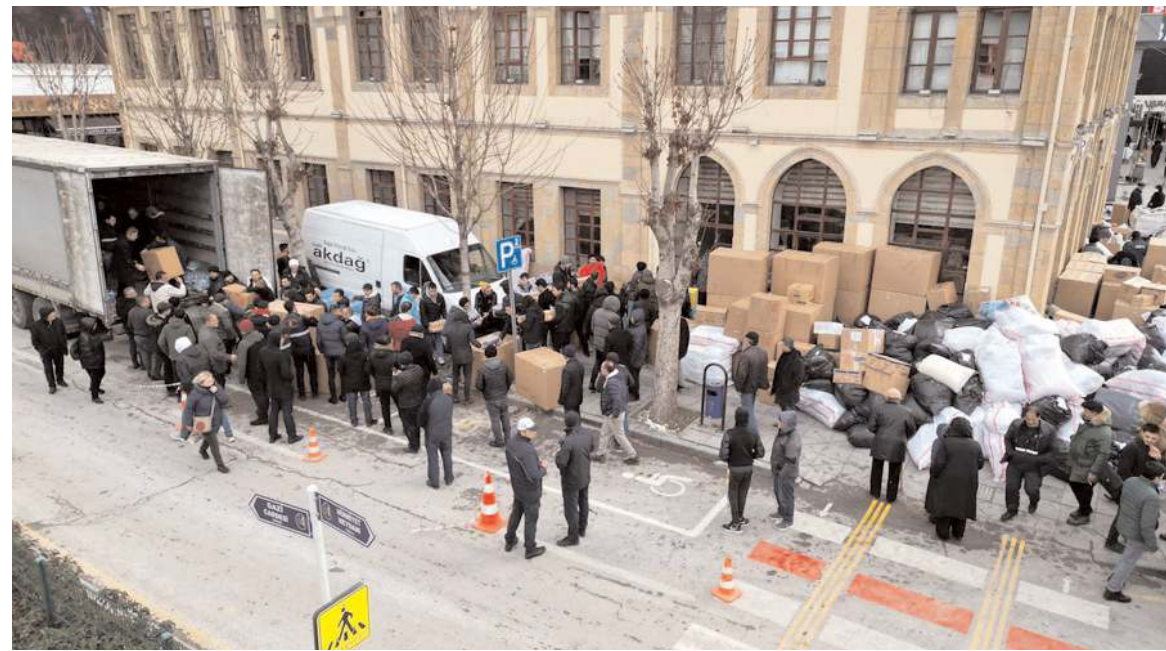
Çorumlular'ın omuz omuza yüklediği tırlar dolusu yardım malzemesi deprem bölgesine uğurlanıyor.