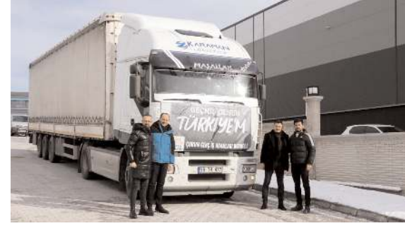
Benka Ancılık'ta toplanan yardımlar, tirlarla deprem bölgelerine uğurlanıyor.