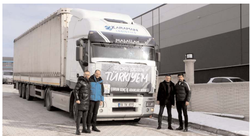
Benka Arıcılık'ta toplanan yardımlar, tırlarla deprem bölgelerine uğurlanıyor.

Bölgede ihtiyaç duyulan battaniye, elektrikli ısıtıcı, mont, eldiven, bere ve gıda maddelerini tedarik eden GİAD, hergün 1 tır dolusu malzemeyi deprem bölgelerine ulaştırıyor.