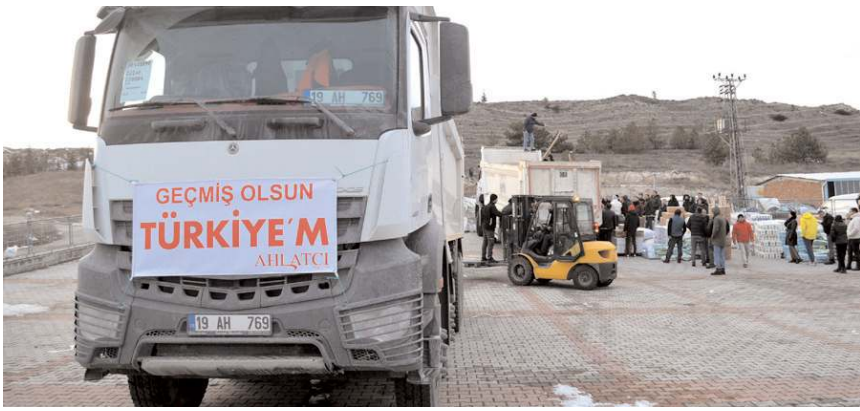
Ahlatıcı Eğitim Sağlık ve Yardım Vakfı, bölgeye çok sayıda araçta gönderdi.

3600 adet bayan havlu çorap, 1400 adet bayan pantik, 5000 adet bayan iç çamaşır, 5000 adet bayan atlet, 5000 adet çocuk havlu çorap, 5000 adet çocuk atlet,