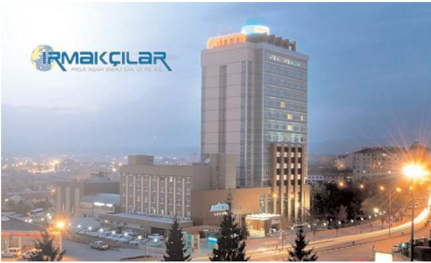
Anitta Otel'de 100 kişilik bir ekibi ağırlamaya hazır olduklarını açıkladı.