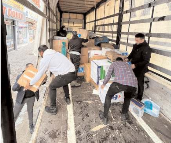
Çorum Ülkü Ocakları, depremzedelere yardımda bulunmak için harekete geçti.

Çorum Ülkü Ocakları'ndan yardım çalışması hakkında yapılan açıklamada, "Çorum Ülkü Ocakları olarak bizler de depremde zarar gören milletimizin acılarını yüreğimizde hissediyor ve yaraların sarılması hususunda üzerimize düşecek olan her sorumluluğa samimiyetle evet diyoruz. Yaşanan elim hadise son- rasında Liderimiz Sayın Dr. Devlet Bahçeli'nin tali- matıyla deprem bölgelerine ulaştırmak üzere düzen- lediğimiz yardım kampanyası hemşehrilerimizin te- veccühüne mazhar olmuş, bu sayede toplanan yar- dımların ilk partisi geç kalmamak adına bugünden Alaca Ülkü Ocakları Başkanımızın nezaretinde Kah- ramanmaraş, Afşin bölge- sine ulaştırılmak üzere yo- la çıkmıştır. İkinci yardım aracımız ise Allah'ın izniyle hafta sonu yola çıkacaktır. Depremden zarar gö- ren kardeşlerimize bu zor günlerinde bir nebze de ol- sa nefes alacak olan bu yardımlarda bizlerin de katkısı olsun diyen değerli gönüldaşlarımız, kıymetli hemşehrilerimiz aynı ve nakdi yardımlarını hafta sonuna kadar Çorum Ülkü Ocakları'na ulaştırabilir- ler" denildi.