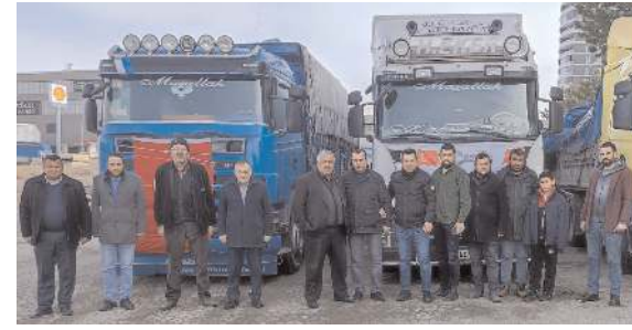
ÇESOB büyük felaketin ardından depremzedelere yardım için seferber oldu