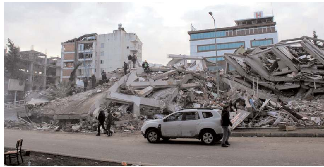
Deprem'in 3'üncü gününde kaydedilen görüntüler izleyenlerin yüreğini sızlattı.