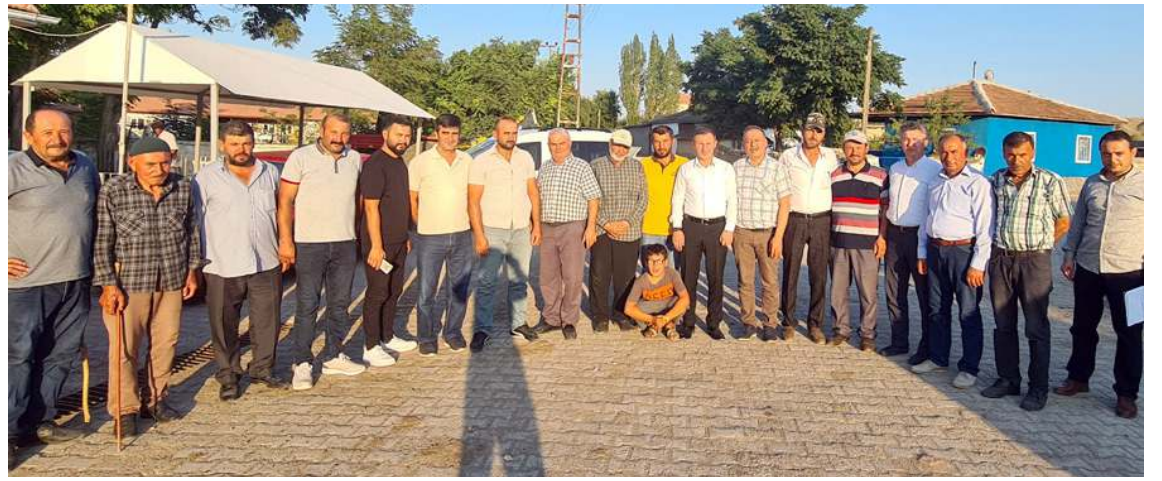
Sungurlu'da bulunan 109 köyün 50'sinde sütte soğuk zincir oluşturmak için harekete geçildi.

Yarışmada dereceye giren üreticilere bakır kazan hediye edildi. (Haber Merkezi)