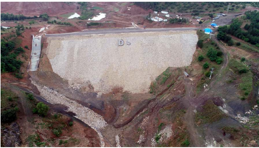
Barajda depolanacak su ile 2 bin 310 dekar tarım arazisi suya kavuşacak.