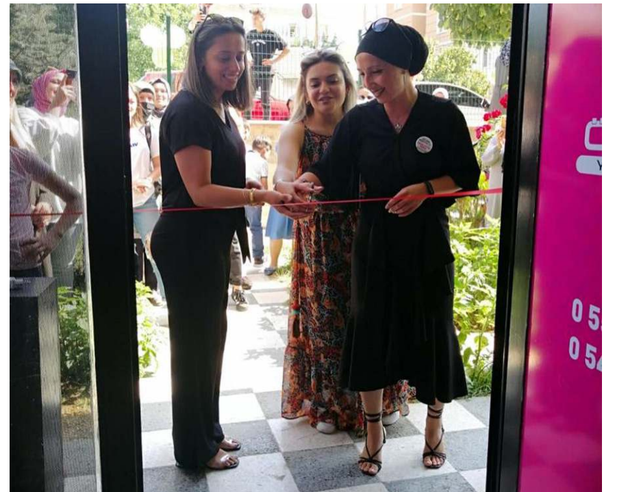
Merkez, Selçuk 2. Cadde Uhud Apartmanında açıldı.

Ulukavak Mahallesi Selçuk 2. Cadde Uhud Apartmanı 40/B (Altın Çocuk Anaokulu arkası) adresinde bulunan Öz Aktif Yaşam Merkezi'nin açılışına çok sayıda davetli katıldı.