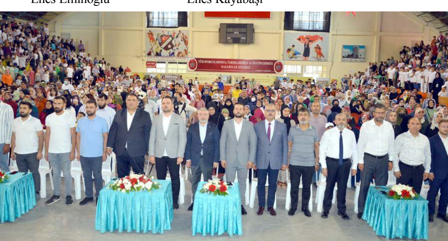
Türkiye Gençlik Vakfı yaz okulunun kapanış programı yapıldı.