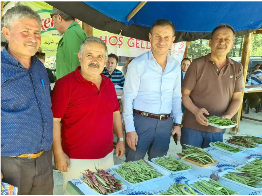
Karagöl Fasulye Şenliğinin 15'incisi Kızılıpınar Köyü'nde gerçekleştirildi.

Çorum'da köy derneklerinin düzenlediği Karagöl Fasulye Şenliği'nin 15'incisi Kızılıpınar Köyü'nde gerçekleştirildi.