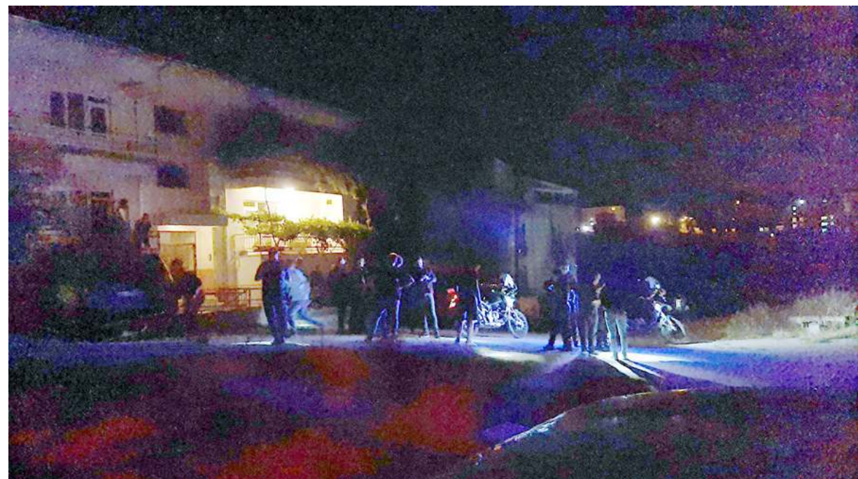
Olay Bahçelievler Mahallesi'nde meydana geldi.

Polis ekipleri, kaçan T.T'yi yakaladı. Zanlının emniyetteki işlemleri sürüyor.(AA)