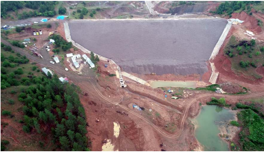
Geykoca Göleti'nde çalışmalar aralıksız devam ediyor.