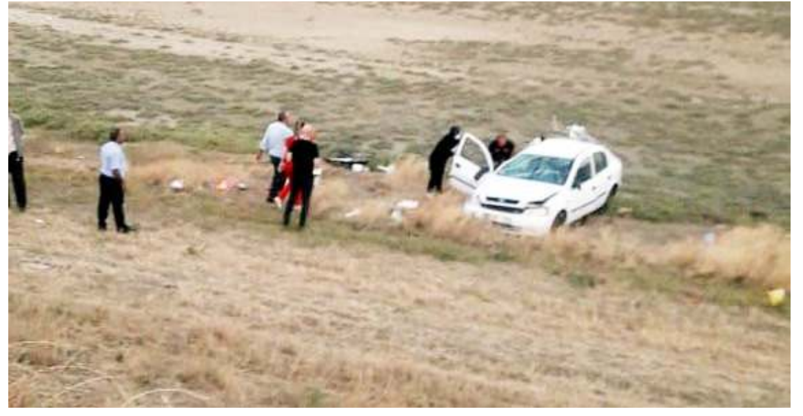
Kaza Hacıbayram köyü yol ayrımında meydana geldi.

Temelden yüksekliği 37 metre ve su depolama kapasitesi 831 bin metreküp olan Geykoca Barajı'nın tamamlanması ile ülke ekonomisine yıllık 6 milyon lira katkı sağlamanın hedeflendiğini de aktaran Akca, "Önyüzü membran kaplı homojen dolgu tipindeki barajın sulama tesisi tamamlanmıştır. Kret kotu 974 metre olan Barajımızda, dolgu çalışması tamamlanmış, membran kaplamasına devam edilmektedir. Şu anda projede % 85 fiziki gerçekleştirme sağlanmıştır" dedi. (Haber Merkezi)