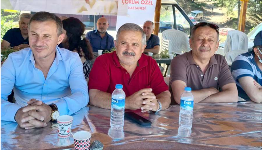
Şenliğe çok sayıda davetli katıldı.