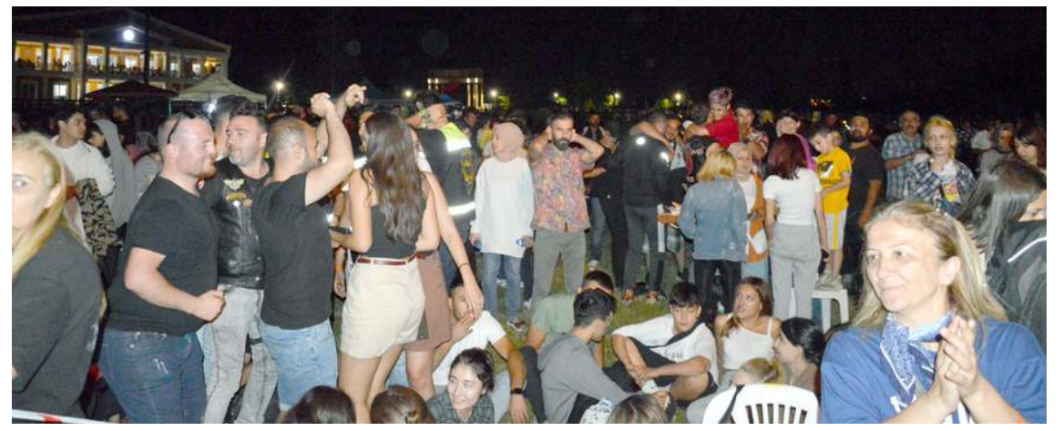
Konser Hitit Motosiklet Festivali kapsamında Atahan Atlı Spor Kompleksi'nde düzenlendi.