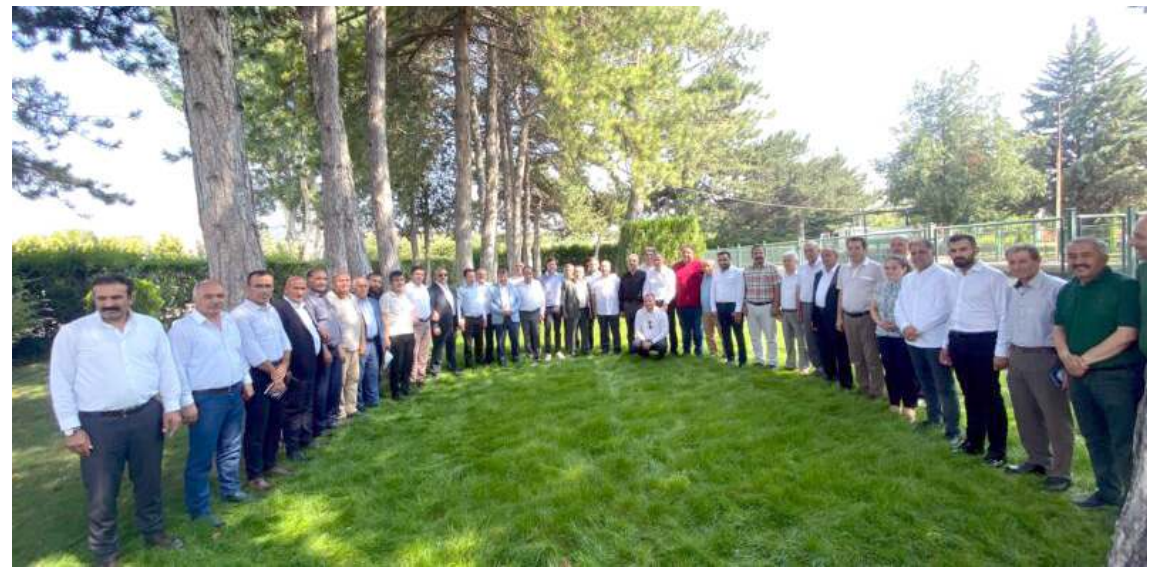
Çorum Belediyesi Park ve Bahçeler Müdürlüğü'nde yapılan toplantıda miting çalışmaları istişare edildi.

Merkez İlçe Başkanı Erhan Akar, ilçe belediye başkanları, ilçe başkanları ile parti yöneticileri Çorum Belediyesi Park ve Bahçeler Müdürlüğü'nde bir araya geldi. Burada Cumhurbaşkanı Erdoğan'ın Çorum ziyaretiyle ilgili hazırlıklar ele alındı.