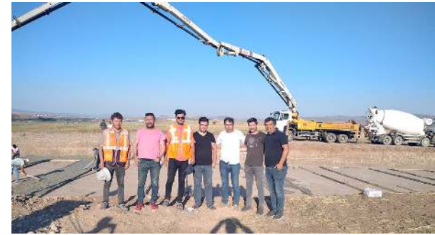
Sungurlu OSB'de inşa edilecek fabrikalar ile ilgili çalışmalar başladı.