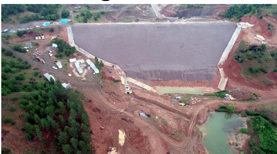
Geykoca Göleti'nde çalışmalar aralıksız devam ediyor.