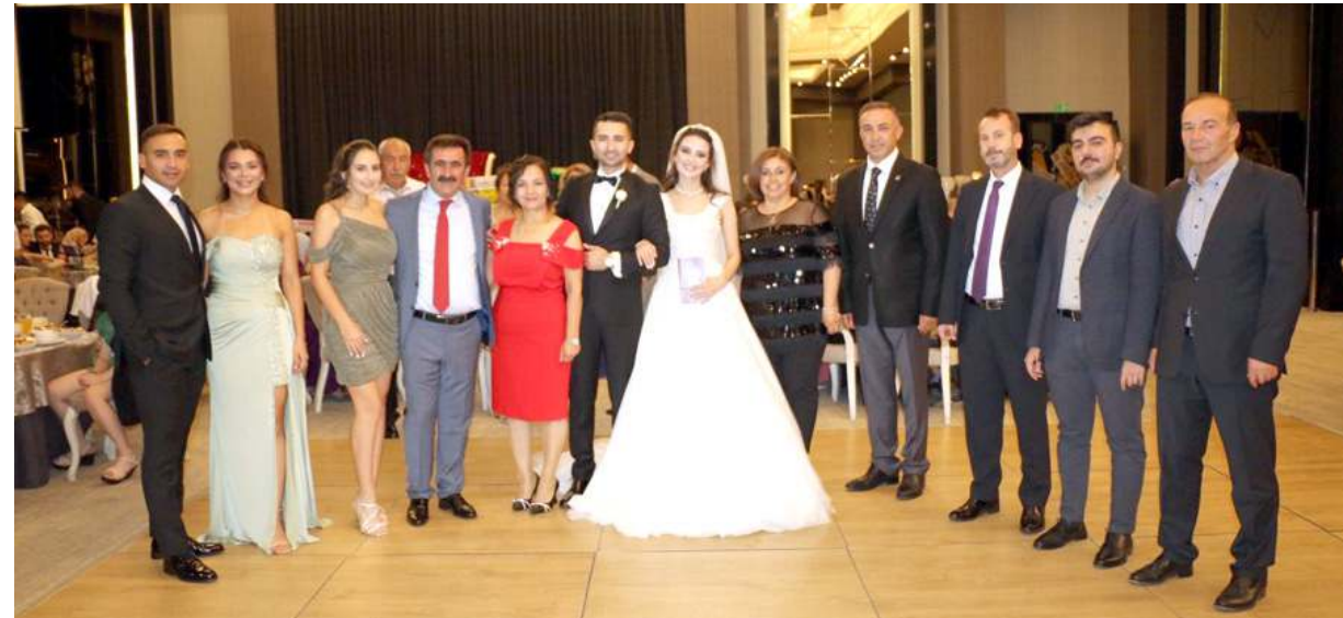
Genç çiftin düğününe çok sayıda davetli katıldı.