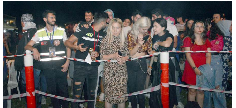
Konsere ilgi yüksek oldu.