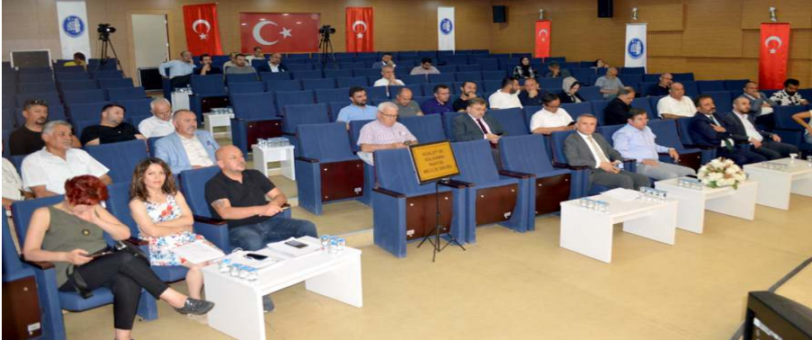
Meclis toplantısında gündem maddeleri görüşülerek karara bağlandı.