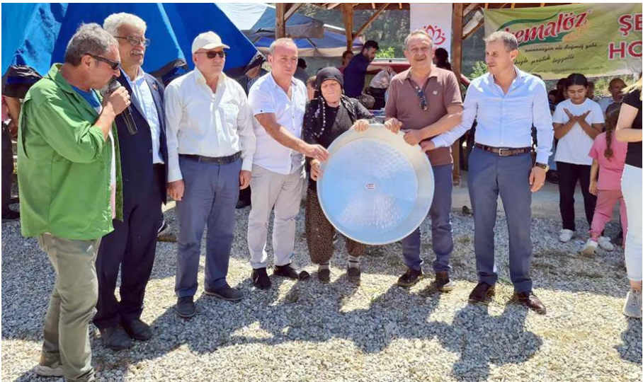
Yarışmada dereceye giren üreticilere bakır kazan hediye edildi.