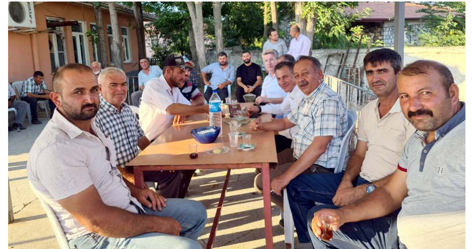
Toplantıda proje hakkında istişarelerde bulunuldu.