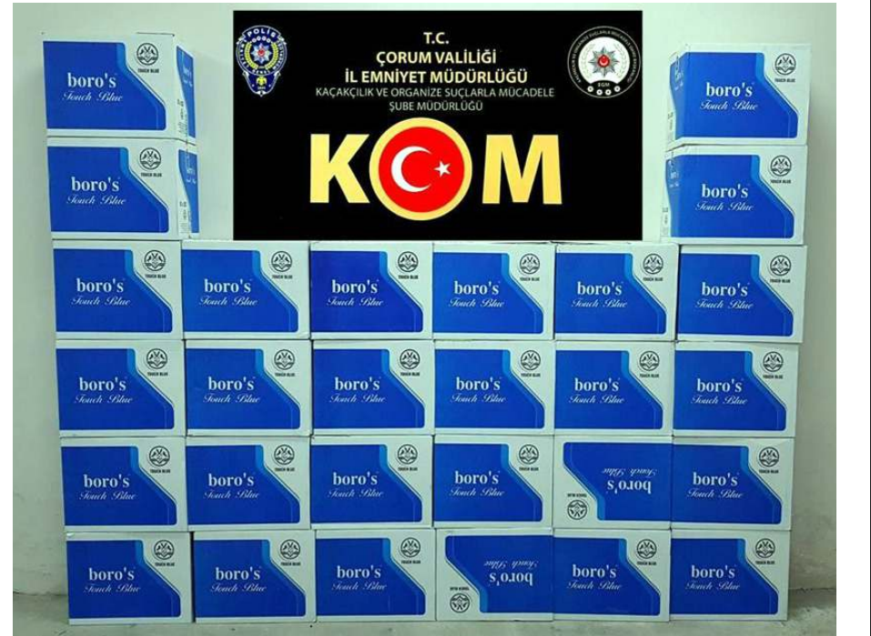
Operasyonda 280 bin adet kaçak makaron ele geçirildi.

İl Emniyet Müdürlüğü Kaçakçılık ve Organize Suçlarla Mücadele Şube Müdürlüğü ekipleri, kaçakçılara yönelik üç ayrı operasyon düzenledi. Operasyonlarda şahısların araç ve iş yerlerinde yapılan aramalarda 280 bin adet kaçak makaron, 40 şişe gümrük kaçağı içki, 292 adet içerisinde kullanılan yasaklanmış etkin maddeler bulunan cinsel içerikli ürün, 1 adet ruhsatsız pompalı av tüfeği ve 19 adet fişek, 2 adet 9x19 mm'lik ruhsatsız tabanca ile 2 adet şarjör ve 1 adet fişek ele geçirildi. Gözaltına alınan 6 ki-