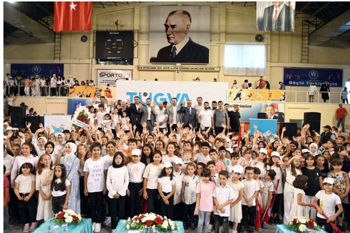
Program sonunda öğrenciler ile protokol üyeleri hatıra fotoğrafı çekindiler.