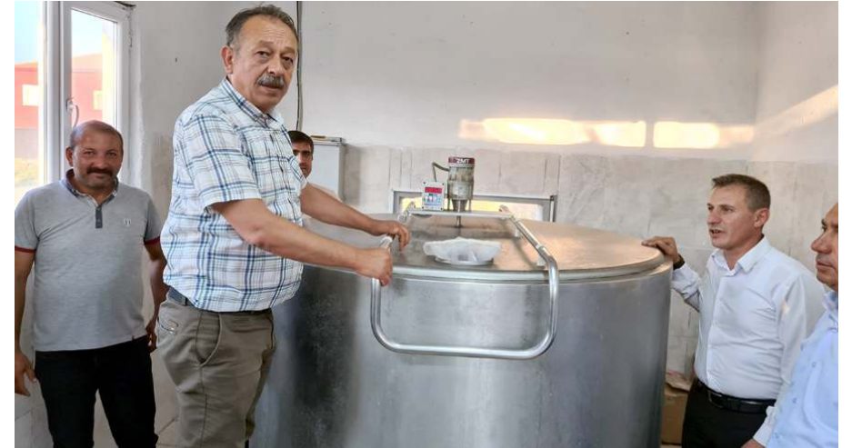
Köylere 650 litrelik süt soğutma tanklarının konulması hedefleniyor.

fusu yerinde tutar üretime katkı sunarız. Bu tankların alınarak Sungurlu'daki köylere soğuk zincir oluşturulmasında emeği olan Valimiz Mustafa Çiftçi'ye milletvekillerimize ve Tarım ve Orman İl Müdürlüğüne teşekkür ederiz. AK Parti Çorum Milletvekili ve Tarım ve Orman Komisyonu üyesi Milletvekilimiz Ahmet Sami Ceylan'a bizleri en güçlü biçimde destekledikleri için çok teşekkür ederiz" ifadelerini kullandı. (Haber Merkezi)