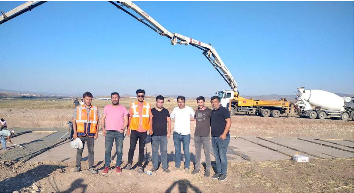
Sungurlu OSB'de inşa edilecek fabrikalar ile ilgili çalışmalar başladı.