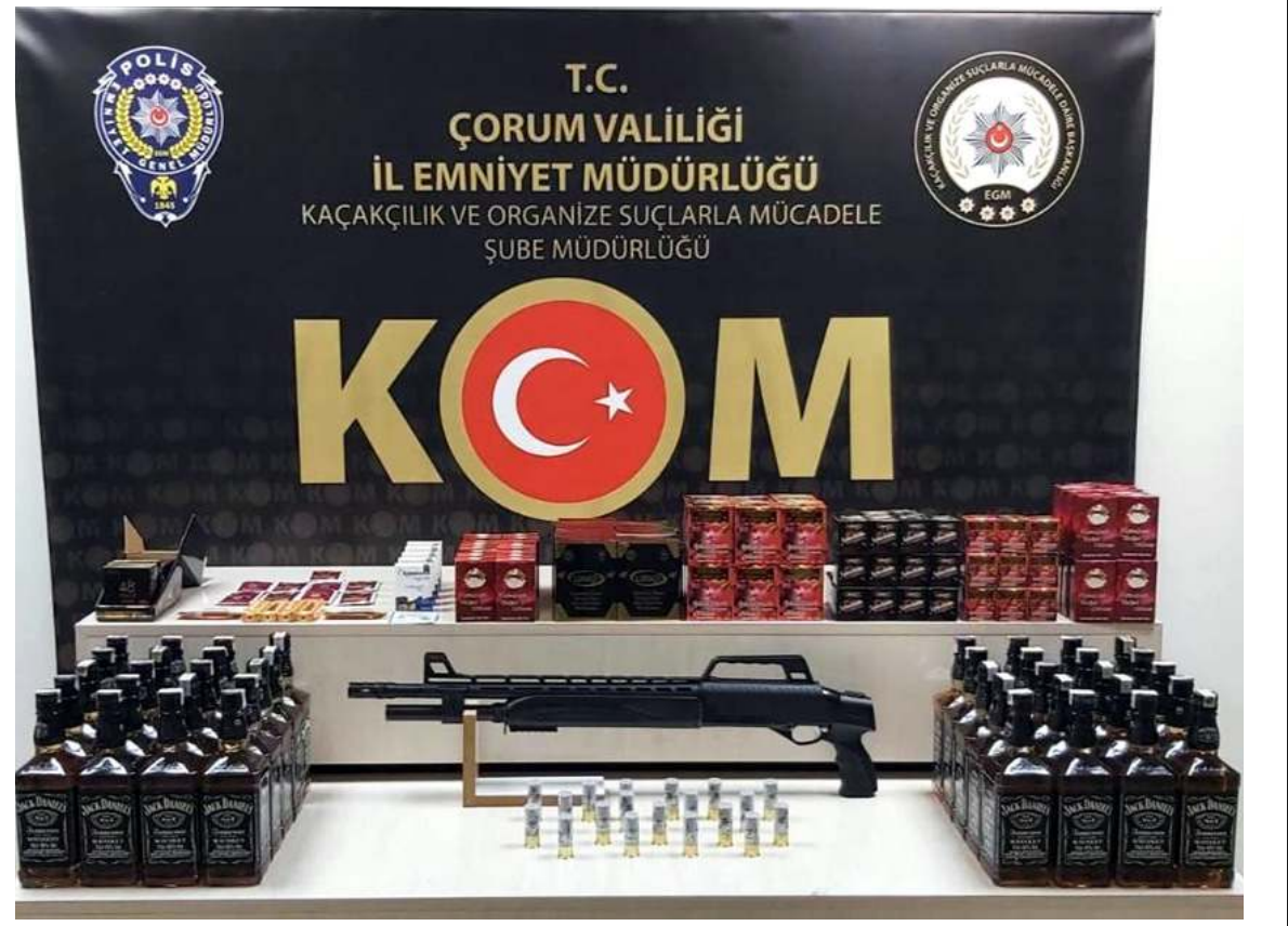
Operasyonda kaçak içki ve ruhsatsız silahlar ele geçirildi.

Polis olayla ilgili inceleme başlattı. (İHA)