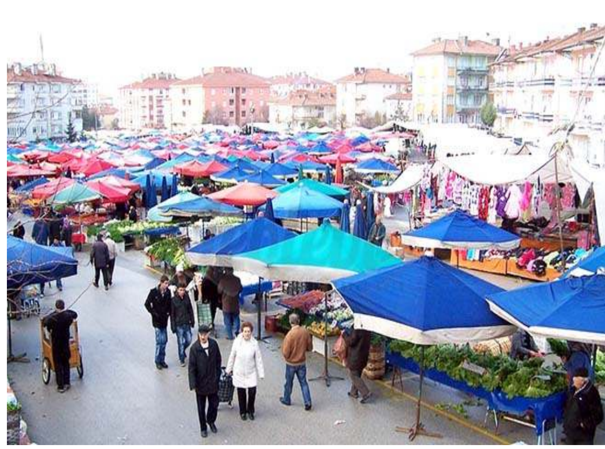
Çevre Yolunda yaşanan sorunların çözümü noktasında ilk atılacak adımın Pazartesi Pazarı'nın başka yere taşınması olduğu belirtildi.

Çevre Yolu ile ilgili farklı çözüm önerileri gündeme taşınıyor