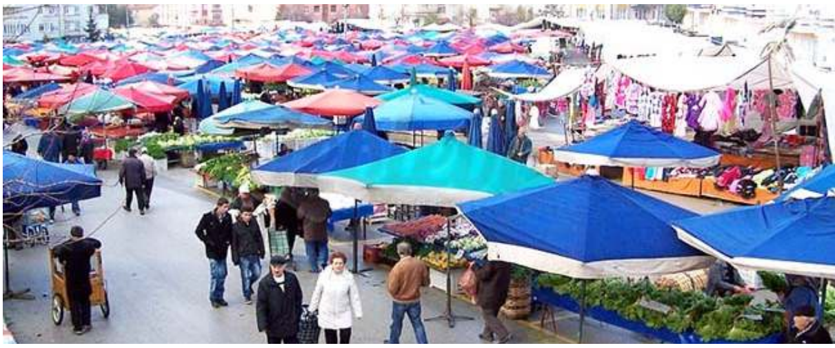
Çevre Yolunda yaşanan sorunların çözümü noktasında ilk atılacak adımın Pazartesi Pazarı'nın başka yere taşınması olduğu belirtildi.

DSİ Genel Müdürü Akca'dan Geykoca Göleti açıklaması