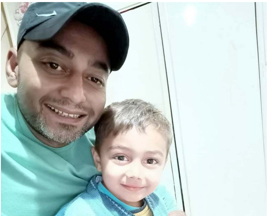
Ağır yaralanan minik İ.N. kaldırıldığı hastanede hayatını kaybetti.

Sungurlu'da manevra yapan minibüsün altında kalan 2 yaşındaki çocuk hayatını kaybetti.