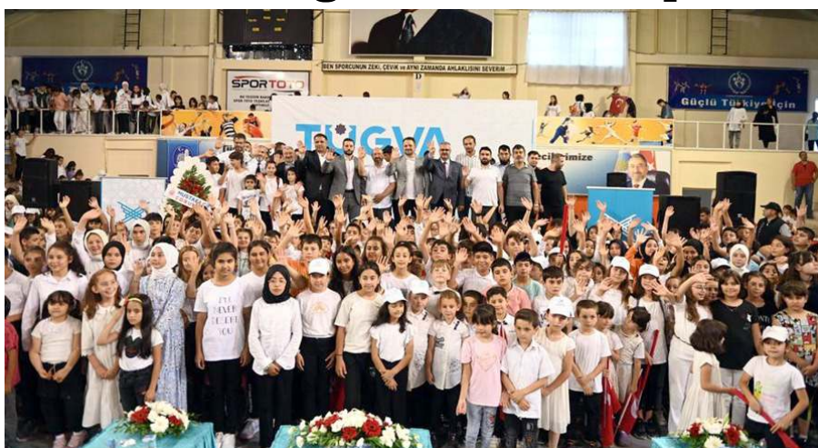
Program sonunda öğrenciler ile protokol üyeleri hatıra fotoğrafı çekindiler.

Türkiye Gençlik Vakfı (TÜGVA) Çorum İl Temsilciliğinin 20 Haziran'da başayalan yaz okul Atatürk Spor Salonunda yapılan görkemli bir kapanış töreni ile sona erdi. Törene 2500 öğrenci katıldı.