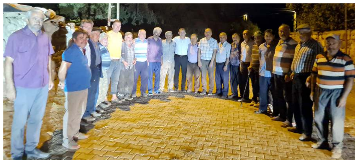
Projeye sütün sanayicinin istediği kalitede ve sağlıklı bir biçimde toplanıp pazarlanmasının sağlanması hedefleniyor.