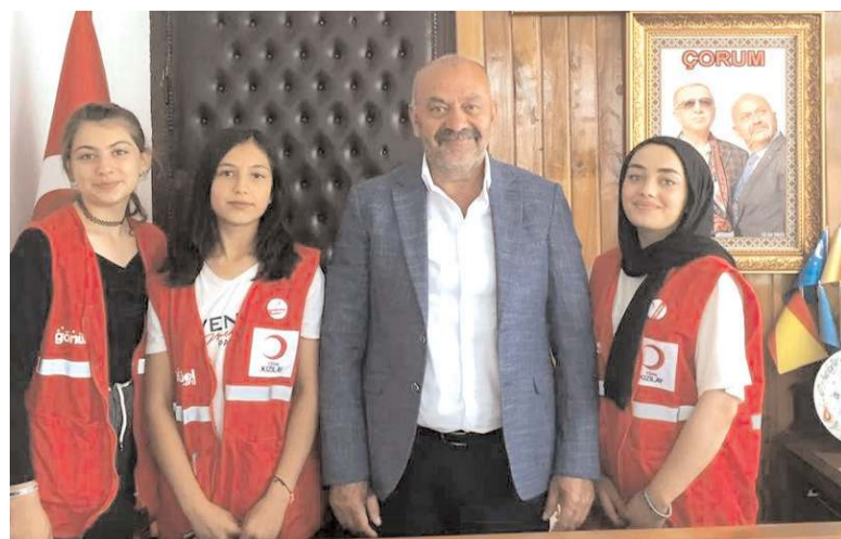
Gençler ziyarette faaliyetleri hakkında bilgiler verdiler.

"Gönüllü gençlerimizin göstermiş olduğu çalışma ve gayretlerden dolayı kendilerine teşekkür ediyorum, gençlerimizin yapmış olduğu her çalışmada yanlarında ve destek olmaya daima hazır olduğumuzu bilmelerini istiyorum" dedi. (Haber Merkezi)