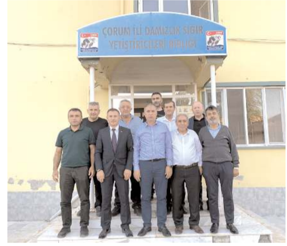
Ziyaretin ardından hatıra fotoğrafı çekildi.