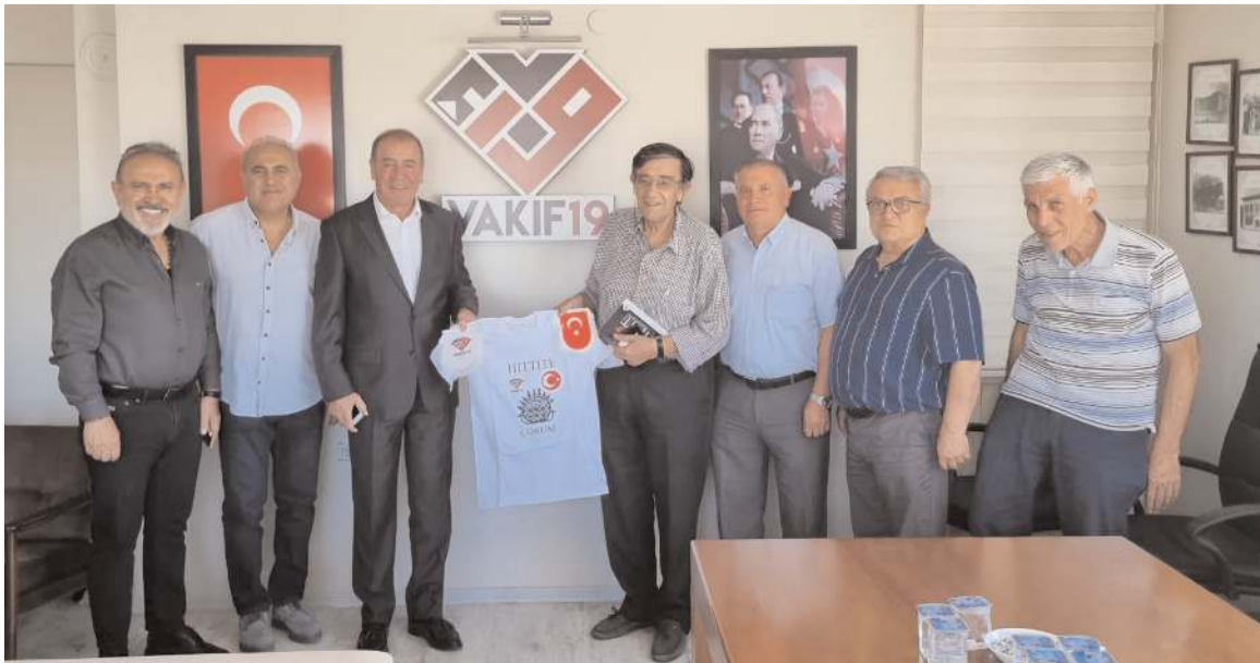
Toplantıda konuklara forma hediye edildi.