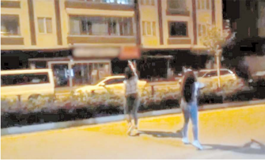
2 kız olaylarda kullandıkları silahlarla yakalanarak gözaltına alındı.