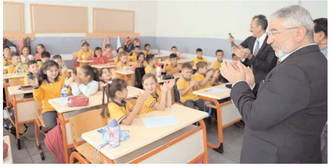
Çorum Belediyesi il merkezinde ilkokula başlayan toplam 4 bin 721 öğrenciye kırtasiye malzemesi ile okul çantası hediye etti.