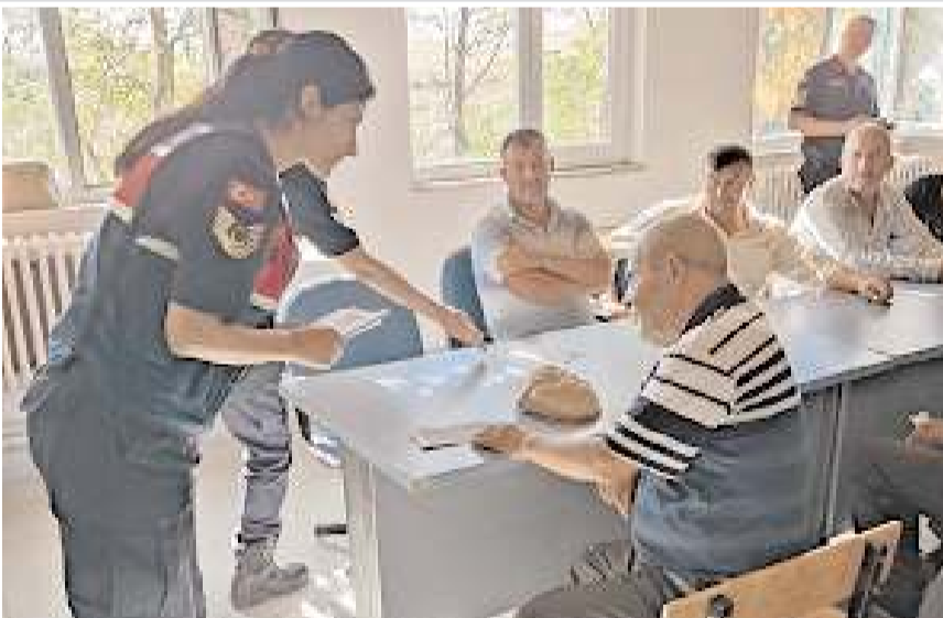
Jandarma Komutanlığı ekipleri köylerde kadına yönelik şiddete karşı bilgilendirme faaliyetlerine devam ediyor.

"Kadına Şiddet İnsanlık Suçudur" isimli afiş asılarak şiddet veya şiddet tehdidinin önlenmesi amacıyla Jandarma'nın 7/24 görevde olduğu vatandaşlara hatırlatıldı. (Haber Merkezi)