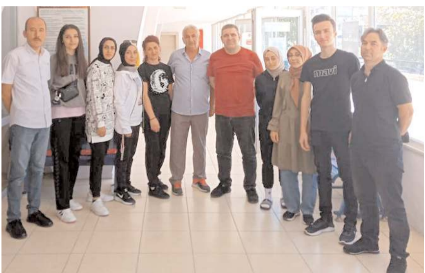
Erbaa'daki turnuvada görev yapacak ilimiz hakemleri toplu halde görüntüyor