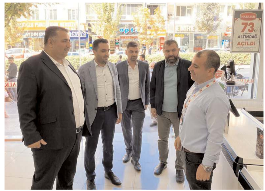
Milletvekili Kaya, esnaflara hayırlı bol kazançlar diledi.