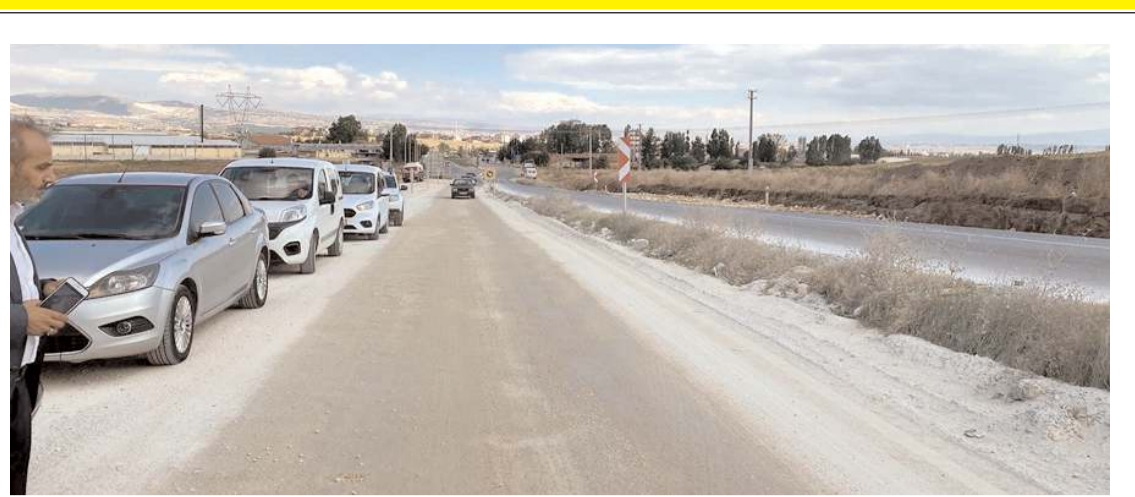
Çorum-Osmancık karayolu Bayat Gedigi bölgesinde devam eden yol çalışmalarının yavaş ilerlemesine vatandaşlar tepki gösteriyor.