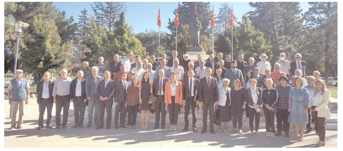
CHP'nin kuruluşunun 99. yıl dönümü nedeniyle Atatürk Anıtı'nda program yapıldı.