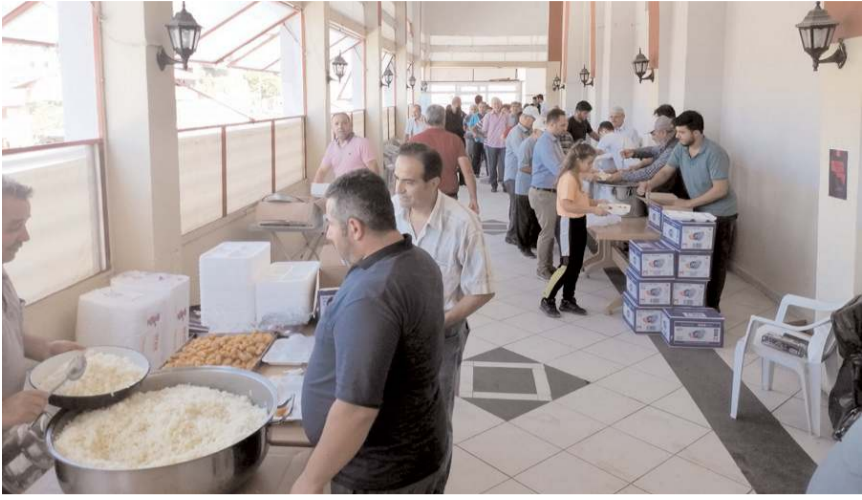
Programı Adayalı Mevkii Tarımsal Kalkınma Kooperatifi düzenledi.