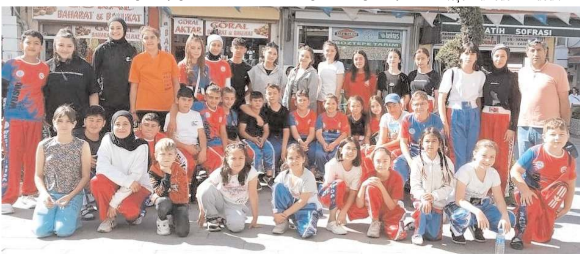
Çorum Wushu takımı Erbaa'da yapılacak turnuvada mücadele etmek için hazırlıklarını tamamladı