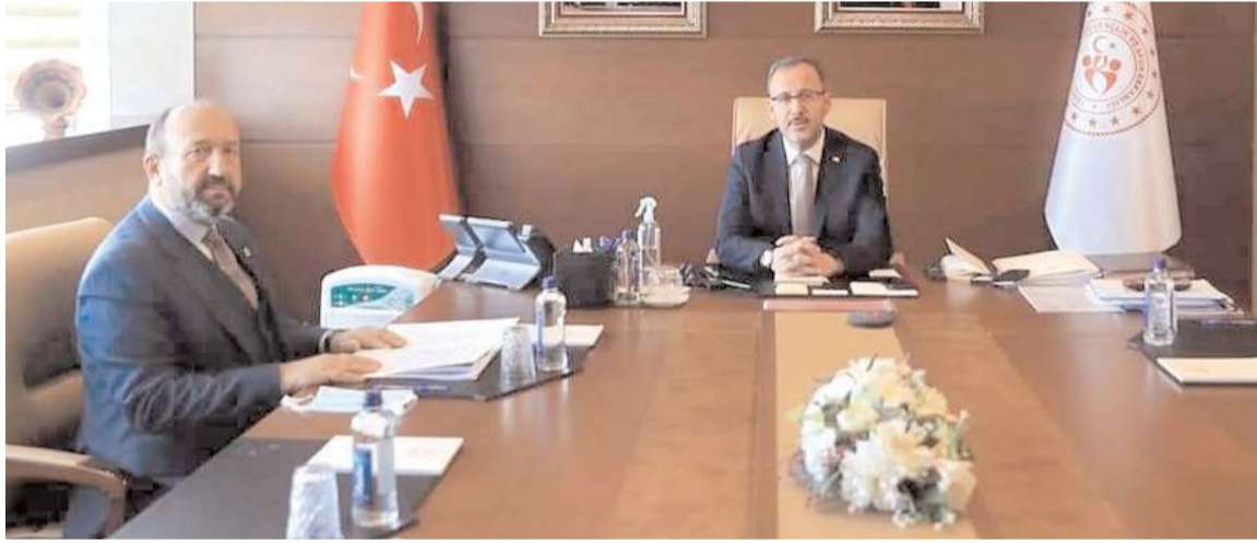
AK Parti Çorum Milletvekili Erol Kavuncu, Gençlik ve Spor Bakanı Dr. Mehmet Kasapoğlu'na gençlere yönelik yatırımlardan dolayı teşekkür etti.