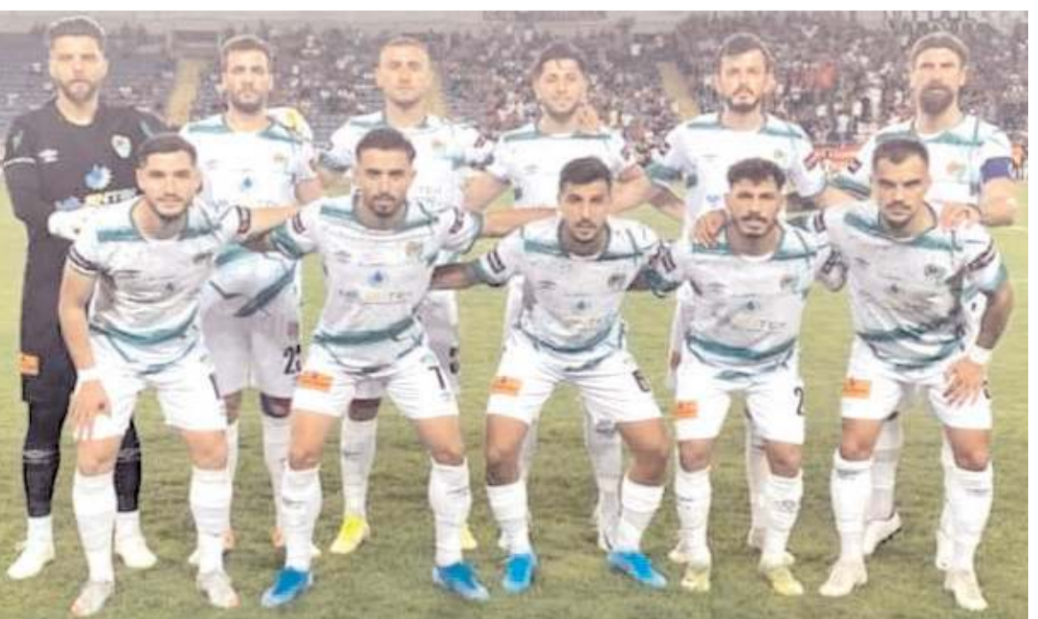
Amasyaspor FK takımı yarın sahasındaki ilk maçını Çorum'da Belediye Kütahyaspor ile yapacak

ilk maçında evinde Yomraspor ile 2-2 berabere kaldı. Yeni Amasyaspor karşısında kazanarak ilk üç puan sevincini yaşamayı hedefliyor. Amasyaspor FK geçen sezon kazandığı şampiyonluk kupasını yarın maç öncesinde alacak. Geçen sezon 3. lige yükselen Yeni Amasyaspor takımı evindeki ilk maçta Çorum'da oynayacağı Belediye Kütahyaspor maçı öncesinde şampiyonluk kupasını Futbol Federasyonu Yönetim Kurulu üyesi ve Konfederasyon Başkanı Ali Düşmez'in elinden alacak. Amasyaspor FK ile Belediye Kütahyaspor takımları arasında oynanacak maçı Gaziantep bölgesi hakemi Erdem Demirtaş yönetecek. Maçın yardımcı hakemleri de aynı ilden Yusuf Şimşek ve Kilis'den Mehmet Ali Çetin, Maçın dördüncü hakemi ise Gaziantep'ten Mehmet İhsan Derme-