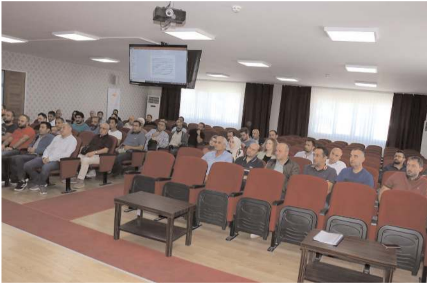
Zirai İlaç Bayileri toplantıda sorunlarını dile getirdi.