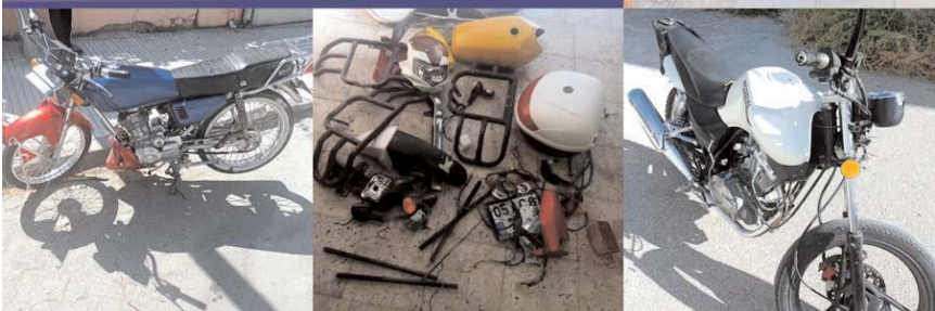
Çalınan motosikletlerin bir kısmı ele geçirilirken bir kısmının ise satıldığı belirlendi.