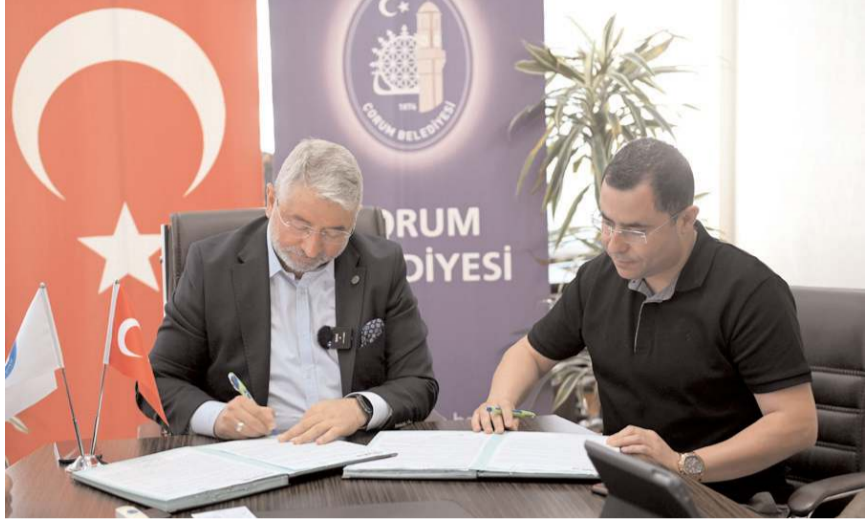
Çorum Belediyesi'nde banka promosyonu sözleşmesi Yapı Kredi Bankası Bahabey Şubesi ile imzalandı.