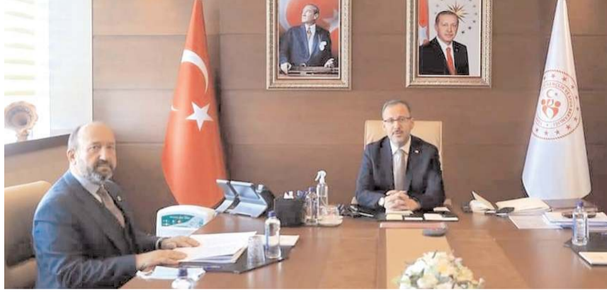
AK Parti Çorum Milletvekili Erol Kavuncu, Gençlik ve Spor Bakanı Dr. Mehmet Kasapoğlu'na yatırımlar için teşekkür etti.

Bu süreçte ülkemizin bir baştan bir başa gençlik yatırımlarıyla donatıldığını hatırlatan Kavuncu, “Gençlik merkezi sayımız 9’dan 412’ye çıktı. Spor tesisi sayımız Bin 575’den 4 bin 133’e yükseltildi. Yükseköğrenim yurt yatak kapasitemiz AK Parti öncesi 182 binden, AK Parti döneminde 800 yurttan 825 bin kapasiteye ulaşılmıştır. Bu rakam dünyada 36 ülkenin toplam nüfusundan daha fazladır. Yükseköğrenim burs ve kredi tutarını lisans öğrencileri için aylık 45 liradan 850 liraya, yüksek lisans öğrencileri için aylık 90 liradan Bin 700 liraya, doktora öğrencileri için aylık 135 liradan 2 bin 550 liraya yükseltmiştir. Onlara daha iyi imkan-