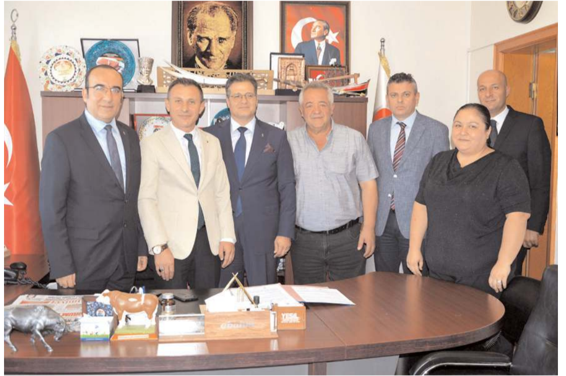
İmzaların atılmasının ardından hatıra fotoğrafı çekildi.

desteklemeyi öncelikli bir görev olarak görüyoruz. Müthiş bir tarım potansiyeline sahip güzel Çorum'da İş Bankası olarak hem şubelerimiz hem tarım bankacılığı özel hizmet birimlerimizle eskisinden çok daha fazla aktif olacağımızı ve Çorum'lu üreticimizin her türlü finansman ihtiyacında yanında olacağımızı müjdelemekten gurur duyuyoruz. Bu itibarla Çorum Damızlık Sığır Yetiştiricileri Birliği ile bu protokolü imzalamaktan çok memnunuz. İş Bankası olarak hem kredi hem kart tarafında piyasa koşullarına göre oldukça avantajlı koşullarla hizmetler sunuyoruz. Hasattan hasada ödemeli kredilerimiz ile traktörden seracılıktan tarladaki en basit ihtiyaçlara kadar üreticimizin her ihtiyacını karşılıyoruz. İmece kartımız ise akaryakıtta tohuma gübreye her alanda faizsiz dönem avantajı sunuyor. Birliğe üye çiftçilerimizin imece kart ürünü ile birlikten yapacakları tarımsal girdi alımlarını faiz dönem avantajı ile alacaklarını, yine birlik üyelerinin ürün ve hayvanları için yaptıracağı Tarsim Sigortası primlerini imece kartlarından tahsil edilmesi koşuluyla yaptırılmaları durumunda prim tutarında % 5 indirim sağlayacağı ve birlik üyelerinin kredi ihtiyaçlarının indirimli faiz oranı ile karşılanacağı hususları protokolle imza edilmiştir. İş Bankası olarak tarımın değerinin farkındayız ve Türkiye'nin Bankası olarak bu alanda üreticimize desteğimiz tüm gücüyle devam edecektir." ifadelerini kullandı.