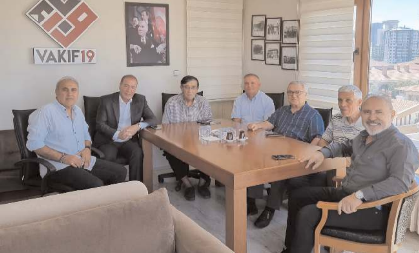
Vakıf19'da yapılan toplantıya, ABB Kültür Varlıkları Daire Başkanı Bekir Ödemiş ve eski Bakan Bülent Yahnici katıldı.