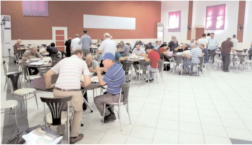
Yemeğe 2 bin davetli katıldı.