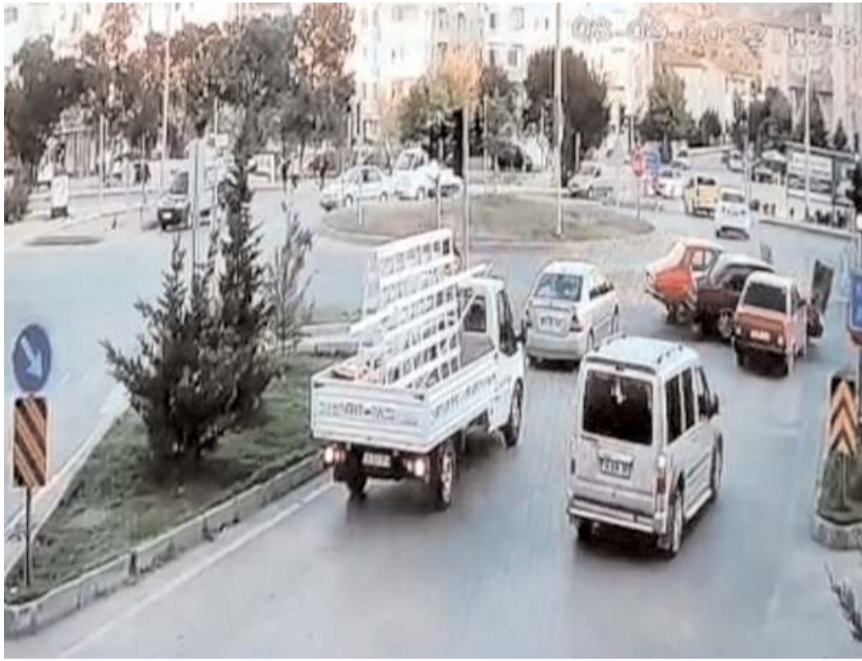
Kaza Budakozü kavşağında meydana geldi.

Edinilen bilgiye göre, Budakozü kavşağında, Kırıkkale'den Sungurlu istikametine seyir halinde olan otomobil, kavşaktan dönmeye çalışan bir başka otomobile çarptı. Arkadan gelen bir başka araç da kaza yapan araçlara çarptı. Kazada 2 kişi yaralanırken, 3 araçta maddi hasar meydana geldi. Yaralılar ambulansla Sungurlu Devlet Hastanesine kaldırılarak tedavi altına alındı. Kaza anı bir işyeri kamerası tarafından saniye saniye kaydedildi. (İHA)