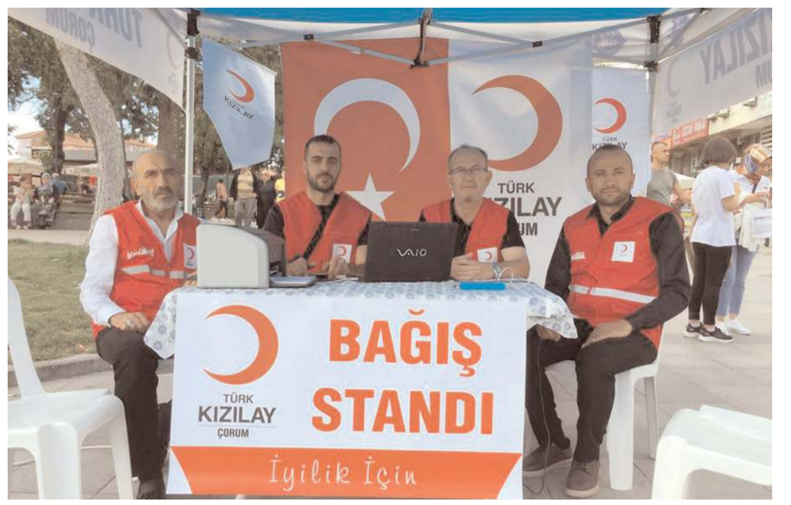
Kızılay Çorum Şubesi, Pakistan'a yardım için PTT önünde stant açtı.