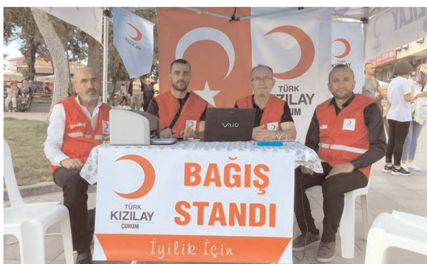
Kızılay Çorum Şubesi, Pakistan'a yardım için PTT önünde stant açtı.