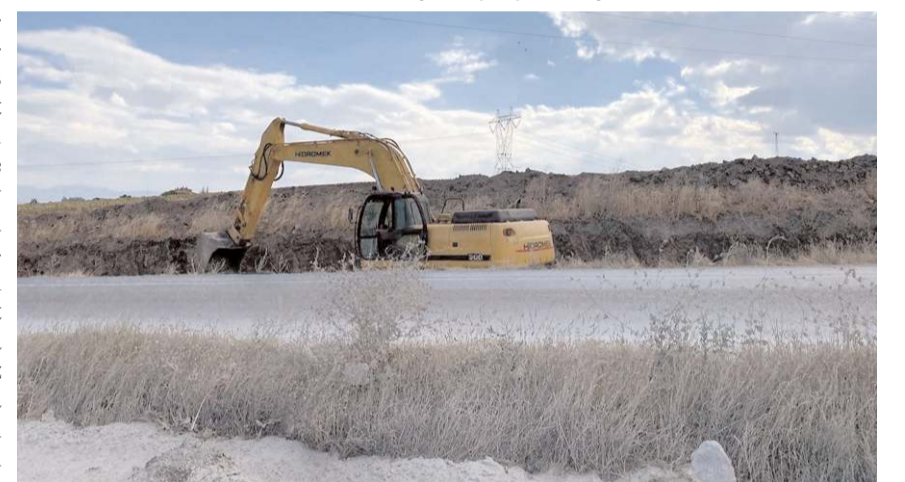
Yolda çalışmaların yetersiz olması, trafiği olumsuz etkiliyor.