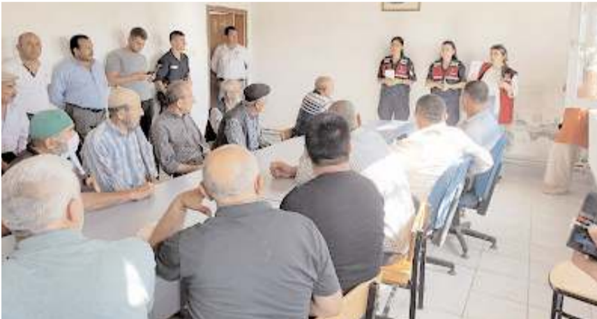
Jandarma'nın bu seferki durağı İskilip'e bağlı Aşağıörenskeki ve Çukurköy köyleri oldu.