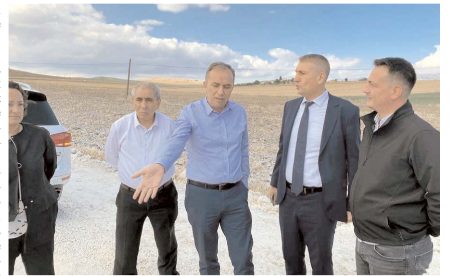
Milletvekili Ahmet Sami Ceylan, çalışmalarını yerinde inceledi.

Çorum-Amasya Karayolu'nda çalışmaların devam ettiğini anlatan Milletvekili Ceylan, özellikle ağırlık verilen Mecitözü-Çorum arasında çalış-