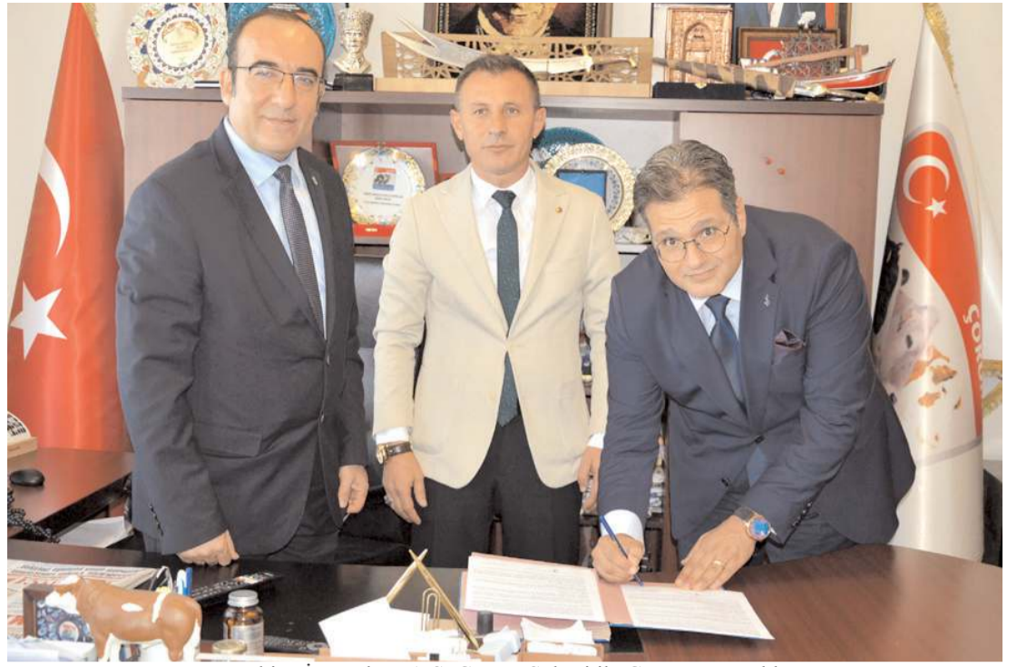
Türkiye İş Bankası A.Ş. Çorum Şubesi ile Çorum Damızlık Sığır Yetiştiricileri Birliği arasında protokol imzalandı.