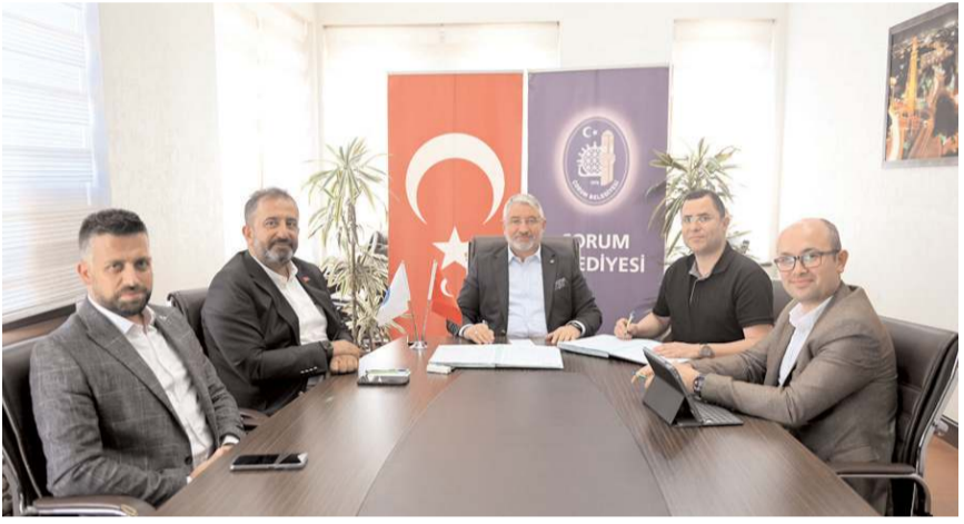
Banka Belediye'ye 28 milyon TL promosyon ödemesi yapacak.