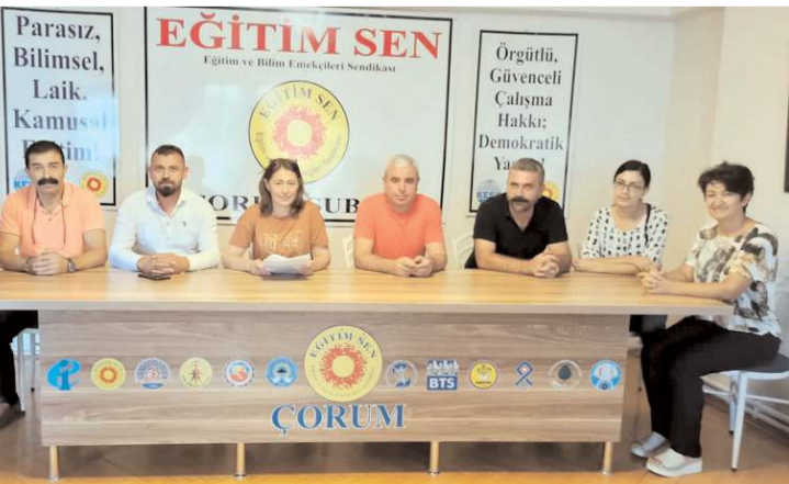
Basın açıklamasını Eğitim Sen Çorum Şube Yürütme Kurulu yaptı.

Tüm eğitim ve bilim emekçileri için, hiçbir ayırım yapılmadan yoksulluk sınırının üzerinde insanca yaşanabilir bir ücret düzenlemesi ve özlük haklarının iyileştirilmesi çalışmasının ivedi biçimde yapılması gerektiğinin belirtildiği açıklamada, "Eğitim emekçilerinin bu kanun ve yönetmelik kapsamında gerçekleştirilecek sınava da, kariyer basamaklarına da karşıyız. Bu kanunun bir an önce iptal edilmesini, öğretmen emeğini değersizleştiren bu sürecin bir an önce durdurulmasını talep ediyoruz. Ekonomik, sosyal, mesleki, özlük haklarımızla il-