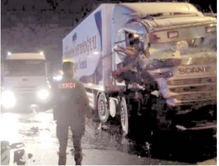
Kaza Buharaevler Kavşağı'nda meydana geldi.

Çorum'da su tankeri ile tırın çarpışması sonucu 1 kişi yaralandı.