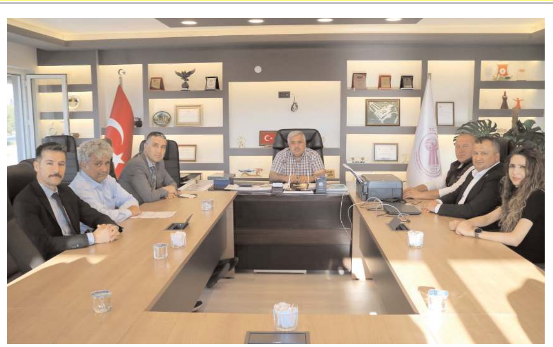
OKA heyeti 'Sıcak Daldırma Galvaniz Kaplama Tesisi Projesi'nin ön fizibilite çalışmaları kapsamında ÇESOB'ta karşılıklı fikir alışverişinde bulundu.