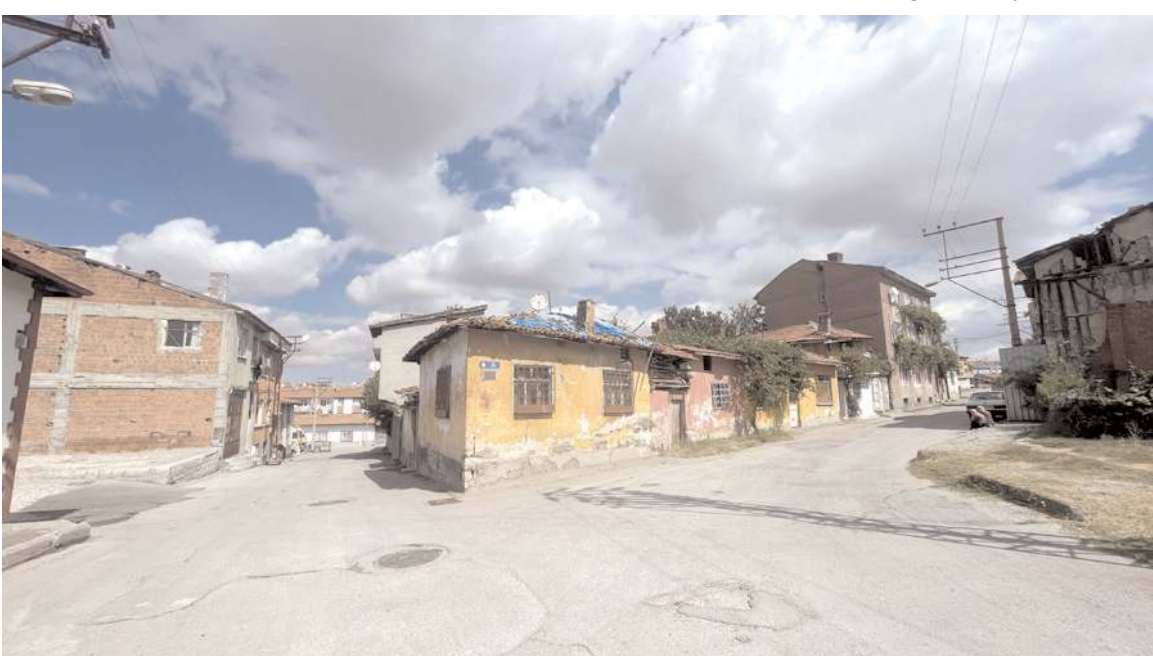
Bölgede ömrünü tamamlayan ev ve iş yerleri, yıkılma tehlikesi nedeniyle mahalle sakinleri için risk oluşturuyor.

Aşgın, kalenin restorasyonu ile çevresindeki kentsel dönüşümün, 1100 yıllık Çorum Kalesi ile yaklaşık 900 yıllık Ulu Cami arasında oluşturmayı hedefledikleri kültür yolunun önemli ayağı olduğunu sözlerine ekledi.(AA)