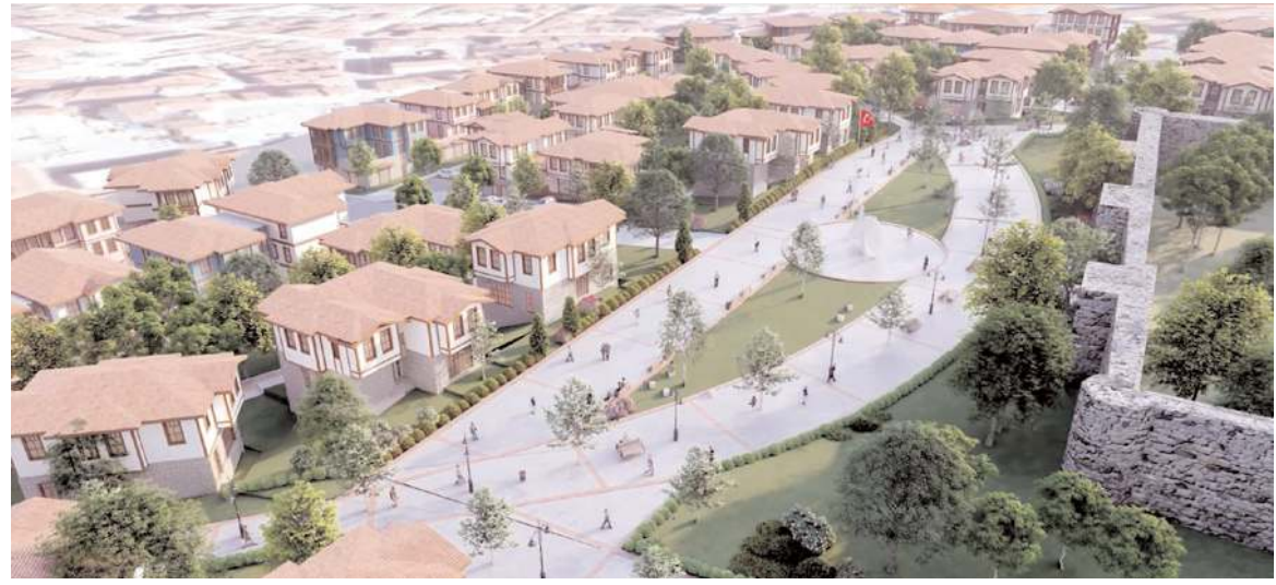
Kale etrafındaki 95 dekarlık alanda başlatılan kentsel dönüşüm projesi ile bölgenin tarihi ve kültürel dokusuna uygun alanlar inşa edilecek.