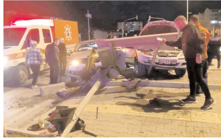
Kaza, Sungurlu-Çorum kara yolu Taş Köprü Kavşağı'nda meydana geldi.

Kaza anı, çevredeki bir iş yerinin güvenlik kamerasına yansıtıldı.