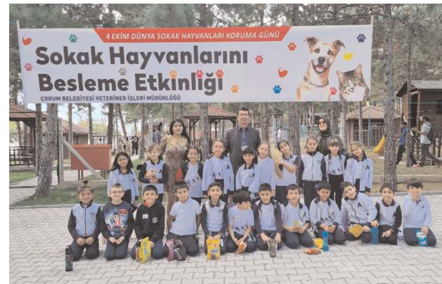
Öğrenciler hatıra fotoğrafı çekindiler.