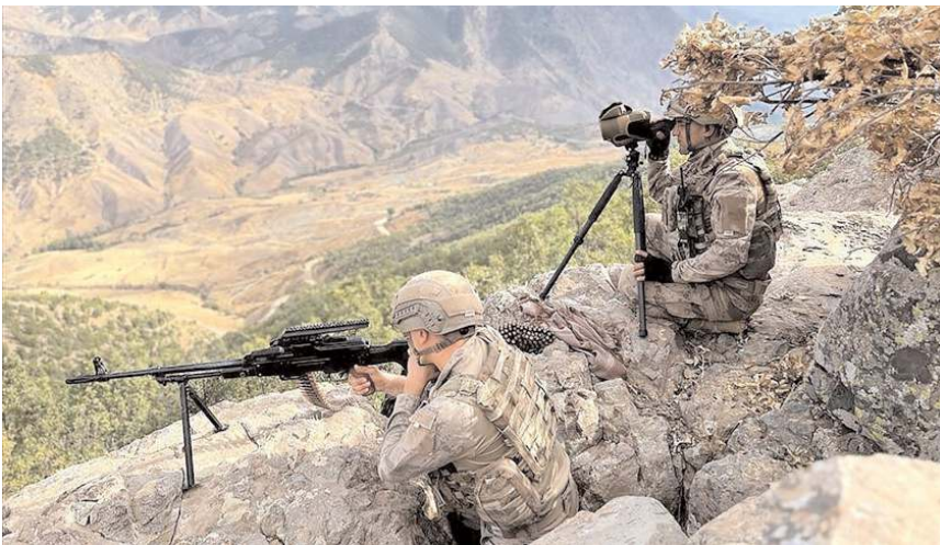
Operasyona toplam 650 personel katıldı.