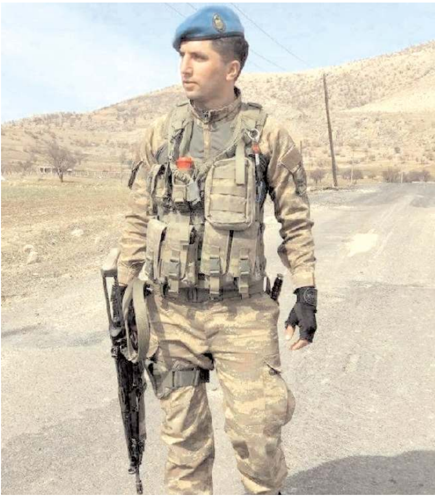
Operasyon Lice-Bayırılı-Koçmarin ve Sağlık Mahallesi kırsalında yapıldı.