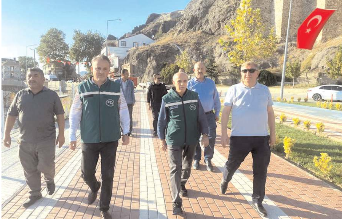
Akca, son 20 yılda inşa ettikleri su yapılarıyla taşkın riskini azaltmak için çok önemli yatırımlar yaptıklarını söyledi.