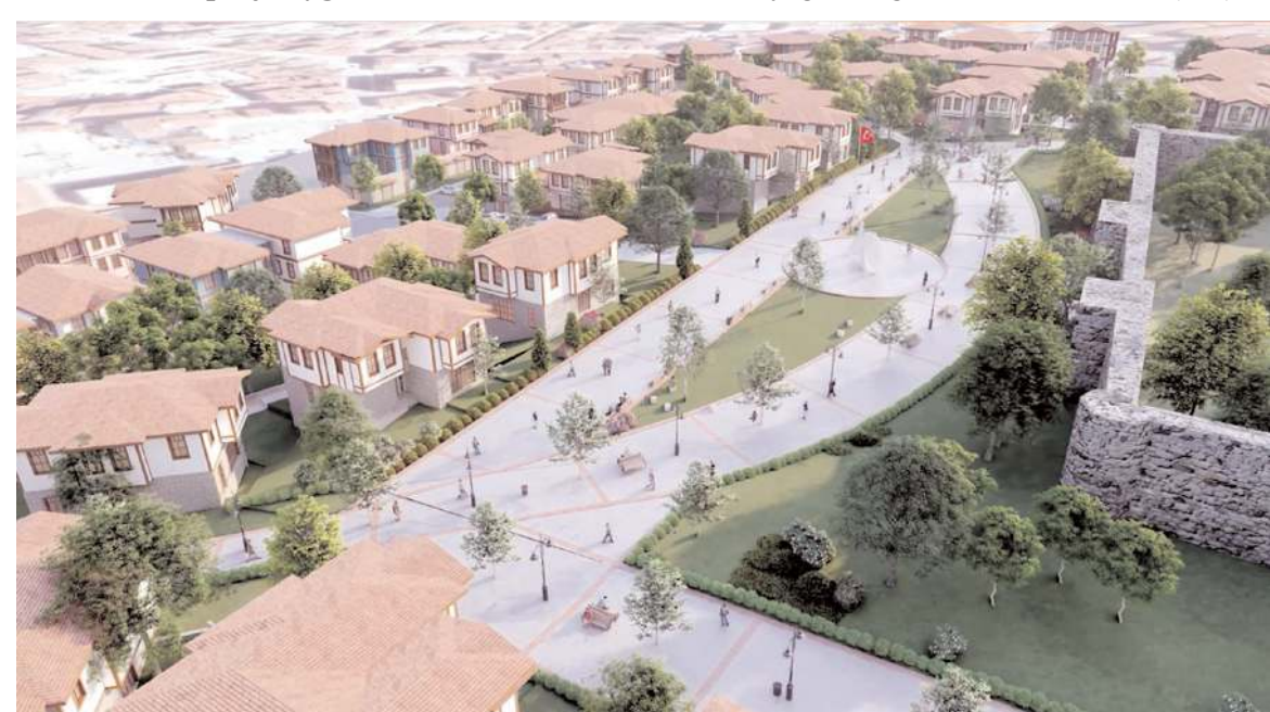
Belediye, bölgenin modern altyapı imkanlarıyla yeniden inşa edilmesi için çalışma başlattı.