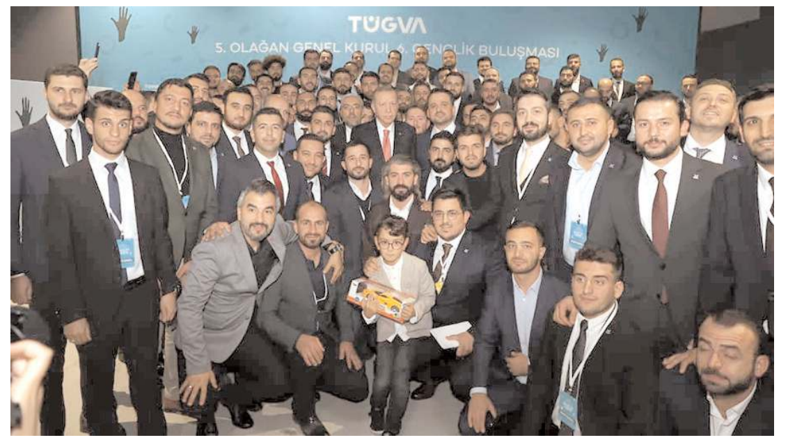
TÜGVA Genel Kurulu Cumhurbaşkanı Recep Tayyip Erdoğan'ın da katılımıyla hafta sonu yapıldı.