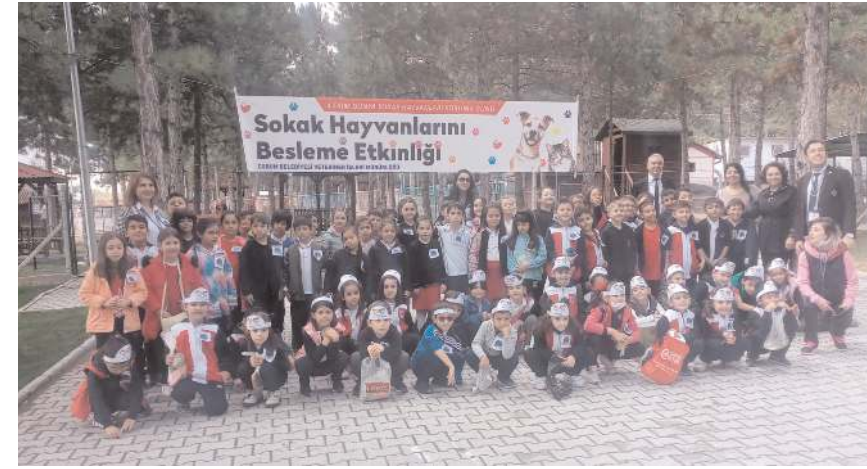
Çok sayıda öğrenci evcil hayvan parkını gezdi.

Ziyarete gelen öğrencilere belediye tarafından pamuk şeker, çikolata, meyve suyu ve limonata ikramında bulunuldu. (Haber Merkezi)