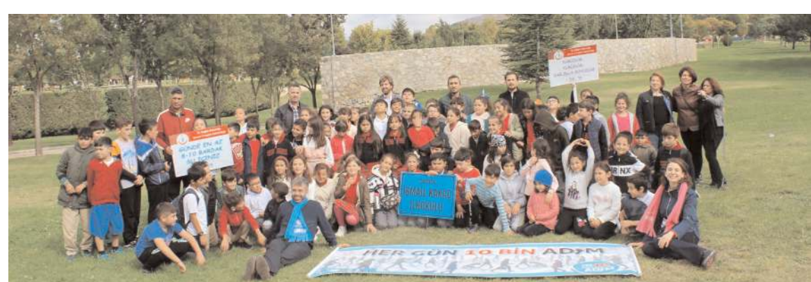
İtfaiye Parkı'nda gerçekleştirilen programda çeşitli yarışmalar yapıldı.

Oda üyesi esnaflar da, bu tür bilgilendirme toplantılarının sık sık yapılmasını istediklerini belirttiler. (Haber Merkezi)