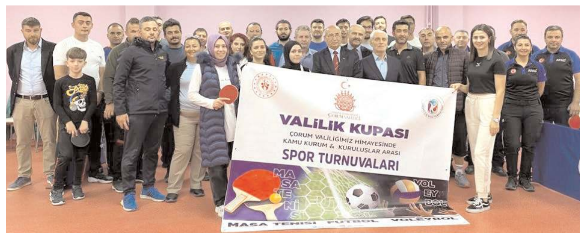
Valilik Kupası Masa Tenisi Turnuvasında dereceye giren ve hakemler ödül töreni öncesinde toplu halde görüntü