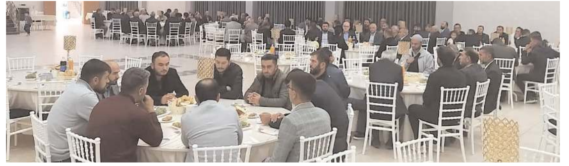
Yemek Ata Park Düğün Salonu'nda gerçekleştirildi.

"Ankara'da 1000, İzmir'de 700, Bursa, Konya, Adana, Malatya, Gaziantep ve Şanlıurfa'da 500, Diyarbakır ve Kocaeli'nde 450, Eskişehir, Kayseri ve Manisa'da 350, Mersin, Denizli ve Balıkesir'de 300, Van, Erzurum, Trabzon, Tekirdağ'da 250, Afyonkarahisar, Aksaray, Isparta, Çorum, Ordu, Sivas'ta 200, Şırnak'ta 150 ve Kastamonu'da 100."