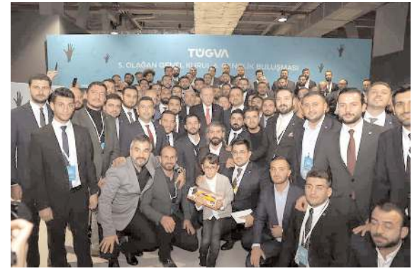
TÜGVA Genel Kurulu Cumhurbaşkanı Recep Tayyip Erdoğan'ın katılımıyla hafta sonu yapıldı.