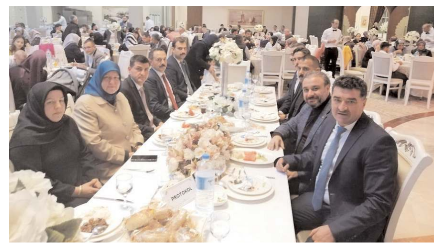
Düğüne çok sayıda davetli katıldı.