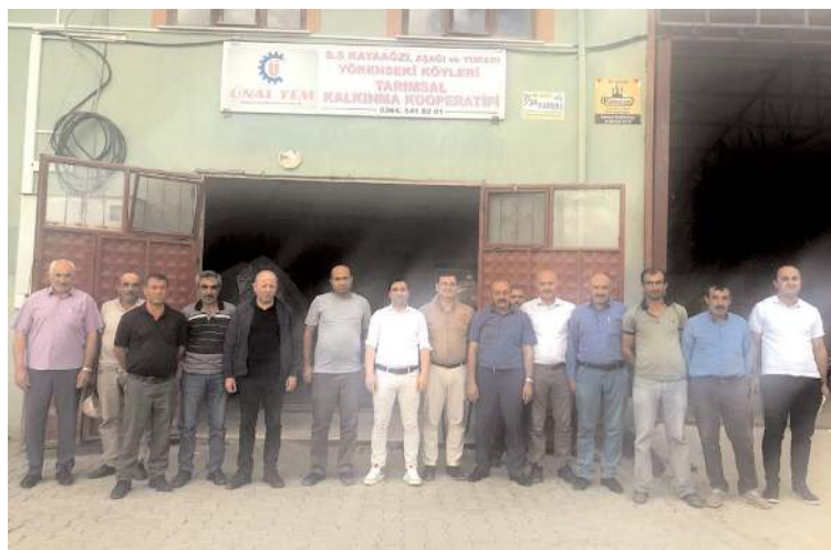
İskilip Kaymakamı Yunus Emre Vural, Kayaagzı Aşağı ve Yukarı Örenseki Köyleri Tarımsal Kalkınma Kooperatifini ziyaret etti.

Geçtiğimiz aylarda İskilip Kaymakamlığına atanan Yunus Emre Vural, köy ziyaretlerini sürdürüyor. Kaymakam Vural, Kayaagzı Köyü ziyaretinde hem köylülerle tanışma imkânı buldu hem de köy kooperatifinin yaptığı çalışmaları inceledi.