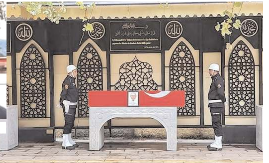
Merhumun cenazesi namazın ardından Ulu Mezarlık'ta toprağa verildi.

8 yıldır Amasya'da görev yaptığı öğrenilen ve bu yıl Şubat ayında emekliye ayrılan Köşger, 49 ya-