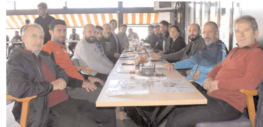
Amatör kulüp temsilcileri ve taban birlik temsilcileri kahvaltıda bir araya geldiler