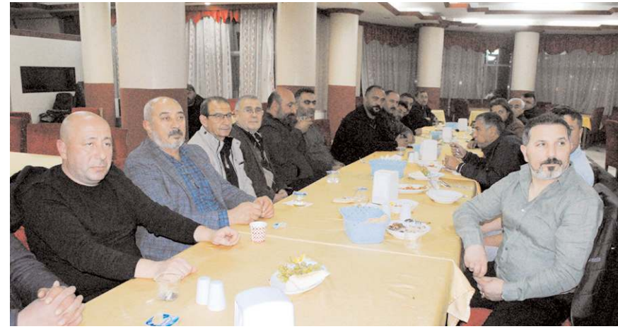
Toplantıda kasap esnafı mesleklerini ilgilendiren çeşitli yasa ve kanunlar hakkında bilgilendirildi.

Oda üyesi esnaflar da, bu tür bilgilendirme toplantılarının sık sık yapılmasını istediklerini belirttiler. (Haber Merkezi)