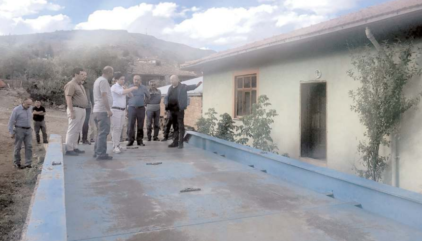
Kaymakam Yunus Emre Vural, kooperatifin çalışmalarını yerinde inceledi.