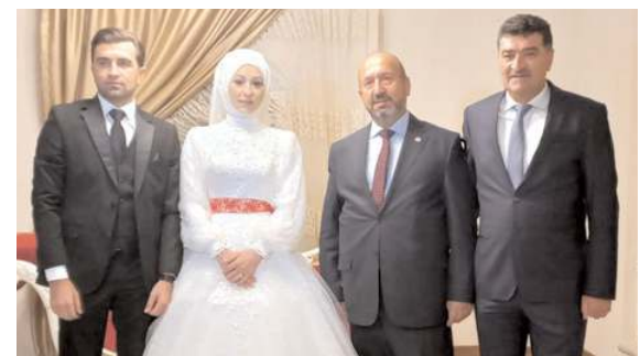
Milletvekili Erol Kavuncu, genç çifte ömür boyu mutluluklar diledi.