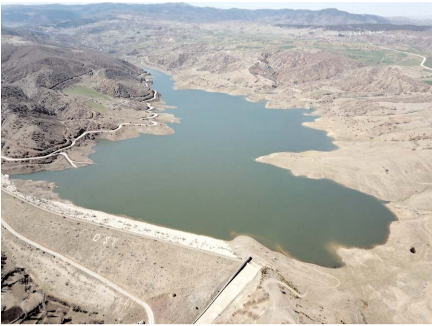
Koçhisar, Yenihayat ve Hatap barajlarının toplam su hacmi 41 milyon m3