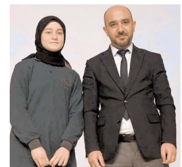
cilere ödülleri verildi.