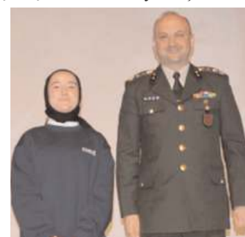
masında dereceye giren öğrencilere ödülleri verildi.