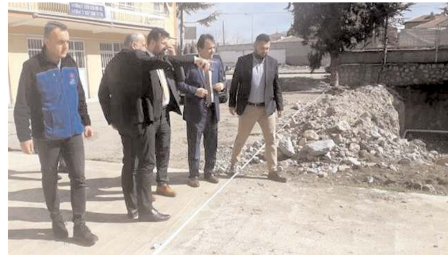
Heyet inşaat alanında incelemede bulundu.