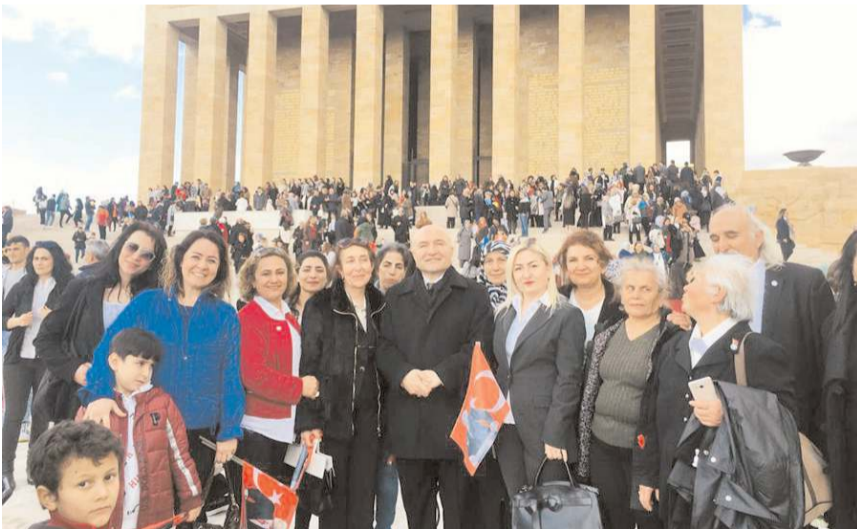
İYİ Partili kadınlar Anıtkabir önünde hatıra fotoğrafı çektirdiler.