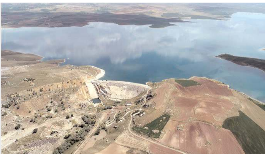
Koçhisar Barajı %27 doluluk oranına sahip.