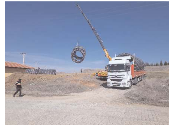
Çorumgaz, bölgeye doğalgaz hattının döşenmesi için çalışmalara başladı.