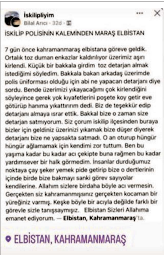
Polis memuru Ferhat Erduğan'ın sosyal medyada yaptığı paylaşım gündem oldu.

Depremin kalbi Elbistan'da yürekleri ısıtan diyalogu İHA muhabirine anlatan polis memuru Ferhat Erduğan, "10 gün önce Çorum'un İskilip ilçesinden deprem görevi ile alakalı olarak Elbistan'a geldik. Bulduğumuz yer, çarşı merkezi. Buralarda yıkımlar gerçekleşmiş. AFAD müracaat merkezinde görevlendirildik. Enkaz kaldırma çalışmaları esnasında üzerimiz toz-toprak nedeniyle kirlendi. Burada marketler de kapalı. Resmi kıyafetlerimizi yıkamak için market aramaya başladık. Küçük bir market bulduk. 30 yaşlarındaki market işletmecisi kardeşimize deterjan almak istediğimizi söyledik. O da deterjanı