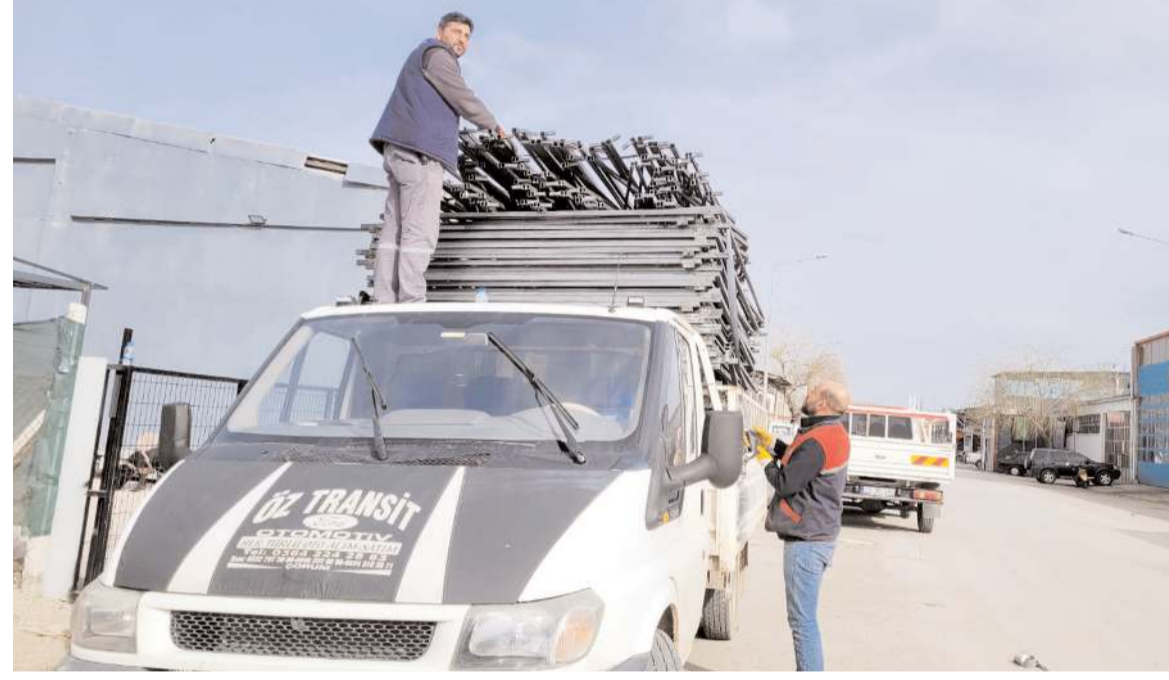
Barınma ihtiyacını karşılamak amacıyla yaklaşık 300 kişilik çadır kuruldu.

Bölgede halen barınma ihtiyacı olduğunu belirten Başkan Öz-