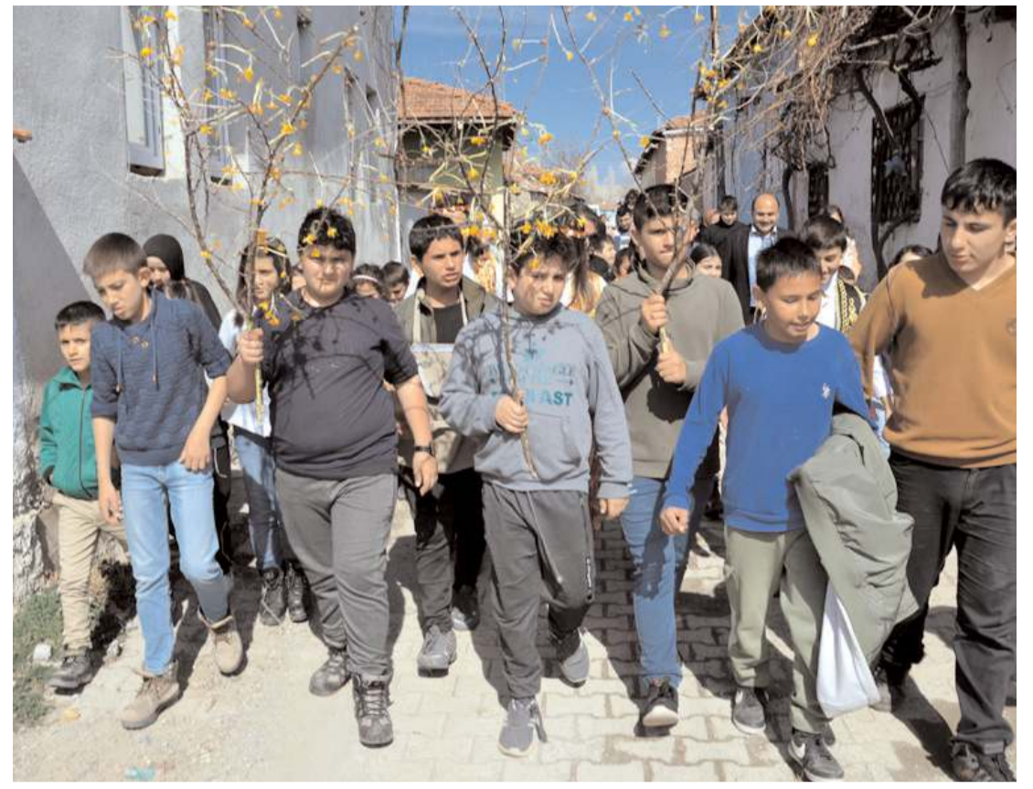
Toplanan çiğdemleri bir iğde dalına takan çocuklar, daha sonra yanlarına aldıkları bez torbalar ile köyde 'çiğdem gezmesi'ne çıktılar.

Anıtkabir özel anı defterini imzalayan Akşener, "Kadınların omuzlarında yükselen bu memleket, yeni asrında kadınları görmezden gelemiz. Türk kadını güçlü olursa, Türkiye de güçlü olur" dedi. (Haber Merkezi)