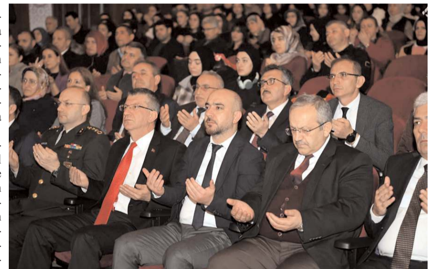
Depremde hayatını kaybeden vatandaşlar için dua edildi.