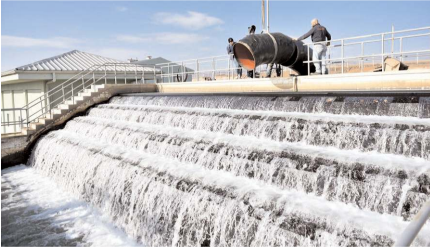
Çorum'un yıllık su tüketiminin yaklaşık 20 milyon m3 olduğu belirtildi.