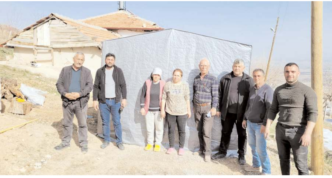
Çorum Kuşsaray Köyü Kültür ve Dayanışma Derneği, Malatya'da depremzedeler için çadır kurdu.