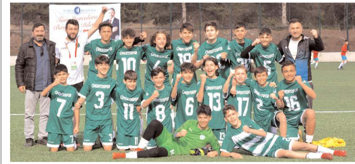
Çimentospor U 14 takımı ligde namağlup olarak son maçına şampiyonluğu garantilemiş olarak çıkacak

Son maçlar öncesinde Çimentospor şampiyonluğu Çorum FK ikincilik, Hattuşa Gençlikspor üçüncü ve Mimar Sinan ise dördüncülük kupasını almayı garantilediler. Kupalar bugün oynanacak maçların ardından düzenlenecek törenle verilecek.