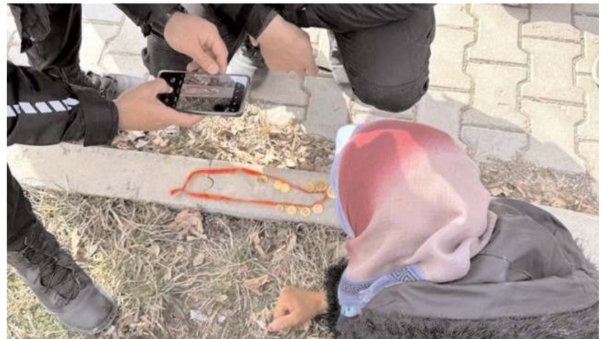
İsmigül Ertuğrul'a yaklaşık 40 bin lira değerindeki altınları teslim edildi.