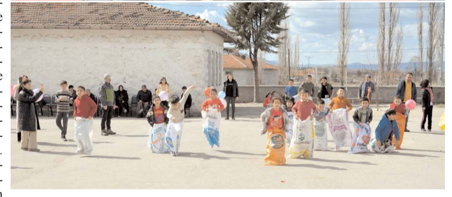
Çocuklar çeşitli oyunlar oynadılar.