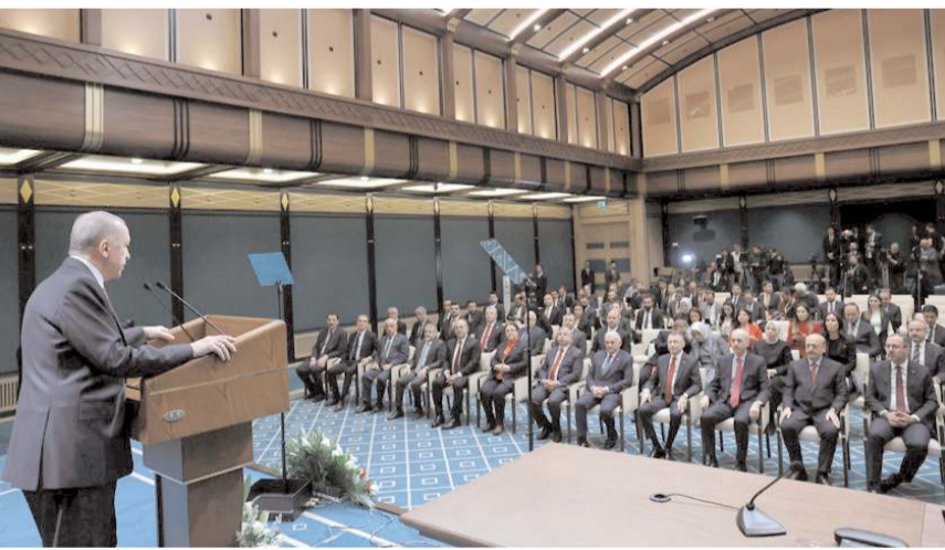
Cumhurbaşkanı Recep Tayyip Erdoğan, seçimlerle ilgili açıklamada bulundu.

Hazırladığımız bütün müzikleri yasaklıyoruz, müziksiz bir kampanya olacak, ikili görüşmeler suretiyle bu kampanyamızı sürdüreceğiz." (Haber Merkezi)