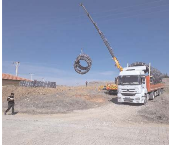
Çorumgaz, bölgeye doğalgaz hattının döşenmesi için çalışmalara başladı.