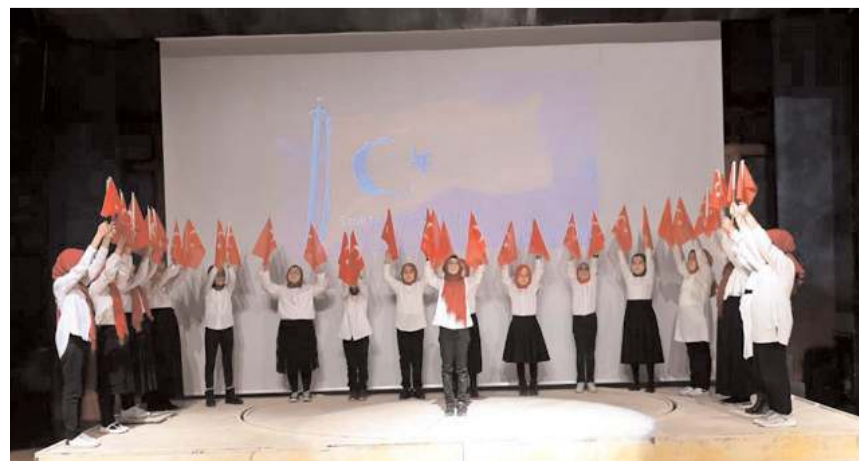
Programı Çorum Belediyesi Prof. Dr. Hayreddin Karaman Kız Anadolu İmam Hatip Lisesi hazırladı.