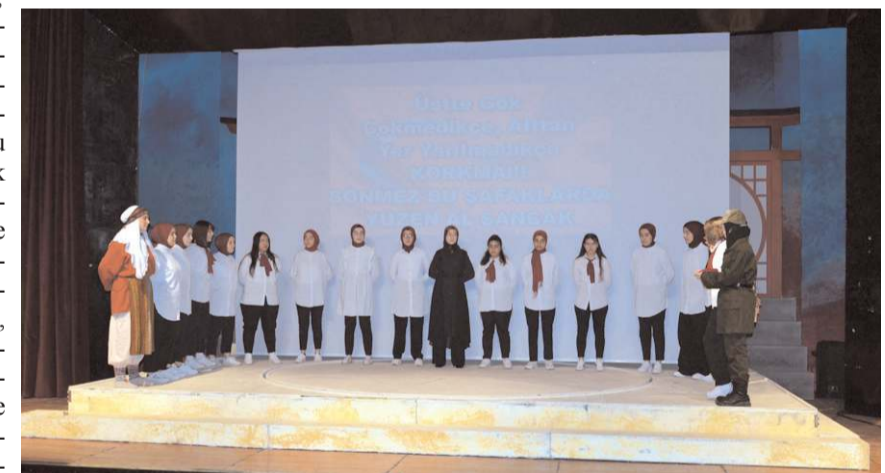
Oratoryo gösterisi büyük beğeni toplandı.