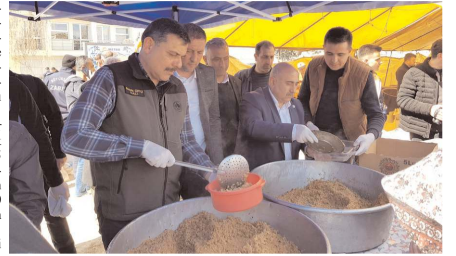
Çorum Valisi Mustafa Çiftçi de vatandaşlara dolma ikram etti.

Depremin meydana geldiği 6 Şubat tarihinden itibaren belediye olarak bugüne kadar 4 iş makinası, 9 personel ile afet bölgesine destek verdiklerini açıklayan Başkan Ekrem Ünlü, "Bayat halkının destekleriyle toplanan yardımlar ivedilikle deprem bölgesine ulaştırıldı. İlçemize gelen 55 depremzede ailemizi en iyi şekilde misafir etmeye çalışıyoruz. Çorum valimiz Mustafa Çiftçi koordine-