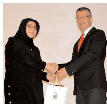
Mektup yazma yarış-

Konuşmaların ardından okul öğrencileri tarafından günün anlam ve önemine ilişkin şiirler okundu.