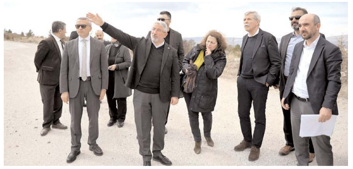
Alman şehir planlama şirketi AS+P yetkilileri Çimento arazisinde incelemede bulundu.

Yüz yüze görüşmeler ve oylamaların neticesinde de il başkan adayları genel merkez tarafından değerlendirilecek.