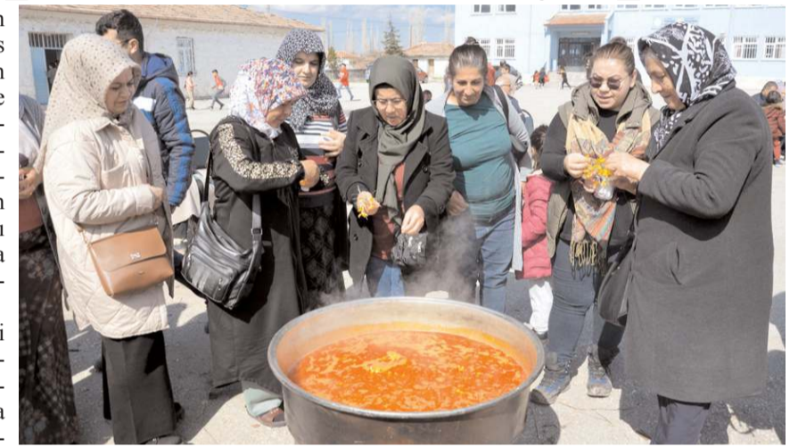
Toplanan malzemelerle okul bahçesinde kurulan kazanlarda pişirilen çiğdem aşısı, köy halkına ikram edildi.

"Çiçekler de bolluk, bereket, huzur getirmesi için o evlere veriliyor" Çocukların köydeki evleri ziyaret etmesi gerektiğini anlatan Yılmaz, "Çünkü baharın gelişini kutluyoruz. Kışın bitmesiyle bahar bolluk bereket, rahmet ayı olarak görülür. Ve bu ritüelde de bunun