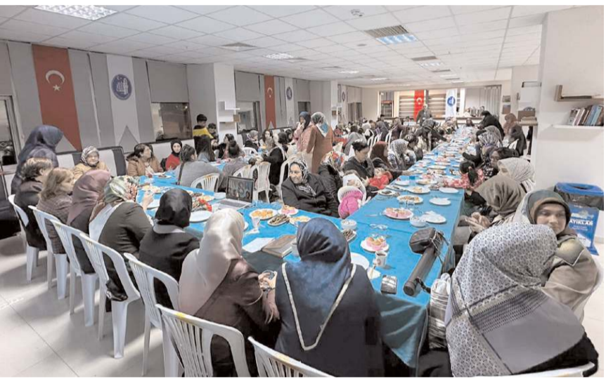
Programa Çorumlu kadınlar ile depremzede misafirlerim katıldı.