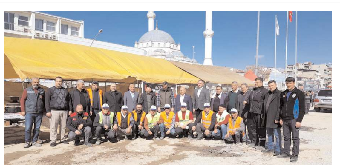
Afşin Çadır Kent'te 20 kişilik ekip tarafından 15 kazan dolma hazırlandı.