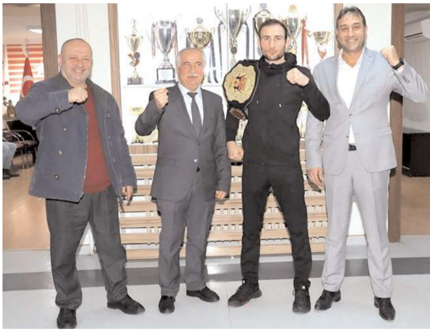
Abdussamet Uğurlu Sungurlu Belediye Başkan Yardımcıları ile birlikte poz verdi