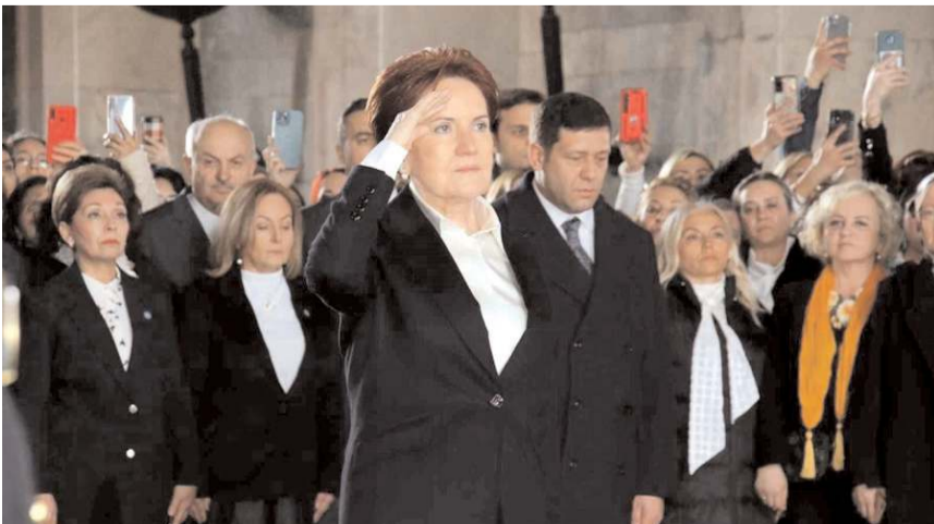
İYİ Parti Genel Başkanı Meral Akşener de programa katıldı.

İYİ Parti Çorum İl ve İlçe Kadın Kolları, Genel Başkan Meral Akşener'in grup toplantısına katılmak ve 8 Mart Dünya Emekçi Kadınlar Günü etkinlikleri kapsamında Anıtkabir'i ziyaret etmek amacıyla Ankara'ya çıkarma yaptı.