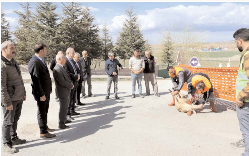
İçmesuyu şebekesi yenileme çalışmaları kurban kesilerek başladı.

Şebeke suyu için kullanılan asbest boruların yerine polietilen boru kullanacaklarını Anlatan Şahiner, "İlçe genelinde uzun yıllardır içme suyuyla yaşanan sıkıntıların önüne geçmek ve zararlı olan asbest boruların kaldırılarak yerine polietilen borularının konulmasına yönelik başlatılan çalışmada ilk kazma vuruldu. Söz vermiştik, sizi asbest borulardan kurtaracağız diye. Akçakent Mahallemizde ilk kazmayı vuruyoruz." ifadelerini kullandı.(AA)