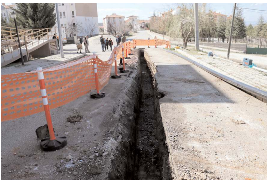
Çalışmalar ilk olarak Akçakent Mahallesi'nde başladı.