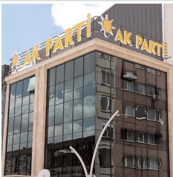
Yine anket usulü görüşmelerde de 3 isim istenecek.

İl yönetim kurulu üyeleri, il kadın ve gençlik kolları yönetim kurulu üyeleri, il disiplin kurulu üyeleri, demokrasi hakem kurulu üyeleri, merkez ilçe yönetimi, il genel meclis üyeleri, belediye meclis üyeleri, kadın kolları ilçe başkanları ve gençlik kolları ilçe başkanlarıyla da anket usulü toplu görüşme yapılacak.