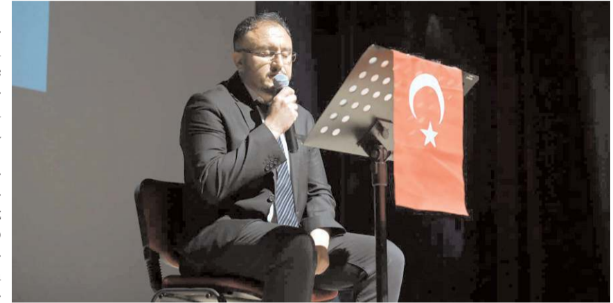
Program Kur'an-ı Kerim tilaveti ile başladı.