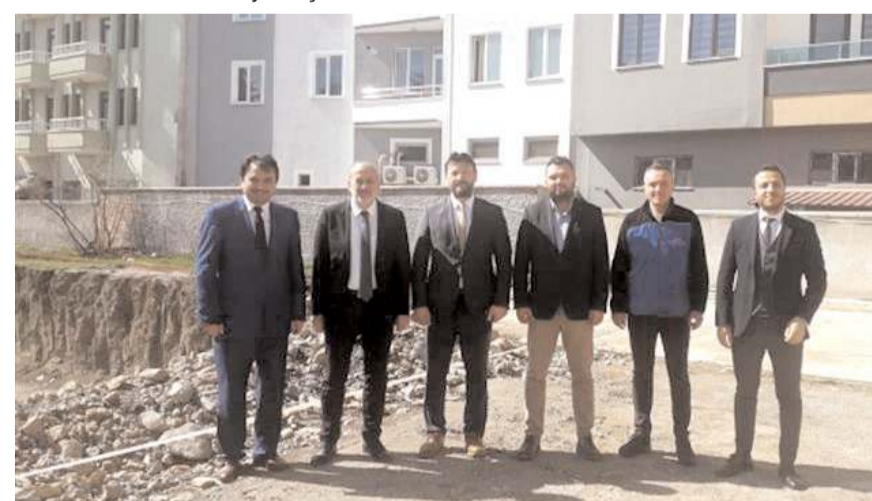
İnşaatı, TDV TEYAŞ-KOMAŞ A.Ş. yapacak.