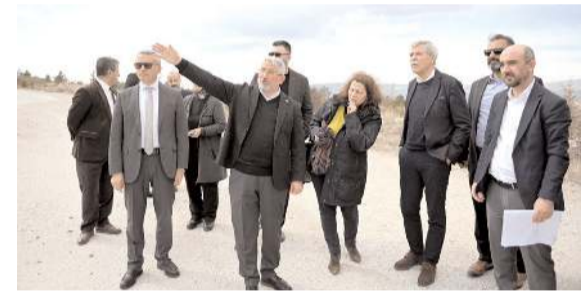
Alman şehir planlama şirketi AS+P yetkilileri Çimento arazisinde incelemede bulundu.