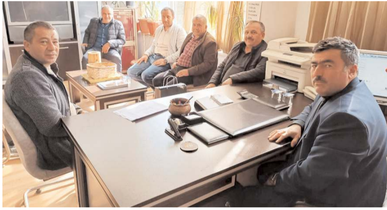
Ziyarete Zanaatkarlar Küçük Sanayi Sitesi Yapı Kooperatifi yönetim kurulu üyeleri de katıldı.