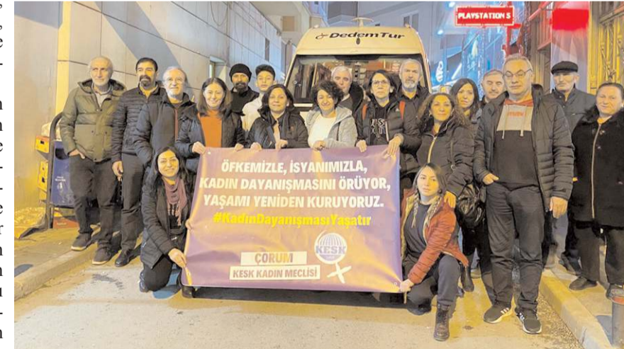
Yardım malzemeleri deprem bölgesine gönderildi.