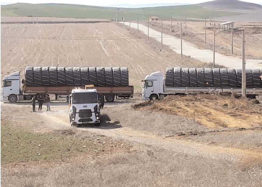
Doğalgaz, OSB'nin yakınından geçen Samsun-Ankara Mavi Akım doğalgaz boru hattından alınacak.