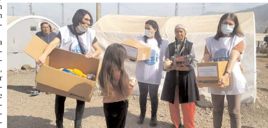
Yardımlar, depremzede kadınlara dağıtıldı.

lerle dayanışma içerisinde olan KESK üyelerine ve tüm gönül dostlarımıza teşekkür ederiz. Biliyoruz ki dayanışmanın gücüne olan inancımızla bu zor günleri de aşacağız. Deprem bölgesindeki halkımızın yaralarını sarmak, dayanışmayı büyütürken depremde birleşen ellerimizi hiç ayırmamak için yıkılan hayatı yeniden kuracağız. Unutmayın, dayanışma yaşatır." dedi. (Haber Merkezi)