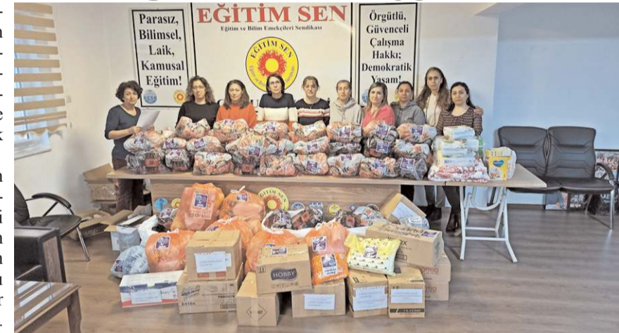
Çorum Kadın Meclisi, İskenderun'daki depremzede kadınlara dağıtılmak üzere hijyen kiti hazırladı.

Ülke olarak büyük bir yıkım ve acı yaşadığımız bu zor günlerde, acılarımızı ortaklaşarak, yaralarımızı sarmak için tüm gücümüzle halkımızın yanında yer alacağız, yardımlarımızı sürdüreceğiz. Bu süreçte biz-