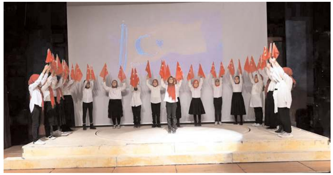
Programı Çorum Belediyesi Prof. Dr. Hayreddin Karaman Kız Anadolu İmam Hatip Lisesi hazırladı.