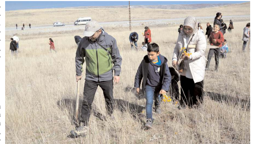
Etkinlik kapsamında ilk olarak çiğdem toplandı.

gerçekleştirilmesi için çocuklar çalılı elinde tutarak köyü dolaşıyor. Topladıkları yağ, bulgur, soğan diğer malzemelerle yemek yapılıyor. Çiçekler de bolluk, bereket, huzur getirmesi için o evlere veriliyor. O yıl yağmur çok yağsın, bereket bolluk olsun diye" şeklinde konuştu.