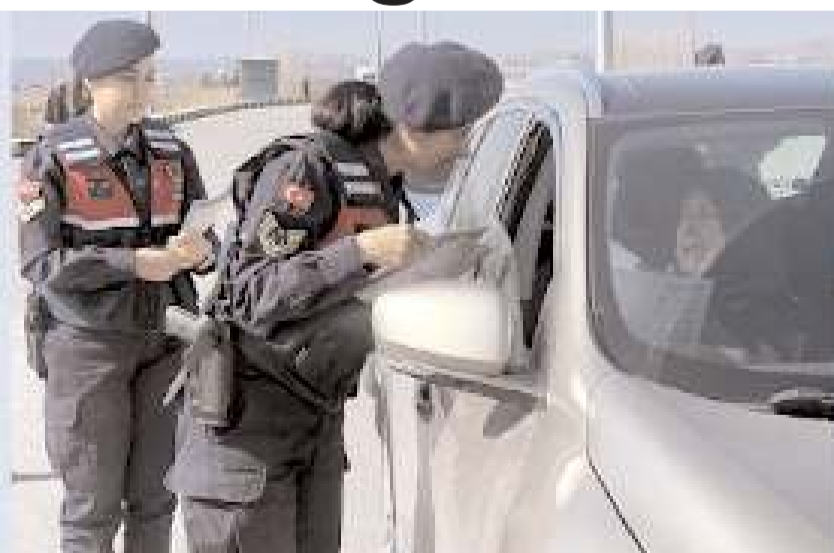
Çorum İl Jandarma Komutanlığı ekipleri kadınların 8 Mart Dünya Kadınlar Günü'nü kutladı.

Çorum İl Jandarma Komutanlığınca kadınların 8 Mart Dünya Kadınlar Günü kutlandı.