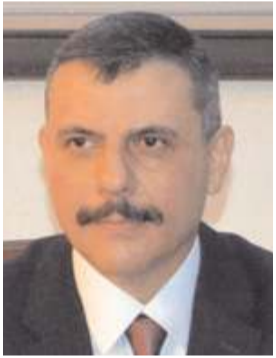
Vali Mustafa Çiftçi

■ Vali Mustafa Çiftçi, 2022-2023 eğitim yılının başlanması ve İlköğretim Haftası nedeniyle yayınladığı kutlama mesajında aydınlık bir geleceğin ancak azimli çalışmalar neticesinde elde edileceğini belirtti.