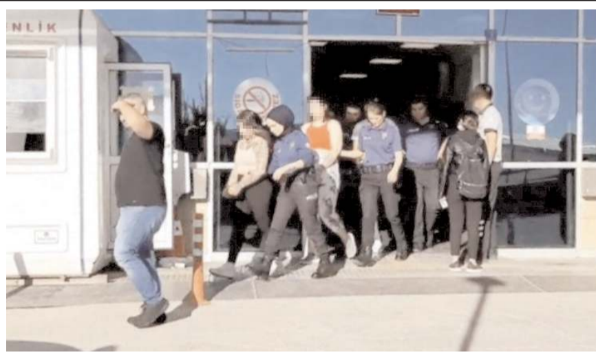
Adliyeye sevk edilen zanlılardan ikisi mahkeme tarafından tutuklandı.

Zanlıların cep telefonlarında yapılan incelemede, tabanca ve tüfekle evlere ateş ederken çekilen görüntüler bulundu.