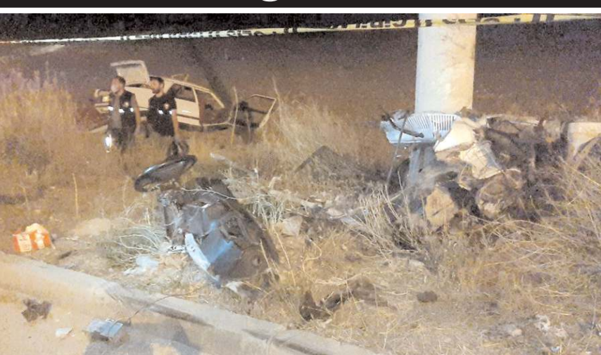
Kaza Çorum-Osmancık kara yolu Bayat Gedigi bölgesinde meydana geldi.

■ Çorum'da otomobilin elektrik direğine çarpmasıyla meydana gelen trafik kazasında baba ile henüz yaşına girmemiş bebeği hayatını kaybetti.