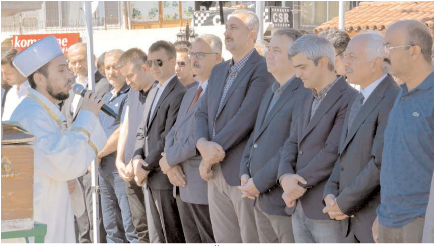
Merhume için Alaca Ömer Paşa Camisi'nde öğle namazına müteakip cenaze namazı kılındı.