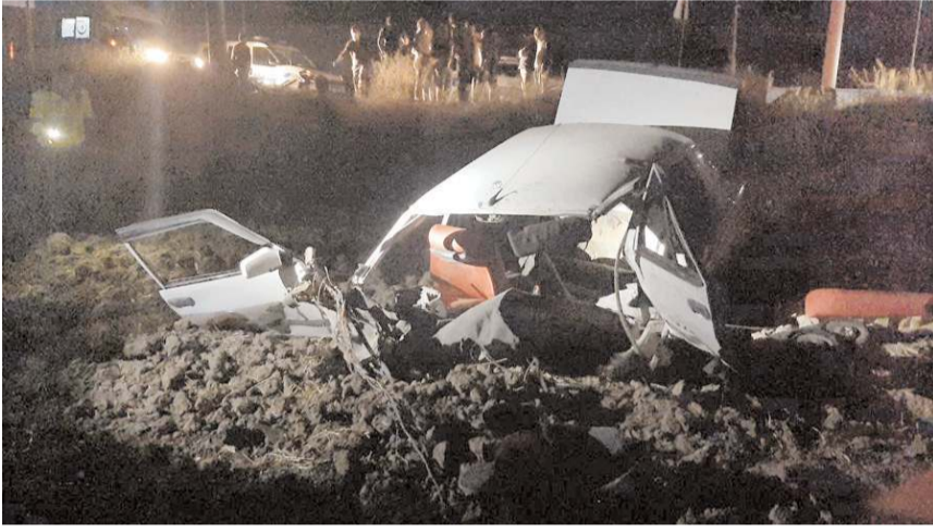
Kazada otomobil parçalandı.