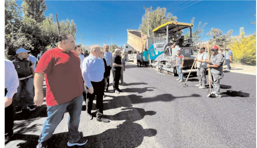
Asfaltlı Çorum Belediyesi Fen İşleri Müdürlüğü ekipleri serdi.