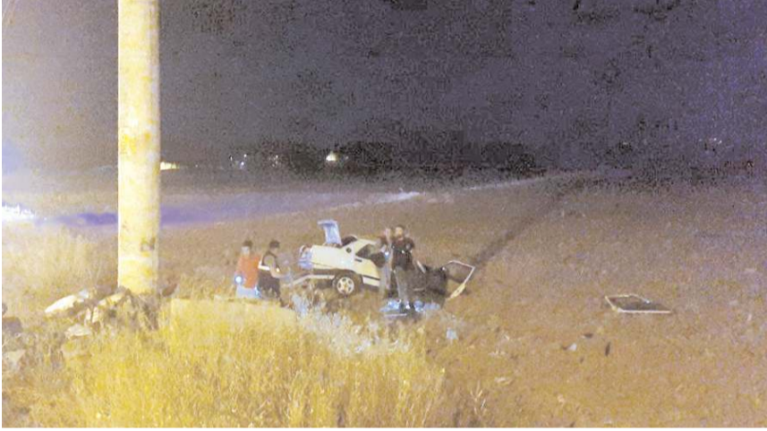
Olay yeri inceleme ekipleri kaza yerinde inceleme yaptılar.

Çorum'da otomobilin elektrik direğine çarpmasıyla meydana gelen trafik kazasında bir baba ile henüz yaşına girmemiş bebeği hayatını kaybetti, kardeşi, eşi ve akrabası yaralandı.