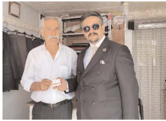
Çorum Alperen Ocakları Eğitim, Kültür ve Dayanışma Vakfı bin adet sifтах parası dağıtıyor.

9 yıl önce 5 metrekarelik bir alanda faaliyete başladıklarını söyleyen Karaca, şuan 500 metrekarelik bir üretim merkezinde Çorumlulara hizmet ettiklerini vurgulayarak, proje tamamlandıktan sonra Çorum'dan uluslararası bir marka doğacağını söyledi.