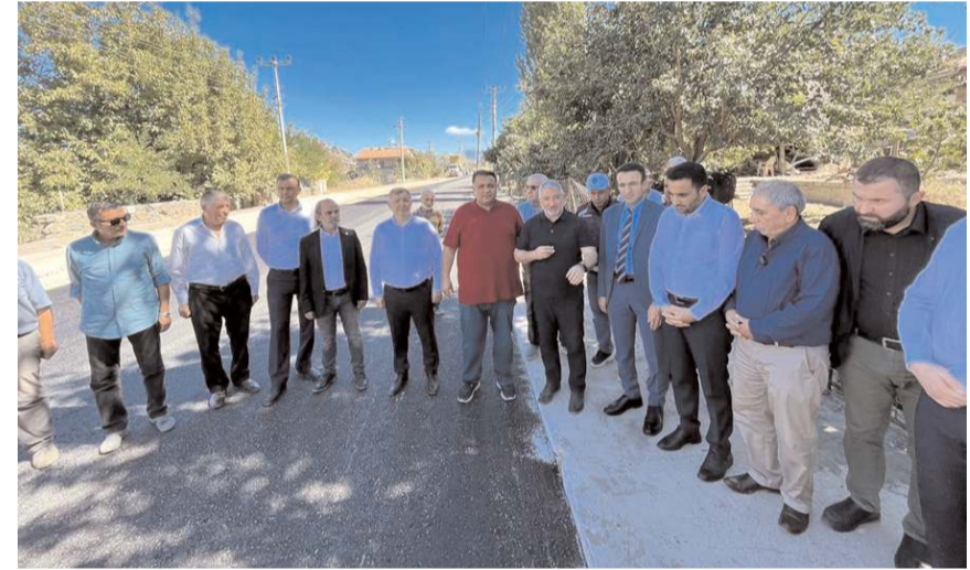
Çorum Belediyesi bin ton asfalt desteği sağladı.