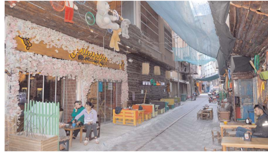
Pilavistan, PTT arkasında faaliyetlerini yürütüyor.

lık tekliflerini de bu süreçten sonra değerlendireceğiz" dedi.