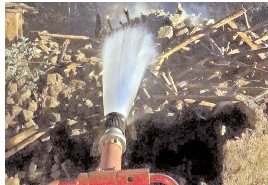
İtfaiye ekipleri yangını çevre evlere sıçramadan söndürdü

Yangınla ilgili olarak başlatılan soruşturmanın devam ettiği bildirildi. (İHA)