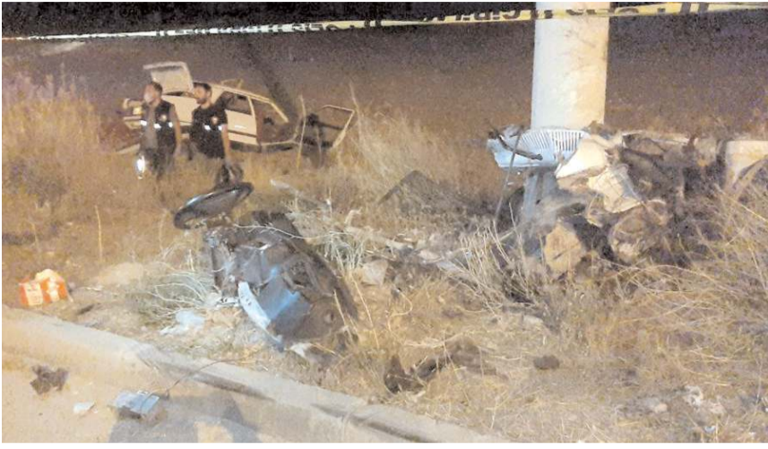
Kaza Çorum-Osmancık kara yolu Bayat Gedığı bölgesinde meydana geldi.