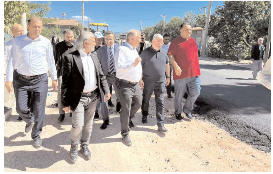
Başkan Aşgın, asfalt çalışmalarını yerinde inceledi.

AK Parti Çorum Milletvekili Oğuzhan Kaya da, "Çorum'un tüm ilçeleri ve merkezi güzelleşsin diye gerçekten büyük ve tarihi projelere imza atıyoruz. Çorum kent meydanının dönüştürülmesi, çimento arsasının Çorum'a kazandırılması, Kışla arsasının projelendirilmesi, Kale kentsel dönüşümü, tarihi kültür yolu ve bunların yanında yaptığı diğer sosyal projeler, fakir fukara, garip gurbaba'nın yanındaki duruşları ile Çorumun tüm belediyelerini ayırt etmeden belediyelerimize de yardım ediyoruz. Bugün de Osmancık Asya Tesislerinden şehrimize giriş yapan Ergenekon Caddemize sıcak asfalt yapıyoruz. İnşallah Dodurga yolumuz sıcak asfaltı yapacağız. Osmancık için önemli bir hizmet olan yaklaşık 8 bin metre karelik kapalı alanıyla 14 dönümlü sebze pazarının yo-