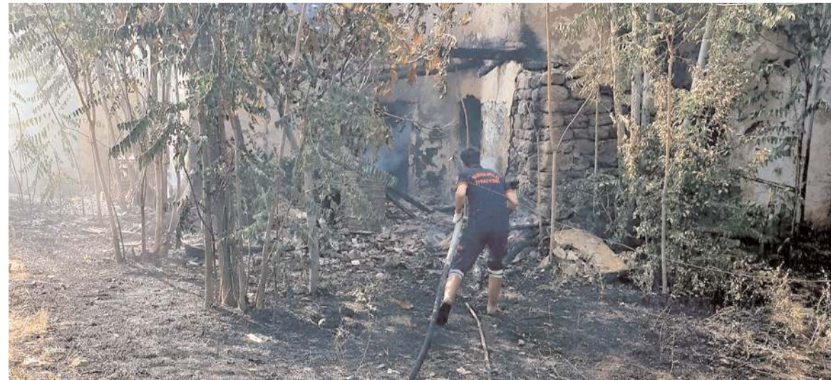
Yangın sonucu ev kullanılmaz hale geldi.