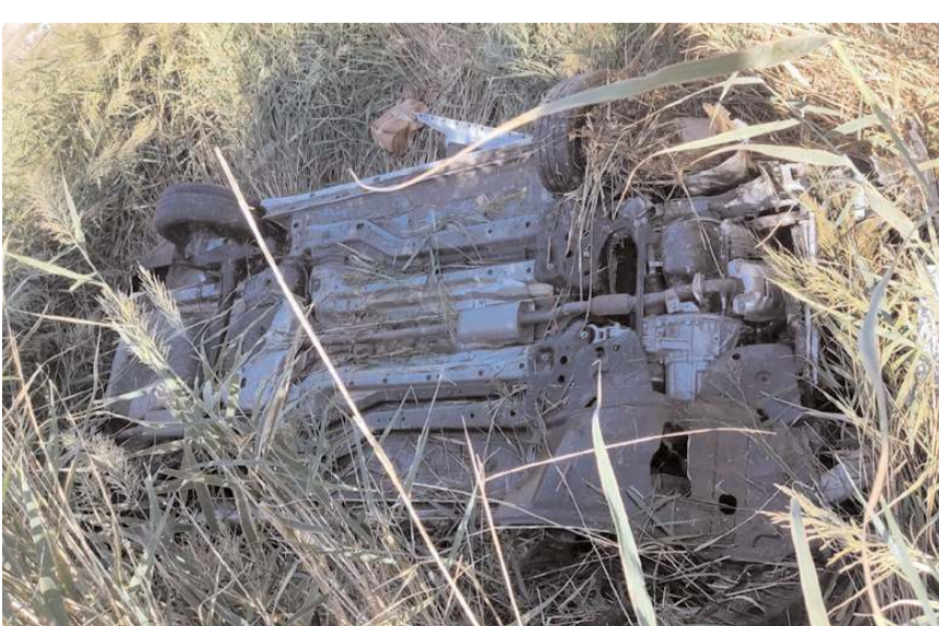
Kaza, Kırıkkale-Çorum D-200 karayolunun 18. kilometresinde meydana geldi.

Kırıkkale'nin Delice ilçesinde kontrolden çıkan otomobilin şarampole devrildiği kazada 3 kişi yaralandı.