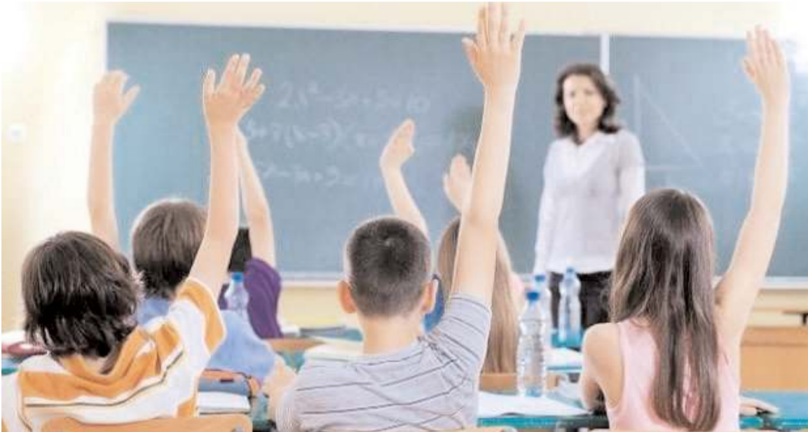
Çorum İnsani Değerler Platformu (İDP), yeni eğitim yılının başlangıcında adeta eğitimin derterine çözüm olacak reçete niteliğinde rapor hazırladı.