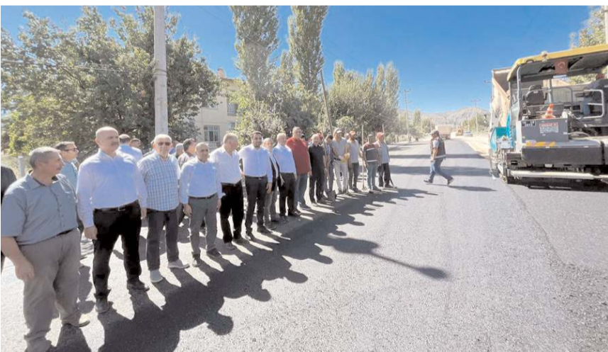
Ergenekon ve Dodurga Caddelerinde asfalt çalışmaları başladı.

■ Çorum Belediyesi'nin katkıları ile Osmancık'ta Ergenekon ve Dodurga Caddeleri'ne sıcak asfalt seriliyor.