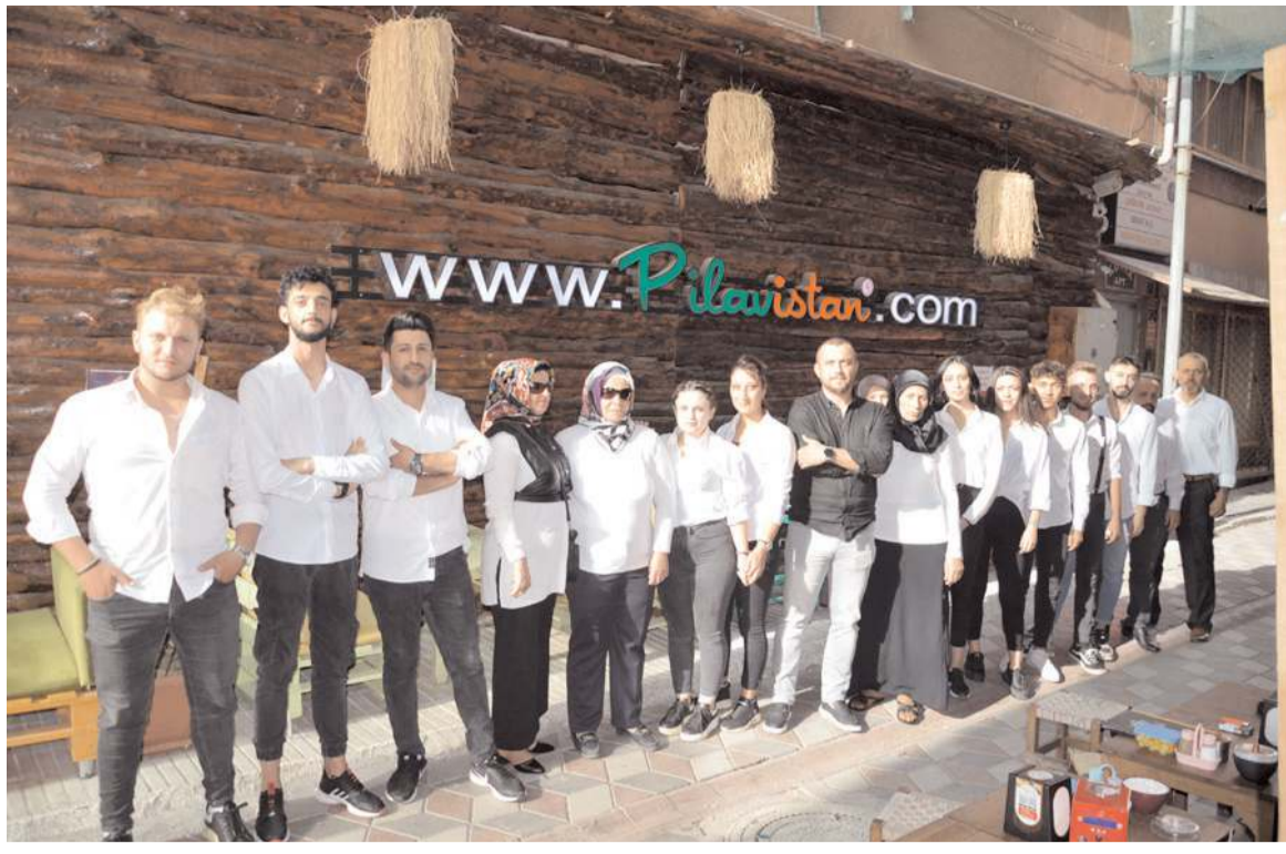
Pilavistan, tecrübeli personeli ile müşterilerine hizmet veriyor.

Resmi İlanlar: www.ilan.gov.tr'de (Basın: 1687312)