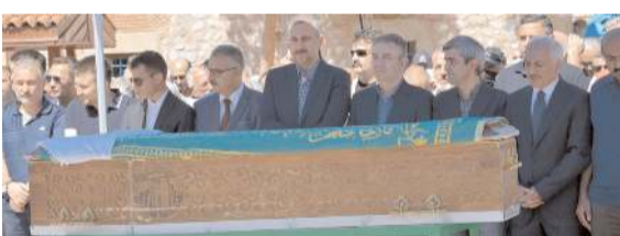
Merhume için Ömer Paşa Camisi'nde öğle namazına müteakip cenaze namazı kılındı.