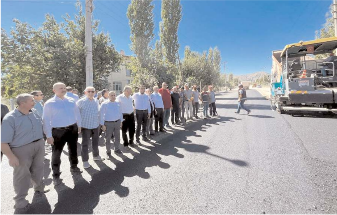
Ergenekon ve Dodurga Caddelerinde asfalt çalışmaları başladı.

Çorum Belediyesi'nin katkıları ile Osmancık'ta Ergenekon ve Dodurga Caddelerine 5 bin ton sıcak asfalt seriliyor. Sıcak asfalt serim çalışmaları Ergenekon Caddesi'nde başladı.