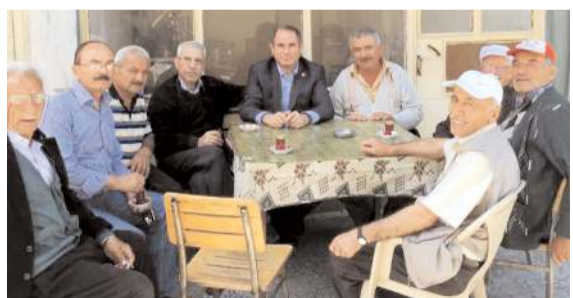
CHP eski İl Başkanı Gürsel Yıldırım, açıklamalarda bulundu.