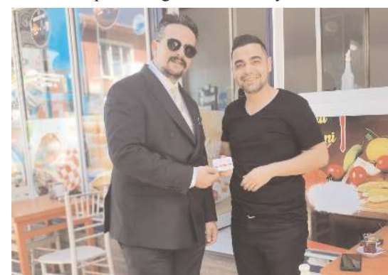
Esnafra teşekkür ettiler.