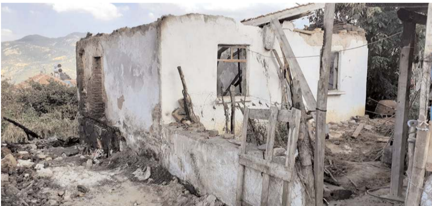
Mehmet Dede Tekke köyünde geçtiğimiz ay 2 ev yanmıştı.

Dodurga'da yangınzede ailelere destek amaçlı gerçekleştirilecek olan 'Bir tuğla da sen koy' kampanyasına sanat camiasından ve siyasilerden destek mesajları yağıyor.