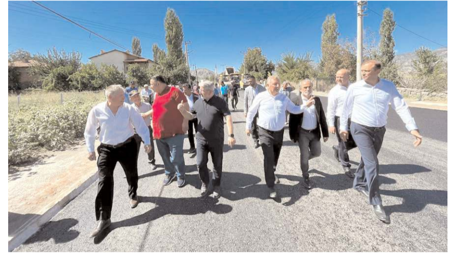
İlçede yeni yapılan kapalı pazar alanının yolu da sıcak asfalt olacak.