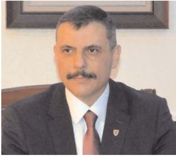
Vali Mustafa Çiftçi

Mesajında öğretmenlere seslenen Vali Çiftçi, "İnsanların ve toplumların şekillenmesinde ve yetiştirilmesinde, daha mutlu ve müreffeh bir geleceğin hazırlanmasında, milli, manevi ve evrensel değerlerin korunmasında, geleceğin aydınlık yüzü çocuklarımızın yetişmesinde en büyük pay hiç şüphesiz ki sizlerindir. Öğretmenliğin bir ideal ve özveri mesleği olduğunun