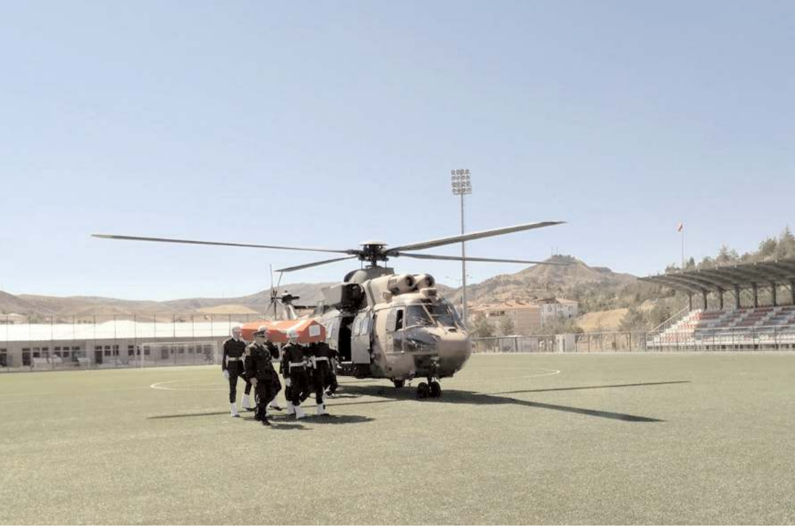
Şehidin Türk bayrağına sarılı naaşı, Ankara GATA'dan alınarak, askeri helikopterle Sungurlu'ya getirildi.