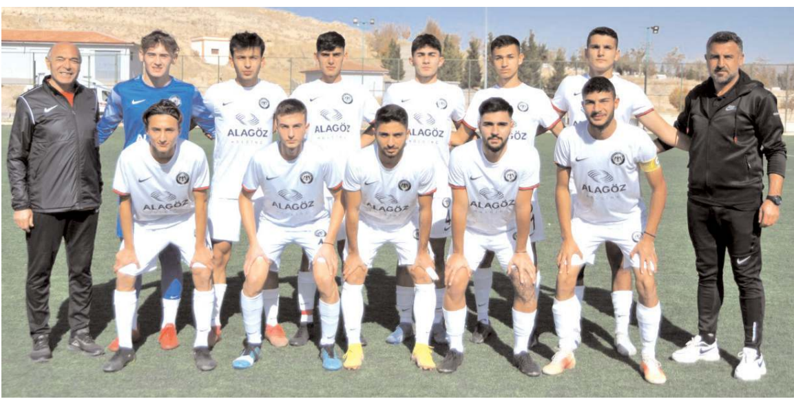
Bölgesel Gelişim Liginde grubunda lider durumda bulunan Çorum FK U 19 takımı bugün Orduspor'u konuk ediyor