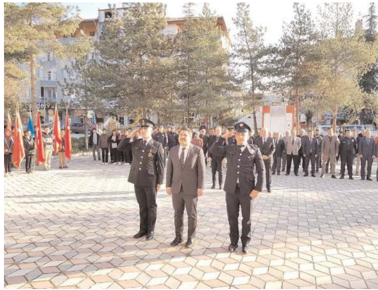
Tören Kaymakamlık bahçesinde Atatürk Anıtı'nda yapıldı.

Türkiye Cumhuriyeti'nin kurucusu Gazi Mustafa Kemal Atatürk'ün vefatının 84. yıl dönümünde Bayat'ta düzenlenen törenle anıldı.