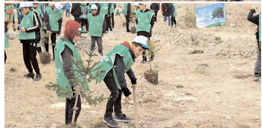
Çorum genelinde ise 29 bin 500 fidan toprakla buluştu.