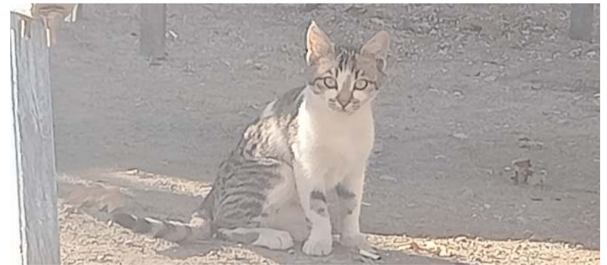
'Zeytin' adı verilen kediye annesi üç dört günlükken dışlamış.