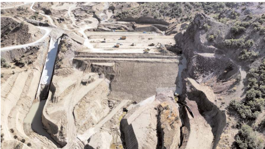
İlçede üç adet barajın inşaatı devam ediyor.