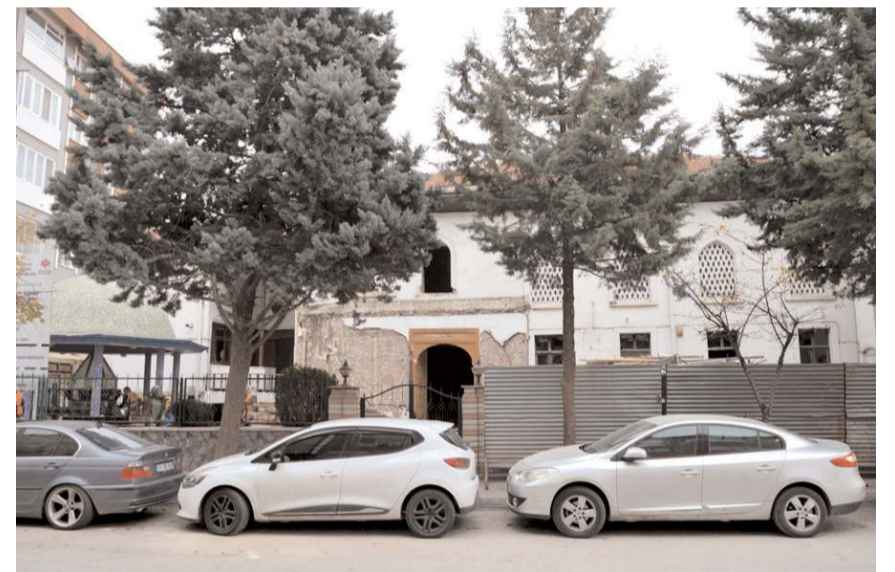
Restorasyon çalışmalarının 2023 yılının sonunda tamamlanarak caminin yeniden ibadete açılması bekleniyor.