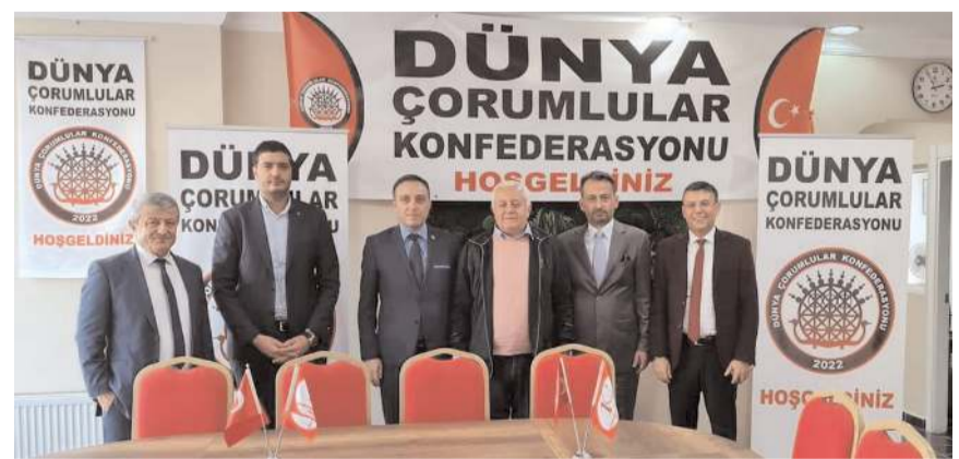
Ziyarete konfederasyonun çalışmaları konuşuldu.