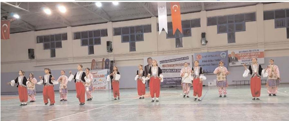
Bayat Spor Salonu'nda yapılan ödül töreninde halk oyunları gösterisi gerçekleştirildi.