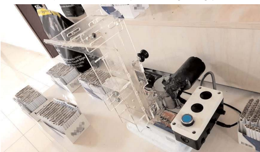
Sigara sarma makinesi ele geçirildi.