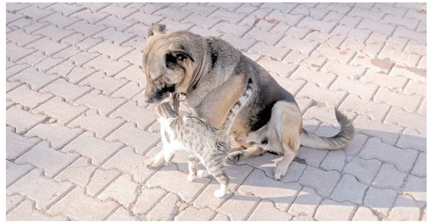
Yavru kedi ile anne köpek arasında ki bağı görenler şaşırıyor.