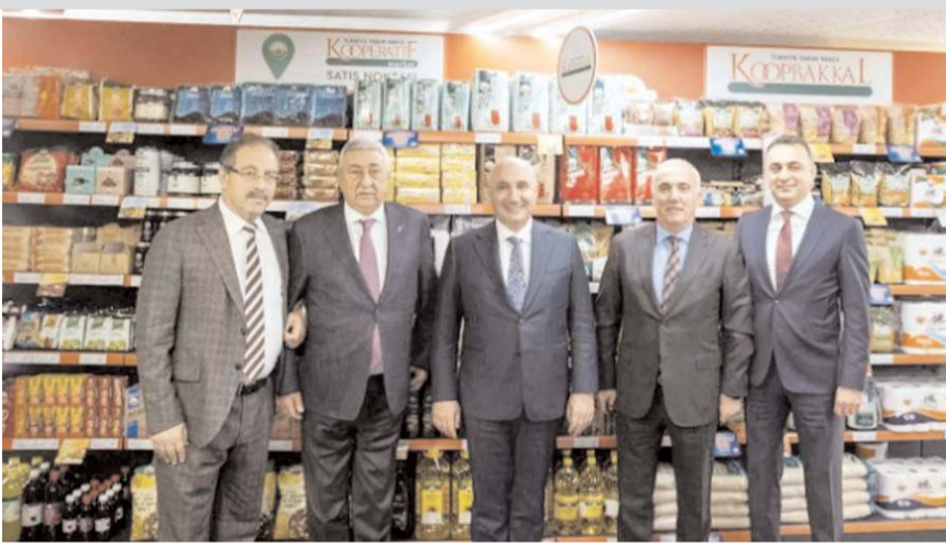
KoopBakkal Projesi'nin tanıtım toplantısı ve imza töreni yapıldı.

Halk Bankası'nın da bankaya finansal destek için başvuranlara raf alımı, tadilat harcamaları ile yazar kasa alımları için 200 bin liralık bir kredi desteği sunacağını aktaran Şanal, yine banka tarafından Tarım Kredi'den alınacak ürünlerin finansmanı için ise kapalı devre çalışan 300 bin liraya kadar limiti olan kredi kar-