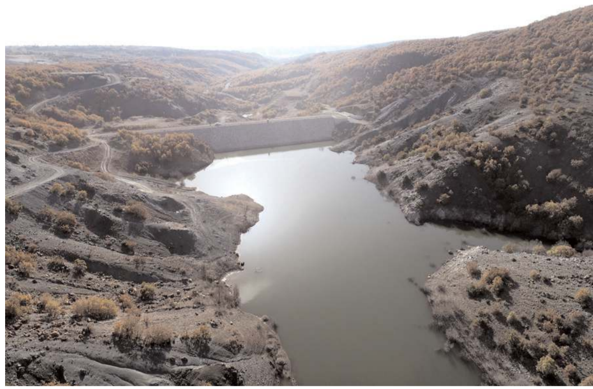
Sungurlu'da yürütülen baraj projeleri hem ilçeye içme suyu sağlayacak hemde toprakları suyla buluşturacak.

Bununla birlikte 11 adet taşkın koruma tesisinin de proje ve planlaması tamamlanırken en kısa zamanda inşaat programına alınması hedeflenmektedir." (Haber Merkezi)