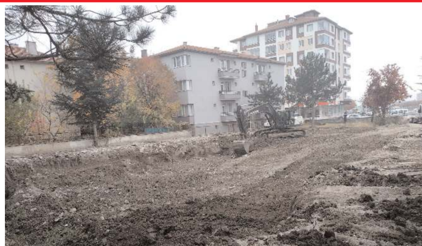
Aile Sağlığı Merkezi ve Sağlıklı Yaşam Merkezi'nde temel kazısı başladı.