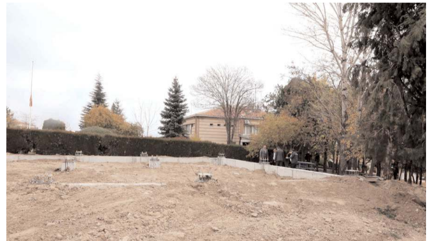
Garajın 2 ay içinde tamamlanarak hizmete girmesi bekleniyor.