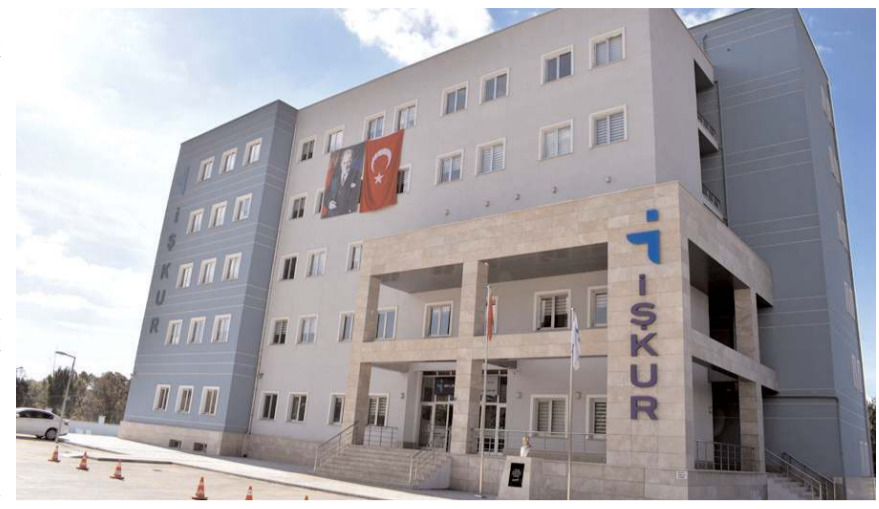
2023/1. Dönem proje başvuruları e-Devlet üzerinden başladı.

"İŞKUR'a engelli veya eski hükümlü kayıt olmak, Bedensel, zihinsel, ruhsal, duysal ve sosyal yeteneklerini çeşitli derecelerde kaybetmesi nedeniyle işgücünün en az % 40'ından yoksun olduğuna ilişkin "Sağlık Kurulu Raporuna" sahip olmak, 18 yaşını tamamlamış olmak, Hangi sebeple olursa olsun emekli olmamak, İŞKUR'a herhangi bir borcu bulunmamak, Kendi üzerine aktif olarak kayıtlı işyeri/işletme olmak, (Proje başvuru rehberi yayım tarihi itibarı ile proje konusu meslekte son bir yıl içerisinde terk mükellefi olmamak), İşyerinin kurulacağı il sınırları içinde ikamet etmek, Girişimcilik eğitim programı sertifikasına sahip olmak, (31.12.2020 öncesi yüz yüze eğitim ile alınan belgeler geçerli değildir.) Kurulacak iş ile ilgili başka mevzuatlarda aranılan diploma, sertifika, izin vb. belgelere sahip olmak ve aranılan diğer şartlara haiz olmak, Kendisine vasi tayini yapılmamış olmak, Herhangi bir icra dosyası bulunmamak, (Komisyon tarafından kabul edilen projelerin sözleşme imzası öncesinde https://www.turkiye.gov.tr/adalet-icra-dosyasi-sorgulama adresinden kişinin icra dosyasının olup olmadığı sorgulama-