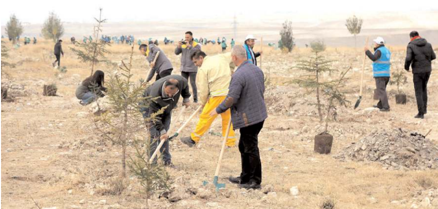
Organize Sanayi Bölgesinde yaklaşık 8 bin fidan toprakla buluştu.