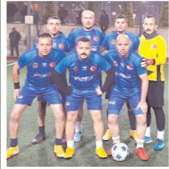
L Tipi Kapalı Cezaevi finale yükselen ilk takım oldu

Turnuvada bugün saat 14'de Bahçelievler İlkokulu ile Ay Yıldız Tim takımı üçüncülük dördüncülük saat 15'de ise Polisgücü ile L Tipi Kapalı Ceza İnfaz Kurulu takımları şampiyonluk maçında karşılaşacaklar.