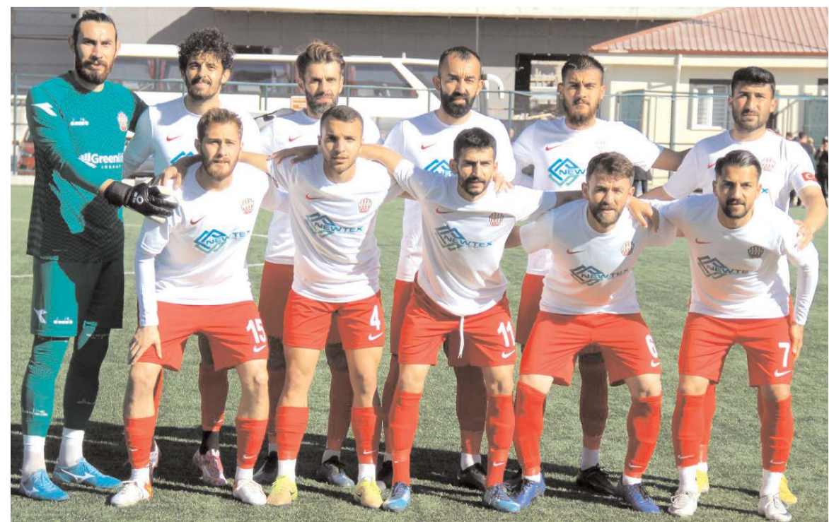
Osmancık Belediyespor yarın Çorum'da oynayacağı maçta Develi önünde kazanarak çıkışa geçmek istiyor