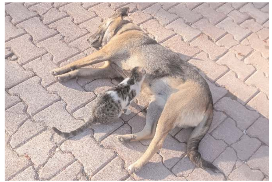
Annesinin dışladığı kedi yavrusunu köpek 3 aydır emziriyor.

Tesise gelen yaban hayatı fotoğrafçısı Hasan Ulusoy da köpeğin kediye emzirmesini cep telefonuyla görüntüledi.