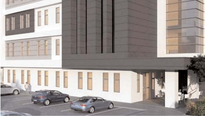
Merkez 5 katlı olarak yapılacak.