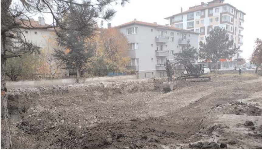
Aile Sağlığı Merkezi ve Sağlıkli Yaşam Merkezi'nde temel kazısı başladı.