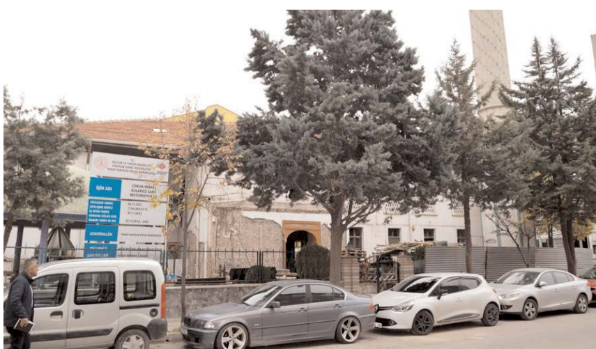
Kulaksız Camii'nin restorasyon çalışmaları başladı.

Tarihi Kulaksız Camii'nde restorasyon çalışmaları başladı. Restorasyonun 2023'ün sonunda bitirilerek caminin yeniden ibadete açılması hedefleniyor.