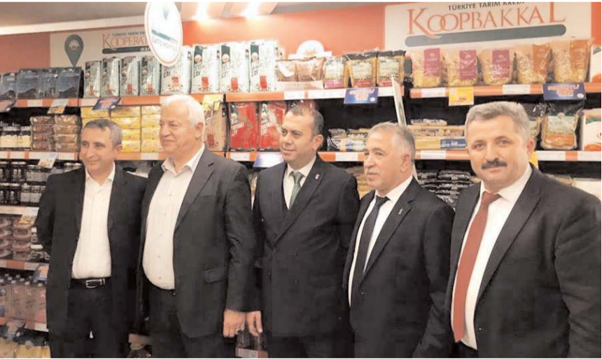
Proje ilk olarak pilot illerde hayata geçirilecek.