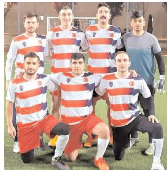
Polisgücü takımı yarı finali kazanarak finale yükseldi