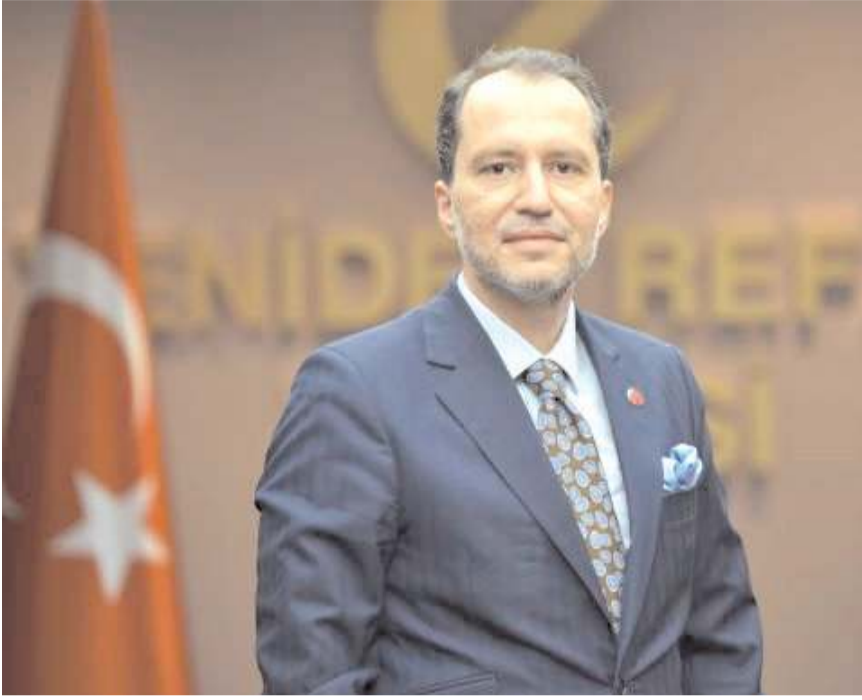
Yeniden Refah Partisi Genel Başkanı Dr. Fatih Erbakan