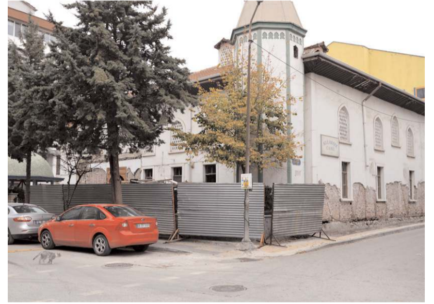
Restorasyon yaklaşık 7 milyon 396 bin liraya mâl olacak.

Yavru Turna Mahallesi'nde bulunan Kulaksız Camisi'nin ne zaman ve kimin tarafından yaptırıldığı bilinmemektedir. XIX.yüzyılın ortalarında onarılmış ve özelliğini yitirmişti. Bununla beraber Osmanlı mimarisinde ağaç direklerin taşıdığı, içerisi sahnalara ayrılmış, Orta mekânın üzeri ahşap bir kubbe ile örtülmüştür.