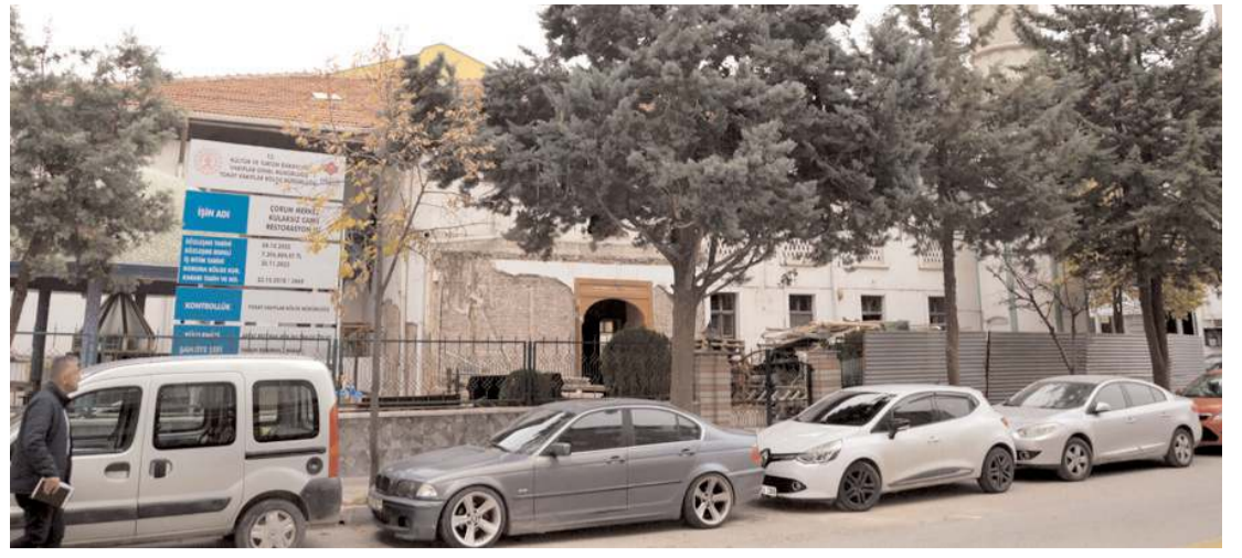
Kulaksız Camii'nin restorasyon çalışmaları başladı.

Projenin ilerleyen zamanda Çorum'da da hayata geçirileceğini ifade eden Özkan Şanal, projede emeği geçen başta Cumhurbaşkanı Recep Tayyip Erdoğan olmak üzere tüm kamu kurum ve kuruluş temsilcilerine teşekkür etti. (Haber Merkezi)