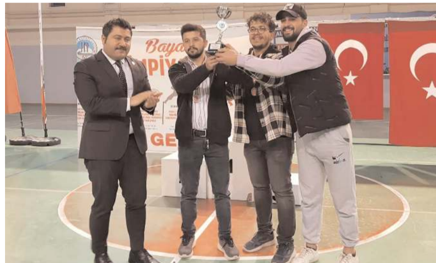
Yarışmalarda derece elde edenlere ödülleri verildi.

Belediye Başkanı Ünlü ise olimpiyatları gelecek yıllarda da sürdürmeyi arzuladıklarını bildirdi. (AA)