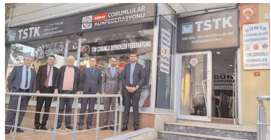
Ziyaretin sonunda hatıra fotoğrafı çekildi.

ziyaretten ziyadesiyle memnuniyet duyduk. Ziyaretlerinden dolayı sayın başkana ve heyetine şükranlarımızı sunuyoruz" şeklinde belirtti. Konfederasyon