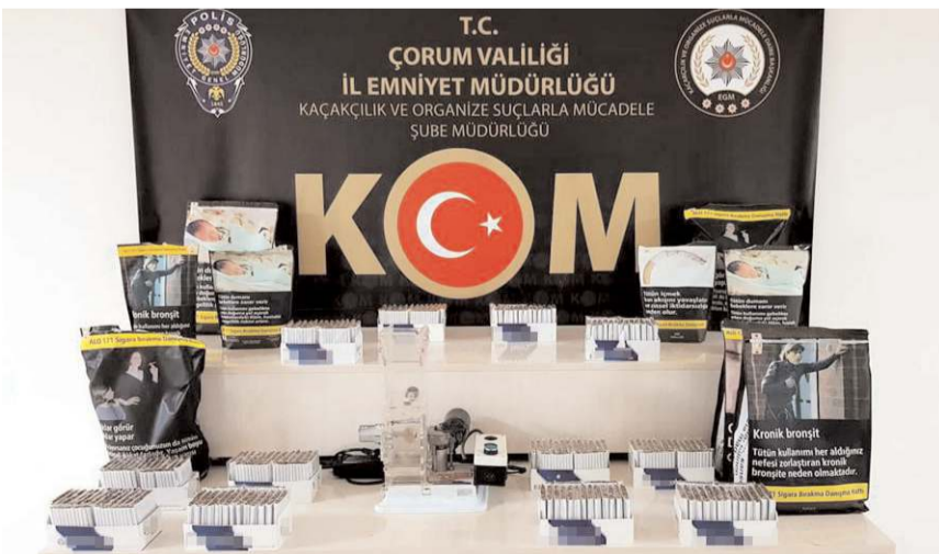
Operasyonda 3 bin 600 adet kaçak makaron sigara ele geçirildi.

Kaçak makaron sigaralar ile kıyılmış tütün ve sigara sarma makinesine el koyan polis ekipleri, şüpheli şahsı hakkında 5607 sayılı kanun maddesinden adli işlem başlattı. (İHA)