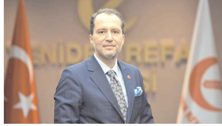
Yeniden Refah Partisi Genel Başkanı Dr. Fatih Erbakan