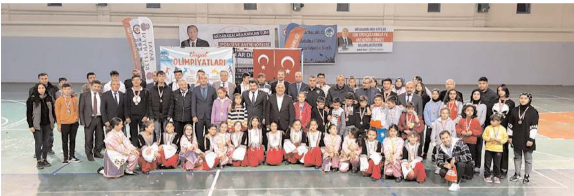
Bayat Olimpiyatları 29 Ekim-10 Kasım tarihleri arasında yapıldı.

Şan seçime hazırlık çalışmaları ve bölgedeki faaliyetler konusunda görüş alışverişinde bulunuldu. (Haber Merkezi)