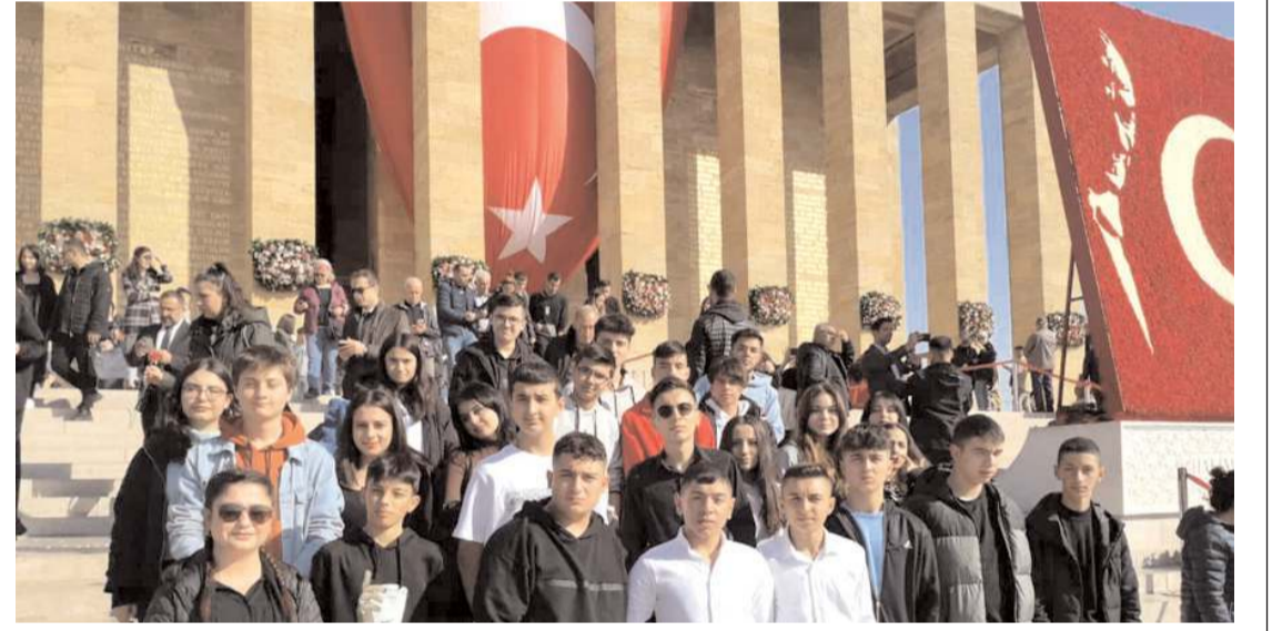
Deneyim Koleji öğrenci ve öğretmenleri Anıtkabir önünde hatıra fotoğrafı çekindiler.