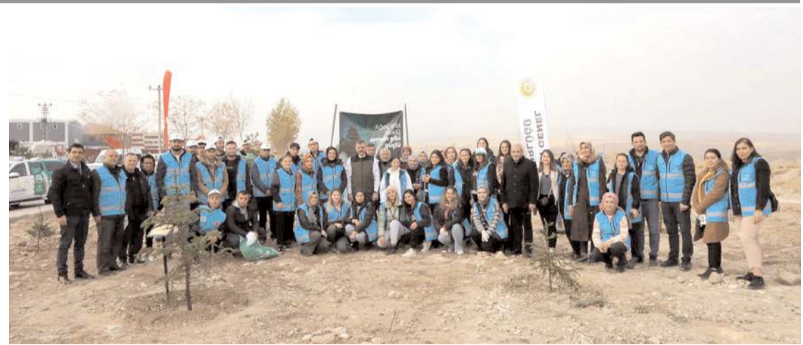
11 Kasım Milli Ağaçlandırma Günü kapsamında OSB'de fidan dikme töreni yapıldı.

Dünyada fidan dikme rekorunun 2019 yılında 1 saatte yaklaşık 303 bin fidan dikimi ile Çorum'da olduğunu hatırlatan Vali Çiftçi, "Bugün Çorum'da 11 ayrı lokasyonda toplam 29 bin 500 fidanı toprakla buluşturacağız. Geçtiğimiz yıl Orman İşletme Müdürlüğümüz ve Organize Sanayi Müdürlüğümüz arasında bir protokol imzalamıştık. Toplam 380 dekar alanda Organize Sanayi bölgesinde bir ağaçlandırma çalışmamız olacak. Bugün, Organize Sanayi Bölgesinde 25 dönüm alanda 8 bin fidanı toprakla buluşturacağız. 2022 yılında Orman İşletme Müdürlüğümüz 1 milyon fidan yeşil vatana yani orman varlığımıza kazandırıldı. Yapılan çalışmalarla Çorum'da orman varlığımız yüzde 38 seviyesine ulaştı." dedi.