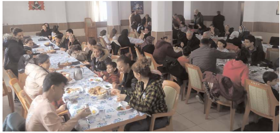
Program Hacı Bektaş Veli Anadolu Kültür Vakfı Çorum Şubesi'nde yapıldı.

Allah bu millete bir daha İstiklal Marşı yazdırmasın" dedi. (Haber Merkezi)