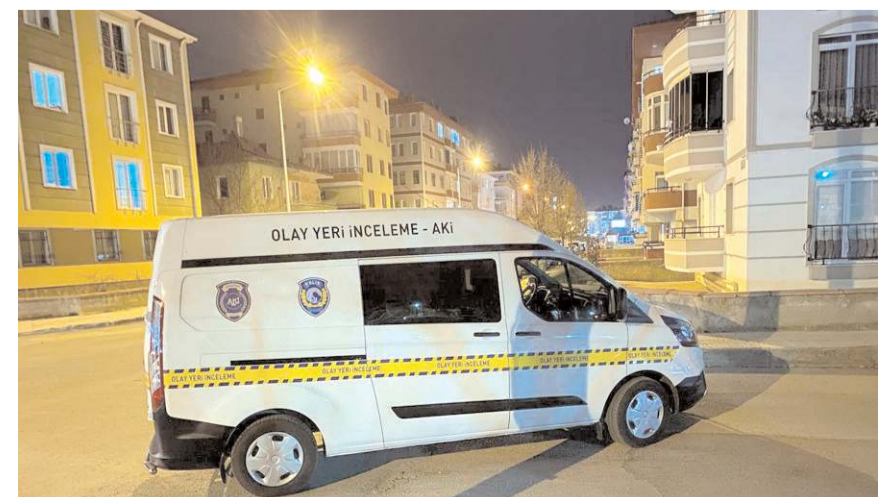
Polis ekipleri olay yerinde inceleme yaptı.