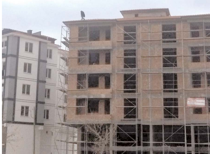
Olay, Fen Lisesi Caddesi'ndeki bir inşaatta gerçekleşti.

Çatıdaki vatandaşın yanına çıkan ekipler, intihar etmek isteyen şahsı ikna ederek intihardan vazgeçirdi.