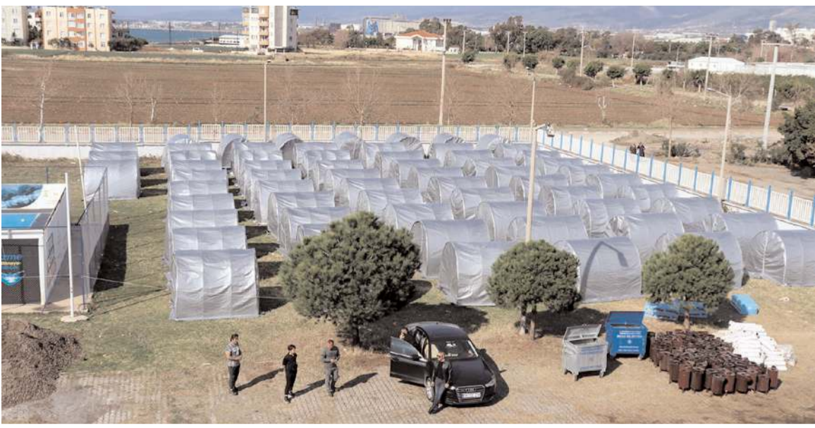
MHP Çorum İl Teşkilatı, Hatay'ın Payas ilçesinde bir çadır kent daha kurdu.