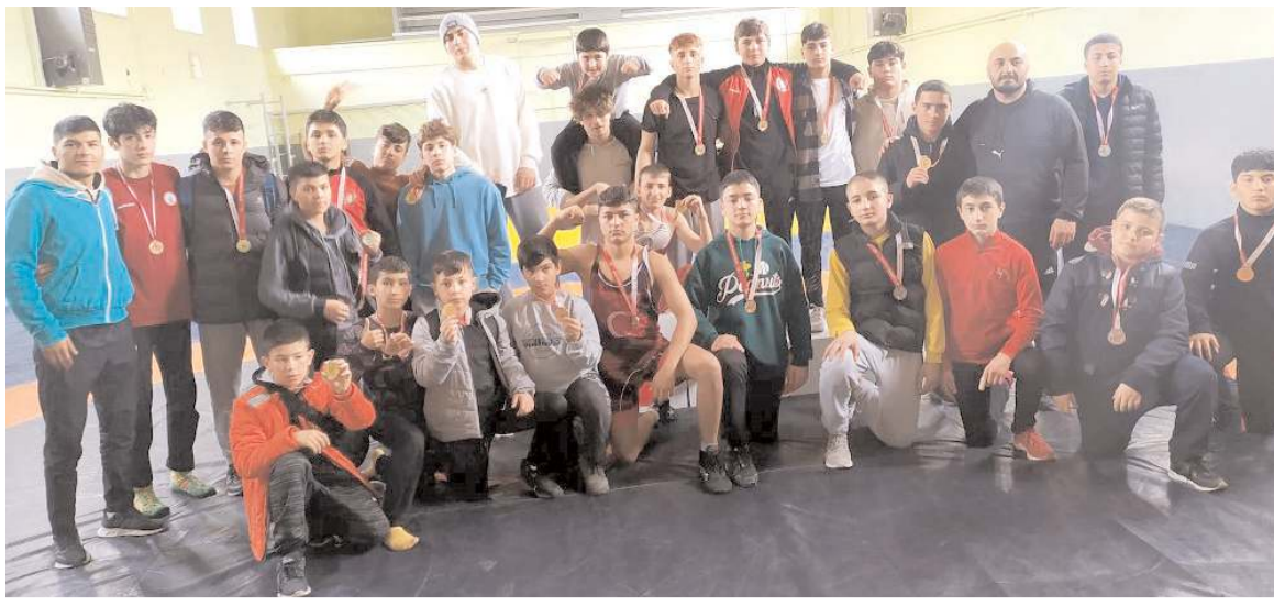
Grekoromen Güreş'te üç kategoride yapılan il birinciliğinde Sungurlu ve Boğazkale'li güreşçiler mücadele etti