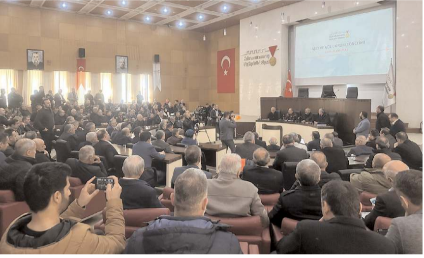
Toplantıda deprem bölgesinde yapılan çalışmalar istişare edildi.