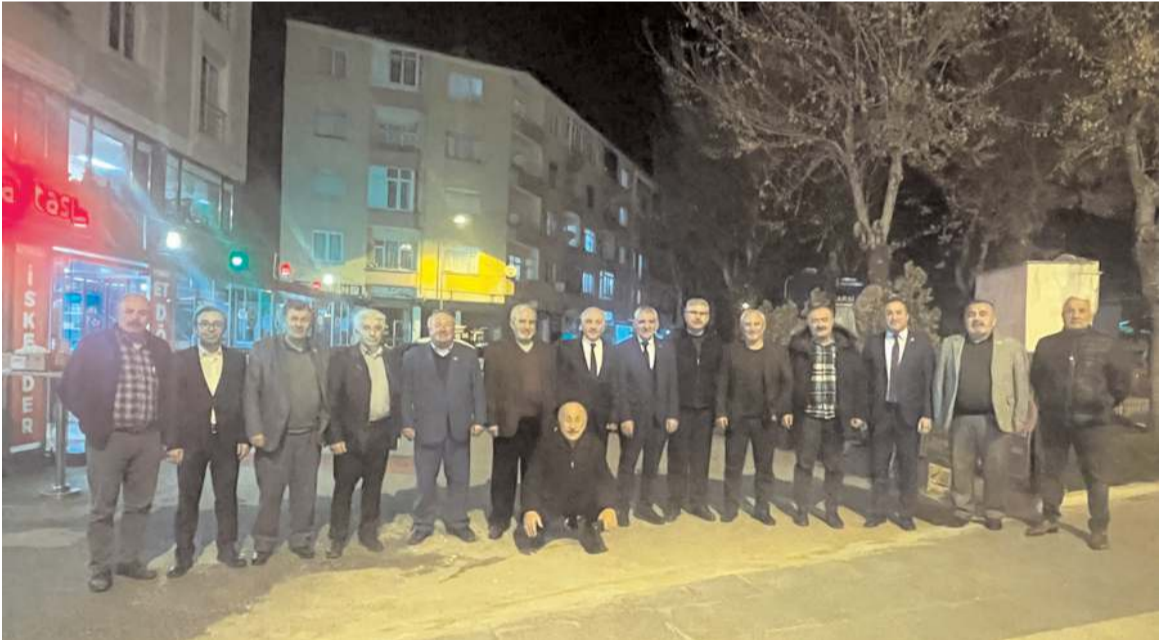
Toplantının ardından toplu hatıra fotoğrafı çekildi.