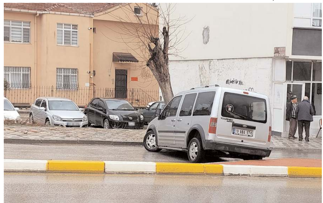
Kazada yaralanan olmazken araçta maddi hasar oluştu.