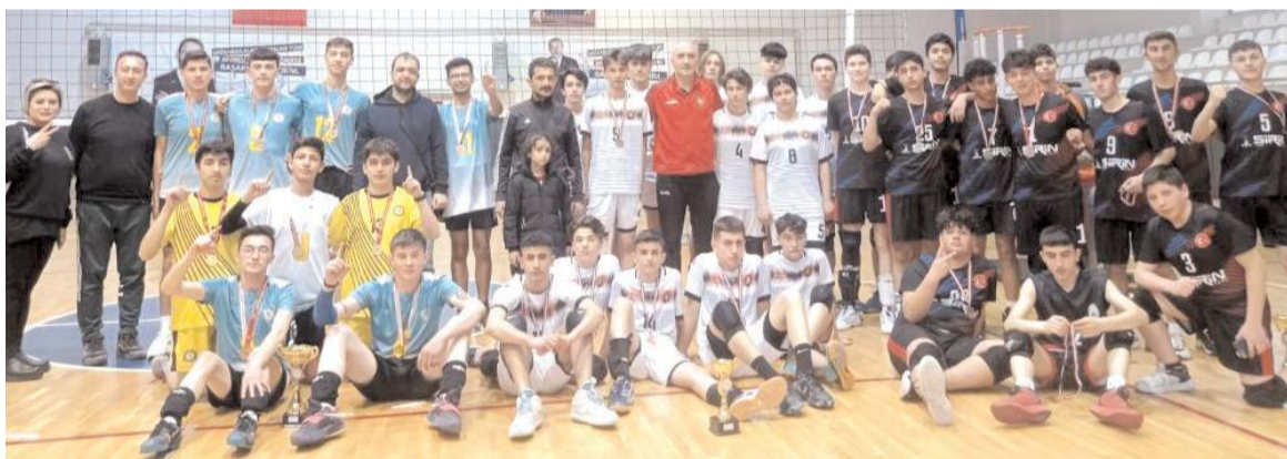
Yıldız erkekler voleybol il birinciliğinde dereceye giren kulüpler ödül töreni sonrasında toplu halde

Grekoromen stilde üç kategoride yapılan maçlar sonunda sıklıtlelerinde birinci olan sporcular ilimizi gruplarda temsil etmeye hak kazanırken dereceye girenlere madalyaları verildi.