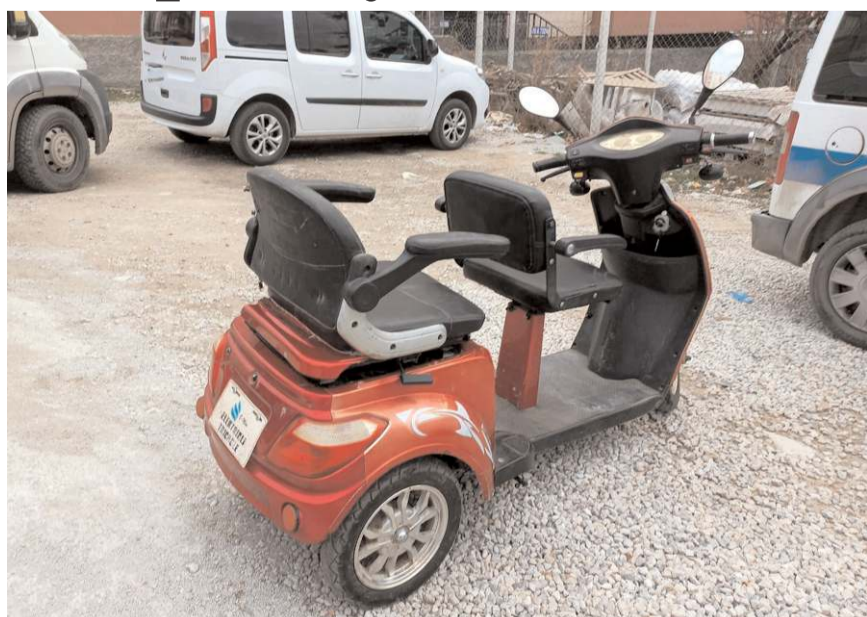
Çalınan motosiklet, sahibine teslim edildi.

Öte yandan zanlının çaldığı motosikleti sosyal medya hesabından bir başkasına sattığı tespit edildi.