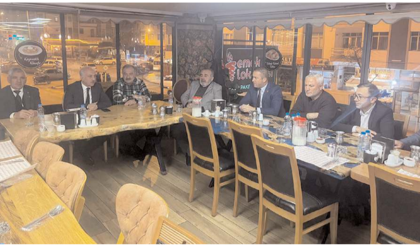
Toplantı Emek Lokantası'nda yapıldı.