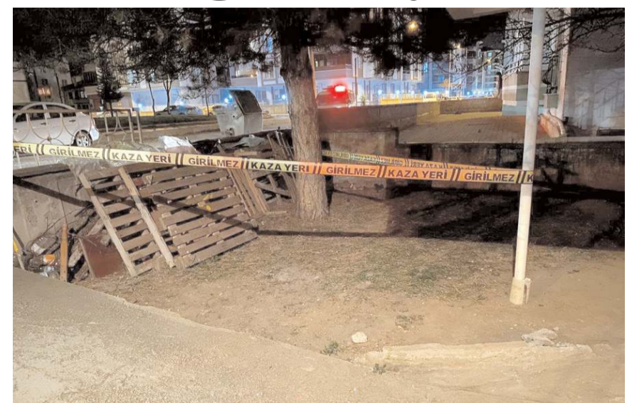
Olay, Buharaevler Mahallesi'nde meydana geldi.

Olayla ilgili başlatılan soruşturma sürüyor. (İHA)