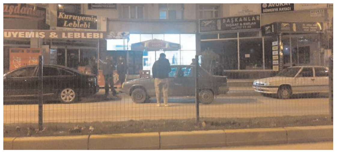
Olay Fatih Caddesi, Çorum Adalet Sarayı karşısında meydana geldi.

Hakimiyet, merhuma Allah'tan rahmet, kederli ailesi ve yakınlarına da başsağlığı diler.