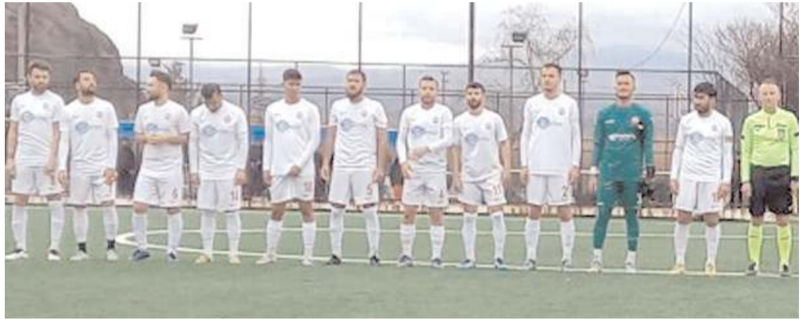
Osmancık Belediyespor Eskiil Belediyespor maçının serenominde hakemlerle birlikte görülüyor