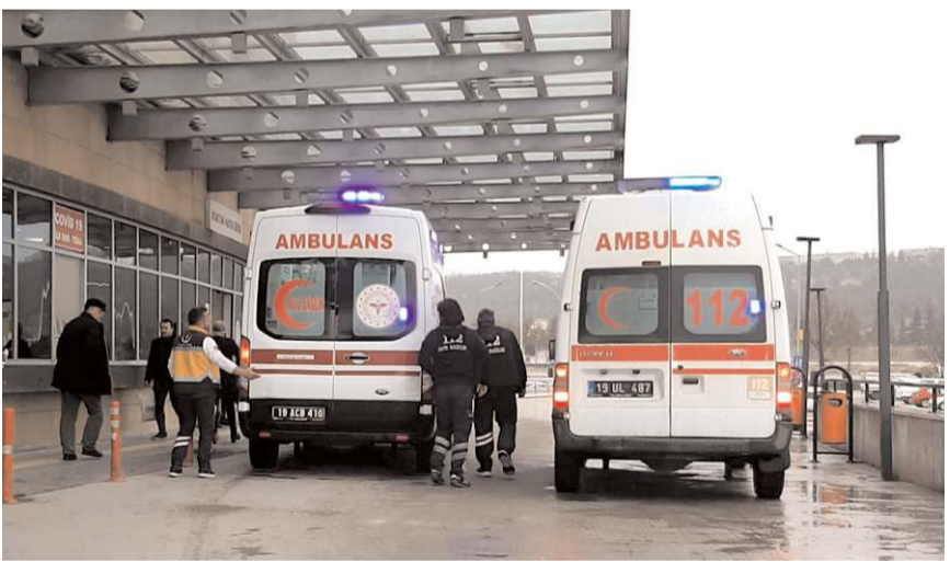
Yaralılar hastanede tedavi altına alındı.

Sağlık ekiplerince ambulansla Osmancık Devlet Hastanesi'ne götürülen yaralılar, buradaki müdahalenin ardından Hitit Üniversitesi Erol Olçok Eğitim ve Araştırma Hastanesi'ne sevk edildi.(AA)