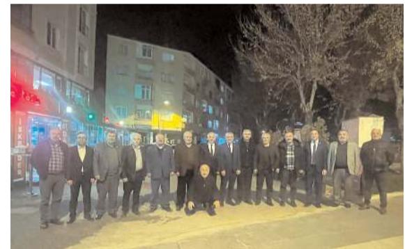
Toplantının ardından toplu hatıra fotoğrafı çekildi.

AK Parti Çorum Milletvekili Oğuzhan Kaya, Çorum'a KÖYDES Projesi için 116 milyon ödenek ayrıldığını duyurdu. * HABERİ 5'DE