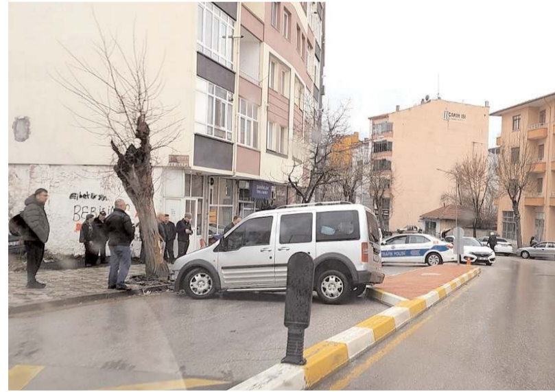
Kaza Cengiz Topel Caddesi'nde meydana geldi.