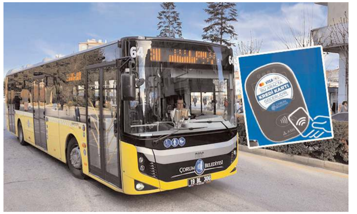
Artık toplu taşımada kredi kartı kullanılabilecek.

renler için Katma Değer Vergisi (KDV) yüzde 1 olarak uygulanıyor. (Haber Merkezi)