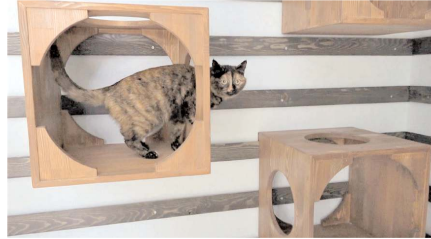
Kedi, Çorum Belediyesi Sahipsiz Kediler Müşahede Binası'ndaki yeni yuvasına yerleştirildi.