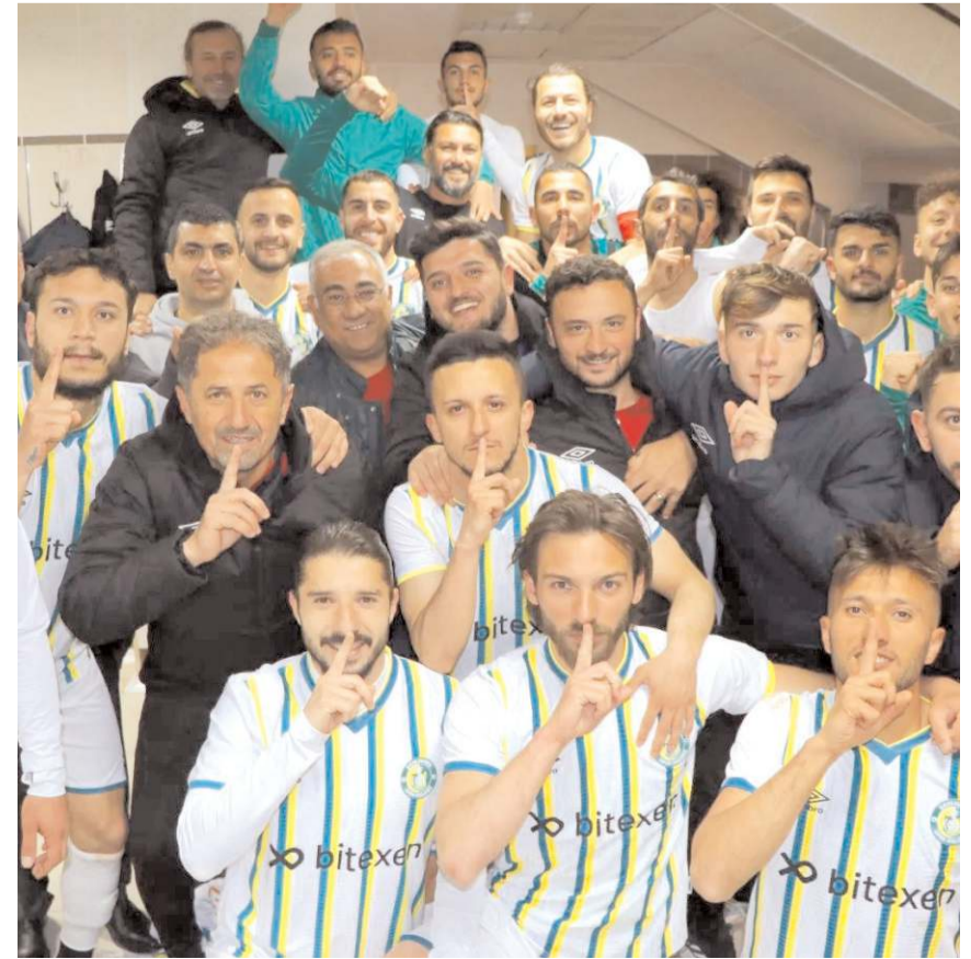
Bayburtspor deplasmanında tek golle kazanarak averajla liderliğe yükselen Urfaspor maçın ardından soyunma odasında bunun sevincini böyle yaşadı