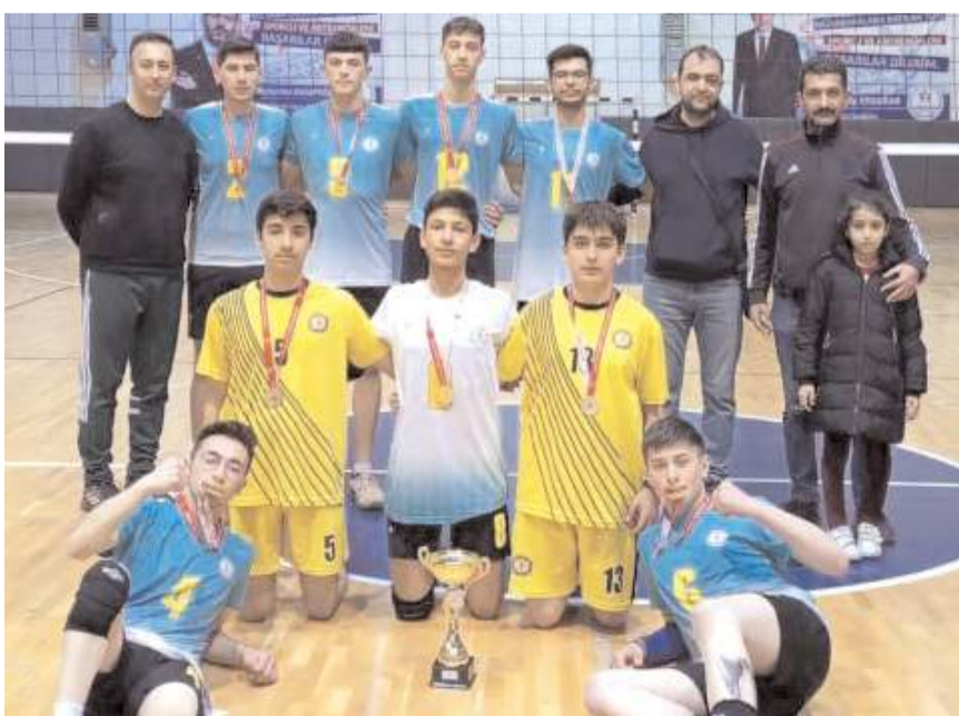
Yıldız erkeklerde şampiyon olan Sungurlu Eğitimspor A takımı kupa töreni sonrasında