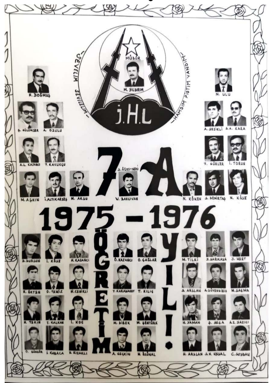
Çorum İmam Hatip Lisesi'nden 1976 yılında mezun 7-A sınıf öğrencileri...