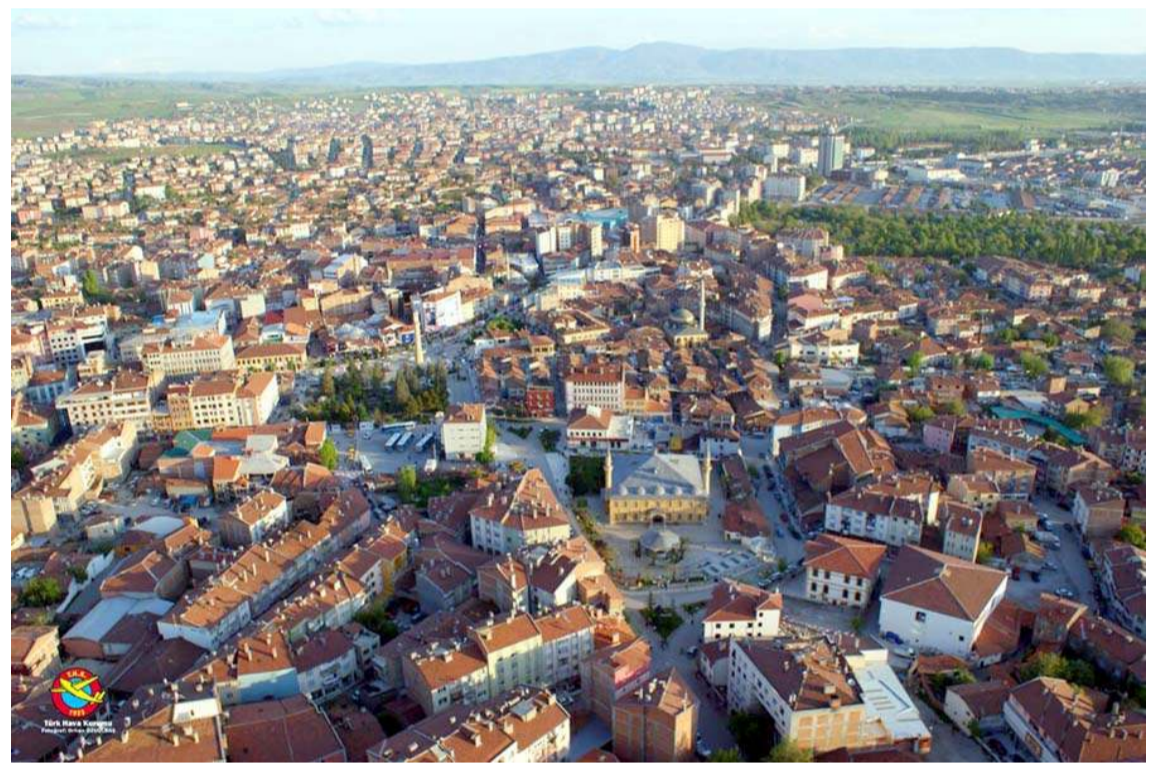
Çorum'da Ağustos ayında kiraların yüzde 8 azaltığı ifade edildi.

termeye başladı. Kiralar nisanda Türkiye genelinde yüzde 18,2'lik aylık değişimle zirve yapmıştı. Ağustos ayı itibarıyla Türkiye genelinde konut satış ve kira fiyatları artış hızı yavaşladı. İstanbul'un bazı ilçeleri ile Anadolu'da 7 kentte ise kiralar yüzde 4 ile 13 arasında düştü. Ağustos ayında düşüş yaşayan kentlerden biri de Antalya oldu. Antalya'da kiralarda yüzde 7, Burdur'da yüzde 4, Çorum'da yüzde 8, İzmir'de yüzde 4, Mardin'de yüzde 8, Sinop'ta yüzde 13, Yalova'da yüzde 7 düştü.