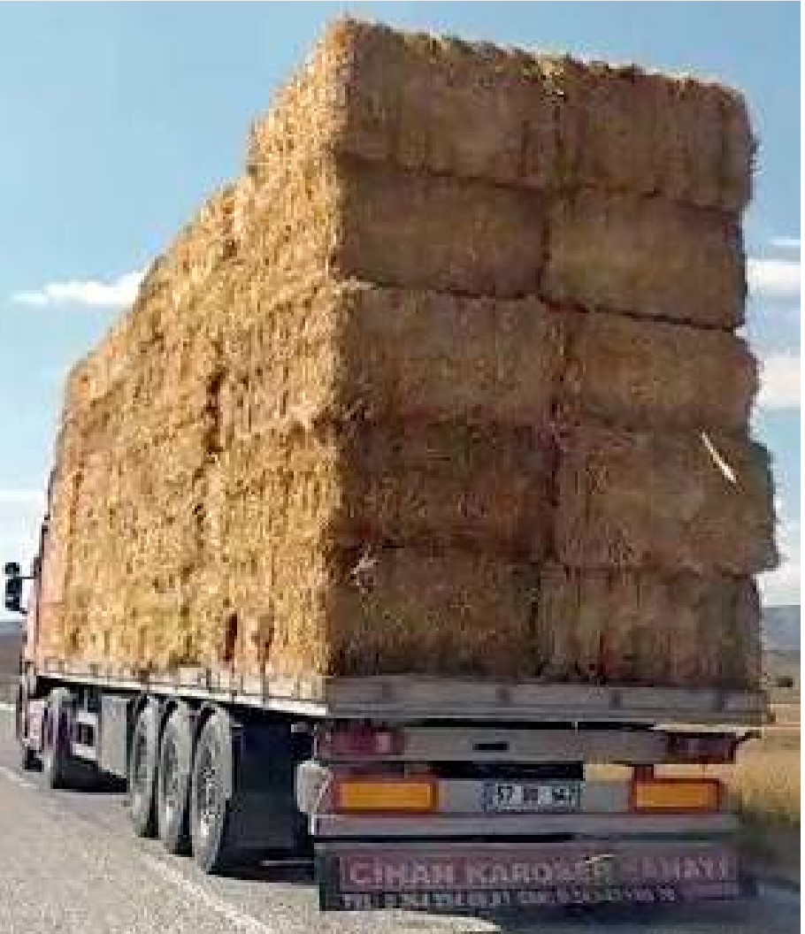
Trafikte güçlükle ilerleyen kamyon, görenleri şaşkına çevirdi.

Trafikte güçlükle ilerleyen kamyon, görenleri şaşkına çevirdi. O anlar karayolunda seyir halinde olan başka araçta bulunan vatandaşın cep telefonu kamerası tarafından görüntülendi. (İHA)