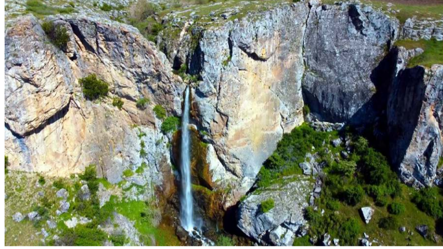
Budakören Şelalesi havadan görüntüldü.