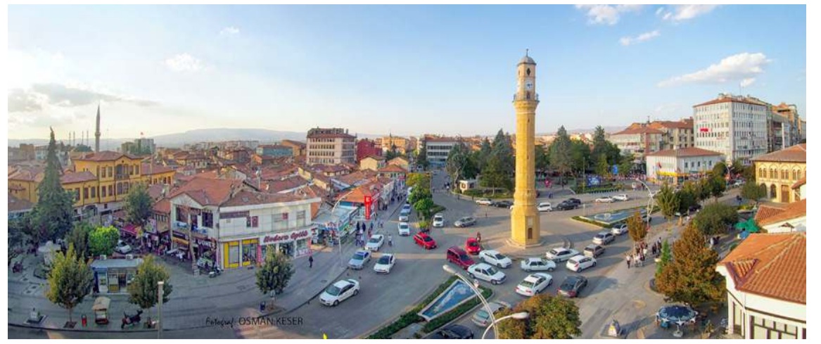
Dünya Gazetesi'nin haberinde Çorum'un Türkiye'de kiraların en fazla düştüğü 3 ilden biri olduğu belirtildi.