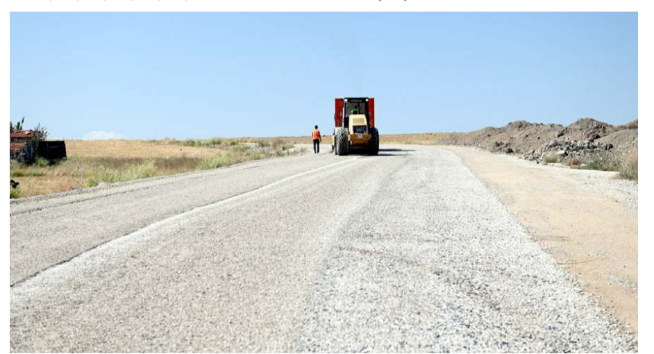
Sokaklarda 2 bin 350 metre uzunluğunda sathi kaplama çalışması yapıldı.