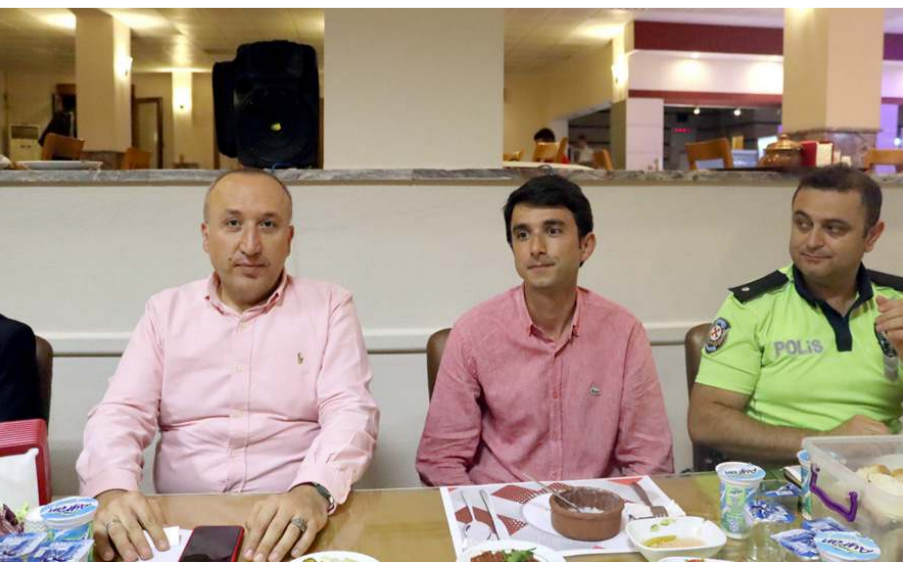
İlçe Emniyet Müdürü ve Bölge Trafik Başkomiseri için veda yemeği düzenlendi.