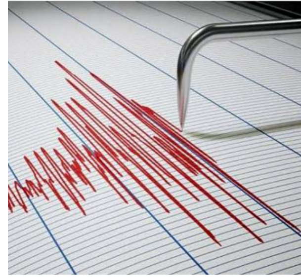
Merkez üssü Çatak Köyü olan saat 09:07'da 4.2 büyüklüğünde deprem kaydedildi.