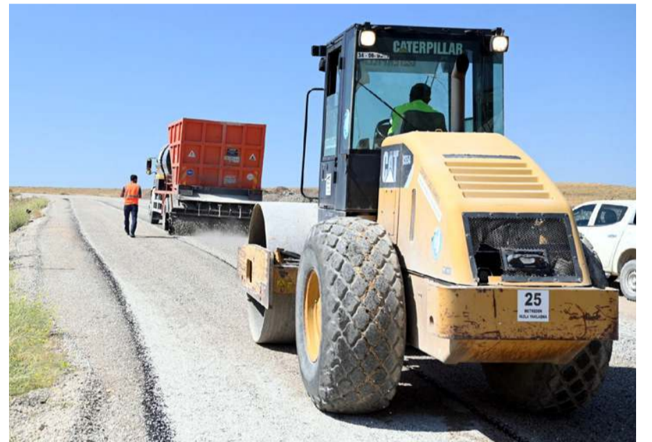
Ata 7, 16, 50, 52, 53, 55, 57 ve 68'inci sokaklarda çalışmalarını tamamladı.