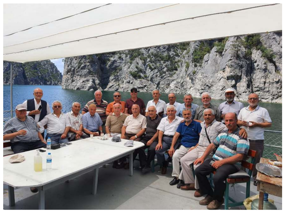
Eski arkadaşlar Şahin Kaya Kanyonunun da tekne turu yaptılar.