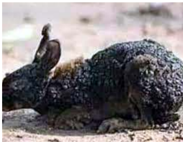
Anız yangınları çok sayıda hayvanın ölmesine neden oluyor.