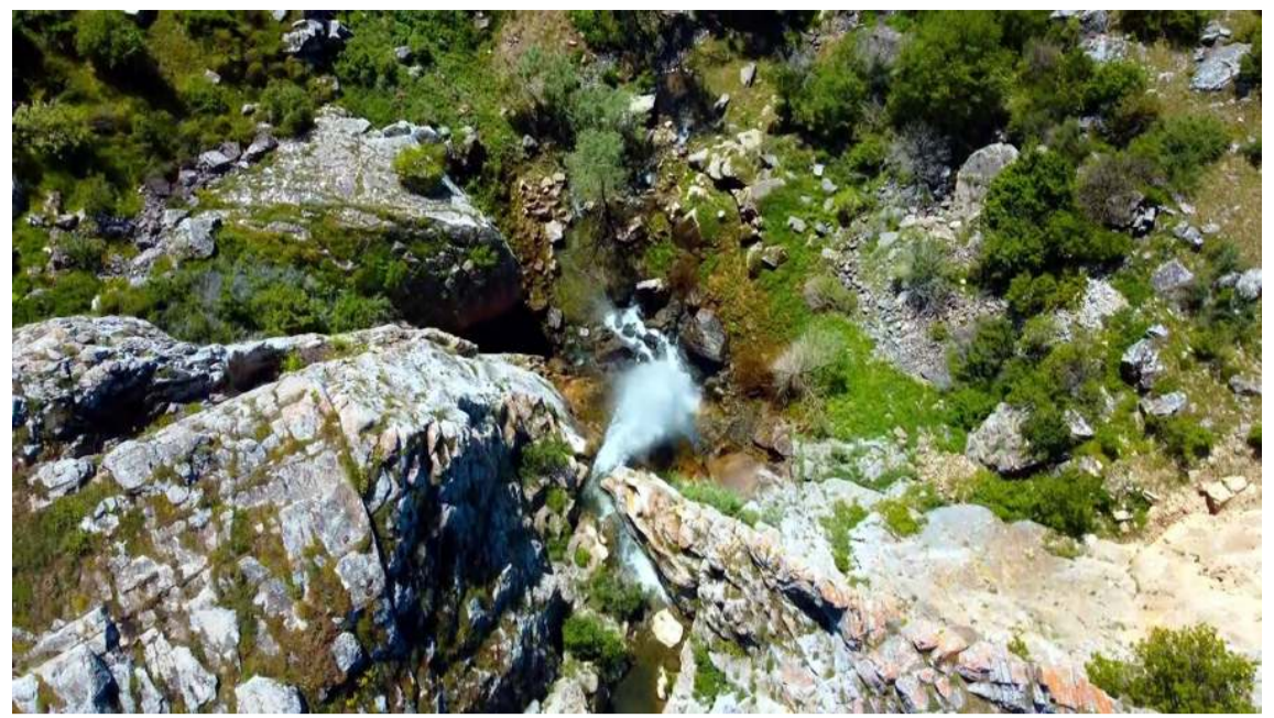
Budakören Şelalesi sarp kayalıklar arasından vadiye dökülüyor.

Resmi İlanlar: www.ilan.gov.tr 'de (Basın: 1675104)