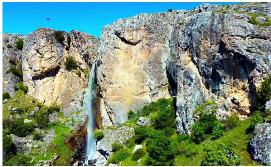
Budakören Şelalesi, temiz doğası ve yeşil görüntüsüyle keşfedilmeyi bekliyor.

Çorum'da güzelliği ile kendisine hayran bırakan ve keşfedilmeyi bekleyen Budakören Şelalesi havadan görüntüldü.