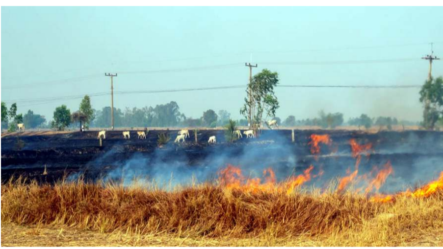
Anız yakılması araziye ve canlılara telafi edilemez boyutlarda zarar veriyor.

sap samandan oluşan namlular balya makinesi ile balyalanarak hayvan yemi olarak veya ahırlarda altlık olarak kullanılabilir veya sanayide kâğıt ve karton yapımında kullanılabilir. Namlu denilen bu sap ve saman tarladan uzaklaştırıldıktan sonra geriye kalan anız sap parçalayıcı makineler ile parçalanarak toprağa karıştırılmalıdır. Bu şekilde bir toprak işleme ile anızın toprağa karıştırılması toprağa birçok fayda sağlar ve anız yakmanın doğuracağı zararlar da önlenmiş olur. 2872 Sayılı Çevre Kanununa göre "Anız yakılması, çayır ve meraların tahribi ve erozyona sebebiyet verecek her türlü faaliyet yasaktır. Çevre ve Şehircilik Bakanlığının 30 Aralık 2021 tarih ve 31705 sayılı Resmi Gazetede yayımlanan 2022/1 No'lu Tebliğin (I) bendinde "Anız yakanlara her dekar için 109,49 lira idari para cezası" verilir. "Anız yakma fiilinin orman ve sulak alanlara bitişik yerler ile meskûn mahallerde işlenmesi durumunda ceza beş kat artırılır." hükmü gereği anız yakma fiilini işleyenler hakkında Çevre, Şehircilik ve İklim Değişikliği İl Müdürlüğü tarafından idari para cezası verilir. Çiftçilerimizin hem kendi hem de ülke menfaatleri açısından bu konuda gerekli hassasiyeti göstermeleri gerekiyor. Tarım alanları gelecek nesillere sağlıklı şekilde bırakılmalıdır. Anız yangınlarına karşı kırsal alanda jandarma (156), polis (155) ve yangın söndürme için ise itfaiye(110) ihbar hatlarını arayınız" ifadelerini kullandı. (Haber Merkezi)