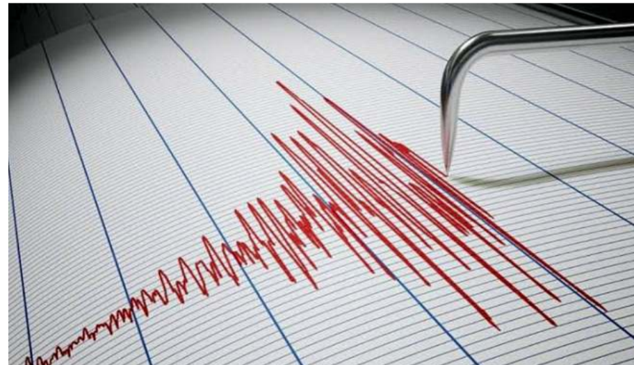
Merkez üssü Çatak Köyü olan saat 09:07'da 4.2 büyüklüğünde deprem kaydedildi.

Depremin, 5 kilometre derinlikte meydana geldiği belirlendi.