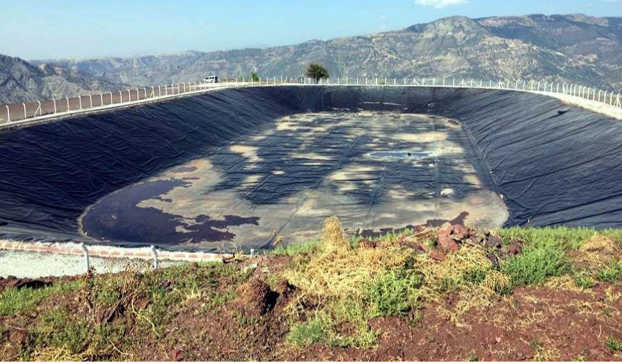
Tarımsal sulama göletine 6 yıldır su verilemiyor.