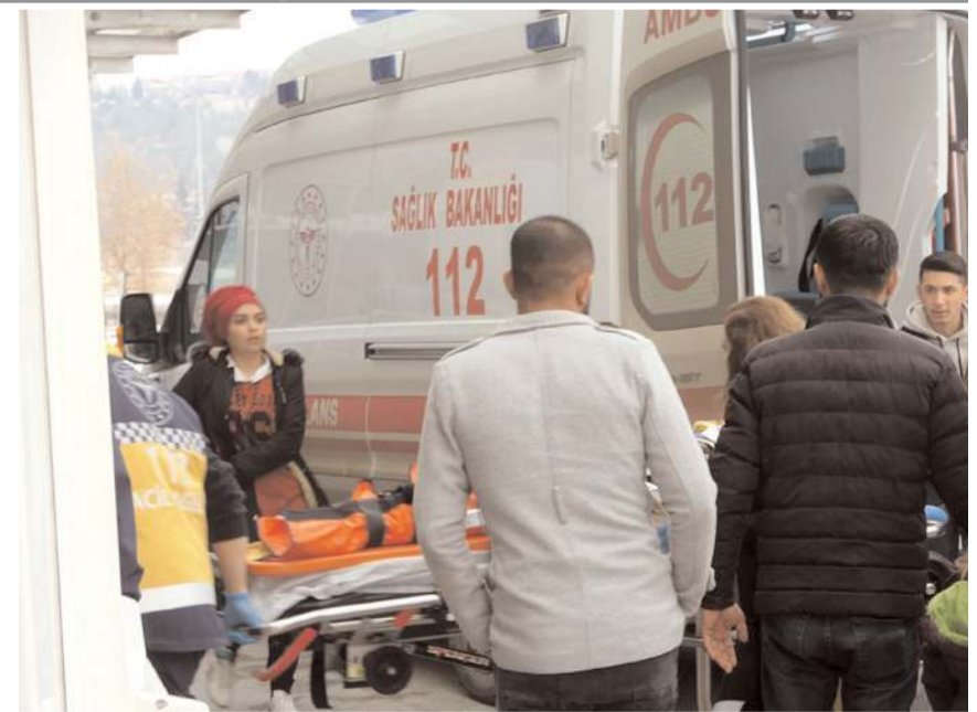
Yaralılar hastanede tedavi altına alındı.

Yaralılar, sağlık ekiplerince olay yerinde yapılan ilk müdahalenin ardından Hitit Üniversitesi Erol Olçok Eğitim ve Araştırma Hastanesi'ne kaldırıldı. (AA)