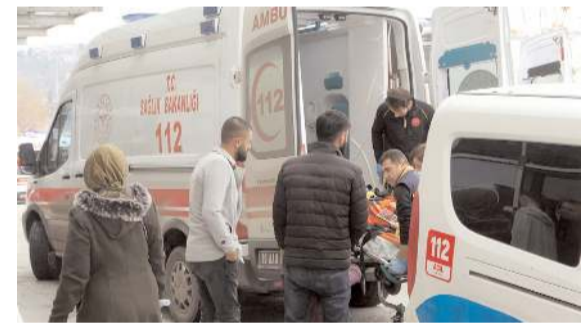
Yaralıları hastanede tedavi altına alındı.