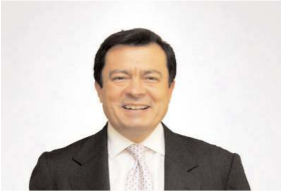
Tarım, Orman, Köyişleri ve Maliye Eski Bakanı Lütfullah Kayalar

Kayalar, ilk olarak saat 11.00'de Çorum Ticaret Borsası'nı, saat 11.30'da Çorum Esnaf ve Sanatkarlar Odaları Birliği'ni, saat 13.00'de Çorum Ticaret ve Sanayi Odası'nı ziyaret ederek meslek kuruluşlarının başkan ve yönetim kurulu üyeleri ile görüşmeler yapacak. Kayalar, ayrıca saat 15.00'de Çorum TSO salonunda eski Anavatan Partisi, Doğru Yol Partisi ve Demokrat Parti kökenli siyasetçiler, sivil toplum kuruluşlarının temsilcileri ve bazı davetlilerin de katılımı ile istişare toplantısı düzenleyerek, gündeme dair açıklamalar yapacak. (Haber Merkezi)