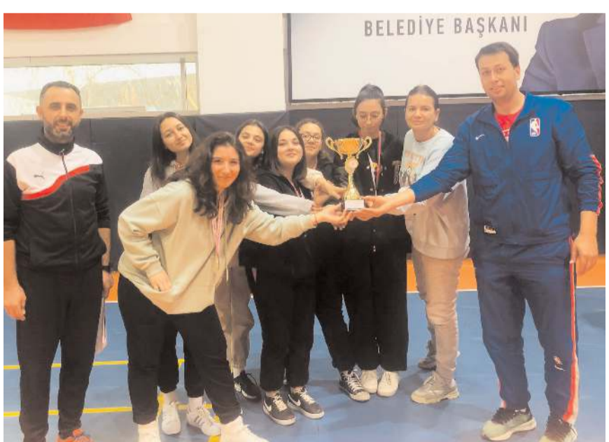
Şampiyon olan Güzel Sanatlar Lisesi okulu kupasını takım olarak aldı

Müsabakalar sonunda düzenlenen törenle ilk dört sırayı alan okullara kupa ve sporculara maddiyaları verildi. Güzel Sanatlar Lisesi Bowling'de erkeklerin ardından kızlarda da şampiyon olarak ilimizi gruplarda temsil etmeye hak kazandı.