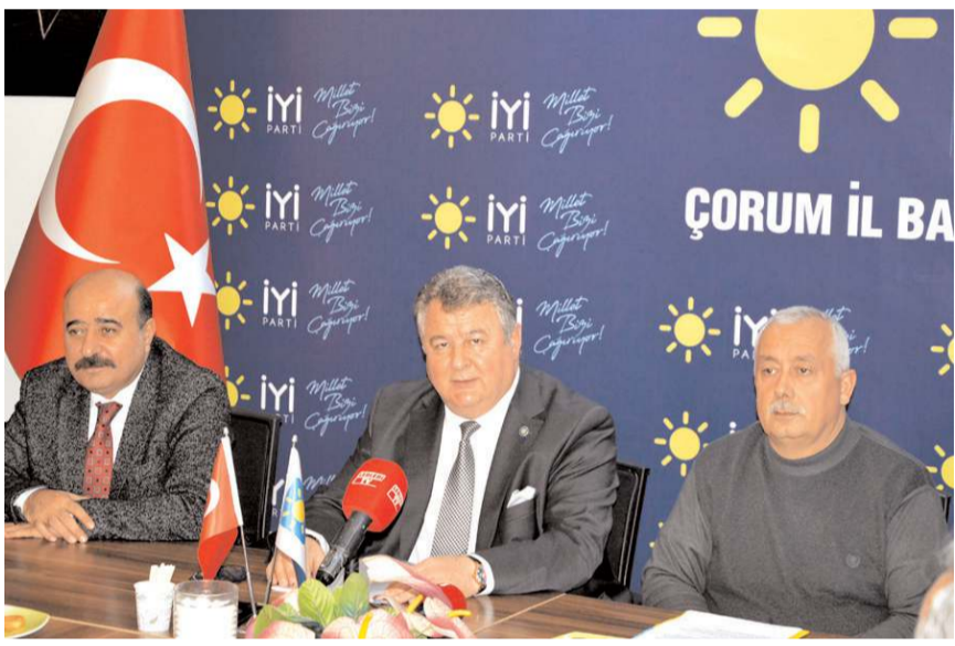
Av. Muhsin Kocasağaç, İYİ Parti binasında partililerinde katılımıyla İl Başkanlığına adaylığını açıkladı.

Partimizde birliğin, beraberliğin ve kardeşlik ruhunun tesisinde elimizden gelen ne varsa yapacağımızın garantisini buradan bu vesile ile bir kez daha veriyoruz. Ben değil. Biz anlayışını partimizde hakim kılacağımıza söz veriyoruz. Dışarıda tek bir arkadaşımızı bile bırakmadan ve partimiz içerisine sokulmak istenilen fitne ve fesada geçit vermeden partimizi ilimizde birinci parti yapmak için gecemizi gündüzümüze katarak çalışacağımıza söz veriyoruz. Yiğit düştüğü yerden kalkar demiş atalarımız. Biz de hem ülkemizi hem de şehrimizi düştüğü yerden kaldırmaya söz veriyoruz."