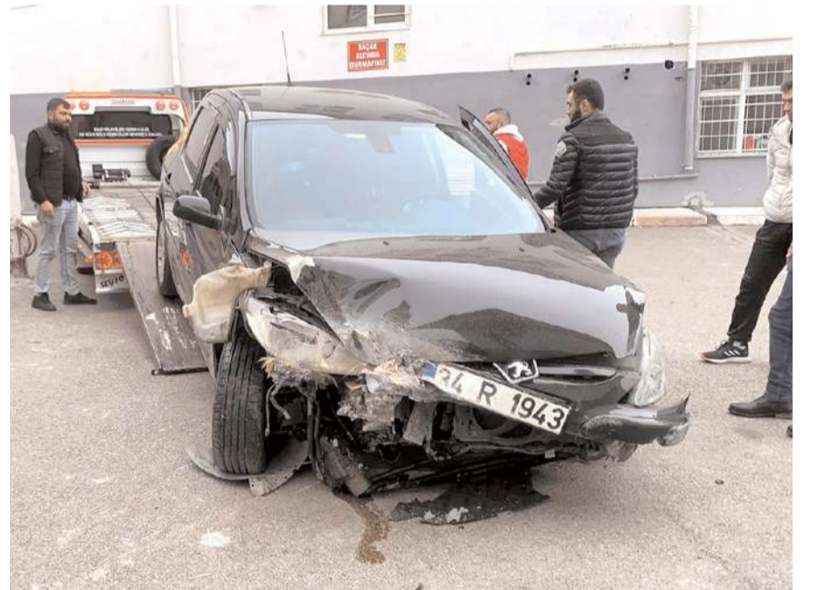
Okulların tatil olması ve okul bahçesinde kimsenin olmaması muhtemel bir faciayı önledi.

Kaza yapan araç çekici yardımıyla okuldan kaldırılırken, olayla ilgili olarak başlatılan soruşturmanın devam ettiği öğrenildi. (İHA)