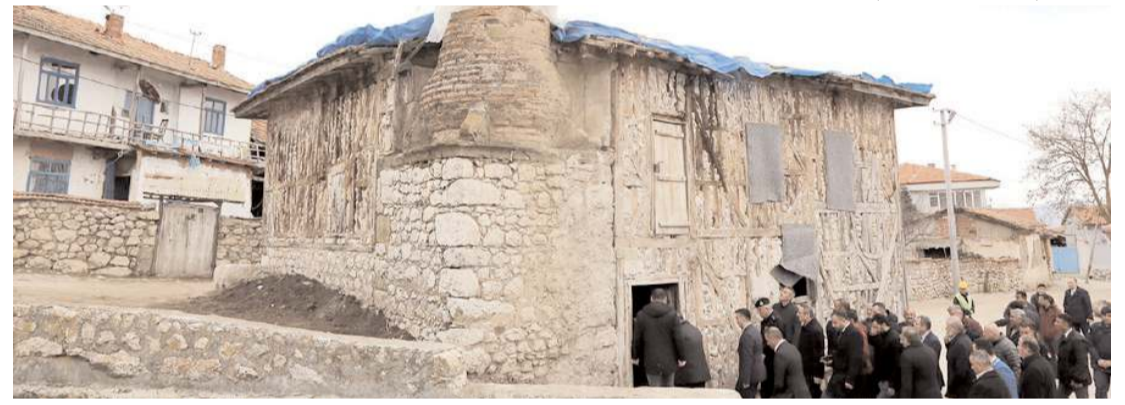
Cami bakımsız olduğu için ibadete kapalı durumda.