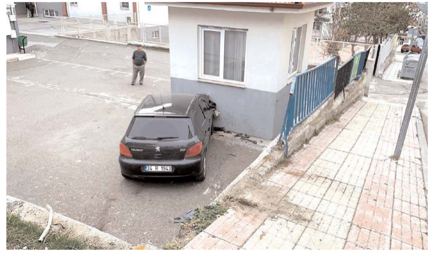
Kazada okul bahçesinin korkulukları ile otomobilde maddi hasar meydana geldi.

Çorum'da kontrolden çıkan otomobil okul bahçesine uçtu. Okulların tatil olması muhtemel bir faciyanın önüne geçti.