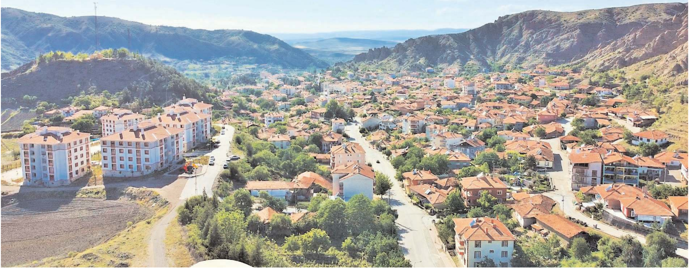
İskilip, Bayat ve Uğurludağ ilçelerini kapsayacak Bölgesel Organize Sanayi kurulması isteniyor.

Doğukan BUĞA / 0542 715 90 19 - 0364 777 08 19 Ulukavak Mah. Çatalhavuz 13. Sk. Yetmiş Apt. No: 3/C ÇORUM