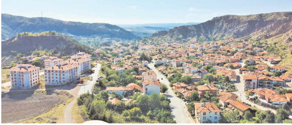
İskilip, Bayat ve Uğurludağ ilçelerini kapsayacak Bölgesel Organize Sanayi kurulması isteniyor.