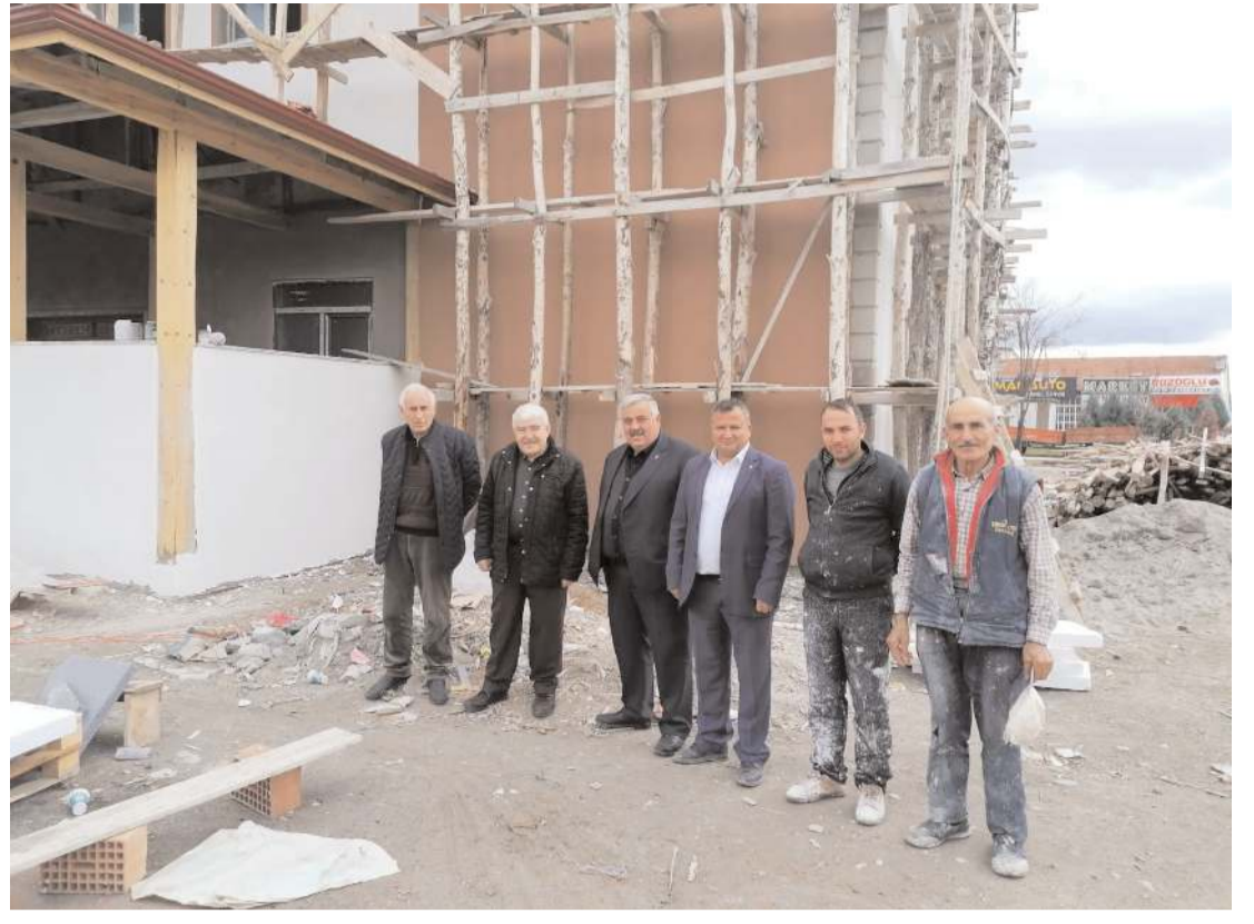
Sanayi Mescidi'nde çalışmalar hızla devam ediyor.