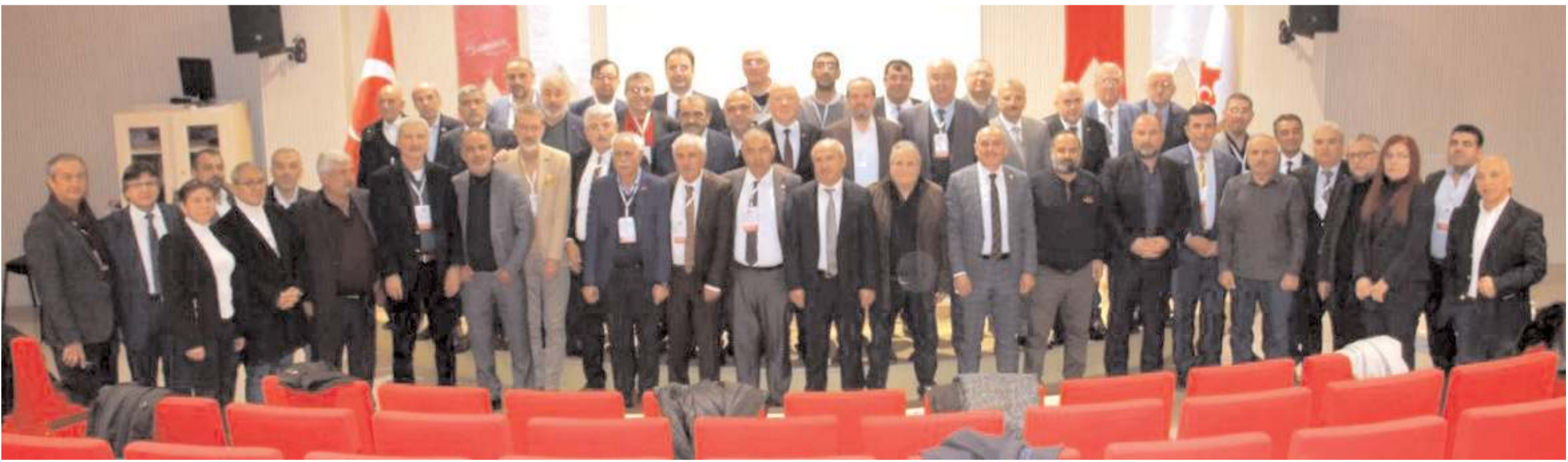
Türkiye Gazeteciler Konfederasyonu'nun 26. Başkanlar Kurulu Toplantısının ardından toplu hatıra fotoğrafı çekildi.

327 kadına iki doz aşı ya da placebo verilerek sonuçlarda kadınların 325'inin hastalığa karşı bağışıklık oluşturduğu tespit edildi. (AA)