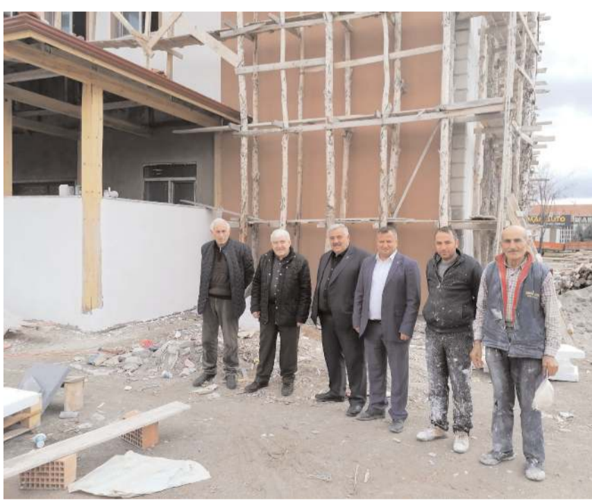
Sanayi Mescidi'nde çalışmalar hızla devam ediyor.

■ Çorum Sanayi Sitesi Cami, Mescit Yaptırma ve Yaşatma Derneği tarafından sanayi sitesinde yaptırılan Sanayi Mescidi'nde çalışmalar hızla devam ediyor. Mescidin 2023 yılında ibadete açılması hedefleniyor.