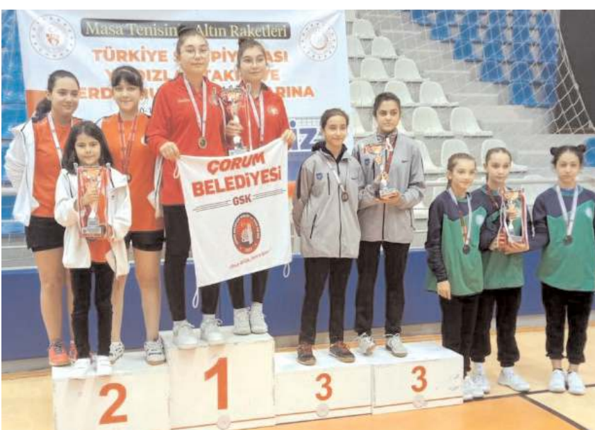
Kızlarda Çorum Belediyesi Gençlikspor birinci Gençlikspor ise ikincilik kürsüsünde