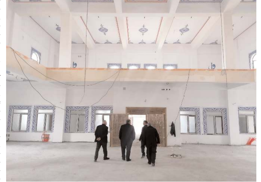
Mescidin içinde kalem işi süslemeler tamamlandı.