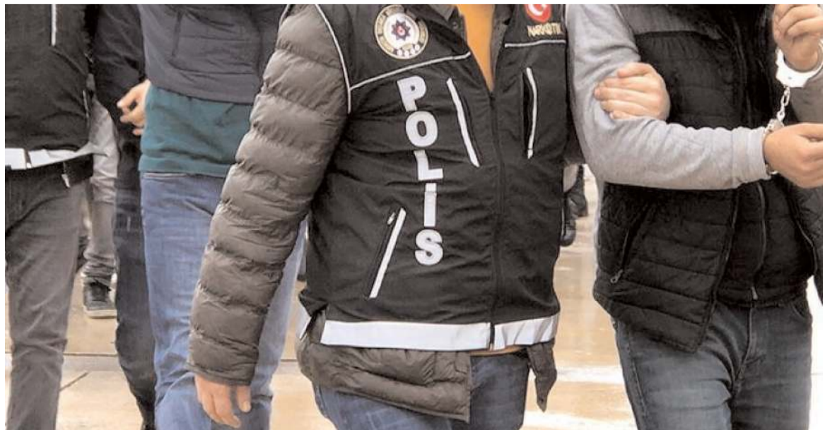
Polis ekipleri 1.568 şahsın GBT kontrolünü yaptı.

Ayrıca 5 adet ruhsatsız tabanca, 2 adet tüfek, 1 adet kesici ve delici alet, 89 adet fişek, 71 adet uyuşturucu-uyarıcı hap ele geçirilirken, 302 araç kontrol edilip 19 araca toplam 40 bin 016 TL idari para cezası uygulandı. (Haber Merkezi)