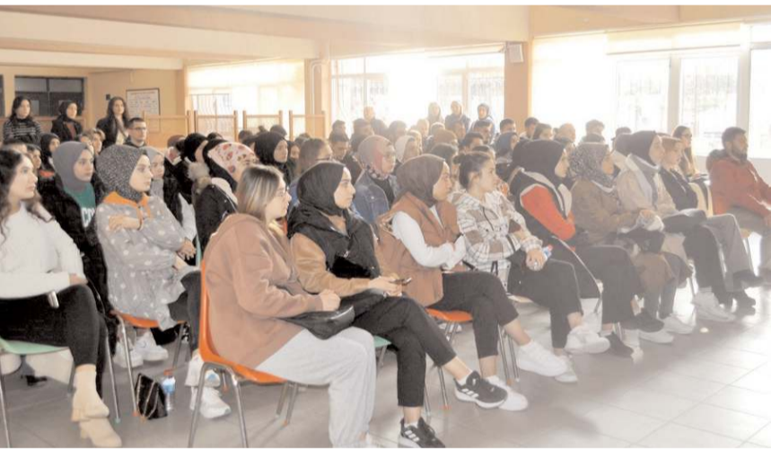
Programa öğrencilerin ilgisi yüksek oldu.