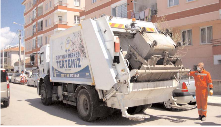
Katı atık yönetim sistemi ile atıkların hem analizi hem de yönetimi daha rahat bir şekilde gerçekleştiriliyor.

"Atık toplamada yakıt, personel ve zaman tasarrufu sağlamak, daha az konteyner ve araç bakım maliyeti sağlamak, personele bağlılıktan kurtulmak, personelin kontrolünü kolaylaştırmak, merkezi kontrol sistemi ile vatandaşın istek ve şikayetlerine hızlı çözüm bulmak, daha az egzoz emisyonu sağlayarak karbon ayak izini azaltmak, Akıllı Şehirler Eylem Planına uyum sağlamak, şehir trafiğinin rahatlamasına katkı sağlamak." (Haber Merkezi)