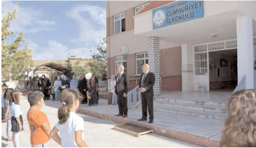
Cumhuriyet İlkokulu'nda tören yapıldı.