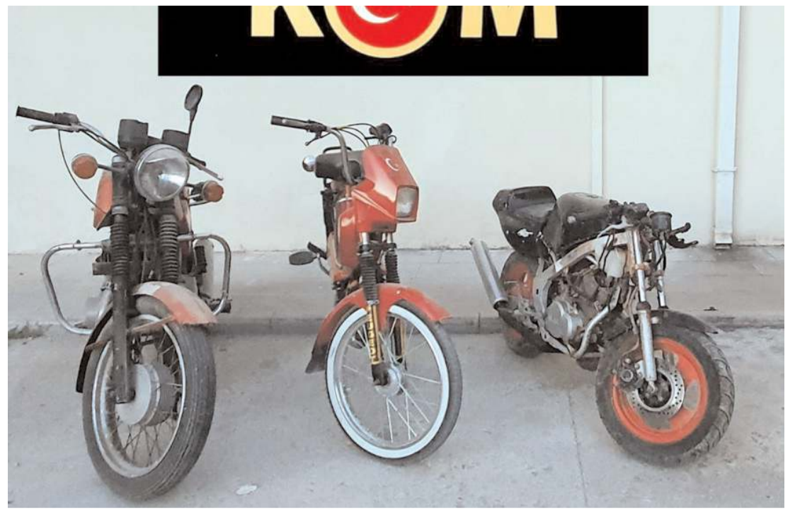
Operasyonda 3 adet gümrük kaçağı motosiklet ele geçirildi.