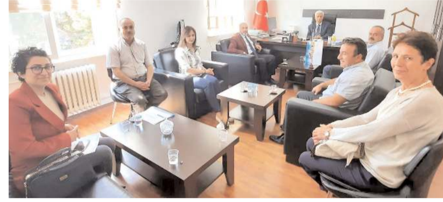
Gençlik ve Spor İl Müdürlüğü faaliyetleri ile Vali Yardımcısına sunum verildi