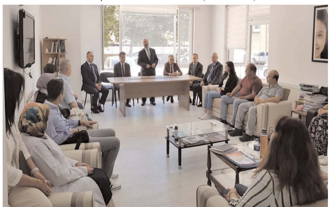
Milletvekili Kavuncu, öğretmenlere başarılı bir yıl diledi.