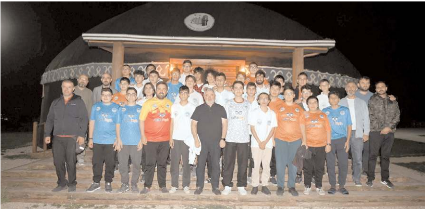
Başkan Aşgın ile misafirler hatıra fotoğrafı çekindiler.