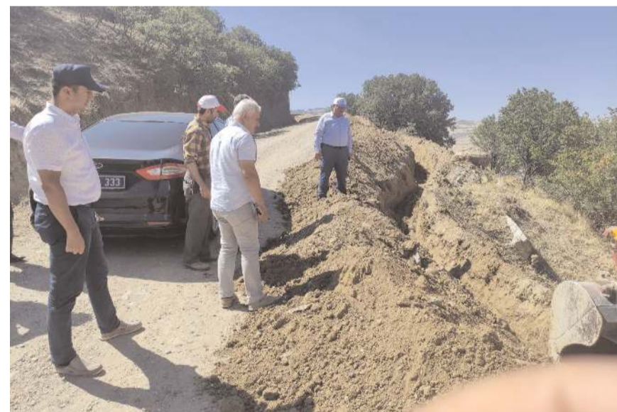
Yeni Mahalle Hilal Sokak, Tepebayat Mahallesi Ömer Mülazım Caddesi'nde ayrıca Yatukcu Mahallesi Çaltı mevkiine şebeke suyu ishale hattı döşeme çalışmaları devam ediyor.