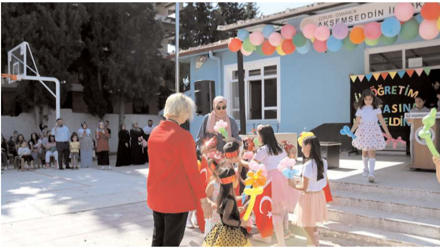
4. sınıf öğrencileri, anasını ve 1. sınıf öğrencilerine 'hoş geldin' diyerek, balonlu çiçekler hediye ettiler.