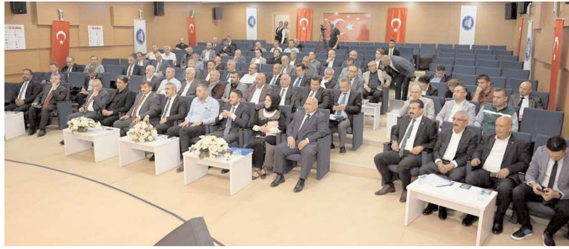
Toplantıya belediye başkanları katıldı.