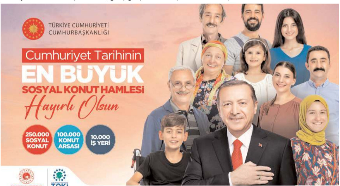
Cumhuriyet tarihinin en büyük sosyal konut projesini Cumhurbaşkanı Recep Tayyip Erdoğan açıkladı.