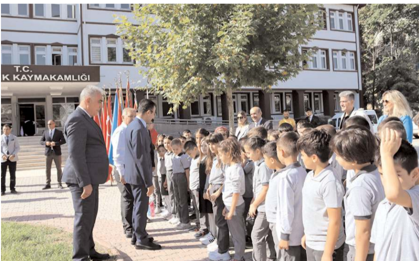
İlköğretim Haftası kutlama programı Hükümet Konağı önünde yapıldı.