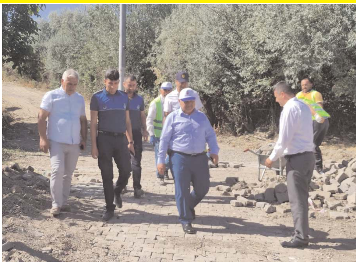
Bayat Belediyesi ilçede yol çalışmalarına devam ediyor.

diyen katil Amerikayı. Başbuğum bu gafillere şöyle haykırıyordu: "Bize yaptıklarınızı gelecek nesiller asla unutmayacak" O, nesil olarak bizler de diyoruz ki "Hem bu dünyada hem de Mahkeme-i Kübra'da davacıyız. İki elimiz yanınızda olacaktır. 42 yıldır ne sizi, ne de yaptıklarınızı unutmamak. O gün Hüseyin'ce ihanete karşı çıktık diye bize 12 Eylülde Kerbelâ'yı yaşattınız. Unuttuğunuz bir şey vardı bin kez Kerbelâ'yı yaşatsanız da biz Hüseyin'ce duruşumuzu bozamayacağız. Herkes bilsin ki; Ülkücü Hareket, dün zulme, işkenceye boyun eğmedi, tehditlere teslim olmadı. Vatan için baş verdi, baş eğmedi. Bugün de merhum Başbuğumuz Alparslan Türkeş'in izinde, bilge liderimiz Dr. Devlet Bahçeli'nin emrinde, genel başkanımızın kılavuzluğunda yürümeye devam edecektir. Unutmayın, biz küresel oyunlara karşı milli duruştan tarafız. Bu vesileyle başta Gazi Mustafa Kemal Atatürk ve silah arkadaşlarını, Başbuğumuz Alparslan Türkeş'i, ülkücü şehitlerimizi rahmetle anıyorum. Bu vatan için canlarını feda eden tüm şehitlerimize yüce Allah'tan rahmet diliyorum. Ruhları şad, mekânları cennet olsun" ifadelerini kullandı. (Haber Merkezi)