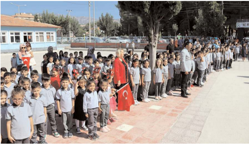
Akşemseddin İlkokulunda tören yapıldı.

Silah, motosik ve mühimmatlara el koyan polis ekipleri, ikamet sahibini de gözaltına alırken zanlıın adli işlemlerin devam ettiği bildirildi. (İHA)