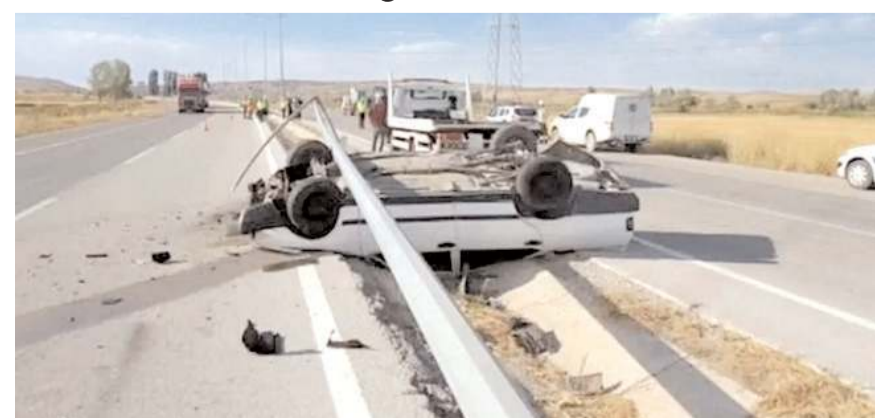
Kaza Alaca Sanayi Sitesi Kavşağı yakınlarında meydana geldi.

Yaralılar, 112 Acil Servis ekiplerince Alaca Devlet Hastanesi'ne kaldırıldı.