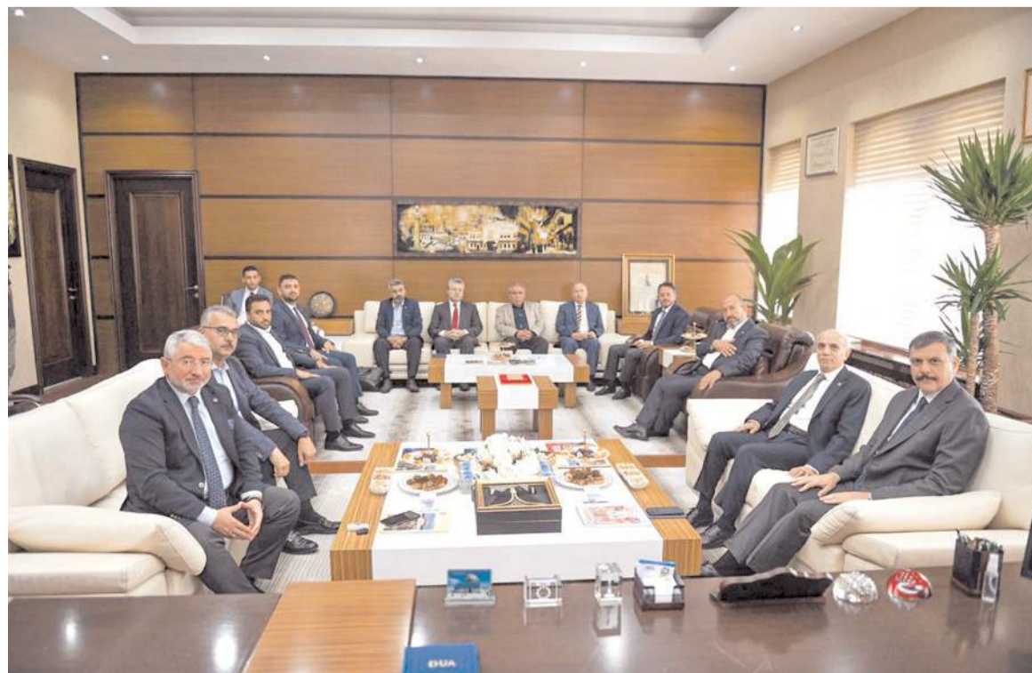
Ziyarete DSİ yatırımları hakkında istişarede bulunuldu.