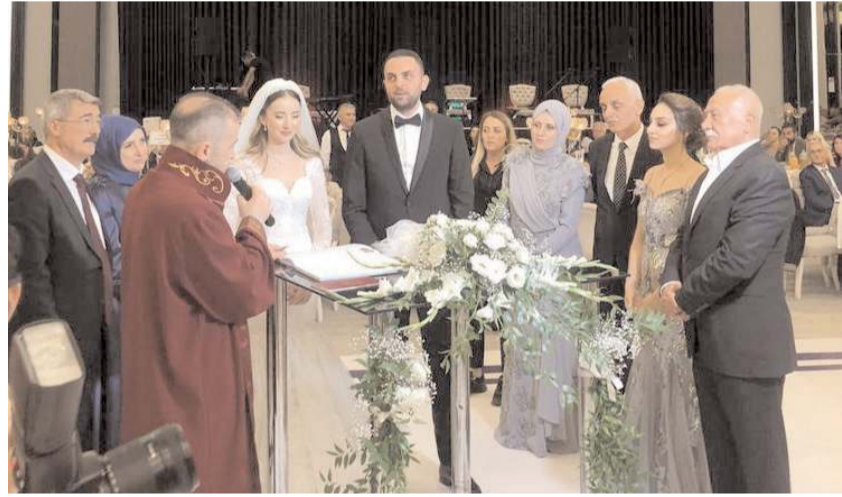
Düğüne çok sayıda davetli katıldı.