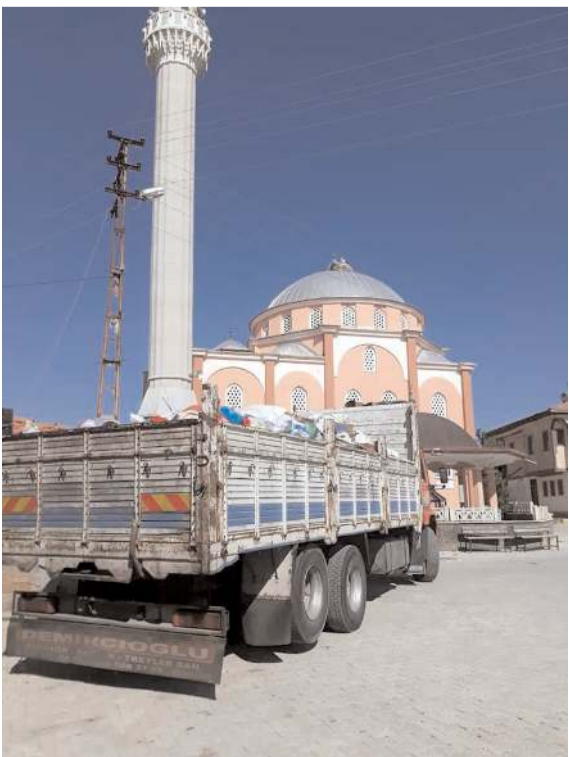
Atıklar hurdacıya satılarak, elde edilen 2 bin 500 liralık gelir, köy camisine bağışlandı.

Köy sakinleri devam eden kampanya için, "Köyümüzün çevresi temizlendiği gibi, atıklar ekonomik olarak tekrar kazanıldı. Üyük Köyü çevresini temiz tutmanın yanı sıra doğayı kirletmemek konusunda da örnek olmayı sürdüreceğiz" diyerek kampanyaya olan destek ve memnuniyetlerini dile getirdi.