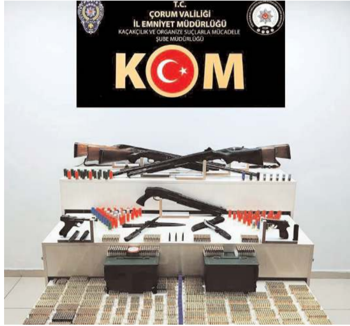
Operasyonda çok sayıda silah ve mühimmat ele geçirildi.

Çorum Emniyet Müdürlüğü Kaçakçılık ve Organize Suçlarla Mücadele Şube Müdürlüğü ekipleri tarafından düzenlenen operasyonda çok sayıda silah ve mühimmat ele geçirildi.