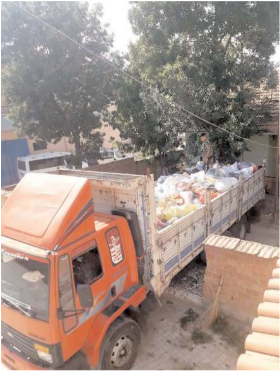
Köylü gençler ve tüm köy halkı, el birliği ile köyün çevresindeki tüm plastik atıkları topladı.

Mansur Geniş'in cenazesi düzenlenen törenin ardından defnedilmek üzere Osmancık'a bağlı Süt-lüce köyüne götürüldü. (IHA)