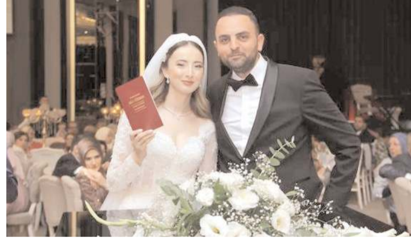
Genç çiftin düğünü önceki gün Yıldızpark Düğün Salonu'nda yapıldı.