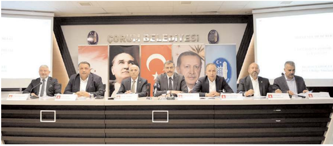
DSİ'nin koordinasyon toplantısında Çorum'da yapılacak yatırımlar hakkında bilgi verildi.