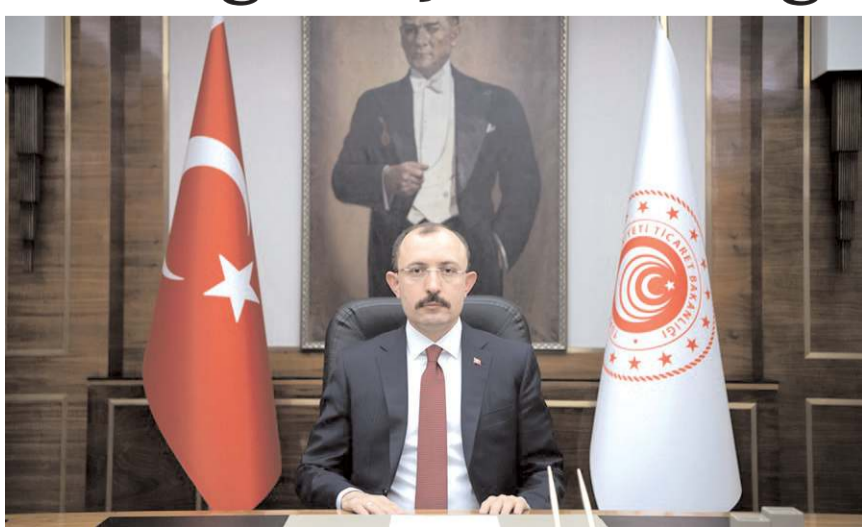
Ticaret Bakanı Mehmet Muş

Ticaret Bakanı Mehmet Muş bir dizi ziyaret ve incelemelerde bulunmak üzere bugün Çorum'a gelecek. Valilik, AK Parti ve Belediyeyi ziyaret edecek olan Bakan Muş,