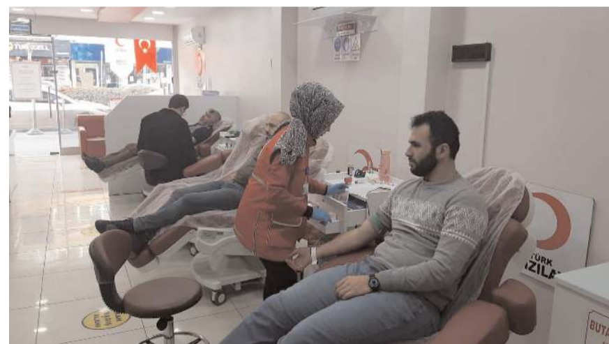
Kan bağışları dün normale döndü.