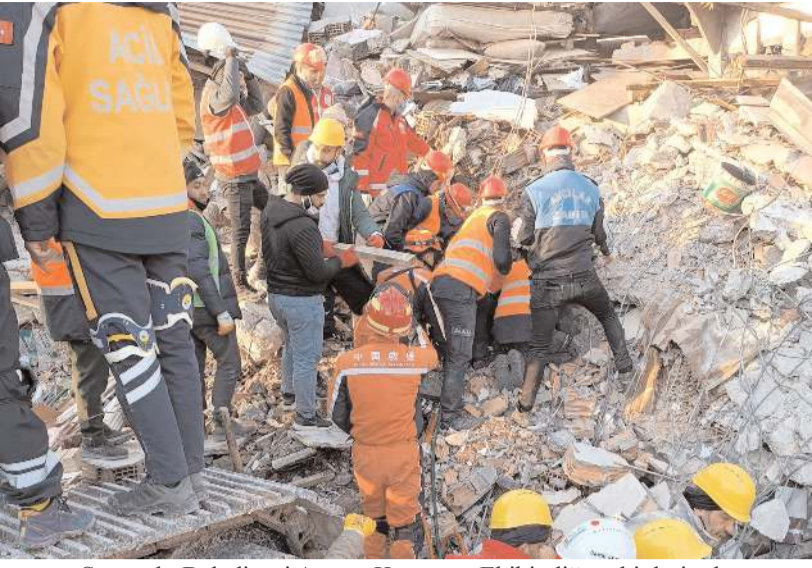
Sungurlu Belediyesi Arama Kurtarma Ekibi, diğer ekiplerin de desteğiyle 1 kişiyi 136 saat sonra enkazdan sağ çıkardı.

'Asrın Felaketi'nin ardından başlatılan arama kurtarma çalışmalarına destek vermek üzere Hatay'a giden Sungurlu Belediyesi Arama Kurtarma Ekibi, diğer ekiplerin de desteğiyle 1 kişiyi 136 saat sonra enkazdan sağ çıkardı.