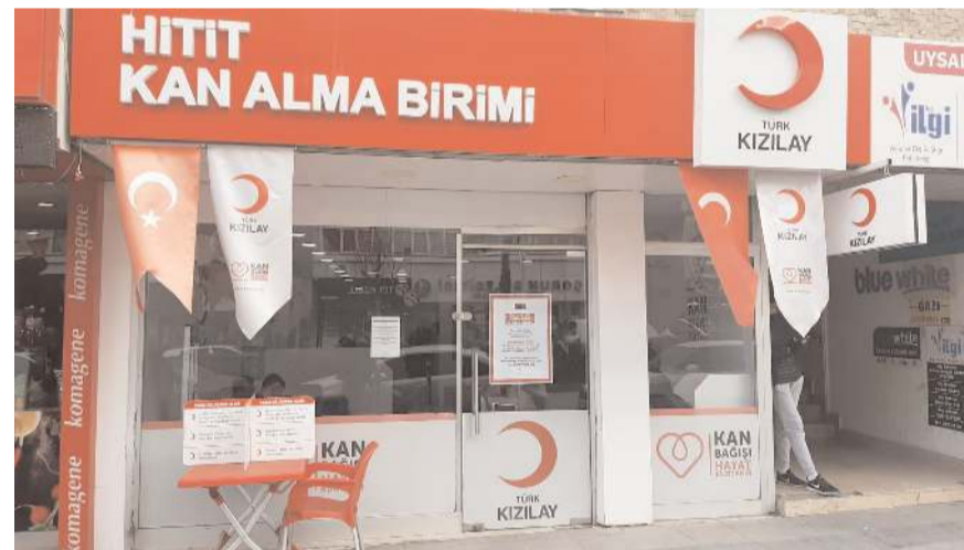
Kızılay kan bağışlarını Hitit Kan Alma Birimi'nde kabul ediyor.

Bağışlanan kanların zayı olmaması için bağışları geçici olarak yavaşlattıklarını hatırlatan Yıldırım, vatandaşların bugünden itibaren Gazi Caddesi'ndeki Kan Alma Merkezi'ne kan bağışında bulunabileceğini kay-