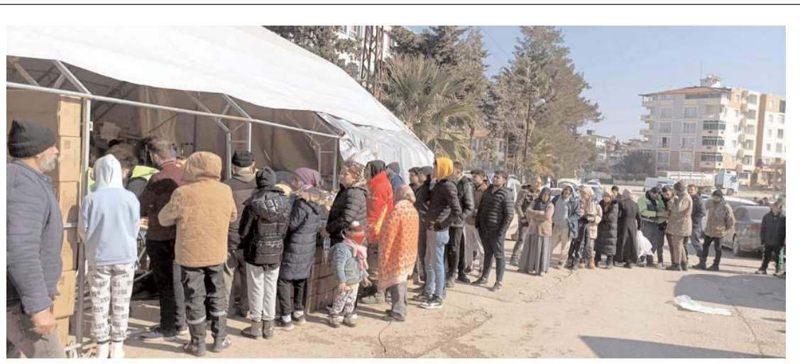
Kaymakamlık, belediyesi, siyasi partiler, odalar, kurumlar, şirketler, muhtarlar, esnaflar ve vatandaşlar depremzedeler için seferber oldu.