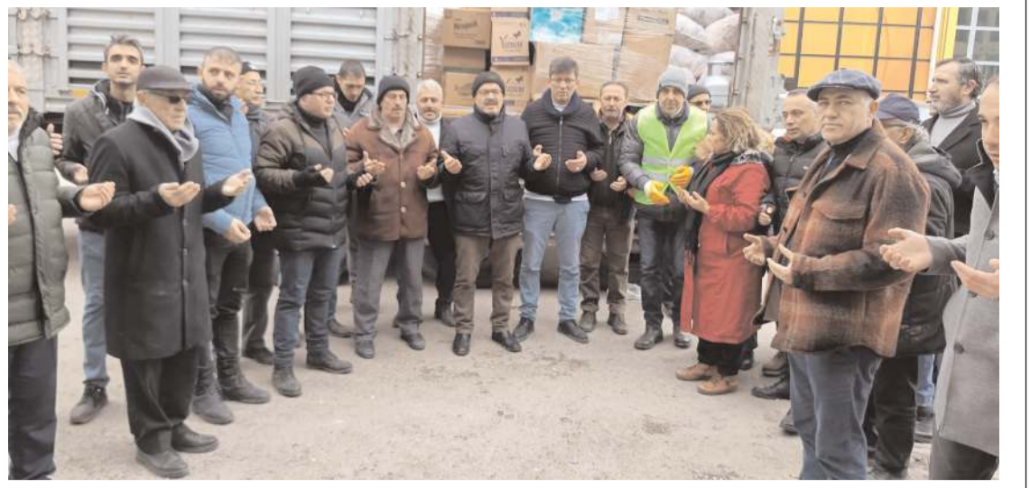
Yardımlar dualarla afet bölgesine gönderildi.