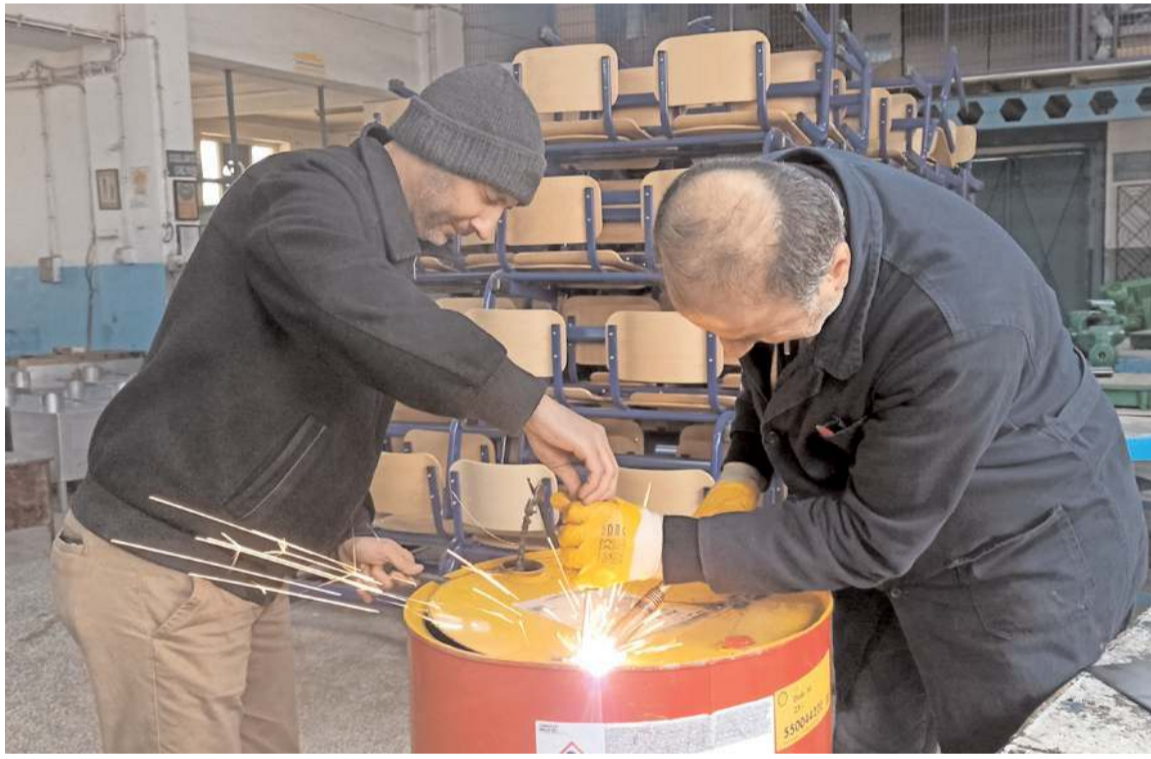
Okulda çadır içi ve çadır dışı kullanımına uygun soba üretimine başlandı.

■ Kahramanmaraş merkezli meydana gelen deprem sonrası tüm Türkiye seferber oldu. Çorum'da Şehit Emin Güner Mesleki ve Teknik Anadolu Lisesi öğretmen ve öğrencileri depremzedeler için çadır içi ve çadır dışı kullanımına uygun soba üretimine başladı. * HABERİ 10'DA