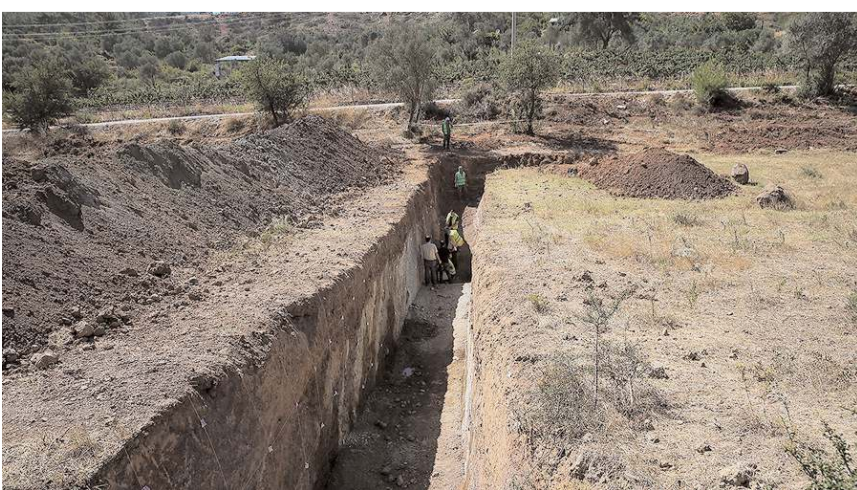
Çorum'da en büyük deprem son olarak 1996 yılında meydana gelmişti.