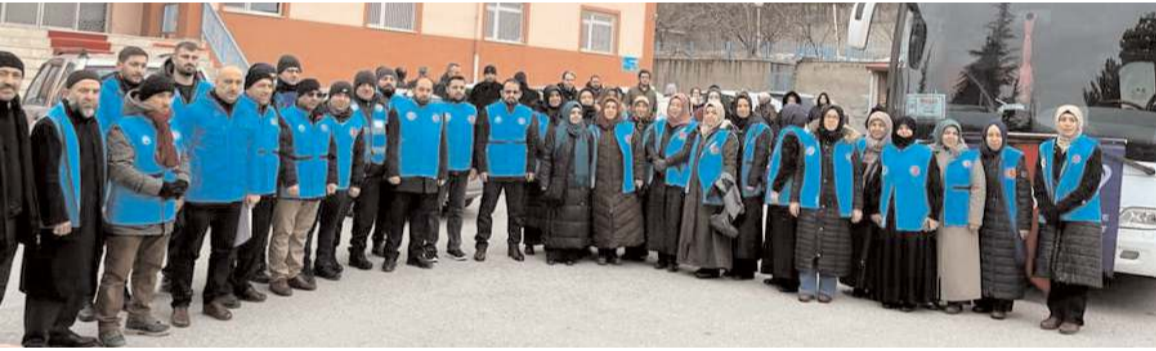
Çorum Müftülüğü'nün 35 kişilik manevi rehber ekibi, afet bölgesine gitti.