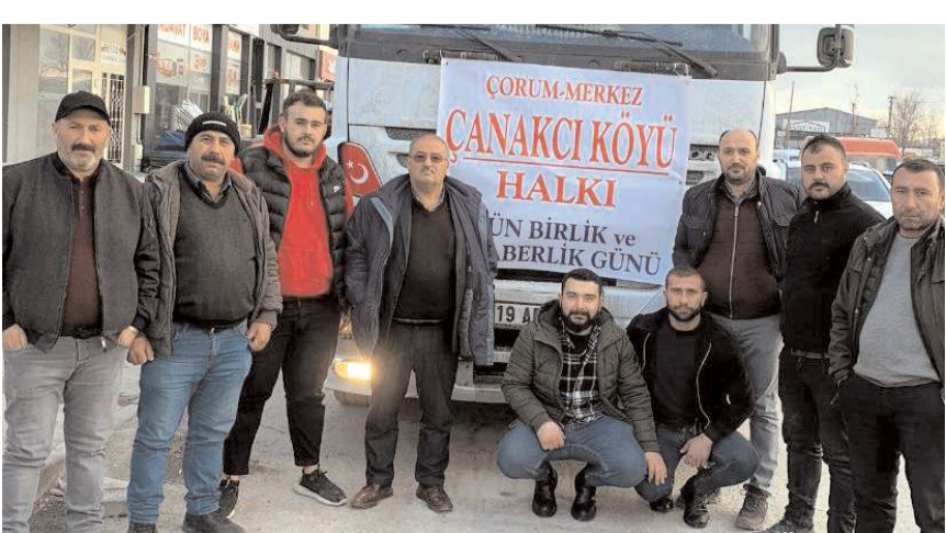
Yardımları deprem bölgesine gönderildi.

Kahramanmaraş merkezli 10 ilimizi etkileyen ve binlerce vatandaşımızın ölümüne ve yaralanmasına neden olan depremin tüm Türk halkını üzdüğü gibi kendilerini de derinden üzdüğünü belirten Yasaçık ve Yiğitoğlu, "Gün birlik, beraberlik ve dayanışma günüdür. Yüce Allah ülkemize bir daha böyle acılar yaşatmasın. Malzemelerin toplanılması ve tıra yüklenmesinde emeği ve katkısı olan tüm köy sakinlerine teşekkür ederiz" dediler. (Haber Merkezi)