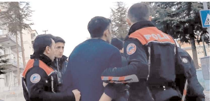
Polis ekipleri şüphelileri gözaltına aldı.

Polis ekipleri, kavga eden grubu biber gazı kullanarak ayırdı.