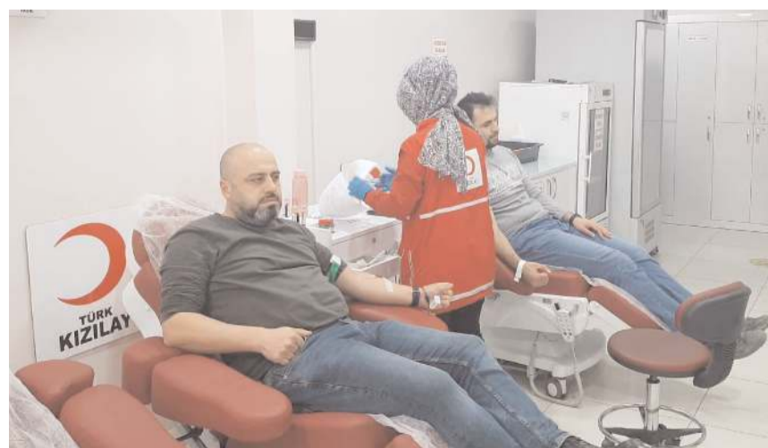
Bir süre kan bağıışlarının yavaşlatılmasının ardından dün yeniden hız verildi.

■ Türk Kızılayı kan alma birimlerinde bir süre önce yavaşlatılan kan bağıışı alımları dün yeniden normale döndü. * HABERİ 2'DE