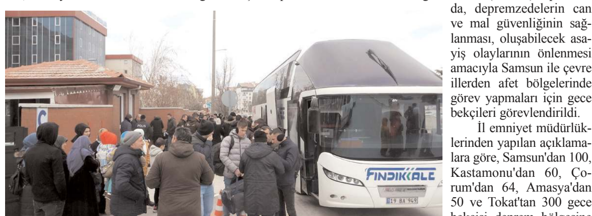
Gece bekçileri İl Emniyet Müdürlüğü önünden uğurlandı.

İl emniyet müdürlüklerinden yapılan açıklamalara göre, Samsun'dan 100, Kastamonu'dan 60, Çorum'dan 64, Amasya'dan 50 ve Tokat'tan 300 gece bekçisi deprem bölgesine sevk edildi.(AA)