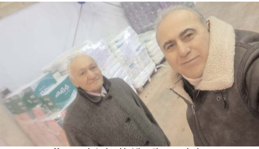
Hayırseverlerin destekleri ile sağlanan yardımlar Vakıf 19 tarafından deprem bölgesine ulaştırıldı.