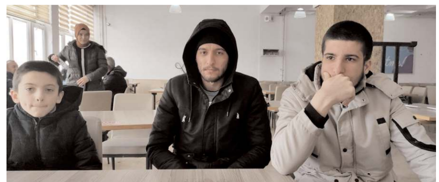
Depremzedeler o gece yaşadıklarını anlattılar.

ülkemize, milletimize geçmiş olsun diyoruz. Hep birlikte bu afetin üzerinden milletçe kalkacağımıza inanıyoruz. Bu zor günlerin üstesinden gelmek içinde çalışıyoruz" diye konuştu.