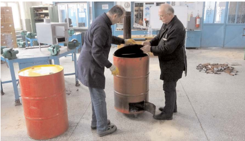
Öğrenci ve öğretmenler gece gündüz demeden mesai yaparken okul atölyelerinde üretilen sobaların en kısa sürede deprem bölgesine ulaştırılması için çalışılıyor.