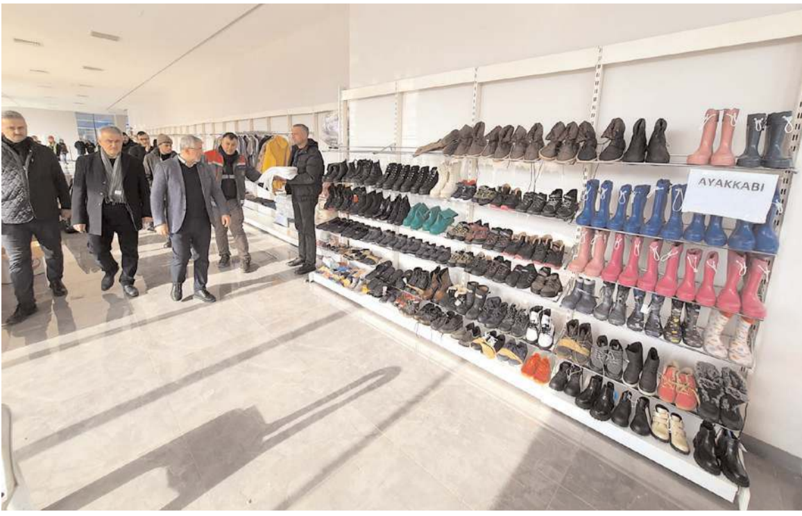
Çorum'a gelen depremzedeler için TSO'da hayır çarşısı açıldı.