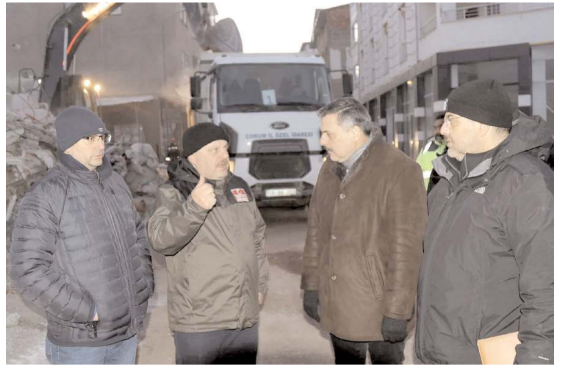
Çorum Valisi Mustafa Çiftçi, enkaz kaldırma çalışmalarını yerinde inceledi.