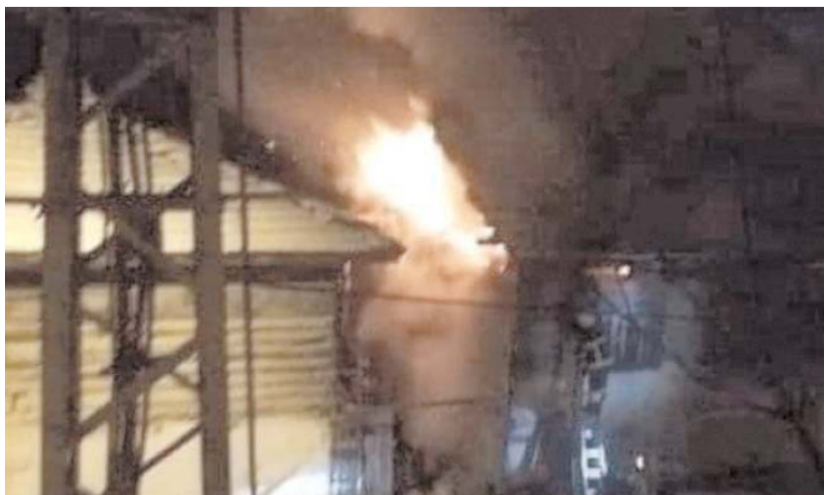
Yangın gece saat 03.30 sıralarında çıktı.

Çıkan yangında Ethem Kafadar'a ait 1 ev tamamen yanarken, can kaybı ve yaralanma olmadı.