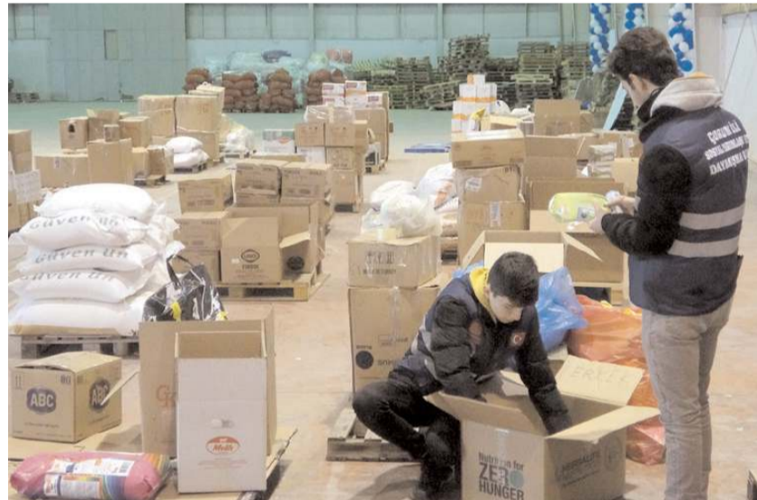
Gelen yardım teasnif ediliyor.