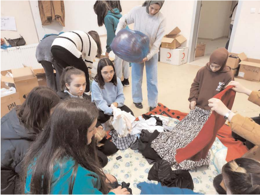
Yardımları gönüllüler tasnif etti.