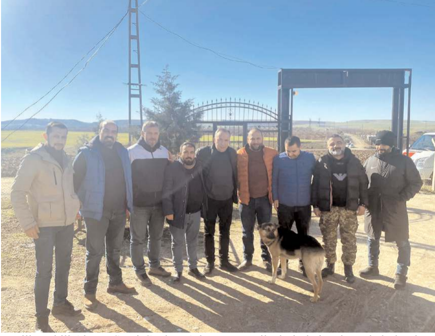
Milletvekili Ahmet Sami Ceylan, Adıyaman ve ilçelerinde incelemede bulundu.

Devletin tüm kurum ve kuruluşları ile milletin yanında olduğunu belirten Milletvekili Ceylan, "Sivil Toplum Kuruluşlarımız (STK'larımız) ve gönüllülerimizde sahada yaraları sarmaya yardıma ihtiyacı olan vatandaşlarımıza ulaşmaya devam ediyorlar. Sahada büyük bir gayret gösteren ve fedakârlıkla koşuşturan askerimiz, polisimiz, doktorlarımız, sağlık personelimiz ve gönüllülerimiz herkes bir derde derman olmak için çalışıyorlar. Allah sizlerden razı olsun. Ülkemizin güzel insanları var oldukça bütün yaralarımızı tez vakitte saracağız inşallah" diye konuştu. (Haber Merkezi)