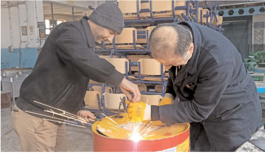
Okulda çadır içi ve çadır dışı kullanımına uygun soba üretimine başlandı.