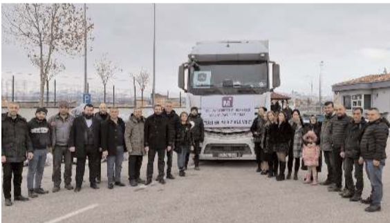
SMMMO'nun yardım tırı deprem bölgesine uğurlandı.