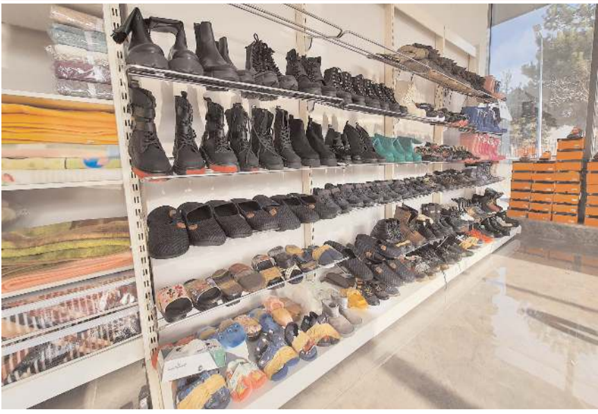
Çorum'a gelen depremzedeler için TSO'da hayır çarşısı açıldı.

■ Kahramanmaraş'ta gerçekleşen ve 10 ilde yıkıma neden olan depremlerin ardından Çorum'a gelen depremzedeler için hayır çarşısı oluşturuldu. 'Haydi Çorum misafirlerimiz var' sloganı ile duyurulan hayır çarşısı için yardımlar TSO fuar alanında toplanıyor. * HABERİ 2'DE