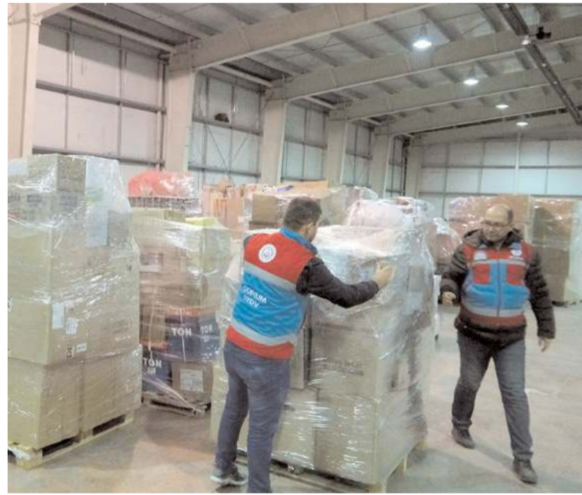
Koliler ise zarar görmemesi için streç filmle kaplanıyor.