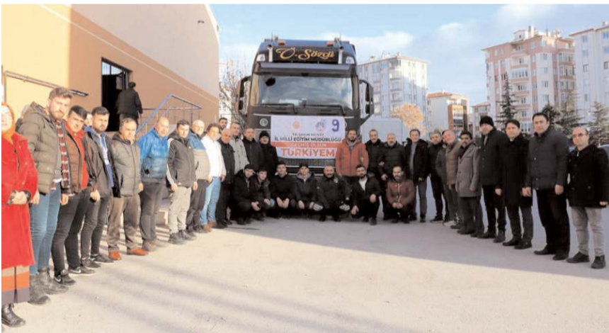
Millî Eğitim Müdürlüğü tarafından başlatılan yardım kampanyasına destek büyük oldu.

"Depremin ilk gününden itibaren MEB AKUB ekiple- rimiz ile deprem bölgesinde depremzedelerimizin hizmetine çıktık. Burada vatandaşlarımızın yapmış oldukları yardımları 9 tır ile birlikte Kahramanmaraş'a gönderdik. Hitit Mesleki ve Teknik Anadolu Lisesi Uygula Otelimiz binlerce ekmeğe gönderdi. Kimi küçük yavrularımız oyuncaklarını yaşıtlarına gönderdi. Şehit Emin Güner Mesleki ve Teknik Anadolu Lisesi