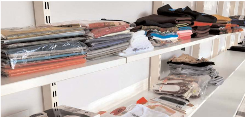
Hayır çarşısına ikinci el giysi kabul edilmiyor.

Valilik, Belediye, AFAD ile Sosyal Yardımlaşma ve Dayanışma Vakfı işbirliğinde açılan hayır çarşısına ikinci el giysilerin kesinlikle kabul edilmeyeceği belirtilerek, afetzedeler için ihtiyaç listesi şöyle sıralandı: Mobilya, beyaz eşya, mutfak eşyası, yatak, baza, battaniye, havlu, çarşaf, iç çamaşır, terlik, bot, mont, atkı, eldiven, eşofman, pijama, çorap."