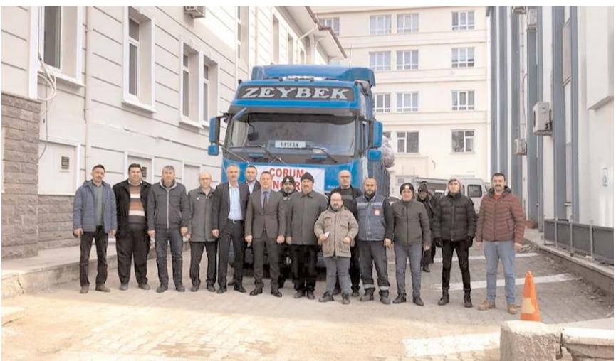
Kampanyada toplanan yardım malzemeleri deprem bölgesine gönderilmek üzere yola çıktı.

'Yardım kampanyası devam edecek' Yardım kampanyasının devam ettiğini söyleyen