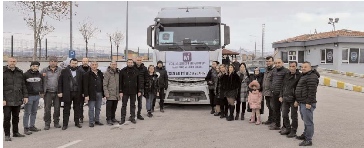
SMMMO'nun yardım tırı deprem bölgesine uğurlandı.