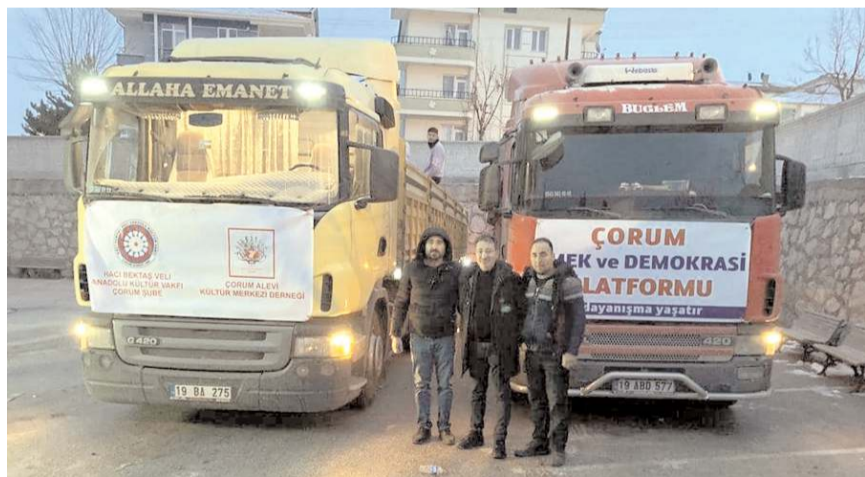
Deprem bölgesine 2 tır daha yardım malzemesi gönderildi.

Çorum Emek ve Demokrasi Platformu'nun başlattığı yardım kampanyası çığ gibi büyüyerek devam ediyor. Yurttaşların omuz omuza yardımlarını 1 tır dolusu yardım malzemesi deprem bölgesine ulaştırılırken, 2 tır daha yola çıktı.