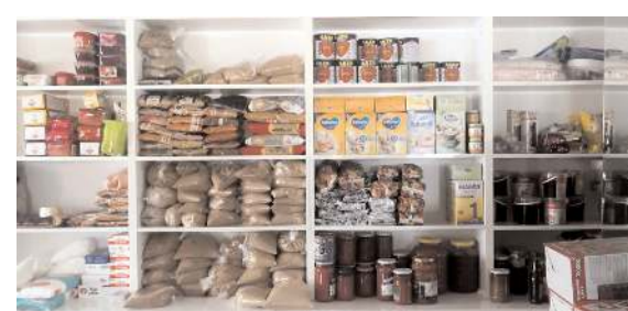
İlçeye gelen depremzedelerin ihtiyaçlarının karşılanması için belediye binası içinde bulunan kadın kültür merkezi mini markete dönüştürüldü.

Buradaki gıda ve giyim eşyaları, depremzedelere veriliyor.(AA)