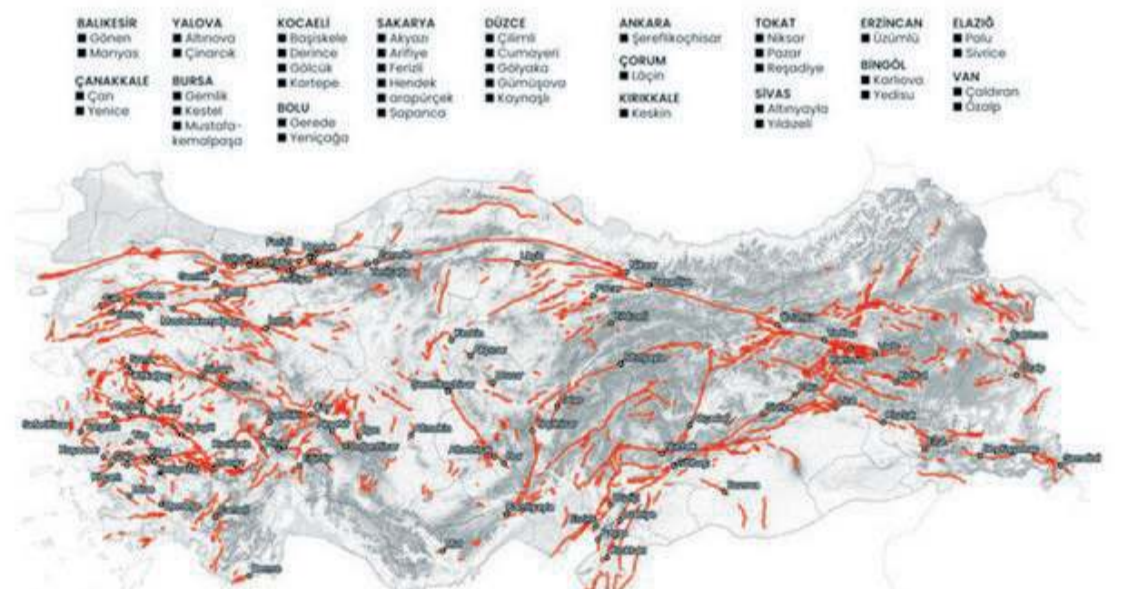
Fay hattı üzerinde toplam 110 ilçe bulunuyor.