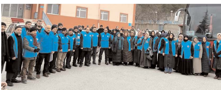
Manevi rehber ekibi İl Müftülüğü önünden afet bölgesine uğurlandı.

■ Çorum Müftülüğü'nün 35 kişilik manevi rehber ekibi, depremzedelere yardım için Afşin'e gitti. * HABERİ 4'DE