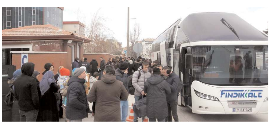
Gece bekçileri İl Emniyet Müdürlüğü önünden uğurlandı.

■ Kahramanmaraş'ta gerçekleşen ve 10 ilde yıkıma neden olan depremlerin ardından Çorum'a gelen depremzedeler için hayır çarşısı oluşturuldu. 'Haydi Çorum misafirlerimiz var' sloganı ile duyurulan hayır çarşısı için yardımlar TSO fuar alanında toplanıyor. * HABERİ 2'DE