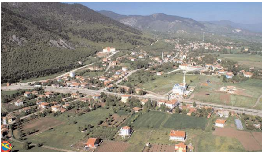
Fay hattı üzerinde bulunan ilçeler arasında Laçın'da yer alıyor.

Depremde, 26.08.1996 günü itibarıyla Amasya iline bağlı köylerde 460 ev ağır, 409 ev orta ve 970 ev hafif ve Çorum iline bağlı köylerde 246 ev ağır, 303 ev orta ve 706 ev hafif derecede hasar gördü.