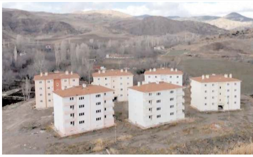
İskilip'te boş durumdaki 48 ev, depremzedelere tahsis edilecek.

Onarım masraflarının Kaymakamlık, Belediye ve hayırseverler tarafından karşılanmak üzere Çorum Valiliğine bilgi verildiğini belirten Sülük, "Afet bölgesinden hafta sonu 10 aile İskilip'e gelecek. Aileleri misafir etmek isteyenler Kaymakamlık ve Belediye