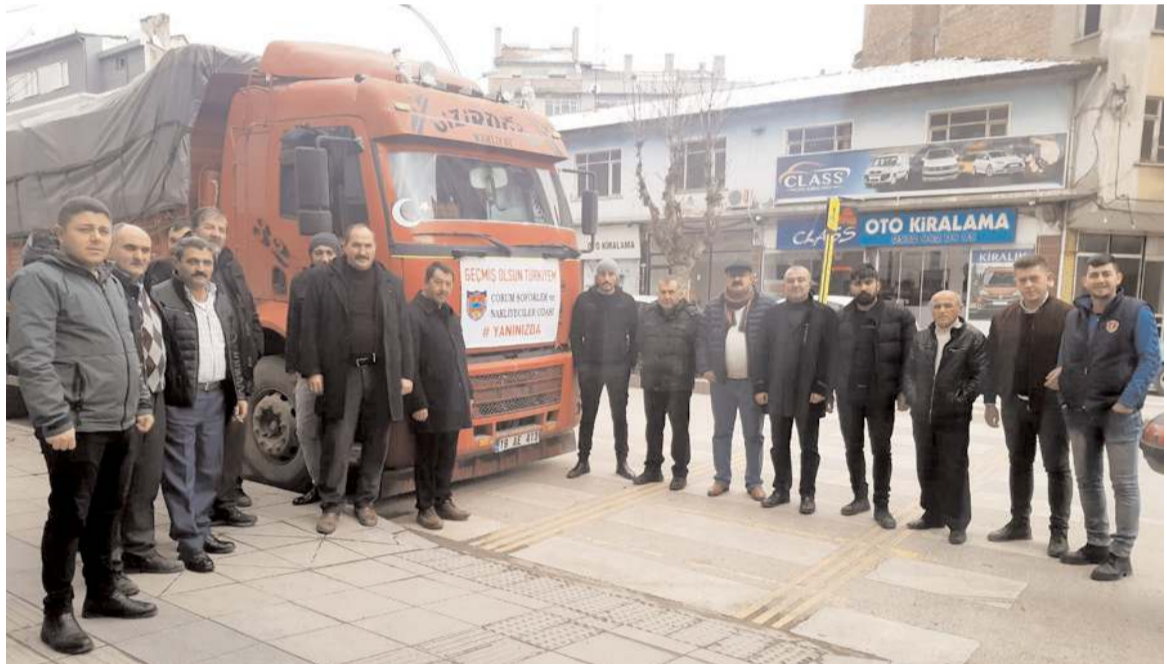
Odun, kömür, giyim ve gıda maddeleri bulunan bir kamyon yardım malzemesi deprem bölgesine gönderildi.