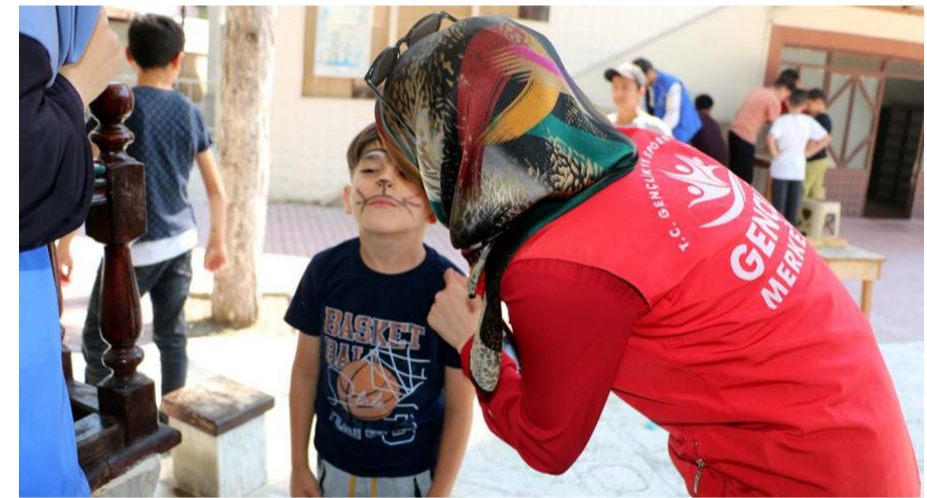
Çocuklara yönelik etkinlikler yapılıyor.