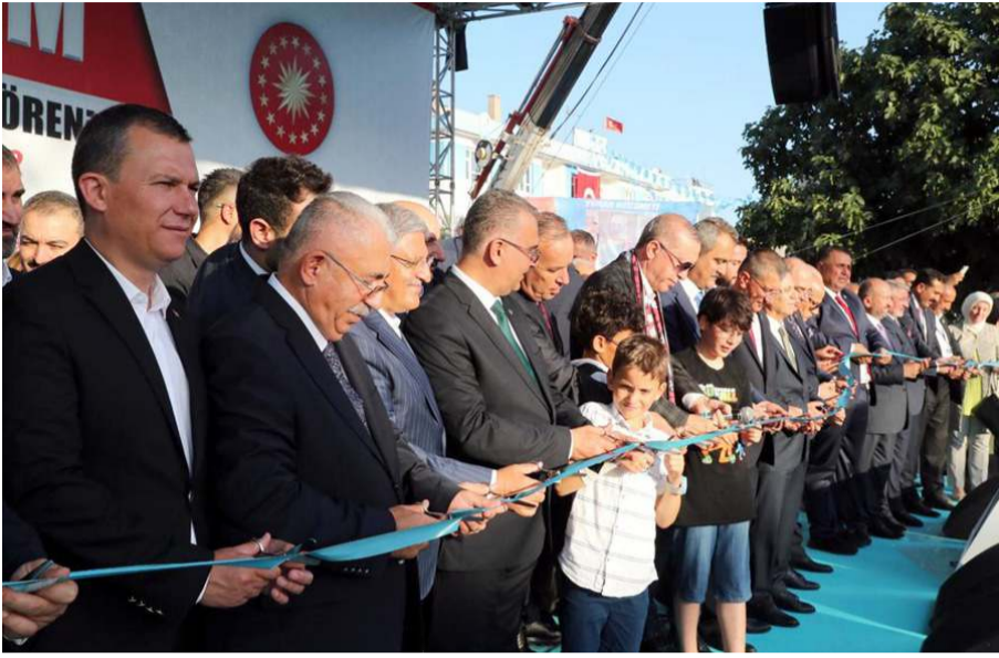
Fabrikaların temelleri telekonferans yoluyla atıldı.