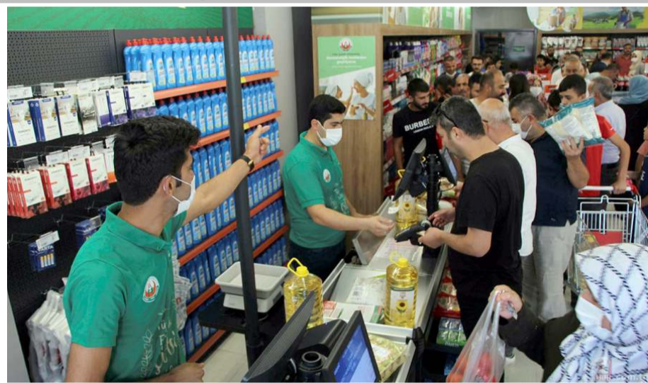
Tarım Kredi Kooperatif Marketleri'nin Çorum'da 11 şubesi bulunuyor.

Kampanya kapsamında 30'un üzerinde temel tüketim ürününde 15 Ağustos 2022 Pazartesi günü itibarıyla indirimli fiyat uygulanmasına geçilecek.