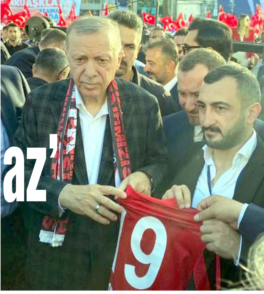
Çorum FK Başkanı Oğuzhan Yalçın, Cumhurbaşkanı Recep Tayyip Erdoğan'a forma verdi

Çorum FK Başkanı Oğuzhan Yalçın, Cumhurbaşkanı Recep Tayyip Erdoğan'a forma hediye etti. Erdoğan 2. ligin Çorum'a yakışmadığını belirterek Başkan Yalçın'dan acil olarak bu takımı üst lige çıkartmasını istedi. Yalçın'da onun için ellerinden gelen çabayı gösterdiklerini söyledi.