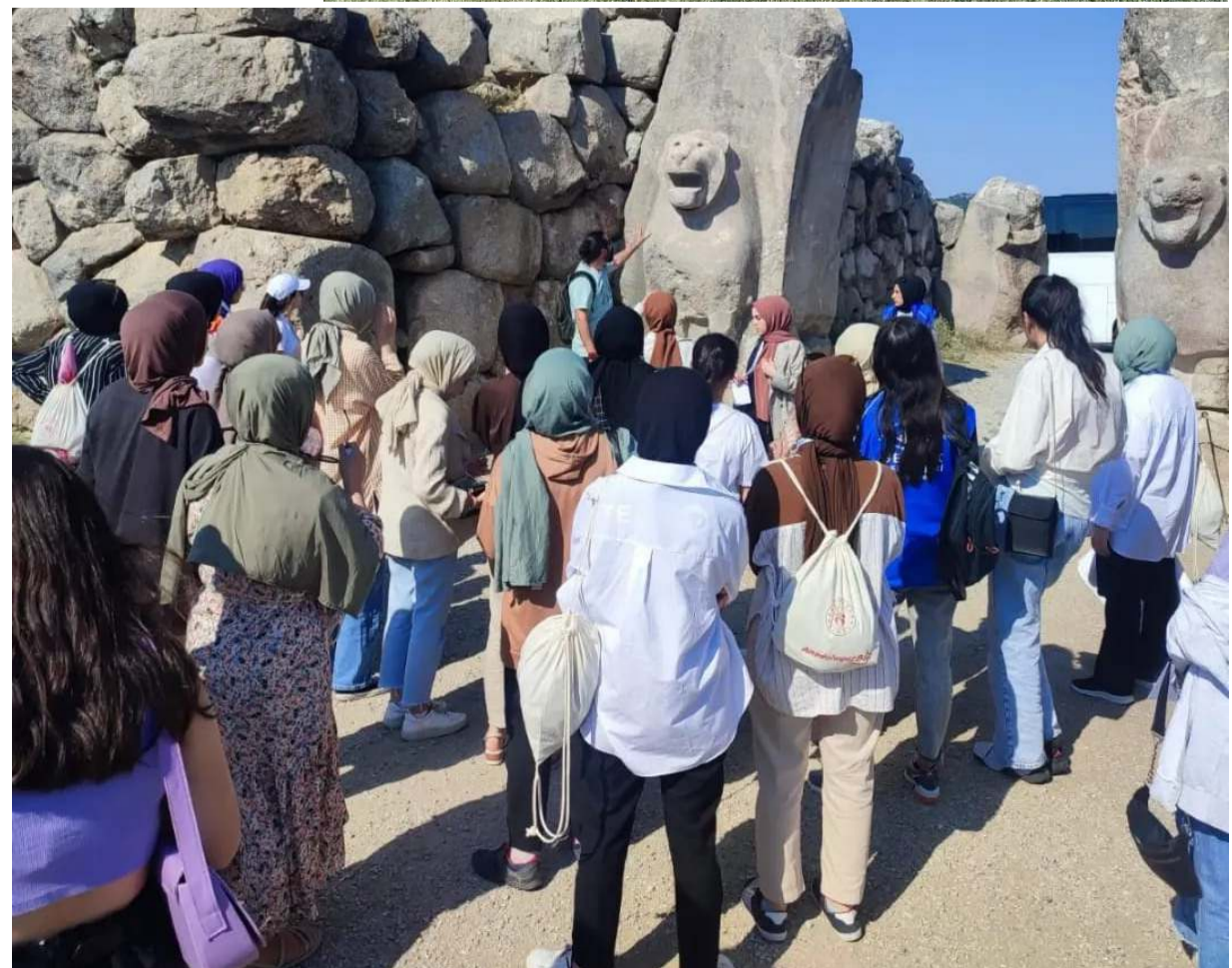
Düzenlenen gezilerle gençlerin tarihi değerleri yerinde görmesi sağlanıyor.