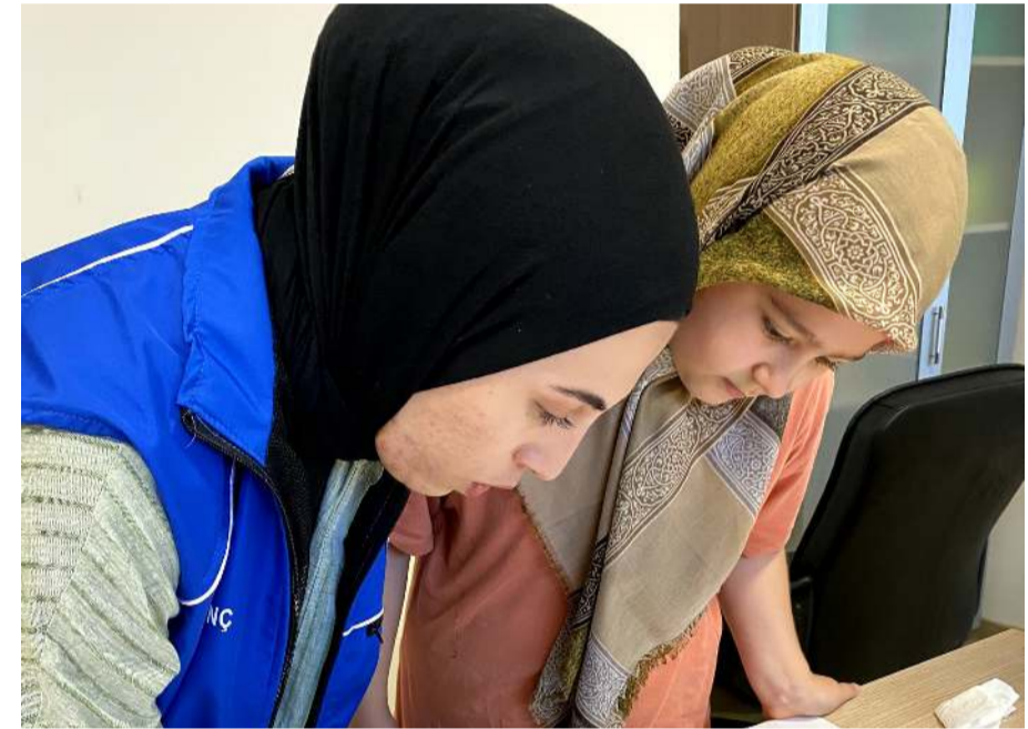
Merkezlerde ebru sanatı kursları açılıyor.