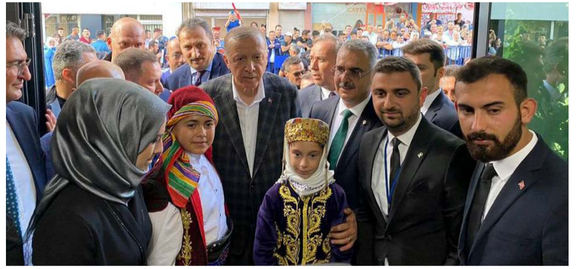
Cumhurbaşkanı Erdoğan, miting ardından AK Parti İl Başkanlığı'ni ziyaret etti.