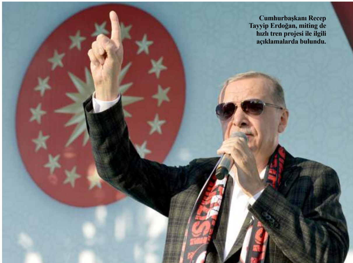
Cumhurbaşkanı Recep Tayyip Erdoğan, mitingde hızlı tren projesi ile ilgili açıklamalarda bulundu.