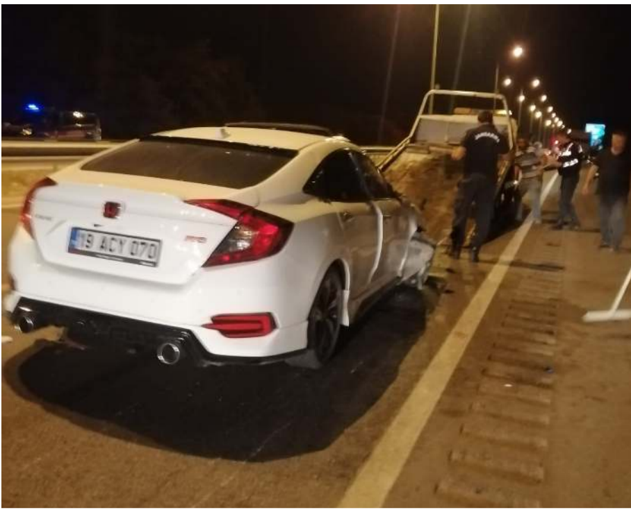
Kaza, Çorum- Alaca yol ayrımında meydana geldi.