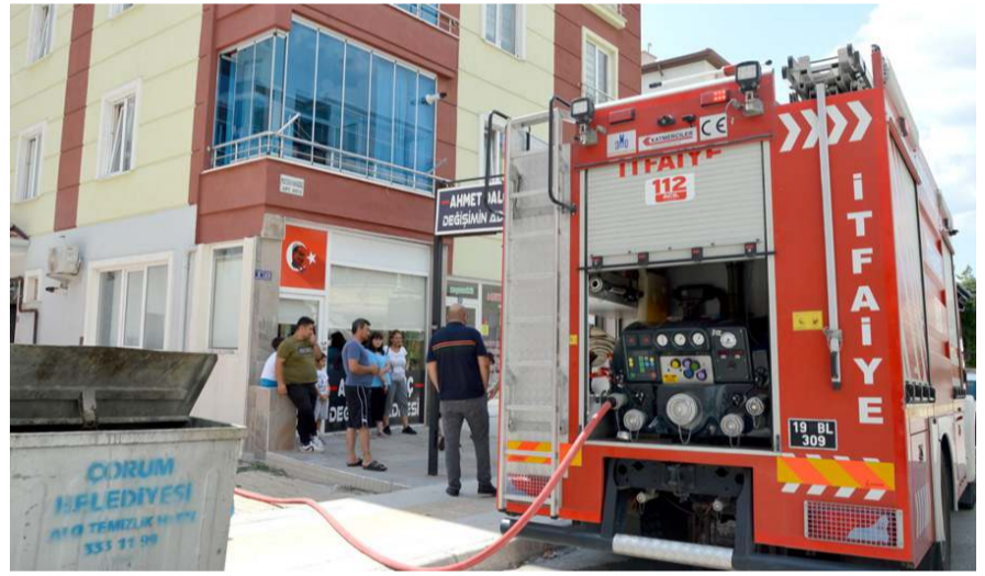
Yangın müdahale sonucu kısa sürede kontrol altına alınarak söndürüldü.