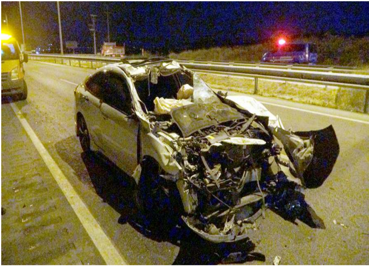
Kazada otomobil hurdaya döndü.

Yaralılar ambulansla Hitit Üniversitesi Erol Olçok Eğitim ve Araştırma Hastanesi'ne kaldırılırken, kazayla ilgili soruşturma başlatıldı.