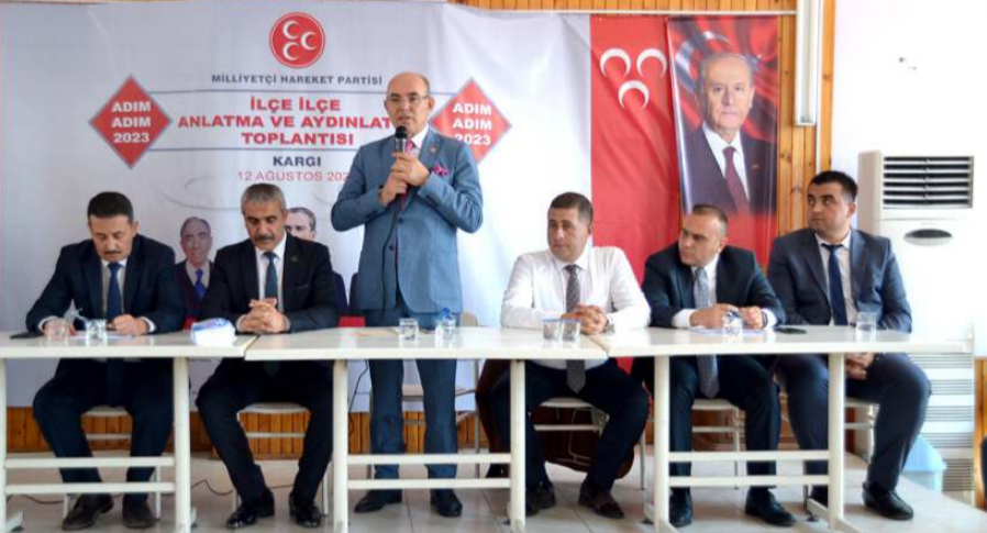
Milliyetçi Hareket Partisi'nin 'Adım Adım 2023' programı çerçevesinde Kargı'da program düzenlendi.