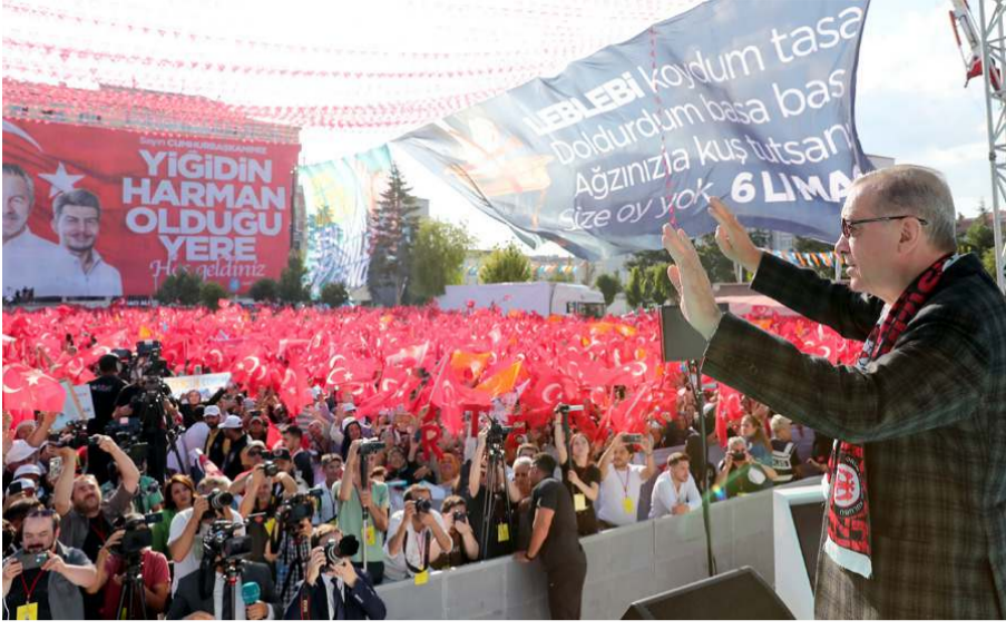
Cumhurbaşkanı Recep Tayyip Erdoğan, Çorum'da vatandaşlara seslendi.

Cumhurbaşkanı Recep Tayyip Erdoğan, Çorum'da Kadeş Barış Meydanı'nda düzenlenen ve yatırım bedeli 3 milyar 263 milyon lirayı aşan 78 eserin toplu açılış törenine katıldı. Sıcak havaya rağmen binlerce vatandaşın katıldığı mitingde ayrıca savunma sanayi yatırımlarının temelleri de atıldı.