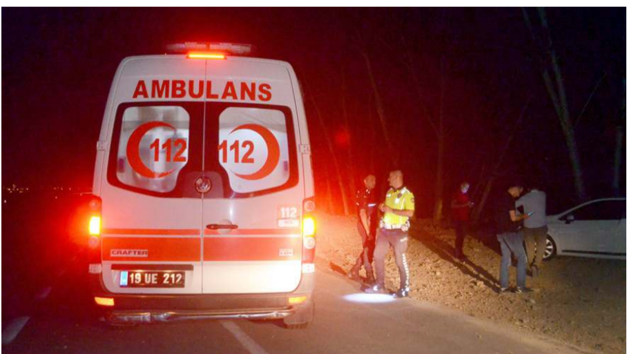
Yaralılara ilk müdahaleyi 112 sağlık ekipleri yaptı.