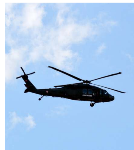
Miting boyunca jandarma ve polis helikopterleri uçuş yaptı.