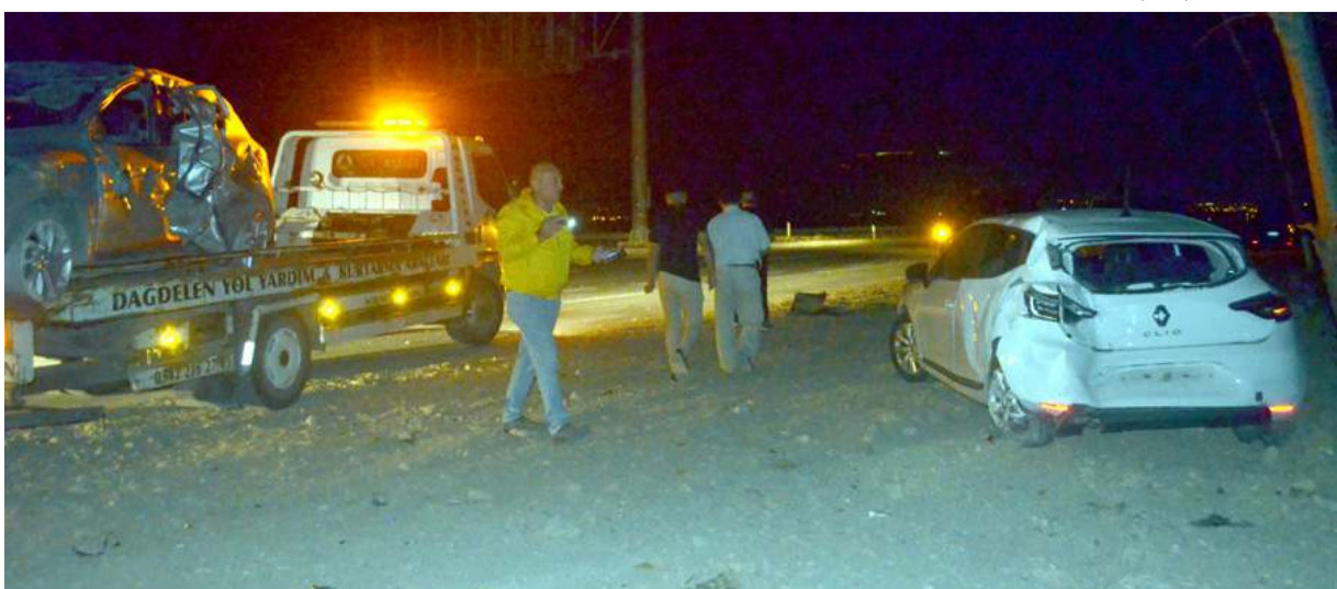
Kaza Merzifon-Çorum kara yolunun 13'üncü kilometresinde meydana geldi.