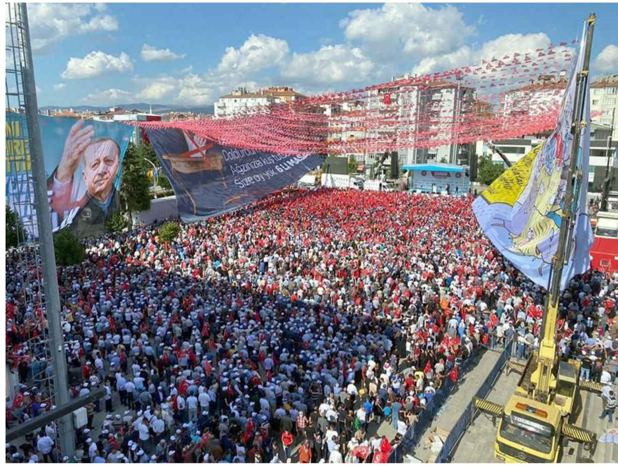
Cumhurbaşkanı Recep Tayyip Erdoğan'ın Çorum mitingi Kadeş Meydanı'nda yapıldı.

Vatandaşlar yoğunluk nedeniyle miting alanına girmekte zorluk yaşadı. Onbinlerce vatandaş Cumhurbaşkanı Recep Tayyip Erdoğan'a sevgi gösterisinde bulundu.