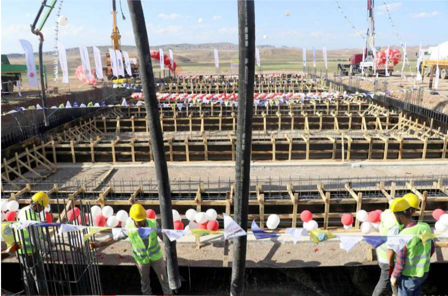
Savunma sanayi tesisleri 6 milyar liraya mâl olacak.