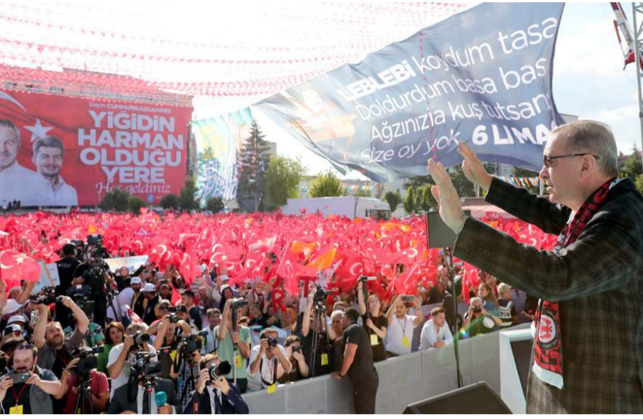
Cumhurbaşkanı Recep Tayyip Erdoğan, Çorum'da vatandaşlara seslendi.