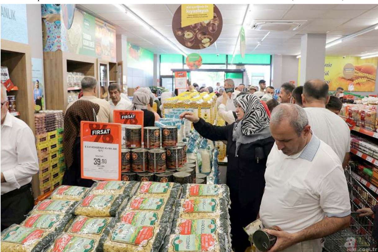
Tarım Kredi Kooperatif Marketlerinde 30'un üzerinde üründe indirim yapılacak.

beklentilerini karşılarken, ülke ekonomisine ve vatandaşların bütçesine katkı sağlama bilinciyle hareket ediyor. Tarım Kredi Kooperatif Marketleri gelecek dönemlerde de imkân ve fırsatları kullanılarak yeni indirim kampanyalarına kamuoyuyla paylaşmaya devam edecek. (Haber Merkezi)