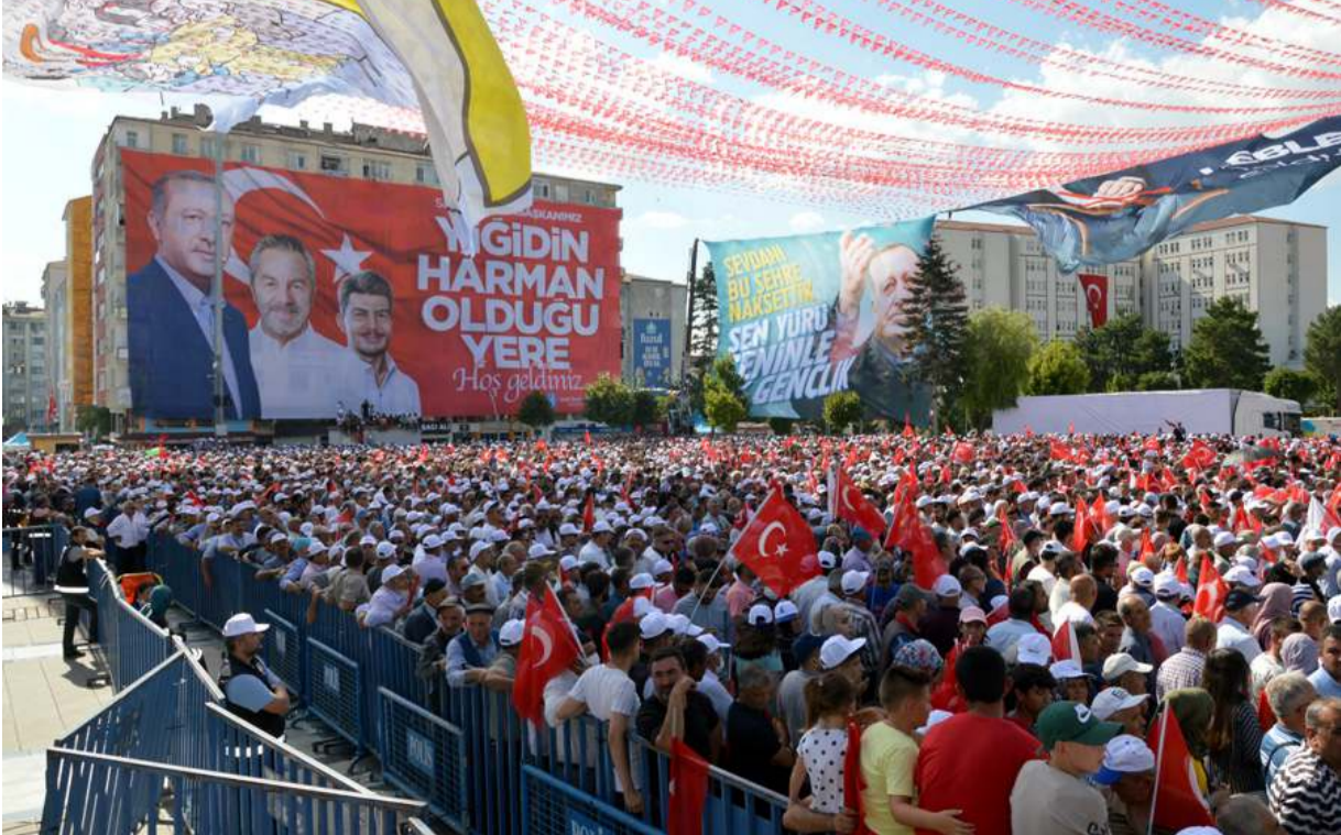
Yüksek hava sıcaklığına rağmen binlerce vatandaş mitinge katıldı.

Erdoğan daha sonra kürsüde Erol Olçok ve oğlu için dua etti.