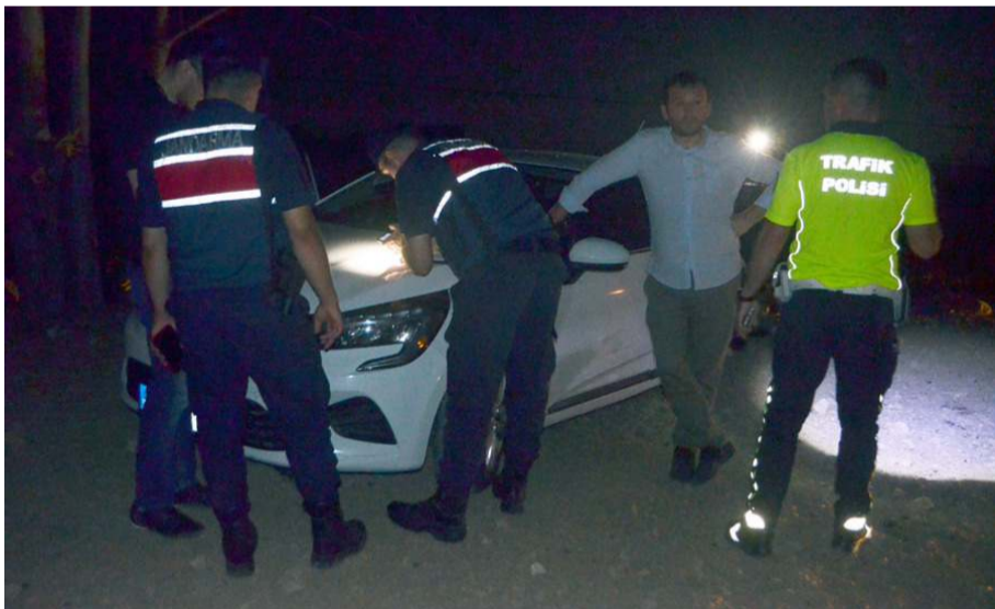
Jandarma ve polis ekipleri olay yerinde inceleme yaptılar.

Amasya'nın Merzifon ilçesinde, karayoluna çıkan domuz sürüsünün yol açtığı zincirleme trafik kazasında 3'ü çocuk 8 kişi yaralandı.