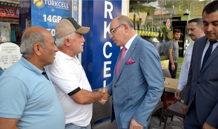
MHP Genel Başkan Yardımcısı ve Ankara Milletvekili Prof. Dr. Mevlüt Karakaya, Kargı'da esnafı ziyaret etti.