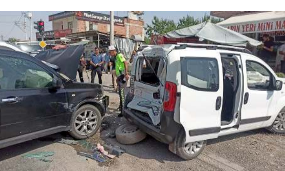
Kaza, 15 Temmuz günü Akpınar Mahallesi'ndeki Özgürlük Bulvarında meydana gelmişti.

Çorum-Alaca yol ayrımında meydana gelen trafik kazasında 1 çocuk hayatını kaybederken 3 kişi de yaralandı.