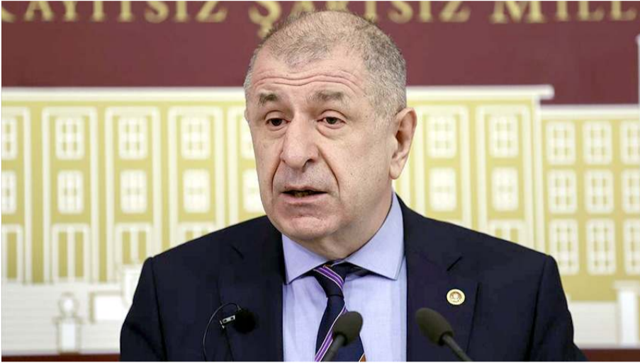
Zafer Partisi Genel Başkanı Ümit Özdağ

Onan istişare toplantısında, Özdağ'a Çorum'un beklentileri ve sorunlarıyla ilgili bir dosya sunulacağını açıkladı. (Haber Merkezi)