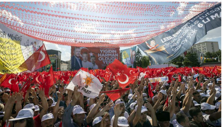
Mitingte katılım yüksek oldu.

Çiftçilerin 84 milyon için üretim yaptığını ifade eden Bakan Kirişçi, "2002 yılında hükümet olarak iş başına geldiğimizde Türkiye'nin nüfusu 65 milyondur. Bugün Türkiye'nin nüfusu 84 milyon. Üzerine tam 19 milyon nüfus eklenmiş durumda. O gün üreten çiftçi 64 milyon için üretirken, bugün 84 milyon için üretiyor. Yani, üretmeye devam ediyor. O gün ülkemizi ziyaret eden turist sayısı 15 milyondur. Pandemi öncesinde 52 milyonla dayandı. Turist sayısı da 3 kat arttı. Gelen turistlerin yediklerini, içtiklerini üreten kim? Bu ülkenin azad ve eli öpüleli üreticileri üreten kim? Madan, sıkılmadan 'Bu ülkede üretim yok, bu ülkede üretim yapılmıyor' deniliyor. Bunların hiçbir sözüne itibar etmemek lazım. 65 milyonun dün doyanan, bugün 85 milyona çıkmış nüfusu doyurmaya devam eden sizlersiniz, bu ülkenin azad üreticileridir. Bu ülke, zengin ve gelişmiş ülke diyerek bilinen, pandemi de rafları boşanan o gelişmiş ülkeleri televizyondan izledi. Bu ülkede bir ürünün yokluğu çekildi mi, hayır. Elhamdülillah bütün ürünlerimizin yeterli kadar raflarda bulundu, bulunmaya da devam ediyor. Türkiye sadece kendini doyuran bir ülke değil, aynı zamanda 25 milyar doları bulan ihracatıyla da yurtdışındaki insanları da doyuran bir ülke. 2002'de 25 milyar olan tarımsal ih-