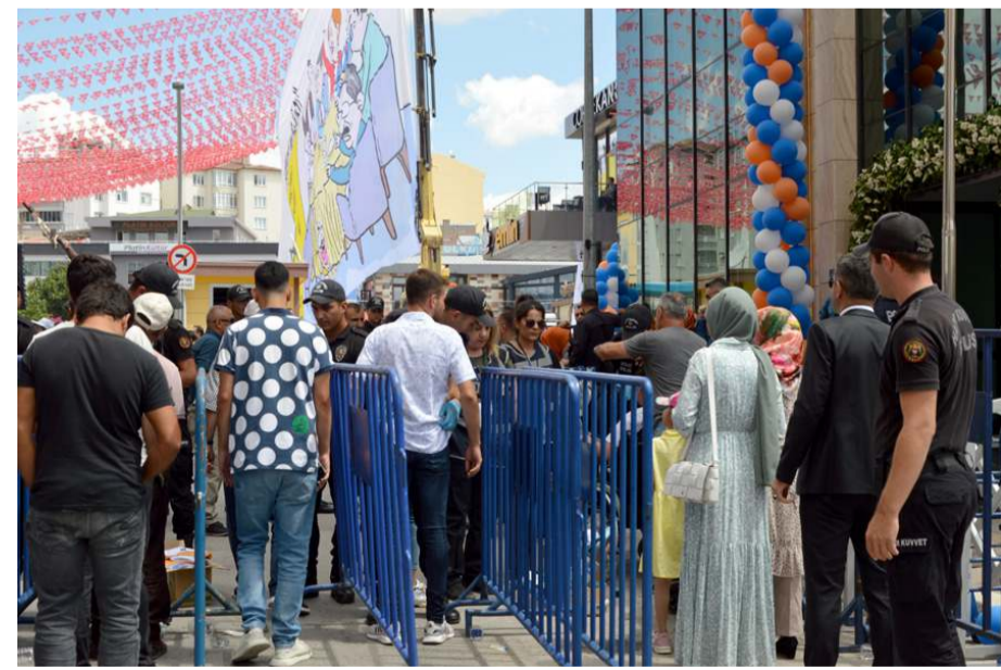
Miting alanına girişlerde kontrol noktaları oluşturuldu.

Erdoğan'ın gelişi öncesi 2 polis helikopteri havadan güvenlik kontrolleri yaptığı görüldü.