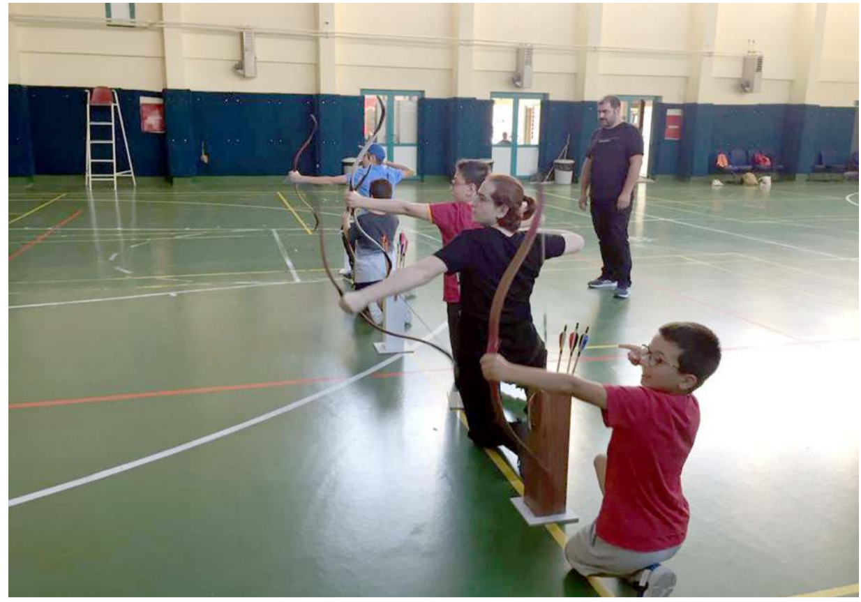
Gençlik merkezlerinde okçuluk eğitimi veriliyor.