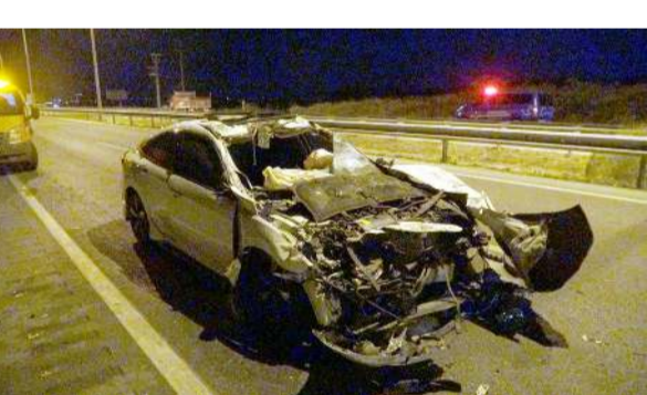
Kazada otomobil hurdaya döndü.