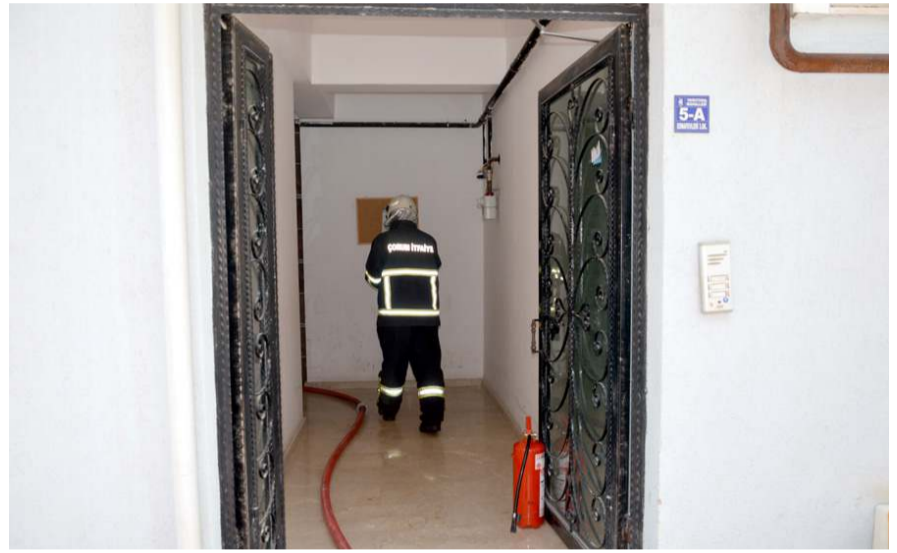
Yangına itfaiye ekipleri müdahale etti.