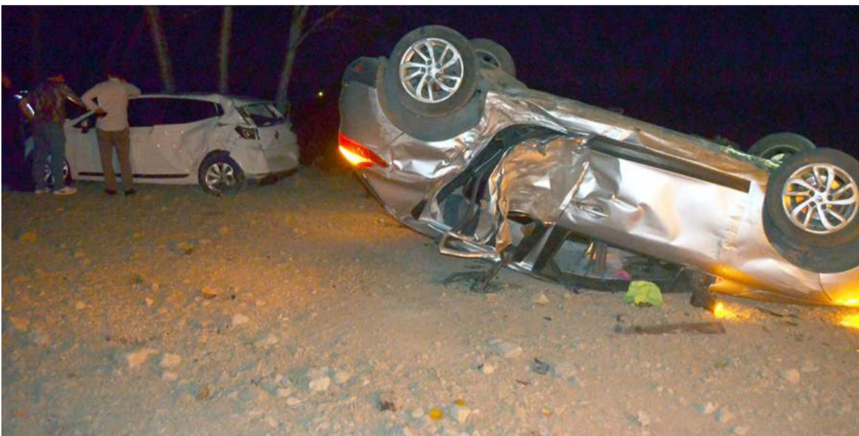
3 otomobil, yola inen domuz sürüsünün arasına girmemek için aniden durmaya çalışınca birbirleriyle çarpıştı.