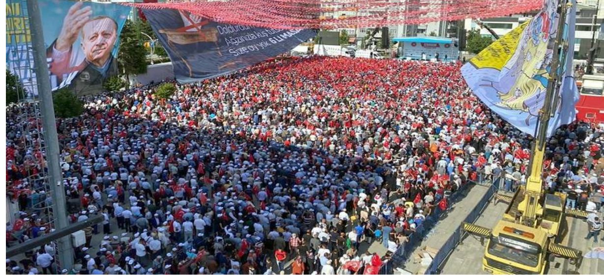
Cumhurbaşkanı Recep Tayyip Erdoğan'ın Çorum mitinginde Kadeş Meydanı'nda yapıldı.