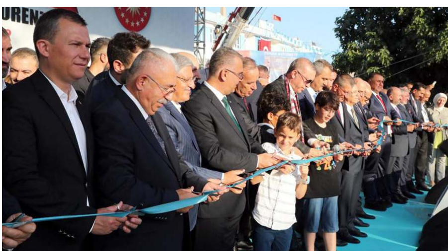
Fabrikaların temelleri telekonferans yoluyla atıldı.

Sungurlu OSB'de yapılacak ve toplam yatırım bedeli 6 milyar TL olan Türkiye'nin tek kalemdeki en büyük savunma sanayi yatırımı olan Küresel Barut, Nitrogliserin ve Nitroselüloz Üretim Tesisleri, Kapsül Üretim Tesisi ve Fişek Üretim Tesisinin temeli, Cumhurbaşkanı Recep Tayyip Erdoğan'ın video konferansla katıldığı törende atıldı.