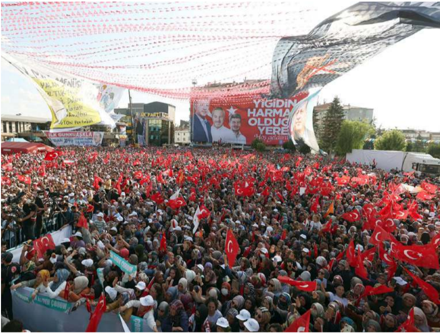
Kadeş Meydanını binlerce vatandaş doldurdu.