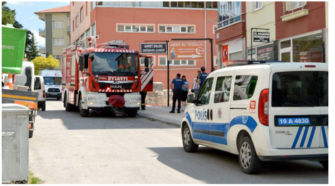
Olay Esnafeleri 3.Sokak'ta bir apartmanda meydana geldi.