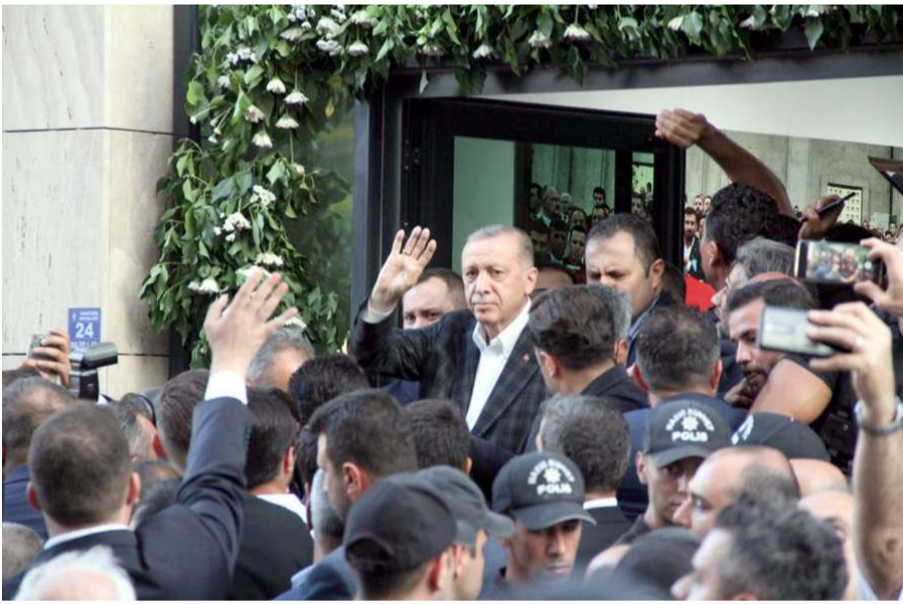
Cumhurbaşkanı Recep Tayyip Erdoğan, AK Parti İl Başkanlığı ziyaret etti.