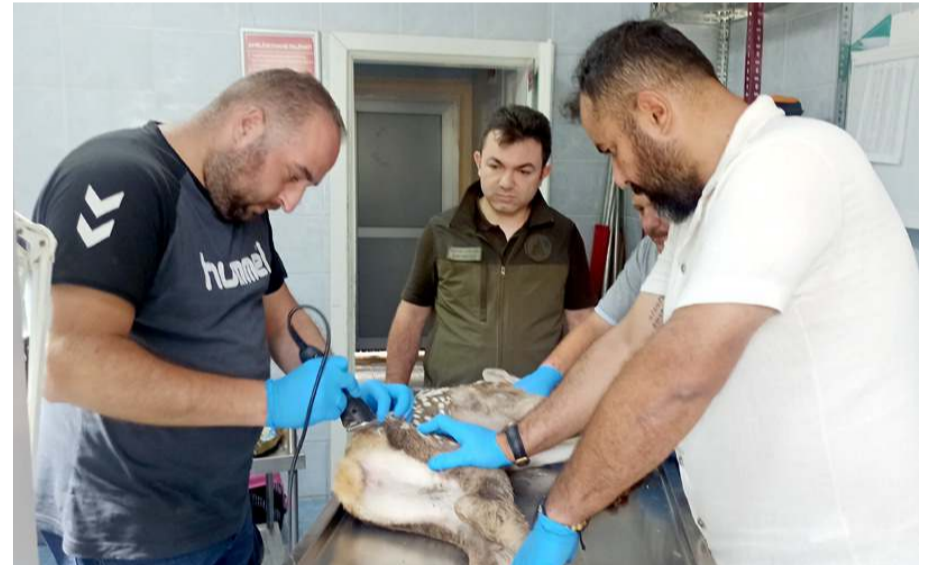
Yavru geyik Doğa Koruma ve Milli Parklar Şube Müdürlüğü ekiplerine teslim edildi.