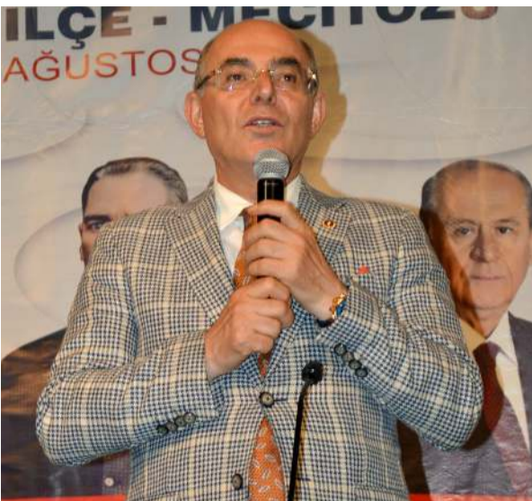
MHP Genel Başkan Yardımcısı Mevlüt Karakaya

MHP MİTINGLERE 4 EYLÜL'DE BAŞLAYACAK MHP Genel Başkan Yardımcısı ve Ankara Milletvekili Mevlüt