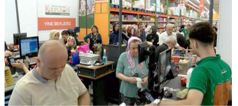
Tarım Kredi Kooperatif Marketleri'nin Çorum'da 11 şubesi var.

İndirim kampanyası vatandaş tarafından mem-