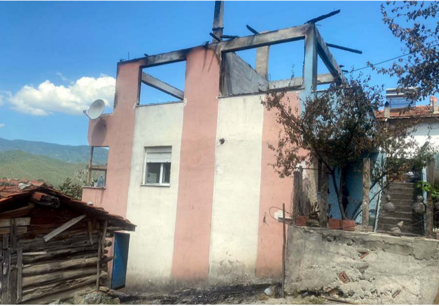
Sadık Ediz'e ait ev yangında kullanılmaz hale geldi.