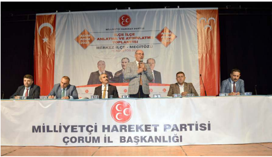
Toplantıda ilk olarak divan heyeti oluşturuldu.

MHP Genel Başkan Yardımcısı Mevlüt Karakaya, 'Adım Adım 2023' toplantısında yaptığı konuşmada birilerinin 2023 seçimlerini Türkiye Cumhuriyeti ve Cumhur İttifakı ile bir hesaplaşma günü olarak gördüklerini söyledi.