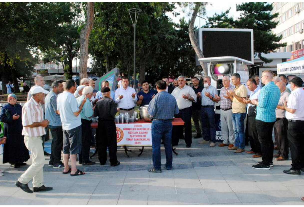
Aşure ikramı öncesinde dua edildi.