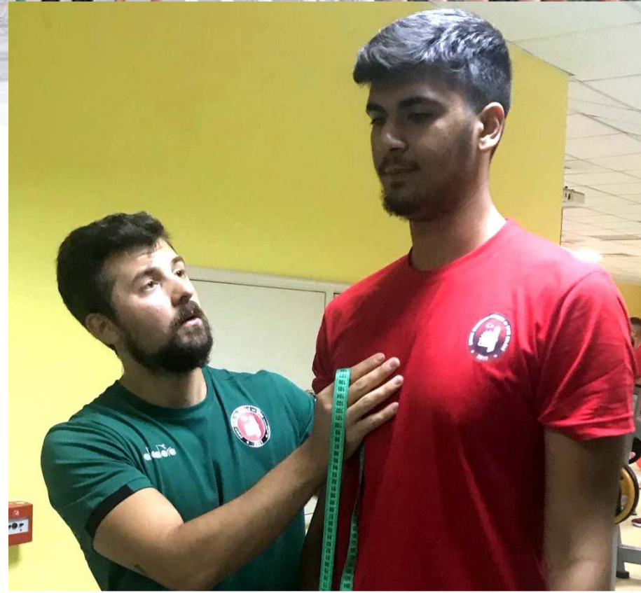
Sezonun ilk antrenmanı öncesinde sporcuların vücut ölçüleri ve diğer bilgileri alındı

Çorum'da ilk kez oynanacak 1. lig maçlarında taraftarlarımızın