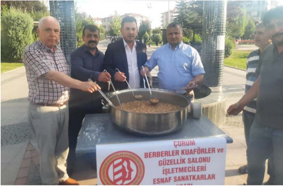
4 farklı noktada aşure dağıtıldı.