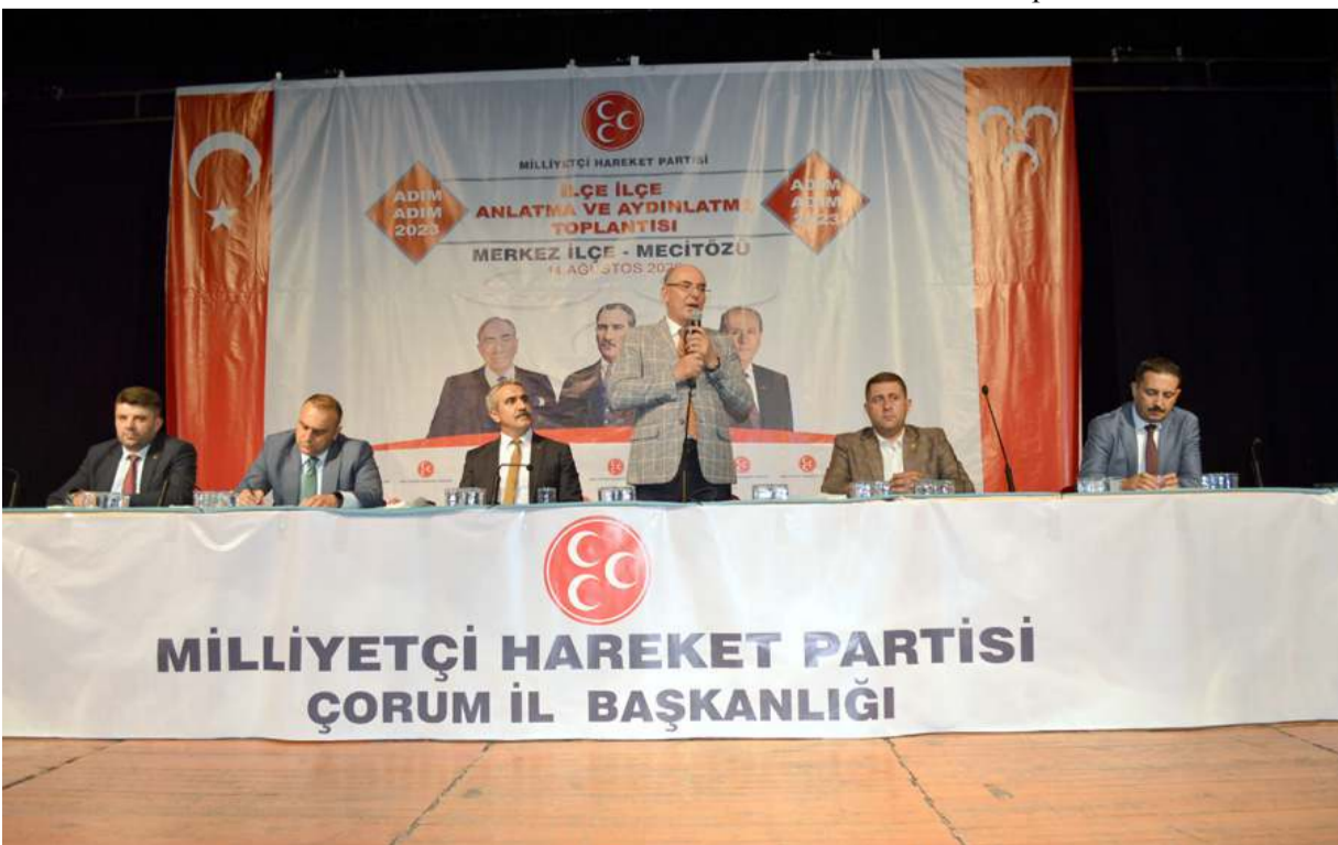
Toplantıda ilk olarak divan heyeti oluşturuldu.