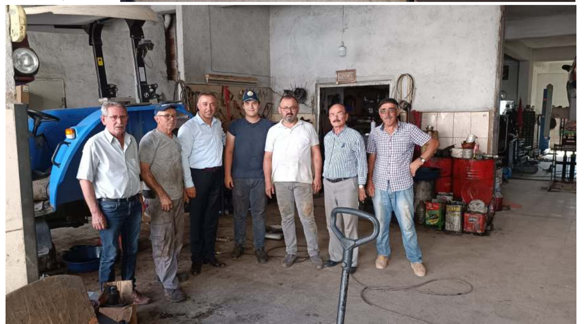
Esnafın yaşadıkları sorunları dile getirdiler.