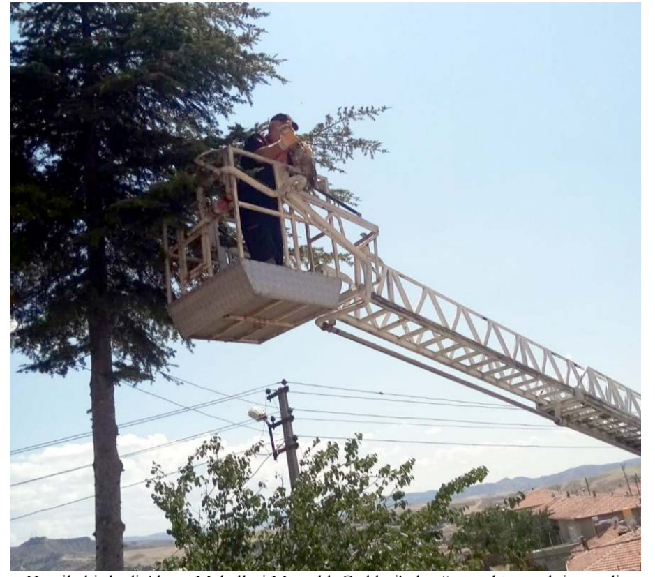
Hamile bir kedi Akçay Mahallesi Mezarlık Caddesi'nde ağaca çıktı ancak inemedi.

Hamile olduğu belirlenen bir kedi, Akçay Mahallesi Mezarlık Caddesi'nde ağaca çıktı. Çıktığı ağaçtan inemediği için mahsur kalan kedinin bağırışlarını duyan vatandaşlar, itfaiye ekiplerinden yardım istendi. Kedi, kısa sürede olay yerine gelen itfaiye ekiplerinin çalışmasıyla mahsur kaldığı ağaçtan indirildi. Aç ve susuz kalan kediye vatandaşlar tarafından su ve mama verildi. Korktuğu görülen kedi, kendine geldikten sonra gözden kayboldu. (İHA)