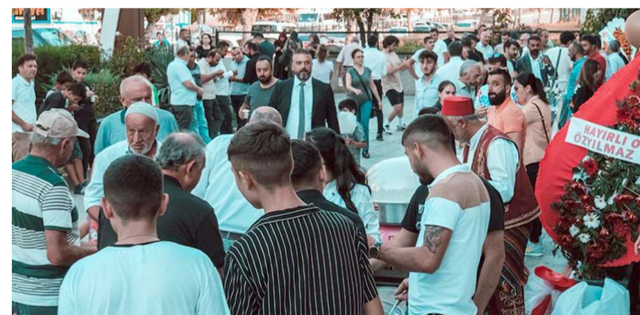
Açılışa çok sayıda davetli katıldı.