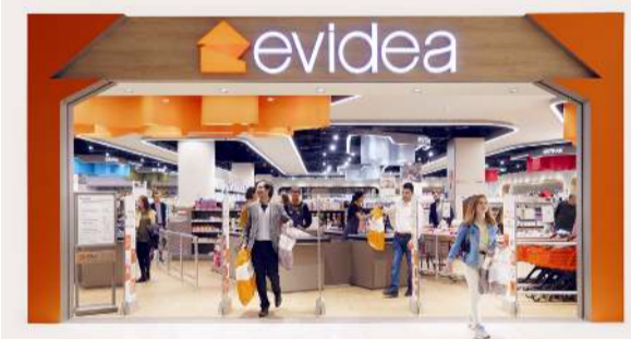
Evidea 25 Ağustos'ta AHL Park AVM'de faaliyete başlayacak.