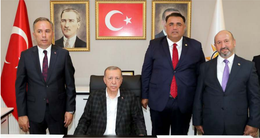
Cumhurbaşkanı Recep Tayyip Erdoğan, miting ardından AK Parti İl Başkanlığı'na ziyarette.

"Sayın Cumhurbaşkanımız, yüzyıllık özlemimiz, Kırıkkale-Çorum-Samsun hızlı tren hattının, Çorum-Sungurlu-Kırıkkale/Delice bölümünün öncelikle yapılarak halkımızın hizmetine sunulması için, yatırım programına alındığı müjdesini verdiler. İhalesi yapılacak olan hızlı tren projesinin tamamlanmasıyla birlikte; ülke ve bölge ekonomisine, Çorum'un gelişim kalkınması, refah seviyesinin yükselmesine büyük katkılar sağlayacak inşallah. Cumhurbaşkanımızın hemşehrilerimize 2. müjdesi ise, 2500 insanımıza istihdam oluşturacak olan, 'Küresel Barut Fabrikası, Fişek Üretim Fabrikası, Nitrogliserin, Nitroselüloz ve Kapsül Fabrikası' olmak üzere 5 fabrikamızın ilimize kazandırılması oldu. Açılışı yapılan proje ve yatırımlar ile temeli atılan yeni kazanımlar için başta Cumhurbaşkanımız Sayın Recep Tayyip Erdoğan olmak üzere emeği geçen herkese şükranlarımı sunuyorum. AK Parti bayrağımızı her zaman zirvede dalgalandıran, bizleri hiçbir zaman yalnız bırakmayan değerli hemşehrilerime gösterdikleri samimi gayret ve teveccüh ile Çorum'umuza yaşattıkları bu tarihi günün teşekkür ediyorum" diyerek açıklamasını tamamladı.