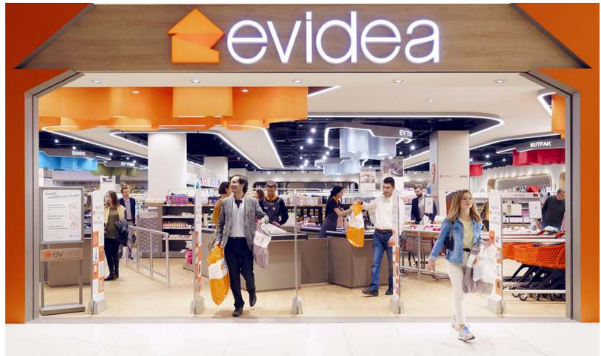
Evidea 25 Ağustos'ta AHL Park AVM'de faaliyete başlayacak.

Ev dekorasyonunda her ihtiyacı karşılamaya yönelik ürünleriyle kalitesinden ödün vermeyen Evidea, her yaşa ve her tarza hitap ediyor. Güçlü organizasyon yapısı ve deneyimli kadrosuyla tüketicilerin ilk adresi olan Evidea, 2025 yılı sonunda çoğunluğu alışveriş merkezlerinde yer alacak 110 mağazaya ulaşmayı hedefliyor. (Haber Merkezi)