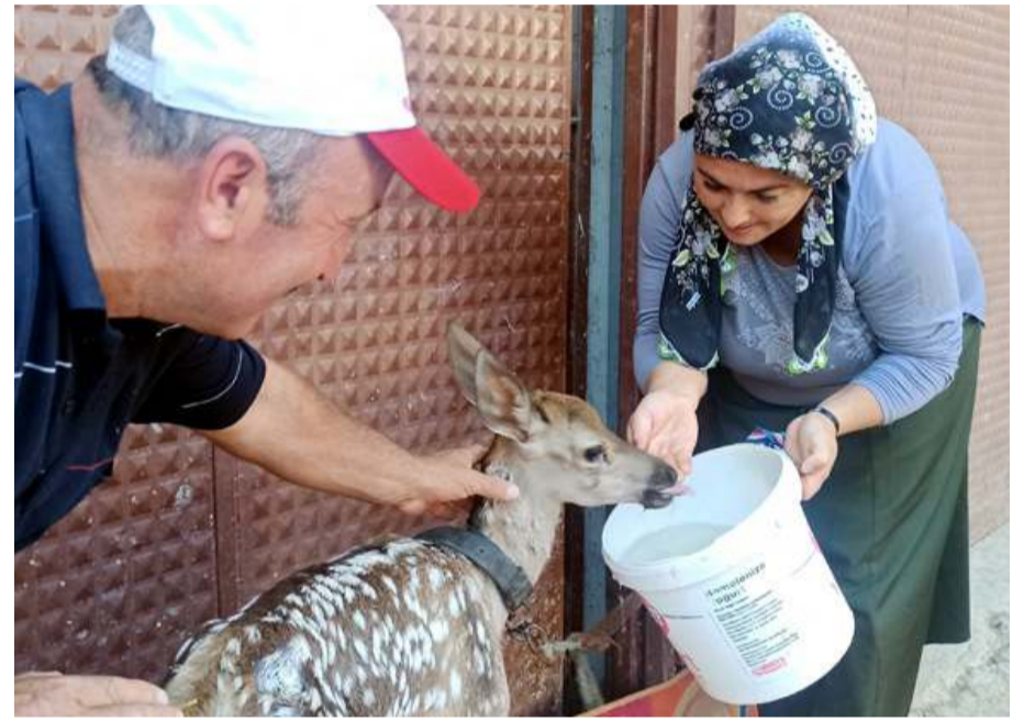
Kavuncu, yavru geyiğe özenle baktı.

kendi ellerimizle besledik. Daha sonra Doğa Koruma ve Milli Parklar Şube Müdürlüğüne bilgi verdik. Şimdi onlara teslim ediyoruz. Eğer doğada bıraksaydık kurtlar veya köpekler yem olurdu. Canına kıyarlardı” dedi. (İHA)