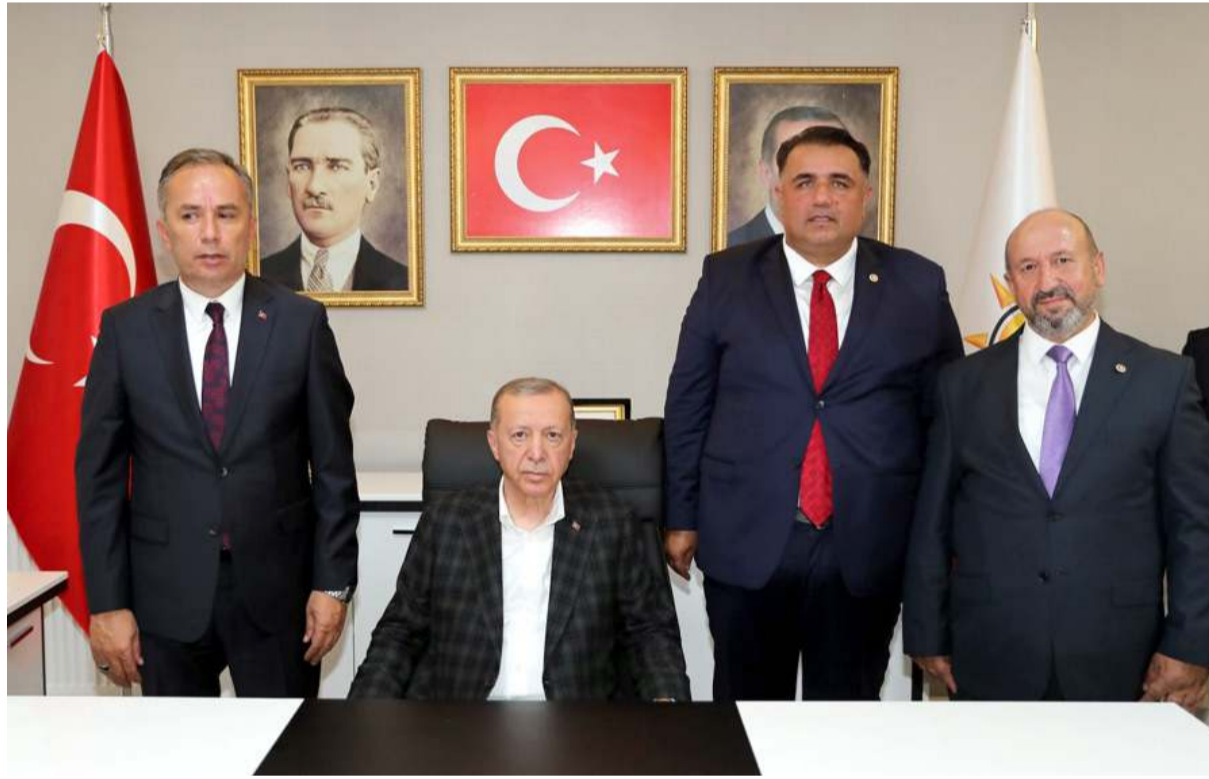
Cumhurbaşkanı Recep Tayyip Erdoğan, mitingin ardından AK Parti İl Başkanlığı'na ziyaret etti.