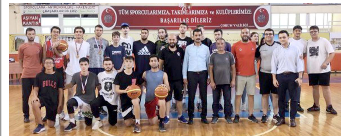
Turnuvada dereceye giren takımlar ve ödül törenine katılırlar müsabakalar sonrasında toplu halde görülüyor

taraftarlarımızı yanımızda görmek istiyoruz ve onları mutlu etmek için elimizden gelen çabayı göstereceğiz' dedi.