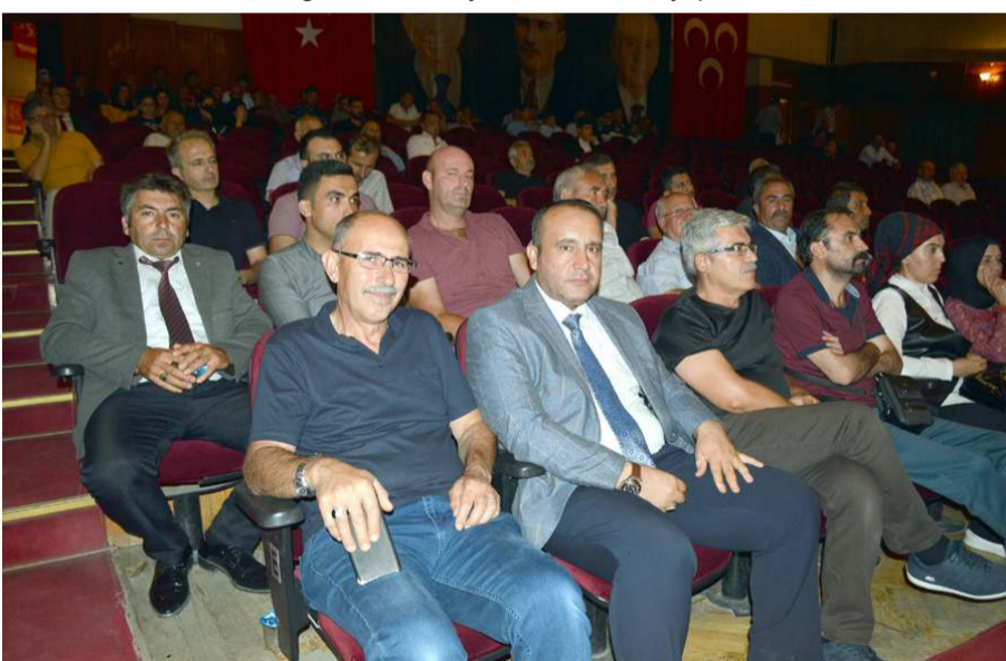
Toplantıda parti çalışmalarını istişare edildi.