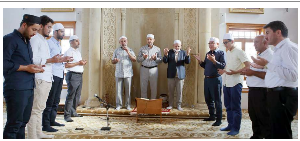
Mevlit programı Erol Olçok'un yaptırdığı camide gerçekleştirildi.