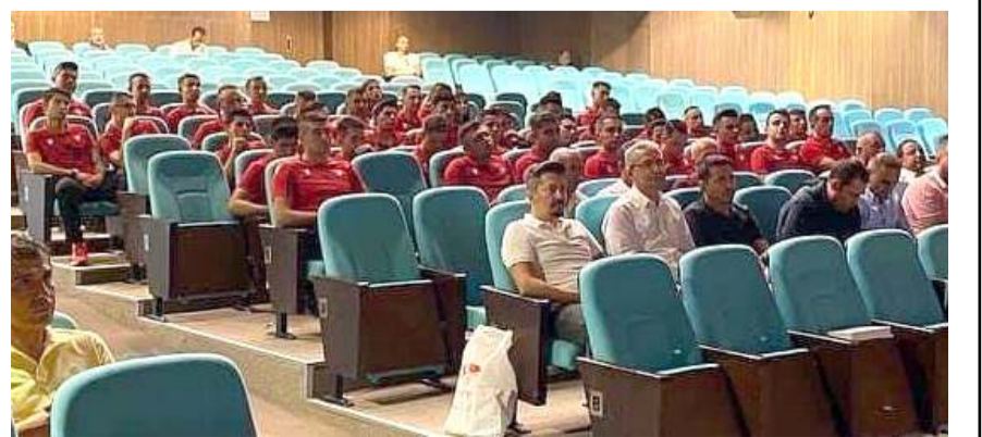
Yozgat'ta yapılan sezon başı seminerine bölgedeki illerden hakem ve gözlemciler katıldı

İlimiz Klasman hakem ve gözlemcileri bu performansları yeni sezonun ilk haftasından itibaren liglerde görev almaya hak kazanacaklar.