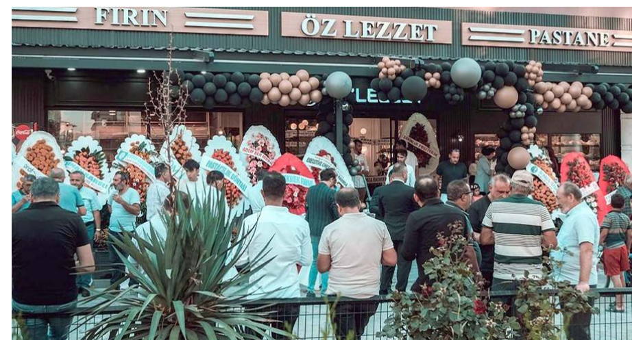
Öz Lezzet Unlu Mamülleri Cemilbey Caddesi numara 76 adresinde bulunuyor.