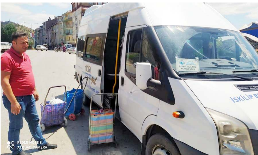
Pazar alış veriş yapan vatandaşları servisler evlerine kadar götürüyor.