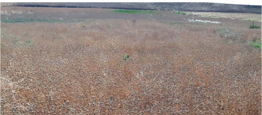
Bu sene 6 bin tonluk rekolte bekleniyor.

Sungurlu'da 6 bin dönüme üretilen çörek otu hasadına başlandı. İlçede bu sene 6 bin tonluk rekolte bekleniyor.