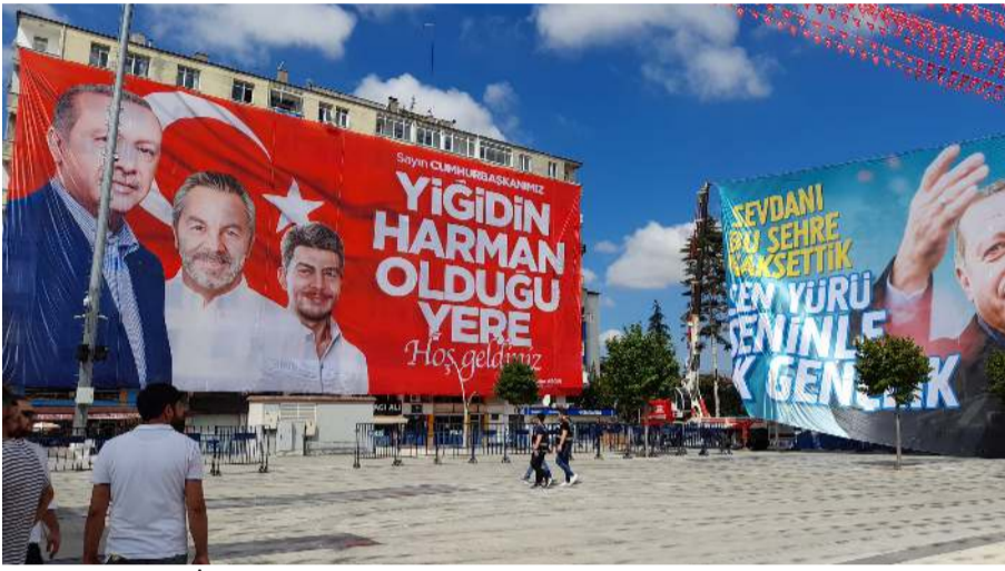
Gelecek Partisi İl binasının bulunduğu binaya miting öncesinde dev pankart asılmıştı.