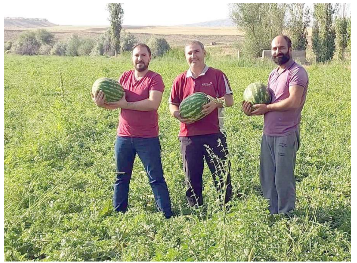
Çiftçiler 15 dekar ala karpuz ektiler.