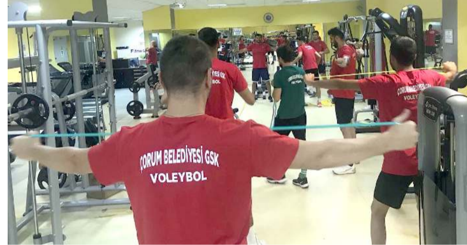
İlk antrenmanı sabah Buhara Kültür Merkezi fitnes salonunda yapıldı

desteğine her zamankinden daha fazla ihtiyacımız var. Bu yüzden yeni sezonda geçtiğimiz yıllardaki taraftarlarımızın