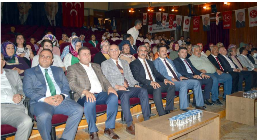
Program Devlet Tiyatro Salonu'nda yapıldı.