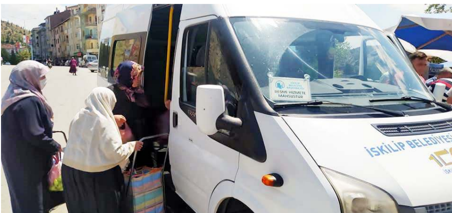
Vatandaşlar uygulamadan memnunnlar.

İskilip Belediyesi'nin sosyal belediyeçilik kapsamında çalışmaları devam ediyor.