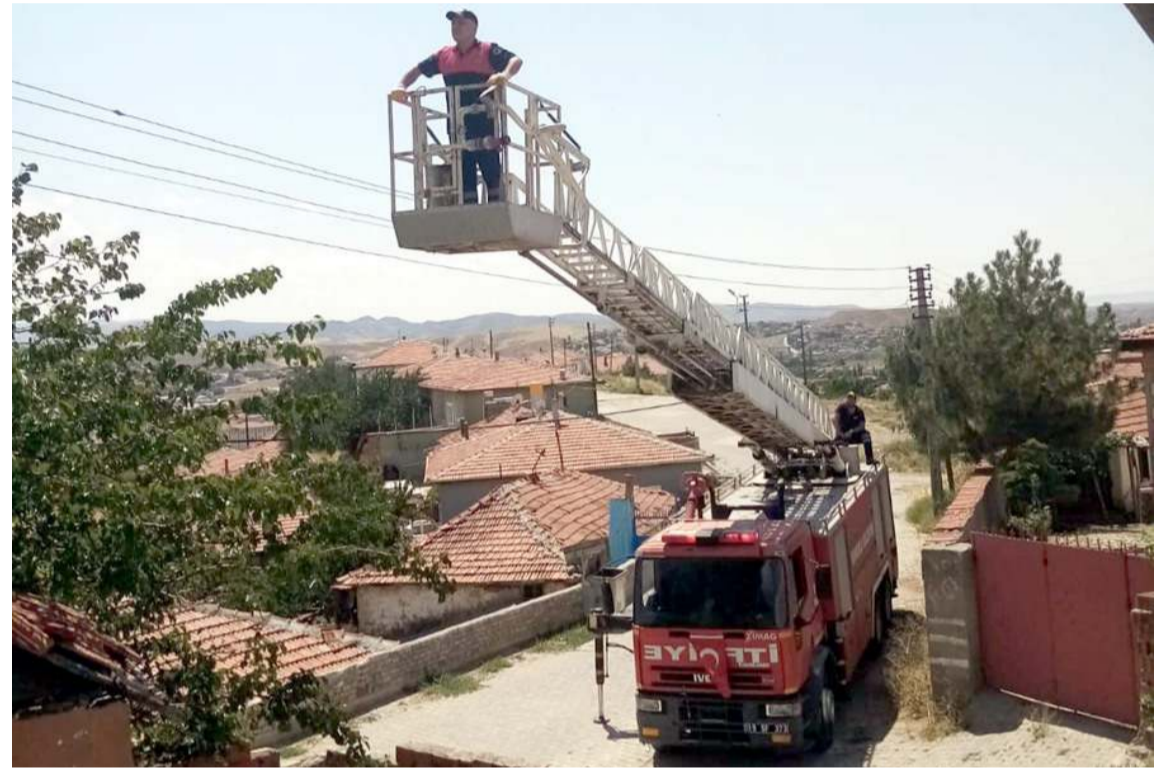
Hamile kediyi çıktığı ağaçta itfaiye ekipleri indirdi.