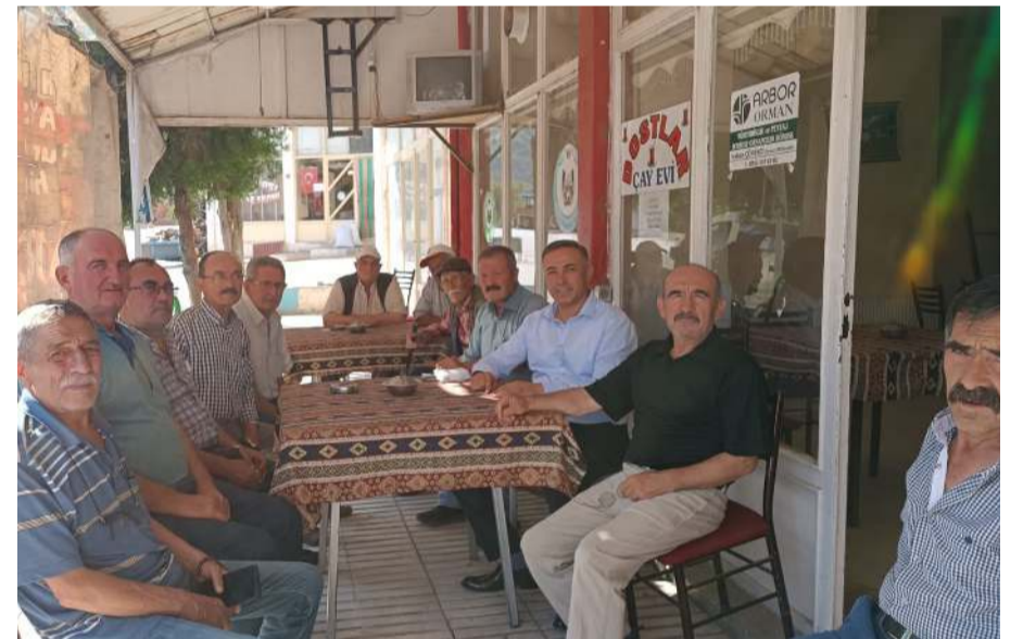
Tahtasız, vatandaşlarla sohbet etti.