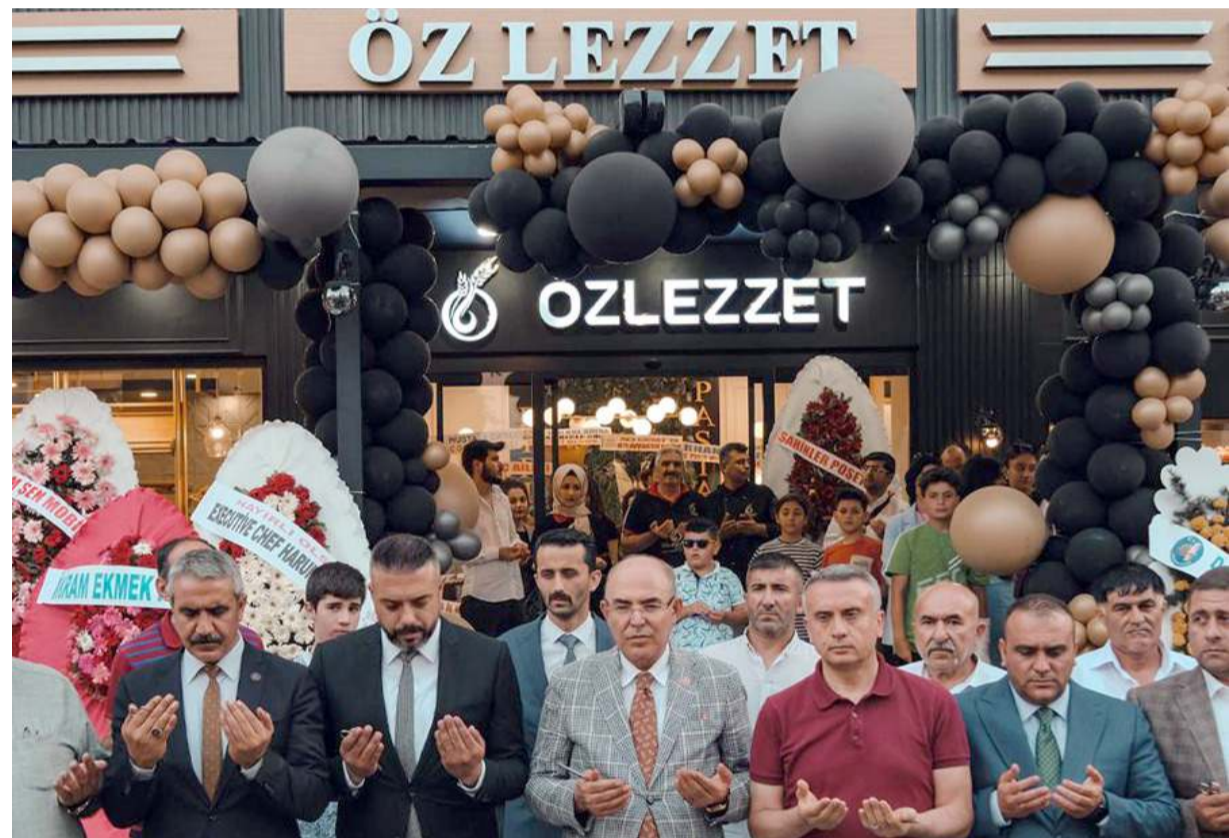
Yapılan duanın ardından açılış kurdelesi kesildi.