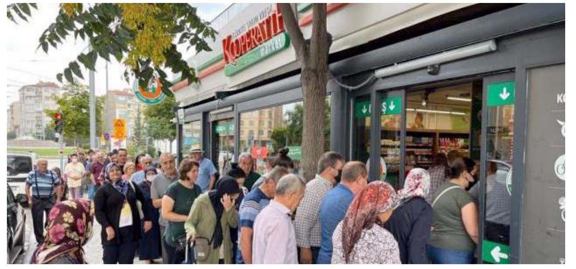
Vatandaşlar marketler önünde uzun kuyruklar oluşturdular.

Gelecek Partisi iktidarında böyle görüntülerin olmayacağını ifade eden Coşgunsu, ayrıca Cumhurbaşkanı Erdoğan'ın Çorum programı için yapılan harcamaların israfa başka bir şey olmadığını belirtti. (Haber Merkezi)