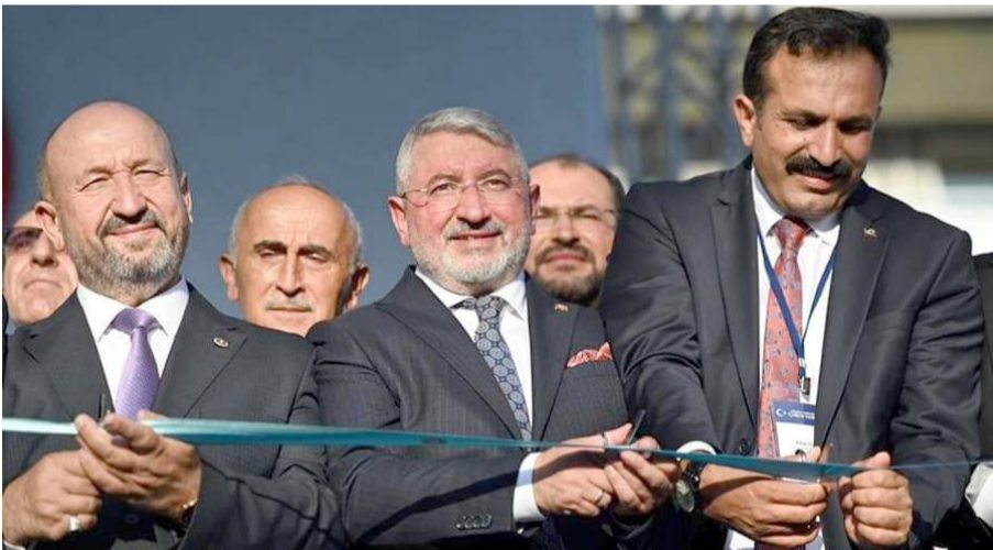
Mitingde tamamlanan yatırımların açılışları yapıldı.