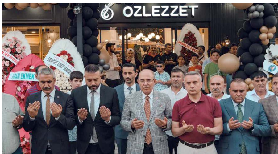
Yapılan duanın ardından açılış kurdelesini kesildi.