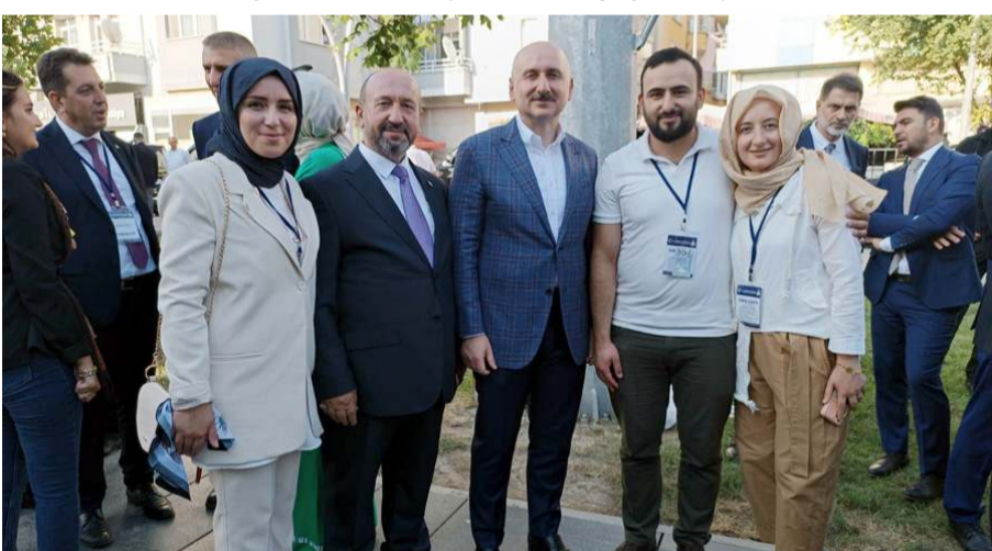
Milletvekili Erol Kavuncu, Ulaştırma ve Altyapı Bakanı Adil Karaismailoğlu ile Çorum'un ulaştırma projelerini konuştu.