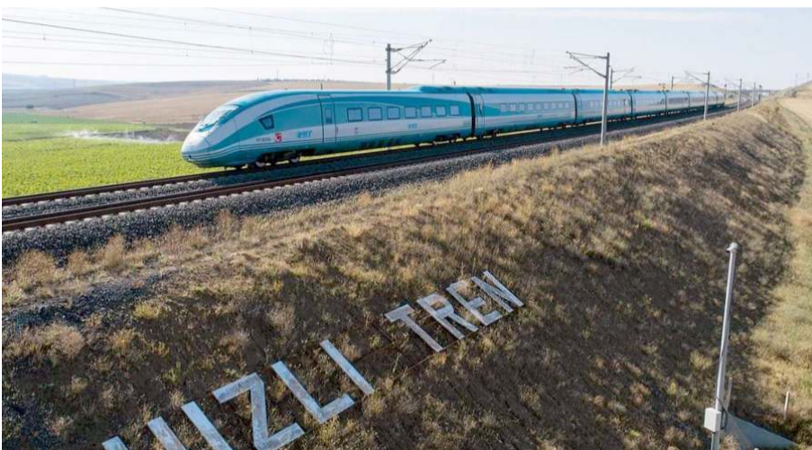
Cumhurbaşkanı Recep Tayyip Erdoğan, hızlı tren projesinin Kırıkkale-Çorum arasının yatırım programına alındığını açıkladı.