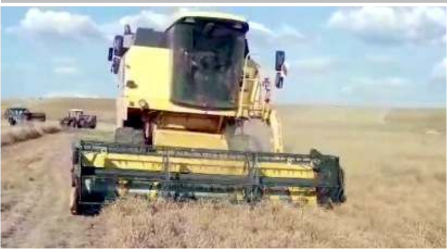
İlçede bu yıl 6 bin dönüme çörek otu ekildi.