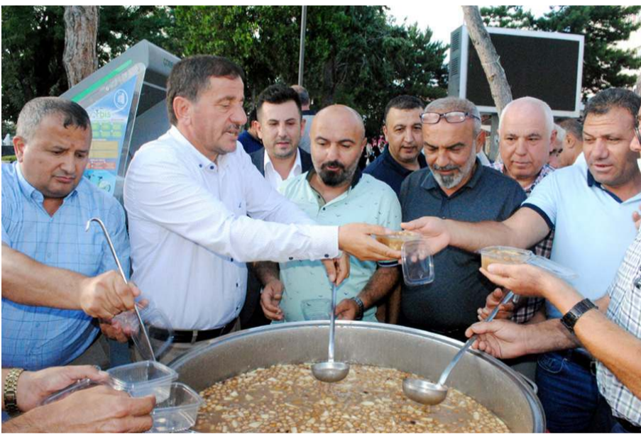
Bazı oda başkanları da aşure dağıtımına katıldılar.