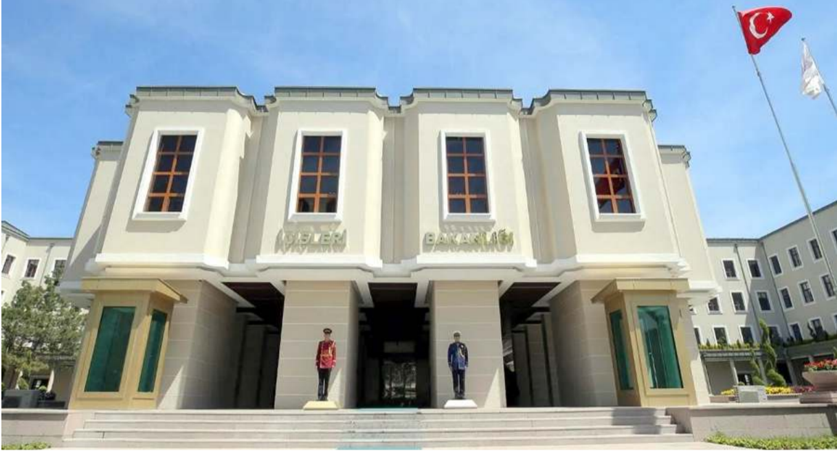
İçişleri Bakanlığı konu ile ilgili açıklama yaptı.

Server Sinanoğlu, Gercüş Kaymakamı iken kullandığı resmi araçla yolun karşısına geçmeye çalışan 13 yaşındaki Muhammet Çelik'e, ardından da başka bir araca çarpmıştı. Yaralanan Çelik, kaldırıldığı hastanede yaşamını yitirirken 0.27 promil alkollü çıkan Server Sinanoğlu tutuklanmıştı. (Haber Merkezi)