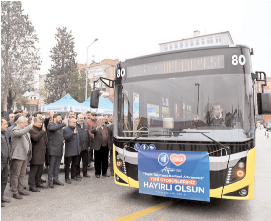
Yeni otobüsler dün yapılan törenin ardından seferlere başladılar.