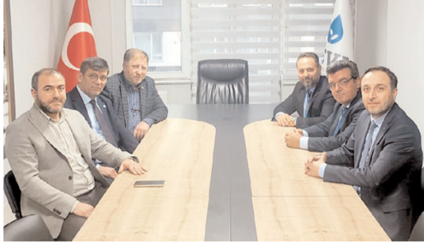
Toplantıda seçimde yapılacak olan çalışmalar istişare edildi.

■ Millet İttifakı'nı oluşturan siyasi partilerin Çorum İl Başkanları, 14 Mayıs 2023 Pazar günü yapılacak olan genel seçimler öncesi seçim güvenliği ve çalışma planını görüştü.