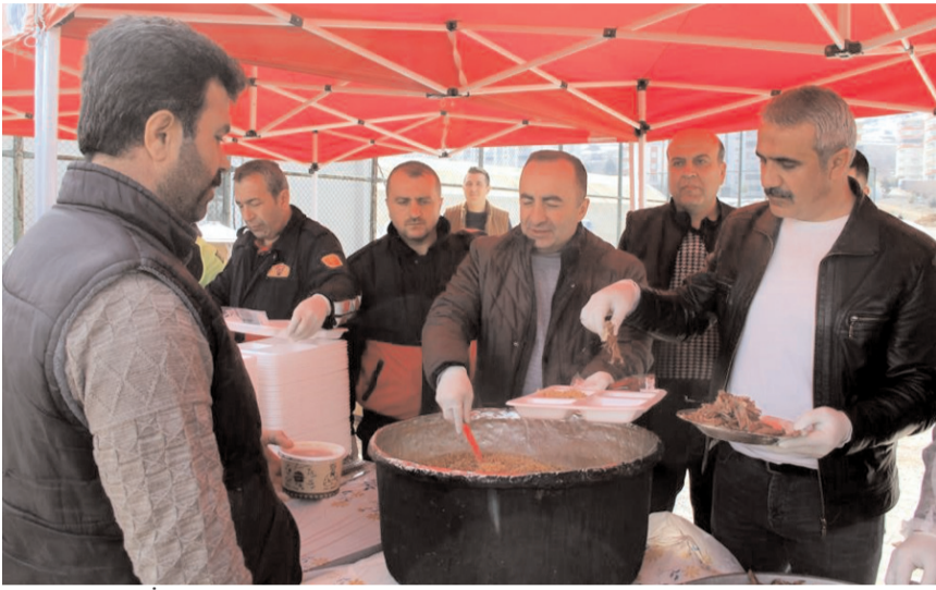
İskilip Belediyesi 2010 yılında Türk Patent Enstitüsü'nce tescillenen İskilip dolmasına coğrafi işaret almıştı.