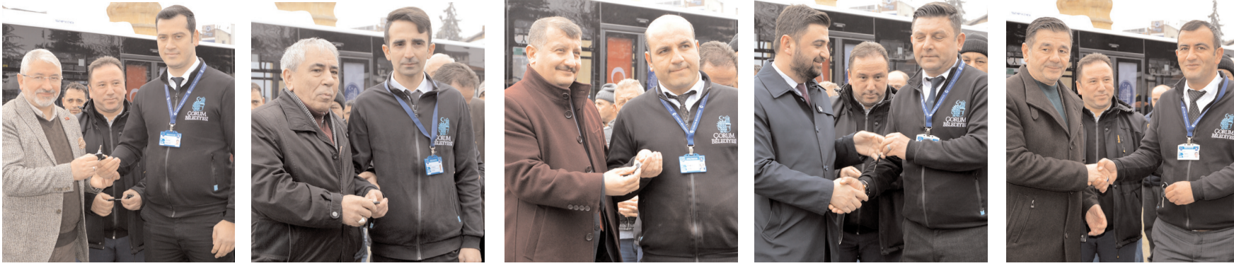
Çorum Belediyesi tarafından toplu ulaşım hizmetinde kullanılmak üzere satın alınan 5 adet otobüsün anahtarları sürücülerine teslim edildi.