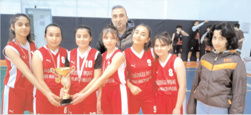
3x3 Basketbol kızlarda ilk şampiyonu olan Mustafa Kemal Ortaokulu