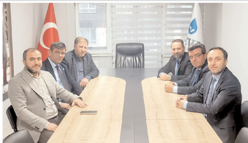
Toplantıda seçimde yapılacak olan çalışmalar istişare edildi.

İttifaka destek veren partilerin seçim öncesi ortak programlar düzenlemesi, bazı etkinliklerde birlikte hareket edilmesi kararlaştırıldı.