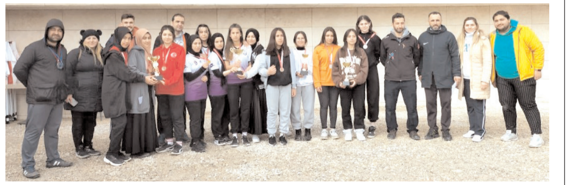
Genç Kızlar Bocce'de dereceye giren okullar ve törene katılan öğretmenler toplu halde