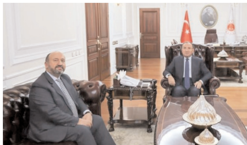
AK Parti Çorum Milletvekili Erol Kavuncu, Adalet Bakanı Bekir Bozdağ'ı ziyaret etti.