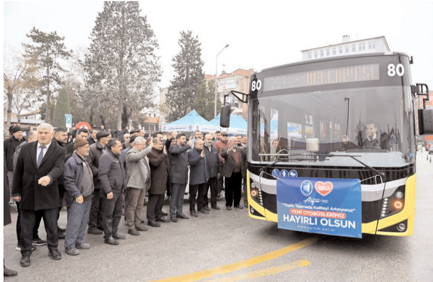
Yeni otobüsler dün yapılan törenin ardından seferlere başladılar.

Konuşmaların ardından hizmete alınan yeni araçların anahtarları şoförlere teslim edildi.