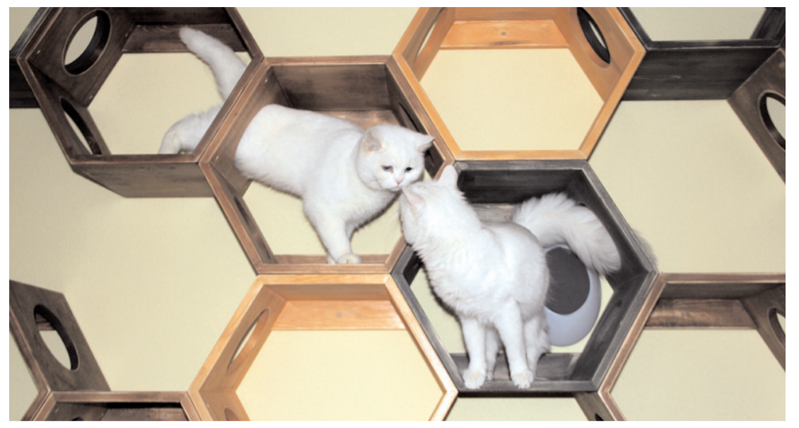
Çorum Belediyesi, sokak kedileri için kedi evi açtı.