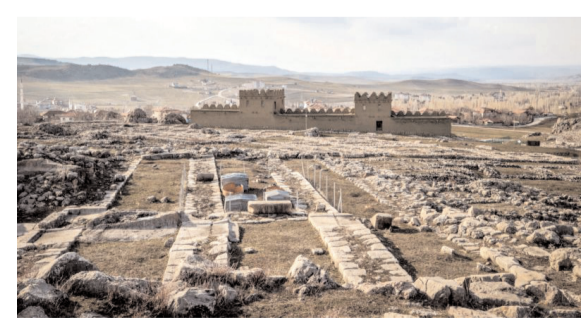
Hititler'in en iyi bilinen düşmanlarından Kaşkaların akınları, iç ve dış çatışmalar ya da salgınlar gibi zorluklara dayanan, inançlarının ve bürokrasilerinin merkezi olan Hattuşa'yı neden terk ettikleri tarihçiler için önemli bir soru işaretini olarak kaldı.