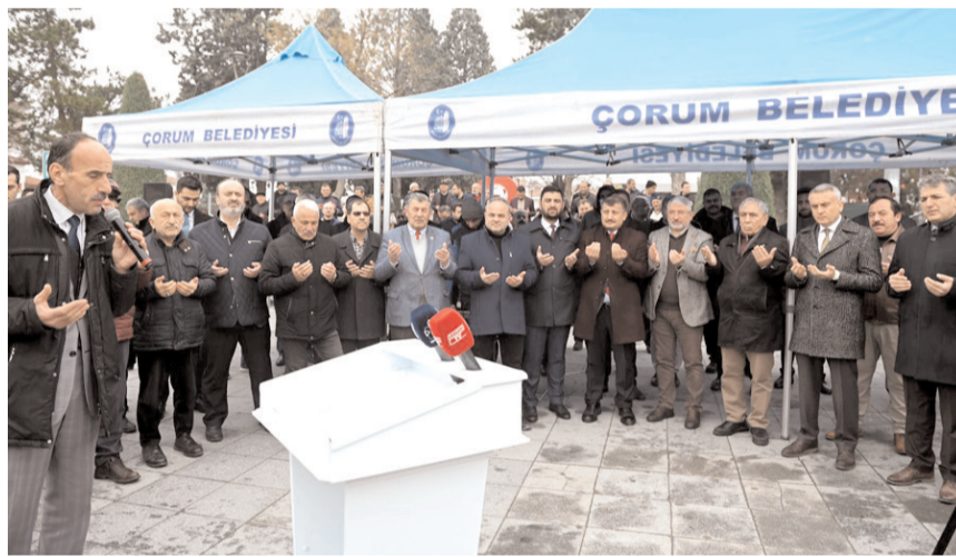
Konuşmaların ardından dua edildi.