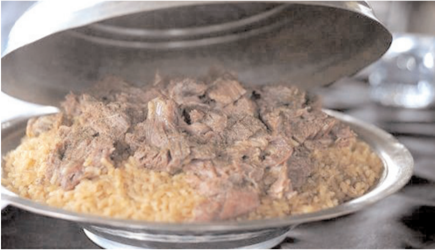
Bayat Belediyesi'nde 'Baharatlı Bayat Dolması'na coğrafi işaret alınması için başvuru yaptı.