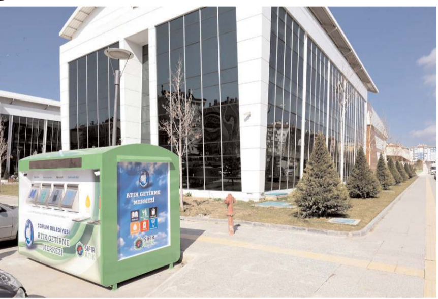
Şehrin farklı noktalarına 20 adet mobil atık getirme merkezi yerleştirilecek.