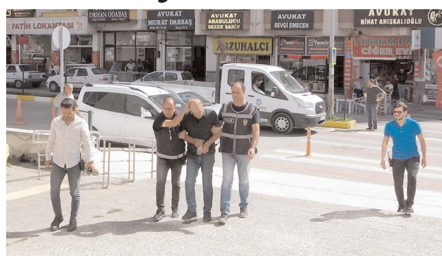
M.K., emniyetteki işlemlerinin ardından adliyeye sevk edildi.