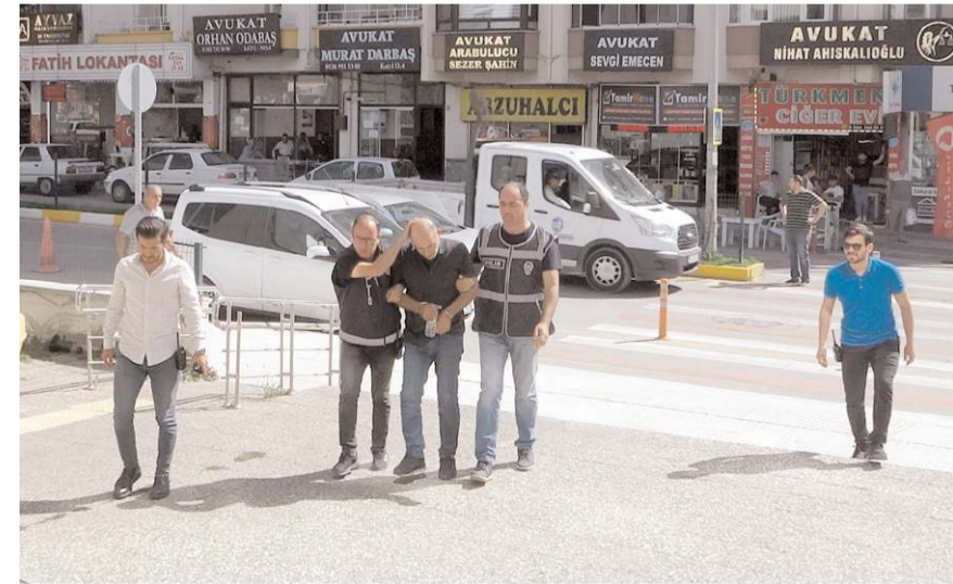
M.K, emniyetteki işlemlerinin ardından adliyeye sevk edildi.

Bunun üzerine Y.B, sivil polis gibi eve gelen M.K'ye yaklaşık 90 bin lira değerinde ziynet eşyası ile nakit parasını teslim etti. Banka hesabında 49 bin lirasının da olduğunu söylemesi üzerine M.K, Y.B'ye bu parayı da