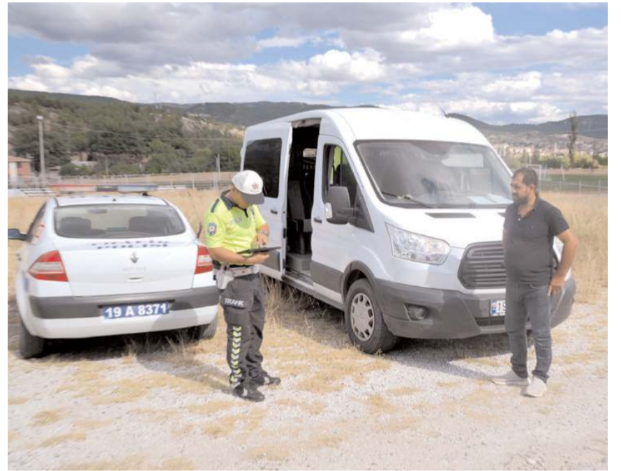
Toplantının ardından servis araçları denetlendi.