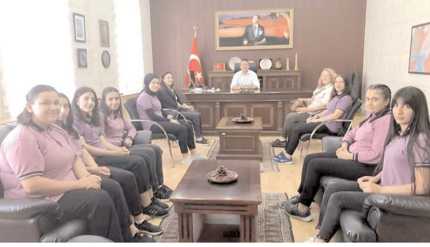
Öğrenciler Kaymakam Fatih Görmüş'ü ziyaret ettiler.

Portekiz ve İtalya'ya gidecek öğretmen ve öğrenciler hareket öncesi İlçe Kaymakamı Fatih Görmüş'ü ziyaret ederek proje konusunda bilgi verdiler. (İHA)