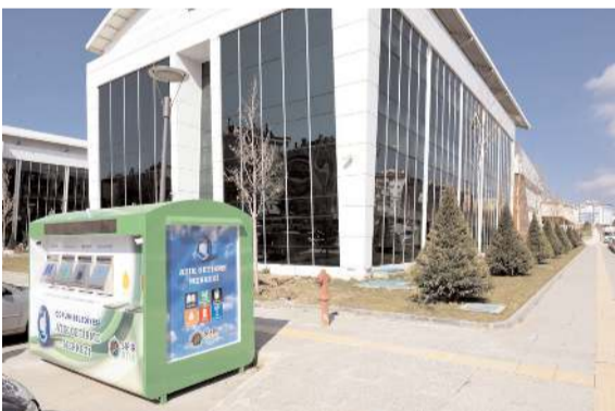
Şehrin farklı noktalarına 20 adet mobil atık getirme merkezi yerleştirilecek.