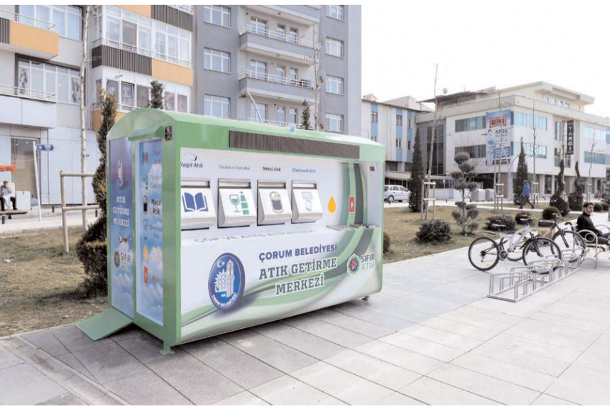
Mobil atık getirme merkezlerinin ihalesi geçtiğimiz günlerde yapıldı.

ulaştırıyoruz. Böylelikle organik atıklar dışındaki evsel atıklar doğaya atılmadan geri dönüşüme ve ülke ekonomisine kazandırılmış oluyor" dedi. (Haber Merkezi)