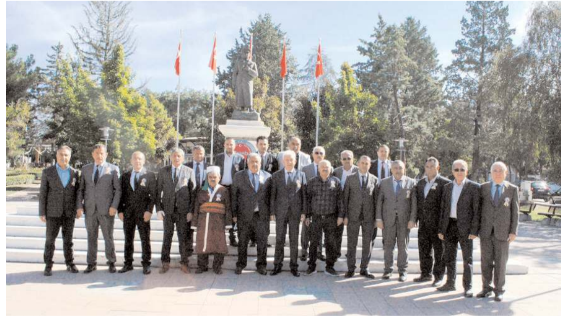
Kutlama etkinlikleri kapsamında Atatürk Anıtı'nda tören yapıldı.