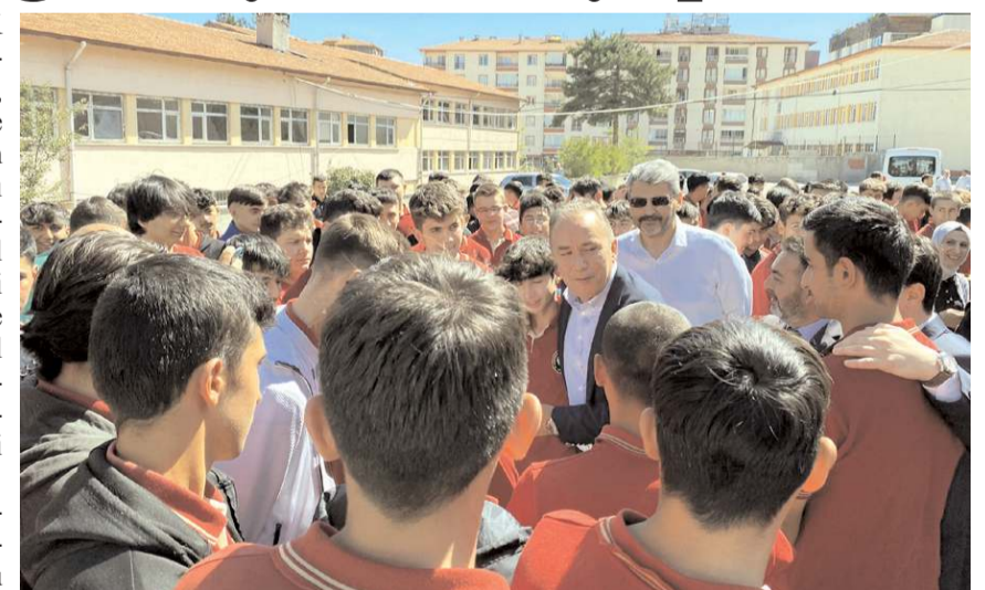
Milletvekili Ahmet Sami Ceylan, İskilip yatırımları hakkında açıklamalarda bulundu.

Kaderin gayrete aşık olduğunu ifade eden Cey- lan, "Gayret gösterirseniz mutlaka hedefe ulaşacaksınız. Yaptığımız işin en iyisi ve en güzelini yapın. Bu- nun için azami gayret gösterin. İlerde keşke dememek için çaba gösterin. Bu ülkenin, Çorum'un, İskilip'in