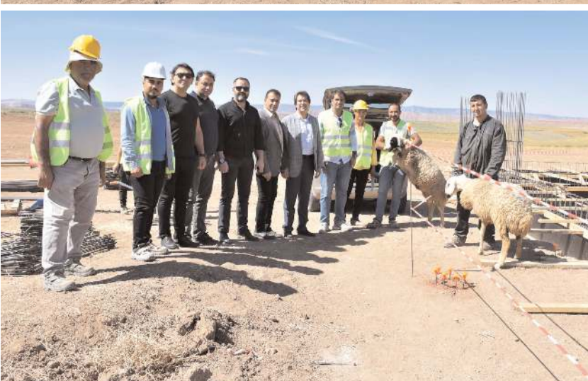
OSB'de temelleri atılan savunma sanayi yatırımlarının önümüzdeki yılın ilk yarısında faaliyete geçmesi planlanıyor.