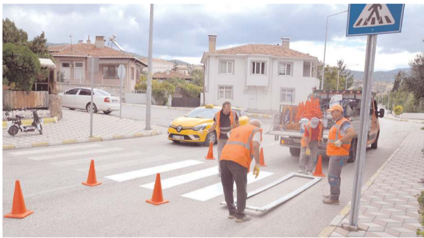
İlçede yaya geçitleri boyanarak yeniledi.