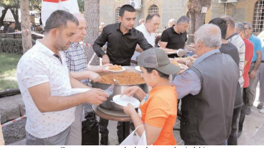
Cuma namazının ardından kent merkezindeki 6 camide cemaate Ahilik pilavı ikram edildi.