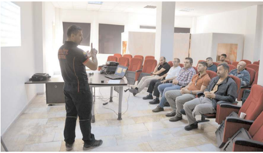
Sağlık İl Müdürlüğü tarafından verilen ilkyardım eğitiminin ardından İtfaiye Müdürlüğünde eğitimlere devam edildi.