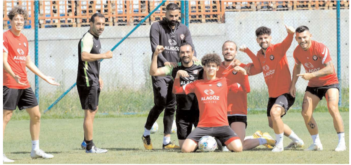
Çorum FK'nın dün sabah yaptığı antrenman sonunda kazanan takım oyuncularını galibiyet pozunu böyle verirken ligde alınan galibiyetlerin ardından tüm futbolcuların moralli olduğu görüldü