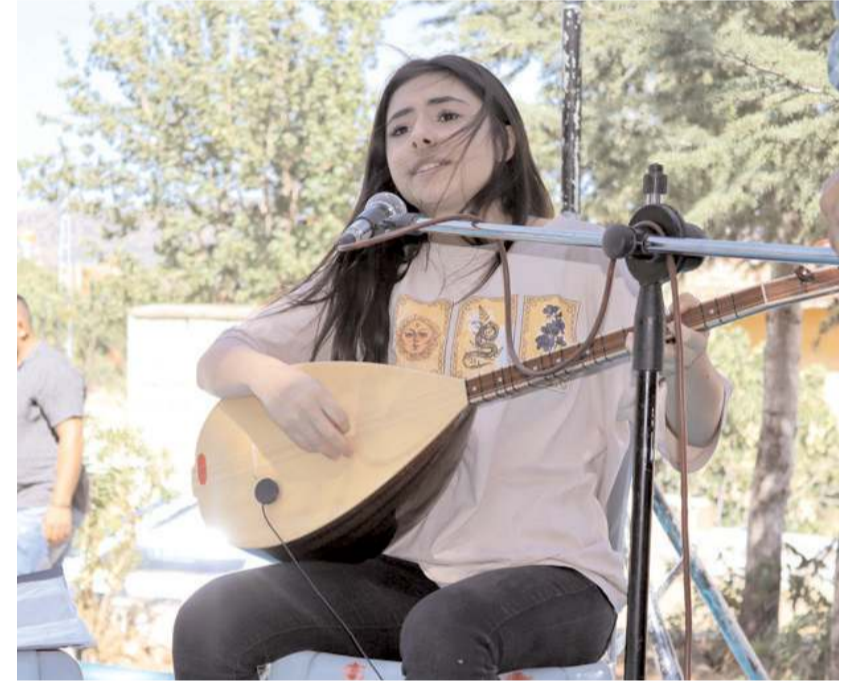
Konserin tüm geliri ailelerin ihtiyacı için kullanılacak.

Kampanyaya destek verenlere teşekkür edilirken, ilk bağışçısının Musa Eroğlu olduğu açıklandı. (İHA)