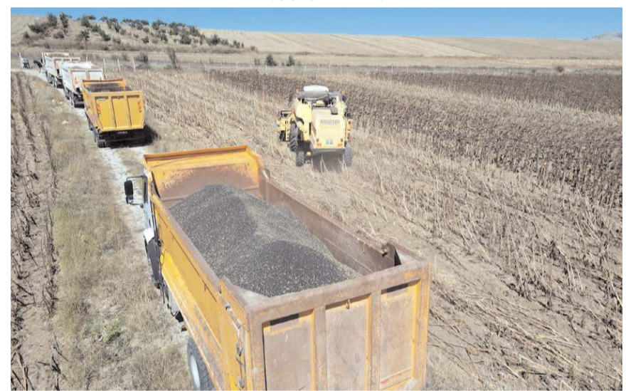
Belediye 80 dönümlük araziden 30 ton yağlık ayçiçeği hasat etmeyi hedefliyor.

de tuz biber olduğu- nu ifade eden Baş- kan Aşgın, "Bu kriz- den tarımsal üretim anlamında en az et- kilenen ülkelerin ba- şında Türkiye geli- yor. Çünkü Türkiye tarımda kendine ye- ten bir ülke olma- sının yanında tarımsal ürünlerde önemli ih- racat payına da sahip bir ülke. Çorum Be- lediyesi olarak ülke ekonomimize tarımsal alanda da katkı sağlamak için çalış- malarımızı başlattık. Bu yıl ilk tarımsal fa- aliyetimizi 80 dö- nümlük araziye yağ- lık ayçiçeği ekerek yaptık, bundan son- rası için Sayın Cum- hurbaşkanımızın ta- limatlarıyla tarıma elverişli arazileri ta- rıma kazandırarak ülke ekonomisine katkı sağlamaya de- vam edeceğiz" diye konuştu. (Haber Merkezi)