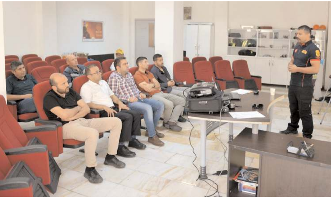
Ekiplere ilk yardım, yangın söndürme, arama kurtarma ve tahliye eğitimleri verildi.