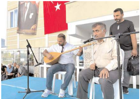
Aşıkların sözleri ile çalıyor söylediği deyişler ilgiyle dinlendi.

sayesinde Türk ulusunun kucagında bağrında Kurtuluş Savaşımız başarıyla sonuçlanmıştır. Biz bugün bunun sonucu olarak huzur ve barış içerisinde birlik içerisinde bu güzel coğrafyada kutsal vatanımızda bir arada bulunmanın onurunu coşkusunu ve mutluluğunu taşıyoruz. Bize bugünleri bırakan Atatürk başta olmak üzere bütün arkadaşlarına ve emek veren herkese Anadolu aydınlanmasının kutsal mimarlarına teşekkür borçluyuz. Hepsinin ruhları şad olsun. Birlik kardeşlik aydınlanma özgürlük ve bağımsızlık içerisinde barış içerisinde yaşamaktan başka bir şey istemiyoruz. Türk ulusu bunu hak etmektedir. Sevgili canlar; hepimiz Türk ulusunun çimentosuyuz. Hepimiz bu birliği bu bütünlüğü yaşatmak için bir arada olacağız. Ehlibeyt Kudret Dağı Vakfı buna katkı vermektedir. Biz bir araya getirmekte bu kutsal değerleri hatırlatmaktadır. Paylaştıkça değerler artar. Gönüller paylaştıkça bir olur. Bu nedenle etkinlik son derece önem taşımaktadır" ifadelerini kullandı.