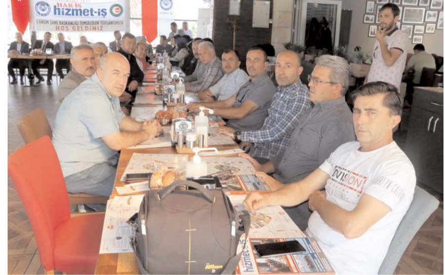
Hizmet-İş Sendikası Çorum Şube Başkanlığı Temsilciler Toplantısına katılım yüksek oldu.