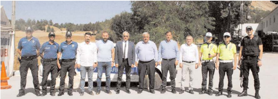
Günün anısına hatıra fotoğrafı çekildi.

Bu yıl 35.'si kutlanan Ahilik Haftası dolayısıyla ÇESOB tarafından sürücülere Ahilik leblebisi ikram edildi.