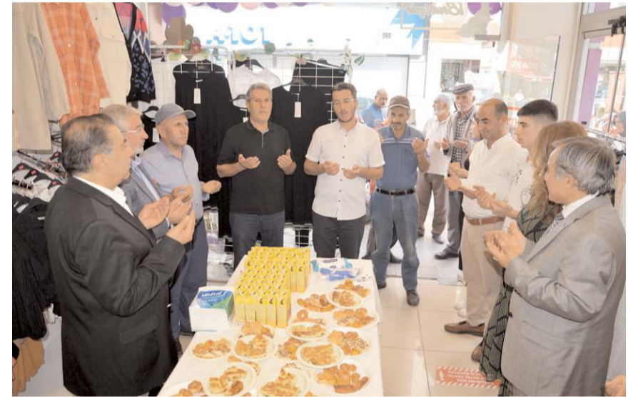
Açılışta dua edildi.