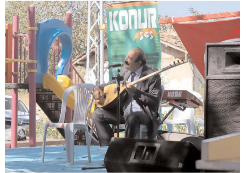
Saz ve bağlama eşliğinde seslendirilen ezgiler davetlilere moral oldu.