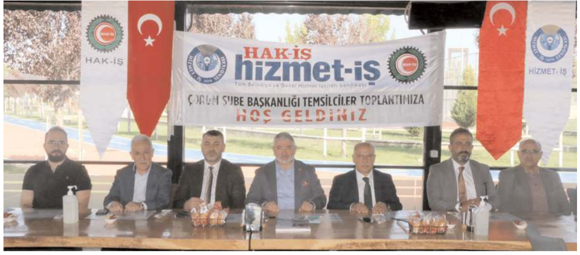
Hizmet-İş Sendikası Çorum Şube Başkanlığı Temsilciler Toplantısı Millet Kafe'de yapıldı.

ulaştırıyoruz. Böylelikle organik atıklar dışındaki evsel atıklar doğaya atılmadan geri dönüşüme ve ülke ekonomisine kazandırılmış oluyor" dedi. (Haber Merkezi)