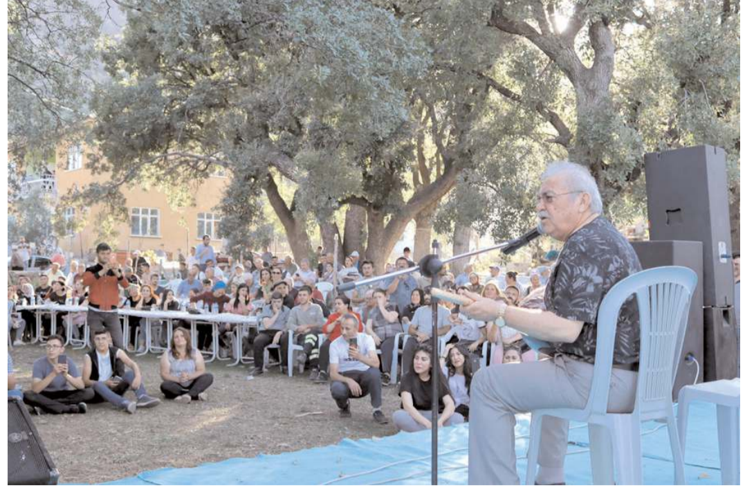
Konser Mehmet Dede Tekke köyünde gerçekleştirildi.

İlk yardım ekibi, yangın söndürme ekibi, arama kurtarma ve tahliye ekibinin eğitim programının ikinci aşaması olan yangın söndürme, arama kurtarma ve tahliye eğitimlerini Çorum Belediyesi İtfaiye Müdürlüğü personelleri veriyor. Ekiplere verilen dersler bünyesinde ev ve iş yerlerinde kullanıcı kaynaklı çıkan yangınlar, elektronik eşyalardan ve elektrik tesisatlarından kaynaklı yangınlar, yangınlara müdahale etme yöntemleri, yangından etkilenen kişi ve kişileri tahliye etme yöntemleri, olası doğal afetler ve kazalarda arama kurtarma ve müdahale teknikleri konularında eğitimler verildi. (Haber Merkezi)