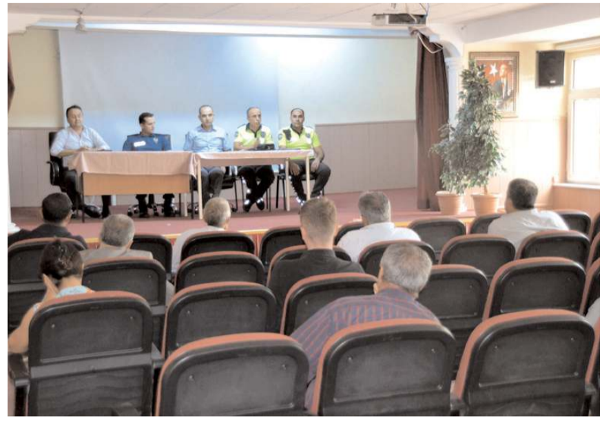
Toplantıda, şoförler uymaları gereken kurallar hakkında bilgilendirildi.

Yapılan toplantının ardından servis araçları ve sürücülerin evrakları trafik ekipleri tarafından denetlendi. Yapılan kontrollerde, servis araçlarının Millî Eğitim Bakanlığı yönetmeliklerine yönelik uygunluğu incelendi. (İHA)