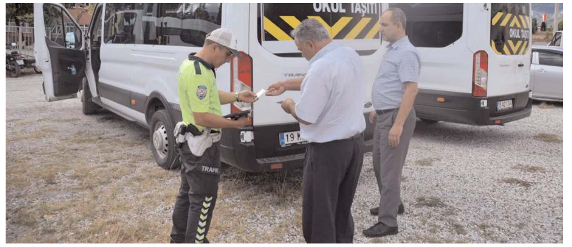
Denetimde şoförlerin belgeleri ile araçlar kontrol edildi.