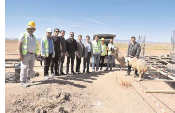
OSB'de temelleri atılan savunma sanayi yatırımlarının önümüzdeki yılın ilk yarısında faaliyete geçmesi planlanıyor.