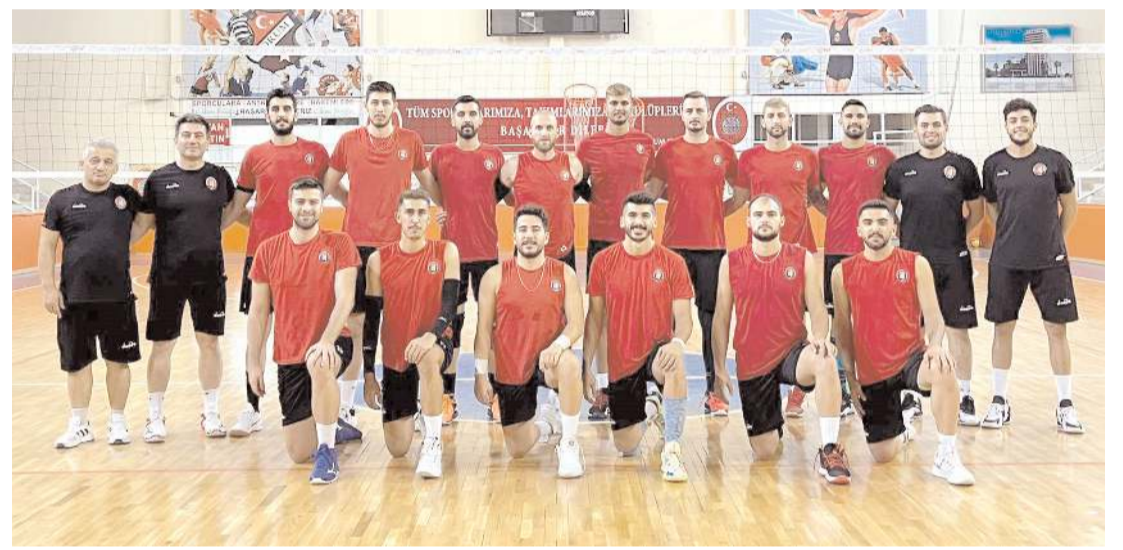
Çorum Belediyesi Gençlikspor ilk hazırlık maçında bugün Tokat Belediye Plevnespor ile karşılaşacak