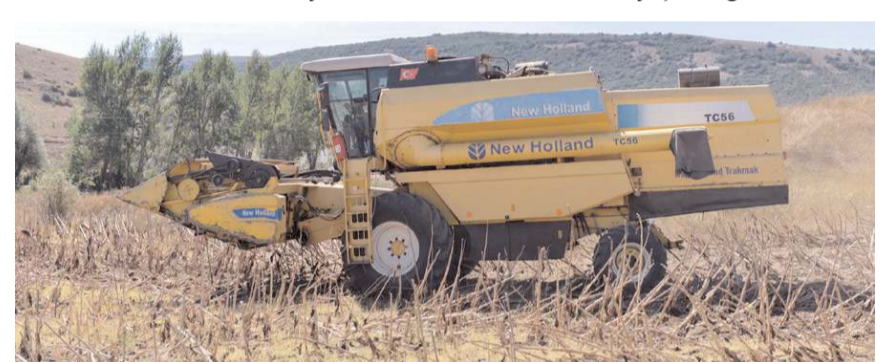
Arazide ayçiçeği hasadı yapıldı.

Dünya genelinde son yıllarda pandemiyle be- raber yaşanan gıda krizine Rusya- Ukrayna krizinin