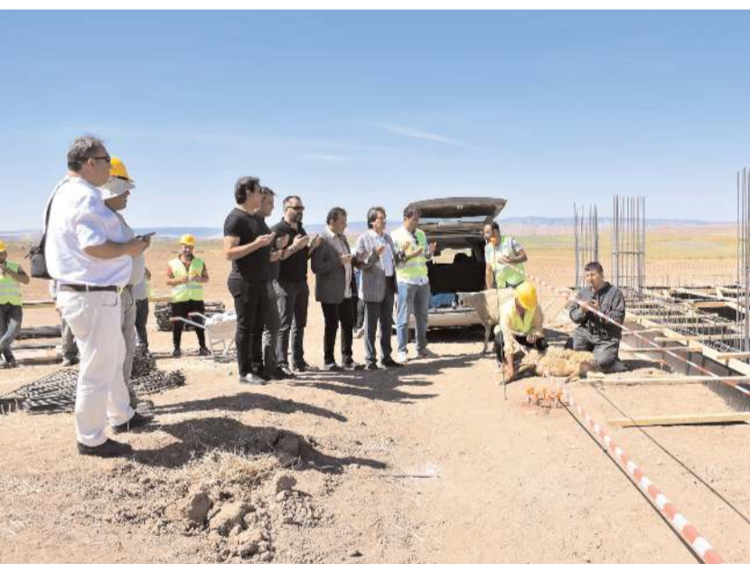
Sungurlu Ticaret ve Sanayi Odası yönetiminin ziyaretinde dua edilip kurban kesildi.