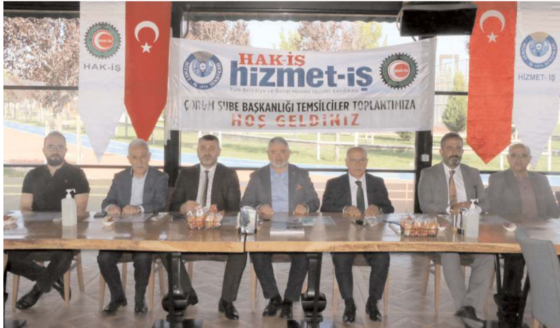
Hizmet-İş Sendikası Çorum Şube Başkanlığı Temsilciler Toplantısı Millet Kafe'de yapıldı.