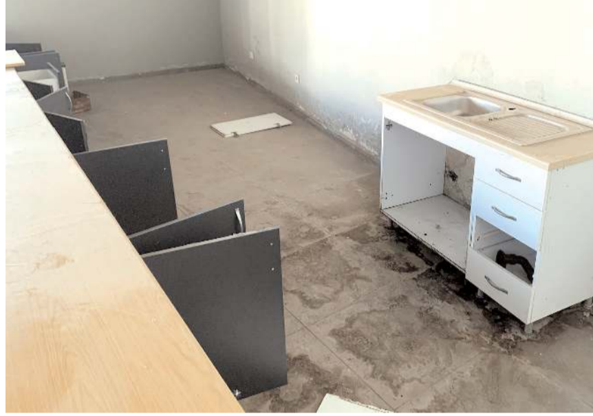
Tribün altındaki büfe dolaplarının tahrip edilmesinden sonraki görüntüsü