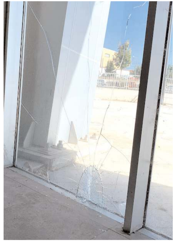
Stadyum çıkışında camların da kırıldığı tesbit edildi

ardından yaklaşık 1 saat aşkın bekletilen Bursaspor taraftarları kontrollü şekilde şehirden ayrıldılar. Onların ayrılmasının ardından Stad Müdürü ve Federasyon Temsilcileri tribün ve içeri girerek inceleme yaptı. İnceleme sonunda yaklaşık 70 kadar koltuğun kırıldığı, bu bölüme ait büfenin dolaplarının kırıldığı ve dış tarafta bulunan büyük bir camın kırıldığı tesbit edilerek tutanak ile Federasyon'a gönderildi.