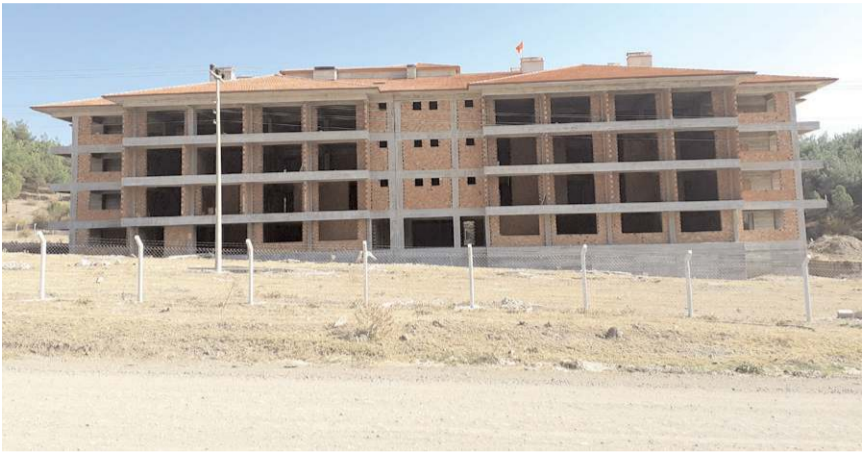
Huzurevi inşaatının yer teslimi yüklenici firmaya yapıldı.

2023 tarihinde Çorum Aile ve Sosyal Hizmetleri İl Müdürlüğüne teslim edilmesi planlanmaktadır. Osmancık Huzurevi Yaşlı Bakım ve Rehabilitasyon Merkezi ikmal binası, bodrum, zemin, 3 normal kat olmak üzere 5 kat olup, 5 bin 992 metrekare inşaat alanı bulunmaktadır. 84 adet yatak kapasitesi bulunan binada 42 adet yaşlı yaşam odası, revir, ilk kabul muayene odası, FTR salonu, sosyal servis odası, uğraş-hobi odası, yemekhane, yaşlı dinlenme odası, kat yaşam salonu, mutfak, çamaşırhane, mescit ve idari odalardan oluşmaktadır. Toplam ihale bedeli 18 milyar 675 milyon liradır. Huzurevi inşaatının tamamlanması için desteklerinden dolayı Genel Başkanımız, Cumhurbaşkanı Recep Tayyip Erdoğan'a, Aile ve Sosyal Politikalar Bakanımız Derya Yanık ve Çorum Milletvekili Oğuzhan Kaya'ya ilçe halkımız adına teşekkür ediyorum" dedi. (İHA)