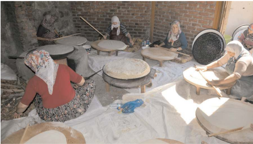
Kış hazırlığına devam eden kadınlar, imece usulü yufka ekmeği yapımına başladı.