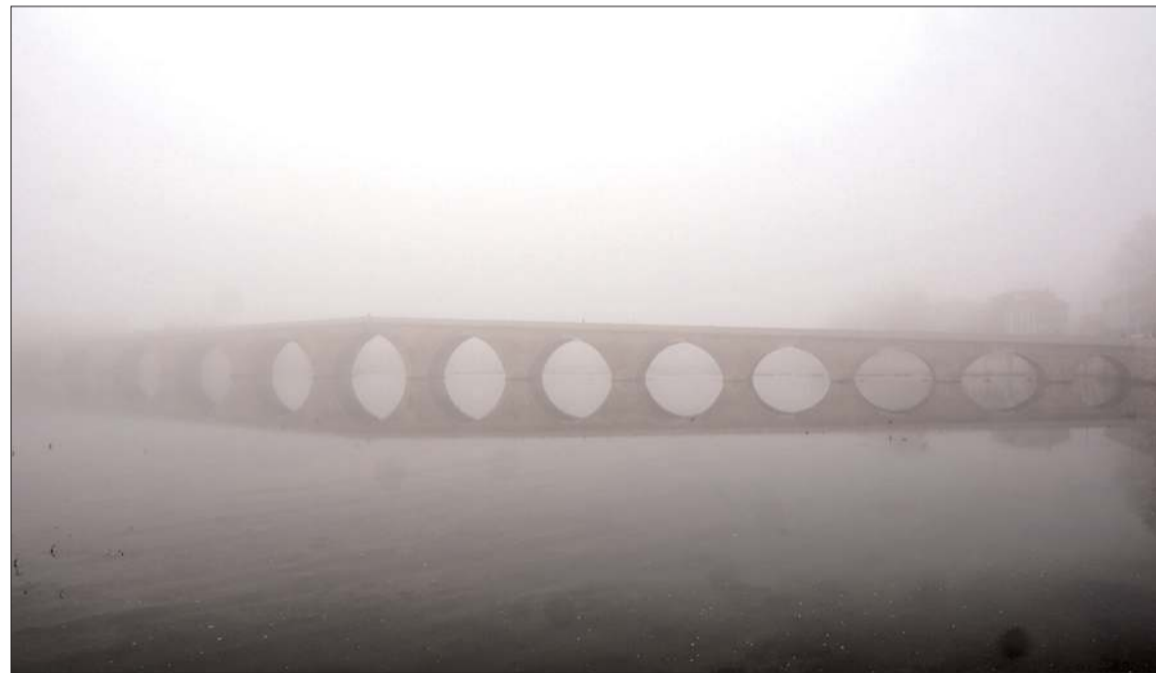
Yoğun sis nedeniyle görüş mesafesi düştü.

Kazayla ilgili olarak başlatılan inceleminin devam ettiği öğrenildi. (İHA)