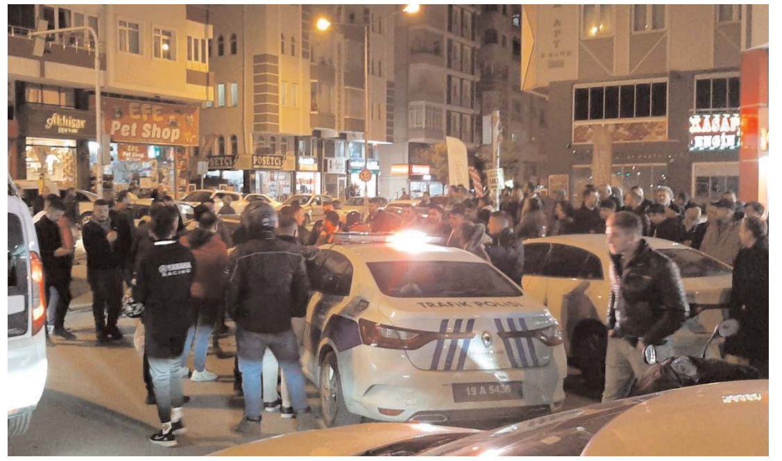
Kaza Bahabey Caddesi'nde meydana geldi.

Merhumun cenazesi Sungurlu'ya bağlı Yeşilova köyünde toprağa verildi.