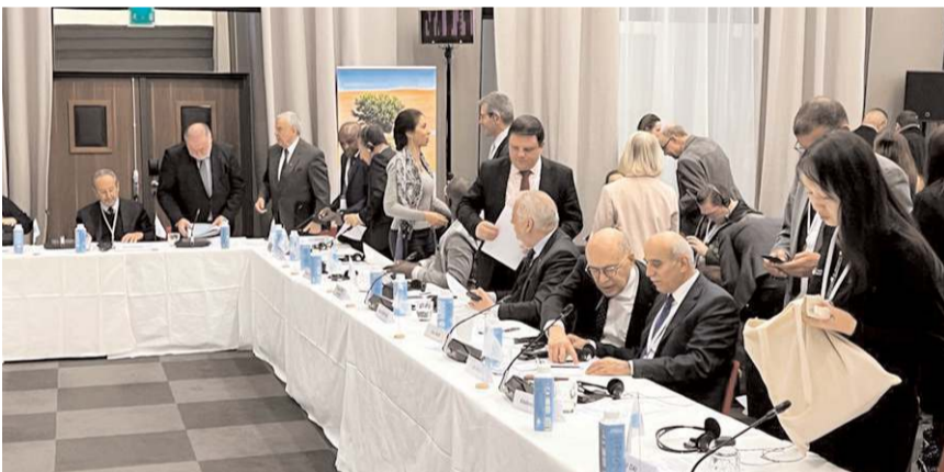
Genel kurulda 2022 - 2025 dönemi için Yönetim Kurulu Seçimi gerçekleştirildi.

Dünya Su Konseyi 9. Genel Kurul Toplantısı, 10 - 11 Aralık 2022 tarihleri arasında Fransa'nın başkenti Paris'te gerçekleştirildi. Genel Kurul Toplantısında, Dünya Su Konseyi'nin gelecek dönem çalışma programı ve bu döneme ilişkin genel politika ve stratejileri görüşüldü. Denetçi raporu, yıllık mali tablolar, Dünya Su Konseyi hesapları ile gelecek döneme ilişkin gelir ve gider tahminleri onaylandı. 2022 - 2025 dönemi için 5 koleji temsil eden Yönetim Kurulu Seçimi gerçekleştirildi.