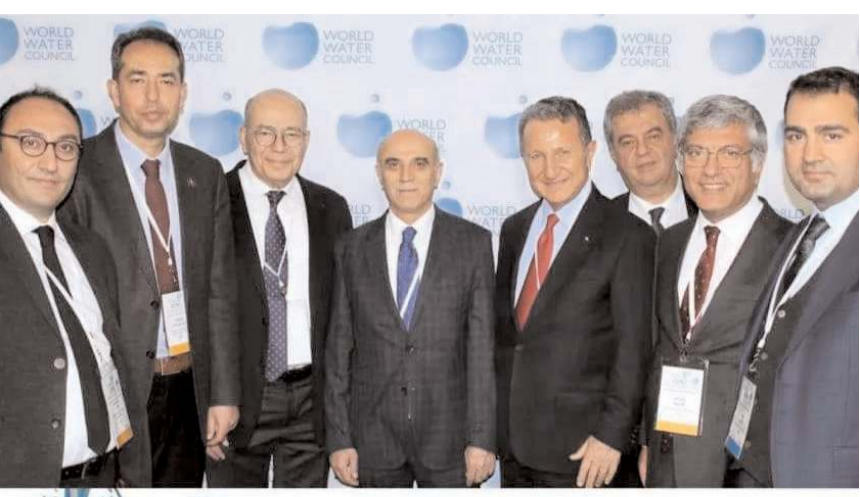
Dünya Su Konseyi (WWC) 9. Genel Kurul Toplantısı Fransa'nın başkenti Paris'te gerçekleştirildi.

teşkilatlandı. Önemi her geçen gün artan su kaynakları ile ilgili farkındalığın geliştirilmesi, küresel su kaynaklarının yeryüzünde yaşayan tüm canlıların yararına olabilecek biçimde etkin korunması, geliştirilmesi, planlanması, yönetilmesi ve sürdürülebilir yönetiminin temini amacıyla kurulan WWC'nin merkezi Fransa'nın Marsilya şehrinde bulunuyor.