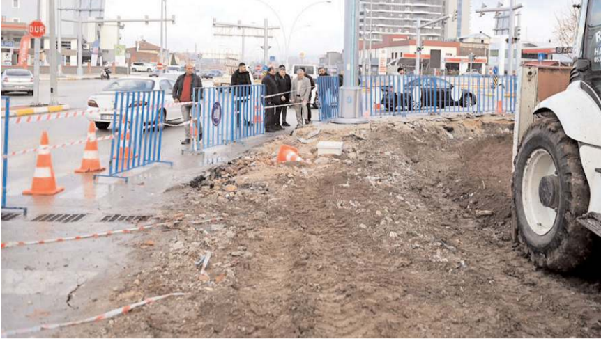
Belediye Tuzcular Kavşağı'nda yeni bir çalışma başlattı.