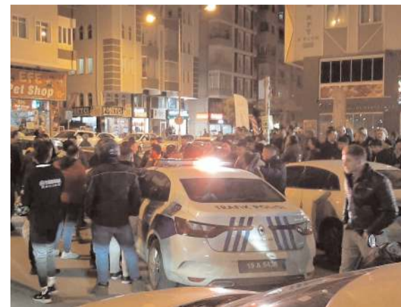
Kaza Bahabey Caddesi'nde meydana geldi.