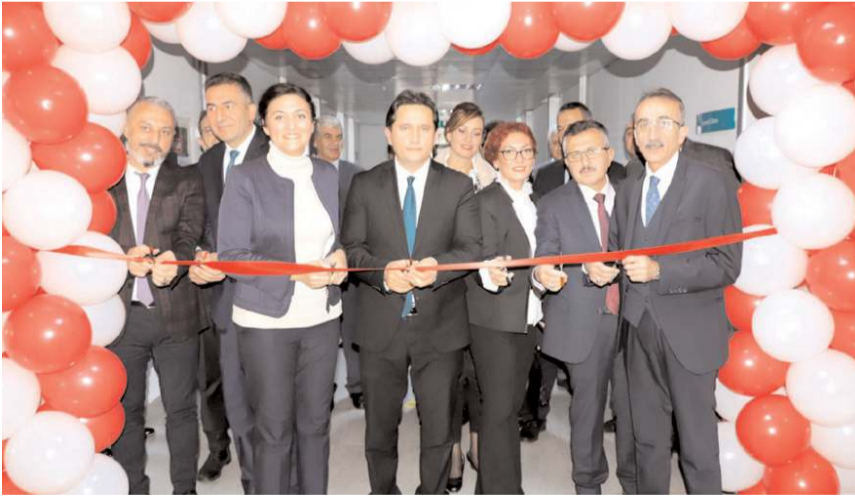
Psikolojik İlk Yardım ve Travma Önleme Birimi için açılış töreni yapıldı.

Doğu Karadeniz Projesi Bölge Kalkınma İdaresi Başkanlığı (DOKAP) tarafından desteklenen Psikolojik İlk Yardım ve Travma Önleme Birimi düzenlenen törenle açıldı.