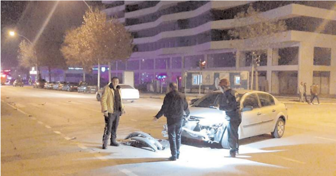
Polis ekipleri kaza yerinde incelemede bulundu.

Kazada yaralanan 4 kişi, ambulanslarla Hitit Üniversitesi Erol Olçok Eğitim ve Araştırma Hastanesi ile kentteki bir özel hastaneye kaldırıldı.(AA)