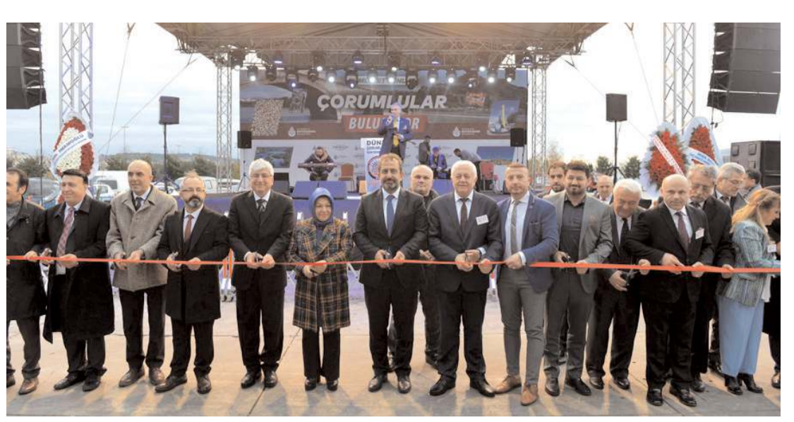
İstanbul'da düzenlenen Çorum Tanıtım Günleri açılış kurdelesi kesildi.