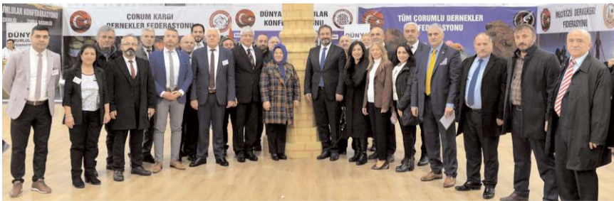
Açılışın ardından toplu hatıra fotoğrafı çekildi.

Çorum Belediyesi, şehrin tarihi güzelliklerini, kültürel mirasını, eşsiz güzelliklerini ve gastronomisini tanıtmak amacıyla İstanbul'da düzenlenen Çorum Tanıtım günlerinde yerini aldı. Dünya Çorumlular Konfederasyonu tarafından 15-18 Aralık tarihleri arasında İstanbul / Maltepe'de gerçekleştirilen tanıtım günlerine İstanbul'daki Çorumlular yoğun ilgi gösterdi.