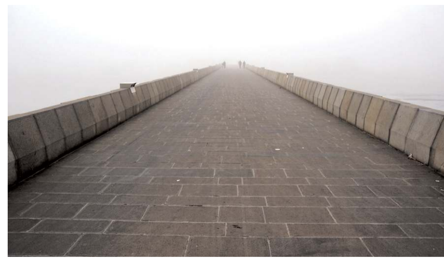
yüksekliğe sahip kayanın üzerinde bulunan 7 bin yıllık Osmancık nedeniyle neredeyse görünmez oldu.