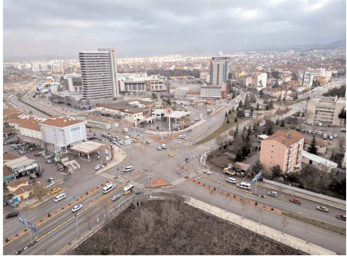
Çalışmanın tamamlanması ile Fevzi Çakmak Caddesi'nden Cengiz Topel Caddesi'ne dönüşler rahatlayacak.

Aşgın, "Tuzcular Kavşağı'nda başladığımız yeni çalışmamız ile Fevzi Çakmak Caddesi'nden Cengiz Topel Caddesi'ne dönüşte yaşanan sıkıntıları ortadan kaldırıyoruz. Çift şerit olan yolunuzu genişleterek üç şerite çıkartıyor, trafiği rahatlatıyoruz." dedi.