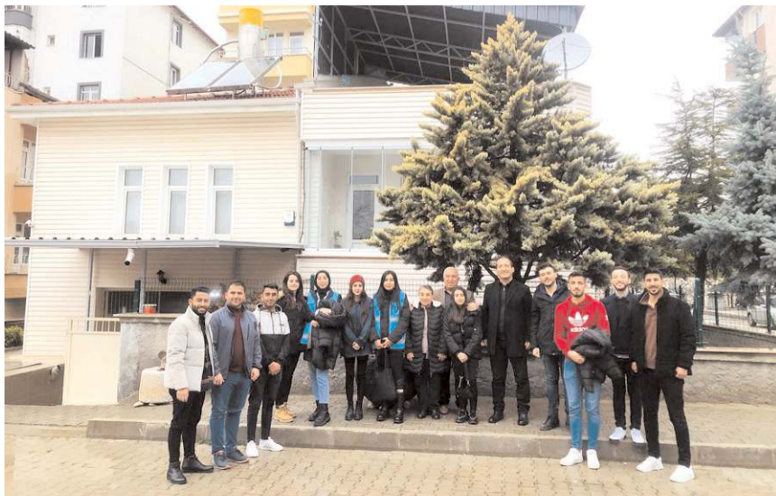
Ziyaretin sonunda toplu hatıra fotoğrafı çekildi.