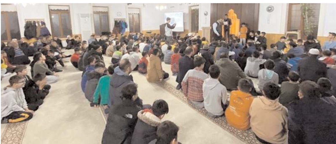
"Cami-Gençlik Buluşması" programı Merkez Orhan Gazi Camisi'nde gerçekleştirildi.

Program sonrası ikramda bulunulurken gençlere Diyanet İşleri Başkanlığı yayınlarından kitaplar hediye edildi. (Haber Merkezi)