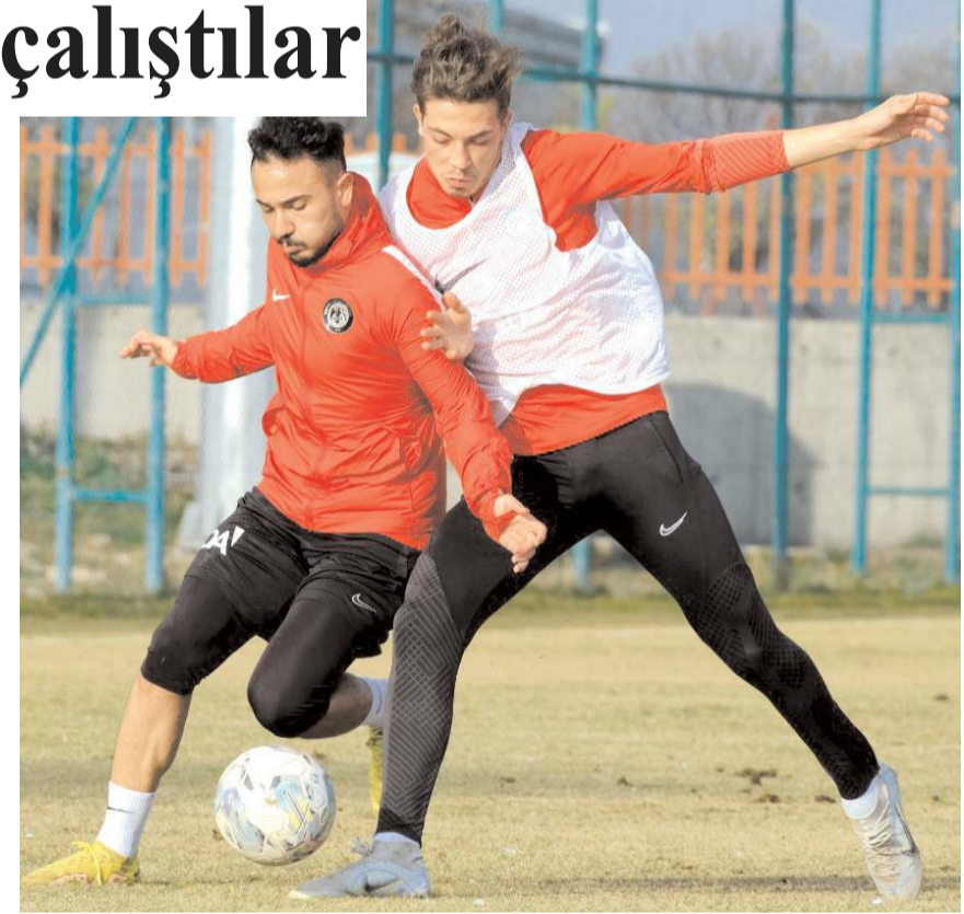
futbolculardan yapmaları gerekenleri uygulamalı olarak anlattı.