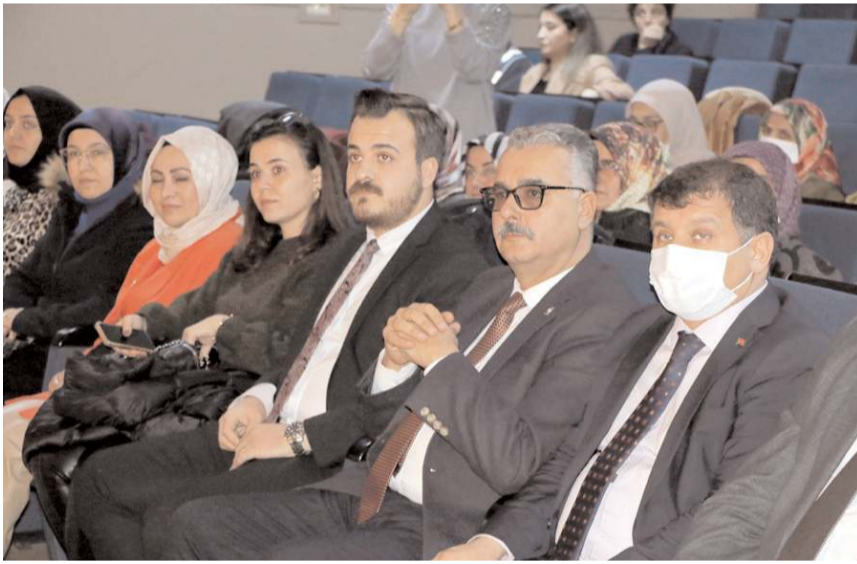
Söyleşi Buhara Kültür Merkezi'nde yapıldı.