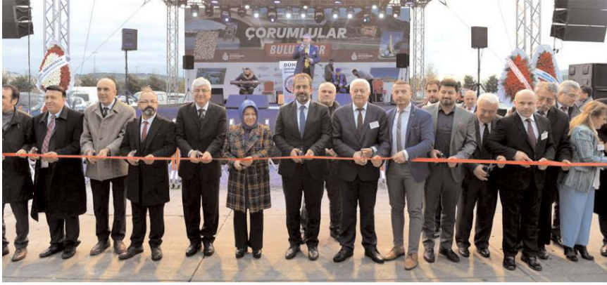
İstanbul'da düzenlenen Çorum Tanıtım Günleri açılış kurdelesini kesildi.