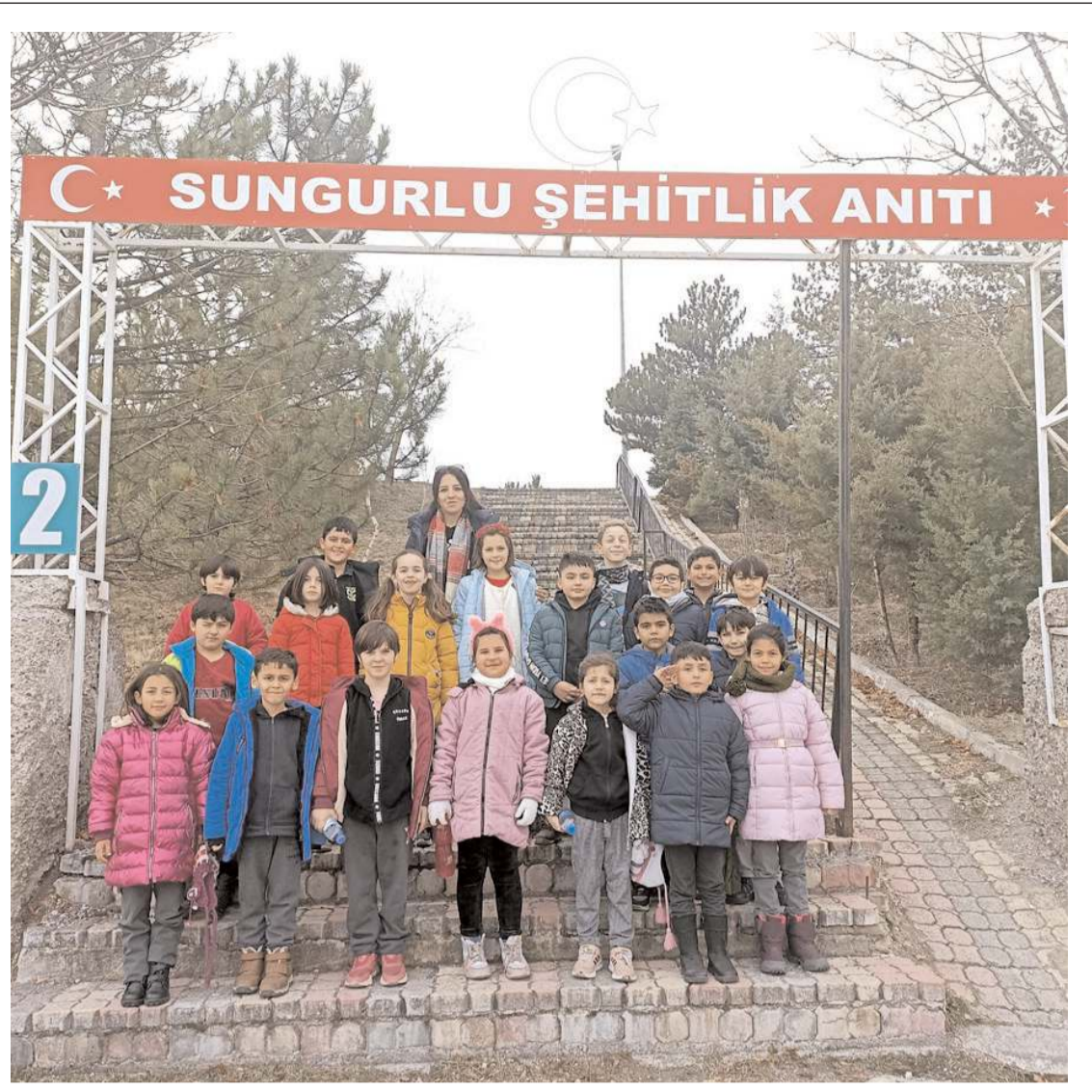
Sunguroğlu İlkokulu 2-B sınıfı öğrencileri Karşıyaka Mezarlığında bulunan şehitliği ziyaret ettiler.