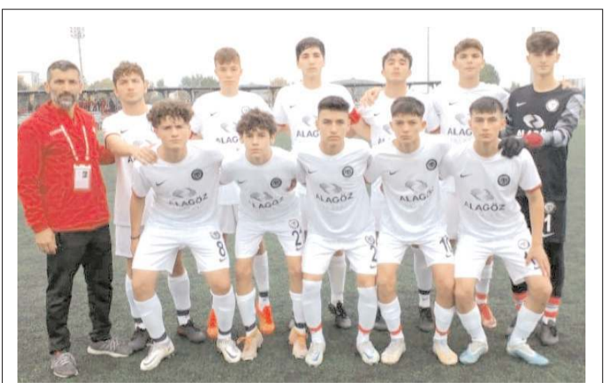
Çorum FK U 16 takımı yarın sahasında Boluspor'u konuk edecek