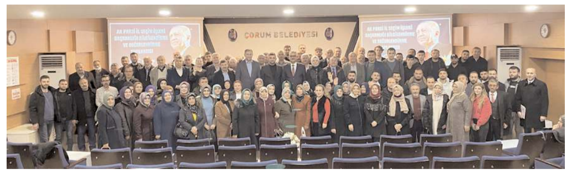
AK Parti istişare ve değerlendirme toplantısı yapıldı.