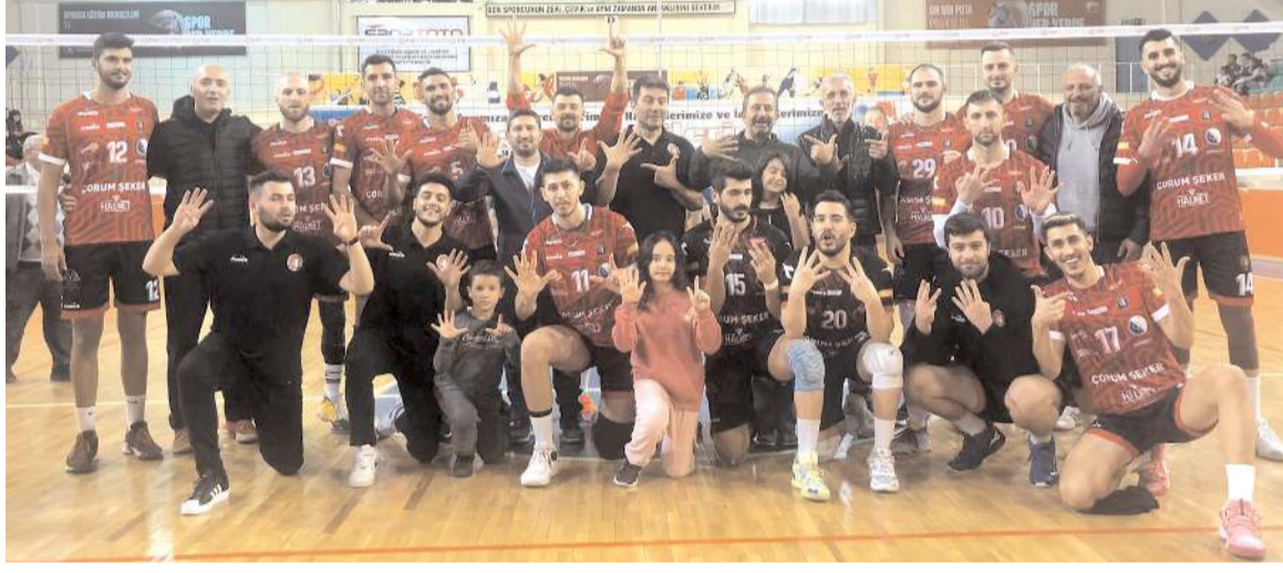
Çorum Belediyesi Gençlikspor ilk yarıda dokuz maçında kazanarak açık ara lider durumda bulunuyor.