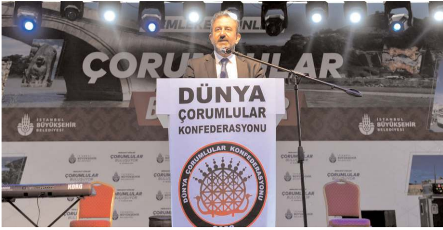
Törende Çorum Belediye Başkan Yardımcısı İsmail Yağbat konuşma yaptı.