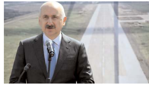
Ulaştırma ve Altyapı Bakanı Adil Karaismailoğlu