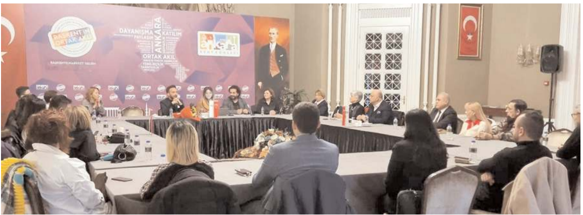
Toplantıda Ankara Kent Konseyi'nin 2023 yılında yapacağı projeler istişare edildi.