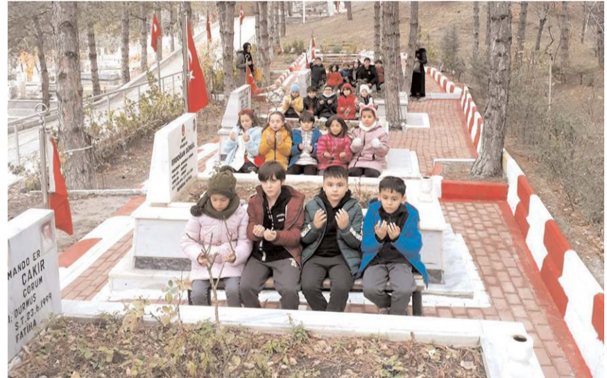
Minikler şehitler için dua ettiler.