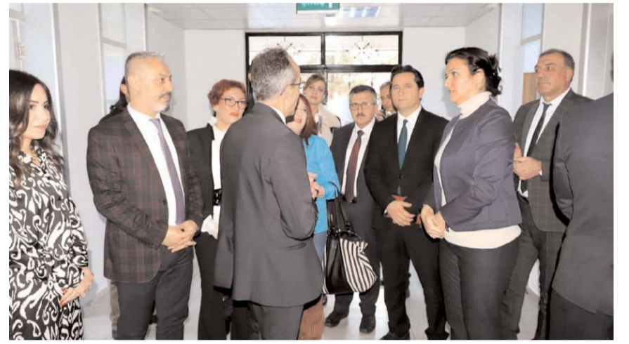
Psikolojik İlk Yardım ve Travma Önleme Birimi yetkilileri bilgi verdiler.

uzman odaları ve bekleme salonları ile Psikolojik İlk Yardım Birimi amaç ve hedeflerimizi uygulayabileceğimiz şekilde hizmete hazır hale getirilmiştir. Dünyada İngiltere, Amerika, Kanada ve Avustralya'dan sonra beşincisi Türkiye'de Çorum Rehberlik ve Araştırma Merkezi Müdürlüğü olmuştur. Hizmetlerimiz ücretsiz ve herkese açık sunulacaktır. Bu projede emeği geçen tüm herkese teşekkür ediyor, ilimizi adına hayırlı uğurlu olmasını diliyorum" dedi. (Haber Merkezi)