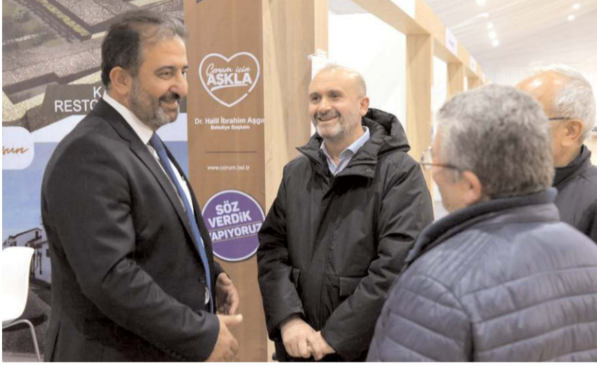
Çorum Tanıtım Günleri'nde Çorum Belediyesi'nde stant açtı.