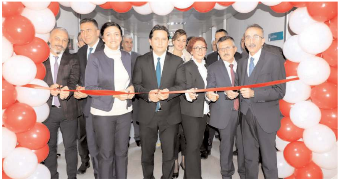
Psikolojik İlk Yardım ve Travma Önleme Birimi için açılış töreni yapıldı.