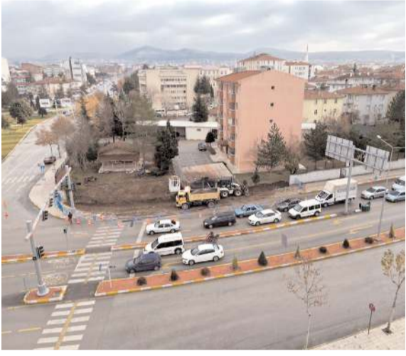
Kavşakta, Fevzi Çakmak Caddesi'nden Cengiz Topel Caddesi'ne dönüşlerde sıkıntı yaşanıyor.