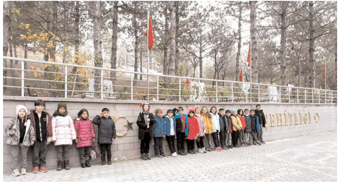
Minikler ziyaretin anısına şehitlik önünde toplu fotoğraf çekindiler.