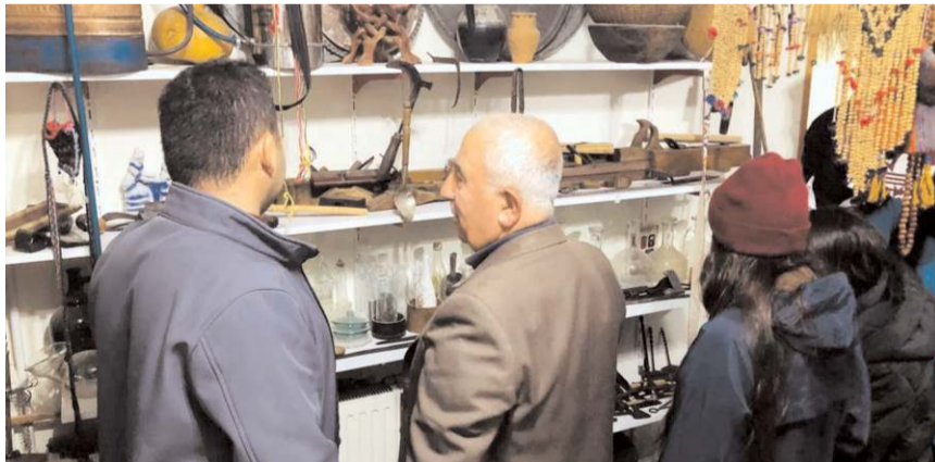
Öğrenciler tarihi eşyaları yakından inceledi.