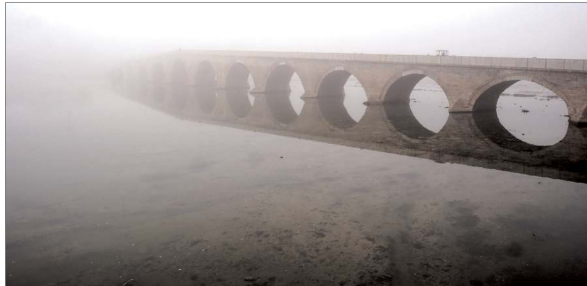
Koyunbaba Köprüsü, sisle güzelliğine güzellik kattı.