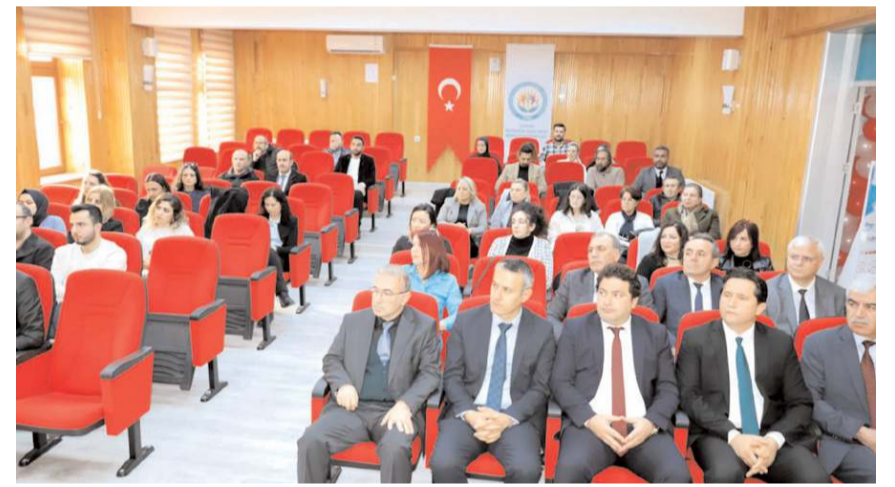
Birim Çorum Rehberlik ve Araştırma Merkezi Müdürlüğünde açıldı.