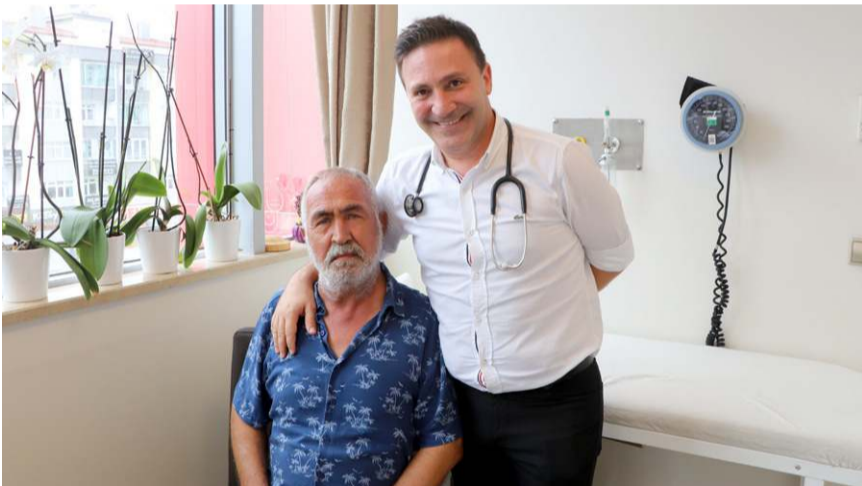
Prof. Dr. Şevket Özkaya, konuyla ilgili açıklamada bulundu.

Vakayı aşımın koruduğunu söyleyen Özkaya, "Asıl ilginç olan olay şu: Hastamız 29 Mart 2021'de ilk aşımını Sinovac oluyor ve o zamana kadar tüm testleri negatif çıkıyor. 26 Nisan 2021'de ikinci aşımını da Sinovac oldu, yine o zamanda tüm testleri negatif çıktı. Hastamızın 2 Sinovac aşısından sonra antikorları arttı ve aşya ciddi bağışıklık kazandı. İlk vurulduğu aşından yaklaşık 1,5 ay sonra antikorları ciddi anlamda arttı ve bağışıklık kazanmaya başladı. Devamında Biontech aşılarıyla aşılmasını tamamladı. Bugüne kadar 138 test vermiş olan hastamızın 137. testi negatifle sonuçlanmış, 138. testi iste pozitifle sonuçlanmıştır. Bu aslında vaka bazında düşünülürse aşıların çok sayıda vakalar üzerinde çalışılmasından öte bireysel anlamda düzenli olarak PCR testide verdiği için şu anda hastalığının hafif geçmesini sağlamıştır. Herkes bu virüsle karşılaşacak ama aşıyla korunabileceğimizi söylüyoruz. Bu vakayı da aşımın koruduğunu söyleyebiliriz" ifadelerini kullandı. (İHA)