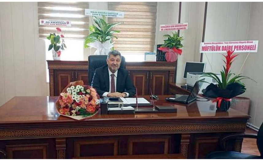
Sungurlu İlçe Müftüsü Süleyman Eroğlu

Sungurlu İlçe Müftülüğüne atanan Süleyman Eroğlu göreve başladı.