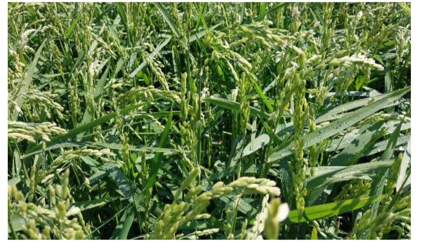
Devrez Çayı'ndan sulanan çeltik tarlaları kurumaya başladı.

Verilen bilgiye göre; 2012 yılında Devrez Çayı üzerine Kızlıryolu Barajı yapılması planlandı. ÇED raporları ve bilgilendirme toplantılarının ardından yapılan proje, rafa kaldırıldı. DSI 5. Bölge