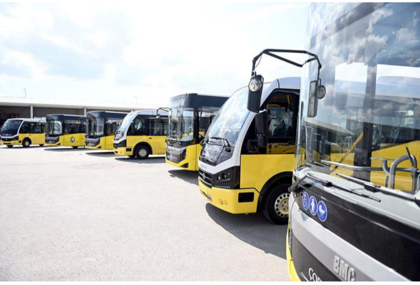
Çorum Belediyesi geçtiğimiz günlerde yeni araçlar almıştı.