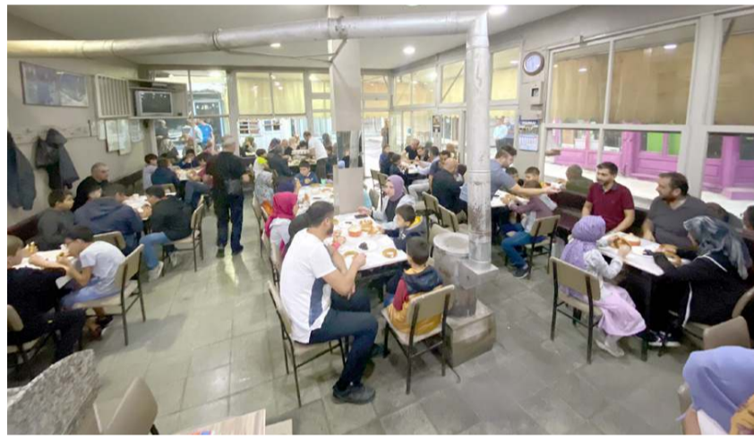
Namazın ardından kahvaltı yapıldı.

Başkan Aşgın kahvaltı sonrasında sabahın ilk ışıkları ile birlikte mesaiye başlayan belediye temizlik işçileri ile de sohbet ederek onlara görevlerinde kolaylıklar diledi. (Haber Merkezi)