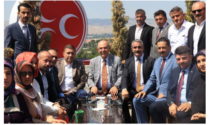
Toplantılar 12-14 Ağustos tarihleri arasında gerçekleştirildi.