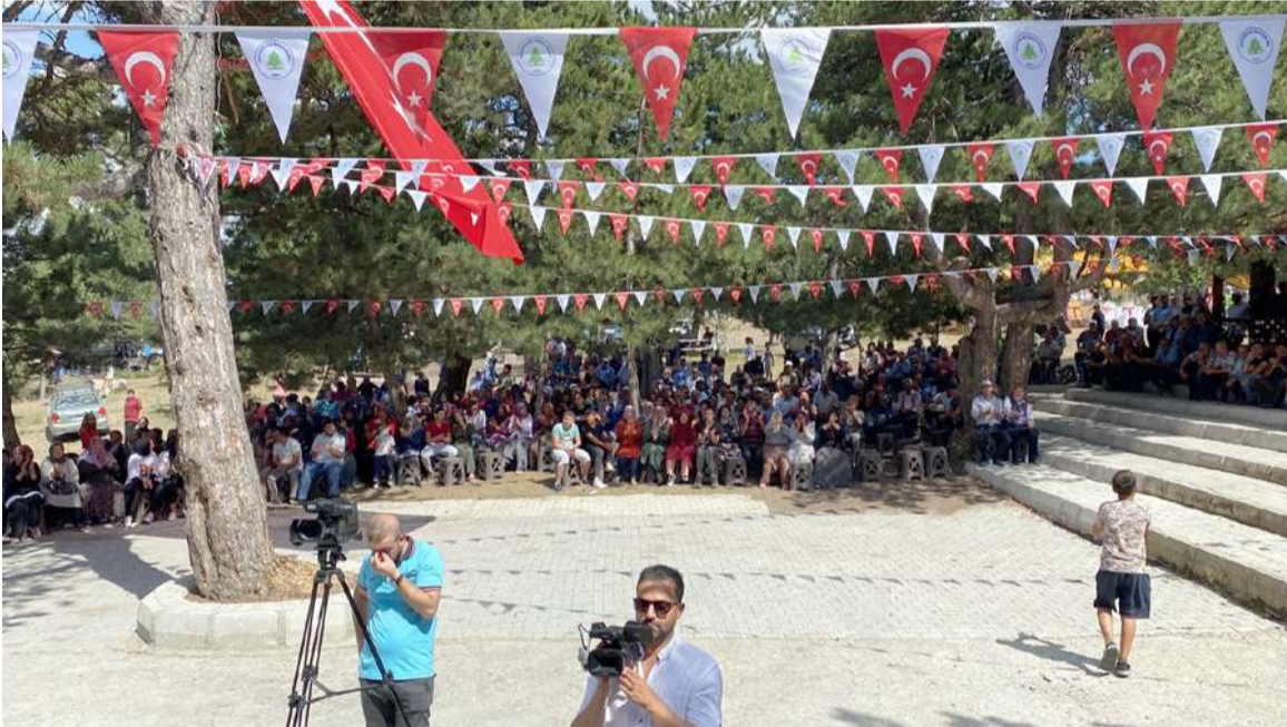
Uğurludağ Beyoğlu Yayla ve Kültür Şenliği yapıldı.