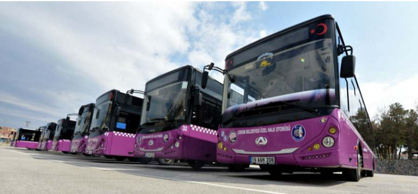
Çorum Belediyesi, son olarak kalan diğer otobüsleri de alarak şehir içi toplu ulaşımda tek söz sahibi oldu.