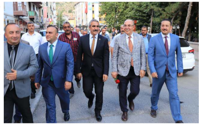
MHP Genel Merkez yöneticileri ilçeleri ziyaret etti.