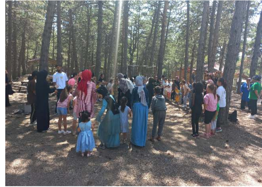
Çatak'ta yapılan pikniğe katılan çocuklar gönüllerince eğlendiler.