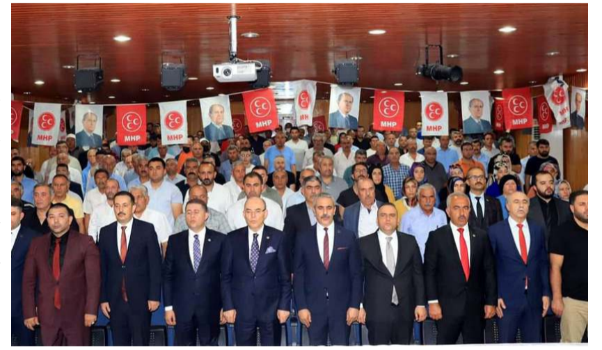
Toplantılar Merkez İlçe ve 13 İlçeyi kapsayacak şekilde 8 oturumda yapıldı.