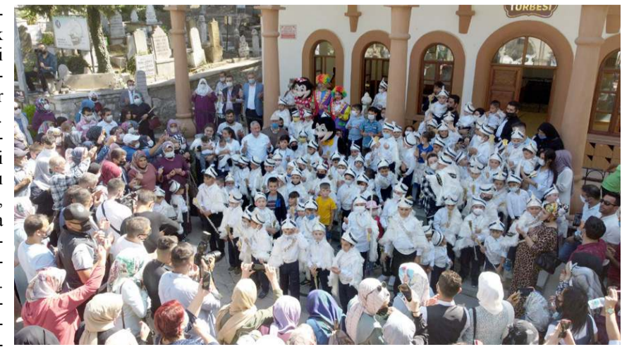
Sünnet şöleni bu yıl 20 Ağustos Cumartesi günü Buharaevler Semt Pazarında yapılacak.