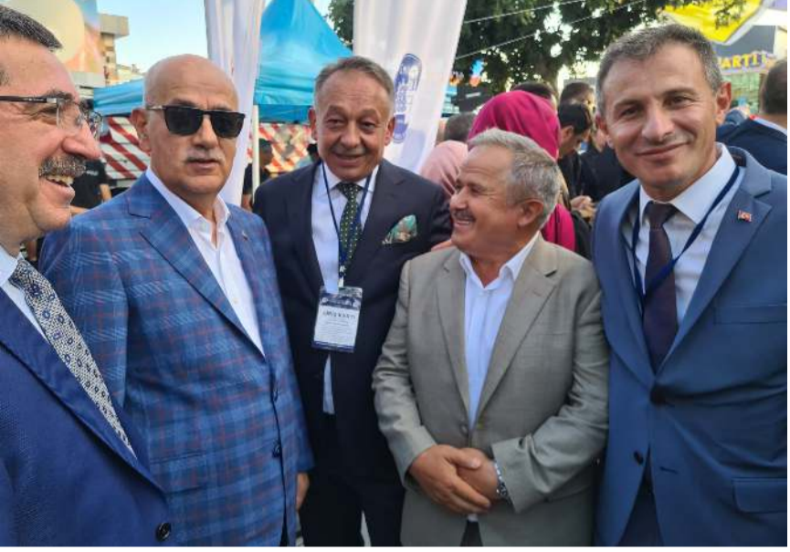
Tarım ve Orman Bakanı Prof. Dr. Vahit Kirişci Cumhurbaşkanı Recep Tayyip Erdoğan'ın Çorum mitingine katıldı.