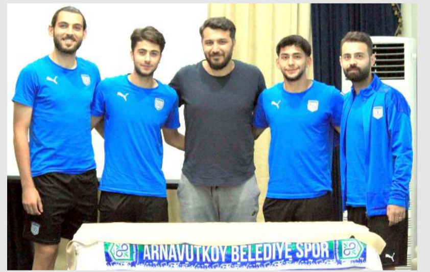
Arnavutköy Belediyespor'da anlaşma sağlanan dört isim imza töreni sonrasında toplu halde