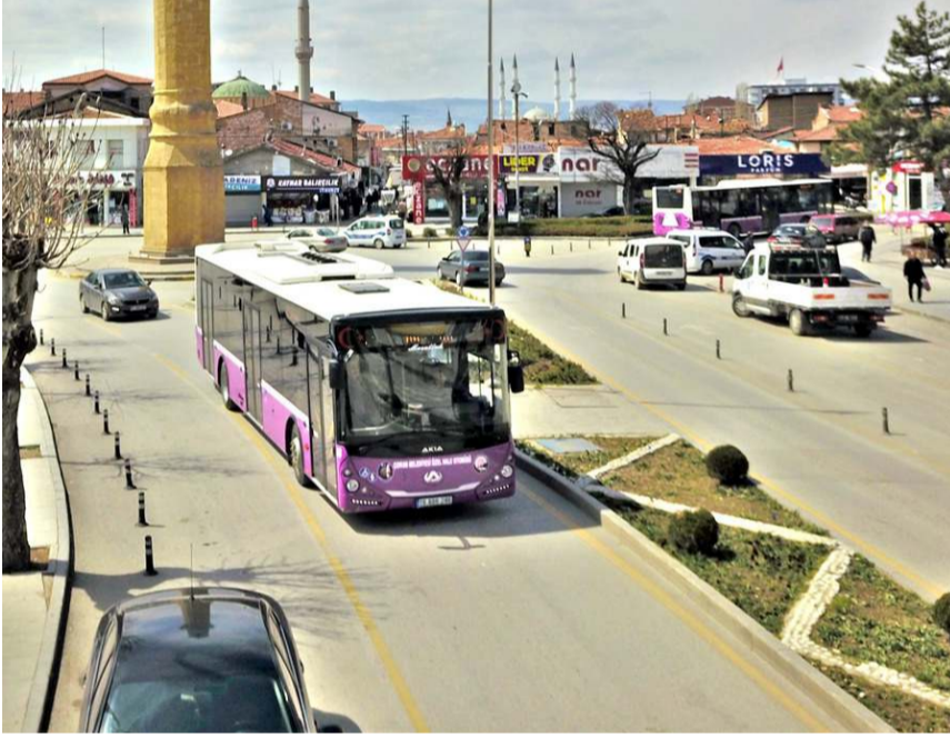
Şu anda hatlarda çalışan belediyeye ait 56 adet araç bulunuyor.