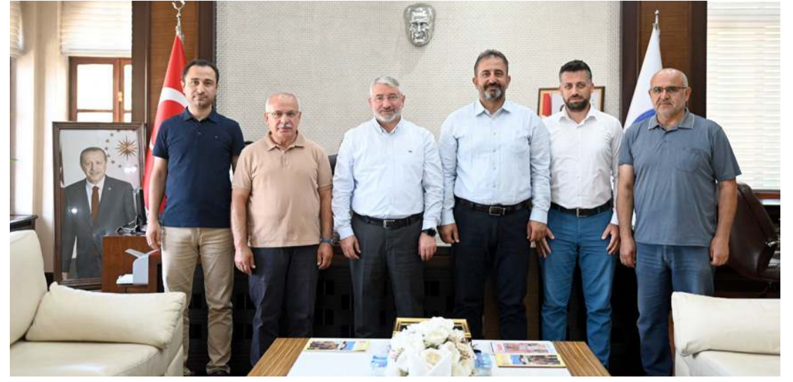
Hak-İş Konfederasyonu Hizmet-İş Sendikası ile Çorum Belediyesi arasında devam eden ücret iyileştirme görüşmeleri tamamlandı.

celeri ve Animasyon Show gösterileri ile birbirinden güzel etkinliklerle yavrularımızı buluşturacağız" diye konuştu. (Haber Merkezi)