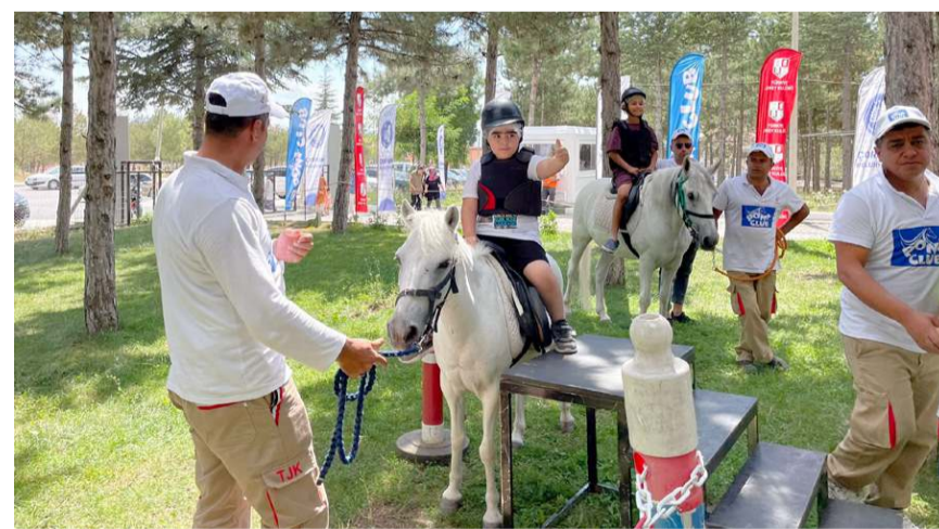
Minikler ata binmenin keyfini yaşadılar.