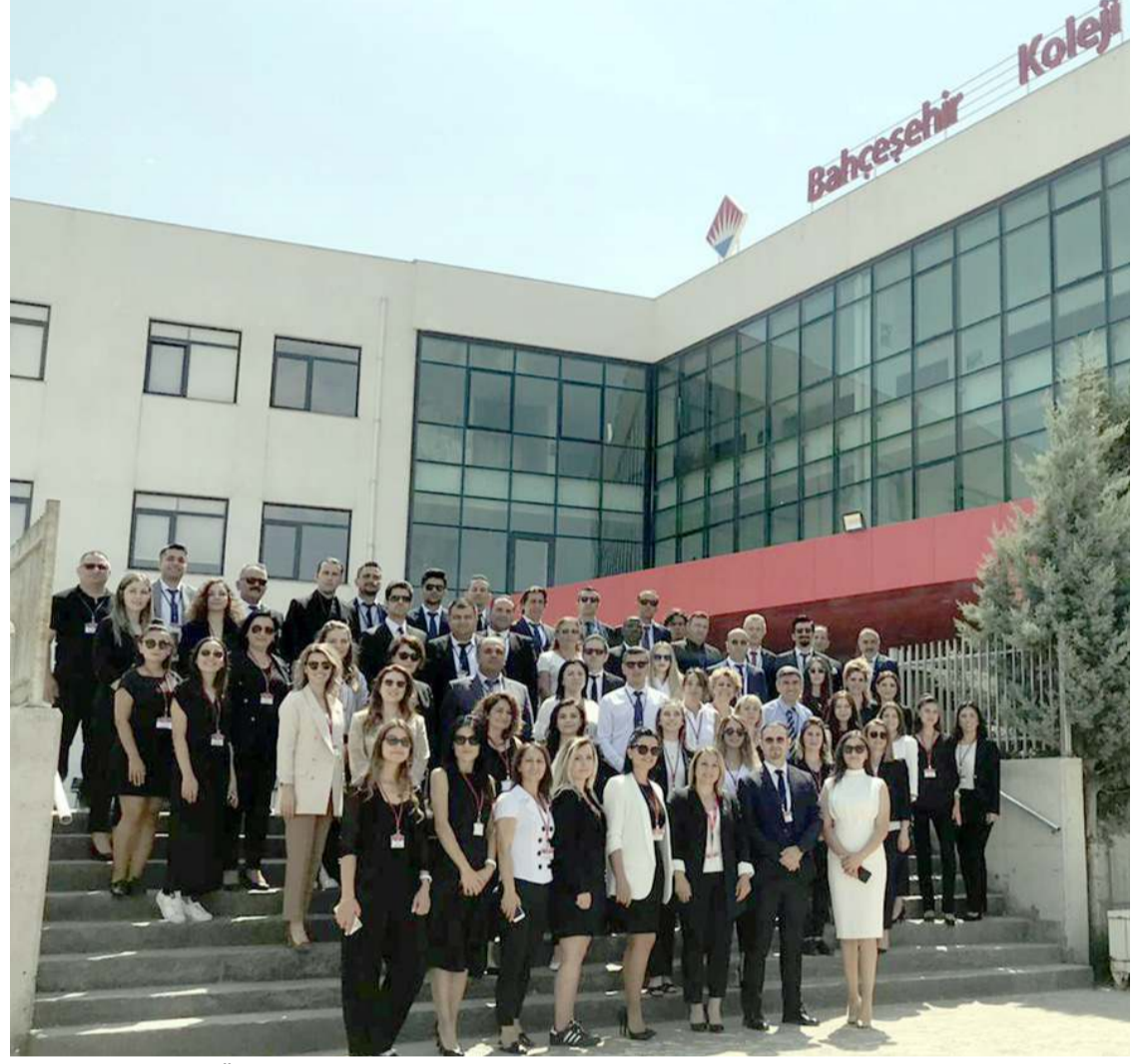
Öğretmenler yeni dönem öncesinde toplu hatıra fotoğrafı çekindiler.

kin ölçme ve değerlendirme araçları ile AGİS, YKS ve deneme sınavları ile kazanım eksiklerini tamamlama olanağı sağlıyoruz. Çorum Bahçeşehir Koleji eğitim kurumu olarak tek hedefimiz, öğrencilerimizin bugünün ve geleceğin dünyasında kendileri ve dünya için fark yaratan bireyler olarak yetişmeleri. Bu vizyonu Çorum'da yaşatabilmek ve kaliteli eğitimi her çocuğumuza ulaştırabilmek için elimizden gelen gayreti tüm ekibimizle birlikte göstereceğiz. 2022-2023 eğitim öğretim yılında öğrencilerimizin