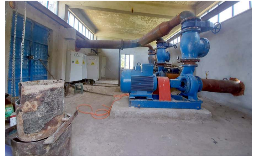
Kızlırmak'tan su alınması için yapılan 2. pompa devreye sokulmadığı için çiftçi zor durumda kaldı.

Müdürlüğü Devrez Çayı üzerinde Çankırı, Kastamonu ve Çorum'un Kargı ilçesinde 5 cazibe, 4 adet pompaj ile toplamda 15 bin 860 hektar alanın sulanmasını planladı. 19 Mayıs 2017 tarihinde AK Partili Milletvekilleri, Kızlıryolu barajının 31 Mayıs 2017 tarihinde ihalesinin yapılacağını müjdeledi fakat henüz bir çalışma yapılmadı.