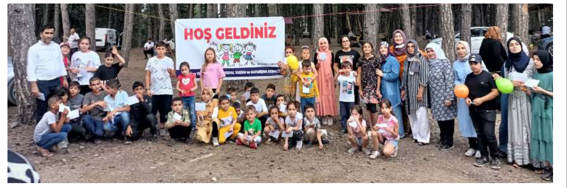
ÖYÇODER okullar açılmadan önce moral pikniği düzenledi.