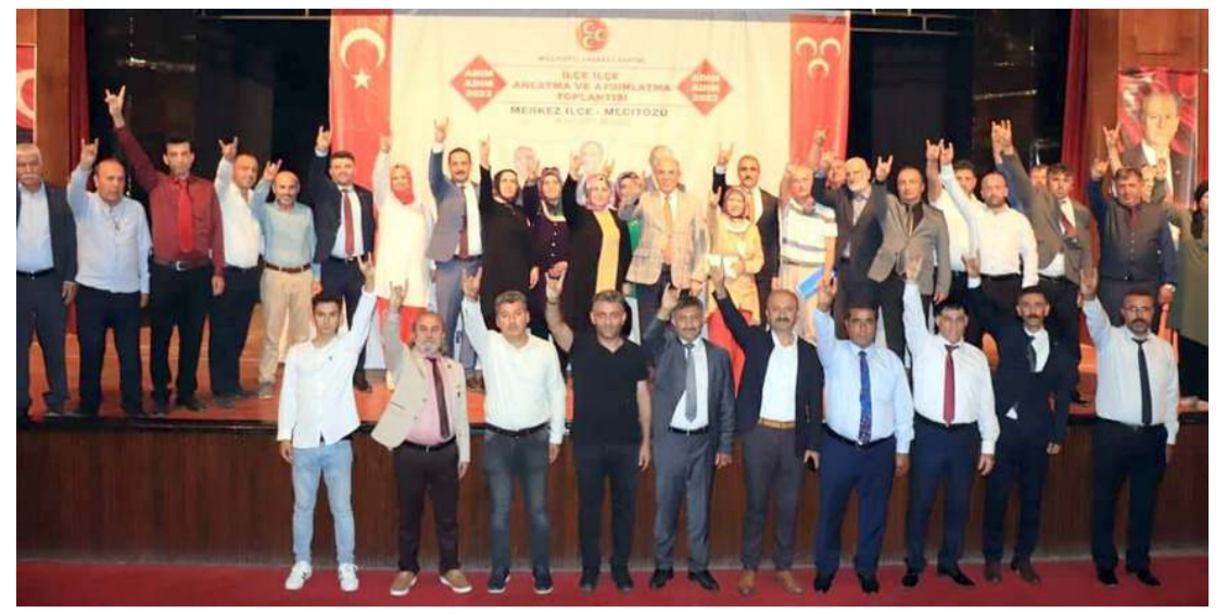
"Adım Adım 2023; İlçe İlçe Anlatma ve Aydınlatma" temalı toplantılar Devlet Tiyatro Salonu'nda yapılan programla sona erdi.