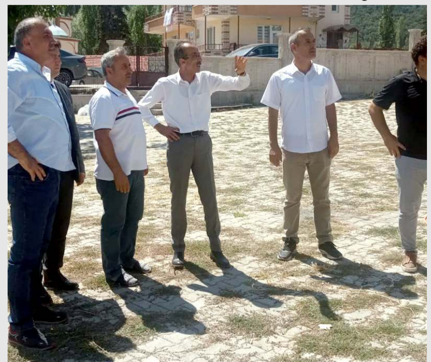
Kullanılmayan köy okulu binaları, doğa, bilim ve tasarım atölyeleri ile gençlik kampları gibi alanlara dönüştürülecek.