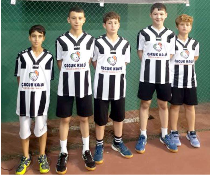
Çorum Badminton erkek takımı bugün final için Ankara ile karşılaşacak