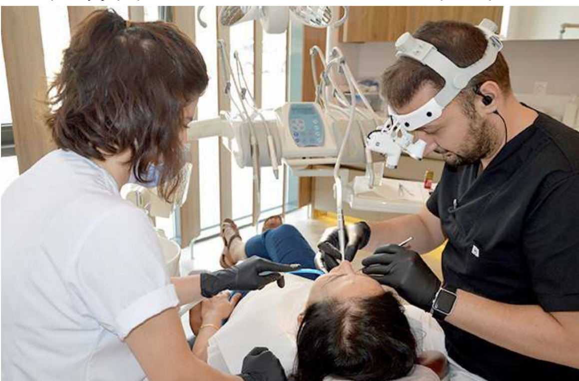
Uygulama ilk olarak pilot il seçilen Eskişehir, Kırşehir ve Karabük'te hayata geçirilecek.