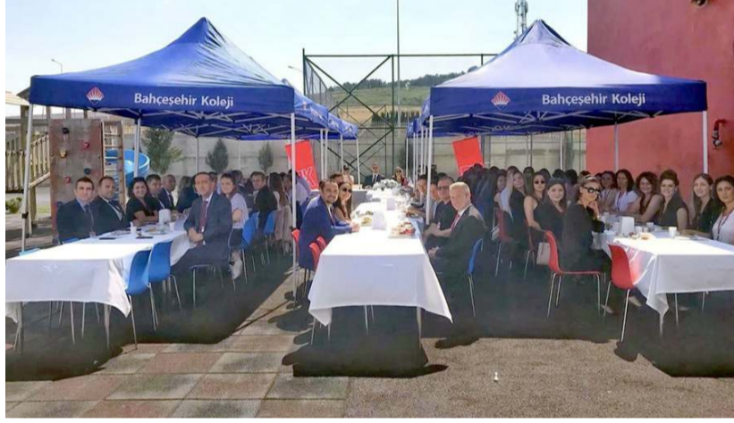
Çorum Bahçeşehir Koleji öğretmenleri için yeni eğitim öğretim yılı öncesinde hizmet içi eğitim programları düzenlendi.

Öğrencilerimizin geleceğinde belirleyici olan ulusal sınavlara en iyi şekilde hazırlanmalarını sağlamak için tecrübeli ve güçlü eğitim kadromuzla çalışmalarımızı verimli ve etkili biçimde devam ettiriyoruz. Yapay Zeka Tabanlı Metobox ile sınavlara hazırlanan öğrencilerimize et-