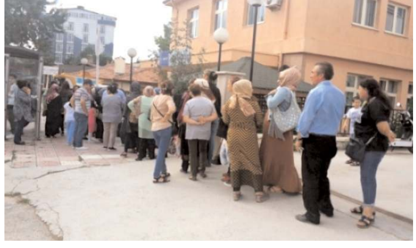
Başvurular, 17-21 Ekim 2022 tarihleri arasında yapılacak.

Aile ve Sosyal Politikalar İl Müdürlüğü'nde görev yapacaklar