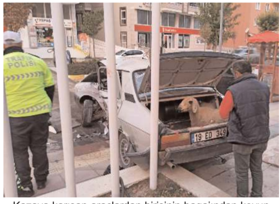
Kazaya karışan araçlardan birisinin bagajından koyun çıkması şaşkınlığa neden oldu.