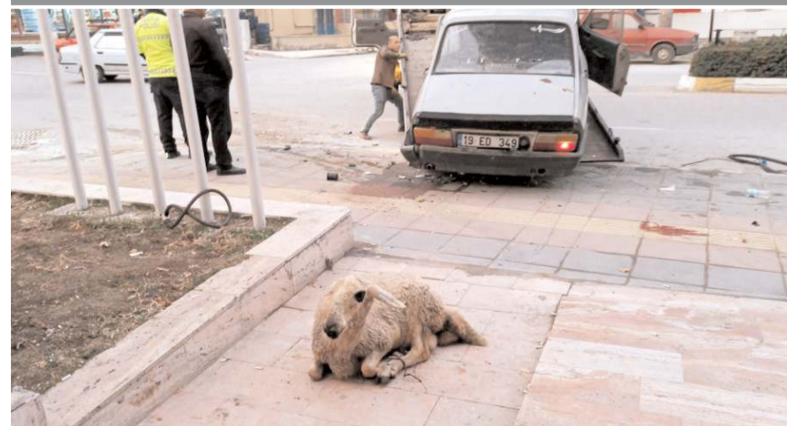
Kaza Bahabey Caddesi'nde meydana geldi.