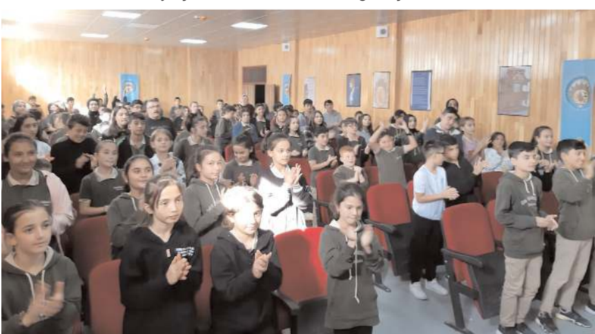
Öğrenciler konukları ayakta alkışladılar.