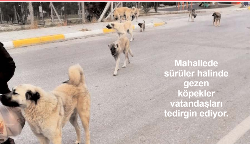
Mahallede sürüler halinde gezen köpekler vatandaşları tedirgin ediyor.