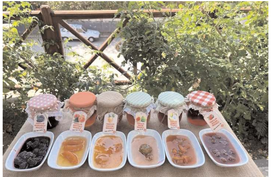
Kadınlar tarafından üretilen birbirinden lezzetli reçeller dünya pazarına sunuldu.

le buluşturduk. Tüm belediye hizmetlerini üreten belediyeçilik anlayışı ile devam ettiriyoruz. Yöresel ürünler alanında sürekli üretim oluşturmayı başardık. İskilip'e özgü tüm ürünlerin yapımından pazarlanmasına kadar desteklerimiz artarak devam edecek" dedi. (İHA)