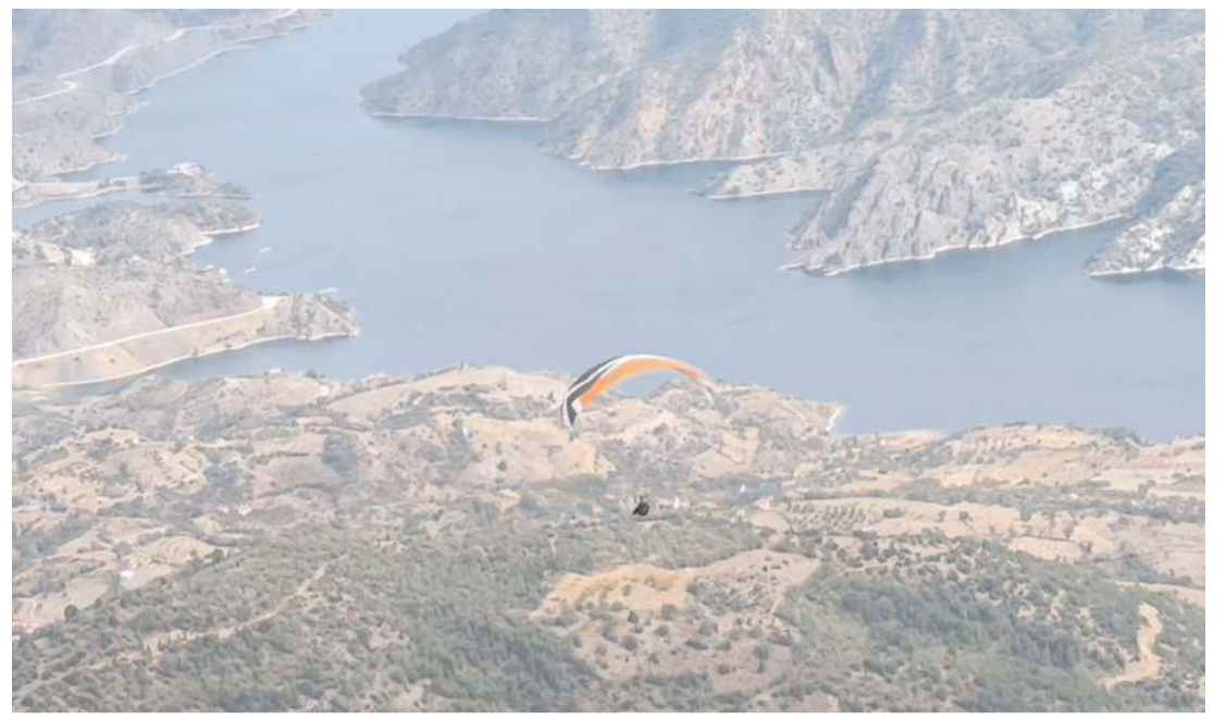
Etkinlik Oğuzlar Belediyesi ile Çorum Sportif Havacılık Kulübü'nce ortaklaşa yapıldı.

Bilinen ve şüpheli rahim ve meme kanseri tanısı olan, teşhis edilmemiş anormal vaginal kanaması olan, karaciğer hastalığı olan, emboli (pıhtı atma) riski olan, şişman, varisi olan, hipertansif ve sigara içen, kalp krizi geçirmiş olan beyin damar tıkanıklığı veya inme geçiren hastalara HRT kesinlikle uygulanmaz. Hormon replasman tedavisi hem enjeksiyon şeklinde hem de ağızdan kullanılabilir. Vajinal krem şeklinde de kullanılabilir. Bu tedaviyi alan hastalarda düzenli olarak meme taraması ve jinekolojik muayene yapılmalıdır." (Haber Merkezi)