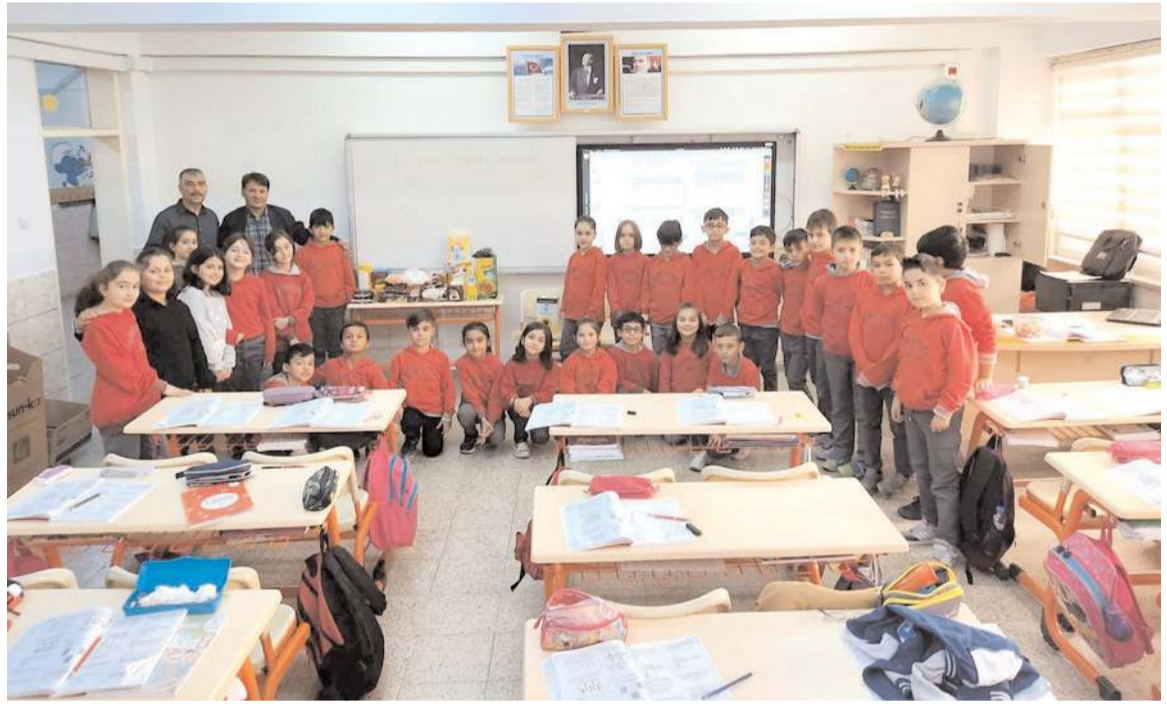
İsmetpaşa İlkokulu 3-A sınıfı öğrencileri, gıda yardımı kampanyası düzenlediler.

Vatandaşlar artık, 'köpekler saldırır mı' korkusu olmadan işe gidip gelmek istediklerini, çocuklarını gönül rahatlığıyla okula göndermek istediklerini ve kurslara rahatlıkla gitmek istediklerini belirterek, yetkililerin soruna çözüm bulmalarını istedikler.