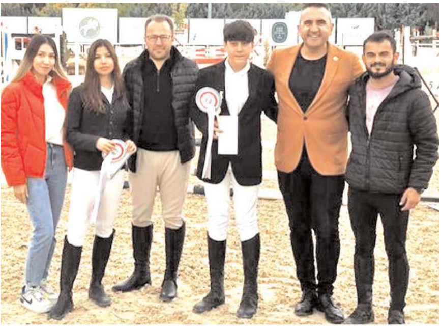
Ankara'da derece yapan sporcular ve velileri ödül töreni sonunda toplu halde

Atahan Atlıspor yarışlarından dört derece ile döndü. 15-16 Ekim