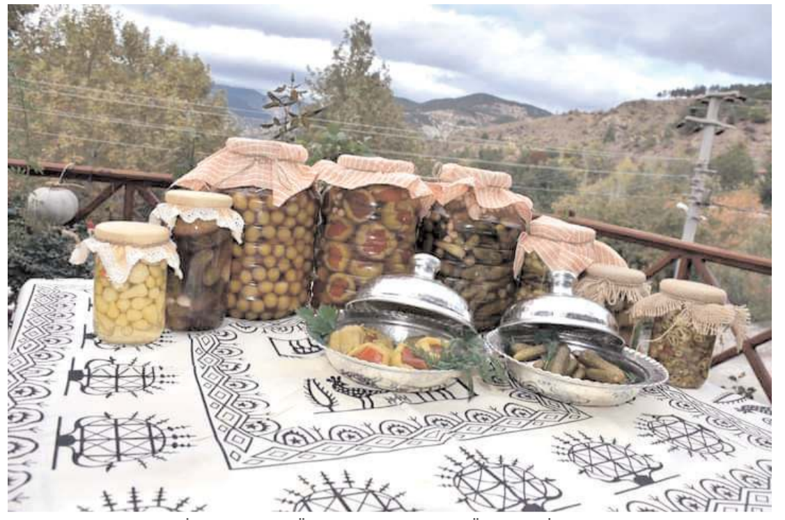
İskilip Yöresel Ürünler Kadın Girişimi Üretim ve İşletme Kooperatifi üyeleri tarafından üretilen yöresel ürünler dünyaya açıldı.