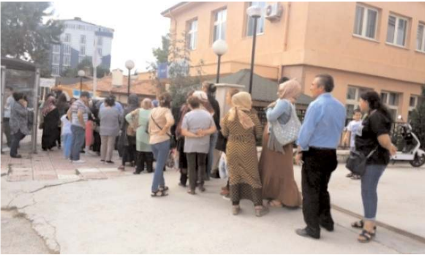
Başvurular, 17-21 Ekim 2022 tarihleri arasında yapılacak.

Bir kişi aynı anda açılacak TYP'lerden yalnızca