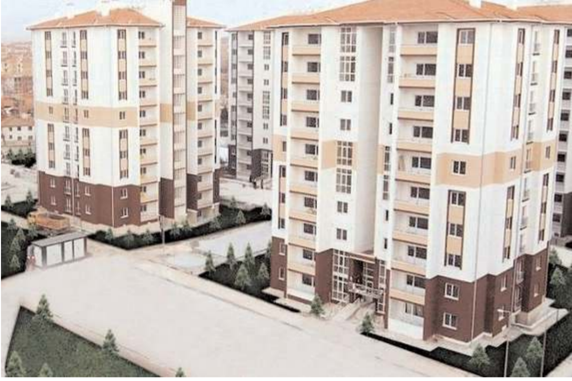
Dev konut projesinde kura çekimleri başvurular biter bitmez ilk hafta da gerçekleştirilecek.

Kura çekimi başvuru bedelleri, Kasım ayında yapılacak kura çekimi sonrasında vatandaşlara geri iade edilecek. (Haber Merkezi)