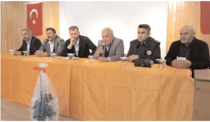
Söyleşiye şehit yakınları ve gaziler katıldı.