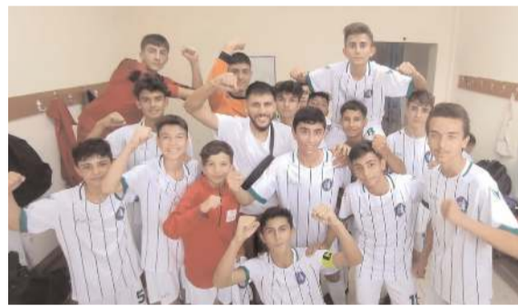
U 15 liginde üçüncü maçında Çimentospor önünde zorlu maçı 1-0 kazanmayı başaran Mimar Sinan takımı maç sonunda soyunma odasında galibiyet pozu verdi

puanla sıralamada beşinci sırada yer aldı. Ligde beşinci hafta maçları pazar günü oynanacak.