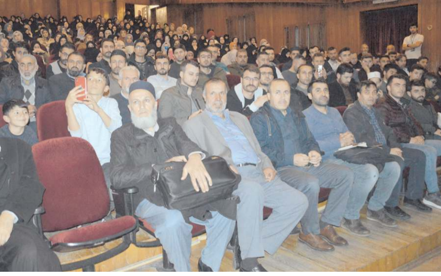
Program Devlet Tiyatro Salonu’nda yapıldı.