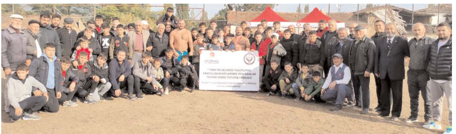
"Türk'ün geleneği Yaşatılıyor" Elvancelebi Er Meydanı'ı güreşlerinde dereceye giren pehlivanlar ve misafirler toplu halde