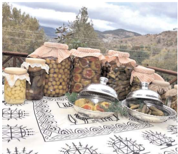
İskilip Yöresel Ürünler Kadın Girişimi Üretim ve İşletme Kooperatifi üyeleri tarafından üretilen yöresel ürünler dünyaya açıldı.