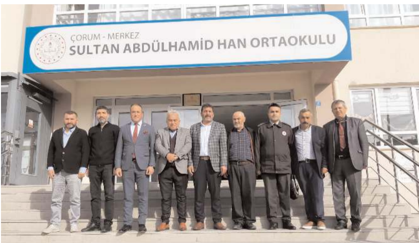
Söyleşinin ardından hatıra fotoğrafı çekildi.