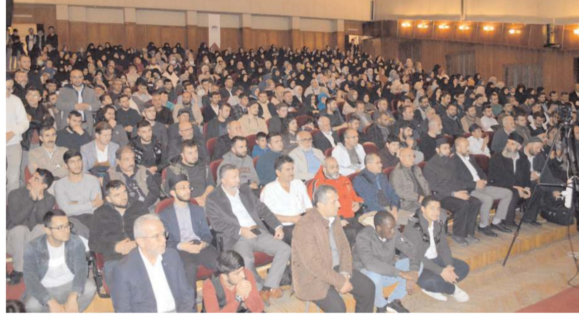
Konferansa ilgi yüksek oldu.