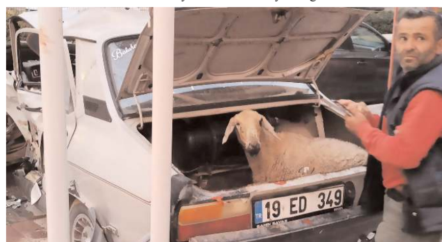
Kazaya karışan araçlardan birisinin bagajından koyun çıkması şaşkınlığa neden oldu.

Çorum'da iki otomobilin çarpışması sonucu 3 kişi yaralandı.