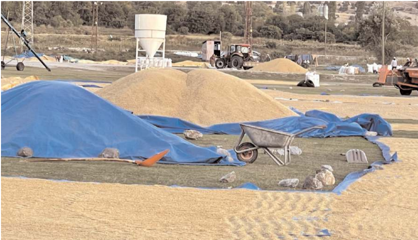
Serme-kurutma-çuvallama işlemlerinden geçirilen çeltik fabrikalara gönderiliyor.