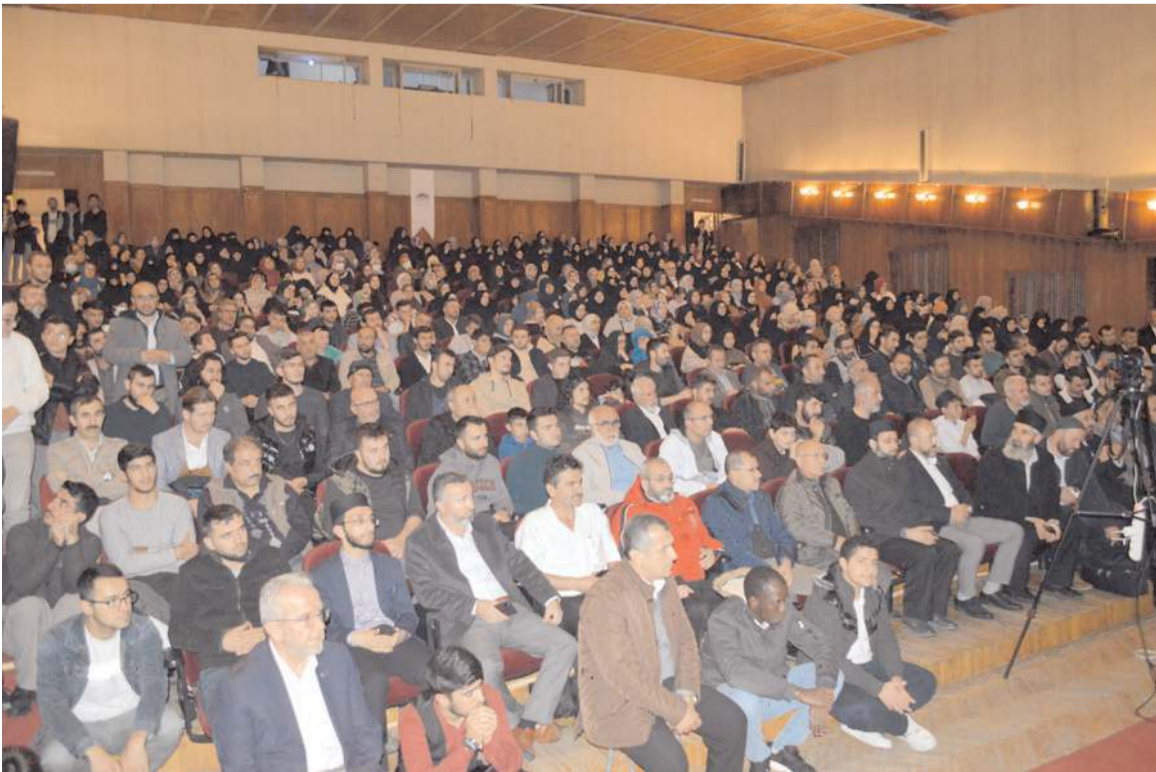
Konferansa ilgi yüksek oldu.