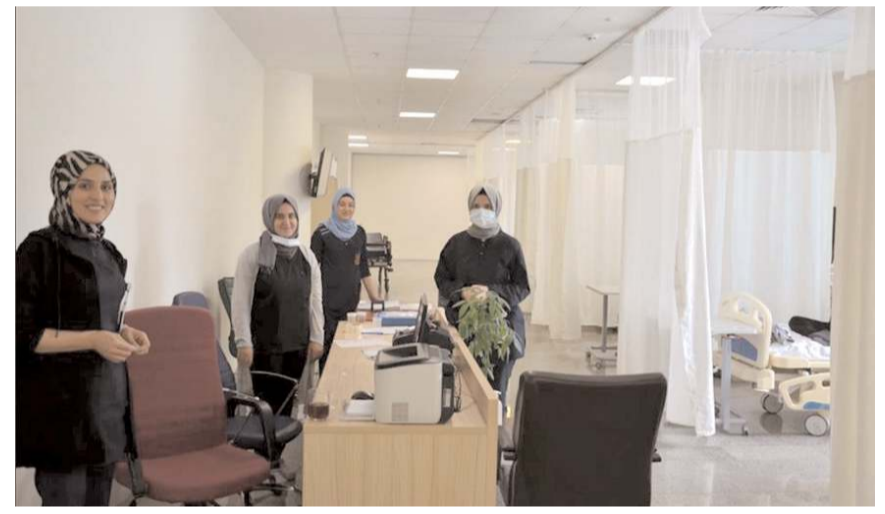
Yeni servis ile günübirlik yatış gerektiren, cerrahi ve dahili kliniğe başvuran hastaların daha etkin ve konforlu hizmet almaları hedefleniyor.