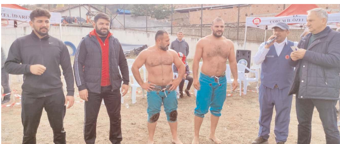
Baş güreşlerinde ilk dört sırayı alan pehlivanlar ödül töreninde birlikte görülüyor