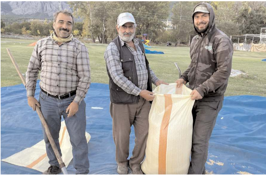
Hasadı yapılan çeltik serme-kurutma-çuvallama işlemlerinden geçiriliyor.