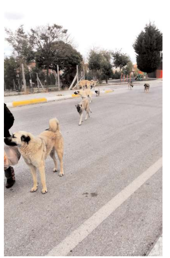
Mahallede sürüler halinde gezen köpekler vatandaşları tedirgin ediyor.