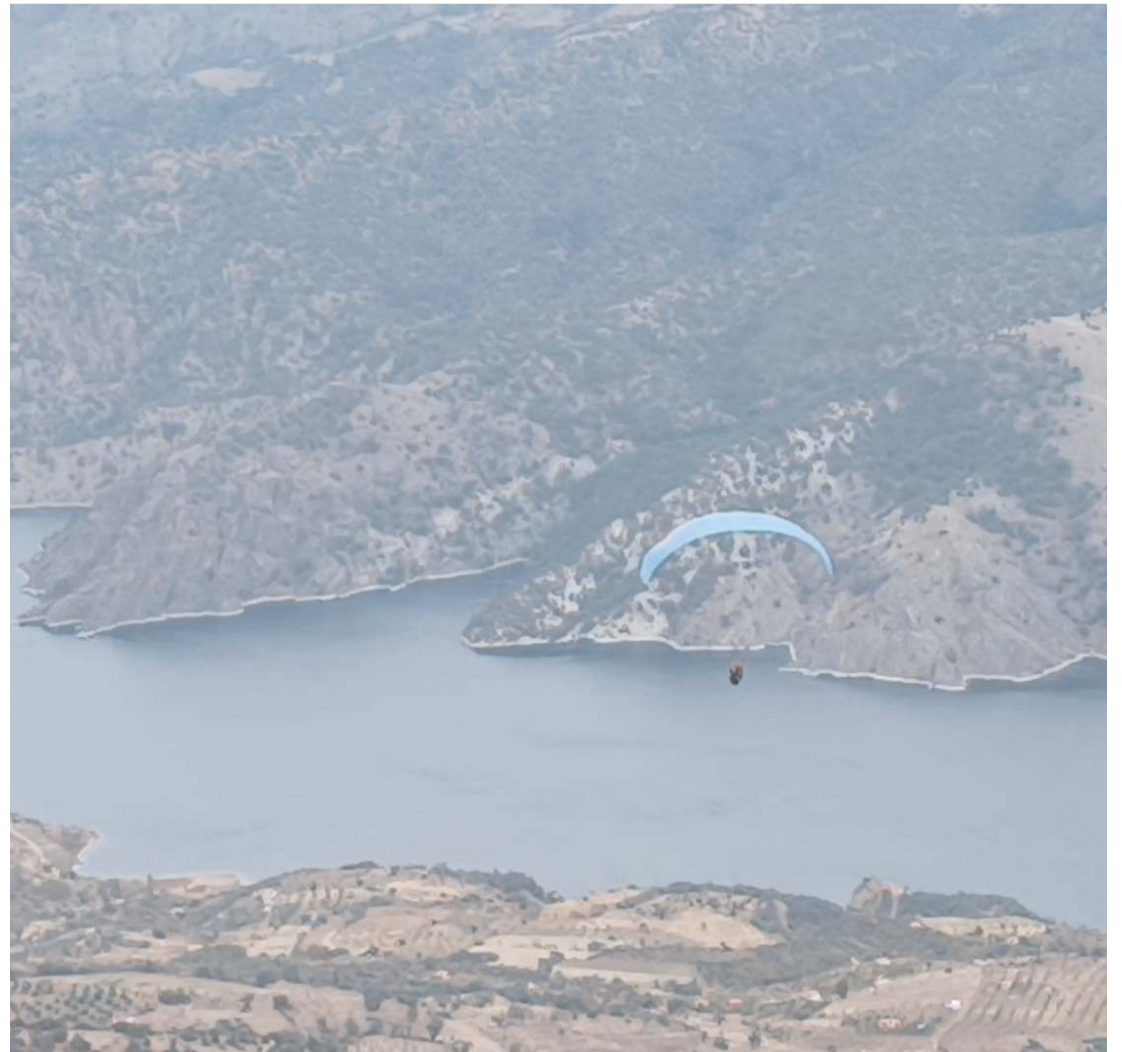
Etkinliğe Çorum'un yanı sıra Erzurum, Denizli ve Trabzon'dan sporcular katıldı.