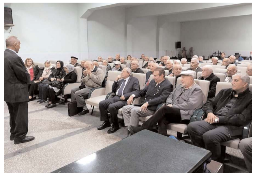
Sungurlu Lisesi'nin ilk mezunları 52 yıl sonra hasret giderdiler.

Bir araya gelmenin mutluluk ve sevincini yaşadıklarını söyleyen Sungurlu Lisesi'nin ilk mezunları, bu tür organizasyonların tekrar yapılmasını istediler. (İHA)