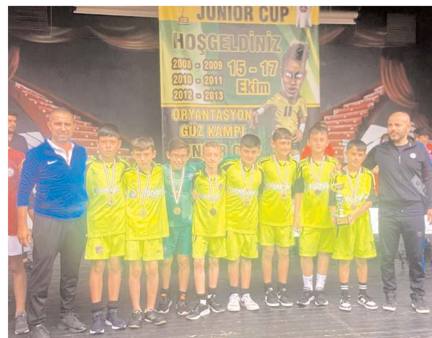
Osmancık FK takımı Alanya'da kazandığı ikincilik kupası ve madalyaları ile toplu halde