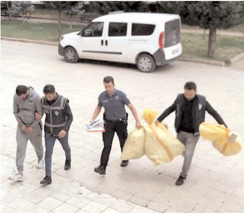
Gözetim altına alınan zanlı, emniyetteki işlemlerinin ardından sevk edildi.

Kargı'da evinin bahçesinde kenevir yetiştirdiği iddiasıyla bir kişi gözaltına alındı.