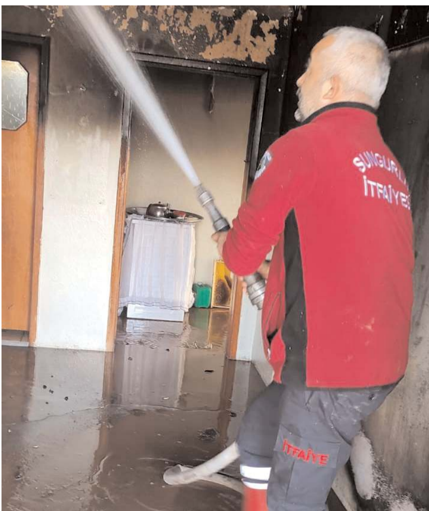
Olay, Sungurlu'ya bağlı Çavuşcu köyünde meydana geldi.

Sungurlu'da çıkan yangında, bir ev tamamen yanarak kullanılamaz hale geldi.