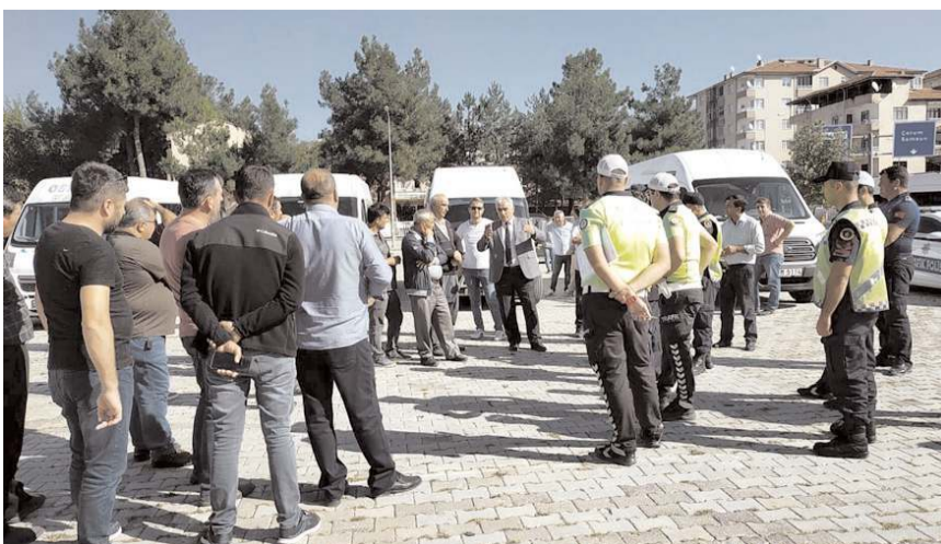
Denetimde ayrıca sürücüler bilgilendirildi.