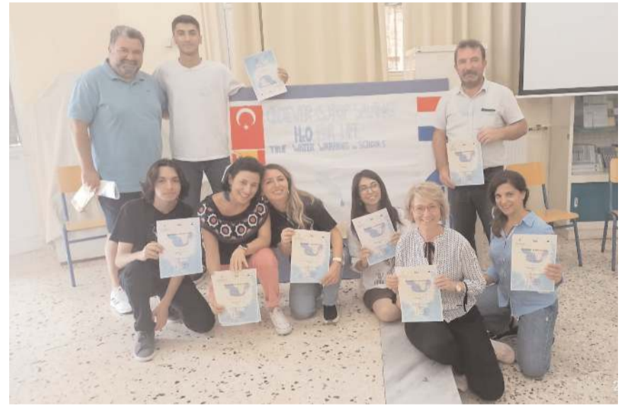
Öğrenciler, Yunanistan'ın Girit adasındaki 2nd Lykeio of Agios Nikolaos Lisesini ziyaret etti