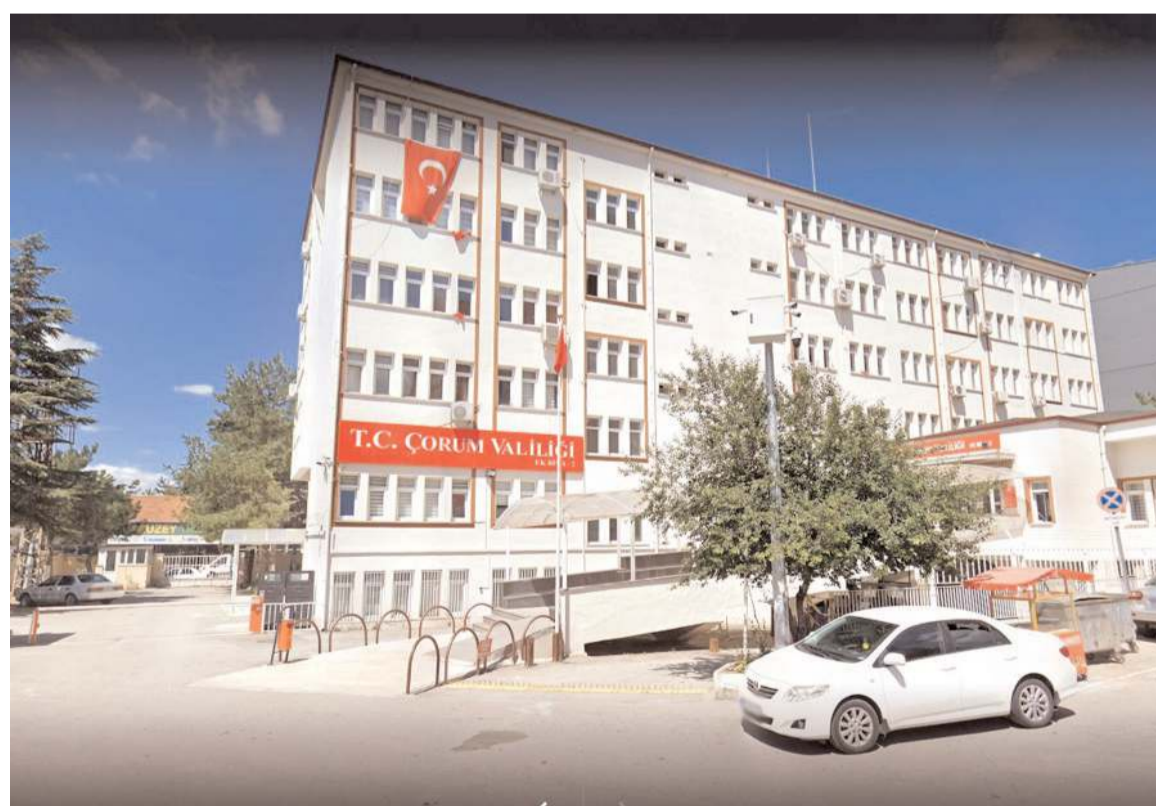
Eski tip ehliyetlerin değiştirilmesi için tanınan süre 31 Aralık 2022'de sona erecek.