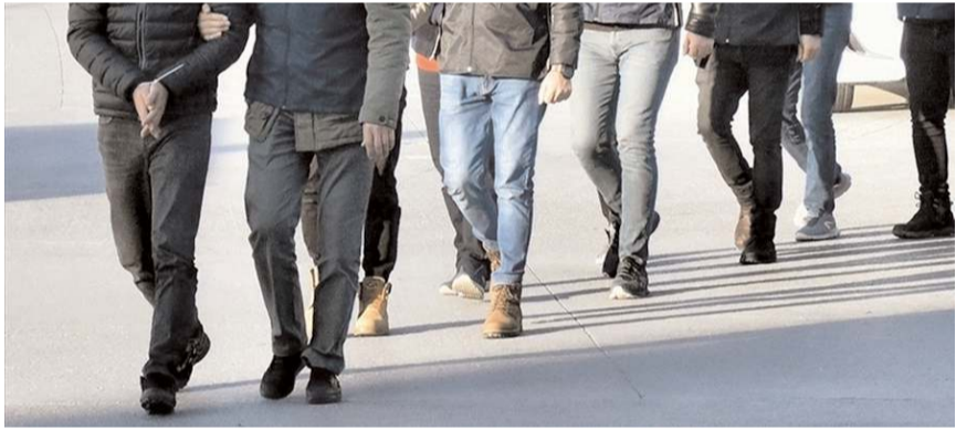
59 ilde 704 şüpheliye yönelik eş zamanlı operasyon yapıldı.