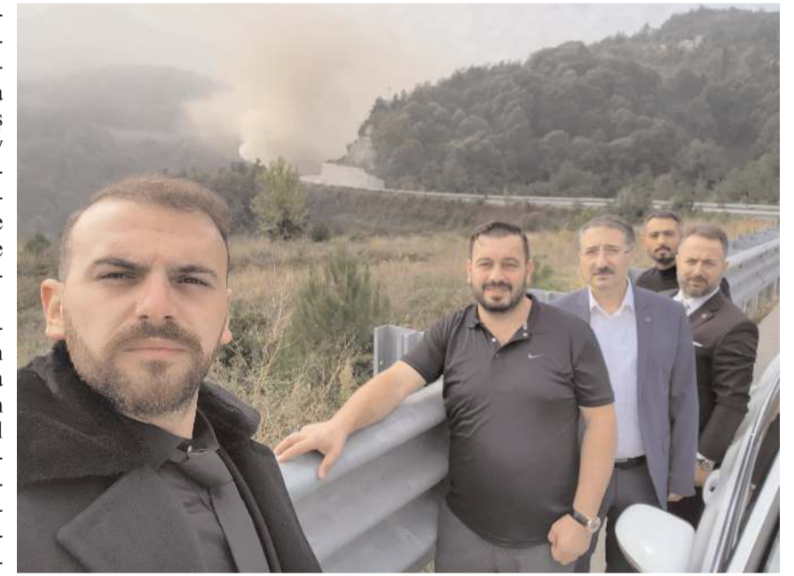
Gelecek Partisi Çorum Heyeti, madende de incelemelerde bulundu.