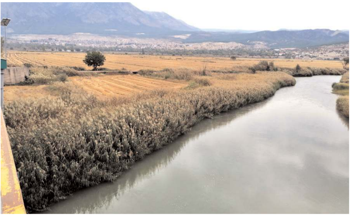
Kargı'da çeltik tarlasından bir görüntü...

63 fabrikadan bazılarının temeli atılırken bazılarında hazırlıklarının bitmek üzere olduğuna dikkat çeken Akkaş, "Sungurlumuzda işsiz aşırsız 1 kişi dahi kalmayacak, herkes doğduğu büyüdüğü memleketinde çalışıp, kazanacak" şeklinde kaydetti. (Haber Merkezi)