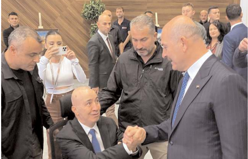
İçişleri Bakanı Süleyman Soylu, operasyona "Gazi Turgut Aslan" isminin verildiğini belirtti.

İçişleri Bakanı Soylu "Operasyon, FETÖ silahlı terör örgütünün güncel yapılanması, yeni elemanlarını ve finans kaynaklarının deşifresine yönelik 81 il Cumhuriyet Başsavcılıklarınca terörizmin finansmanı kapsamında alınan soruşturma izinleri doğrultusunda 8 ay süren titiz çalışmalar neticesinde bu saban itibarıyla başlamıştır. Bu bir şafak operasyonu değildir. Örgütün yurt dışına firar etmiş üst düzey mahrem sorumluları tarafından verilen talimatlar doğrultusunda örgütün kopmaları engelleme, örgütü canlı tutma, mahrem birimlerin ve finansal faaliyetlerin yeniden yapılandırılması ve faaliyetlerinin örgütün yurt içindeki üyeleri tarafından uygulamaya devam edilmesi konusundaki yapılan tespitler üzerine gerçekleştirilen bir operasyon. FETÖ terör örgütünün güncel yapılanmasında görev alan ve örgütsel talimatlara harfiyen uyan örgüt mensuplarına düzenli ve sistematik olarak para transferinde bulunduğu anlaşıldı. Yaklaşık 8 ay boyunca Gerek kargo gerek bankamatik üzerinden ve birbirlerini tanımayan insanlara yaptıkları belirlendi.