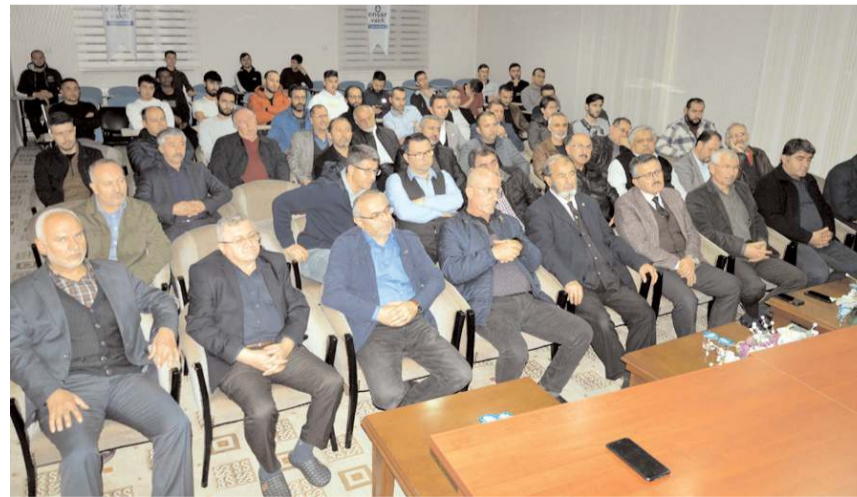
Tarih sohbetleri programına ilgi yüksek oldu.

Ensar Vakfı Çorum Şubesi'nin her Pazartesi günü gerçekleştireceği "Osmanlı Tarihi Sohbetleri" önceki akşam başladı. * HABERİ 5'DE