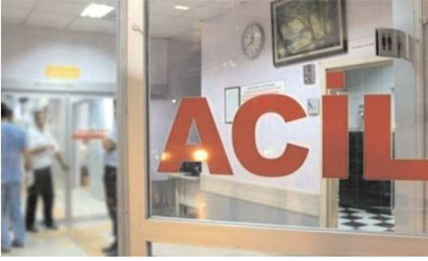
Olay Çocuk Acil Servisi'nde meydana geldi.

İhbar üzerine hastaneye gelen polis ekipleri, zanlıları gözaltına aldı. (AA)