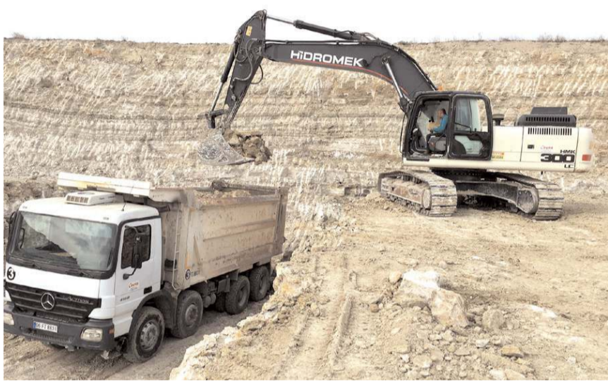
Çorum'a ve Türkiye'ye örnek olabilecek bir sanayi sitesi kazandırmak hedefleniyor.