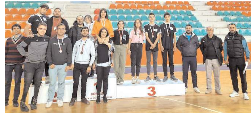
Bocce turnuvasında dereceye giren sporcular ödül töreninde toplu halde

Amatör Spor Haftası etkinlikleri arasında düzenlenen Bocce turnuvasında dört kategoride 44 sporcu mücadele etti. Atatürk Spor Salonu'nda yapılan turnuvada kategorilerinde dereceye giren sporculara madalyaları verildi.