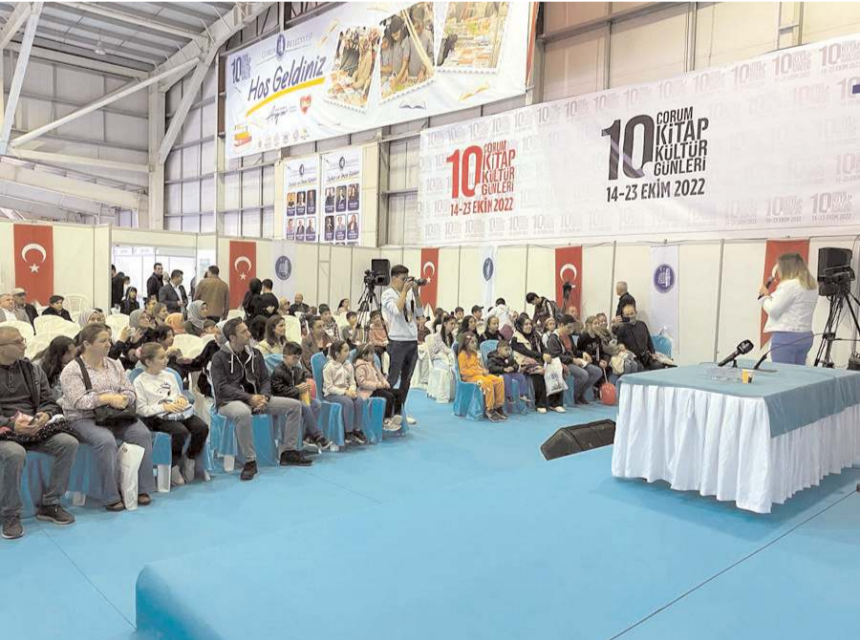
Yazarlar 23 Ekim'e kadar okuyucu ile buluşmaya devam edecek.