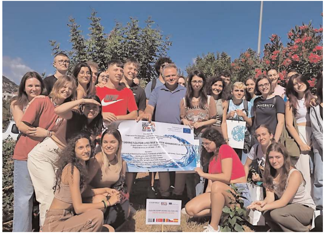
Mehmetçik Anadolu Lisesi öğretmen ve öğrencileri Yunan Adası'nda birlikte poz verdi.

Kargı Ovası'nda bu yılki çeltik veriminin çok güzel olduğunu vurgulayan Arpa, "Dönümden 750-800 kilogram arasında verim alıyoruz." ifadelerini kullandı. (AA)