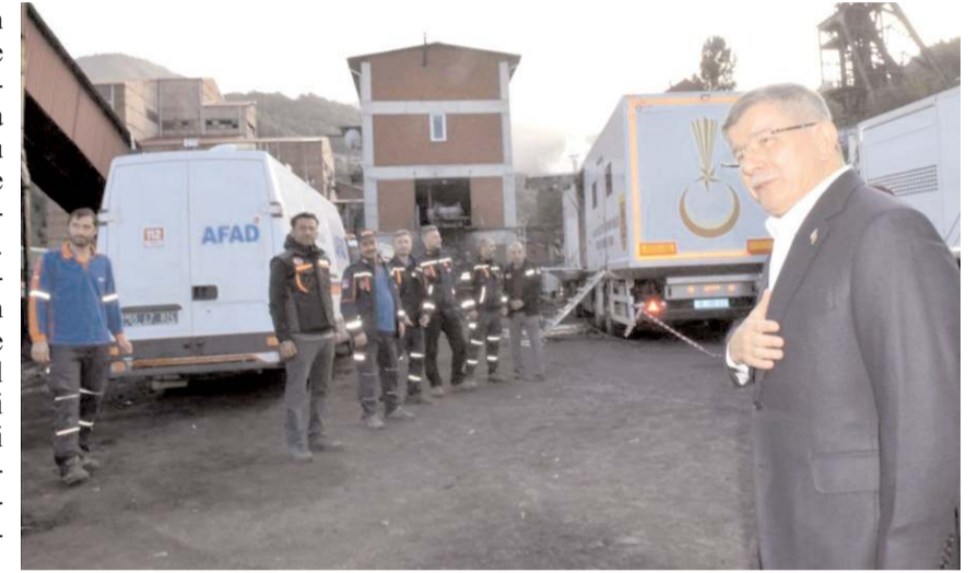
Gelecek Partisi Genel Başkanı Ahmet Davutoğlu facianın yaşandığı kömür ocağında incelemelerde bulundu.

İncelemelerde bulunduğu maden ocağı bölgesinde gazetecilerle bir araya gelen Davutoğlu, kaza anından itibaren bütün Türkiye'nin gözünün Amasra'da olduğunu söyledi ve birçok kez buna benzer acıların yaşandığını belirterek, "Bu kez de 41 canımızı kaybetmenin, 41 aileye düşen ateşi