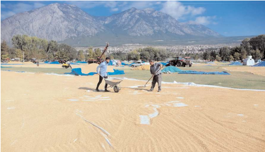
Bu yıl yaklaşık 12 bin ton çeltik hasat edilmesi bekleniyor.