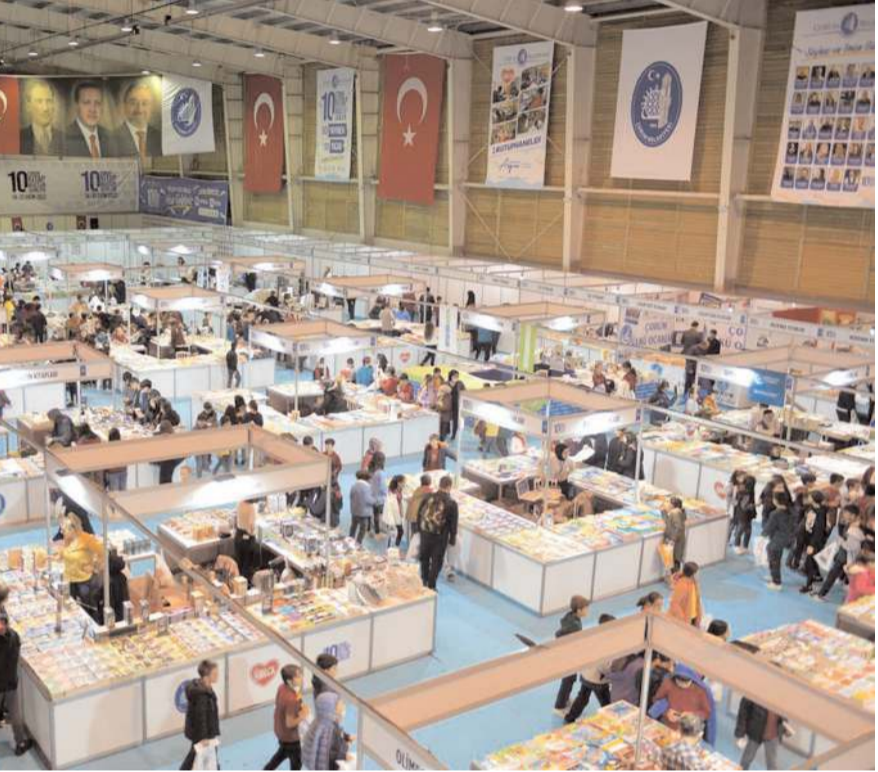
Kitap Kültür Günleri TSO Fuar Merkezi'nde düzenleniyor.