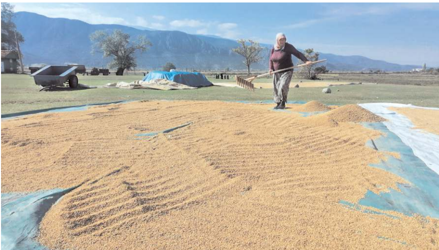
İlçe merkezindeki 4 fabrikada işlenip pirinç olarak sofralara geliyor.

Kent merkezine yaklaşık 110 kilometre uzaklıkta Kargı ilçesi, bölgede çeltik üretimi ile öne çıkıyor. İlçenin en önemli gelir kaynağı olan ve Kızılırmak'tan sulanan 15 bin dekarlık arazide yetiştirilen çeltik, 5 aylık zahmetli bir sürecin ardından ilçe merkezindeki 4 fabrikada işlenip pirinç olarak sofralara geliyor.