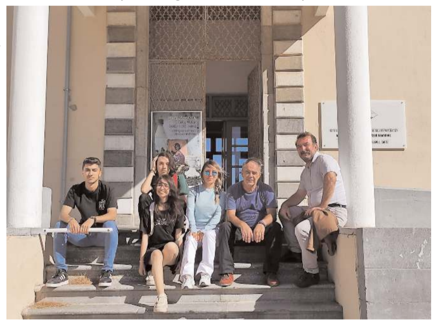
Tarih müzesi önünde hatıra fotoğrafı...

len uzman bir agronomist tarafından kuraklığa dayanıklı bitkiler ve zeytin ağacı yetiştiriciliği hakkında bilgi edinip ağaç diktiler.