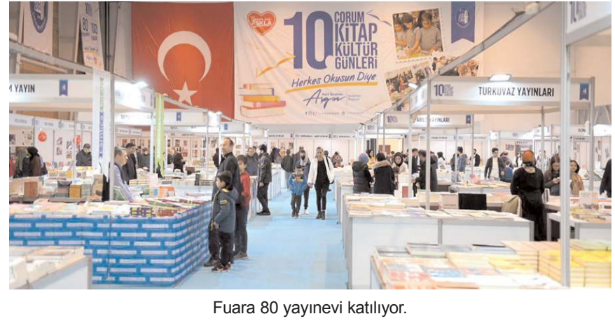
Fuara 80 yayınevi katılıyor.