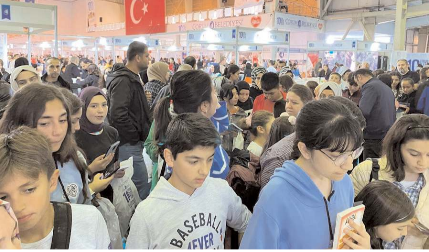
Kitap Kültür Günleri'ne ilgi yüksek oldu.