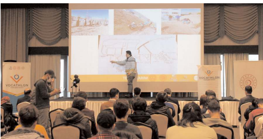
Program Amasya, Bartın, Çankırı, Çorum, Karabük, Kastamonu, Samsun, Sinop, Tokat, Zonguldak illerine yönelik olarak düzenlenecek.

Programa katılmak isteyen öğrencilerin 31 Ekim tarihi öncesinde "vocathlon.org/basvuru-formu" adresindeki formu doldurmaları gerektiği belirtildi. (İHA)