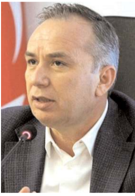
Ahmet Sami Ceylan

AK Parti Çorum Milletvekili Ahmet Sami Ceylan, Çorum'da sağlık kuruluşlarının uzman hekim, diş hekimi ve eczacı kadrosuna 24 yeni atama gerçekleştirildiğini açıkladı.