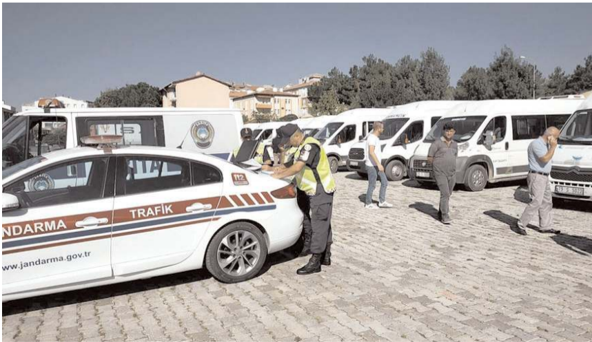
Denetimde eksik evrağı olan servis araçlarına ceza kesildi.