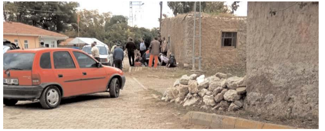
Olay Sungurlu'ya bağlı Kavşut köyünde meydana geldi.