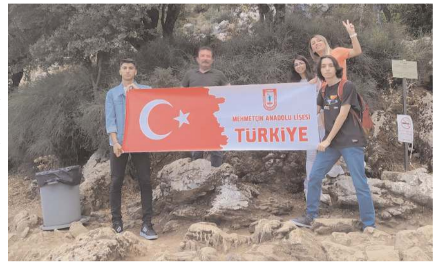
Öğrenciler, Erasmus+ programı kapsamında Yunanistan'ın Girit adasında bir haftalık eğitim programına katıldılar.

Adada kullanılmış suların arıtılıp yeniden kullanılmasını, yağmur sularının depolanması ve gereksiz su kullanımının önüne geçilmesini içeren çalışmalarını da inceleyen öğretmen ve öğrenciler, okula ge-