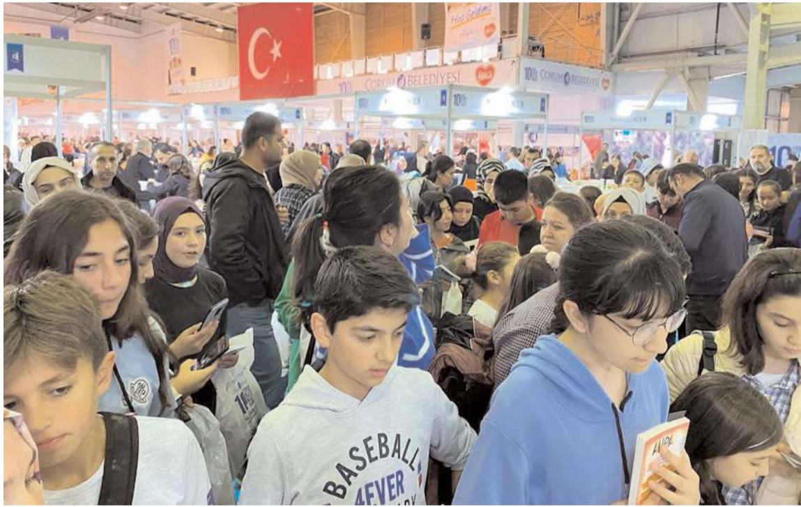
Kitap Kültür Günleri'ne ilgi yüksek oldu.

Ensar Vakfı'nda 'Osmanlı Tarihi Sohbetleri' başladı