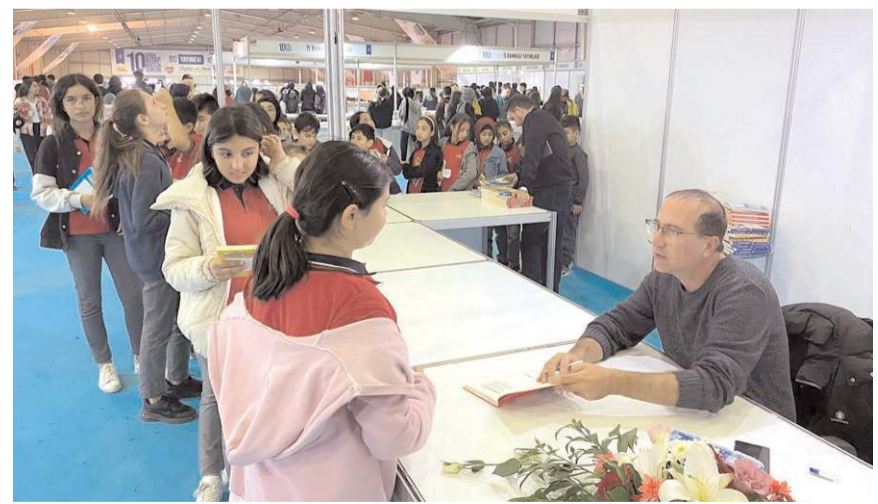
Öğrenciler fuara büyük ilgi gösteriyor.