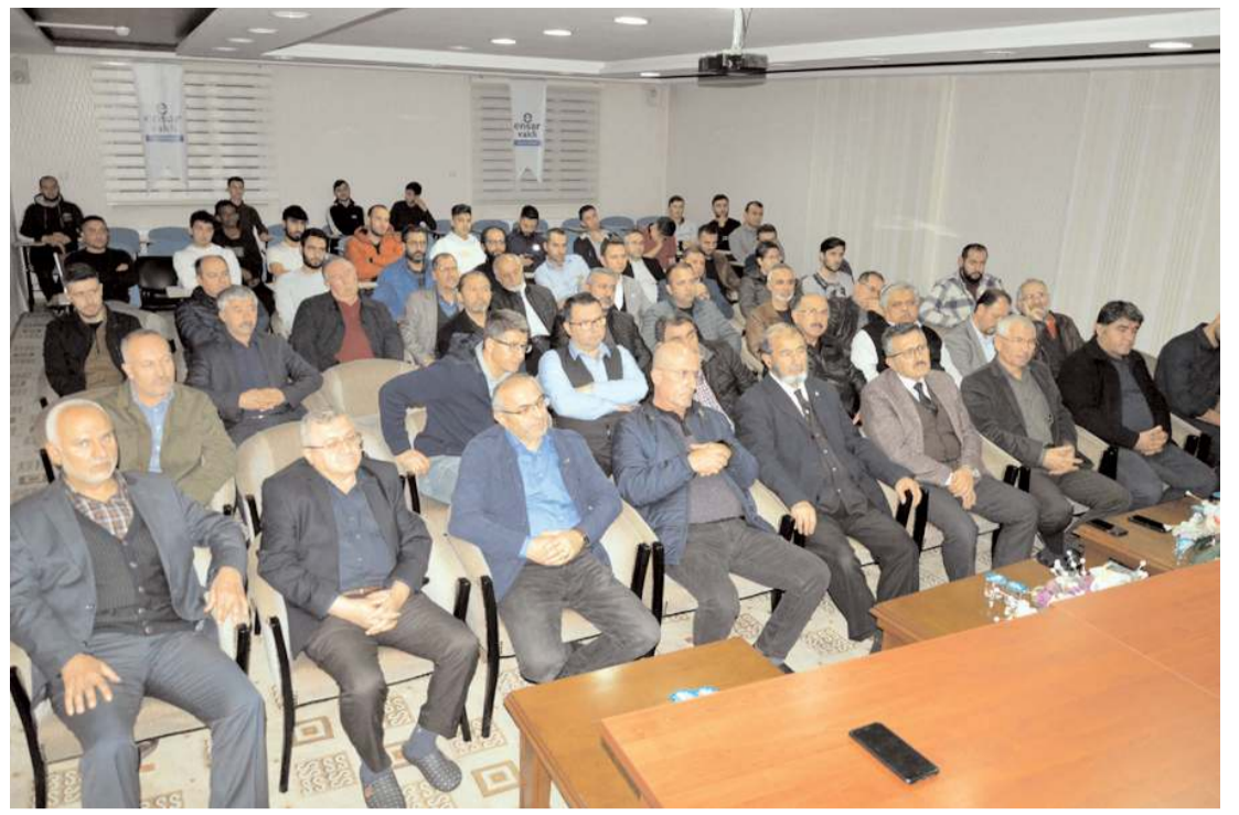
Tarih sohbetleri programına ilgi yüksek oldu.

Hakimiyet, merhuma Allah'tan rahmet, ailesine ve sevenlerine başsağlığı diler.