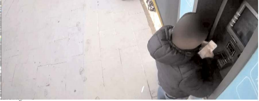
Örgüt mensuplarının para transferlerini gerek kargo gerekse bankamatik üzerinden ve birbirlerini tanımayan insanlara yaptıkları belirlendi.