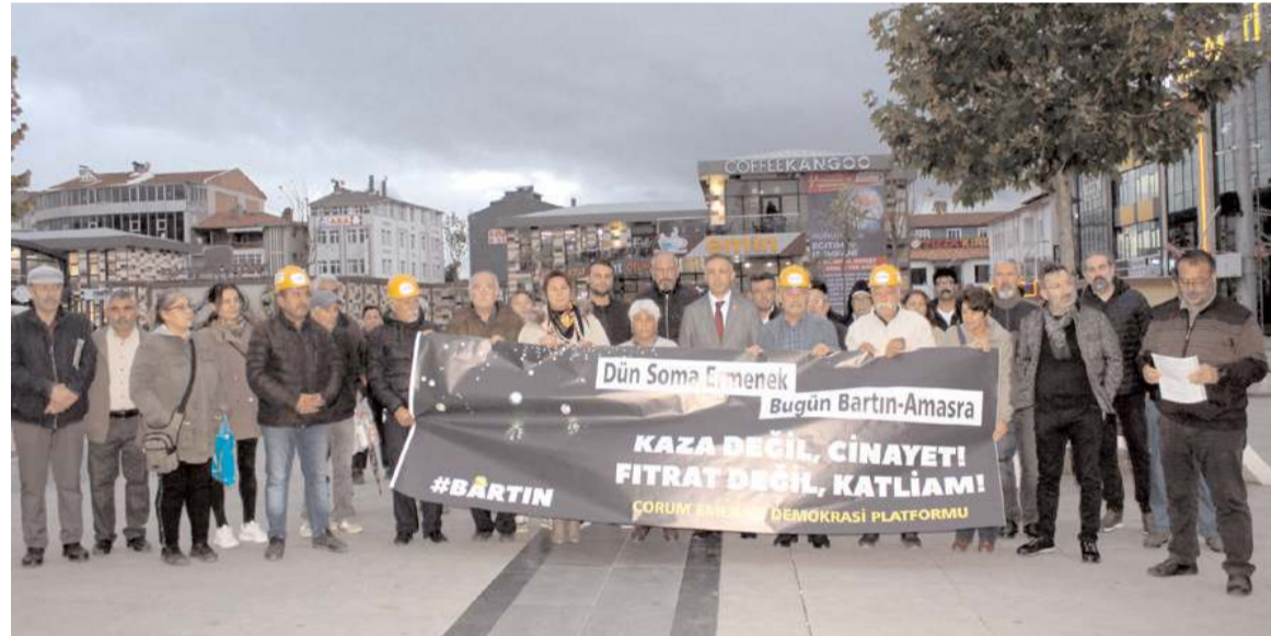
Çorum Emek ve Demokrasi Platformu, grizu patlaması sonucu hayatını kaybeden 41 madenci için basın açıklaması gerçekleştirdi.