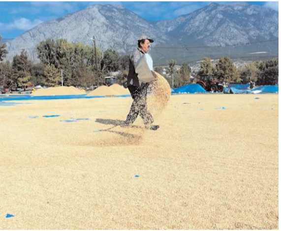
Çeltik hasadından bir görüntü...

Çorum'un Kargı ilçesinde Kızılırmak çevresindeki bereketli topraklarda bu yıl yaklaşık 12 bin ton çeltik hasat edilmesi bekleniyor.