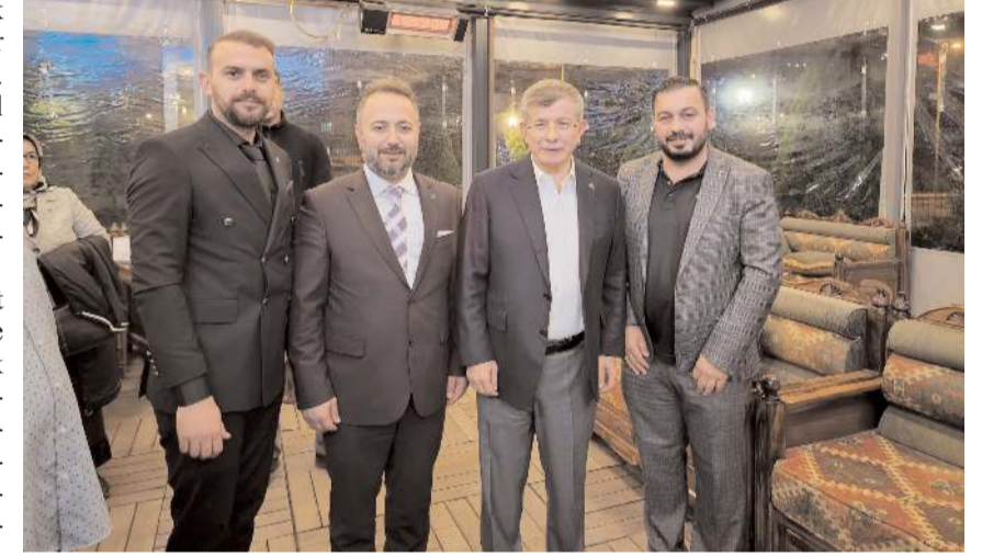
Gelecek Partisi Çorum İl Başkanı, Genel Başkan Ahmet Davutoğlu ile birlikte...