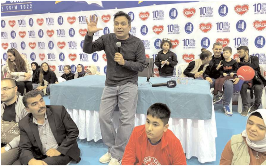
Yazarların söyleşilerine ilgi yüksek.