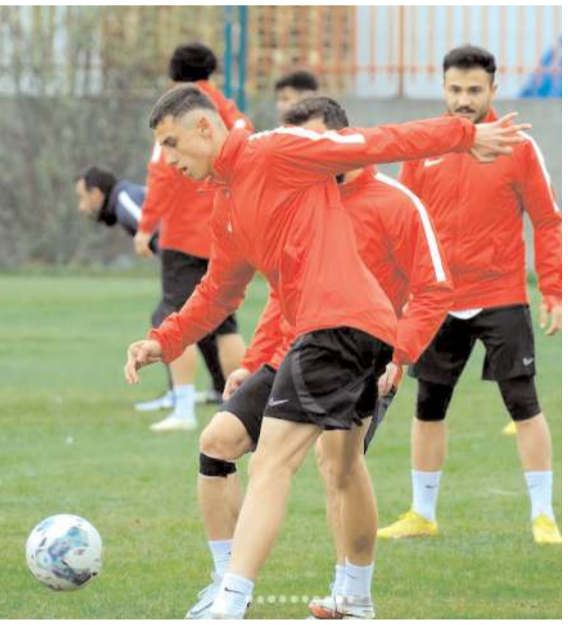
Çorum FK dün yaptığı antrenmana alt yapıdan çağrılan gençlerin katılımı ile Esenler kupa maçının hazırlıklarını dün yaptığı antrenmanla tamamladı

Çorum FK ile Esenler Erokspor arasındaki maçı Ardahan bölgesi hakemi Doğu Yılmaz yönetecek.