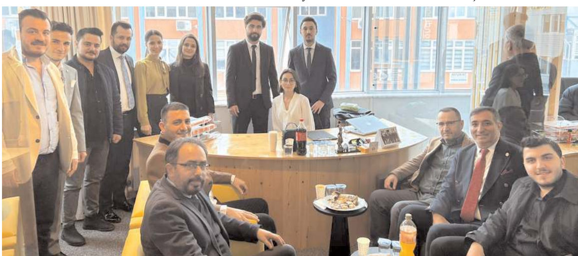
Açılışa çok sayıda davetli katıldı.