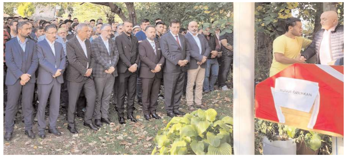
Gelecek Partisi Çorum heyeti maden şehidinin cenazesine katıldı.