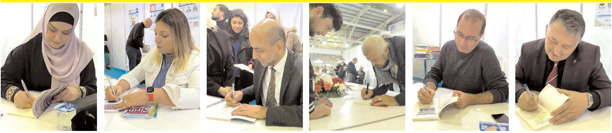
Kitap Kültür Günleri'ne şimdiye kadar katılan birçok yazar hem söyleşi yaptılar hem de kitaplarını imzaladılar.