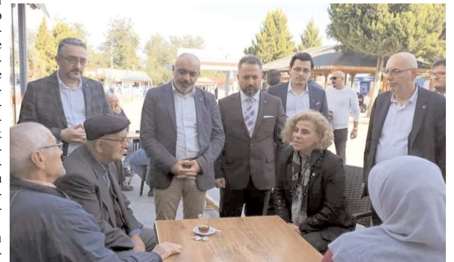
Partitiler, madende yakınları bulunan vatandaşlarla bir araya gelerek, facia hakkında bilgi aldı.

kendi ailemize düşmüş gibi hissetmenin hüznünü yaşıyoruz. Hayatını kaybeden vatandaşlarımıza rahmet diliyoruz, ailelerine sabrı cemil niyaz ediyoruz" dedi.