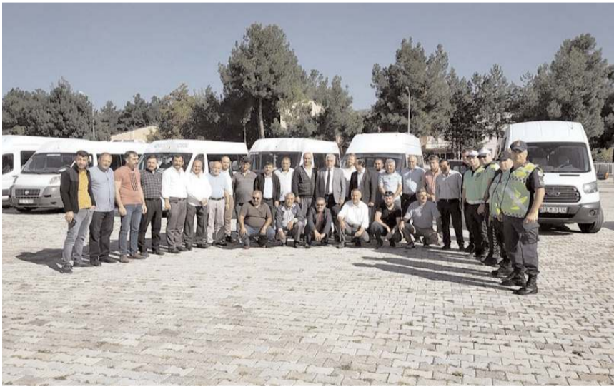
Jandarma ekipleri okul minibüslerini denetledi.

Osmancık'ta okul bulunmayan köylerden 2022-2023 eğitim-öğretim döneminde temel eğitimde 31 servis aracı ile toplam 457 öğrenci, özel eğitimde 5 araç ile toplam 50 öğrenci, ortaöğretimde 15 araç ile toplam 222 öğrenci, genel toplamda 51 servis aracı ile 729 öğrenci taşınması için eğitim sistemi ile eğitim öğretim görüyor. (İHA)