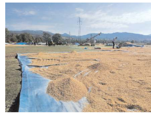
Bu yıl yaklaşık 12 bin ton çeltik hasat edilmesi bekleniyor.