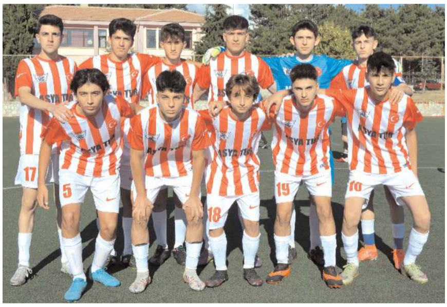
Hattuşa Gençlikspor ilk galibiyetini Bayat Belediyespor deplasmanında aldı