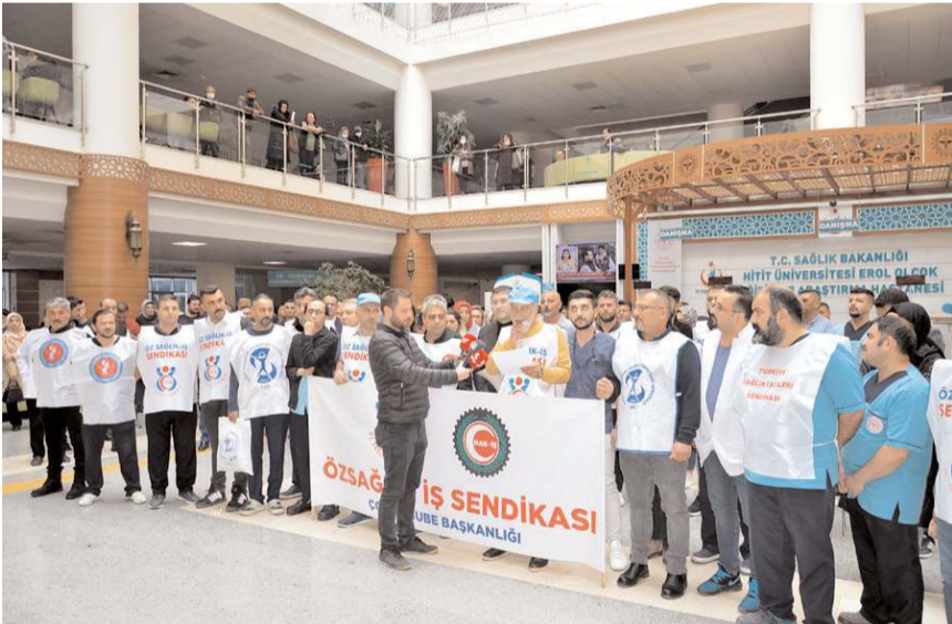
Basın açıklamasına sağlık sendikaları da destek verdi.