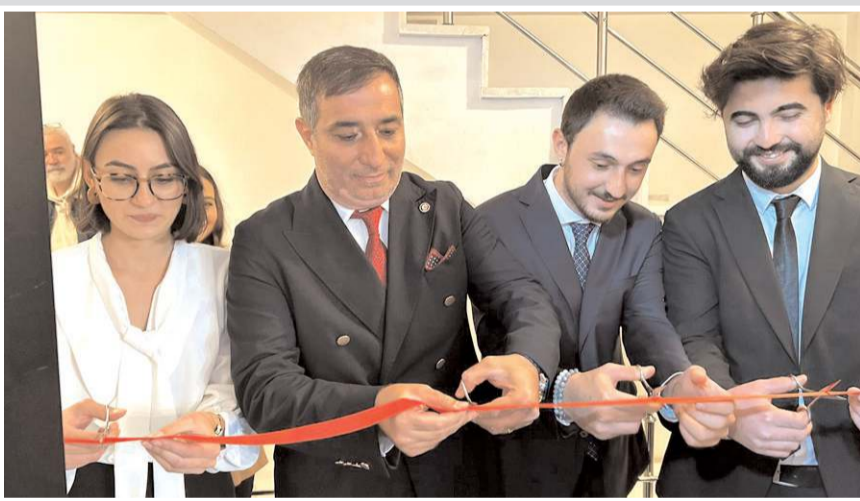
MDK Hukuk Bürosu'nun açılış kurdelesini Baro Başkanı Av. Turan Kalıpcı kesti.

Açılışa konuşma yapan Baro Başkanı Av. Turan Kalıpcı, genç meslektaşlarını tebrik ederek, hayırlı olsun dileklerini ilettiler.