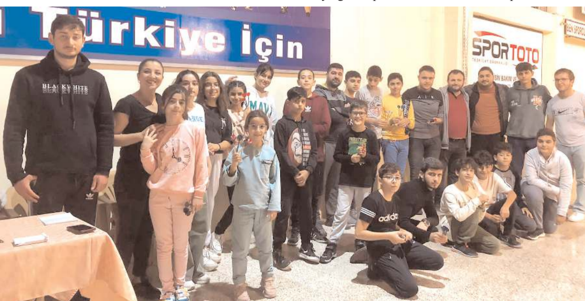
Amatör Spor Haftası Bocce müsabakalarına katılan sporcular maçlar öncesinde toplu halde görüntüleri