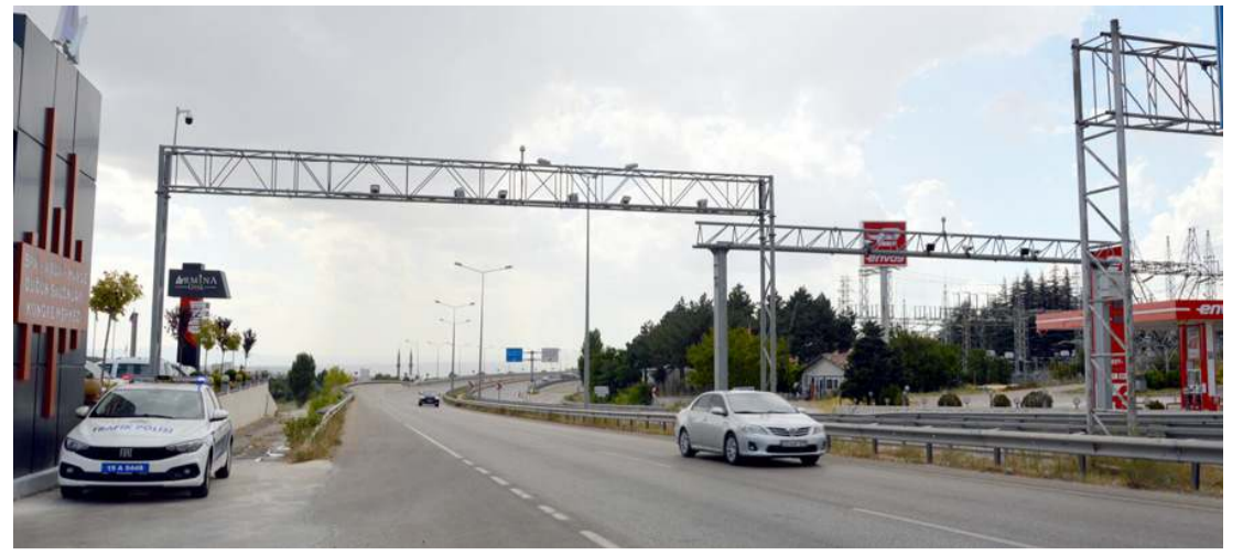
Yaydığın Kavşağı'ndan Armina Otel'e kadar EDS sistemi faaliyete geçirildi.