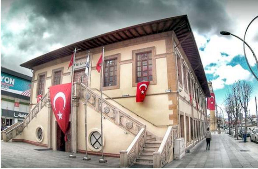
Personel alımı başvuruları dün sona erdi.

Çorum BELTAŞ A.Ş personel alımı başvuruları dün sona erdi. Mülakat yer ve zamanı daha sonra SMS yoluyla bildirilecek.