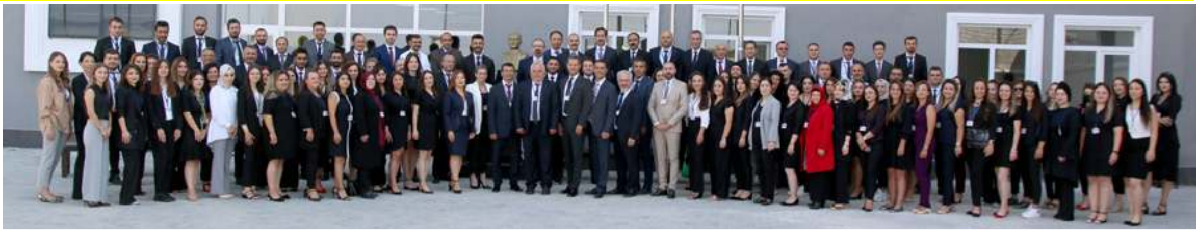
Çorum Özel Ada Koleji yeni eğitim öğretim yılı öncesi öğretmenlerine yönelik 'Yaz Dönemi Seminer Programı' gerçekleştirdi.