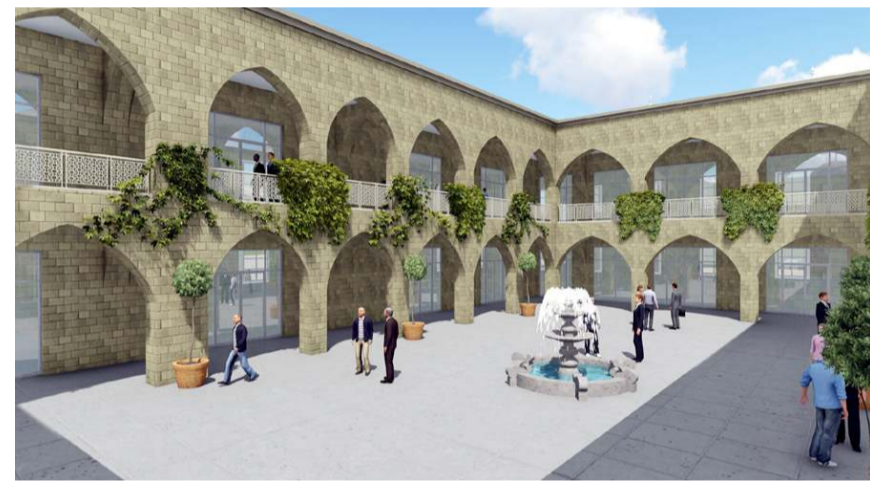
Bedesten içerisinde 25 adet işyeri olacak.

Bedestenin taş yapısı ile tarihi görünümüne sa-