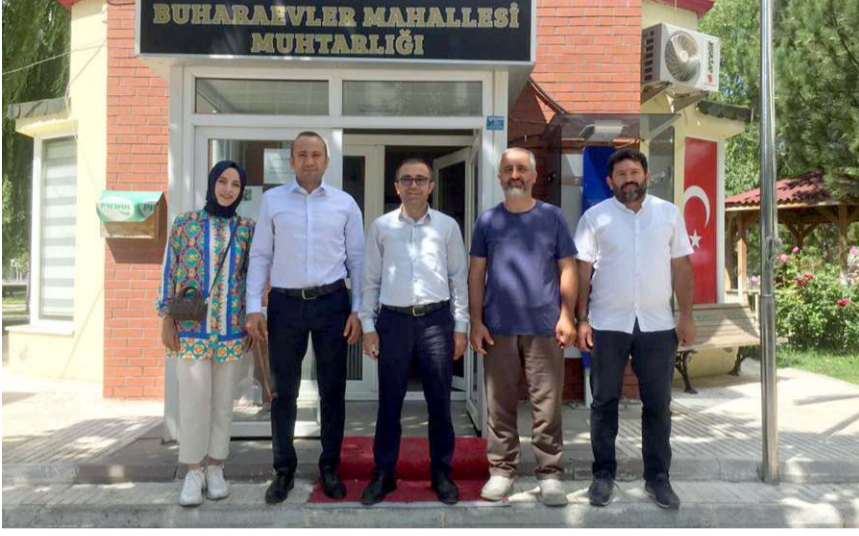
Yıldırım, muhtarlara Kızılay'a göstermiş oldukları ilgi ve alakadan dolayı teşekkür etti.

Kızılay'ın sadece kan alma, kan ihtiyacını karşılama faaliyeti olmadığını ayrıca sosyal destek nokta-