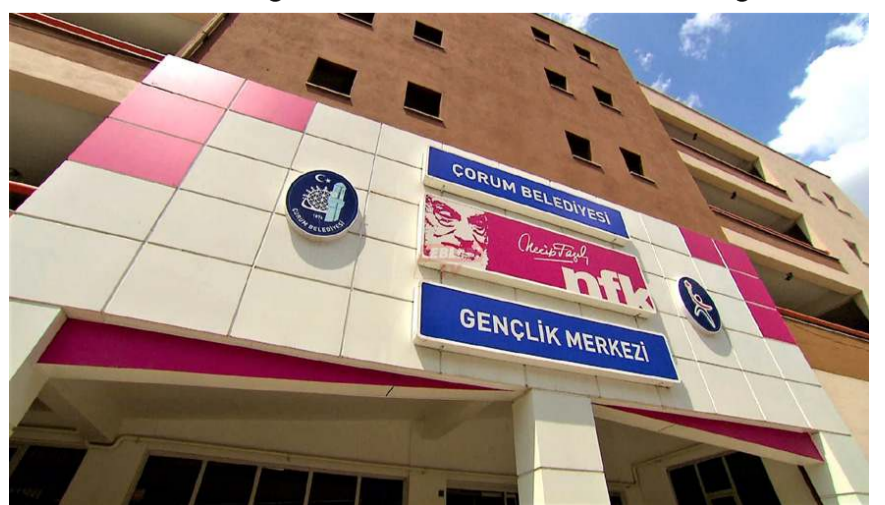
YKS kurslarında 22 saat eşit ağırlık ve 28 saat sayısal eğitim verilecek.

Soru çözümleri, 30 deneme sınavı ve rehberlik gibi konuların yer aldığı YKS kurslarında Matematik, Fizik, Biyoloji, Türkçe, Edebiyat, Tarih, Coğrafya, Felsefe alanlarında kurslar düzenlenecek. Haftada 22 saat eşit ağırlık ve 28 saat sayısal eğitim verilecek. (YKS) Yükseköğretim Kurumları Sınavı'na hazırlanan adaylar NFK Gençlik Merkezi, Buhara Gençlik Merkezi yada online olarak (başvuru.corum.bel.tr) adresinden kayıt yaptırabilirler. (Haber Merkezi)