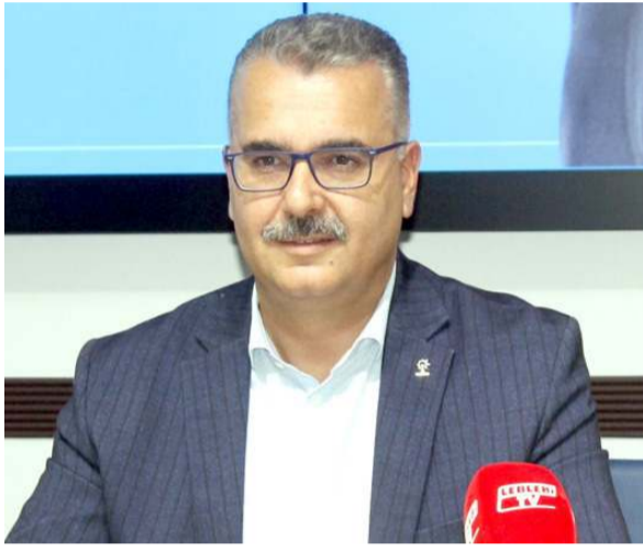
Av. Yusuf Ahlatcı

Cumhurbaşkanı Recep Tayyip Erdoğan’ın mitingine resmi rakamlara göre 50 bin kişinin