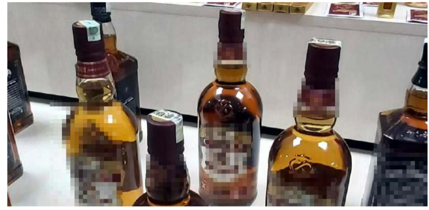
Operasyonda çok sayıda kaçak alkol ve cinsel içerikli ürünler ele geçirildi.