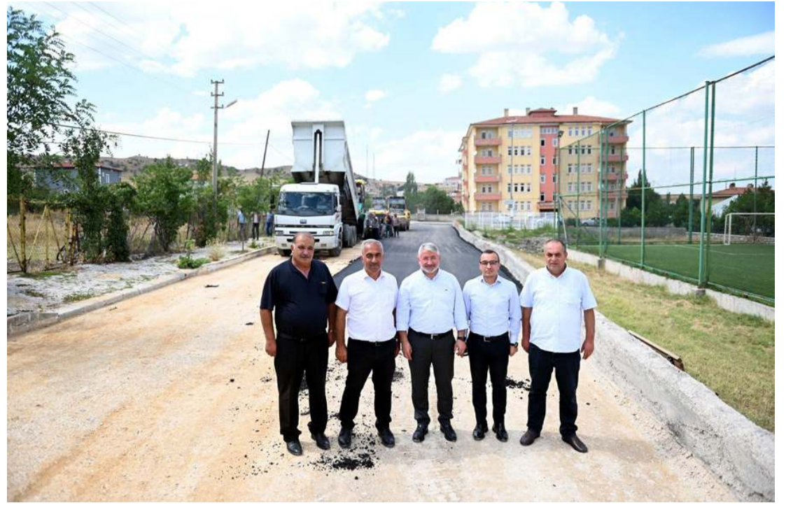
Boğazkale'de Hitit Caddesi'ne bin ton asfalt serimi yapıldı.