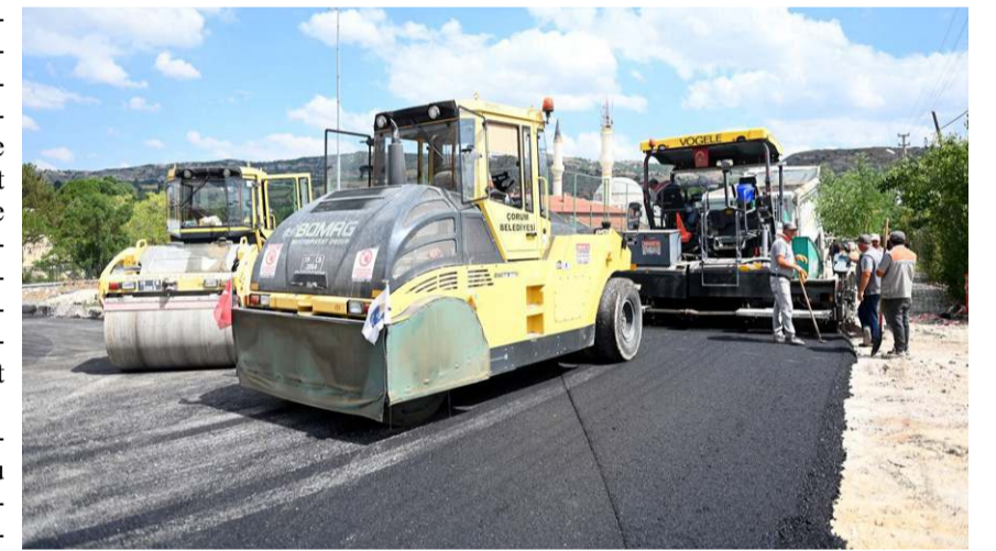
Başkan Aşgın, bütün ilçelere bin ton asfalt dökmeyi hedeflediklerini söyledi.