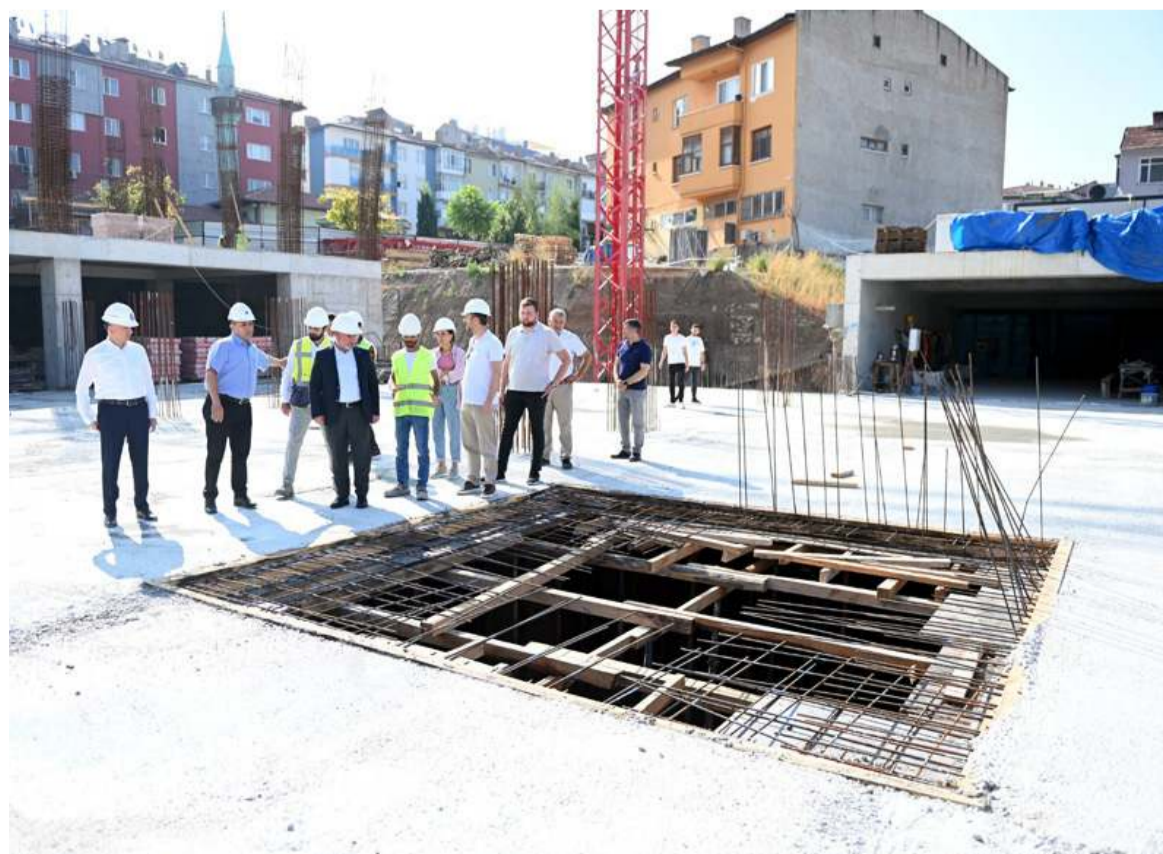
Aşgın, yeraltı otoparkının bölgedeki otopark ihtiyacına önemli ölçüde cevap vereceğini söyledi.

hip olacağını ifade eden Aşgın, "İçerisinde 25 adet işyeri olacak. Ön ve yan kısmında orta büyüklükteki meydanlarıyla birlikte şehrimize kazandırmış olacağız. Bedesten ve 211 araçlık otoparkı inşallah yıl sonu itibarıyla açılışını gerçekleştireceğiz. Hemşehrilerimize hayırlı olsun" diye konuştu. (Haber Merkezi)