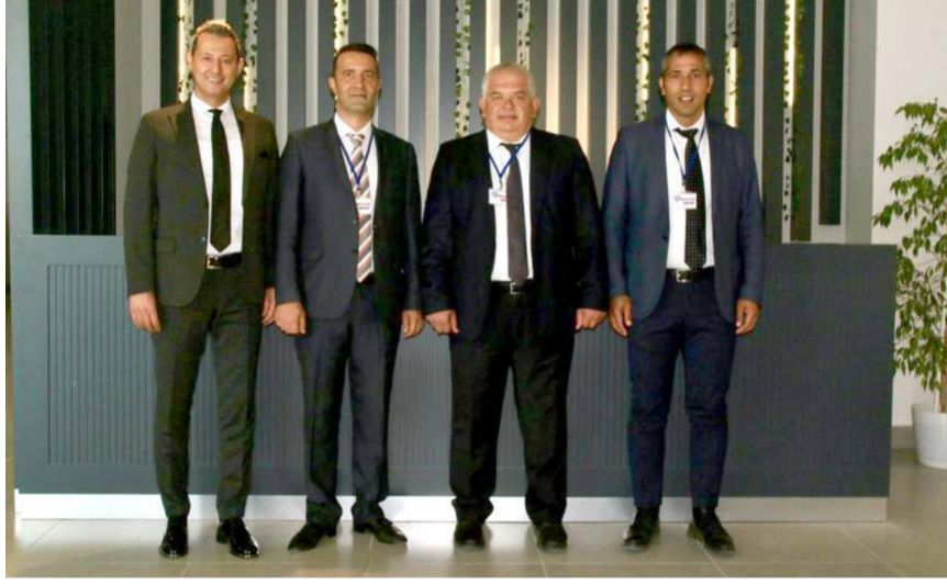
Toplantı Binevler Kampüsünde düzenlendi.