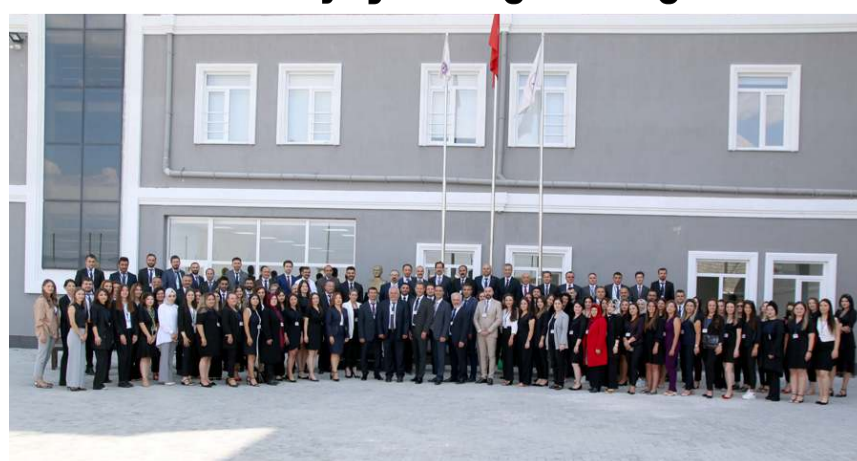
Çorum Özel Ada Koleji yeni eğitim öğretim yılı öncesi öğretmenlerine yönelik 'Yaz Dönemi Seminer Programı' gerçekleştirdi.

■ Çorum Özel Ada Koleji 2022-2023 eğitim öğretim yılı öncesinde, öğretmenlerin e yönelik 'Yaz Dönemi Seminer Programı' gerçekleştirdi. * HABERİ 6'DA