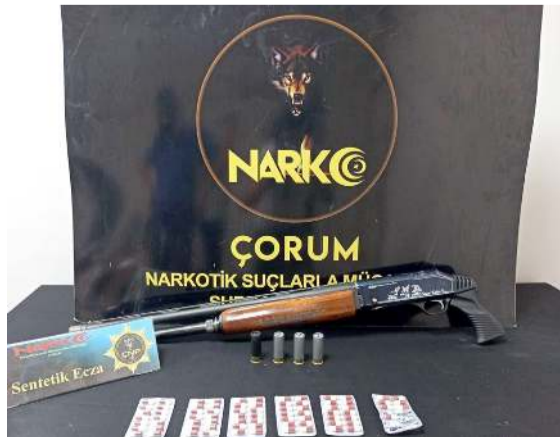
Operasyonda 1 kişi gözaltına alınarak tutuklandı.

■ Çorum Özel Ada Koleji 2022-2023 eğitim öğretim yılı öncesinde, öğretmenlerin e yönelik 'Yaz Dönemi Seminer Programı' gerçekleştirdi. * HABERİ 6'DA