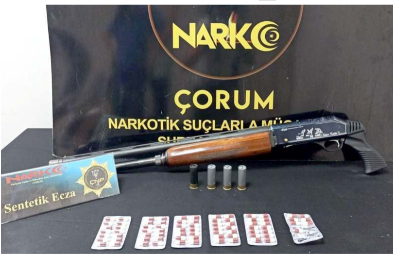
Operasyonda çok sayıda uyuşturucu madde ele geçirildi.

Çorum Emniyet Müdürlüğü, Narkotik Suçlarla Mücadele Şube Müdürlüğü ekipleri tarafından bir iş yerinde düzenlenen operasyonda çok sayıda uyuşturucu madde ele geçirildi.