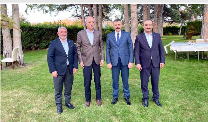
Numan Kurtulmuş, Tokat'a giderken Çorum'da mola verdi.