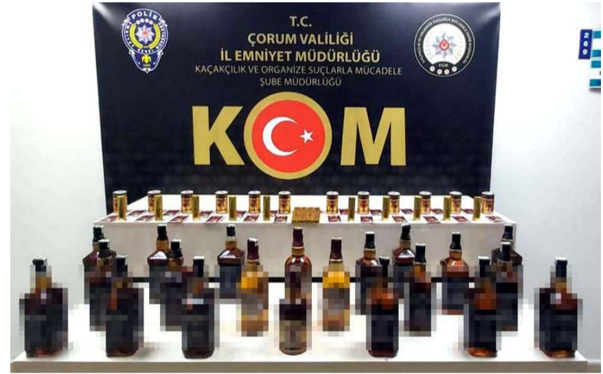
Kaçak alkol operasyonunda 1 kişi gözaltına alındı.

Gözaltına alınan şahsın emniyetteki işlemleri sürüyor. (Haber Merkezi)