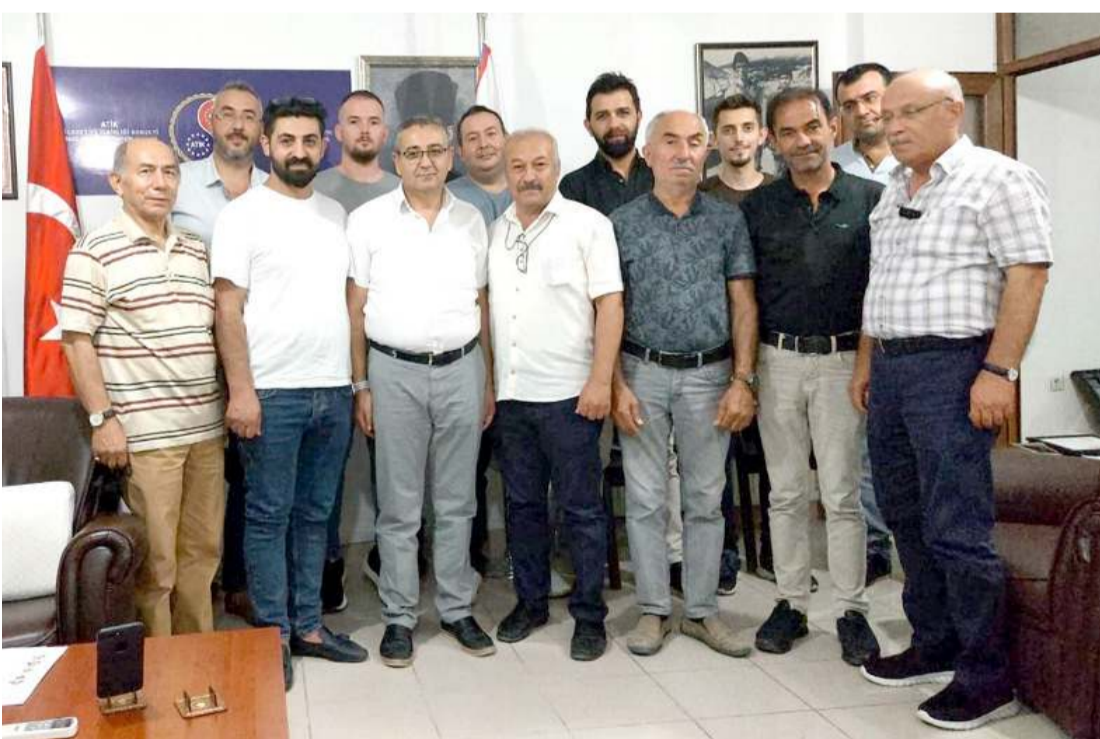
Toplantıda yerel ve bölgesel yapılacak çalışmaların yanı sıra ulusal ve uluslararası B2B ikili görüşme ve iş formu toplantılarına katılımların değerlendirildiği belirtildi.

Dolayısı ile AK Parti son barutunu attı, ortağı da üzerine mevlüt okuttu. 2053'e kim öle kim kala. Ama şunun şurasında 2023'e 5 aydan az bir süre kaldı. 2023'ün somut vaatleri şimdiden yalan oldu. Bu vaatlerin yalan olduğunu da, Sayın Erdoğan'ın imza attığı Orta Vadeli Program cümle âleme ilan etti. Artık zaman mavra yapacak zaman değil. Dolar 18 lirayı aşarken, 2053'e masal yazmayı bırakın. Beceriksizliğiniz için, milletten samimi bir özür dileyin. Gidiyorsunuz, az kaldı."