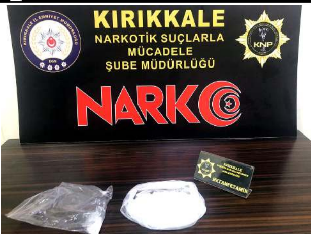
Uyuşturucu madde kullanan ve ticareti yapan şahıslar üzerinde çalışmalar sürüyor.

K.Ş ve M.K. isimli şahıslar bulunduğu araçta yapılan aramada 205 gram metamfetamin, 7 adet farklı marka ve modellerde telefon ile 1 adet şarj bataryası, 2 adet harici bellek ele geçirildi. Emniyetteki işlemlerin ardından adli yele sevki edilen 2 şüpheli, "uyuşturucu madde imalata ve ticareti" suçundan tutuklandı. (İHA)