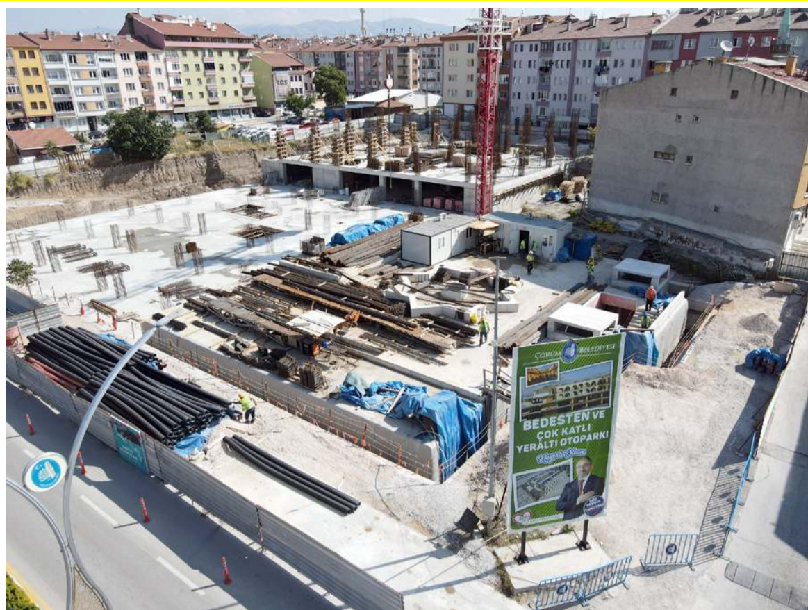
Bedesten ve Yeraltı Otoparkı inşaatında çalışmalar devam ediyor.

Acil durum numaraları artık 112 çatısı altında!