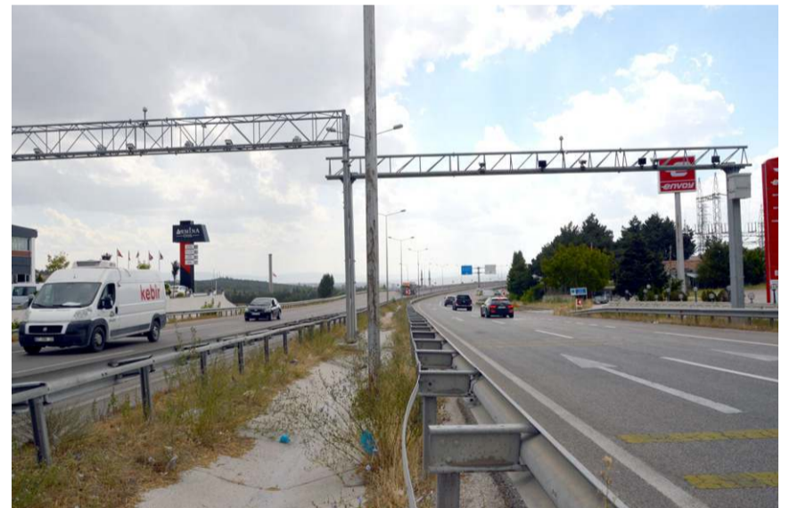
Otomobillerde hız sınırının 70, kamyon, kamyonet ve ticari araçlarda 50 km hız sınırı olduğu belirtildi.

bölgelere sürücülerini bilgilendirmek amacıyla otomobiller için 70 kilometre, kamyon, kamyonet ve otobüsler için 50 kilometre olup diğer araçlar ise Karayolları Trafik Yönetmeliği 100. Maddesinde belirtilen hız limitleri Karayolları 73. Şube Şefliği'nce trafik işaret ve uyarı levhaları yerleştirildiğini belirten Demir; "Temmuz ayı içerisinde duyurusu yapılan EDS-PTS projesi 15 Ağustos'tan itibaren Yaydığın Kavşağı Çimento Köprülü Kavşak güzergahları arasında çift yönlü olarak ortalama hız denetimi başlamıştır." diyerek sürücülerini uyardı.