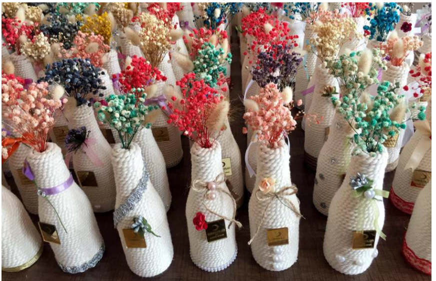
Proje kapsamında Kızılay maden suyu şişeleri üzerine süsleme yapıldı.

Kızılay Çorum Şubesi tarafından, Kızılay maden suları şişesi üzerine yapılan süsleme ile hayata geçirilen proje kapsamında kan bağışi yapan vatandaşlara geri dönüşümün önemini anlatan hediye verildi.