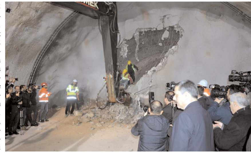
Kırkdilim'de inşaatı devam eden tünellerde kazı işlemleri tamamlandı.