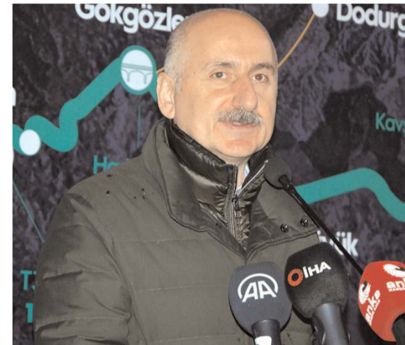
Ulaştırma ve Altyapı Bakanı Adil Karaismailoğlu

Kırkdilim'de inşaatı devam eden tünellerde kazı işlemleri tamamlandı.