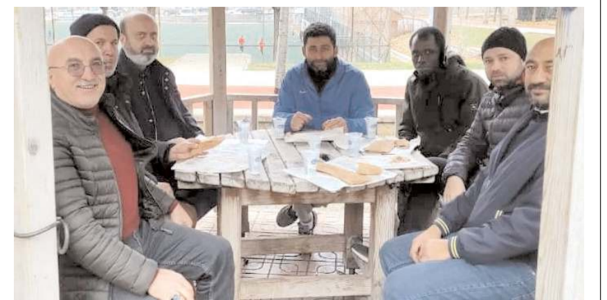
sındaki maçın ardından parkta düzenlenen yemeğe Mimar Sinan Gençlikspor kulübü yöneticileri ve sporcular katıldılar.