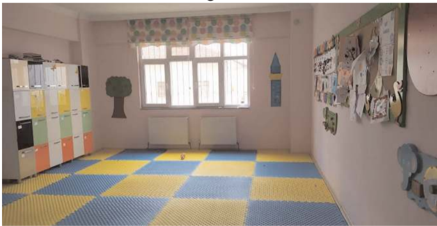
Diyanet Sen Çorum Şubesi, Bayat Atıf Hoca Kur'an Kursu'na yardımcı bulundu.