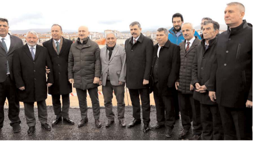
Ulaştırma ve Altyapı Bakanı Adil Karaismailoğlu, kavşak hakkında açıklamalarda bulundu.