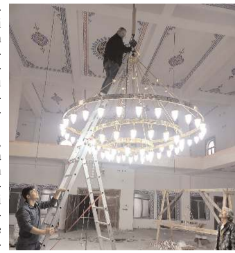
Mescidin avizeleri takıldı.