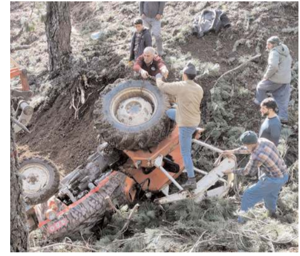
Kaza Kayı köyü Kise Gölü mevkinde ormanda meydana geldi.