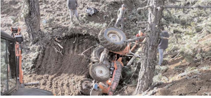
Çevrede bulunan vatandaşlar kaza yapanların yardımına koştu.

İhbar üzerine bölgeye jandarma, itfaiye ve sağlık