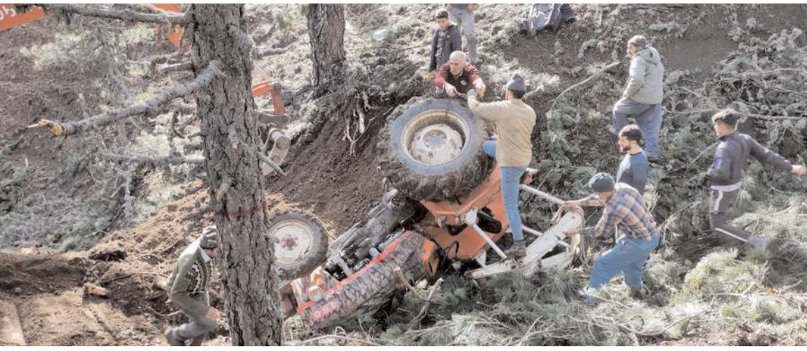
Kaza Kayı köyü Kise Gölü mevkinde ormanda meydana geldi.