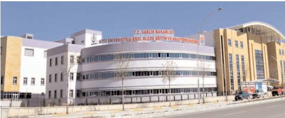
Sağlık Bakanlığı-Hitit Üniversitesi Erol Olçok Eğitim ve Araştırma Hastanesi Sağlık Kurulu'nda yoğunluk yaşanıyor.