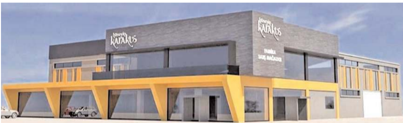
Firma Çorum Organize Sanayi Bölgesi'nde kurduğu fabrikada üretim yapıyor.