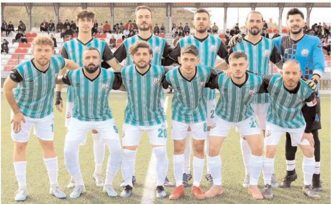
Sungurlu Belediyespor ligdeki dördüncü maçından da galibiyet ile ayrılarak liderliğini devam ettirdi

Ligde bu hafta sonu iki kayıpsız takımı Sungurlu Belediyespor ile Mimar Sinan arasındaki maç şampiyonluk yolunda büyük önem taşıyor.