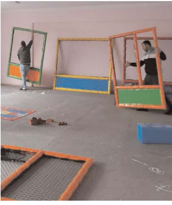
Oyun gruplarının kurulumu yapıldı.

Oğuzlar'da ormanlık alanda devrilen traktördeki 3 kişi yaralandı. Abdullah İ. idaresindeki 19 FF 104 plakalı traktör, Kayı köyü Kise Gölü mevkindeki ormanlık alanda devrildi. * HABERİ 7'DE