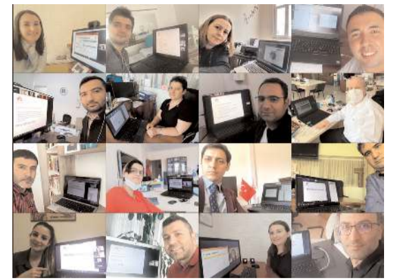
Program, 20 Aralık'ta düzenlenecek "Sosyal İnovasyon" eğitimi ile Çorumlu öğretmenlerle buluşacak.

Anadolu Vakfı gençleri yetiştiren Değerli Öğretmenleri de eğitim ve gelişim programları ile destekliyor. Değerli Öğretmenim Programı'nda öğretmenlerin; sürekli değişen dünya ve koşullar karşısında fark yaratabilen, araştıran, sorgulayan profesyoneller olarak bilgi, beceri ve yetkinliklerini arttırmaları hedefleniyor. Milli Eğitim Bakanlığı'nın "Eğitim Vizyonu" doğrultusunda hazırlanan eğitim programlarına Türkiye'nin dört bir yandaki öğretmenlerin yanı sıra eğitim alanında görev yapan yöneticiler ve okul idare ekipleri de katılıyor. Bugüne kadar 190 bine yakın öğretmenin hayatına değer katan Değerli Öğretmenim, 2013 yılından bu yana kesintisiz devam ediyor. Değerli Öğretmenim Programı kapsamında verilen eğitimler İl Millî Eğitim Müdürlükleri iş birliği ile uzaktan erişim aracı olan Zoom uygulaması üzerinden devam ediyor.