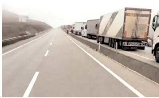
Kaza nedeniyle trafik uzun süre durdu.