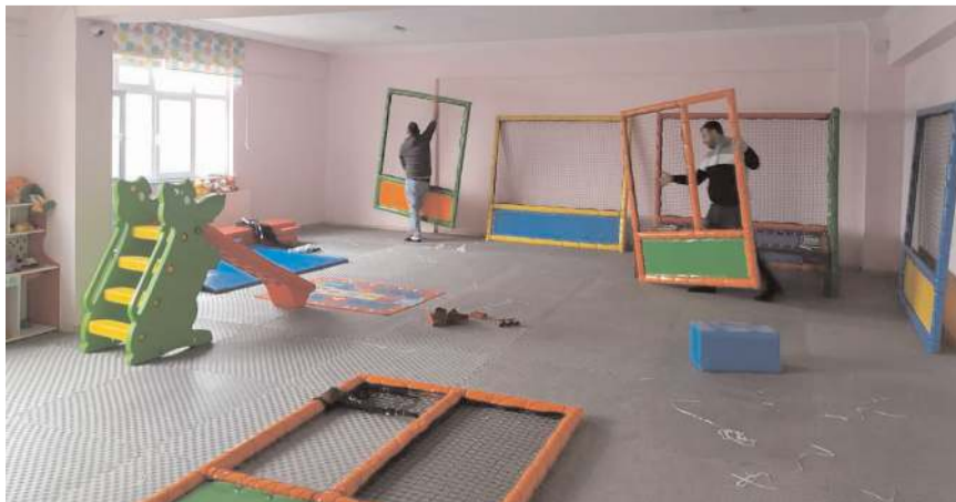
Oyun gruplarının kurulumu yapıldı.