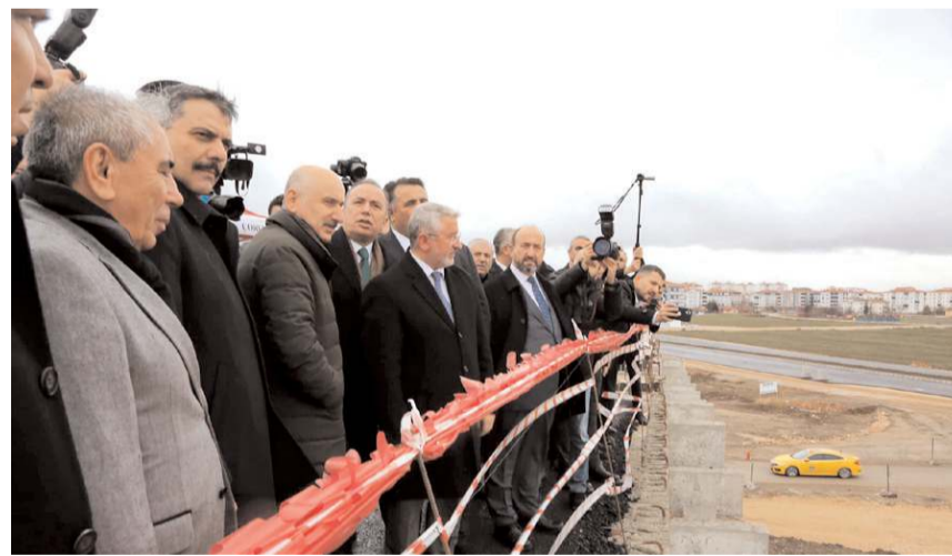
Ulaştırma ve Altyapı Bakanı Adil Karaismailoğlu, kavşak çalışmalarını inceledi.

Ulaştırma ve Altyapı Bakanı Adil Karaismailoğlu, Çevre Yolu'nda inşaatı süren farklı seviyeli köprülülük kavşağın birkaç ay içinde tamamlanarak hizmete açılacağını belirtti. * HABERİ 2'DE