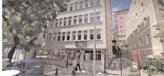
Öğrenci yurdu Çankaya'da bulunuyor.