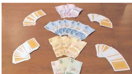
Operasyonda bir miktar para ve iskambil kağıtlarına el konuldu.

kın düzenleyen polis, kumar oynayan 6 kişi ve yer temin eden 2 kişiyi suçüstü yakaladı. Operasyonda bir miktar para ve iskambil kağıtlarına el konuldu. Gözaltına alınan şahıslardan 7'si emniyetteki sorgusunun ardından, 1'i de Cumhuriyet Savcılığı tarafından serbest bırakıldı. (İHA)