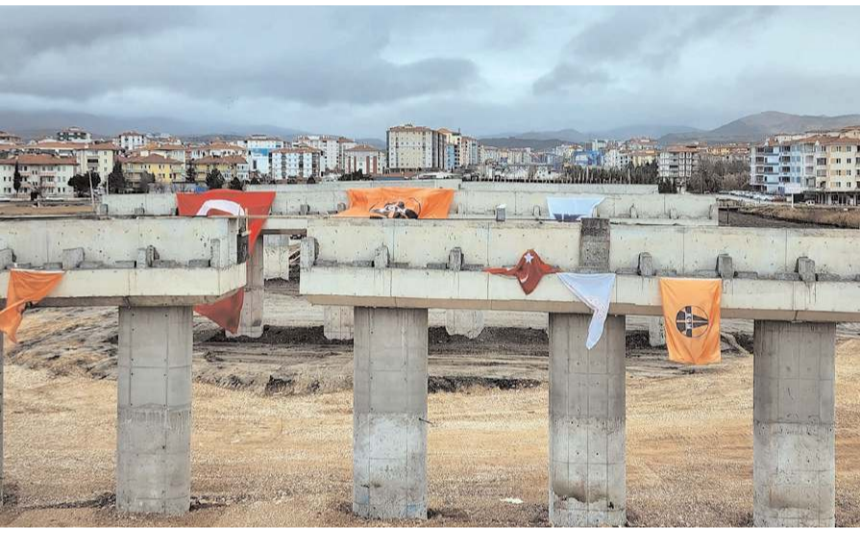
Akşemseddin Köprülü Kavşağı, 300 milyon liraya mal olacak.