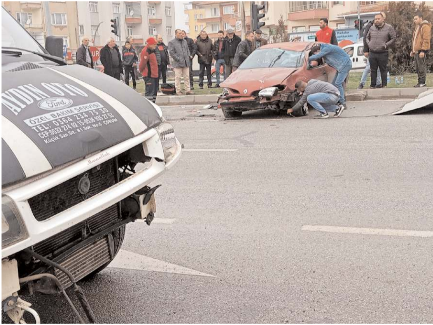
Kazada her iki araçta da maddi hasat meydana geldi.

Sungurlu'da minibüs ile otomobil kavşakta çarpıştı. Kaza, öğle saatlerinde Sungurlu Taş Köprü kavşağında meydana geldi. Edinilen bilgilere göre, minibüs ile otomobil kavşakta çarpıştı. Kazada can kaybı ve yaralanma yaşanmazken, araçlarda maddi hasar oluştu.