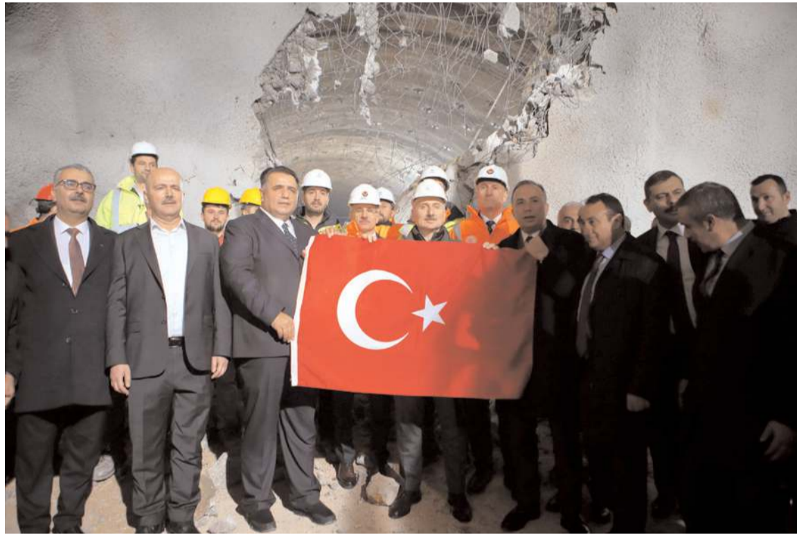
T1 tüneline kazı çalışmalarının tamamlanması nedeniyle ışık görme töreni yapıldı.

Karadeniz Bölgesi'ni İç Anadolu'ya bağlayan en önemli güzergahlardan birisi olan Çorum'da yaklaşık 2 milyar lira yatırım ile inşa edilen Kırkdilim tünellerinde sona geliniyor. T1 tüneline de kazı çalışmalarının tamamlanması nedeniyle Ulaştırma ve Altyapı Bakanı Adil Karaismailoğlu'nun katılımıyla ışık görme töreni yapıldı. * HABERİ 2'DE