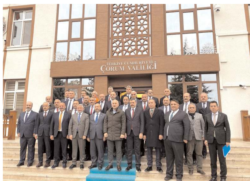
Toplantının sonunda Valilik önünde toplu hatıra fotoğrafı çekildi.