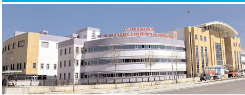
Sağlık Bakanlığı-Hitit Üniversitesi Erol Olçok Eğitim ve Araştırma Hastanesi Sağlık Kurulu'nda yoğunluk yaşanıyor.

Vatandaş sağlık raporu için randevu alamamaktan şikayetçi