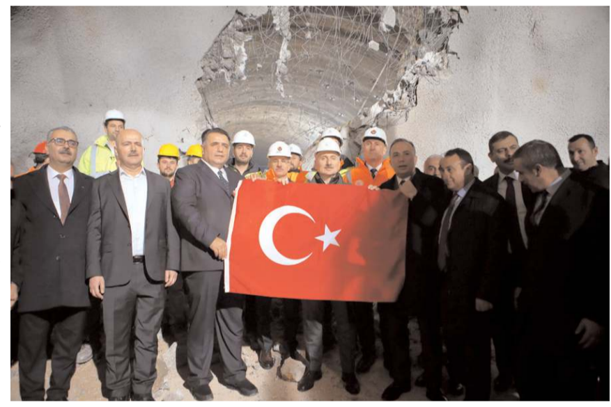
T1 tüneline kazı çalışmalarının tamamlanması nedeniyle ışık görme töreni yapıldı.