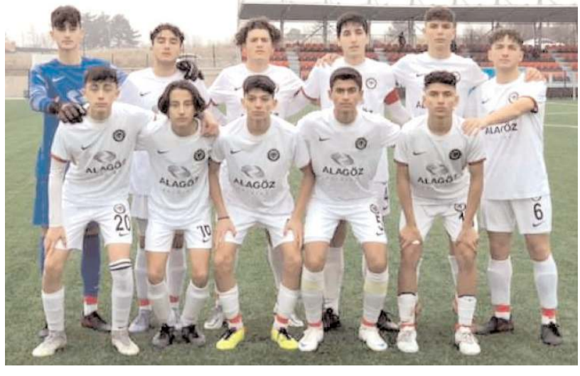
A grubundan farklı galip ayrılan Çorum FK grupta averajla liderliğe yükseldi