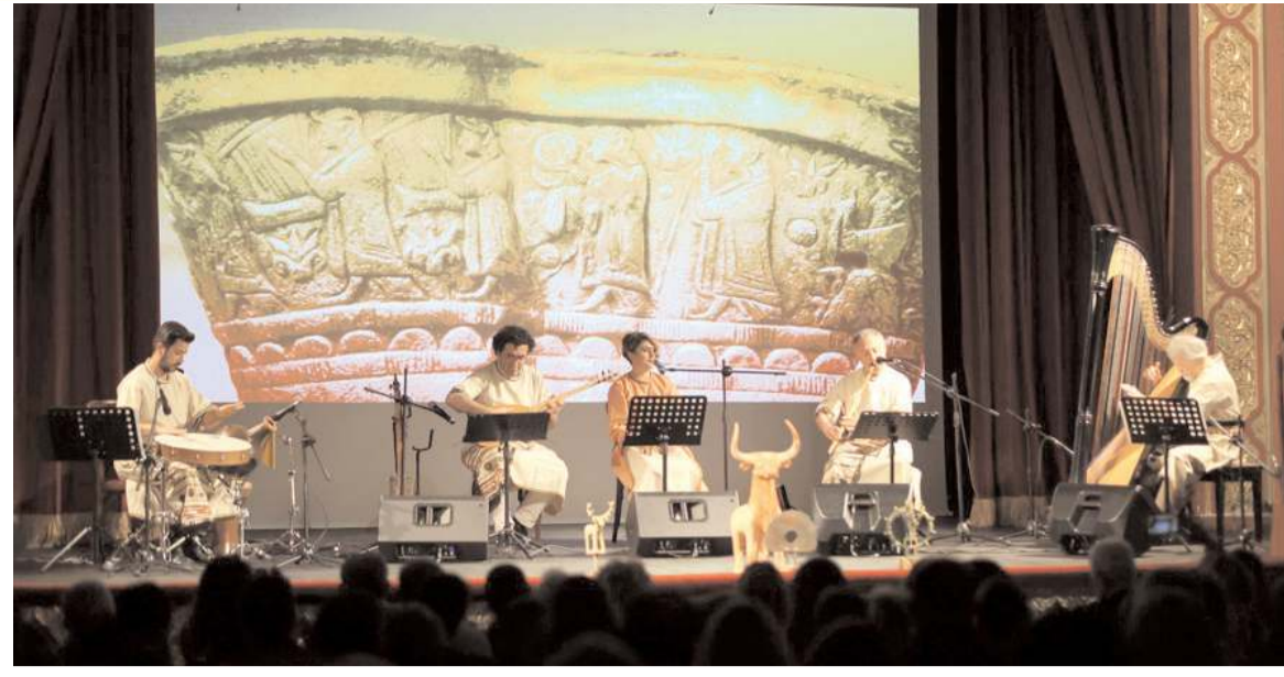
Geçtiğimiz hafta Ankara'da Hitit Ensemble konseri düzenlenmişti.