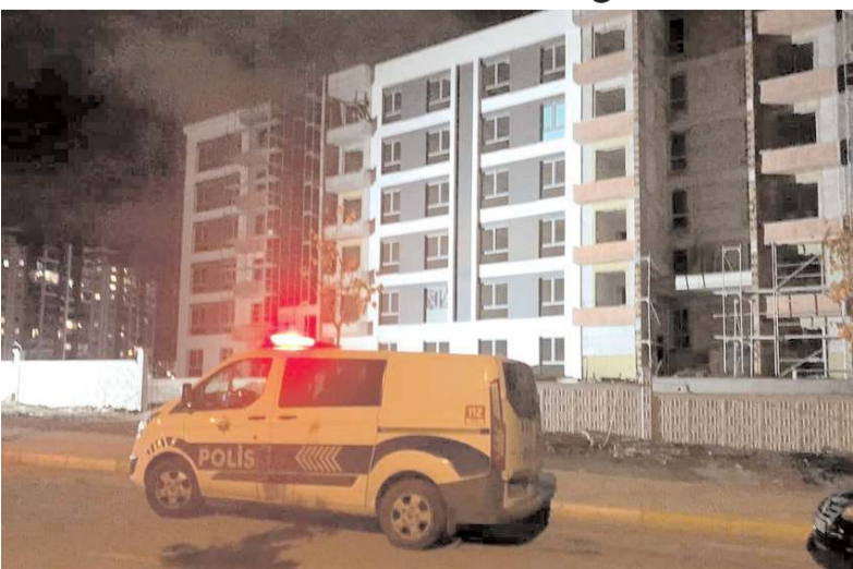
Olay, Binevler 1. Cadde üzerinde bulunan inşaatda meydana geldi.