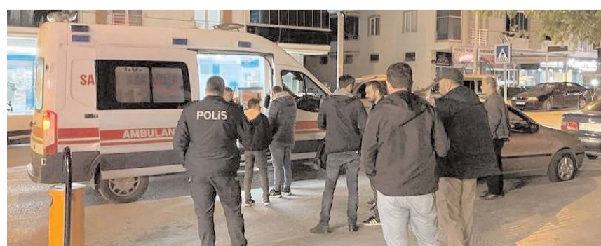
Olay Gülabibey Mahallesi Ata Caddesi'nde meydana geldi.