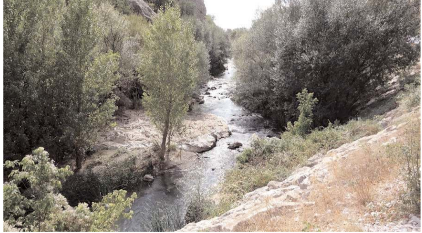
Proje kapsamında yürüyüş yolları, tırmanış parkurları, seyir tepesi, gözetleme kuleleri ve konaklama yerleri yapılacak.