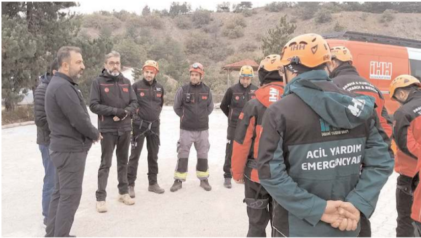
Eğitimine Samsun, Ordu, Kastamonu ve Sivas'tan ekipler katıldı.