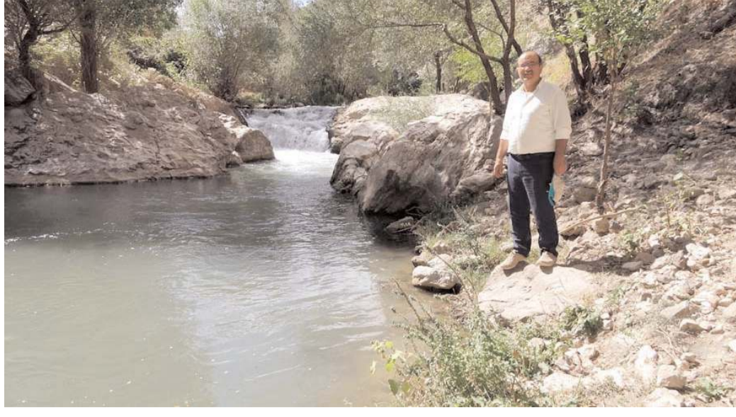
Aydıncık Belediye Başkanı Ahmet Koçak, proje ile ilgili açıklamalarda bulundu.