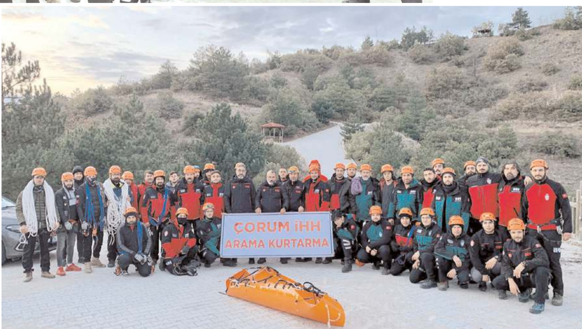
Eğitime 39 kişi ve 5 eğitmen katıldı.

Çorum İHH Arama Kurtarma ekibi Çorum'da DAK Eğitim Programı düzenledi.