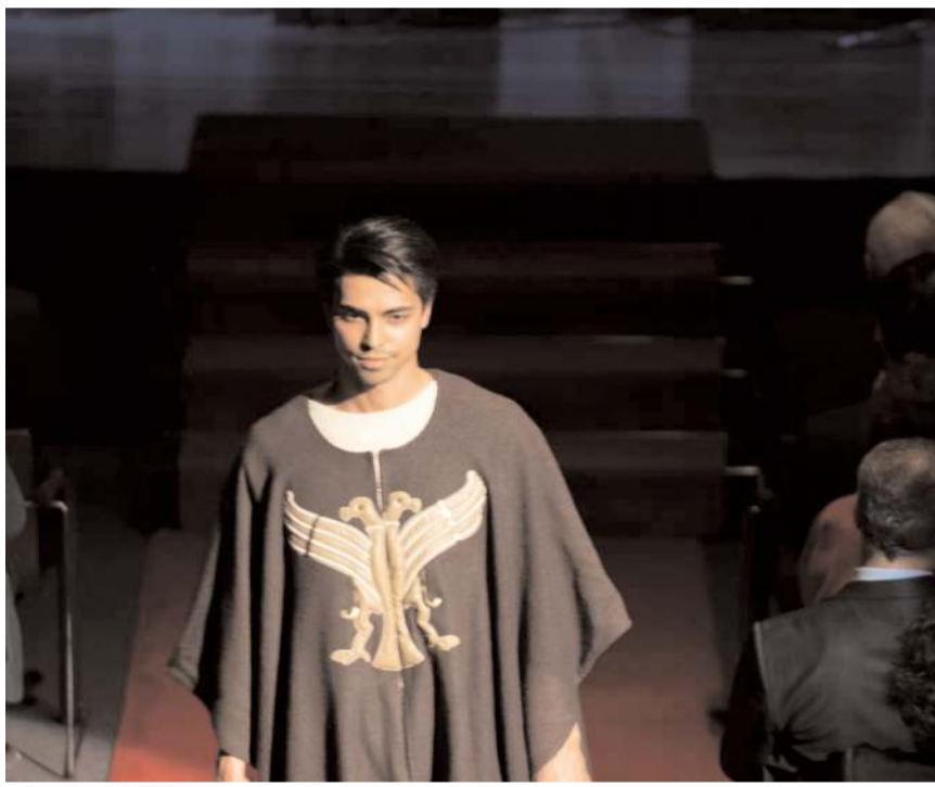
Etkinliklerde Hititler'den günümüze kadar olan kıyafetler sergilenecek.