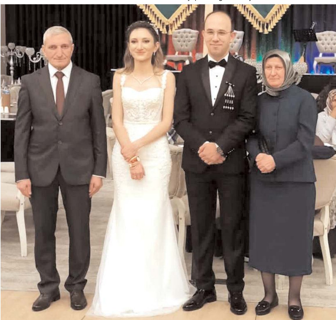
Çiftin düğün töreni Yıldız Park Düğün Salonunda yapıldı.