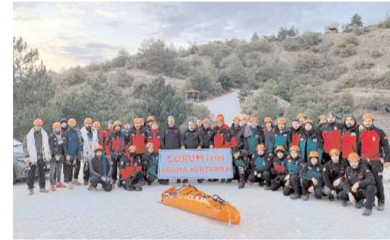
Eğitime 39 kişi ve 5 eğitmen katıldı.