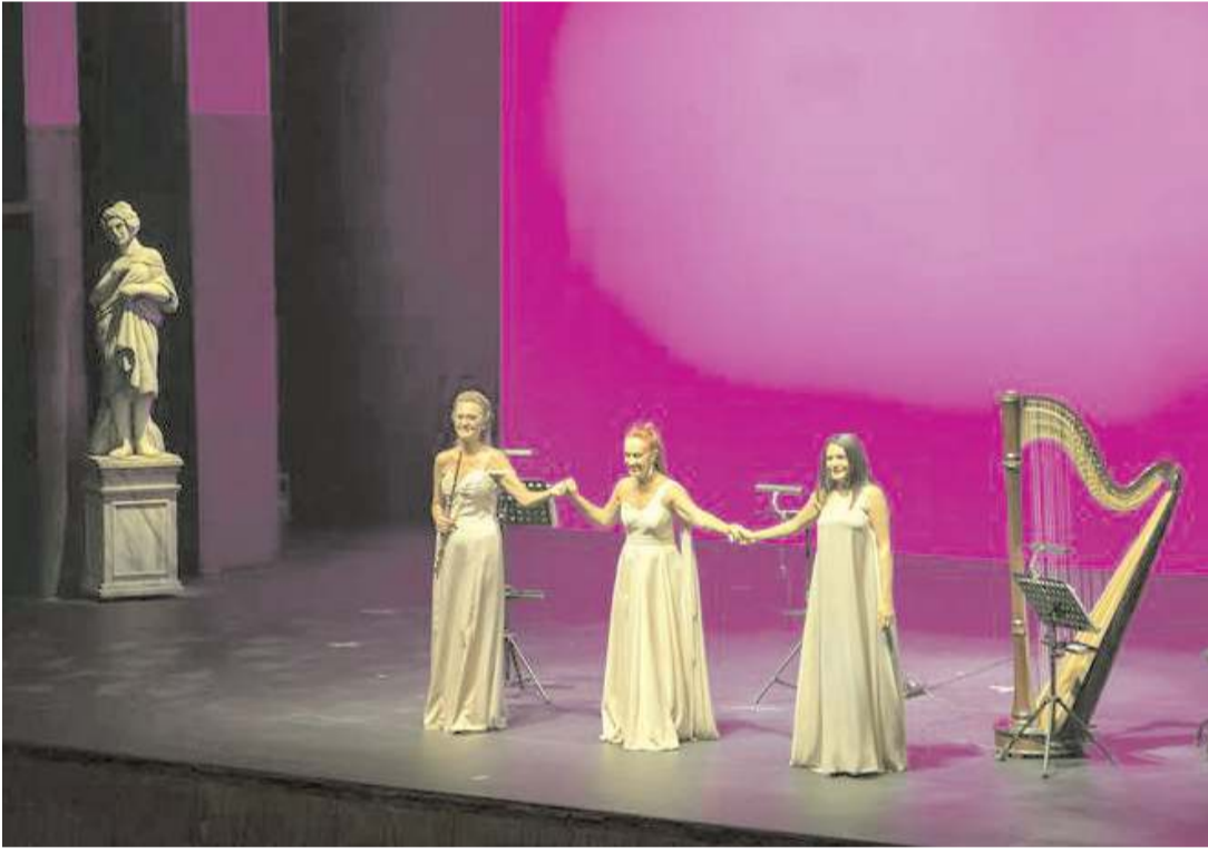
Etkinlikler Patara Trio konseri ile başlayacak.