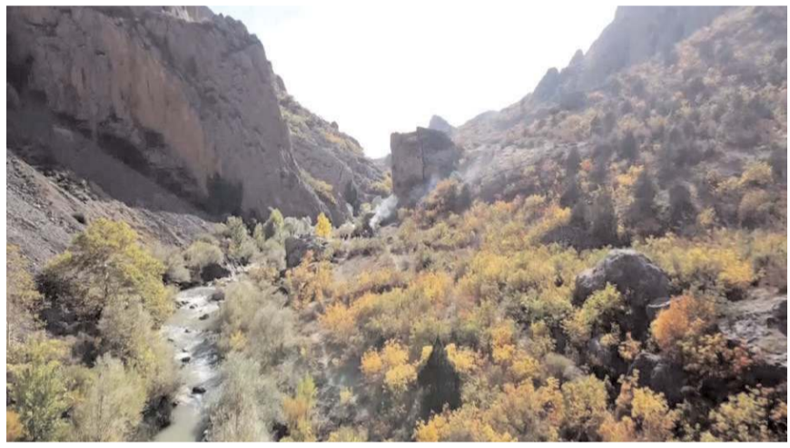
Kanyon 12 km'lik bir uzunluğa sahip.