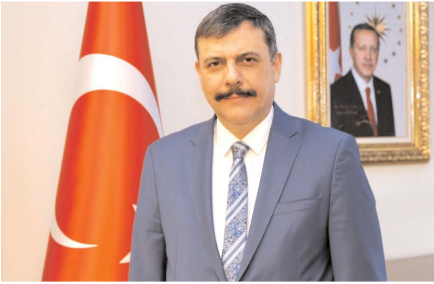
Vali Mustafa Çiftçi

Vali Mustafa Çiftçi, 19 Ekim Muhtarlar Günü nedeniyle yayınladığı mesajında muhtarların köy ve mahallelerde devletin gören gözü, işiten kulağı olduklarını kaydetti.