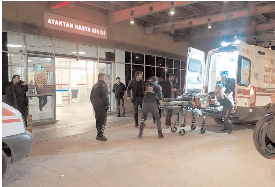
Yaralanan çocuklar hastanelerde tedavi altına alındı.

Yaralılarından durumu ağır olan C.Ç'nin yoğun bakıma alındığı öğrenildi.(AA)