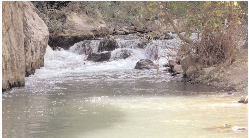
Projeye kanyonun turizme kazandırılması hedefleniyor.