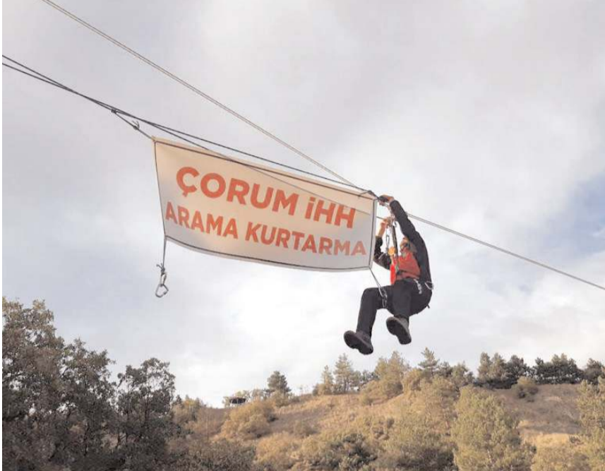
Afet ve savaş bölgelerinde yardım çalışmaları yürüten İHH'nın arama kurtarma ekiplerine, çetin koşullarda eğitimler verildi.