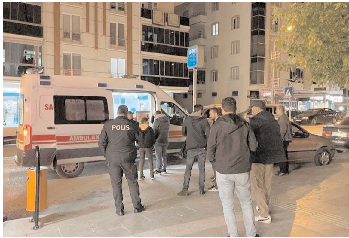
Olay Gülabibey Mahallesi Ata Caddesi'nde meydana geldi.

Hakimiyet, merhuma Allah'tan rahmet, kederli ailesi ve yakınlarına da başsağlığı diler.