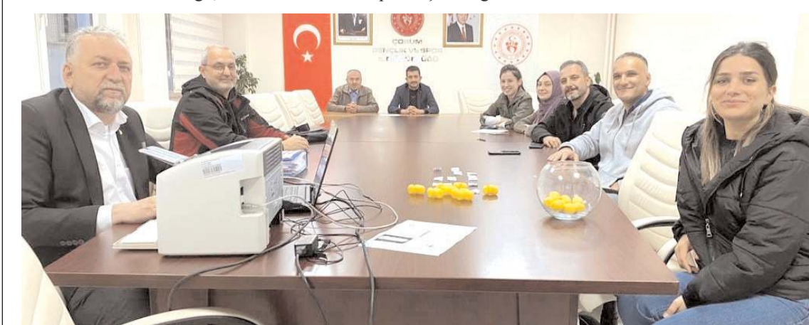
Valilik Kupası Voleybol turnuvasının teknik toplantısı ve fikstür çekimine tertip kurulu ve takım temsilcileri katıldı

Erkeklerde grup maçları bugün başlayacak ve 2 Kasım Çarşamba günü sona erecek. Tefvik Kış Spor Salonu'nda oynanacak maçlar sonunda gruplarında birinci olan beş takım final grubuna yükselcek. Beş takımlı final grubu maçları 3 Kasım'da başlayacak tek devreli lig statüsünde oynanacak maçlar sonunda şampiyon belli olacak. Kadınlarda ise maçlar 4 Kasım'da başlayacak 10 Kasım perşembe günü sona erecek.