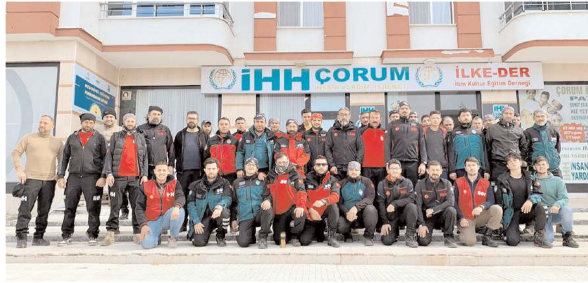
Eğitime katılan ekipler Çorum İHH'da buluştular.

İHH İnsani Yardım Vakfı Arama Kurtarma ekibinin Doğada Arama ve Kurtarma (DAK) Temel Eğitim Programı kapsamında, 2 modül ve 3. Modül Kursu'nun