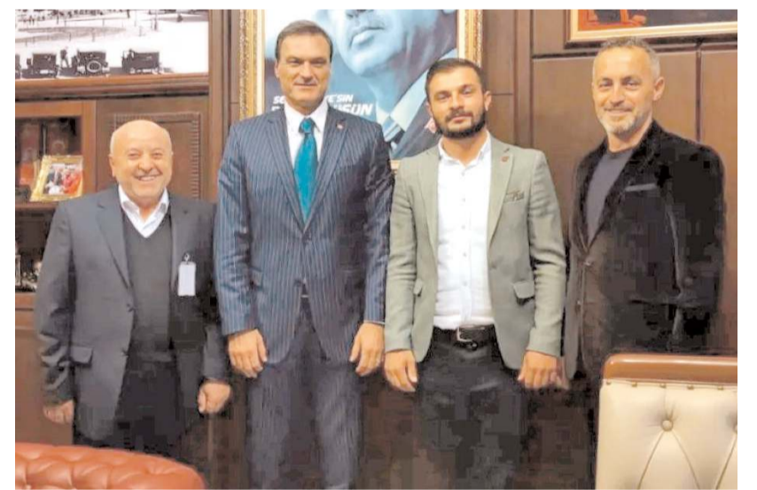
Çorum ASKF heyeti TBMM Meclis İdare Amiri eski milletvekili Alpay Öcalan'ı ziyaret ederek hem tanıştılar hem çalışmalarını hakkında bilgiler verdiler