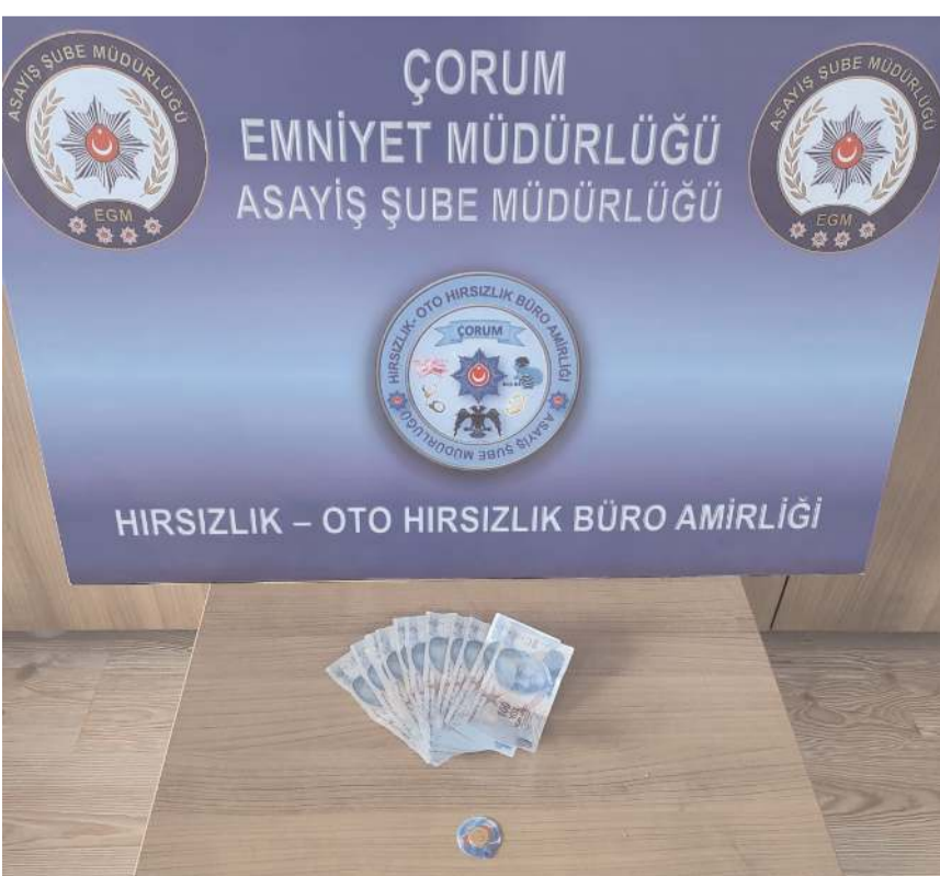
Çalıntı para ve ve ziynet esyası polis tarafından ele geçirildi.

Asayiş Şube Müdürlüğü Hırsızlık ve Yankesicilik Büro Amirliği Ekipleri tarafından yapılan çalışmalar neticesinde, bir kişinin park halinde bulunan araçtan inerek keseyi aldığı tespit edilirken şüpheli şahıs ekipler tarafından kese içerisinde bulunan altın ve 1.200,00 TL para ile birlikte ele geçirildi. Çalınan altın ve paralar ise mağdura teslim edildi. Şüpheli şahsın adli işlemleri ise devam ediyor.