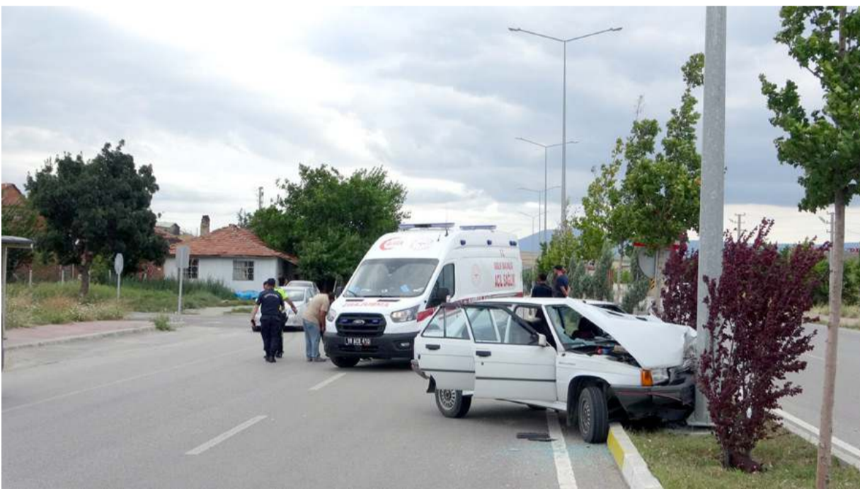
Kaza Ortaköy yolunda meydana geldi.