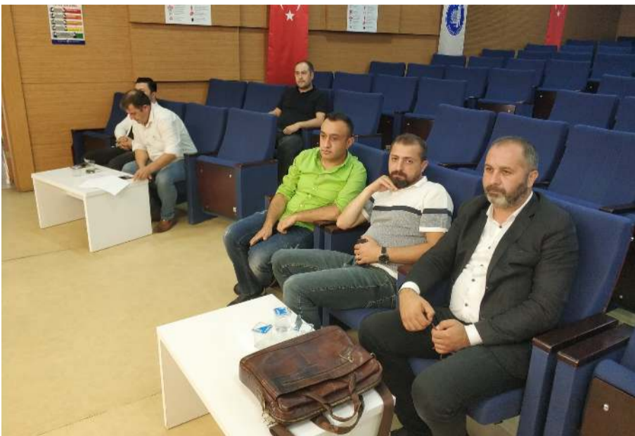
İhaleler Turgut Özal İş Merkezi Belediye Konferans Salonu'nda yapıldı.