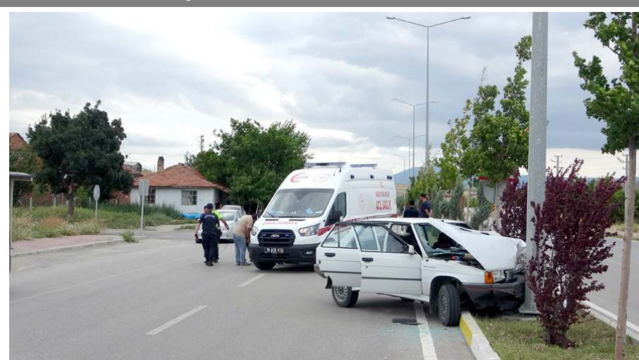
Kaza Ortaköy yolunda meydana geldi.