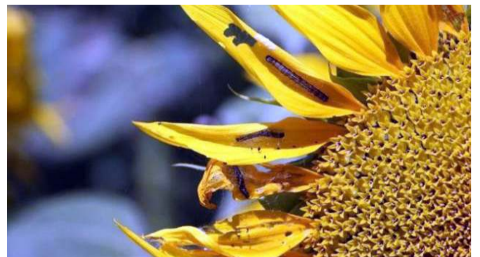
Çayır tırtılı ayçiçeklerine büyük zarar veriyor.