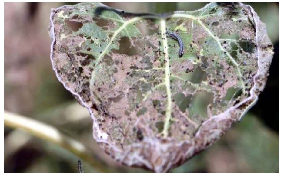
Çayır tırtılı belirtilen orandan fazla ise ilaçlı mücadele öneriliyor.