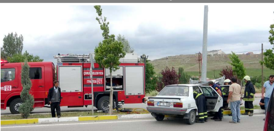
Kazada otomobilde maddi hasar meydana geldi.

Çorum'da aydınlatma direğine çarpan otomobildeki 3 kişi yaralandı.