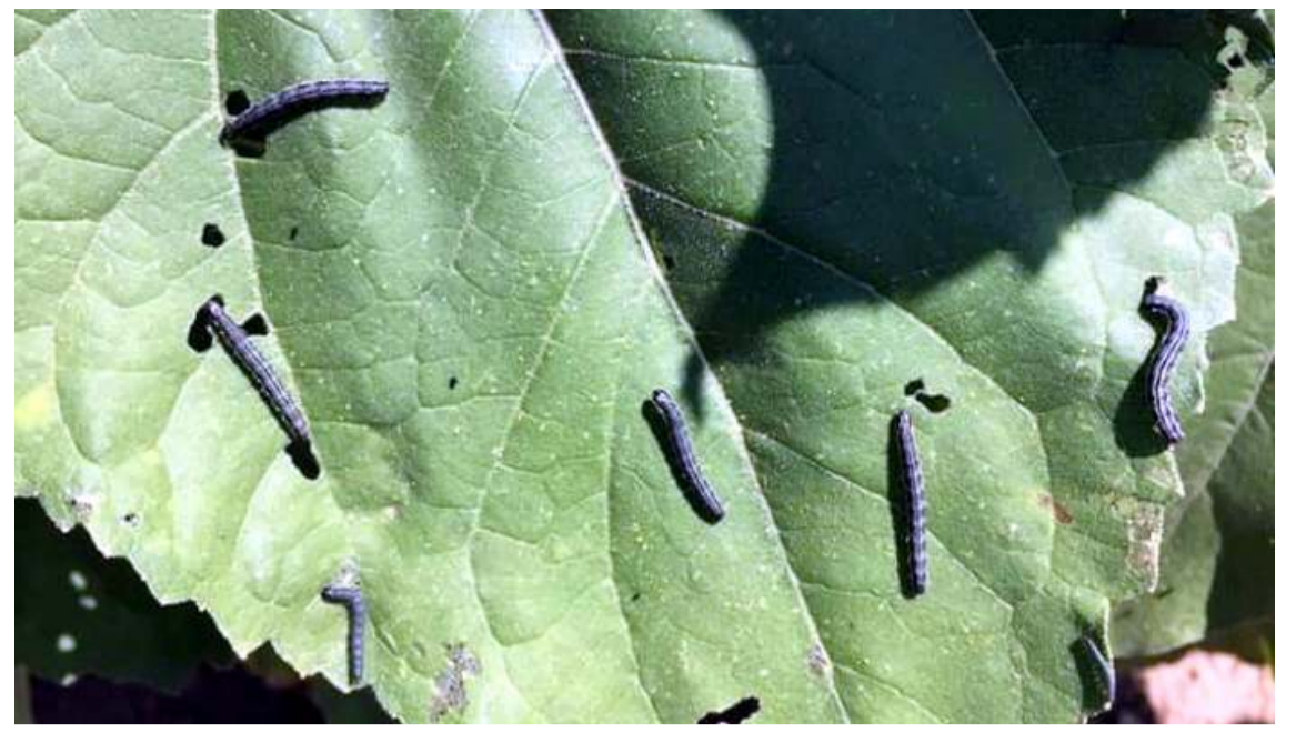
Çayır tırtılı, yonca, mısır ve ayçiçeği tarlalarında yoğun olarak görülüyor.

Durumu ağır olan sürücünün, Ankara'da özel bir hastaneye sevk edildiği öğrenildi.(AA)