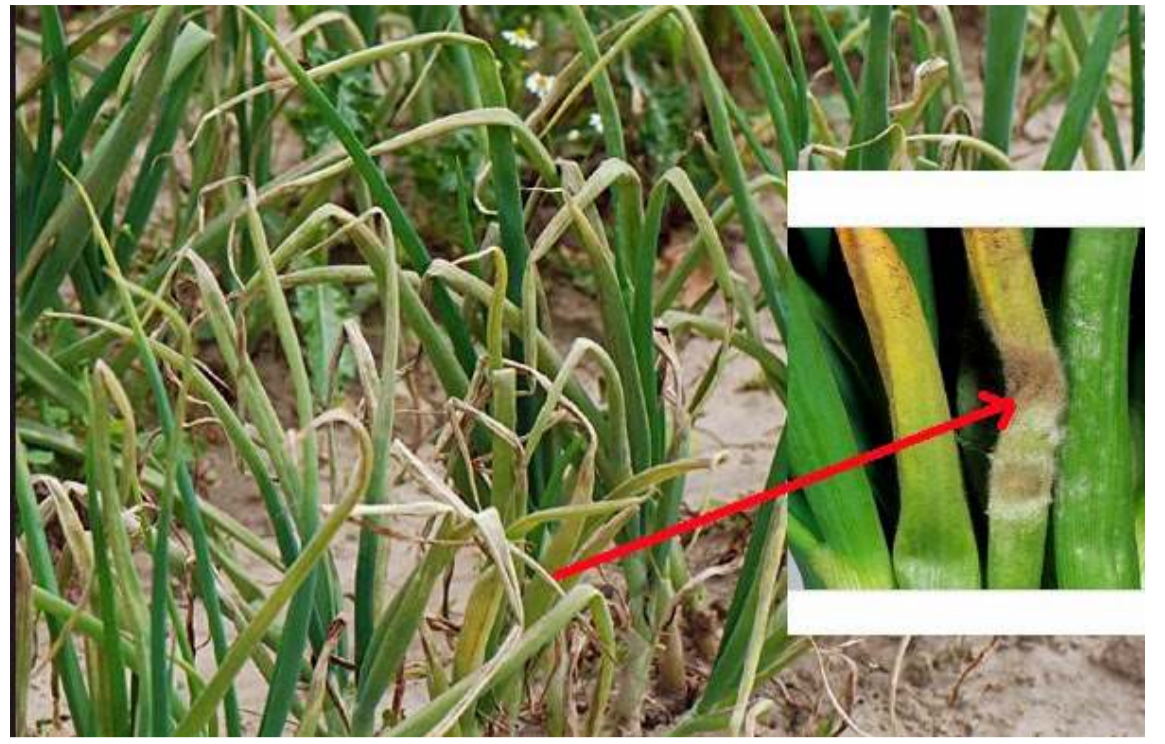
Mildiyo hastalığı başta soğan olmak üzere sarımsakta da görülüyor.

Açıklamaların ardından Destici, Samsun'da ziyaretlerine devam etti. (İHA)