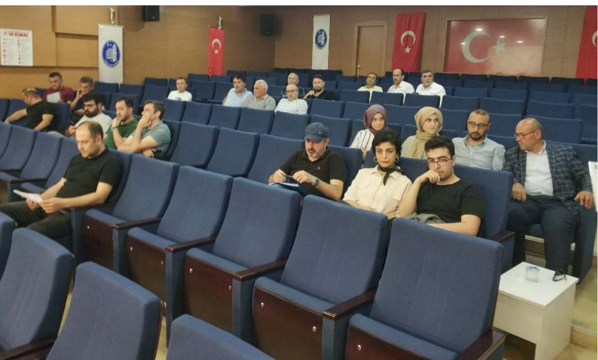
Kuruçay mevkiinde bulunan 5 arsanın satışı gerçekleştirildi.