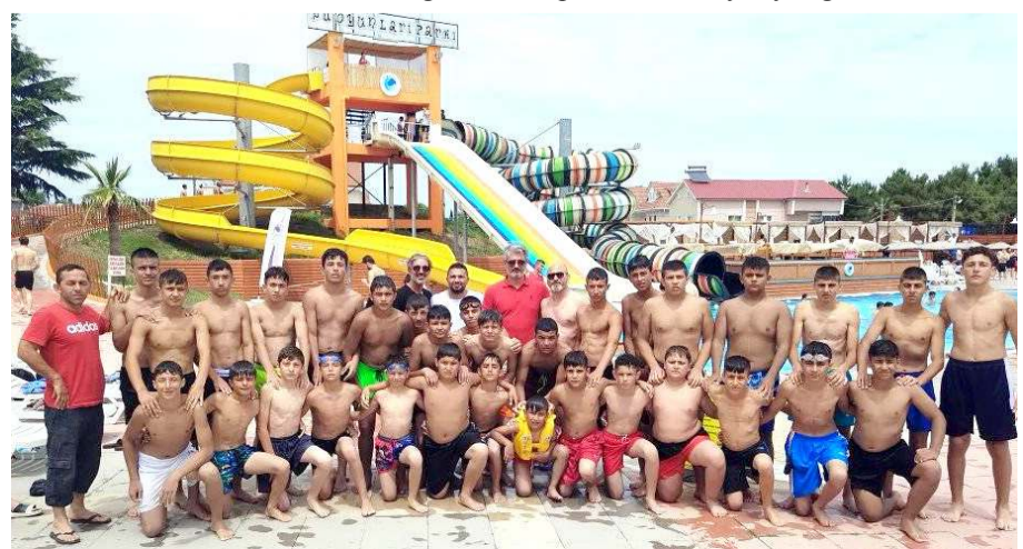
Çorumlu minik pehlivanlar Samsun'da havuzda keyif yaptılar