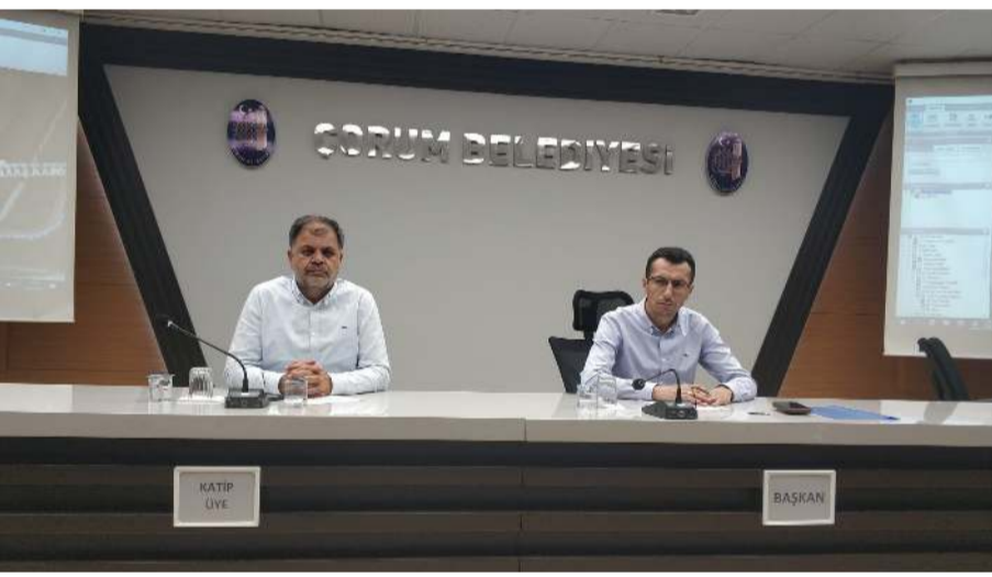
Her iki ihalede Encümen huzurunda yapıldı.