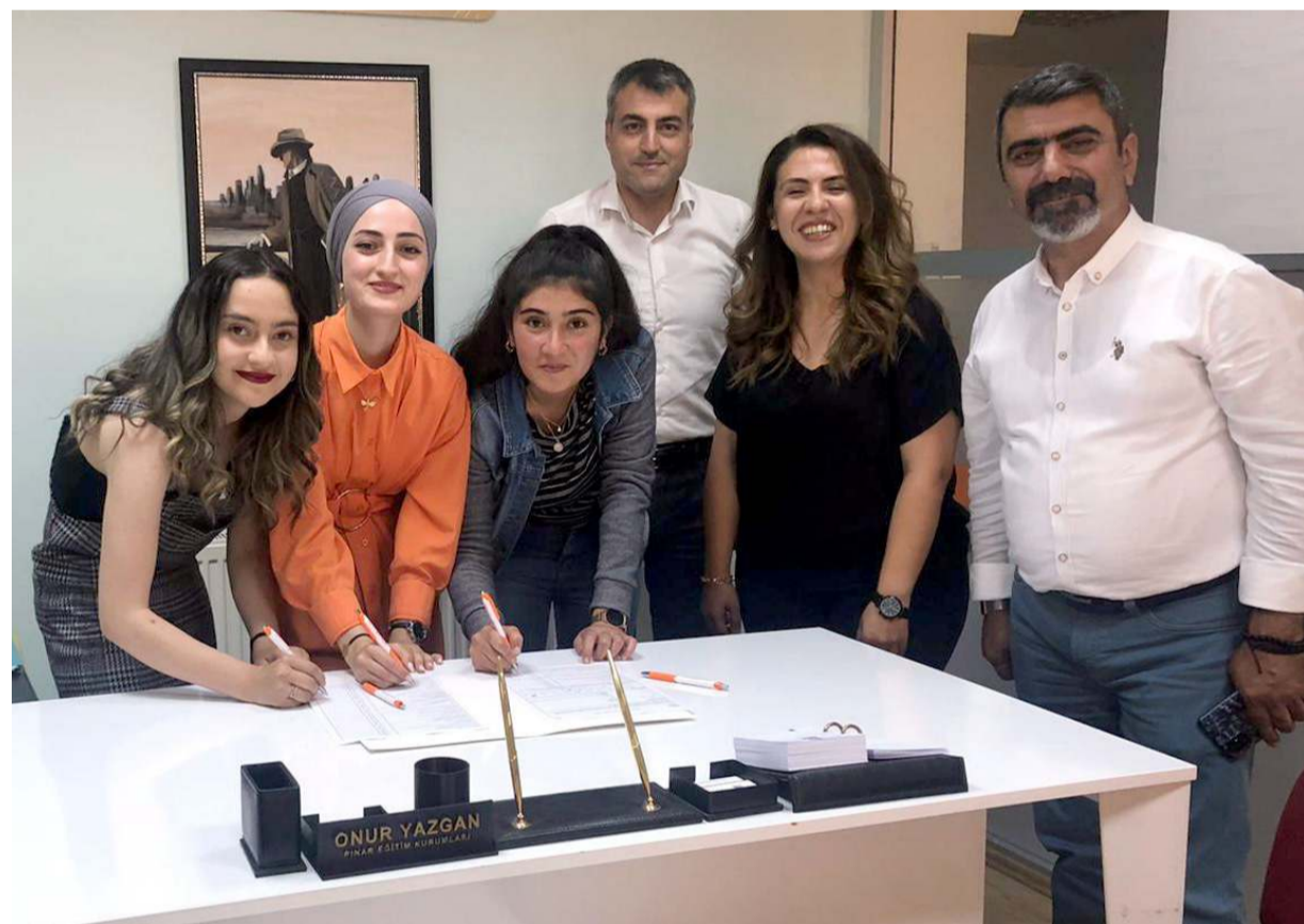
Europass Belgesi sayesinde üç öğrenci Almanya'dan iş teklifi aldılar.

Çorum Özel Pınar Tasarım Teknoloji ve İnovasyon Koleji'nin