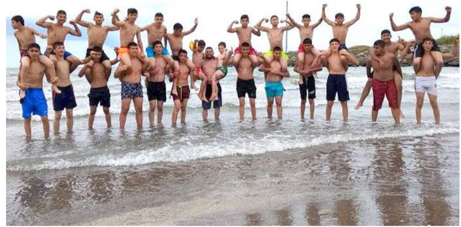
Pehlivanlar Samsun'da iki günlük kampa denizde doyusya eğlendiler