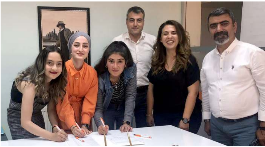
Europass Belgesi sayesinde üç öğrenci Almanya'dan iş teklifi aldılar.

■ Çorum'da devlet destekli tek okul olma özelliği taşıyan Çorum Özel Pınar Tasarım Teknoloji ve İnovasyon Koleji, öğrencilerine Avrupa'da iş imkanı sağlıyor.