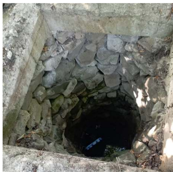
Olay İskilip'te eski hayvan pazarı mevkiinde meydana geldi.