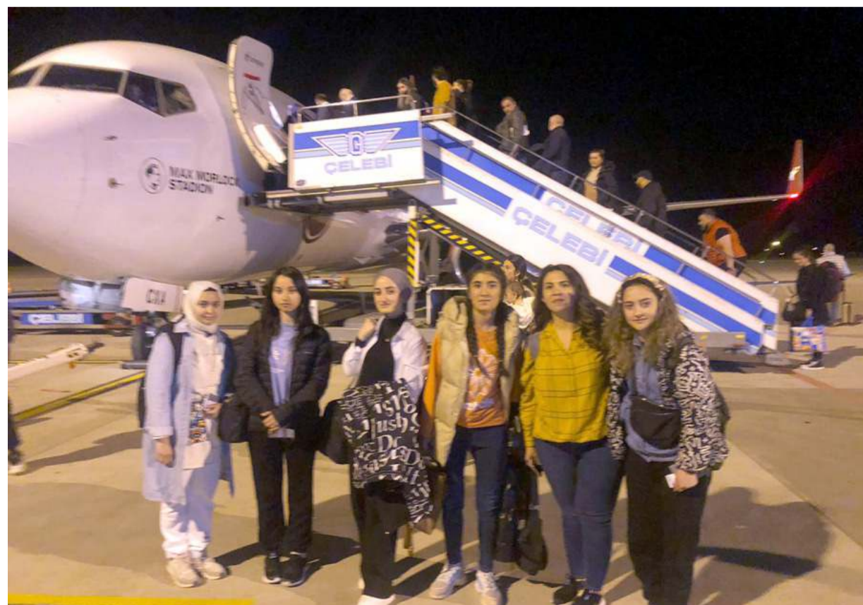
3 yıl sürecek olan eğitim-öğretim hayatları sonunda öğrenciler haftanın üç günü eğitim iki günü ise işyerlerinde çalışarak iş ve eğitim hayatlarına adım atacaklar.