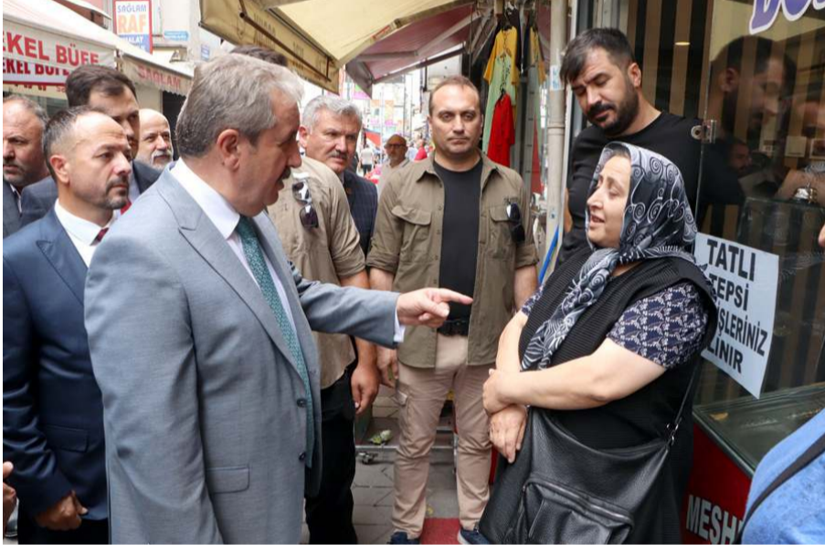
Mustafa Destici, Samsun'da esnafı ziyaret etti.

Hükümet iyi niyetli olarak enflasyon faizinin altında olduğu dönemlerde öğrenciyi koruma gayesiyle faizi kaldırdı. Öğrencilerin kredileri ödemesinde enflasyon farkı koydu. Öğrenciyi korumak için enflasyon farkına geçti. Son yıl özellikle bu 2022 yılında enflasyon o kadar yükseldi ki yılbaşında 30 olan enflasyon bugün yüzde 73'lere yükseldi. Dolayısıyla öğrencilerimizin bu rakam üzerinde aldıkları kredileri geri ödemeleri mümkün değildir. Bakanlar Kurulu toplantısında inanıyorum ki bu hususta bir düzenleme yapılacaktır. Ben daha önce ilgili bakanımızla ve diğer yetkililerle bu hususta ilgili görüştim. Büyük Birlik Partisi olarak bizim teklifimiz şudur: İnşallah bugünkü kararında böyle çıkmasını arzu ediyorum. Öğrencilerimiz kullandığı kredileri geri öderken ne faiz ne de enflasyon farkı uygulanmasın. Öğrenci ne kadar para almışsa o kadar parayı 10 yıl içerisinde eşit taksitlerle işe girdikten sonra ödemeye başlasın" diye konuştu.