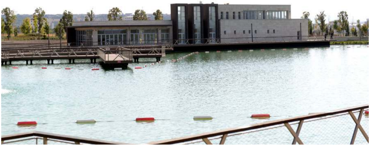
Millet Bahçesinde bulunan restoran-kafeteryanın kiralama ihalesi yapıldı.