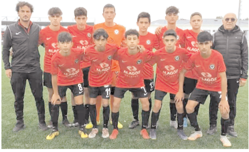
Çorum FK U 15 takımı Boluspor deplasmanında ilk puanlarını almak için mücadele edecek

U 15 Gelişim Liginde Çorum FK yarın Boluspor deplasmanında ilk puanını almak için mücadele edecek. Yarın saat 16'da Karacayır 1 nolu sentetik sahada oynanacak Boluspor - Çorum FK maçını İlker Akbayır yönetecek yardımcılıkları ise Burak Benek ve Rabie Kardelen İleri yapacak.