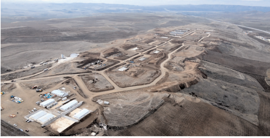
Sungurlu OSB'de yapımı devam eden savunma sanayi yatırımları %50 seviyesine geldi.

Ahlatıcı Gold Force Küresel Barut Fabrikası, Nitrogliserin Fabrikası ve Nitroselüloz Fabrikası ile Arca Kapsül Üretim Fabrikası ve Mite Defence Fişek Üretim Fabrikası, OSB'de 4 bin dönüme yayılan 3 farklı firmanın 5 farklı fabrika inşaatının planlandığı