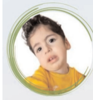
@smatip1_cinar 18.750 $

Zehra Meva'nın kampanyasından kalan 56.250 dolar Ankara Valiliği kararı doğrultusunda üç bebeğimize eşit miktarda aktarılmıştır. Bebeklerimize şifa olsun.