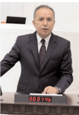
Ahmet Sami Ceylan

İklim değişikliğinin tarımsal üretime olan etkilerini önlemek amacıyla yeni bir eylem planı daha ortaya koyuyoruz. Tarım ve Orman Bakanlığımız tarafından, 2023 ve 2027 tarımsal kuraklıkla ilgili yol haritamız belirlenmiş olup tüm faktörleri ve tüm beklentileri bir bütün içinde ele alıyor, planlarımızı ve tedbirlerimizi katımlı bir yaklaşımla ortaya koyuyoruz. Bilindiği üzere, iklim değişikliği, daha sıcak ve az yağışlı iklim koşulları, ekstrem meteorolojik olaylarda artış, su kaynaklarında azalma ve kuraklık şiddetinde artış, su ve toprak kalitesinin bozulması gibi hususların ortaya çıkmasıyla tarım sektörünü etkilemektedir. İşte, bu amaçla Bakanlığımız, il ve merkez birimleri, STK'lar, üniversitelerden akademisyenler ve Birleş-