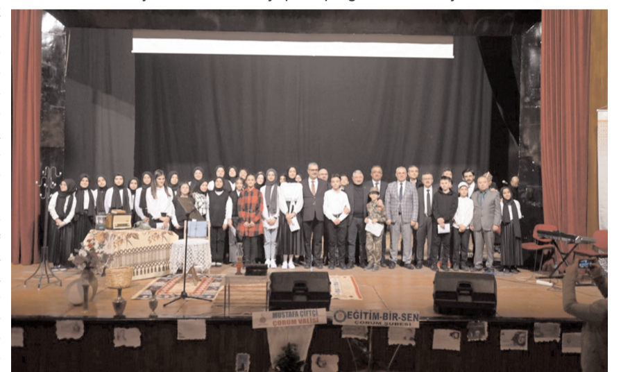
Protokol üyeleri öğrencileri tebrik ettiler.

teşekkür ederim" diyerek sözlerini tamamladı.