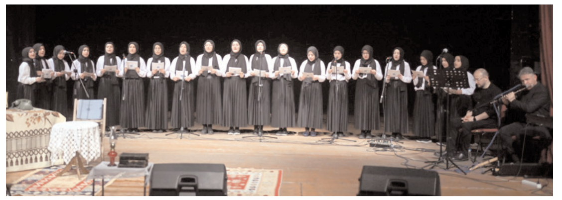
Programda öğrenciler ilahiler seslendirdiler.

Önmümüzdeki Perşembe'yi Cuma'ya bağlayan gece Regaib gecesini idrak edeceğiz inşallah. Üç aylar ve Regaib gecemiz mübarek olsun. Yü-