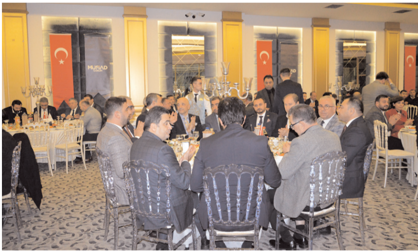
Genel kurula katılım yüksek oldu.