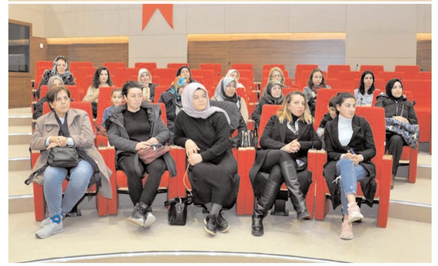
Eğitim sonunda girişimci kadınlara sertifika verilecek.