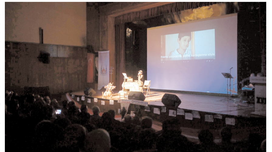
Öğrenciler şiirler okudular.