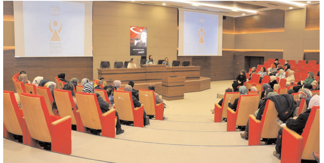
Eğitim sonunda girişimci kadınlara sertifika verilecek.