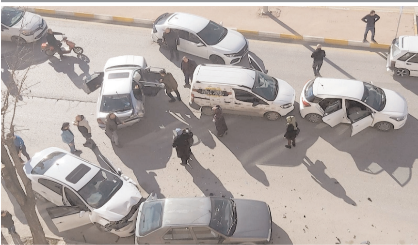
Kaza nedeniyle trafik bir süre durdu.