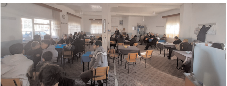
Kursu Dodurga Halk Eğitimi Merkezi düzenledi.