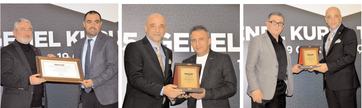
MÜSİAD'ın önceki dönem yöneticilerine emeklerinden dolayı teşekkür belgesi ve plaket verildi.