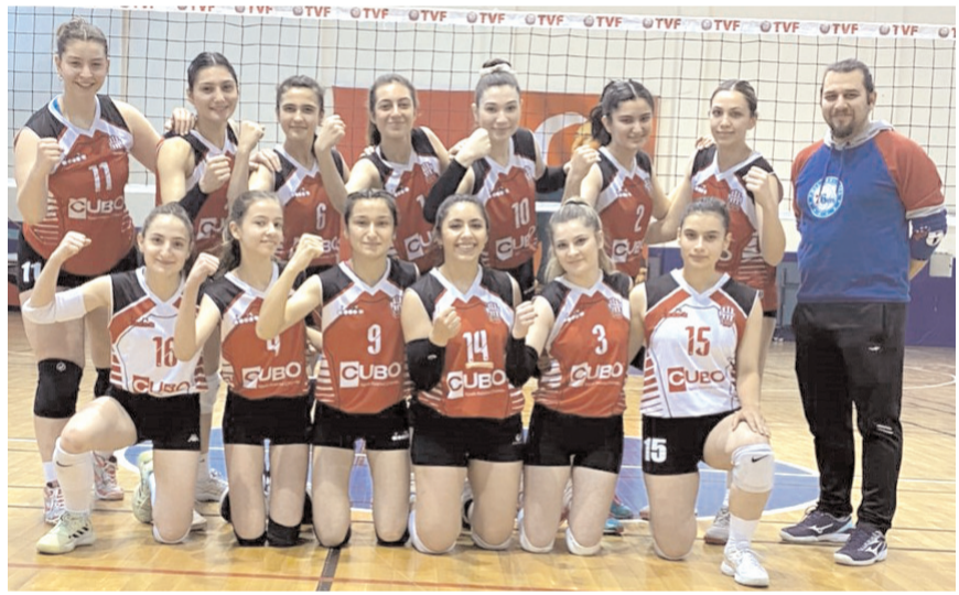
Osmaniç Belediyesiyarın Sinop Ayancık deplasmanında üst sıralar için mücadele edecek

verecek olan Çorum Belediyesiyarın Sinop Ayancık deplasmanında üst sıralar için mücadele edecek. Bu maçta baş hakem olarak Hasan Olgun görev yaparken yardımcılığını