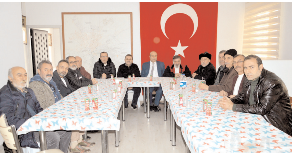
Ulukavak Mahallesi Yaşatma ve Dayanışma Derneği, basın mensuplarıyla bir araya geldi.