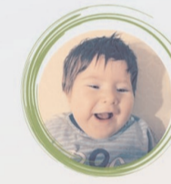
@sma.ibrahimumutol 18.750 $