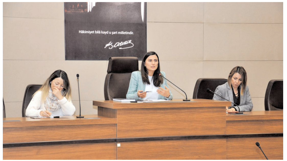
'Üreten Kadın Girişimcilerin El Emeği Sergisi' projesi bilgilendirme toplantısı gerçekleştirildi.

20-23 Ocak 2023 tarihleri arasında 81 ilden öğretmen, okul idarecisi, özel kurum temsilcisi, akademisyenler, bürokratlar, bakanlık müfettişleri, eğitim yöneticileri ve uzman yaklaşık 200 eğitimcinin katılımıyla gerçekleştirilecek çalıştayda, el birliğiyle kanunun muhtevasına ivme kazandıracak görüş ve teklifler hazırlanacak; oluşturulan raporlar ise Milli Eğitim Bakanlığı başta olmak üzere eğitimin tüm paydaşları, kanun koyucular ve siyasi parti temsilcileri ile paylaşılacaktır." (Haber Merkezi)