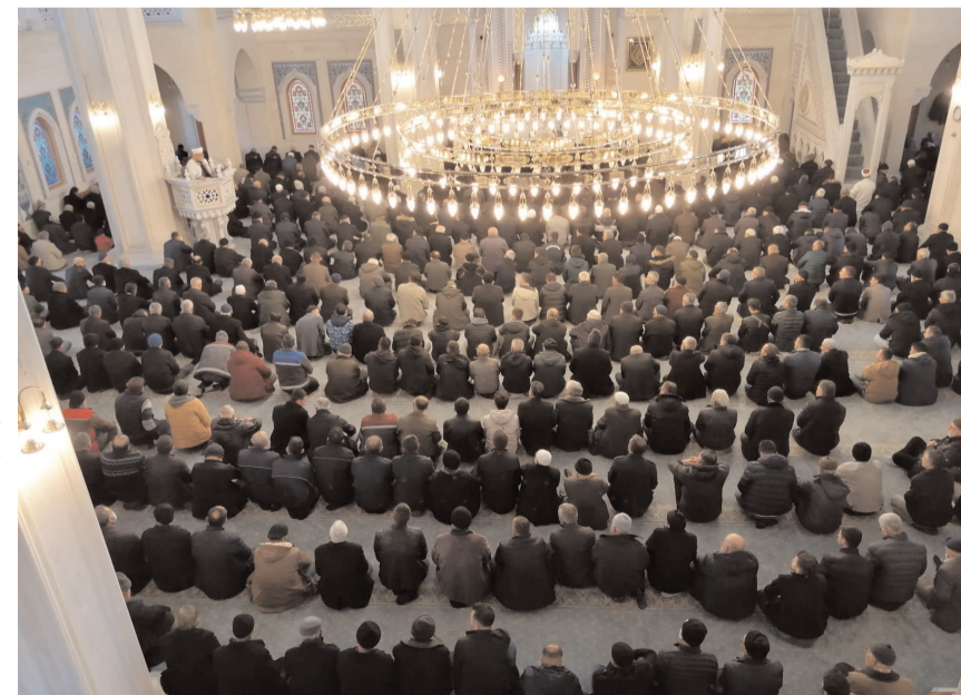
Diyanet İşleri Başkanlığı tarafından dün ki Cuma hutbesinde önmümüzdeki pazartesi günü başlayacak olan üç aylara değinildi.