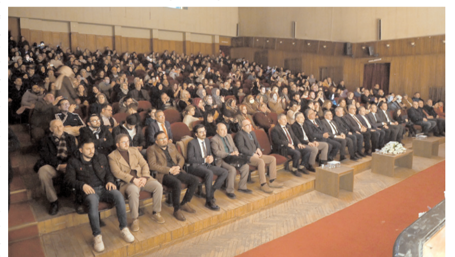
Devlet Tiyatro Salonu'nda yapılan programa katılım yüksek oldu.