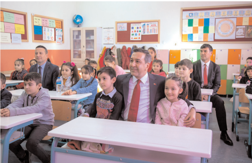
Dere, çocukların karne sevincine ortak oldu.