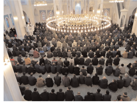
Diyanet İşleri Başkanlığı tarafından dün ki Cuma hutbesinde öntümüzdeki pazartesi günü başlayacak olan üç aylara değinildi.