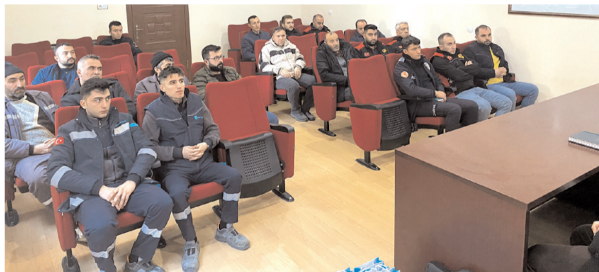
Semineri Çorum Gaz uzmanları verdi.

Konuşmaların ardından işçiler toplu iş sözleşmesini halay çekerek kutladı.