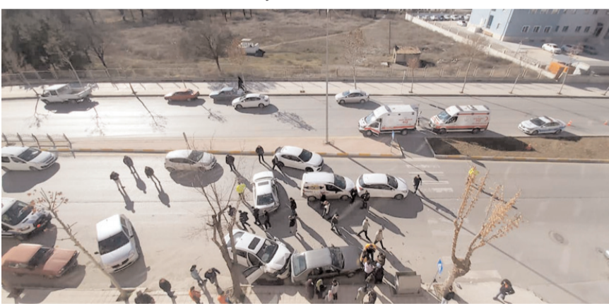
Kaza araçlarda maddi hasar meydana geldi.