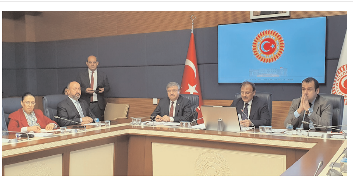
TBMM İnsan Hakları Komisyonu yılın ilk toplantısını yaptı.

Eylem planımızda aylık olarak sulama suyuna ilişkin veriler, meteorolojik veriler ve hububat bitkileri üzerinde her su yılında bitkilerin ekiminden hasadına kadar fenolojik gelişmeler aylık olarak raporlanacak, il bazında kuru ve sulu koşullarda gerekli tedbir ve önlemler önceden alınarak iklim değişikliğinin en önemli sonuçlarından biri olan tarımsal kuraklıktan çiftçimizin en az düzeyde etkilenmesi sağlanacak ve sürdürülebilir tarımsal üretim izlenecektir." (Haber Merkezi)