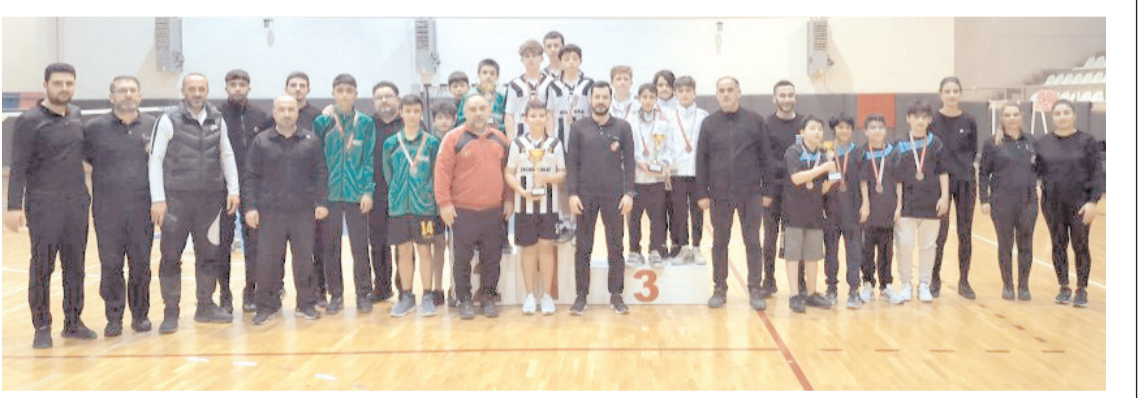
Yıldız erkekler badmintonunda ilk dört sırayı alan okul sporcu, idareci ve öğretmenleri ödül töreni sonrası toplu halde