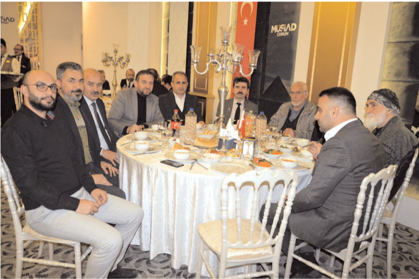
Genel kurul Altınkaya Arena'da yapıldı.