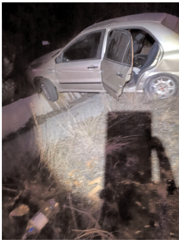
Kaza, İskilip-Tosya karayolunda meydana geldi.