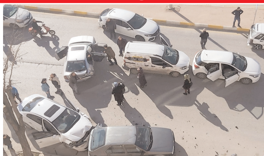
Kaza nedeniyle trafik bir süre durdu.