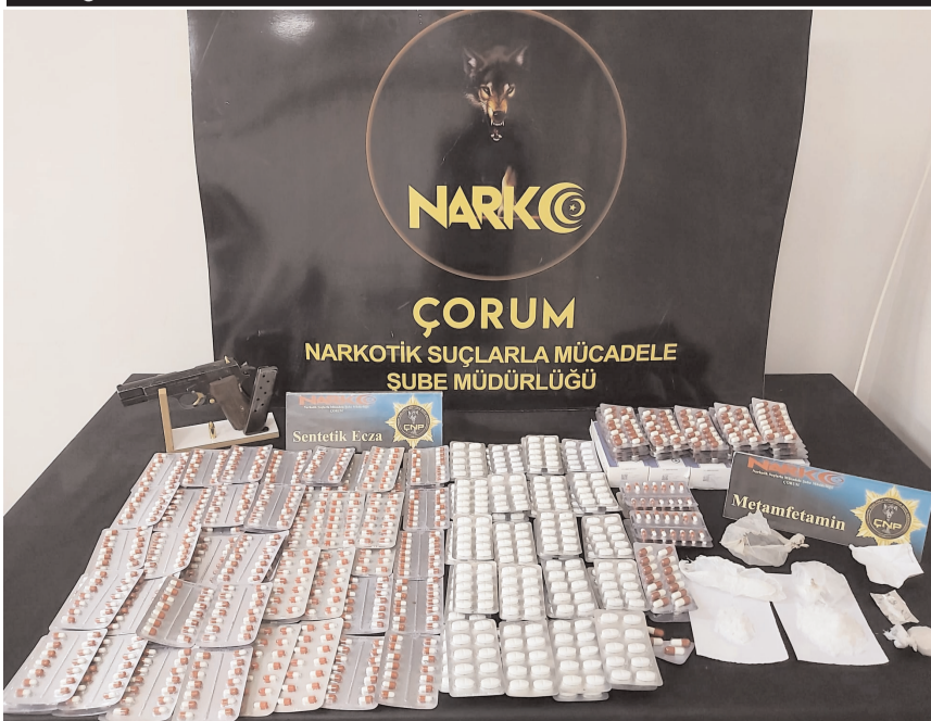
Operasyonda çok miktarda uyuşturucu madde ele geçirildi.

Çorum'da uyuşturucu ticareti yaptığı iddiasıyla gözaltına alınan şüpheli tutuklandı.