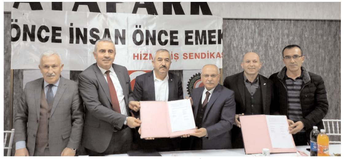
Alaca Belediyesi ile Hizmet-İş Sendikası Çorum Şube Başkanlığı arasında Toplu İş Sözleşmesi (TİS) imzalandı.