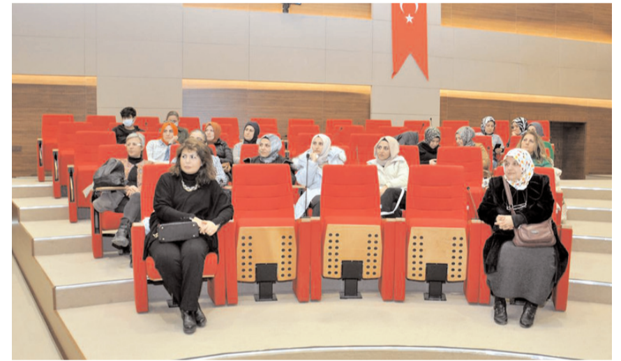
Toplantı Ticaret Sanayi Odası Meclis Salonu'nda yapıldı.