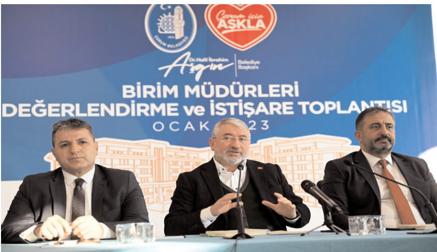
Belediye Başkanı Dr. Halil İbrahim Aşgın, toplantıda açıklamalarda bulundu.

Başkan yardımcılarını ve birim müdürlerine yaptıkları çalışmalar nedeniyle teşekkür eden Aşgın, "Şu an Çorum Belediyesi tüm Türkiye'de birinci sıradadır. Belediye başkanları toplantısında da Türkiye'de en iyi durumda olan Belediyelerden birisi olduğumuzu görüyorum. Tüm birimlerimizin başarılarını gururla konuşuyoruz. Objektif, hesap verilebilirlik, iş yapma bakımından da Türkiye'de ilk sırada Çorum Belediyesi var. Yapılan tüm anketlerde Çorum'da en güvenilir kurum Çorum Belediyesi olarak çıkmaktadır. Geçtiğimiz süre içerisinde Çorum Belediyesi bütün kurumlar içerisinde dürüstlük, ahlak, erdem ve mali yapı konularının tamamında en güvenilir kurum haline gelmiştir" dedi. (Haber Merkezi)