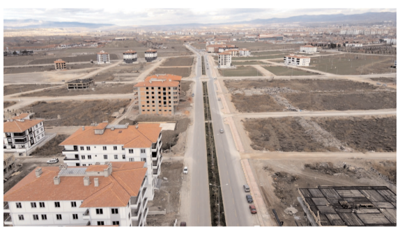
Çorum Belediyesi Hıdırlık Caddesi'ni Öğretmen Lisesi 1. Cadde'ye bağladı.