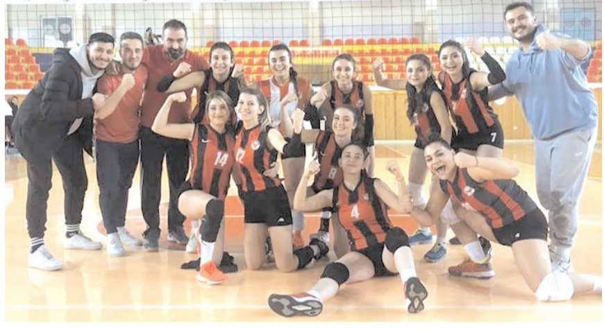
Çorum Voleybol yarın grup lideri Bordo Mavi önünde puan mücadelesi verecek

Grupta ilk galibiyetini geçtiğimiz hafta sonu Tokat Gençlikspor'u deplasmanda 3-1 yenerek alan Çorum Voleybol ligde kalma yolunda yakaladığı moralle yarın evinde grubun namağlup lideri Bordo Mavi 61 takımını konuk edecek. 12 maçından da galibiyet ile ayrılarak play-off biletini alan Bordo Mavi önünde puan mücadelesi