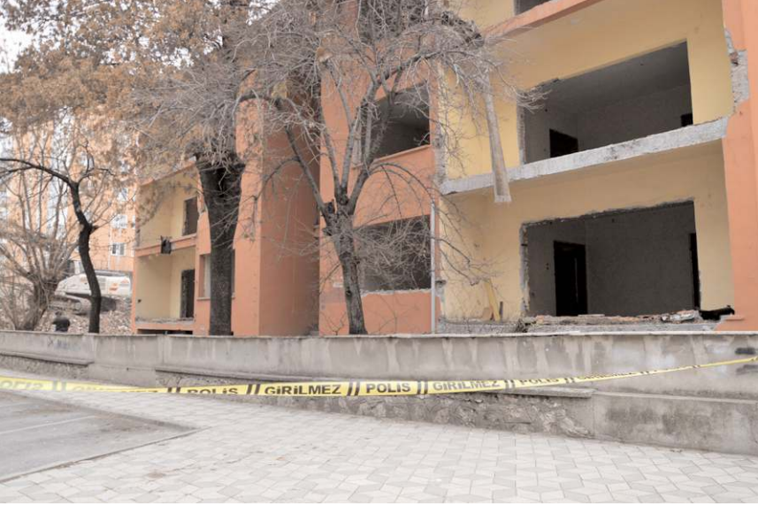
Yıkılan binanın yerine karakol ve Aile Şiddet Merkezi yapılacak.