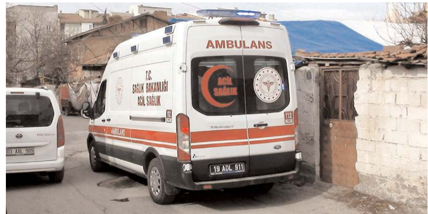
Olay, Çepni Mahallesi'nde metruk bir evde meydana geldi.