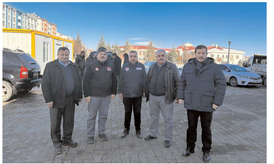
Heyet Afşin'de incelemelerde bulundu.