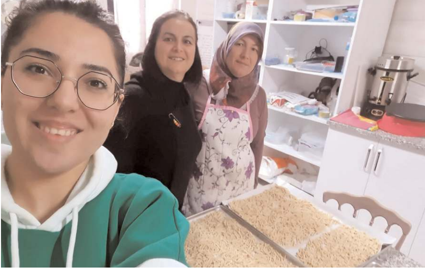
Çorum Çölyak Derneği, Glütensiz Mutfak'ta çölyaklı depremzedelere ulaştırılmak üzere yiyecek üretimine devam ediyor.