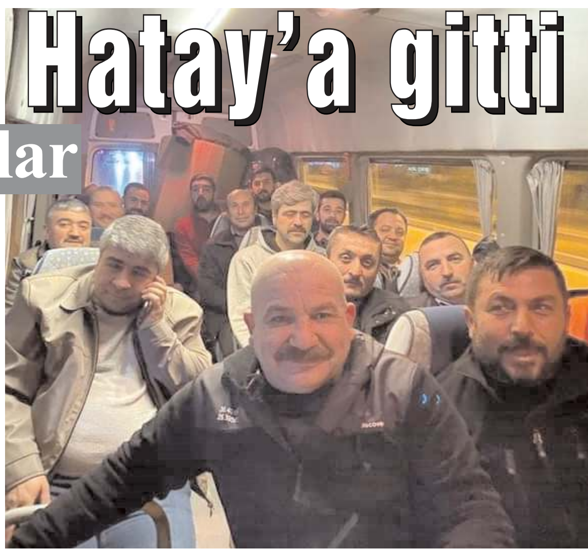
Ustalar Hatay'da çadır kent kurulumuna yardım edecekler.

Üç berber, kendileri için hazırlanan alanda çok sayıda depremzedenin saç ve sakalını tıraş etti.