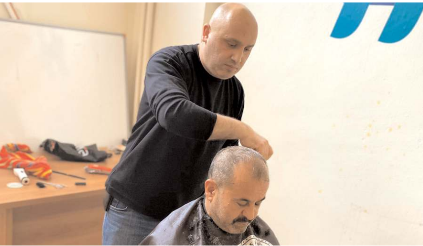
Gönüllü berberler, Çorum'da Kredi ve Yurtlar Kurumu Hitit Kız Öğrenci Yurdu'na yerleşen depremzedeleri ücretsiz tıraş etti.