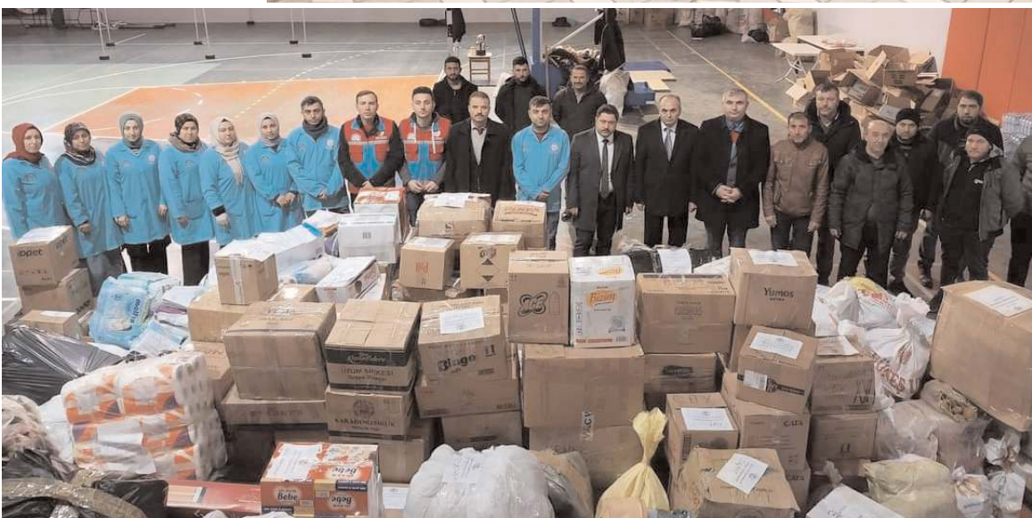
İlçede kamu kurumları ile vatandaşların katkılarıyla toplanan 11 kamyon insani yardım malzemesi ve 7 tır yakacak, afet bölgesine gönderildi.