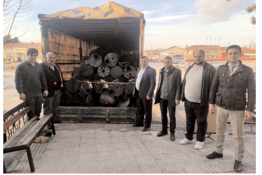
ÇESOB heyeti beraberinde götürdüğü yardımları da teslim etti.

Ayrıca ÇESOB olarak deprem bölgesine yardımlara devam edeceklerini belirten Gür, yardımların toplanmasında katkıda bulunan esnaf temsilcileri ile tüm Çorumlu esnaf ve sanatkarlara teşekkür etti. (Haber Merkezi)