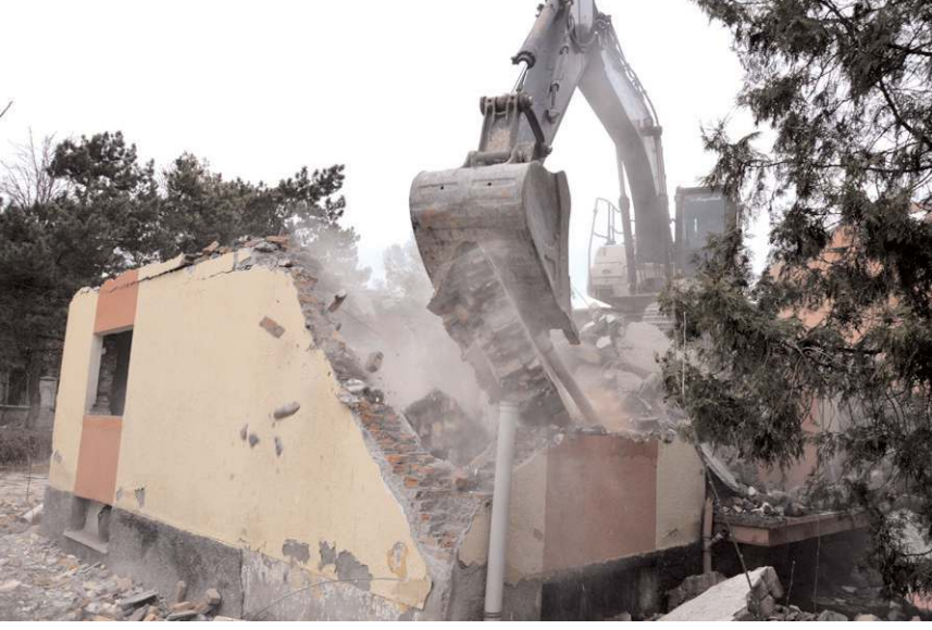
Jandarma Lojmanları'nın yıkımına başlandı.

Bu arada Mart ayında temelinin atılması planlanan Polis Moral Eğitim Merkezi'nin ileri bir tarihte atıldığı öğrenildi.