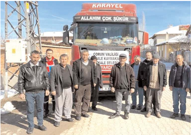
Kampanya kapsamında gönüllü vatandaşlarca köylerden temin edilen odunlar, sobaya sığacak şekilde küçültülüp torbalara doldurulduktan sonra tirlara yüklendi.