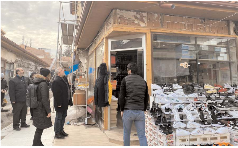
Başkan Aşgın, çalışanları yerinde inceledi.