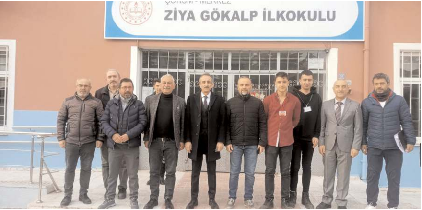
Eti Anadolu Lisesi öğrencileri iki hafta sonra yeni binaya geçecekler.