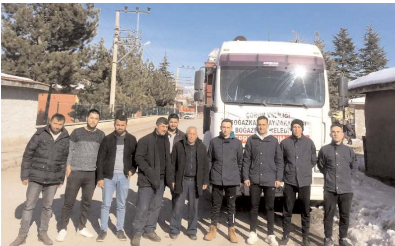
İlçeden şimdiye kadar toplam 5 tır insani ve yakacak yardımı bölgeye gönderildi.

Kampanyanın devam ettiği, yardım etmek isteyen vatandaşların Kaymakamlığa başvurabileceği bildirildi. (AA)