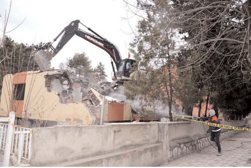
Yeni tesisin ihalesinin bu yıl yapılması bekleniyor.