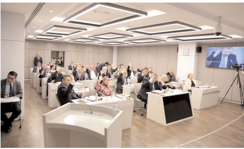
Basın İlan Kurumu Genel Kurulu, 21-23 Şubat 2023 tarihlerinde yapılacak.

Yönetim Kurulunun teklifinde, basın dernekleri ile azınlık gazetelerine yapılacak maddi yardımın zarar ve hasar durumlarına göre deprem bölgesindeki gazete-