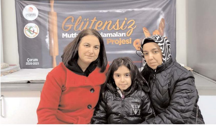
Çorum Çölyak Derneği Çorum'a yerleşen çölyaklı depremzedelerin kendileriyle iletişime geçmelerini istedi.