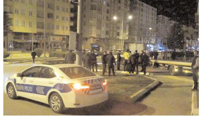
Vatandaşların yardımı ile düzeltilen otomobil çekiciyle yoldan kaldırıldı.

Vatandaşların yardımı ile düzeltilen otomobil çekiciyle yoldan kaldırıldı.