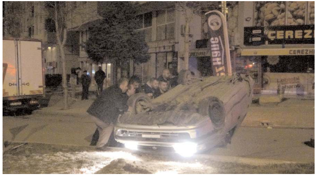
Kaza Bahçelievler Mahallesi Bahabey Caddesi'nde meydana geldi.