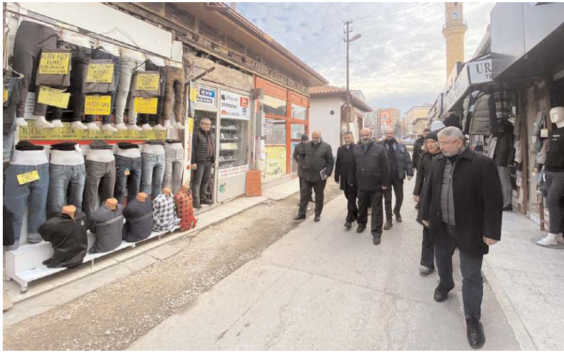
Başkan Aşgın, çalışmaların son durumu hakkında bilgi aldı.