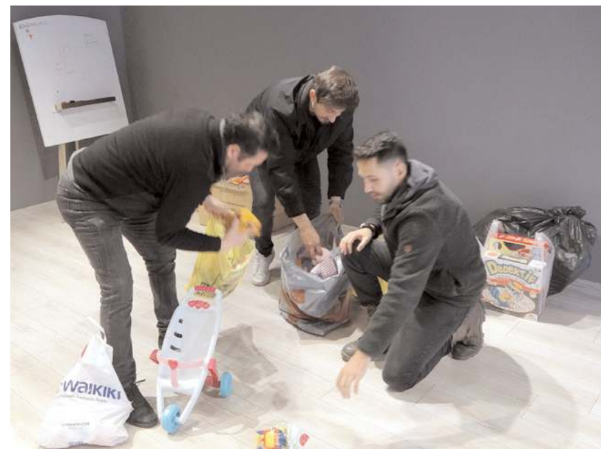
Kampanyayı Tiyatro Dördüncü Duvar ekibi düzenledi.