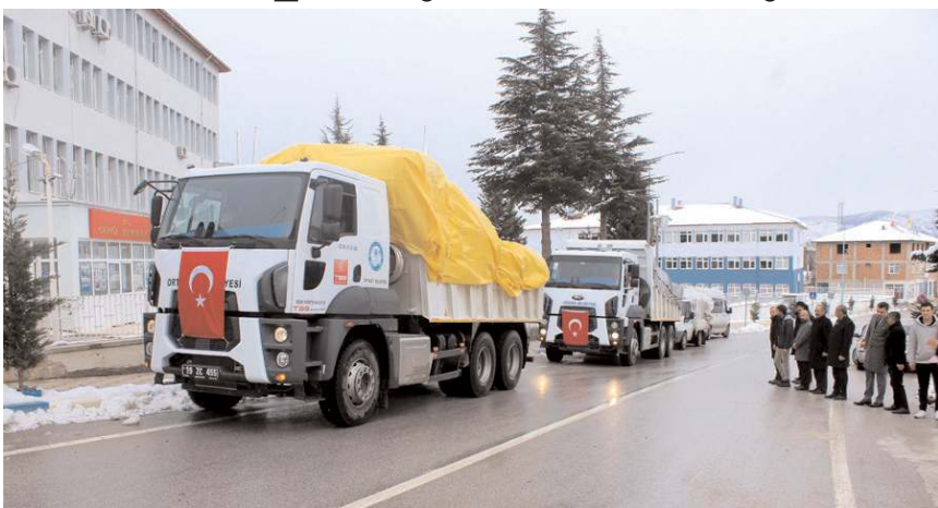
Ortaköy'den bugüne kadar 3 kamyon aynı yardım ve 2 kamyon yakacak olmak üzere 5 kamyon yardım malzemesi gönderildi.

Deprem ardından 28 kişilik 4 ailenin ilçeye geldiğinin aktarıldığı açıklamada, depremzedeler için yardım faaliyetlerinin devam ettiği aktarıldı.(AA)