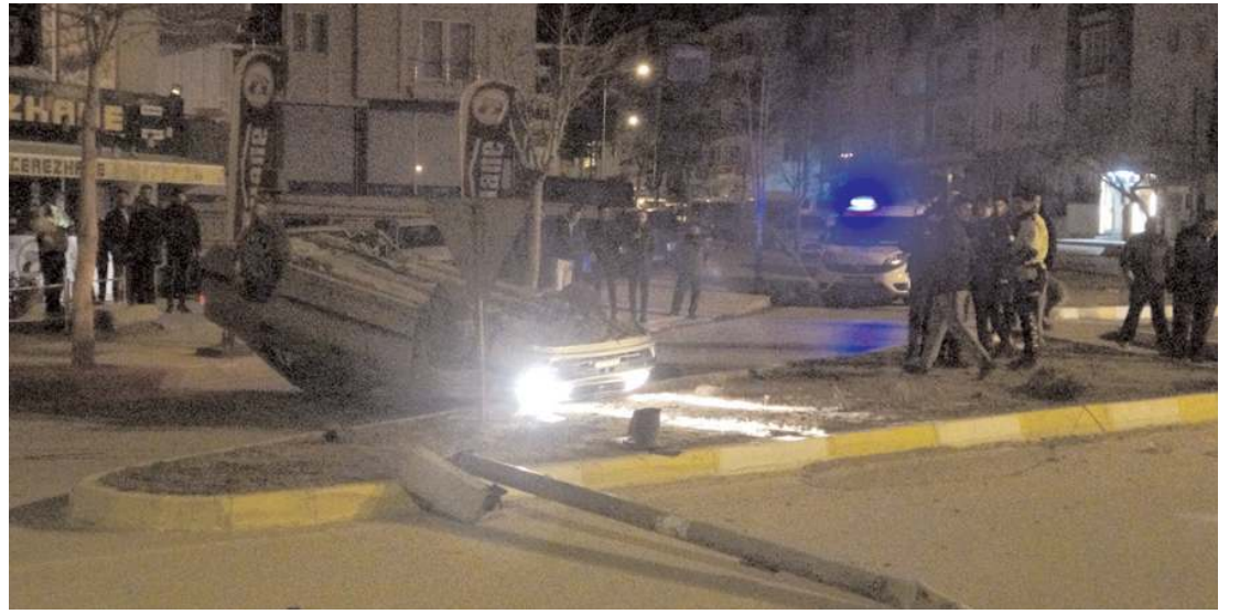
Takla atan otomobil sinyalizasyon direğini devirdi.