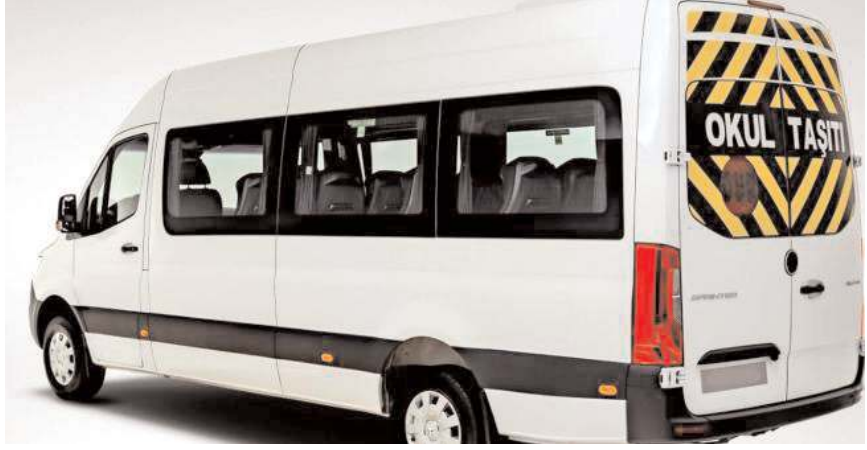
Vatandaşlar yetkililerin konuya el atmasını istiyor.

Bazı öğrenci servisi işletmecilerinin ise bu konu da alınan ortak bir karardan haberlerinin olmadığı ve iki haftalık ek tatilin ücretini almadıkları da öğrenildi.