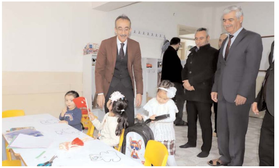
Şehit Erol Olçok Anadolu İmam Hatip Lisesi pansiyonunda anasınıfı açıldı.